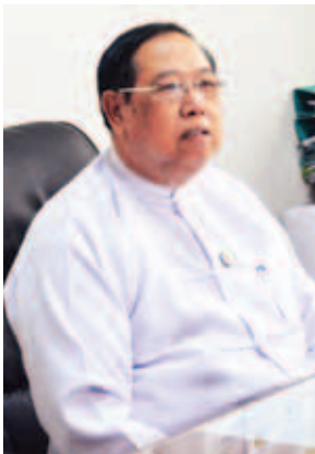
ဦးစိုးတင့် ဒုတိယဝန်ကြီး ဆောက်လုပ်ရေးဝန်ကြီးဌာန။

ရခိုင်ပြည်နယ်တွင် ဆယ်စုနှစ် တစ်ခုအတွင်း ထူးကဲစွာ မိုးရေချိန် များပြားခဲ့သည့်အတွက် ပြီးခဲ့သည့် ဇွန်လအတွင်း ရေကြီးရေလျှံမှုများ ဖြစ်ပေါ်ခဲ့ပြီး လူနေအိမ်များ၊ စာသင် ကျောင်းများ၊ ဘုန်းကြီးကျောင်း များ၊ စိုက်ပျိုးမြေများနှင့် လမ်း တံတားပျက်စီးမှုများ ဖြစ်ပေါ်ခဲ့ သည်။ ထိုသို့ သဘာဝဘေးအန္တရာယ် ကြောင့် ရခိုင်ပြည်နယ်အတွင်း လမ်းတံတား ပျက်စီးမှုများအပေါ် ဆောက်လုပ်ရေးဝန်ကြီးဌာနမှ ပြန် လည်ဆောင်ရွက်ခဲ့မှုများကို ဒုတိယ ဝန်ကြီး ဦးစိုးတင့်၊ ညွှန်ကြားရေး များချုပ် ဦးဟန်စိုးတို့နှင့် တွေ့ဆုံ မေးမြန်းခဲ့သည်များကို ပြန်လည် ရေးသားတင်ပြလိုက်ရပါသည်။