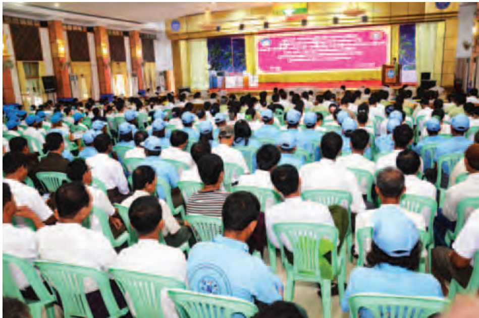
ထောက်ပံ့ပေးအပ်သည်။ ထို့နောက် ဆပ်ရိုးကျ ရခိုင်တိုင်းရင်းသားကျေးရွာ ကယ်ဆယ်ရေးစခန်း၌ ပြည်သူများနှင့် တွေ့ဆုံကာ ပြန်လည်ထူထောင်ရေး လုပ်ငန်းများအတွက် လိုအပ်သည့် များ ထောက်ပံ့ပေးခဲ့ကြောင်း သိရသည်။ (ကြေးမုံ)

ဒသမ ၂၄ သိန်းခန့် တန်ဖိုးရှိပစ္စည်းများ၊ မောင်တော မြို့နယ်အတွက် ငွေကျပ် ၂၆ ဒသမ ၅၇ သိန်းနှင့် ၄ ဒသမ ၈၅ သိန်းခန့် တန်ဖိုးရှိ ပစ္စည်းများ၊ စစ်တွေ ခရိုင်ရှိ ဘိုးဘွားရိပ်သာတစ်ခု၊ လူငယ်ဖွံ့ဖြိုးရေး ပရဟိတဂေဟာနှစ်ခုနှင့် ကိုယ့်အားကိုယ်ကိုးမူလတန်း ကြိုကျောင်း ၁၁ ကျောင်းတို့အတွက် ငွေကျပ် ၂၁၆ ဒသမ ၃၅ သိန်း၊ မြောက်ဦးခရိုင်ရှိ လူငယ်ဖွံ့ဖြိုးရေးပရဟိတ ဂေဟာသုံးခုနှင့် ကိုယ့်အားကိုယ်ကိုး မူလတန်းကြိုကျောင်း ၁၂ ကျောင်းတို့အတွက် ငွေကျပ် ၂၀၀ ဒသမ ၀၄ သိန်း၊ ကျောက်ဖြူခရိုင်ရှိ လူငယ်ဖွံ့ဖြိုးရေး ပရဟိတဂေဟာနှစ်ခု နှင့် ကိုယ့်အားကိုယ်ကိုး မူလတန်းကြိုကျောင်း ၁၀ ကျောင်း တို့အတွက် ငွေကျပ် ၁၂၄ ဒသမ ၁၉ သိန်း၊ သံတွဲခရိုင်ရှိ ဘိုးဘွားရိပ်သာနှစ်ခုနှင့် ကိုယ့်အားကိုယ်ကိုး မူလတန်းကြို ကျောင်း ကိုးကျောင်းတို့အတွက် ငွေကျပ် ၉၃ ဒသမ ၇ သိန်း၊ မောင်တောခရိုင်ရှိ လူငယ်ဖွံ့ဖြိုးရေးပရဟိတဂေဟာ နှစ်ခုနှင့် ကိုယ့်အားကိုယ်ကိုး မူလတန်းကြိုကျောင်း ခြောက်ကျောင်းတို့အတွက် ငွေကျပ် ၁၆၈ ဒသမ ၂၈ သိန်း စုစုပေါင်းငွေကျပ် ၁၃၈၇ ဒသမ ၃၉ သိန်းနှင့် ငွေကျပ် ၉၄ သိန်းခန့် တန်ဖိုးရှိ ကယ်ဆယ်ရေးပစ္စည်းများကို