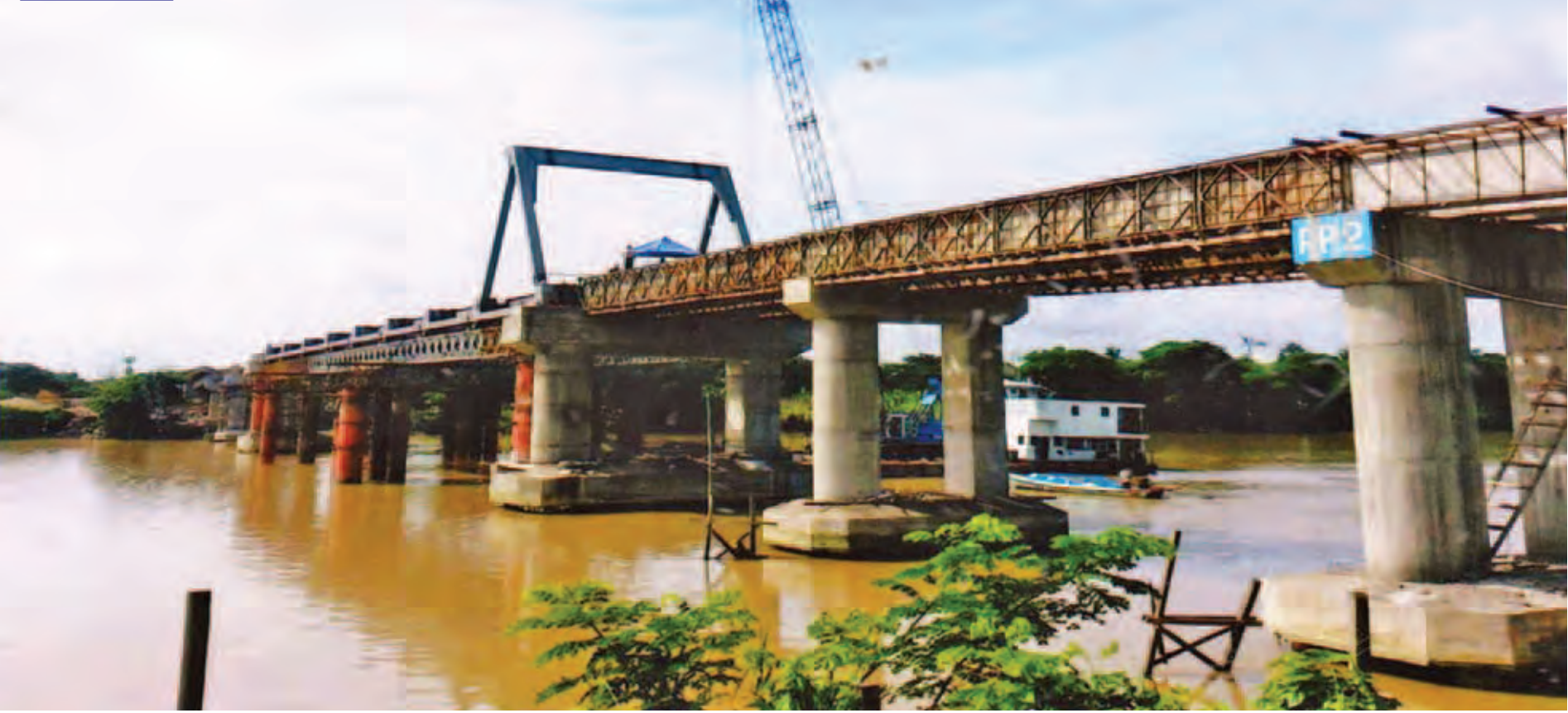
ပံ့ပိုးပေးရန် တာရှည်ဆောက်လုပ်ကိစ္စအတွက် တွေ့ရစဉ်။