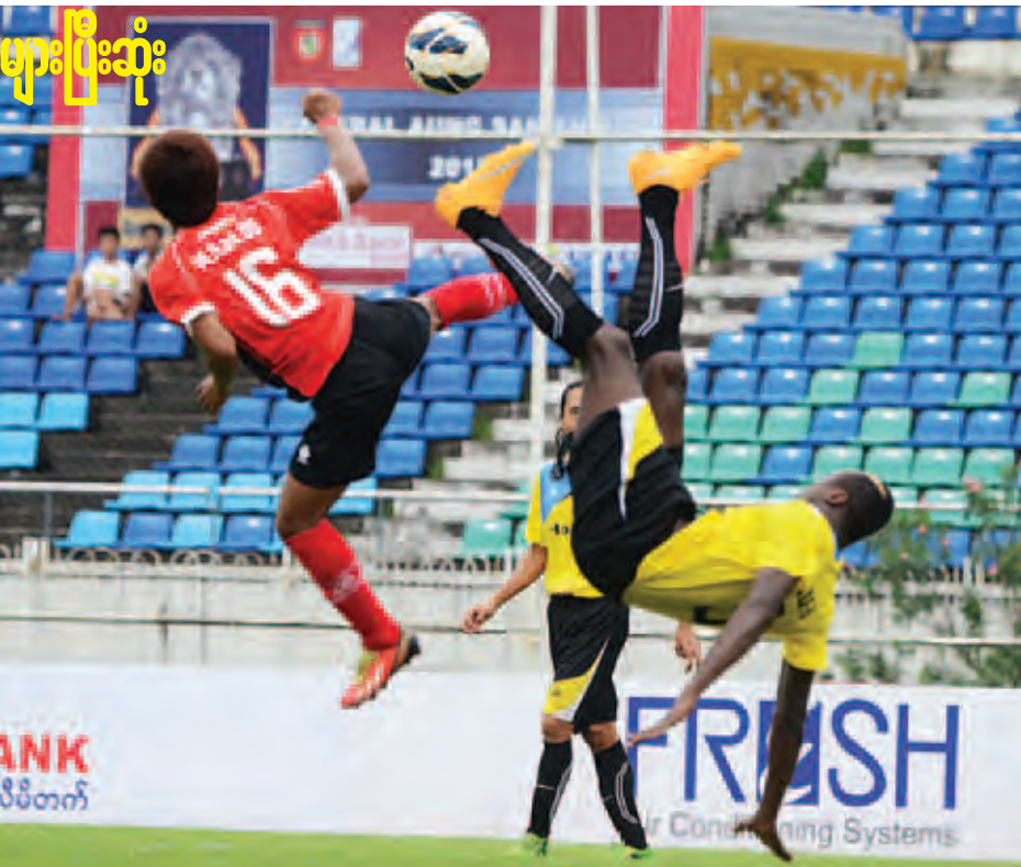
နေပြည်တော်အသင်းမှ ရခိုင်အသင်းဘက်သို့ ဂိုးသွင်းရန်ကြိုးပမ်းနေစဉ်။

၂၀၁၅ ရာသီ ဗိုလ်ချုပ်အောင်ဆန်းဒိုင်း ရှုံးထွက်ဘောလုံးပြိုင်ပွဲ ဒုတိယအဆင့်နောက်ဆုံးပွဲစဉ်များကို ယနေ့ညနေပိုင်းက ဆက်လက်ကျင်းပသည်။ (သုဝဏ္ဏတွင်း) ရခိုင်ယူနိုက်တက်-နှစ်ပိုင်း။ နေပြည်တော် - ဝိုးမရှီ။ ရှုံးထွက်ပြိုင်ပွဲတွင် ဗိုလ်လုပွဲအဆင့်သို့ နှစ်ကြိမ်တိုင်တက်ရောက်ဖူးသည့် နေပြည်တော်အသင်းမှာ ယခုပြိုင်ပွဲတွင် ဒုတိယအဆင့်မှထွက်ခဲ့ရပြီဖြစ်သည်။ ရခိုင်အသင်းမှာ နေပြည်တော်အသင်းထက် ကစားပုံပိုကောင်းခဲ့သလို ရရှိသည့်ဂိုးသွင်းခွင့်များကိုလည်း ပိုင်နိုင်စွာ အသုံးပြုနိုင်ခဲ့၍ ကွာတားဖိုင်နယ်သို့ တက်ရောက်နိုင်ခဲ့ခြင်းဖြစ်သည်။ နေပြည်တော်အသင်းမှာ ပွဲအစတွင် ခြေအသာရခဲ့သော်လည်း ၁၂ မိနစ်တွင် နေပြည်တော်မှ ဘီတာနှင့် ရခိုင်မှ ပြည့်ဖြိုးကိုတို့ တိုက်ရိုက်အနီကတ်ဖြင့် ထုတ်ပယ်ခံခဲ့ရ၍ တစ်ယောက်လျှော့ဖြင့် ကစားခဲ့ရသည်။ ယင်းနောက်ပိုင်းတွင် ရခိုင်အသင်း ကစားပုံပိုကောင်းခဲ့ပြီး မိနစ် ၄၀ တွင်