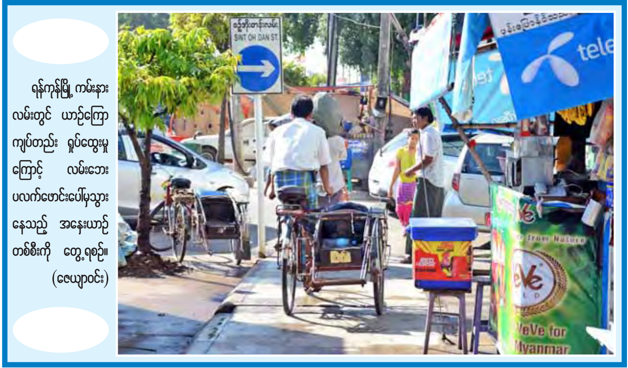
ရန်ကုန်မြို့ ကမ်းနား လမ်းတွင် ယာဉ်ကြော ကျပ်တည်း ရှုပ်ထွေးမှု ကြောင့် လမ်းဘေး ပလက်ဖောင်းပေါ်မှသွား နေသည့် အနေးယာဉ် တစ်စီးကို တွေ့ရစဉ်။ (ဇေယျာဝင်း)

လက်ရှိ မြန်မာအမျိုးသားလေကြောင်းလိုင်းက လေယာဉ်အသစ် တစ်စင်းလျှင် အမေရိကန်ဒေါ်လာသန်း ၆၀ တန်ဖိုးရှိ လေယာဉ်အသစ် ၁၀ စင်းမှာ၍ ဝယ်ယူထားကြောင်း၊ တစ်နှစ်လျှင် နှစ်စင်းနှုန်းရောက်ရှိမည်ဖြစ် ကြောင်း၊ ယင်းကဲ့သို့ ဘိုးရင်းလေယာဉ်အသစ်များ ရောက်ရှိလာတော့မည် ဖြစ်သည့်အတွက် မြန်မာအမျိုးသားလေကြောင်းလိုင်းသည် အိမ်နီးချင်းနိုင်ငံ များမှ လေကြောင်းလိုင်းများကို ကောင်းစွာယှဉ်ပြိုင်နိုင်တော့မည်ဖြစ်ကြောင်း၊ ထို့အပြင် ပြီးခဲ့သည့် ဇွန် ၁၅ ရက်က ရန်ကုန်အပြည်ပြည်ဆိုင်ရာလေဆိပ်သို့ ရောက်ရှိခဲ့သောပထမဦးဆုံးပျံသန်းပြေးဆွဲပေးမည့် လေယာဉ်အသစ်ဦးပိုင်း တွင် မြန်မာနိုင်ငံတော်အလံတံဆိပ်တပ်ထားသော အဆိုပါ ရန်ကုန်-စင်ကာပူခရီးစဉ်ကို လာမည့်အောက်တိုဘာ ၂၅ ရက်မှစတင်၍ နားရက်မရှိ နေ့စဉ်ပျံသန်းပြေးဆွဲပေးသွားမည်ဖြစ်ကြောင်း မြန်မာအမျိုးသားလေကြောင်း လိုင်းမှ စုံစမ်းသိရသည်။ (၀၄၀)