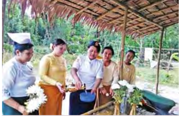
ရန်ကုန်တောင်ပိုင်းခရိုင် တွဲတေးမြို့နယ် တလုထွက်ကျေးရွာ၌ သွေး လွန်တုပ်ကွေးကာကွယ်ရေးလုပ်ငန်းအဖြစ် ဇူလိုင် ၁၁ရက်က မြို့နယ်ကျန်းမာရေး ဌာနမှ ဝန်ထမ်းများ၊ မြို့နယ်မိခင်နှင့်ကလေး စောင့်ရှောက်ရေးအသင်းဝင် များ ပူးပေါင်း၍ ဖွဲ့၊ သွန်း၊ လဲ၊ စစ် လုပ်ငန်းများ ပညာပေးခြင်း၊ ရေတွင်း၊ ရေကန် များအား အဘိတ်ဆေးခတ်ခြင်းများ ဆောင်ရွက်စဉ်။ မျိုးလှိုင်(တွဲတေး)

တိရစ္ဆာန်များသောက်သုံးရန်အတွက် ရေဂါလန် ခုနစ်သန်းခန့်စီ သိုလှောင်နိုင် သည့် လျှိုပိတ်တံခံနှစ်ခုကိုလည်း တည်ဆောက်ပေးထားသည်။ လျှပ်စစ်မီးရရှိရေးအတွက် ဝန်ကြီး-မြစ်သာ ဓာတ်အားလိုင်း သွယ်တန်း ခြင်းလုပ်ငန်းကို ပြင်ပလုပ်ငန်းရှင်များနှင့် ပူးပေါင်းဆောင်ရွက်နေသည်။ ပြောင်းရွှေ့ခံရသော ကျေးရွာလေးရွာမှ တောင်သူလယ်သမားများအား ၎င်းတို့၏ မြေယာလျော်ကြေး၊ နှစ်ရှည်သီးနှံလျော်ကြေး၊ ဆန်စက်၊ ဆီစက် ပြောင်းရွှေ့စရိတ်များ ထုတ်ပေးခဲ့သည်။ သီးနှံလျော်ကြေးအဖြစ် လယ်တစ်ဧက ကျပ်သိန်း ၃၀၊ ယာလျော်ကြေးအဖြစ် တစ်ဧက ကျပ် ၂၅ သိန်းနှင့် နှစ်ရှည်သီးနှံ များဖြစ်သော သရက်ပင်၊ ထန်းပင်၊ မာလာကာပင်နှင့် အခြားအပင်များအတွက် လျော်ကြေးများ ထုတ်ပေးခဲ့သည်။ ကျေးရွာလေးရွာမှ ထပ်တိုးအိမ်ထောင်စု ၄၄ စုတို့ကိုလည်း သက်ဆိုင်ရာကွက်သစ်များတွင် ပေ ၆၀x၄၀ မြေကွက်များ မဲနှိုက်ချပေးခဲ့သည်။ ရွှေပြောင်းကျေးရွာလေးရွာမှ အိမ်ထောင်စု ၃၇၅ စုအတွက် နှစ်နှစ် ဆန်အခမဲ့ပေးဝေနေသည်။ ပထမသုံးလစာ ရိက္ခာဆန်အိတ် ၂၆၃၀ ကို ဖြန့်ဝေ ပေးထားပြီး နှစ်နှစ်တိတ် ရိက္ခာဆန်ဖြန့်ဝေပေးသွားမည်ဖြစ်သည်။ ရွှေပြောင်း ရွာလေးရွာမှ တောင်သူလယ်သမားများအတွက် စိုက်ပျိုးမြေစုစုပေါင်း ၁၅၈၁ ဧကကိုလည်း ဖော်ထုတ်ပေးထားသည်။ ဖော်ထုတ်ထားသည့် စိုက်ပျိုးမြေ များပေါ်တွင် မြေမညီသော အပိုင်းများအား မြေညှိခြင်း၊ မြေဖိုခြင်းလုပ်ငန်း များ ဆောင်ရွက်ပေးခဲ့သည်။ မြေယာသစ်တွင် မြေဩဇာကောင်းမွန်စေရန် အတွက် ထွန်ယက်ပြီးမြေများပေါ်တွင် ပဲယဉ်များ စိုက်ပျိုးခြင်း၊ ပထမသီးနှံ အဖြစ် အထွက်တိုးပြောင်းများ စိုက်ပျိုးခြင်း၊ ဒုတိယသီးနှံအဖြစ် ပုလဲသွယ် အထွက်တိုး စပါးစိုက်ပျိုးခြင်းများ ဆောင်ရွက်ပေးခဲ့သည်။ (၁၁၁)