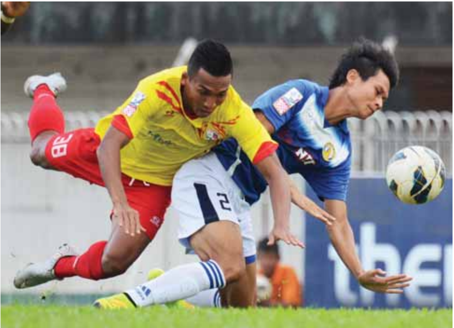
ဇွဲကပင်နှင့် ဇေယျာရွှေမြေတို့ အကြိတ်အနယ်။

ရန်ကုန် ဇူလိုင် ၁၃ ၂၀၁၅ ခုနှစ် ဇူလိုင် ၁၆ ရက်မှ ၁၈ ရက်အထိ ကာလအတွင်း ရန်ကုန်မြစ်အတွင်း အခြေခံရေစစ်မျဉ်း အထက် အမြင့်ပေ ၂၀ ဒသမ ၁၄ ပေခန့်မှ ၂၀ ဒသမ ၂၄ ပေခန့်အထိ ထူးကဲဒီရေတက်ဖွယ်ရှိကြောင်း၊ ယခင် ၂၀၁၃-၂၀၁၄ ခုနှစ်များတွင် ရန်ကုန်မြစ် အတွင်း အခြေခံရေစစ်မျဉ်းအထက် အမြင့်ပေ ၂၂ ပေခန့်ထိ တက်ခဲ့ဖူးသဖြင့် စိုးရိမ်ဖွယ်မရှိကြောင်း၊ အခြေခံရေစစ်မျဉ်းအထက်အမြင့်ပေ ၂၀ကျော်လွန် သဖြင့်သာ သတင်းထုတ်ပြန်ခြင်းဖြစ်ကြောင်း မြန်မာ့ သိပ်ကမ်းအာဏာပိုင်မှ သတိပေးထုတ်ပြန်ချက်အရ သိရသည်။ (ကြေးမုံ)