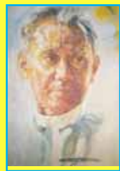
တက္ကသိုလ်ဘုန်းနိုင်