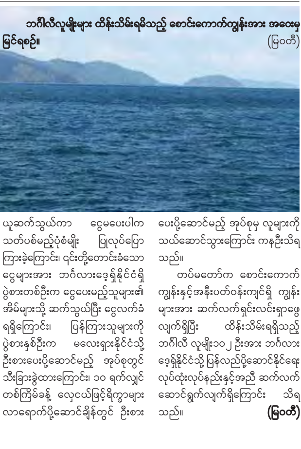
ဘင်္ဂါလီလူမျိုးများ ထိန်းသိမ်းရမည့် စောင်းကောက်ကျွန်းအား အဝေးမှ မြင်ရစဉ်။ (မြဝတီ)

ကျေးရွာမှ တောင်သူတစ်ဦးက ပြောသည်။ နှမ်းပင်၏ သက်တမ်းသည် စိုက်ပျိုးသည့်နေ့မှစ၍ ရိတ်သိမ်းသည်အထိ ရက်ပေါင်း ၉၀ ကျော် ရှိသည်။ ယခုနှမ်းများ၏ သက်တမ်းမှာ ရက်ပေါင်း ၅၀ ကျော် ဖြစ်ပြီး ကျန်ရက်ပေါင်း ၄၀ ကျော်အတွင်း အောင်မိုး အပါအဝင် သုံးမိုးရွာလျှင် အဆင်ပြေသလို မြေတင်ပိုင်း ဆိုလျှင် အမြဲဖျန်းပေးလျှင် အဆင်ပြေကြောင်း တောင်သူ တစ်ဦးက ပြောသည်။ နှမ်းတစ်ဧက စိုက်ပျိုးလျှင် ငွေကျပ် ၂၀၀၀၀၀ ကုန်ကျကြောင်း သိရသည်။ ဇာဇာ(မကွေး)