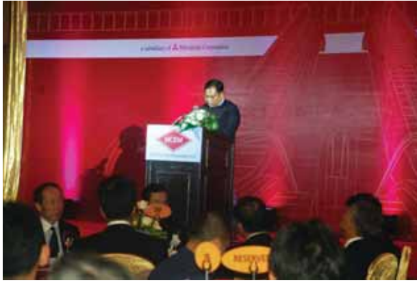
ဇူလိုင် ၁၀ ရက်နေ့တွင် ဖွင့်လှစ်ထားသည့် MCEM ကုမ္ပဏီတွင် ဝန်ထမ်းပေါင်း ၅၀ ခန့်ထားပြီး လုပ်ငန်းကျွမ်းကျင်မှု ရှိစေရန် ပြည်ပနိုင်ငံများသို့ သင်တန်း များ စေလွှတ်ခဲ့ကြောင်း သိရသည်။

နံပါတ်တစ် ကုမ္ပဏီကြီးတစ်ခုလည်း ဖြစ်သည်။ မစ်ဆူဘီရှီသည် မြန်မာ နိုင်ငံတွင် ၁၉၉၈ ခုနှစ်က စတင် ရောက်ရှိလာခဲ့ပြီး ၁၅ နှစ်အကြာ ၂၀၁၄ ခုနှစ်မှ စတင်ရင်းနှီးမြှုပ်နှံခဲ့ ကြောင်းသိရသည်။ ရင်းနှီးမြှုပ်နှံမှု အားဖြင့် စုစုပေါင်း အမေရိကန် ဒေါ်လာ သန်းပေါင်း ၁၅၀ ရင်းနှီး မြှုပ်နှံထားကြောင်း သိရသည်။ MCEM ကုမ္ပဏီမှ တာဝန်ရှိသူ တစ်ဦးက “ကျွန်တော်တို့အနေနဲ့ မန္တလေးမှာသာမက တခြားနေရာ တွေမှာပါ ထပ်ပြီးတိုးချဲ့ချင်သေးတယ်။ သီလဝါမှာပါထပ်ပြီး ဖြစ်နိုင်မယ်ဆိုရင် Elevator တွေ တိုးချဲ့တပ်ဆင် လုပ်ကိုင်သွားဖို့ရှိပါတယ်။ ၂၀၁၄ ခုနှစ် ၁၁ လပိုင်းကစဖြစ်ခဲ့တာက Elevator ဟာ လူတစ်ယောက်ရဲ့ အသက်အန္တရာယ်နဲ့ အများကြီး သက်ဆိုင်စေတဲ့အတွက် အခြေခံ ခိုင်မာအောင်၊ တာကွယ်ဖို့အတွက် အရင်ဆုံးဂျပန်ကို လွှတ်တယ်။