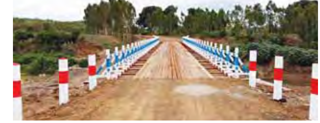
တံတား သုံးစင်း၊ ရေကျော် သုံးစင်း ဖြစ်ကြောင်း မြို့နယ်ကျေးလက်ဒေသ တို့ကို ယခုနှစ် မေလတွင် လုပ်ငန်း ဖွံ့ဖြိုးတိုးတက်ရေးဦးစီးမှူး၏ ပြောပြ အားလုံး ဆောင်ရွက်ပြီးစီးပြီ ချက်အရ သိရသည်။ (ခင်ဦးစိုးဝေ)

စစ်ကိုင်းတိုင်းဒေသကြီး ရွှေဘိုခရိုင် ခင်ဦးမြို့နယ်အပိုင်း ခရိုင်ချင်းဆက် လမ်း အမှတ်(၃) လမ်း၊ တံတား၊ ရေကျော်လုပ်ငန်းများကို ၂၀၁၄-၂၀၁၅ ဘဏ္ဍာနှစ်တွင် မြို့နယ် ကျေးလက်ဒေသဖွံ့ဖြိုးတိုးတက်ရေး ဦးစီးဌာနက တာဝန်ယူဆောင်ရွက်ခဲ့ရာ မြေသားလမ်း ၁၀မိုင်၊ ကျောက်ချော လမ်း ၂၀ မိုင် ၅ ဖာလုံ၊ ကျောက်စီ၊ သံပေါင်ရက်မ၊ သစ်သားခင်း