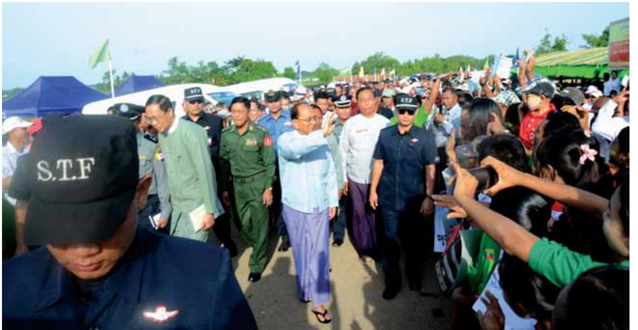
ပြည်ထောင်စုသမ္မတမြန်မာနိုင်ငံတော် ကျေးလက်ဒေသဖွံ့ဖြိုးရေးနှင့် ဆင်းရဲနွမ်းပါးမှုလျှော့ချရေး ဗဟိုကော်မတီဥက္ကဋ္ဌ နိုင်ငံတော်သမ္မတ ဦးသိန်းစိန် မှော်ဝန်းတံတားဖွင့်ပွဲတွင် ဒေသခံပြည်သူများအား ရင်းရင်းနှီးနှီးနှုတ်ဆက်စဉ်။ (သတင်းစဉ်)

ဒေသဖွံ့ဖြိုးတိုးတက်ရေးကို များစွာ အထောက်အကူဖြစ်ကြောင်း၊ နိုင်ငံတော်အစိုးရအနေဖြင့် ကျောက်တန်းဒေသတွင် လျှပ်စစ်မီးရရှိရေး၊ စိုက်ပျိုးမြေများသို့ ပင်လယ်ရေခန့် ဝင်ရောက်မှုကို ကာကွယ်ပေးနိုင်ရေးတို့အား ဆက်လက် ဆောင်ရွက်ပေးပါရန်၊ နိုင်ငံတော်သမ္မတအနေဖြင့် ကျေးလက်လူမှုစီးပွားဘဝ ဖွံ့ဖြိုးတိုးတက်ရေးလုပ်ငန်းများကို လာမည့်နှစ်များတွင် လည်း ဆက်လက်အကောင်အထည်ဖော်ပေးစေလိုကြောင်း ပြောကြားခဲ့သည်။ ထို့နောက် ရန်ကုန်တိုင်းဒေသကြီးဝန်ကြီးချုပ် ဦးမြင့်ဆွေက ရန်ကုန်တိုင်းဒေသကြီးအတွင်း ကျေးလက်ဒေသဖွံ့ဖြိုးတိုးတက်ရေးနှင့် ဆင်းရဲနွမ်းပါးမှုလျှော့ချရေးလုပ်ငန်းများအကောင်အထည်ဖော်ဆောင်ရွက်ခဲ့မှုအခြေအနေများနှင့် ကျောက်တန်းမြို့နယ်ဖွံ့ဖြိုးတိုးတက်ရေးအတွက် ဆောင်ရွက်ဆဲလုပ်ငန်းများ၊ အနာ