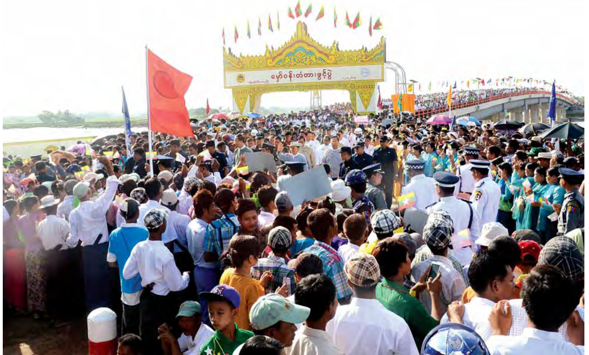
ပြည်ထောင်စုသမ္မတမြန်မာနိုင်ငံတော် ကျေးလက်ဒေသဖွံ့ဖြိုးရေးနှင့် ဆင်းရဲနွမ်းပါးမှုလျှော့ချရေးဗဟိုကော်မတီဥက္ကဋ္ဌ နိုင်ငံတော်သမ္မတ ဦးသိန်းစိန် မှော်ဝန်းတံတားပေါ်သို့ ဖြတ်သန်းကြည့်ရှုစစ်ဆေးပြီး ဒေသခံပြည်သူများအား ရင်းရင်းနှီးနှီးနှုတ်ဆက်စဉ်။ (သတင်းစဉ်)

ရန်ကုန်တောင်ပိုင်းခရိုင် ကျောက်တန်းမြို့နယ် ဝဲကြီးကျေးရွာနှင့် ပန်းချောင်းကျေးရွာသို့ မှော်ဝန်းချောင်းကို ဖြတ်သန်းတည်ဆောက်ထားသည့် မှော်ဝန်းတံတားဖွင့်ပွဲကို ယနေ့နံနက် ၈ နာရီတွင် အဆိုပါတံတားအနီးရှိ ယာယီ မဏ္ဍပ်၌ ကျင်းပရာ ပြည်ထောင်စုသမ္မတမြန်မာနိုင်ငံတော် ကျေးလက်ဒေသဖွံ့ဖြိုးရေးနှင့် ဆင်းရဲနွမ်းပါးမှုလျှော့ချရေးဗဟိုကော်မတီဥက္ကဋ္ဌ နိုင်ငံတော်သမ္မတ ဦးသိန်းစိန် တက်ရောက်ပြီး ကမ္ဘာ့ဦးစီးဌာနများနှင့်အညီ စက်ဝတ်လုပ်ငန်း ဖွင့်လှစ်ပေးမည်။