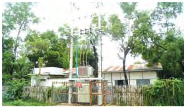
မတ္တရာ ဇူလိုင် ၁၂

ဆက်လက်၍ မြို့နယ်မြေစာရင်းဦးစီးဌာန မြေတိုင်းဝန်ထမ်းများက ၎င်း ဘန်းလမ္ပတ်ကျေးရွာအတွင်း အိမ်ခြေ ၁၆၁ အိမ်အား မြေအမျိုးအစားလိုက် တိုင်းထွာခြင်း၊ ဘေးပတ်ဝန်းကျင် အသိသက်သေများ သဘောထားမှတ်ချက် နှင့် သုံးဘက်မြင်စာတိုင်များဖြင့် အခမဲ့မြေအငှားဝရန်ရရှိရေးအတွက် စက် တင်ဘာလကုန်တွင်ပြီးစီးအောင် ဆောင်ရွက်သွားမည်ဖြစ်သဖြင့် ဒေသခံ ရပ်မိရပ်ဖများ၊ လူမှုရေးအသင်းအဖွဲ့များမှ ပူးပေါင်းကူညီကြရန် ညှိနှိုင်း ဆွေးနွေးခဲ့သည်။ ဒေသခံများကလည်း မရှင်းလင်းသည့်များမေးမြန်း၍ သက် ဆိုင်ရာတို့က ပြန်လည်ဖြေကြားခဲ့ကြောင်း သိရသည်။ ထိန်းဝင်း(ပြန်ဆက်)