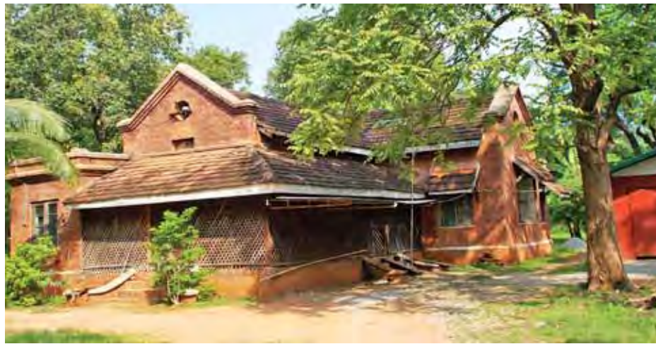
လုပ်ငန်းနှင့် မြို့ပြအင်ဂျင်နီယာစနစ်ကောင်းမွန်ခဲ့ပုံကို အတုယူနိုင်သည်ဟု ညွှန်းဆိုနိုင်သည်။ ရှေ့မိနောက်မိ