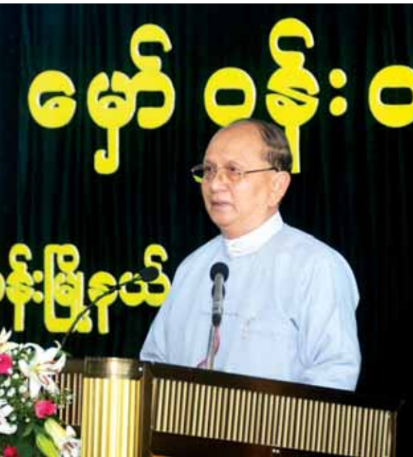
ပြည်ထောင်စုသမ္မတမြန်မာနိုင်ငံတော် ကျေးလက်ဒေသဖွံ့ဖြိုးရေးနှင့် ဆင်းရဲနွမ်းပါးမှု လျှော့ချရေးဗဟိုကော်မတီဥက္ကဋ္ဌ နိုင်ငံတော်သမ္မတ ဦးသိန်းစိန် မှော်ဝန်းတံတားဖွင့်ပွဲတွင် နှုတ်ခွန်းဆက်စကားပြောကြားစဉ်။ (သတင်းစဉ်)

ထို့ပြင် ဒေသခံပြည်သူများ၏ ပညာရေး၊ ကျန်းမာရေးနှင့် လူမှုစီးပွား ဘဝ ပိုမိုဖွံ့ဖြိုးတိုးတက်လာမည်ဖြစ် ပြီး အဆိုပါဒေသရှိ စိုက်ပျိုးမြေ ၁၂၇၃၁၂ ဧကတို့မှ လယ်ယာ ထွက်ကုန်များနှင့် ငါး၊ ပုစွန်မွေးမြူရေး ၁၁၄၅၂ ကန်တို့မှ သားငါး၊ ပုစွန် စသည့် ရေထွက်ကုန်ပစ္စည်းများကို ရန်ကုန်မြို့နှင့် ဆက်စပ်မြို့များသို့ သယ်ယူပို့ဆောင်စရိတ်သက်သာစွာ ဖြင့် အချိန်တိုအတွင်းတင်ပို့ရောင်း ချနိုင်မည်ဖြစ်ကြောင်း သိရသည်။ (သတင်းစဉ်)