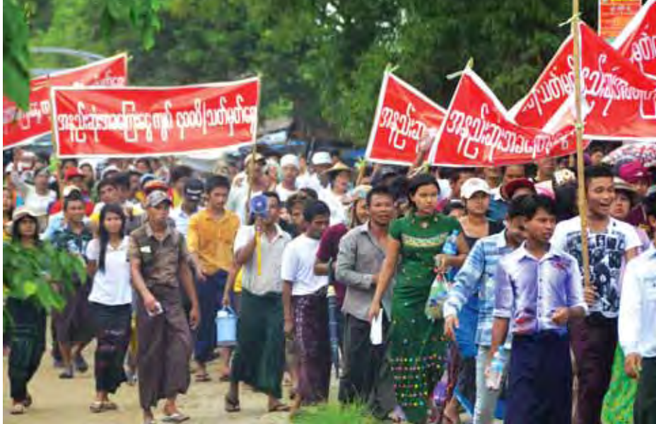
လှိုင်သာယာမြို့နယ်အတွင်း အလုပ်သမားများဆန္ဒဖော်ထုတ်နေမှုကို တွေ့ရစဉ်။

စစ်တွေ ဇူလိုင် ၁၂ လူမှုဝန်ထမ်း၊ ကယ်ဆယ်ရေးနှင့် ပြန်လည်နေရာချထားရေးဝန်ကြီးဌာနမှ ရခိုင်ပြည်နယ်အတွင်း ရေဘေးသင့်ပြည်သူများအတွက် ကယ်ဆယ်ရေးပစ္စည်းထောက်ပံ့ပေးအပ်ခြင်း၊ စစ်တွေခရိုင်၊ မြောက်ဦးခရိုင်၊ မောင်တောခရိုင်၊ ကျောက်ဖြူခရိုင်၊ သံတွဲခရိုင်များအတွင်းရှိ စေတနာ့ဝန်ထမ်းအဖွဲ့အစည်းများသို့ ၂၀၁၅-၂၀၁၆ ဘဏ္ဍာရေးနှစ် ထောက်ပံ့ငွေများပေးအပ်ခြင်းနှင့် လူမှုစောင့်ရှောက်ရေးနှင့် သဘာဝဘေးလျော့ပါးရေး စေတနာ့ဝန်ထမ်းလူငယ်များ မွမ်းမံသင်တန်းအမှတ်စဉ်(၁၂/၂၀၁၅)ဖွင့်ပွဲအခမ်းအနားကို ဇူလိုင် ၁၂ ရက် နံနက် ၈ နာရီခွဲက စစ်တွေမြို့၊ ဦးဥတ္တမခန်းမ၌ ကျင်းပခဲ့ကြောင်း သိရသည်။ အခမ်းအနားတွင် ပြည်ထောင်စုဝန်ကြီး ဒေါက်တာဒေါ်မြတ်မြတ်အုန်းခင်နှင့် ရခိုင်ပြည်နယ် ချင်းတိုင်းရင်းသားရေးရာဝန်ကြီး ဦးကိုကိုနိုင်တို့က အဖွင့်အမှာစကားပြောကြားသည်။ ထို့နောက် ပြည်ထောင်စုဝန်ကြီးနှင့် တာဝန်ရှိသူတို့က ရခိုင်ပြည်နယ်အတွင်း ဘူးသီးတောင်၊ အမ်း၊ သံတွဲ၊ တောင်ကုတ်၊ မောင်တောမြို့နယ်တို့မှ ရေဘေးသင့်ပြည်သူများ အသုံးပြုရန်အတွက် စောင်အထည် ၅၀၀၊ ခြင်ထောင်အလုံး ၁၀၀ နှင့် ကယ်ဆယ်ရေးပစ္စည်းများကို သက်ဆိုင်ရာ မြို့နယ်များမှ ကိုယ်စားလှယ်များထံ ထောက်ပံ့ပေးအပ်ပြီး စစ်တွေခရိုင်၊ မြောက်ဦးခရိုင်၊ မောင်တောခရိုင်၊ ကျောက်ဖြူခရိုင်နှင့် သံတွဲခရိုင်အတွင်းရှိ စေတနာ့ဝန်ထမ်းအဖွဲ့အစည်းများသို့ ၂၀၁၅-၂၀၁၆ ဘဏ္ဍာရေးနှစ် ထောက်ပံ့ငွေများ ပေးအပ်သည်။ ရခိုင်ပြည်နယ်တွင် ရေဘေးသင့်ပြည်သူများအတွက် ကယ်ဆယ်ရေးပစ္စည်းတန်ဖိုးငွေနှင့် ခရိုင်ငါးခရိုင်အတွင်း စေတနာ့ဝန်ထမ်းအဖွဲ့အစည်းများသို့ ထောက်ပံ့ငွေစုစုပေါင်းမှာ ငွေကျပ်သိန်း ၁၅၀၀ ကျော်ဖြစ်ကြောင်း သိရသည်။ (ပြည်နယ် မြန်/ဆက်)