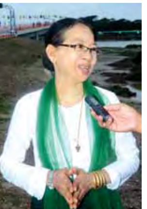
ဆရာမဒေါ်ဌေးရီ။