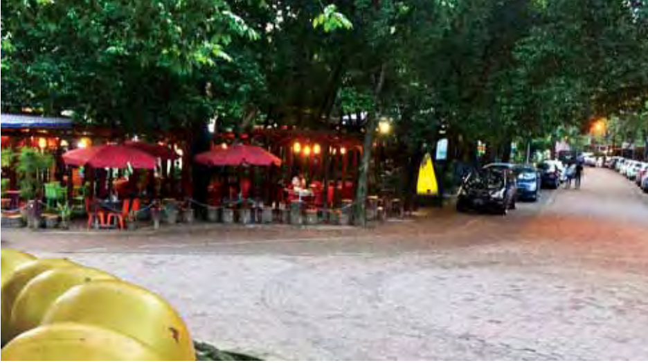
ကန်တော်ကြီး(ကရဝိက်ဥယျာဉ်)အတွင်းမှ စားသောက်ဆိုင်အချို့ကို တွေ့ရစဉ်။

တစ်ခါက ကျွန်တော်ကိုယ်တိုင် တင့်ကားကုန်းနားရှိ ကန်ရေပြင်စပ်က ဆူရှီတိုင်းဆိုင်တွင် သူငယ်ချင်းမိတ်ဆွေ များနှင့် ထိုင်ရင်းသောက်စားနေစဉ် ဘေးပိုင်းမှ ဆရာ သမားက မူးယစ်ရမ်းကားလေသည်။ အိန္ဒိယနွယ်ဖွား ချာတီတံ တစ်သိုက် နောက်တီးနောက်ချာလုပ်သည်ကို မြင်သောအခါ အဆိုပါဆရာသမားက အမုန်းစကားများကို ပြောဆို၍ လိုက်လံရိုက်နှက်ထိုးကြိတ်လေသည်။