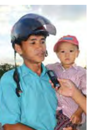
ကိုသန်းဌေး။

သည်။ ဤမှော်ဝန်းတံတား ဖွင့်လှစ်နိုင် ခြင်းသည် ရန်ကုန်တောင်ပိုင်းခရိုင် ကျောက်တန်းမြို့နယ်နှင့် ဆက်စပ် ကျေးရွာအုပ်စုများအတွက် ကြီးမား ကျယ်ပြန့်သော ဖွံ့ဖြိုးတိုးတက်မှု၏ ကနဦးအစ ဖြစ်ပေါ်မိမည်။ နိုင်ငံတော်သမ္မတ ဦးသိန်းစိန်၏ ဒေသခံပြည်သူများအား နှုတ်ခွန်း ဆက်အမှာစကားတွင် ဤဒေသ၏ ကြီးမားသော အခွင့်အလမ်းနှင့် အနာဂတ် မျှော်မှန်းချက်များကို ထည့်သွင်း ပြောကြားခဲ့ပေသည်။ သို့ဖြင့် မှော်ဝန်းတံတားဖွင့်ပွဲအခမ်း