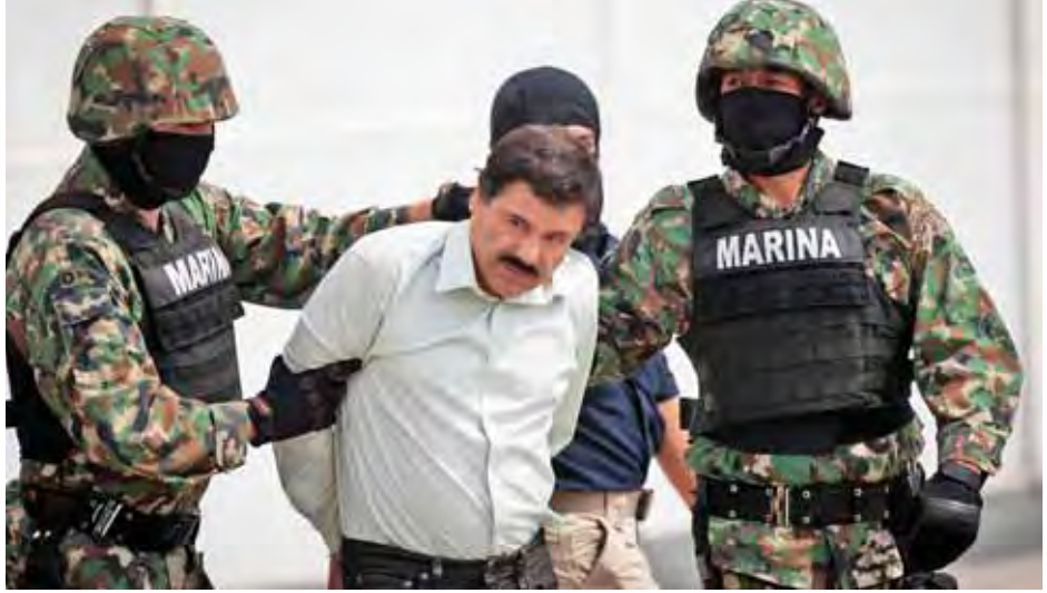
၂၀၁၄ ခုနှစ်က အာဏာပိုင်များက မှူးယစ်ရာဇာ ဂျီရာတွင်ကို ပြန်လည်ဖမ်းဆီးခဲ့သည်ကို တွေ့ရစဉ်။