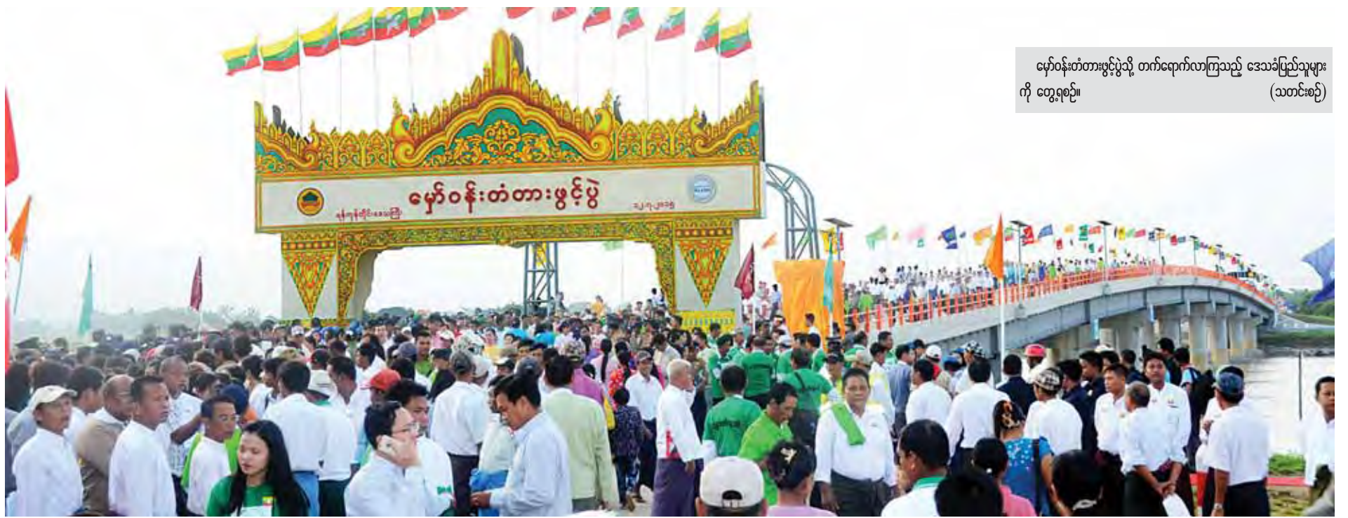
မှော်ဝန်းတံတားဖွင့်ပွဲသို့ တက်ရောက်လာကြသည့် ဒေသခံပြည်သူများ ကို တွေ့ရစဉ်။ (သတင်းစဉ်)

ရန်ကုန်ကိုသွားရင် သုံးခွဘက်က နေသွားရင်သွား၊ မသွားရင် ဒီကနေ စက်လှေစီးပြီး ကျောက်တန်းကိုသွား၊ ကျောက်တန်းကနေတစ်ဆင့် ရန်ကုန် ကို သွားရတယ်။ အခု တံတားတည် ဆောက်ဖွင့်လှစ်ပေးတော့ ဖြတ်လမ်း သဘောဖြစ်သွားပြီး ခရီးကတအား နီးသွားတယ်။ နေ့ညအချိန်မရွေး သွားလို့ရသွားတယ်။ ဒီဘက်မှာက မိုးစပါးစိုက်တယ်။ နွေကျမှ ပဲစိုက်တယ်။ ကုန်စည်ပို့ဆောင်ရေးက ရေလမ်းကိုပဲ အားကိုးရတာ။ ရေလမ်းကတစ်ဆင့် မော်တော်နဲ့သယ်ရတာ။ ရန်ကုန်ကို တိုက်ရိုက်ပို့ဖို့ခက်ခဲတယ်။ အခုကျ ကားနဲ့တစ်ခါတည်းပို့လို့ရသွားပြီ။