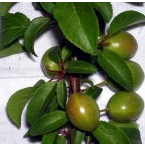
ဖန်ခါးသီး၏ အာနိသင်မှာ သကြားလေကိုနိုင်စေကြောင်း သိရသည်။ လက်ရှိ မကွေးဒေသဈေးကွက်တွင် ဘုရားပြိုဖန်ခါးသီး တစ်ပြည်ကို ကိုနိုင်၏။ ထောပတ်နှင့်စားပါက ငွေကျပ် ၃၅၀၀ ဝန်းကျင်ဈေးပေါက်ပြီး

ယခုရက်ပိုင်းတွင် ဖန်ခါးသီးပေါ်ဦးပေါ်စပို့ ဈေးကြီးနေခြင်းဖြစ်ပြီး ဒုတိယဝါဆိုလောက်တွင် လှိုင်လှိုင်ပေါ်မည်ဖြစ်၍ လက်ရှိဈေးကွက်ထက် လျော့နည်းသွားမည်ဖြစ်ကြောင်း ၎င်းက ဆက်လက်ပြောသည်။