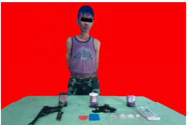
လုံးကောလိန်အား သိမ်းဆည်းရမိ မူးယစ်ဆေးဝါးများနှင့်အတူ တွေ့ရစဉ်။

ဘိန်းညိုခဲ သူညီ ဒေသ ၀၁၆၃၃ ကီလိုနှင့် မြန်မာငွေ ကျပ်၇၀၀၀၀ တို့ကို သိမ်းဆည်းရမိသဖြင့် မူးယစ်ဆေးဝါးနှင့် စိတ်ကိုပြောင်းလဲစေသော ဆေးဝါးများဆိုင်ရာ ဥပဒေအရ အရေးယူထားကြောင်း သိရသည်။ (သတင်းစဉ်)