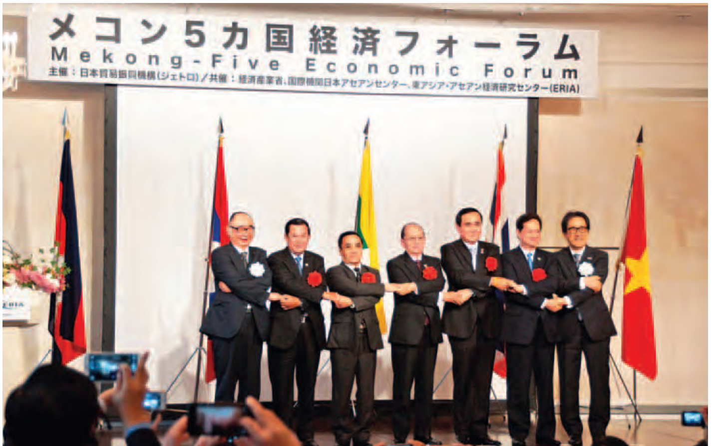
ဂျပန်နိုင်ငံ Hotel New Otani ၌ ကျင်းပသည့် မဲခေါင်အဖွဲ့ဝင်ငါးနိုင်ငံ၏ စီးပွားရေးဖိုရမ်၌ စုပေါင်းမှတ်တမ်းတင်ဓာတ်ပုံရိုက်ကြစဉ်။ (မြန်/ဆက်)

ထားဝယ်အထူးစီးပွားရေးဇုန်နယ်မြေသည် ပစိဖိတ် သမုဒ္ဒရာနှင့် အိန္ဒိယသမုဒ္ဒရာတို့ကို ကွန်းလမ်းမှ ဆက်သွယ်ပေးမည့် မဟာမဲခေါင်တောင်ဘက် စီးပွားရေးစင်္ကြံ၏ အနောက်တံခါးပေါက်အဖြစ် မဟာဗျူဟာကျစွာ တည်ရှိနေကြောင်း။