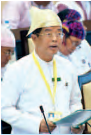
ဒုတိယဝန်ကြီး ဦးကျော်ကျော်ဝင်း။

ပထမအကြိမ် အမျိုးသားလွှတ်တော် (၁၂) ကြိမ်မြောက် ပုံမှန်အစည်းအဝေး (၆၆) ရက်မြောက်နေ့ကို ယနေ့နံနက် ၁၀ နာရီတွင် ကျင်းပရာ လွှတ်တော် ကိုယ်စားလှယ်များ၏ တန်ဖိုးနည်း အိမ်ရာများ ဖော်ထုတ်ပေးရေးနှင့် ရန်ကုန်စည်ပင်သာယာရေးနယ်နိမိတ် ရှိ မီးပွိုင့်များကို ပုဂ္ဂလိကသို့ လုပ်ကိုင် ခွင့်ပြုနိုင်ခြင်း ရှိ မရှိ မေးခွန်းများ နှင့်စပ်လျဉ်း၍ သမ္မတရုံးဝန်ကြီးဌာန ဒုတိယဝန်ကြီး ဦးကျော်ကျော်ဝင်းက ပြန်လည်ဖြေကြားသည်။