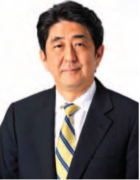
ဂျပန်အစိုးရ ဝန်ကြီးချုပ် ရှင်ဒိုအာဘေး။

ယခုချိန်အထိ မဲခေါင်ဒေသတွင်း ငြိမ်းချမ်းရေး တည်ဆောက်ခြင်းမှ ဒေသတွင်းဆက်သွယ်မှုများတိုးတက်သည်အထိ ဘိုးဘွားဘီဘင်များက အစွမ်းကုန်ကြိုးပမ်းအားထုတ်ခဲ့ကြပါသည်။ ထို့ပြင် ဂျပန်လူမျိုးများက ဒီအတွက်အလုပ်လုပ်ပြီး မတည်ငွေနှင့် နည်းပညာအတွေ့