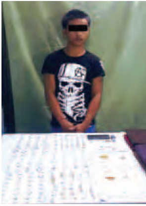
ငွေကျပ် သိန်း ၁၄၀ ခန့်တန်ဖိုးရှိ ရွှေထည်ပစ္စည်းများ ခိုးယူသူကို ပစ္စည်းများနှင့်အတူ တွေ့ရစဉ်။

ရွှေနန်းတိုက်ရွှေဆိုင်ပိုင်ရှင်ဖြစ်သူက ပုဇွန်တောင်မြို့နယ်၌ ဖွင့်လှစ်ထားသည့် ရွှေဆိုင်မှ ဇွန် ၂၇ ရက် နံနက် ၉ နာရီခွဲက ရွှေနားကပ်နှင့် နားဆွဲများ စုစုပေါင်းအလေးချိန် ၂၀ ကျပ်သားခန့်၊ တန်ဖိုးငွေကျပ်သိန်း ၁၄၀ ခန့် ပျောက်ဆုံးနေသည်ကို တွေ့ရှိရသဖြင့် စုံစမ်းအရေးယူပေးရန် တိုင်တန်းသဖြင့် ပုဇွန်တောင်မြို့မရဲစခန်းက (ပ)၁၄၀/၂၀၁၅၊ ပြစ်မှုပုဒ်မ ၃၈၀ ဖြင့် အမှုဖွင့်စုံစမ်းဆောင်ရွက်ခဲ့သည်။