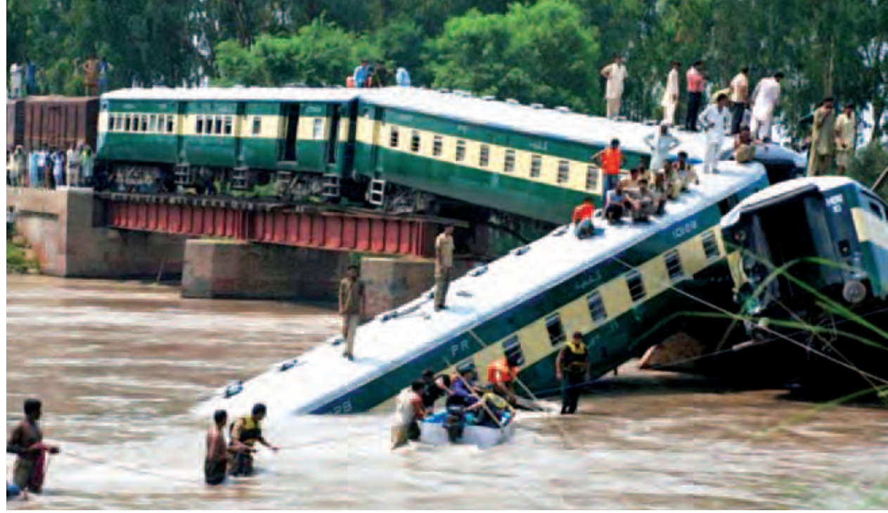
အစ္စလာမာဘတ် ဇူလိုင် ၃

ပါကစ္စတန်နိုင်ငံတွင် အထူးရထားတစ်စင်းသည် တံတားတစ်ခုကိုဖြတ်သန်းနေစဉ် ရထားလမ်းချော်ပြီး တူးမြောင်းအတွင်းသို့ ထိုးကျခဲ့ရာ အနည်းဆုံး သေဆုံးသူ ၁၇ ဦးရှိပြီဖြစ်ကြောင်း ဒေသဆိုင်ရာ သတင်းဌာနများက ယနေ့သတင်းထုတ်ပြန်သည်။