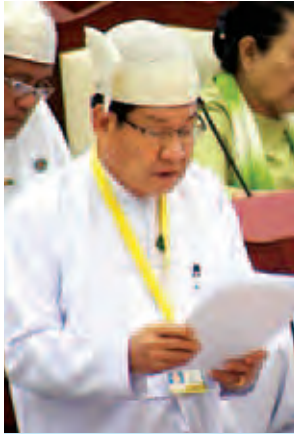
ဒုတိယဝန်ကြီး ဦးခင်ဇော်။

ချီပွေမဲဆန္ဒနယ်မှ ဦးဇော်တိန်၏ ဝေးလံခေါင်သီသော ဒေသများတွင်