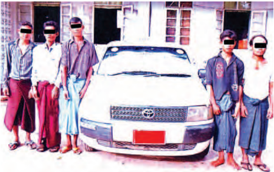
လုယက်မှုကျူးလွန်သူ ငါးဦးအား ဖမ်းဆီးရမိစဉ်။