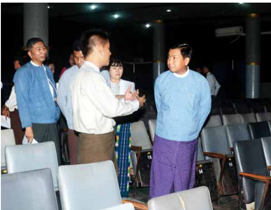
ပူးပေါင်း၍ ပြင်ပအကူအညီဖြင့် ရှေးဟောင်းသမိုင်းဝင် အဆောက် အအုံအဖြစ် ပြုပြင်ထိန်းသိမ်းပြီး Red Carpet Theatre အဖြစ် ဆောင် ရွက်ရန် စီစဉ်လျက်ရှိကြောင်း သိရ သည်။ (သတင်းစဉ်)