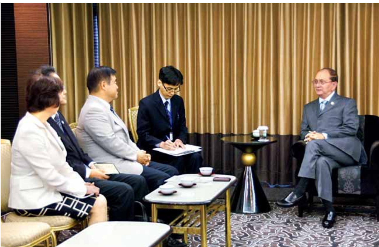
ပညာတော်သင်ထောက်ပံ့ကြေးပေးအပ်ခဲ့ပြီးဖြစ်ကာ အဆိုပါကျောင်းသားများ အနက် ၂၅ ဦးမှာ ပါရဂူဘွဲ့ရရှိခဲ့ကြောင်း သိရှိရသည်။

အဆိုပါ အိမ်အိမ်ပိ ပညာသင်ဆုဖောင်ဒေးရှင်းမှာ ဒုတိယကမ္ဘာစစ်အတွင်း မြန်မာနိုင်ငံတွင် ပါဝင်တိုက်ခိုက်ခဲ့သော ဂျပန်တပ်သားများအား ကူညီ စောင့်ရှောက်ပေးခဲ့သည့် မြန်မာလူမျိုးများအား ကျေးဇူးတုံ့ပြန်သည့်အနေဖြင့် ပညာရေးဆိုင်ရာကူညီထောက်ပံ့ပေးအပ်ရန် ၁၉၈၈ ခုနှစ်တွင် ထူထောင် ခဲ့သော ဖောင်ဒေးရှင်းဖြစ်သည်။ မြန်မာနိုင်ငံမှ ကျောင်းသား ၁၈၇ ဦးအား