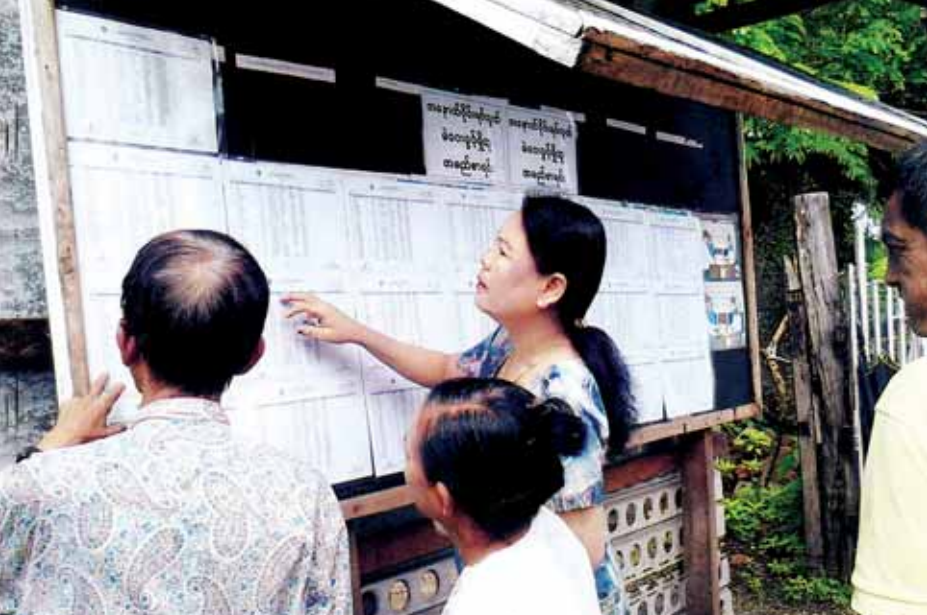
ဇွန် ၂၃ ရက်က ကျောက်ဖြူမြို့နယ်တွင် မဲဆန္ဒရှင်စာရင်းများ ထုတ်ပြန်ကြေညာထားရာ လာရောက်ကြည့်ရှုနေကြသည်ကို တွေ့ရစဉ်။

ပါသည်။ အချိန်နှင့်တစ်ပြေးညီ ပြင်လည်းပြင်ပေးနေပါသည်။ ထိုသို့ဆောင်ရွက်ခြင်းများ၏ အနှစ်သာရမှာ ကျင်းပမည့် အထွေထွေရွေးကောက်ပွဲကြီးတွင် မဲပေးခွင့်ရှိသူတိုင်း မဲပေးခွင့်မဆုံးရှုံးစေရပေမည်ဖြစ်ပါသည်။ လစ်ဟာနေသာ ကွက်လပ်လေးများ သက်ဆိုင်ရာရွေးကောက်ပွဲကော်မရှင်က အခြေခံမဲစာရင်းကို ထုတ်ပြန်၊ မီဒီယာများက တွေ့ရှိရသည့်အားနည်းချက်၊ အားသာချက်များကို ထုတ်ဖော်၊ နိုင်ငံတော်အစိုးရက အသိပညာပေးနှိုးဆော်မှုများကို တွင်တွင်