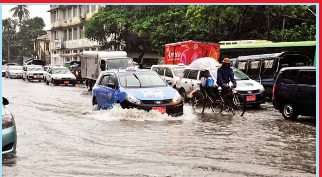
ဇူလိုင် ၂ ရက် ညနေပိုင်းက ရွာသွန်းခဲ့သော မိုးရေများကြောင့် ရန်ကုန်မြို့၊ မဟာဗန္ဓုလလမ်းပေါ်တွင် ရေများပြည့်လျှံနေသည်ကို တွေ့မြင်ရစဉ်။

ဇူလိုင် ၂ ရက်နေ့ထုတ် ကြေးမုံသတင်းစာ စာမျက်နှာ(၅)တွင် ဖော်ပြထားသော နိုင်ငံရေးပါတီ မှတ်ပုံတင်ခွင့်များ လာရောက်လျှောက်ထားလျက်ရှိသတင်း ဒုတိယစာကြောင်းတွင် ၂၀၁၅ ခုနှစ်၊ “ဇူလိုင်လ ၇ ရက်” အစား “ဇူလိုင်လ ၁ ရက်”ဟု ပြင်ဆင်ဖတ်ရှုပါရန်။ (စာတည်း)