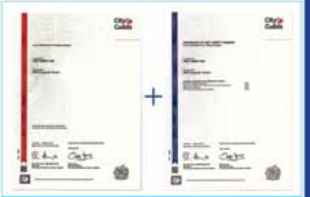
UK Diploma + Certificate

အမှတ် ( ၃၃၁ )၊ ပြည်လမ်း၊ မြေနီကုန်း၊ စမ်းချောင်းမြို့နယ်။ ဖုန်း - ၅၂၇၄၃၆၊ ၅၃၄၁၇၀၊ ၅၀၂၂၃၃။