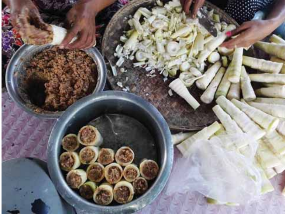
တမူးမျှစ်ပေါင်းရောင်းချသူများဝင်ငွေတိုး၍ စီးပွားဖြစ်နေကြောင်း သိရသည်။ နောက်ပြီး ဒေသထွက်ဆိုင်ရာများထဲတွင် နာမည်ကြီးစားစရာတစ်ခုဖြစ်သော တမူးမျှစ်ပေါင်းကို ပြုလုပ်ရောင်းချသူများ အနေဖြင့် နေ့တွက်ကိုက်ကာ ဝင်ငွေတိုး၍ စီးပွားဖြစ်နေကြောင်း သိရသည်။

တမူး ဇူလိုင် ၂ စစ်ကိုင်းတိုင်းဒေသကြီး တမူးမြို့၏ ဒေသထွက်စားစရာများထဲတွင် နာမည်ကြီးစားစရာတစ်ခုဖြစ်သော တမူးမျှစ်ပေါင်းကို ပြုလုပ်ရောင်းချသူများ အနေဖြင့် နေ့တွက်ကိုက်ကာ ဝင်ငွေတိုး၍ စီးပွားဖြစ်နေကြောင်း သိရသည်။ တမူးမျှစ်ပေါင်းသည် ရာသီစာအစားအစာတစ်ခုဖြစ်ပြီး မိုးတွင်းကာလတွင်မှရရှိသောမျှစ်ကို စားချင်စဖွယ်ဖြစ်အောင် မျှစ်အဖျားပိုင်း ငါးလက်မကျော်ခန့်ကိုဖြတ်၍ မျှစ်အခေါင်းလေးများဖြစ်အောင် ထွင်းကာ မျှစ်အပိုင်းအစလေးများဖြင့် ရောပြီး မိမိကြိုက်နှစ်သက်သော အစားအစာများ ထည့်၍လည်းကောင်း၊ ပုဇွန်ခြောက်များထည့်၍လည်းကောင်း ပြန်ပိတ်ကာ ရေဓနွေးငွေ့ဖြင့်ပေါင်းခံပြီး စားသုံးရသော အစားအစာဖြစ်သည်။