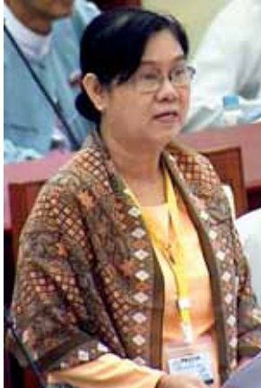
ဒုတိယဝန်ကြီး ဒေါ်လှလှသိန်း။