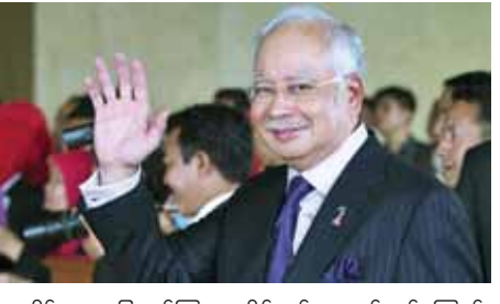
လျှော့ဒါန်းမှုများ ပြုလုပ်ကြလျာလိမ့်မည်ဟု မျှော်လင့်ကြောင်း ပြောကြားသည်။

ကိုယ်တွင်းအင်္ဂါလျှော့ဒါန်းမှုကိုထောက်ခံပေးခဲ့သည့် အစိုးရတာဝန်ရှိသူများအား ကျန်းမာရေးဝန်ကြီးဌာနက ကျေးဇူးတင်ရှိကြောင်း ဖော်ပြခဲ့ပြီး အများစုသော မလေးရှားနိုင်ငံသားများအနေဖြင့်လည်း ကိုယ်တွင်းအင်္ဂါ အစားထိုးကုသရန် လိုအပ်ချက်အတွက် ကုသိုလ်ဖြစ်