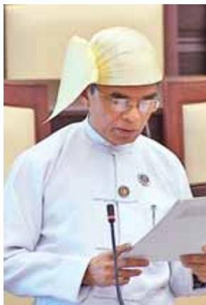
မဲဆန္ဒနယ် အမှတ်(၁၀)မှ လွှတ်တော်ကိုယ်စားလှယ် ဦးနု။

နေ့စားဝန်ထမ်းများအား အမြဲတမ်း ခန့်ထားရာတွင် ဖွဲ့စည်းပုံလစ်လပ်မှု အရ ခန့်ထားခြင်းဖြစ်ပါကြောင်း၊ မွန်ပြည်နယ်အတွင်းရှိ နေ့စား ဝန်ထမ်းများအား အမြဲတမ်းခန့်ထား ရာတွင် မွန်ပြည်နယ်အတွင်း ဝင်ပေါက်ရာထူး နေရာလစ်လပ်မှု