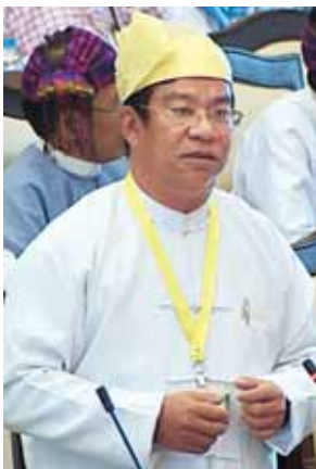
ဒုတိယဝန်ကြီး ဦးသန်းရှင်။

ပထမအကြိမ် အမျိုးသားလွှတ်တော် (၁၂)ကြိမ်မြောက် ပုံမှန်အစည်းအဝေး (၆၅) ရက်မြောက်နေ့ကို ယနေ့နံနက် (၁၀) နာရီတွင် ဆက်လက်ကျင်းပရာ မွန်ပြည်နယ် မဲဆန္ဒနယ်အမှတ် (၅) မှ လွှတ်တော်ကိုယ်စားလှယ် ဦးနိုင်ထွန်းအံ့၏ “နေ့စားလျှစ်စစ်ဝန်ထမ်းများအား အမြဲတမ်းဝန်ထမ်းအဖြစ် ခန့်ထားပေးရန် အစီအစဉ် ရှိ မရှိ” မေးခွန်းနှင့်စပ်လျဉ်း၍ လျှစ်စစ် စွမ်းအားဝန်ကြီးဌာန ဒုတိယဝန်ကြီး ဦးမော်သာထွေးက နေ့စားဝန်ထမ်းမှ အမြဲတမ်းဝန်ထမ်းအဖြစ်သို့ ခန့်ထားရေးကို တိုင်းဒေသကြီး/ပြည်နယ် လျှစ်စစ်အင်ဂျင်နီယာရုံးများ အလိုက် မြို့နယ်/ မြို့/ မြို့နယ်ခွဲ လျှစ်စစ် အင်ဂျင်နီယာရုံးများတွင် ဝင်ပေါက် ရာထူး စာရင်းကိုင်(၄)နှင့် ဒုလက်