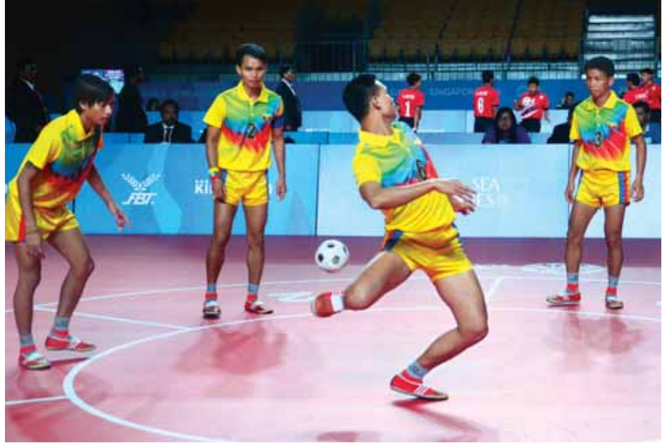
ရွှေဆုတံဆိပ်များ ဆွတ်ခူးခဲ့သည့် မြန်မာခြင်းလုံးအသင်းယှဉ်ပြိုင်ဘက်။

(၂၈)ကြိမ်မြောက်ဆီးဂိမ်းပြိုင်ပွဲကို စင်ကာပူနိုင်ငံတွင် အောင်မြင်စွာ ကျင်းပပြီးစီးခဲ့ပြီဖြစ်သည်။ မြန်မာအားကစား အဖွဲ့များမှာ မျှော်မှန်းထားသည့် ရွှေဆုအရေအတွက် မရရှိခဲ့သော်လည်း အားကစားအဖွဲ့အများစုမှာ ရွှေ၊ ငွေ၊ ကြေး ဆုတံဆိပ်များ ဆွတ်ခူးကာ နိုင်ငံ့ဂုဏ်ဆောင်နိုင်ခဲ့သည်။