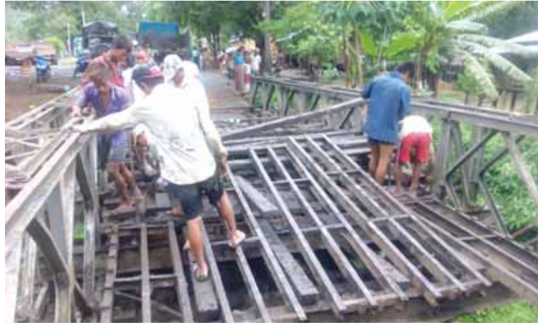
ကလေးဝ ဇွန် ၂၀

စစ်ကိုင်းတိုင်းဒေသကြီး ကလေးဝမြို့နယ် တွင် ဇွန်လ ၂၅ ရက်က ကလေးဝ-ကျိကုန်း ကားလမ်းပေါ်ရှိ မိုင်တိုင်အမှတ် ၃ မိုင် ၄ ဖာလုံ တံတားအမှတ် (၂/၄) ၏ တံတားအောက်ခံ ရက်မတစ်ချောင်း ကျိုးနေသဖြင့် အစားထိုး လဲလှယ်ခြင်းလုပ်ငန်းကို ညနေ ၄ နာရီ ခန့်က စတင်ပြုလုပ်ခဲ့ရာ ၁ နာရီကျော် အချိန်ကြာ