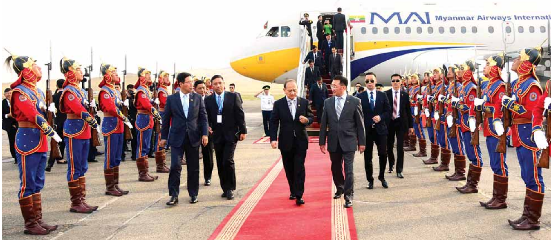
အူလန်ဘာတာ ဇွန် ၂၈

ပြည်ထောင်စုသမ္မတ မြန်မာနိုင်ငံတော် နိုင်ငံတော်သမ္မတ ဦးသိန်းစိန်သည် မွန်ဂိုလီးယားနိုင်ငံ သမ္မတ အယ်လ်ဘတ်ဒီဗျော့ ဇော်ဒ်လီယာဒ်၏ ဖိတ်ကြားချက်အရ မွန်ဂိုလီးယားနိုင်ငံသို့ တရားဝင်ချစ်ကြည်ရေးခရီးသွားရောက်ရန် အဖွဲ့ဝင်များနှင့်အတူ ယနေ့ မွန်းတည့် ၁၂ နာရီတွင် နေပြည်တော်မှ အပြည်ပြည်ဆိုင်ရာ မြန်မာလေကြောင်းအထူးလေယာဉ်ဖြင့် ထွက်ခွာရာ ဒုတိယသမ္မတ ဒေါက်တာစိုင်းမောက်ခမ်းနှင့် ဦးညွှန်ထွန်း၊ တပ်မတော်ကာကွယ်ရေးဦးစီးချုပ် ဗိုလ်ချုပ်မှူးကြီးမင်းအောင်လှိုင်၊ ပြည်ထောင်စုဝန်ကြီးများနှင့် တာဝန်ရှိသူများက နေပြည်တော်လေဆိပ်၌ ပို့ဆောင်နှုတ်ဆက်ကြသည်။