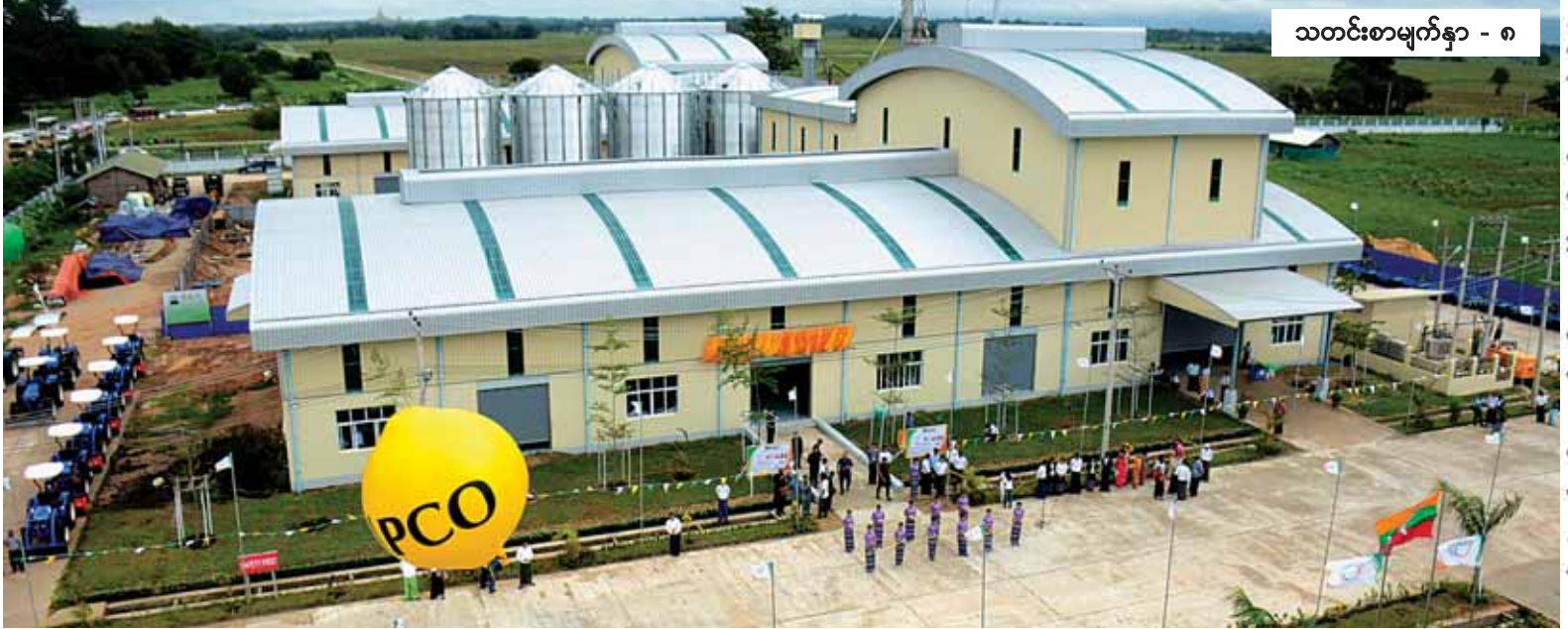
သတင်းစာမျက်နှာ - ၈