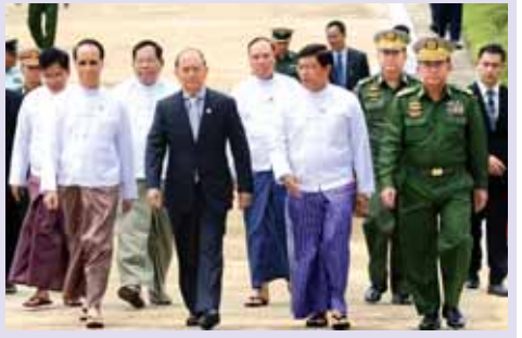
သတင်း စာမျက်နှာ >> ၃