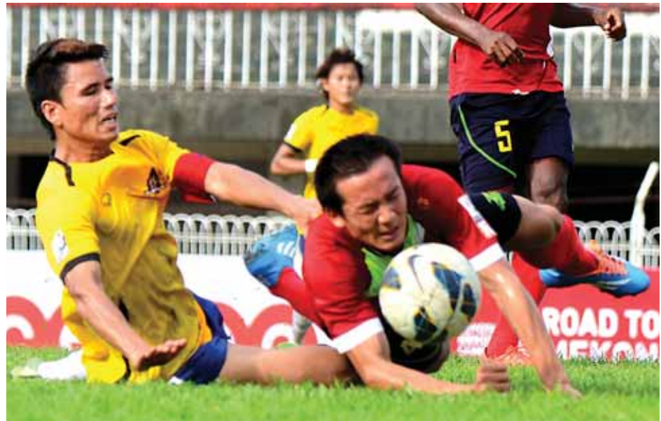
မကွေးနှင့် ချင်းယူနိုက်တက်တို့ ယှဉ်ပြိုင်နေစဉ်။

Public Access to Information ကို ပိုမိုကျယ်ပြန့်စွာရရှိနိုင်စေရန်အတွက် Mobile Radio သတင်းထုတ်လွှင့်မှုကို တိုင်းရင်းသားဘာသာစကားများဖြင့်ပါ တိုးချဲ့ဆောင်ရွက်သွားမည်ဖြစ်သည်။ တိုင်းရင်းသားဘာသာ Mobile Radio သတင်းအစီအစဉ်များအဖြစ် ကချင်ဘာသာ၊ ကယားဘာသာ၊ စကောကရင်ဘာသာ၊ အနောက်ပိုးကရင်ဘာသာ၊ အရှေ့ပိုးကရင်ဘာသာ၊ ချင်း(လိုင်ဇိုး)ဘာသာ၊ ချင်း(ချိုး)ဘာသာ၊ မွန်ဘာသာ၊ ရခိုင်ဘာသာ၊ ရှမ်းဘာသာ၊ ဝ"ဘာသာ စသည့် တိုင်းရင်းသားဘာသာ ၁၁ မျိုးဖြင့် စာမျက်နှာ ၉ ကော်လံ ၄ သို့