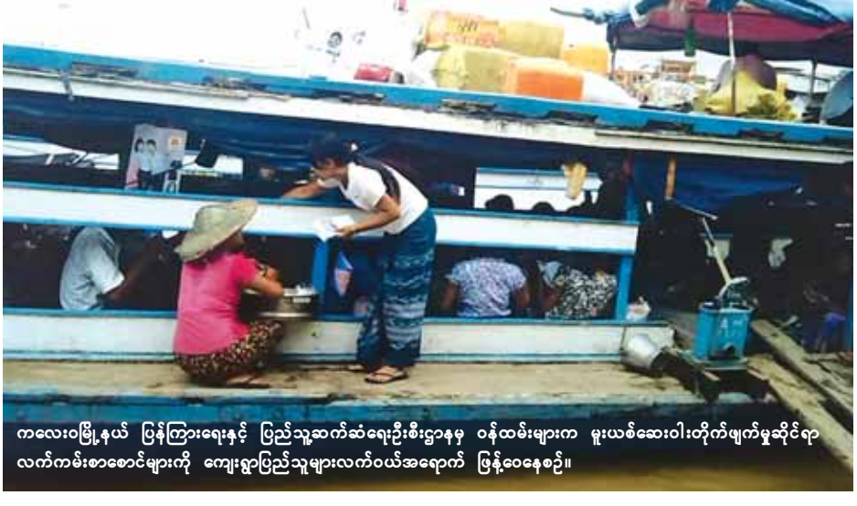
ကလေးဝမြို့နယ် ပြန်ကြားရေးနှင့် ပြည်သူ့ဆက်ဆံရေးဦးစီးဌာနမှ ဝန်ထမ်းများက မူးယစ်ဆေးဝါးတိုက်ဖျက်မှုဆိုင်ရာ လက်ကမ်းစာစောင်များကို ကျေးရွာပြည်သူများလက်ဝယ်အရောက် ပြန့်ဝေနေစဉ်။