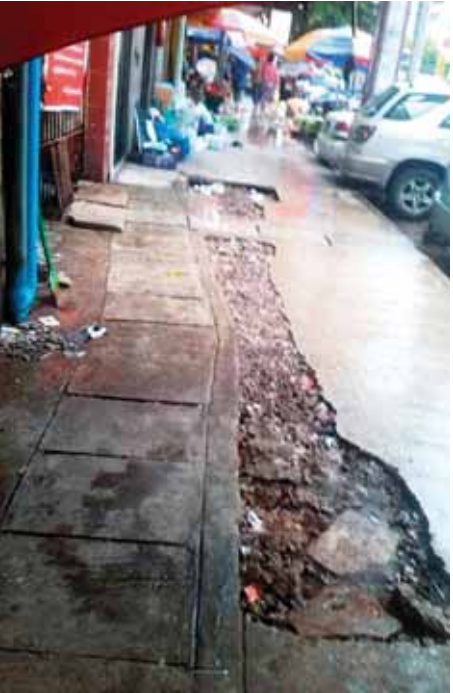
လမ်းမတော်လမ်းနှင့် (၁၆)လမ်းကြား မဟာဗန္ဓုလလမ်းဘေး ပလက်ဖောင်းပျက်စီးနေပုံ။

ထိခိုက်မှုများ၍ အလုပ်မှ နှစ်ပတ်တိတ် နားခဲ့ရသည်ဟု ယင်းဆေးခန်းတွင် လုပ်ကိုင်နေသော ဆရာဝန်တစ်ဦးက ပြောသည်။ ဇွန်လဆန်းပိုင်းတွင် အဆိုပါဖြစ်စဉ်ဖြစ်ပွားပြီး ဇွန်လနောက်ဆုံးပတ်တွင် လမ်းမတော်မြို့နယ်အတွင်းရှိ အနော်ရထာလမ်းမဘေး လူသွားပလက်ဖောင်းဖြတ်ရေမြောင်းဖုံးမခင်းထားသော ကားလမ်းမဘက် အစွန်နေရာတွင် ည ၇ နာရီခွဲအချိန် လမ်းသွားလမ်းလာတစ်ဦး