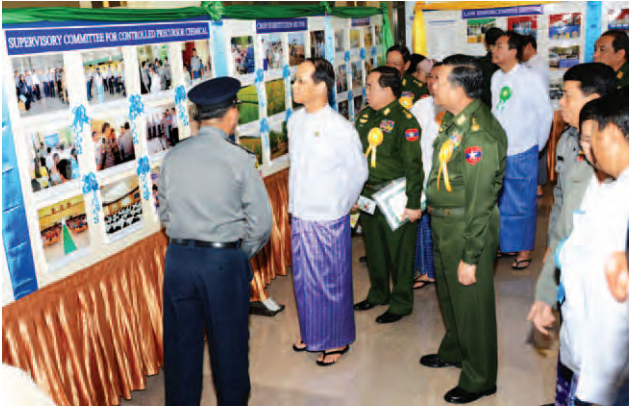
ဖြစ်ပါကြောင်း။

မူးယစ်ဆေးဝါးသုံးစွဲမှုကို စနစ်တကျကုသနိုင်ရေးအတွက် ဆေးကုသရေး လုပ်ငန်းများအနေဖြင့် ကျန်းမာရေးဝန်ကြီးဌာနက မူးယစ်ဆေးဝါးကုသရေး ဌာနကြီး ၂၆ ခုနှင့် ဌာနငယ် ၄၇ ခုတို့ကို ဖွင့်လှစ်ဆောင်ရွက်လျက်ရှိပါ ကြောင်း၊ မက်သာဒုန်းအစားထိုးတိုက်ကျွေးမှု အစီအစဉ်အရ မက်သာဒုန်း တိုက်ကျွေးသည့် ဌာန ၄၁ ခုကို မူးယစ်ဆေးဝါးသုံးစွဲမှုများသည် မြို့နယ်များတွင် ဖွင့်လှစ်ဆောင်ရွက်ထားရှိပြီးဖြစ်ပါကြောင်း၊ စခန်းအခြေပြု ပြန်လည်ထူထောင် ရေးလုပ်ငန်းများအတွက် လှူဝန်ထမ်း၊ ကယ်ဆယ်ရေးနှင့် ပြန်လည်နေရာချထား ရေးဝန်ကြီးဌာနက ပြန်လည်ထူထောင်ရေးစခန်း ၁၂ ခုကို ဖွင့်လှစ်ထားရှိပြီး