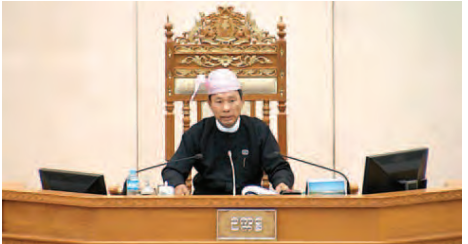
ပြည်သူ့လွှတ်တော်ဥက္ကဋ္ဌ သူရဦးရွှေမန်း (၁၂)ကြိမ်မြောက်ပုံမှန်အစည်းအဝေး ၆၉ ရက်မြောက်နေ့သို့ တက်ရောက်စဉ်။ (သတင်းစဉ်)

ထို့အတူ ပြည်သူ့လွှတ်တော် ပြည်သူ့ရေးရာစီမံခန့်ခွဲမှုကော်မတီက တင်သွင်းသည့် ပြည်ထောင်စုရွှေ့နေချုပ်ဥပဒေကို ပြင်ဆင်သည့်ဥပဒေကြမ်း၊ ပြည်ထောင်စုစာရင်းစစ်ချုပ်ဥပဒေကို တတိယအကြိမ် ပြင်ဆင်သည့်ဥပဒေကြမ်း၊ ပြည်ထောင်စုရာထူးဝန်အဖွဲ့ဥပဒေကို ပြင်ဆင်သည့်ဥပဒေကြမ်း၊ နေပြည်တော်ကောင်စီဥပဒေကို ပြင်ဆင်သည့်ဥပဒေကြမ်း၊ ပြည်ထောင်စုတရားစီရင်ရေးဥပဒေကို တတိယအကြိမ် ပြင်ဆင်သည့်ဥပဒေကြမ်းနှင့် နိုင်ငံတော်ဖွဲ့စည်းပုံအခြေခံဥပဒေဆိုင်ရာ ခုံရုံးဥပဒေကို တတိယအကြိမ် ပြင်ဆင်သည့်ဥပဒေကြမ်းတို့နှင့်စပ်လျဉ်း၍ ပြင်ဆင်ချက်ရှိသော အပိုဒ်၊ အပိုဒ်ခွဲများကို ပြင်ဆင်ချက် တင်သွင်းထားသည့် ပြည်သူ့လွှတ်တော်ဥပဒေကြမ်းကော်မတီနှင့် လွှတ်တော်ကိုယ်စားလှယ်များက ဆွေးနွေးကြပြီး လွှတ်တော်၏ အဆုံးအဖြတ်ရယူ၍ တစ်ပိုဒ်ချင်းစီ အလိုက် အတည်ပြုခဲ့ကြသည်။ (သတင်းစဉ်)