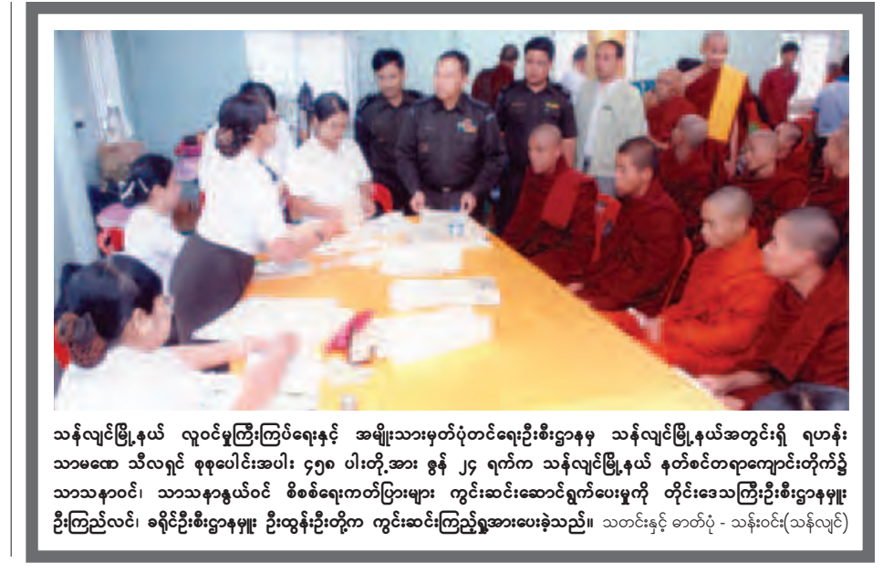
သန်လျင်မြို့နယ် လူဝင်မှုကြီးကြပ်ရေးနှင့် အမျိုးသားမှတ်ပုံတင်ရေးဦးစီးဌာနမှ သန်လျင်မြို့နယ်အတွင်းရှိ ရဟန်း သာမဏေ သီလရှင် စုစုပေါင်းအပါး ၄၅၈ ပါးတို့အား ဇွန် ၂၄ ရက်က သန်လျင်မြို့နယ် နတ်စင်တရကျောင်းတိုက်၌ သာသနာဝင်၊ သာသနာ့အဖွဲ့ဝင် စီစစ်ရေးကတ်ပြားများ ကွင်းဆင်းဆောင်ရွက်ပေးမှုကို တိုင်းဒေသကြီးဦးစီးဌာနမှူး ဦးကြည်လင်၊ ခရိုင်ဦးစီးဌာနမှူး ဦးထွန်းဦးတို့က ကွင်းဆင်းကြည့်ရှုအားပေးခဲ့သည်။

သာစည် ဇွန် ၂၆ မိတ္ထီလာခရိုင် သာစည်မြို့နယ် တွင် ရုံးဌာနပေါင်းစုံမှ အငြိမ်းစား ယူသွားခဲ့ကြသည့် ဝန်ထမ်းများက စုပေါင်းပြီး ဝန်ထမ်းပေါင်းစုံ အငြိမ်း စားများအသင်းကို လာမည့်ဇူလိုင် လအတွင်းတွင် ဖွဲ့စည်းသွားမည်ဖြစ် ကြောင်း အငြိမ်းစားကျောင်းအုပ် ကြီးတစ်ဦးထံမှ သိရသည်။ အဆိုပါ ဝန်ထမ်းပေါင်းစုံ အငြိမ်း စားများအသင်းကို ဖွဲ့စည်းခြင်းမှာ အငြိမ်းစားယူသွားခဲ့ကြသည့် ဝန် ထမ်းများ၊ အလုပ်တာဝန်မရှိတော့ သည့် အချိန်တွင် စိတ်အားမငယ်