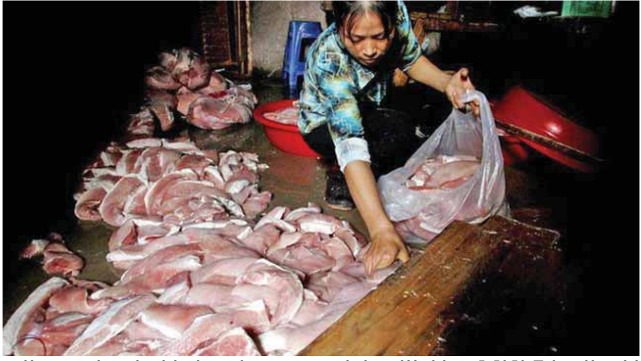
မှောင်ခိုအသားများသည် ကုန်ကျစရိတ်သက်သာစေရန် အသားများ လက်ဝယ်မရောက်ရှိမီ ပုပ်သိုးဆွေးမြေ့ခြင်းဖြစ်ကြောင်း မှောင်ခိုကူးမှုတိုက်သတ်ရေးအဖွဲ့က အရေးတော်ပုံအဖွဲ့အစည်းများကို အသုံးမပြုဘဲ သာမန် ဖျက်ရေးတာဝန်ရှိသူတစ်ဦးက အဆိုပါသတင်းစာသို့ ပြောကြားသည်။

အကောက်ခွန် တာဝန်ရှိသူများက ဖမ်းဆီးရမိခဲ့သော အသားအချို့မှာ နှစ်ပေါင်း ၄၀ သက်တမ်းရှိပြီး အနံ့ဆိုးများထွက်ကာ ပုပ်သိုးဆွေးမြေ့နေကြောင်း အဆိုပါသတင်းစာသို့ ပြောကြားသည်။ ယင်းဖမ်းဆီးရမိခဲ့သော အသားများကို ထပ်တလဲလဲအရည်ဖျော်ပြီး တာရှည်ခံအောင် ရေခဲရိုက်ထားသည်ကို တွေ့ရသည်။ ယင်းတို့ကို ဖျက်ဆီးပစ်ခြင်း ရှိ၊ မရှိ ရှင်းရှင်းလင်းလင်း မသိရသေးပေ။ တရုတ်နိုင်ငံ၏ အသားတင်သွင်းမှုအဟန့်အတားများကို ရှောင်လွှဲနိုင်ရန်အတွက် ဘရာဇီးနှင့် အိန္ဒိယနိုင်ငံများမှ တန်ချိန်ထောင်ပေါင်းများစွာသော အမဲသားများကို အိမ်နီးချင်းနိုင်ငံများဖြစ်သော ဟောင်ကောင်နှင့် ဗီယက်နမ်နိုင်ငံများမှတစ်ဆင့် တရုတ်နိုင်ငံသို့ မှောင်ခိုကူးခြင်းဖြစ်ကြောင်း သိရသည်။