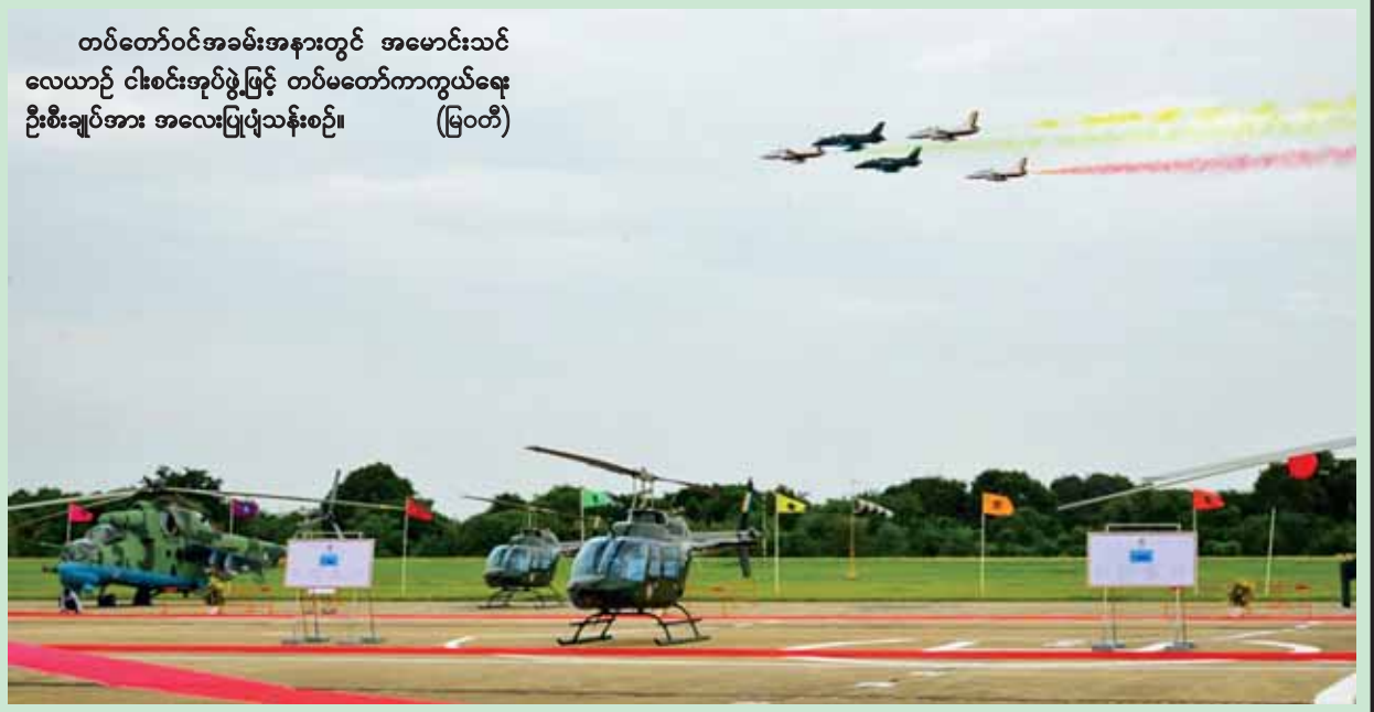
တပ်တော်ဝင်အခမ်းအနားတွင် အမောင်းသင် လေယာဉ် ငါးစင်းအုပ်ဖွဲ့ဖြင့် တပ်မတော်ကာကွယ်ရေး ဦးစီးချုပ်အား အလေးပြုပွဲသန်းစဉ်။