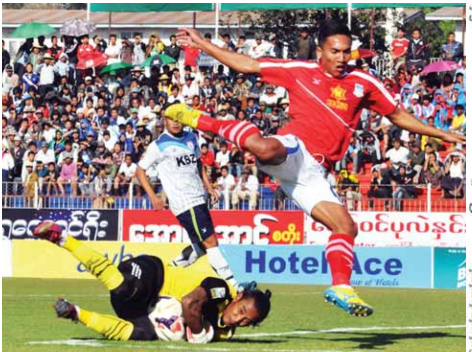
ကမ္ဘောဇနှင့် ရတနာပုံအသင်းတို့ ၂၀၁၄ ရာသီက တွေ့ဆုံခဲ့စဉ်။

မြန်မာနိုင်ငံဘောလုံးအဖွဲ့ချုပ်က ကြီးမားကျင်းပလျက်ရှိသည့် ၂၀၁၅ ရာသီ MNL အမှတ်ပေးပြိုင်ပွဲ ပွဲစဉ်(၁၀)ကို ယခုတစ်ပတ်တွင် ပြန်လည်ကျင်းပမည်ဖြစ်ပြီး အမှတ်ပေးဇယားထိပ်ဆုံးမှ ရန်ကုန်နှင့် ဒုတိယနေရာမှ ဧရာဝတီ၊ အဆင့်(၃)မှ လက်ရှိချန်ပီယံ ရတနာပုံနှင့် အဆင့်(၅)မှ ကမ္ဘောဇအသင်းတို့ ထိပ်တိုက်တွေ့ဆုံမည်ဖြစ်သည်။ ပွဲစဉ် (၁၀)အဖြစ် ဇွန် ၂၇ ရက်တွင် YUSC ကွင်း၌ ရန်ကုန်အသင်းနှင့် ဧရာဝတီအသင်း၊ အောင်ဆန်းကွင်း၌ မနောမြေအသင်းနှင့် နေပြည်တော်အသင်း၊ သုဝဏ္ဏကွင်း၌ ရခိုင်အသင်းနှင့် ဇေယျာရွှေမြေအသင်း၊ ဇွန် ၂၈ ရက်တွင် တောင်ကြီးကွင်း၌ ကမ္ဘောဇအသင်းနှင့် လက်ရှိချန်ပီယံရတနာပုံအသင်း၊ သုဝဏ္ဏကွင်း၌ ဟံသာဝတီအသင်းနှင့် ဇွဲကပင်အသင်း၊ အောင်ဆန်းကွင်း၌ မကွေးအသင်းနှင့် ချင်းယူနိုက်တက်အသင်းတို့ ယှဉ်ပြိုင်ကစားကြမည်ဖြစ်သည်။ ဇွန် ၂၂ ရက်က ကစားခဲ့သည့် ရတနာပုံနှင့် ဇေယျာရွှေမြေ၊ ချင်းယူနိုက်တက်နှင့် ဧရာဝတီပွဲစဉ်များမှာ အာရှချန်ပီယံလိဂ်ပြိုင်ပွဲနှင့် AFC Cup ပြိုင်ပွဲတို့ကြောင့် ရွှေ့ဆိုင်းထားရသည့် ပွဲစဉ်များကို ပြန်ကစားခဲ့ခြင်းဖြစ်သည်။ စာမျက်နှာ ၁၀ ကော်လံ ၄ သို့