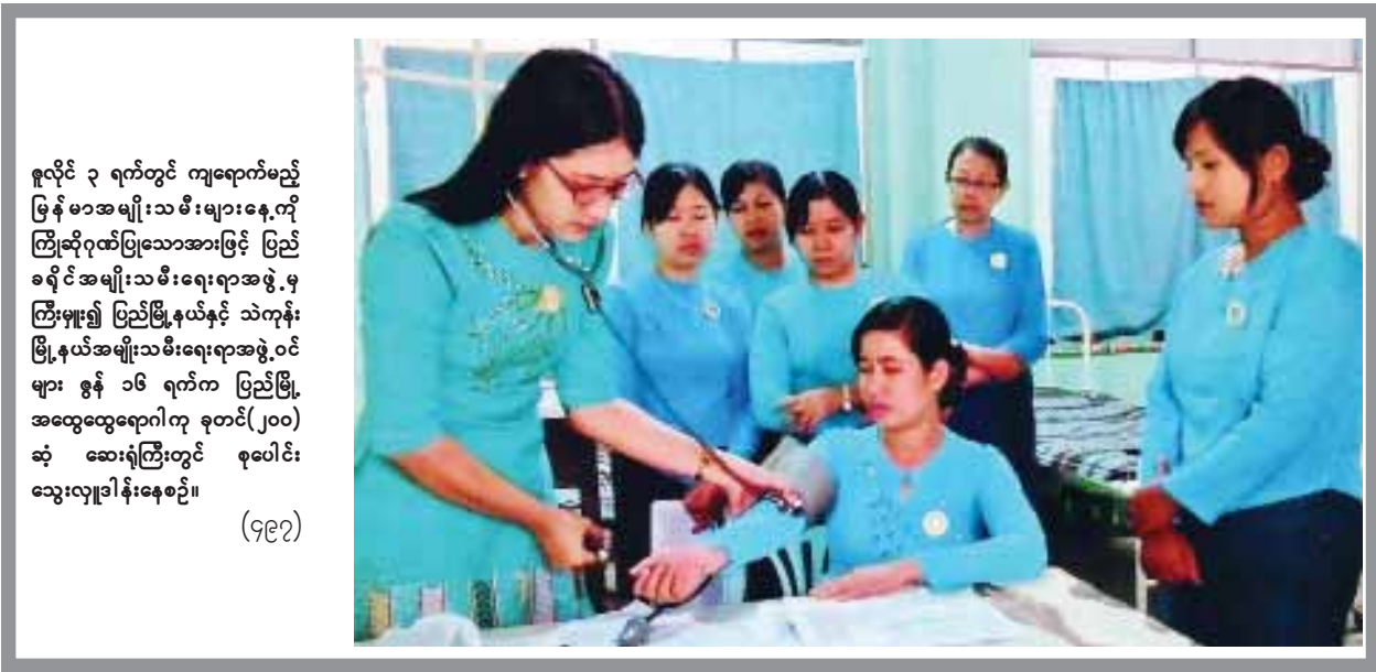
ရုလိုင် ၃ ရက်တွင် ကျောက်မည် မြန်မာအမျိုးသမီးများနေ့ကို ကြိုဆိုရန်ပြုသောအားဖြင့် ပြည် ဓရိုင်အမျိုးသမီးရေးရာအဖွဲ့မှ ကြီးပွား၍ ပြည်မြို့နယ်နှင့် သဲကုန်း မြို့နယ်အမျိုးသမီးရေးရာအဖွဲ့ဝင် များ ဇွန် ၁၆ ရက်က ပြည်မြို့ အထွေထွေရောဂါကု ခုတင်(၂၀၀) ဆုံ ဆေးရုံကြီးတွင် စုပေါင်း သွေးလှူဒါန်းနေစဉ်။ (၄၉၇)