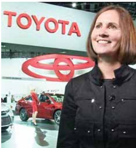
စေရန်အတွက် ဝယ်ယူခဲ့ခြင်းဖြစ်ကြောင်း ရဲတပ်ဖွဲ့ကို ပြောကြားခဲ့သည်ဟု ကျီဒိုသတင်းဌာနက ဖော်ပြခဲ့သည်။

ယင်းဆေးများကို ပါဆယ်ဖြင့် ၎င်းကိုယ်တိုင် စာတိုက်မှ ပေးပို့ခဲ့ခြင်းဖြစ်သည်ဟု ရဲတပ်ဖွဲ့က ပြောသည်။ ၎င်းက သူ၏ ခွဲခေါင်းနာကျင်ကိုကဲ့သို့ သက်သာ