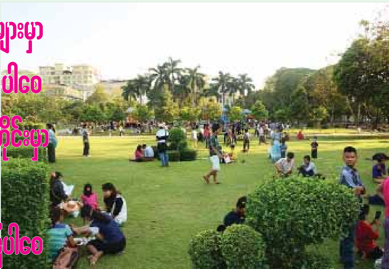
ရန်ကုန်မြို့လယ် မဟာပန္နလပန်းခြံ၌ စနေ၊ တနင်္ဂနွေနေ့ ရုံးပိတ်ရက်များတွင် ပြည်သူများ ကြိုဆို အပန်းဖြေအနားယူကြသည်။

ပန်းဥယျာဉ်များမှာ ပန်းတိုင်းပွင့်ပါစေ ကစားကွင်းတိုင်းမှာ ကလေးတွေ ငြင်းခုံနိုင်ကြပါစေ