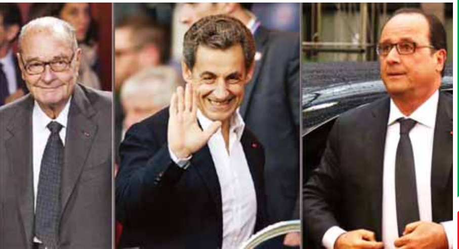
ပြင်သစ်နိုင်ငံ၏ နောက်ဆုံးအာဏာရရှိခဲ့သော သမ္မတများ။

သမ္မတ သုံးဆက်စလုံးတွင် အမေရိကန်အမျိုးသားလုံခြုံရေးအေဂျင်စီက သူလျှိုပြုလုပ်ခဲ့သည်ဟု ဝီကီလီဒီအုပ်စုက ဖွင့်ဟကြေညာခဲ့သည်။ ယင်းသည် စီးပွားရေးအရ