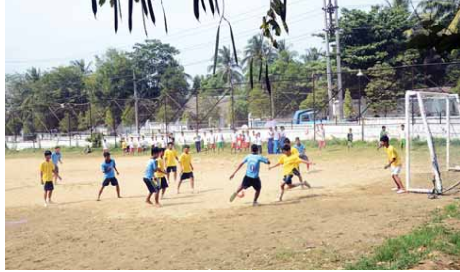
ရန်ကုန်မြို့ရှိ အားကစားကွင်းတစ်ကွင်းတွင် လူငယ်များ ပျော်ရွှင်စွာ ဘောလုံးကစားနေကြစဉ်။

မည်သို့ပင်ဆိုစေ သမိုင်းအတွင်း ပြန်လည်တိုးဝင် သွားခဲ့သည့် ခေတ်ကာလတစ်ခုက အကောင်းအဆိုး အကြောင်းအကျိုးတို့ကို ပစ္စုပ္ပန်တွင် သမိုင်းသင်ခန်းစာ တစ်ရပ်အဖြစ် ပြန်လည်ထုတ်ဖော်ရယူပြီး အနာဂတ် အတွက် ကြိုတင်ပြင်ဆင်လျှောက်လှမ်းခြင်းသည်သာ လက်တွေ့ကျသော ယောနိသော မနသိကာရစိတ်ဖြစ်ပေ လိမ့်မည်။