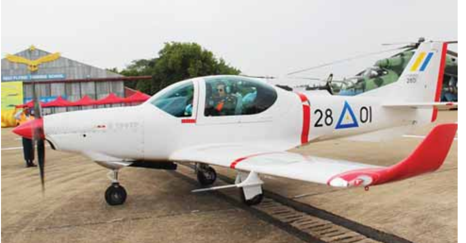
တပ်မတော်ကာကွယ်ရေးဦးစီးချုပ် ဗိုလ်ချုပ်မှူးကြီး မင်းအောင်လှိုင် တပ်တော်ဝင်ခဲ့သည့် Grob-120 TP လေယာဉ်ပျံသန်းရာတွင် လိုက်ပါစီးနင်းချီးမြှင့်စဉ်။

တပ်မတော်(လေ)အနေဖြင့် ၁၉၉၀ပြည့်နှစ်ဝန်းကျင် မှစ၍ ဂျက်တိုက်လေယာဉ်များ ဖြည့်တင်းနိုင်သည့်အတွက် ပတ်ဝန်းကျင်နိုင်ငံများနှင့် နည်းပညာနှင့် လေကြောင်းစွမ်း အားကွာဟမှုလျော့နည်းသွားပြီး ဒေသတွင်းနိုင်ငံများနှင့် တန်းတူ လိုက်နိုင်ခဲ့ကြောင်း၊ လေယာဉ်များကိုပြည်တွင်း၌ တပ်ဆင်ထုတ်လုပ်ခြင်းနှင့်အတူ လေကြောင်းစွမ်းအား တိုးတက်မြှင့်မားရေးအတွက် ခေတ်မီလေယာဉ်၊ ရဟတ် ယာဉ်များဝယ်ယူဖြည့်တင်းမှုကို လေးနှစ်အတွင်း တပ်တော် ဝင်ခြင်း(၄)ကြိမ်ပြုလုပ်ခဲ့ပြီး လေယာဉ်အမျိုးအစား လေးမျိုး ၂၉ စင်း၊ရဟတ်ယာဉ် အမျိုးအစားသုံးမျိုး ခုနစ်စင်း၊ စုစုပေါင်း ၃၆ စင်းတပ်တော်ဝင်ခဲ့ပြီးဖြစ်ကြောင်း၊ ယခုကဲ့သို့ လေယာဉ် ရဟတ်ယာဉ်များ တပ်တော်ဝင်နိုင်ခဲ့သည့်အတွက် တပ်မ တော်(လေ)၏ လေကြောင်းစွမ်းအား မြှင့်တင်ပေးနိုင်ခြင်း နှင့်အတူ နိုင်ငံတော်ကာကွယ်ရေးစွမ်းအား ပိုမိုတောင့်တင်း လာမည်ဖြစ်ကြောင်း၊ယနေ့အခါတွင် နိုင်ငံတော်သည် ဒီမိုကရေစီလမ်းကြောင်းပေါ်တွင် လျှောက်လှမ်းနေပြီး ဒီမိုကရေစီအသွင်ကူးပြောင်းရေးနှင့်အတူ စိန်ခေါ်မှု အသစ်များလည်း ကြုံတွေ့နေရသည့်အတွက် နိုင်ငံတော်၏ အချုပ်အခြာအာဏာထိပါးမခံရစေရေးအတွက် တပ်မ တော်သည် အသက်၊ သွေး၊ ချွေး များစွာ စွန့်လွှတ်ပြီး ဆောင်ရွက်နေပါကြောင်း၊ ဒီမိုကရေစီပန်းတိုင်သို့ မယိမ်း မလှိုင် လျှောက်လှမ်းနိုင်ရန်မှာ မိမိတို့လုပ်ဆောင်ရမည့် တာဝန်ဖြစ်ပြီး ထိုသို့ဆောင်ရွက်ပေးနိုင်ရန် တပ်မတော်