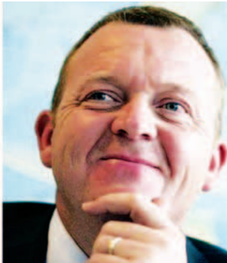
ဝန်ကြီးချုပ်ဟောင်း လား(စ်)လော့ကီးရတ်စ်မူဆင်။