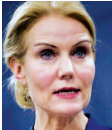
ဝန်ကြီးချုပ် ဟလ်လီတော်နင်းရှမစ်။