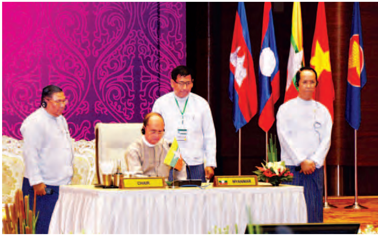
နေပြည်တော် ဇွန် ၁၉

ပြည်ထောင်စုသမ္မတမြန်မာနိုင်ငံတော် နိုင်ငံတော်သမ္မတ ဦးသိန်းစိန်သည် ယနေ့ညနေပိုင်းတွင် နေပြည်တော်ရှိ မြန်မာအပြည်ပြည်ဆိုင်ရာကွန်ဗင်းရှင်း ဗဟိုဌာန(၁)၌ ကျင်းပမည့် (၇)ကြိမ်မြောက် ကမ္ဘောဒီးယား-လာအို-မြန်မာ-ဗီယက်နမ်(စီအယ်လ်အမ်ပီ) ထိပ်သီးအစည်းအဝေး၊ ကမ္ဘောဒီးယား-လာအို-မြန်မာ-ဗီယက်နမ်-ထိုင်းနိုင်ငံတို့ပါဝင်သည့် (၆)ကြိမ်မြောက် ဧရာဝတီ-ကျောက်ဖယား-မဲခေါင် စီးပွားရေးပေါင်းဆောင်ရွက်မှုမဟာဗျူဟာ(အက်မက်စ်) ထိပ်သီးအစည်းအဝေးများနှင့် ဆက်စပ်အစည်းအဝေးများ ကျင်းပနိုင်ရေးအတွက် ဝတ်စုံပြည့်အစမ်းလေ့ကျင့်နေမှုနှင့် ပြင်ဆင်ထားရှိမှုများကို ကြည့်ရှုစစ်ဆေးသည်။