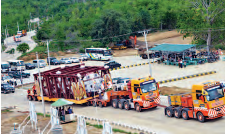
အား ယာယီသိတင်းသုံးနေသည့် များက ဝတ်ရွတ်စဉ်များဖြင့် ရွတ်ဖတ် အစီအစဉ်အလုပ်ရုံအတွင်းမှ ကိန်းဝပ် ပူဇော်ကြရာ လမ်းဘေး ဝဲ၊ ယာ၌ ဒေသခံ ပြည်သူများကလည်း တောင်သို့ မော်တော်ယာဉ်များဖြင့် လာရောက်ဖူးမြော်ကြည့်ညိကြသည်။ အဆိုပါ ရုပ်ရှင်တော်မြတ်ကြီးအား ဆင်နှစ်ကောင်မိသားစုကုမ္ပဏီပိုင် ဆင်နှစ်ကောင် ၂၂ လုံးနှင့် အလျားပေ ၉၀၊ ဘီးလုံး ၁၂၂ လုံးနှင့် အလိုက်သင့်ကွေ့နိုင်သော စတီယာရင်စနစ်ပါဝင်သည့် Heavy Modular Trailer ယာဉ်ကြီးဖြင့် သယ်ယူပင့်ဆောင်ခဲ့ရာ ယခုအခါ အောင်မောင့်တောင်ခြေသို့ ရောက်ရှိ ပြီဖြစ်သည်။ ရုပ်ရှင်တော်မြတ်ကြီးအား ကိန်းဝပ် စံပယ်တော်မူမည့် တောင်တော်ညွန့်သို့ မင်္ဂလာကိန်းယာဉ်များဖြင့် ဆက်လက် ပင့်ဆောင် ပူဇော်သွားမည်ဖြစ်ပြီး အနေကဇာတင် မင်္ဂလာအခမ်း အနားနှင့် ရေစက်ချမင်္ဂလာအခမ်း အနားကို အဆိုပါတောင်ညွန့်ထက်၌ ဆင်ယင်ကျင်းပသွားမည်ဖြစ်ကြောင်း သိရသည်။ (တင်ထွန်းအောင်)

နေပြည်တော် ကောင်စီနယ်မြေ ဥက္ကဋ္ဌရံသီရိမြို့နယ် အောင်မောင့်တောင်ညွန့်ထက်၌ တည်ထား ကိုးကွယ်မည့် မဟာသကျရံသီရပ်ရှင်တော်မြတ်ကြီးအား အောင်မောင့်တောင်တော်ညွန့်သို့ ပင့်ဆောင်ခြင်း မင်္ဂလာအခမ်းအနားကို ယနေ့နံနက် ၆ နာရီတွင် သာသနာတော်ဆိုင်ရာ ထုံးတမ်း အစဉ်အလာများနှင့်အညီ ကျင်းပသည်။