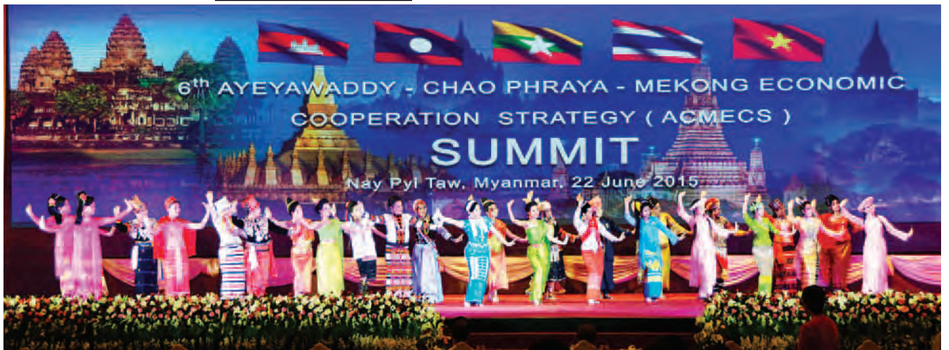
စီအယ်လ်အမ်ပီ၊ အက်မက်စ် ထိပ်သီးအစည်းအဝေးများအတွက် ယဉ်ကျေးမှုဝန်ကြီးဌာနမှ အနုပညာရှင်များ ဝတ်စုံပြည့်လေ့ကျင့်နေမှုကို တွေ့ရစဉ်။

နိုင်ငံတော်သမ္မတ ဦးသိန်းစိန် စီအယ်လ်အမ်ပီ၊ အက်မက်စ်ထိပ်သီးအစည်းအဝေးများနှင့် ဆက်စပ်အစည်းအဝေးများ ကျင်းပနိုင်ရေးအတွက် ပြင်ဆင်ထားရှိမှုများကို ကြည့်ရှုစစ်ဆေးစဉ်။ (သတင်းစဉ်)