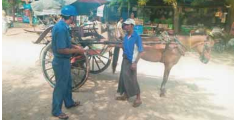
မြင်းမရှိသလောက်နီးပါးဖြစ်ခဲ့သော မကွေးမြို့၌ မြို့ပေါ်ဈေးများအနီးတွင် အနွေးယာဉ်သမားများ၏ဘဝကို စာနာနားလည်သူ ဈေးဝယ်များ ရှိနေဆဲဖြစ်သည်။ ယင်းတို့၏ဘဝကို ကူညီဖြေရှင်းပေးသည့် အနေဖြင့် ကုန်ပစ္စည်းများသယ်ယူပို့ဆောင်ရေးအတွက် အလျင်မလိုသောအခါများ၌ ဆိုက်ကား၊ မြင်းလည်းများကို အသုံးပြုနေကြဆဲဖြစ်ကြောင်း အနွေးယာဉ်မောင်းနှင်စဉ်က ပြောသည်။ ဇေယျာ(မကွေး)

၂၀၁၅-၂၀၁၆ ခုနှစ်တွင် အနွေးယာဉ်လုပ်ငန်းလိုင်စင် လျှောက်ထားမှုမှာ ဆိုက်ကား ၁၀၆ စီး၊ မြင်းလည်းခန့်စီခန့်ထိ လျော့ကျလာခဲ့ကြောင်း မြို့နယ်စည်ပင်သာယာရေး တာဝန်ရှိသူတစ်ဦး၏ပြောကြားချက်အရ သိရသည်။ အလှူအတန်းနှင့် လူမှုရေးရာကိစ္စရပ်များ၊ သယ်ယူပို့ဆောင်သွားလာမှုများတွင် စက်တပ်ယာဉ်များ အသုံးပြုလာကြပြီဖြစ်သဖြင့် မြင်းလည်းနှင့်ဆိုက်ကားယာဉ်များအား အသုံးပြု