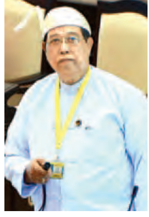
ဒုတိယဝန်ကြီး ဦးစိုးတင်။

စိုက်ပျိုးရေးနှင့် ဆည်မြောင်းဝန်ကြီးဌာန ဒုတိယဝန်ကြီး ဦးခင်ဇော်က အုတ်တွင်းမြို့နယ်ရှိ ခပေါင်းရေလှောင်တံစံ တည်ဆောက်ခြင်း လုပ်ငန်းသည် လယ်ယာမြေဥပဒေနှင့် နည်းဥပဒေများ စတင်ပြဌာန်းခဲ့သည့် ၂၀၀၂ ခုနှစ် ဩဂုတ် ၃၀ ရက်မတိုင်မီ အချိန်ကဆောင်ရွက်ခဲ့ပြီး ထိုစဉ်က တည်ရှိခဲ့သောဥပဒေ၊ လုပ်ထုံး လုပ်နည်း၊ ညွှန်ကြားချက်များနှင့်