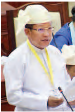
ဒုတိယဝန်ကြီး ဦးတင်ဦးလွင်

ပြည်ထောင်စုရှေ့နေချုပ်ရုံး၏ ဥပဒေအကြံပြုချက်အရ ဥပဒေ (မူကြမ်း)တွင် ဖော်ပြထားသည့် ပြစ်ဒဏ်ပိုင်းဆိုင်ရာပြဌာန်းချက်နှင့် ပတ်သက်၍ ပြန်လည်စဉ်းစားသုံးသပ်ရန် အကြံပြုလာပါသဖြင့် နိုင်ငံခြားရေးဝန်ကြီးဌာနအနေဖြင့် သက်ဆိုင်ရာဝန်ကြီးဌာနများ ပါဝင်သည့်အဖွဲ့ဝင်များဖြင့် ညှိနှိုင်းအစည်းအဝေးများ ခေါ်ယူဆွေးနွေးခဲ့ပါကြောင်း၊ အစည်းအဝေး ရလဒ်အပေါ် မူတည်၍ အဆိုပါ ဥပဒေ၏ ပြစ်ဒဏ်ပိုင်းကို ပြည်ထောင်စုရှေ့နေချုပ်ရုံး၏ အကြံပြုချက်နှင့် အညီ ပြန်လည်သုံးသပ်ပြင်ဆင်ရေးဆွဲလျက်ရှိနေပါ