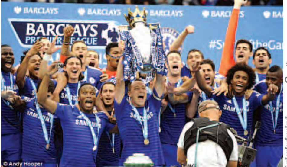
၂၀၁၄-၂၀၁၅ ဘောလုံးရာသီက ပရိမီယာလိဂ်ဖလားရရှိခဲ့သည့် ချယ်လ်ဆီးအသင်း ပရိမီယာလိဂ်ဖလားနှင့် အတူ အောင်ပွဲခံစဉ်။

၂၀၁၅-၂၀၁၆ ဘောလုံးရာသီ ပရိမီယာလိဂ်ပြိုင်ပွဲ၏ ပွဲစဉ်များ ထွက်ပေါ်ခဲ့ပြီဖြစ်သည်။ ယင်းသို့ လာမည့် ဘောလုံးရာသီပရိမီယာလိဂ် ပွဲစဉ်များ ထွက်ပေါ်ခဲ့ရာတွင် ရာသီ၏ အစဖြစ်သည့် ပွဲစဉ်(၁)တွင် လက်ရှိ ပရိမီယာလိဂ်ချန်ပီယံ ချယ်လ်ဆီး အသင်းသည် ဆွမ်ဆီးအသင်းနှင့် စတင်ယှဉ်ပြိုင်ကစားရမည်ဖြစ်သည်။ လာမည့် ဘောလုံးရာသီတွင် ပရိမီယာလိဂ်ဖလားဆွတ်ခူးရန် မျှော် လင့်ထားသည့် အာဆင်နယ်အသင်း မှာ လန်ဒန်မြို့ဘက် ဝက်စ်ဟမ်း အသင်းကို အိမ်မရိတ်ကွင်းကြီးထဲတွင် ဧည့်ခံကစားရမည်ဖြစ်ပြီး မန်စီးစီး အသင်းမှာ ဝက်စ်ဘရစ်အသင်း၏ အိမ်ကွင်းသို့ ဧည့်သည်အဖြစ် စာမျက်နှာ ၉ ကော်လံ ၄ သို့