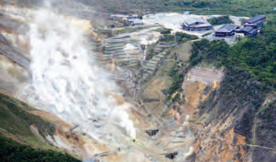
တိုကျိုမြို့ အနောက်တောင်ဘက် အိုဝါကူဒါနီခရိုင် ဟာကိုနဲတောင်အနီးရှိ မီးတောင်ဘေးလွတ်ရာဇုန်ကို ဝေဟင်မှ တွေ့ရပုံ။