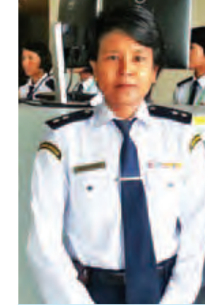
ရဲအုပ်အေးအေးမော်။

အခုလာမယ့် ထိပ်သီးအစည်းအဝေးမှာ လုံခြုံရေးအင်အားရဲ့ ၂၅ ရာခိုင်နှုန်းကို ဇွန် ၅ ရက်မှာ စတင်အသုံးပြုခဲ့ပြီး ဇွန်လ ၁၀ ရက်နေ့မှာ ၅၀ ရာခိုင်နှုန်းနဲ့ ဇွန်လ ၁၆ ရက်နေ့မှာတော့ ၁၀၀ ရာခိုင်နှုန်း ရာနှုန်းပြည့် အသုံးပြုပြီး စတင်ဆောင်ရွက်နေပြီ ဖြစ်ပါတယ်။ လုံခြုံရေးကဏ္ဍကို အပိုင်းခုနစ်ပိုင်းနဲ့ ဆောင်ရွက်နေပါတယ်။ လူပုဂ္ဂိုလ် လုံခြုံရေး၊ တည်းခိုနေရာ လုံခြုံရေးလမ်းကြောင်းလုံခြုံရေး၊ ယာဉ်တန်းလုံခြုံရေး၊ နယ်မြေတစ်ခုလုံး လုံခြုံရေး၊ အရေးပေါ်ဖြစ်လာတဲ့အခါ ဆောင်ရွက်မယ့်လုံခြုံရေးနဲ့ မီးဘေးလုံခြုံရေးတို့ ဖြစ်ပါတယ်။ နိုင်ငံခေါင်းဆောင်တွေအတွက်ဆိုရင်လည်း တည်းခိုနေရာ၊ လူပုဂ္ဂိုလ် လုံခြုံရေးတွေပါ စီမံဆောင်ရွက်ပေးရပါတယ်။ ယာဉ်တန်းတွေနဲ့တည်းခိုမယ့် နေရာတွေပါဝင်ပြီး တစ်နိုင်ငံချင်းစီရဲ့ လုံခြုံရေးအတွက်ကို ရဲမှူးကြီးတစ်ဦး၊ ဒုရဲမှူးကြီးတစ်ဦး၊ ရဲမှူးတွေနဲ့ကြပ်ကြပ်ပြီး အင်အားနှစ်စုဖြစ်တဲ့ ၃၀ နဲ့ ၅၀ ကြား ပေးထားပါတယ်။ နယ်မြေလုံခြုံရေး ဆောင်ရွက်နေတာမှာ ထူးခြားဖြစ်စဉ်မရှိပါဘူး။ သတင်းအရလည်းမရှိဘူး။ ရှာဖွေစစ်ဆေးတွေ့ရှိတာတွေလည်း မရှိပါဘူး။ ယာဉ်တန်း အစီအစဉ်တွေကတော့ အာဆီယံထိပ်သီးအစည်းအဝေးတုန်းက ဆောင်ရွက်ခဲ့သလိုပါပဲ။ ဇာတ်တိုက်လေ့ကျင့်မှုအနေနဲ့က ဇွန်လ ၁၆ ရက်နေ့မှာ တစ်ကြိမ် ဆောင်ရွက်ပါတယ်။ ဇွန်လ ၁၈ ရက်နေ့မှာ တစ်ကြိမ် ထပ်ပြီးဆောင်ရွက်မှာဖြစ်ပါတယ်။ ဒီအစည်းအဝေးမှာ ကတ်စနစ်ကို ပြင်လိုက်ပါတယ်။