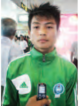
ကိုမြတ်နိုးဦး။

တွေပါပဲ။ ပိုပြီးကြိုးစားချင်စိတ်တွေဖြစ်မိတယ်။ ကျွန်တော် တို့အလှည့်ရောက်တဲ့အချိန်မှာ အစ်ကိုတွေထက်ကောင်း မွန်အောင်ကြိုးစားမယ်။ အခုဆိုရင် အစ်ကိုတွေက ကျွန်တော်တို့အတွက် ဝမ်းသာပျော်ရွှင်မှုတွေကို ပေးခဲ့တဲ့ အပြင် သင်ခန်းစာတွေလည်း ပြသလိုက်သလိုပါပဲ။နိုင်ငံ အတွက်လည်း ဂုဏ်ရှိပါတယ်။ အစ်ကိုတွေကတော့ နိုင်ငံနဲ့ပြည်သူတွေအပေါ် တာဝန်ကျေခဲ့ပါတယ်။