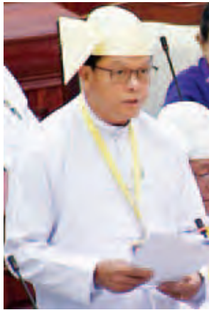
ဒုတိယဝန်ကြီး ဦးအောင်သန်းဦး။

ဥပဒေပါပြဋ္ဌာန်းချက်နှင့်အညီ သတင်းအချက်အလက်ထုတ်ပြန်မှု ဆောင် ရွက်နိုင်ရန် မြန်မာနိုင်ငံတော်ဗဟိုဘဏ်အနေဖြင့် ငွေကြေးဆိုင်ရာအစီရင်ခံစာနှင့် ငွေရေးကြေးရေးတည်ငြိမ်ရေးဆိုင်ရာ အစီရင်ခံစာနှစ်ခု ထုတ်ပြန်နိုင်ရန် စီစဉ် ဆောင်ရွက်လျက်ရှိပါကြောင်း၊ ငွေရေးကြေးရေးဆိုင်ရာ စာရင်းအင်းများကို အမှန် ကိန်းဂဏန်းများ မရရှိနိုင်သေးသည့်အတွက် တင်ပြနိုင်ခြင်းမရှိသေး