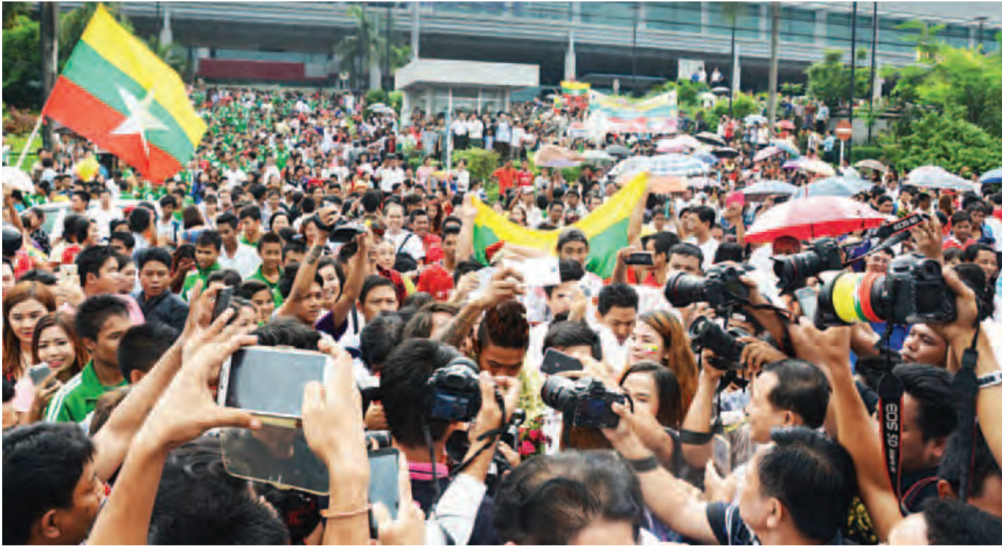
ဒုတိယဆူရ မြန်မာဘောလုံးသမားများအား ရန်ကုန်အပြည်ပြည်ဆိုင်ရာလေဆိပ်တွင် ပြည်သူများက သောင်းသောင်းဖြူဖြူကြိုဆိုကြစဉ်။