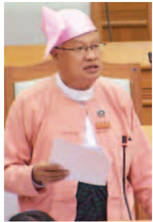
ပြည်ထောင်စုလွှတ်တော် ကိုယ်စားလှယ် ဦးသိန်းညွန့်။