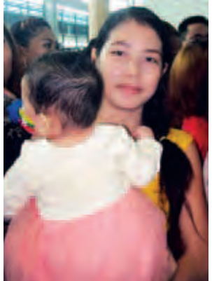
မချောစုဝင်း။

အစ်ကိုတွေဆုယူပြီး ပြန်လာတာကို အလွန်ပဲပျော်ပါ တယ်။ အခုလို ဆီးဂိမ်းပြိုင်ပွဲမှာ ခြေစွမ်းကောင်းတွေကစား ပြခဲ့ပြီး ဆုတွေယူလာတာကို ဝမ်းသာဂုဏ်ယူမိတယ်။ ကျွန်တော်တို့အတွက် အတူယူဖွယ်ပါ။ ပရိသတ်က သောင်းသောင်းဖြဖြကြိုဆိုတာကိုမြင်တော့ နိုင်ငံဂုဏ် ဆောင်အားကစားသမားတွေကို ပိုပြီးလေးစားမိတယ်။ ကျွန်တော်တို့အတွက်ကတော့ ဒီနေ့မြင်ကွင်းဟာ အားဆေး