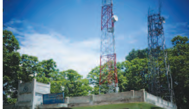
ယင်းကဲ့သို့ တိုးမြှင့်လာခြင်းကြောင့် ၂၀၁၆ ခုနှစ်ကုန်ပိုင်းလောက်တွင် မြန်မာနိုင်ငံဧရိယာ၏ ၇၅ ရာခိုင်နှုန်းခန့်သည် မိုဘိုင်းလ်ဖုန်းဆက်သွယ်ရေးကွန်ရက် လွှမ်းခြုံနိုင်မည်အပြင် အင်တာနက်သုံးစွဲမှုမှာလည်း မိုဘိုင်းလ်ဖုန်းအသုံးပြုသူအရေအတွက်၏ ၅၀ ရာခိုင်နှုန်းကျော်အထိ ရောက်ရှိလာလိမ့်မည်ဟု ခန့်မှန်းထားကြသည်။ ကသာခရိုင်(မြန်/ဆက်)

အင်တာနက်သုံးစွဲရာတွင် ပိုမိုကောင်းမွန်သော 3G ကွန်ရက်တပ်ဆင်မှုဖြစ်ပြီး အရင်က အဝေးဆက်ကြောင်း (E1) ကို အသုံးပြုနေရာမှ အဝေးဆက်ကြောင်း (FE) အမျိုးအစားကို ပြောင်းလဲအသုံးပြုနေပြီဖြစ်ကြောင်း ၎င်းက ထပ်လောင်းပြောသည်။ မြန်မာ့ဆက်သွယ်ရေးလုပ်ငန်းသည် တာဝါတိုင်များအားလုံးကို 3G ကွန်ရက်အဆင့်သို့ တိုးမြှင့်ဆောင်ရွက်နိုင်စေရန် ဂျပန်နိုင်ငံအခြေစိုက် KDDI ကုမ္ပဏီ၊ Sumitomo ကော်ပိုရေးရှင်းတို့နှင့်အတူ ပူးပေါင်းဆောင်ရွက်လျက်ရှိကြောင်းသိရသည်။ ယခင်က မြန်မာနိုင်ငံ၌ မိုဘိုင်းလ်ဖုန်းသိပ်သည်းဆမှာ ၁၀ ရာခိုင်နှုန်းကျော်သာရှိခဲ့ပြီး လွန်ခဲ့သောနှစ်နှစ်ခန့်မှစတင်ကာ ပြည်တွင်း၌ မိုဘိုင်းလ်ဖုန်းအသုံးပြုသူ အရေအတွက်တိုးတက်များပြားလာရာ မိုဘိုင်းလ်ဖုန်းသိပ်သည်းဆသည် ၄၅ ဒသမ ၄၂ ရာခိုင်နှုန်းအထိ တိုးမြှင့်လာခဲ့သည်။