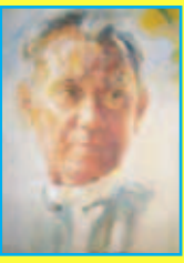
တက္ကသိုလ်ဘုန်းနိုင်