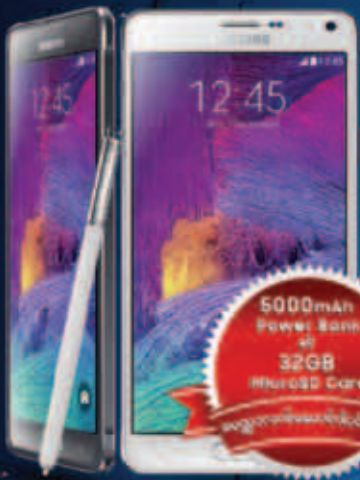
Samsung GALAXY Note 4