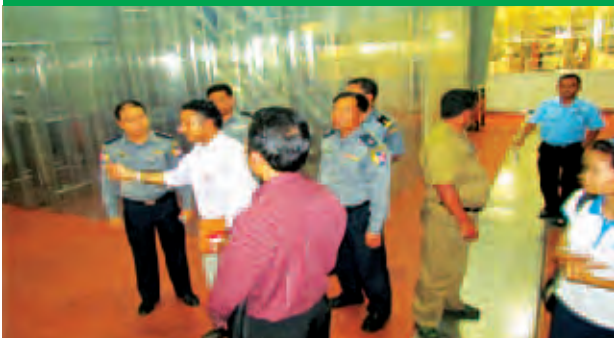
ပြန်လည်ထူထောင်ရေးအဖွဲ့