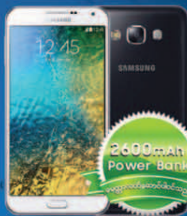
Samsung GALAXY E7