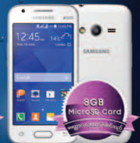
Samsung GALAXY V