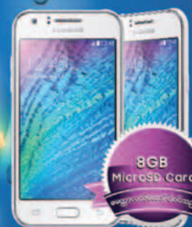
Samsung GALAXY J1