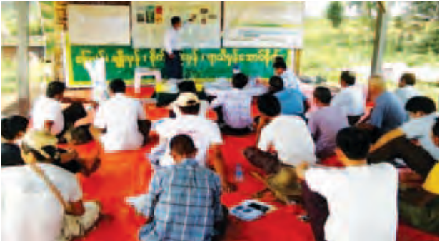
တားဆီးနှိမ်နင်းရေးနှင့် စီမံခန့်ခွဲရေးအဖွဲ့