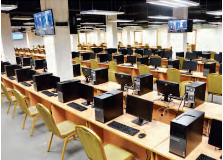
နေပြည်တော်ရှိ မြန်မာအပြည်ပြည်ဆိုင်ရာ ကွန်ပင်းရှင်းဗဟိုဌာန(၁)၌ Media Center ပြင်ဆင်ထားရှိမှုကို တွေ့ရစဉ်။