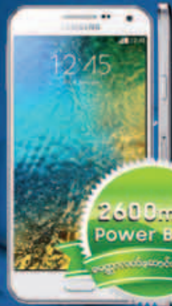
Samsung GALAXY E5