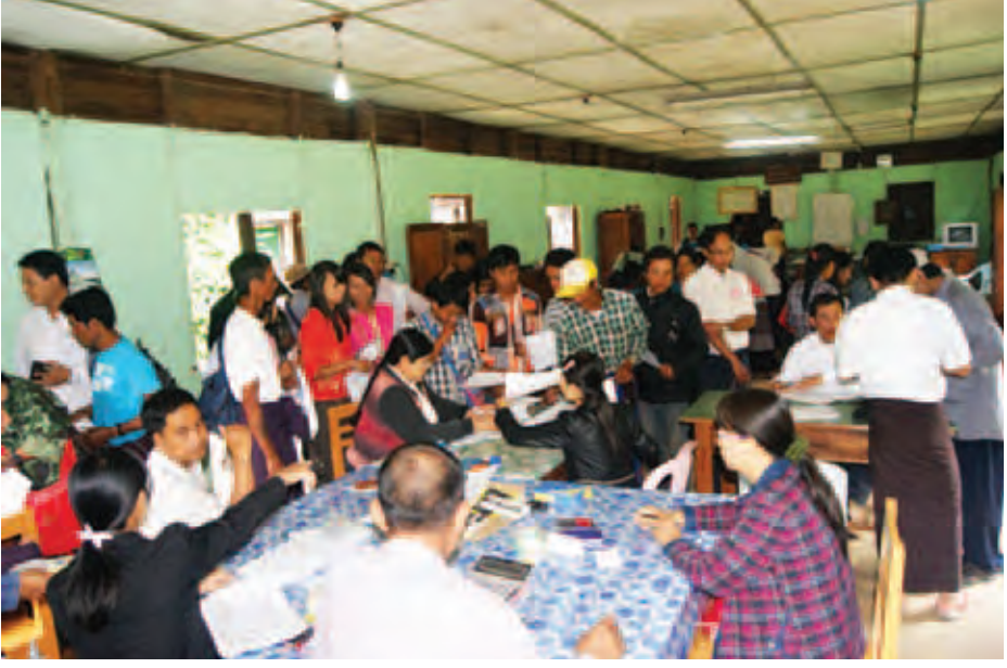
ကယားပြည်နယ် ဖရူဆိုမြို့ အထွေထွေ အုပ်ချုပ်ရေးဦးစီးဌာန၌ လွိုင်ကော်မြို့ ကုန်းလမ်းပိုဆောင်ရေးညွှန်ကြားမှု ဦးစီးဌာနနှင့် မြန်မာ့အာမခံလုပ်ငန်းတို့ ပူးပေါင်း၍ ဇွန် ၁၃ ရက်က ယာဉ်လိုဏ်ခင်းနှင့် အမောင်းလိုဏ်ခင်းများ အသစ်ပြုလုပ် ဖြင်း၊ သက်တမ်းတိုးပေး ဖြင်းလုပ်ငန်းများကို နေ့ရှင်းပြီး ကွင်းဆင်းဆောင်ရွက်ပေးနေစဉ်။