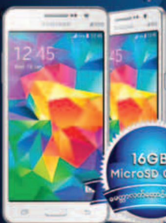
Samsung GALAXY GRAND Prime