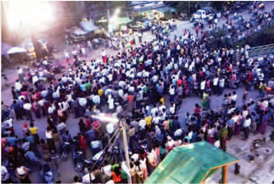
ဧရာဝတီတိုင်းဒေသကြီး ဖျာပုံခရိုင် ဖျာပုံမြို့၊ ကားကြီးကွင်းရှေ့ရှိ LED Board ရှေ့တွင် ဖျာပုံမြို့သူ မြို့သားများ ယူ-၂၃ ဘောလုံး ဗိုလ်လုပွဲအား တစ်ခဲနက်အားပေးနေကြသည်ကိုတွေ့ရစဉ်။ (သပြေထွန်း)