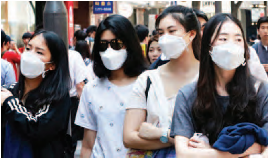
ရိုသူများက ရောဂါကူးစက်ခံထားရသူများနှင့် ဆက်သွယ် ပတ်သက်သည့် လူ ၅၂၀၀ ကို သီးသန့်ခွဲထားသည်။ အင်န်အိတ်ချီကေ။

တောင်ကိုရီးယားဆေးရုံတစ်ရုံမှ တာဝန်ရှိသူတစ်ဦးက တောင်းပန်စကားဆိုခဲ့သည်။ ဆစ်ဆောင်း ဗဟိုဆေးဝါးဌာနဥက္ကဋ္ဌ ဆောင်ကျော့က အသက် (၅၅)နှစ်အရွယ်ရှိ အရေးပေါ်ကျန်းမာရေးဌာနမှ အမျိုးသားတစ်ဦး မေလနှောင်းပိုင်းက လူနာများကို ဆေးရုံသို့ပို့ဆောင်ပေးစဉ် မားစ်ရောဂါကူးစက်ခံခဲ့ရ ကြောင်း၊ အဆိုပါအမျိုးသားမှာ မားစ်ရောဂါလက္ခဏာများ ပြသနေသော်လည်း ပြီးခဲ့သည့် ဗုဒ္ဓဟူးနေ့အထိ အလုပ် လုပ်နေခဲ့ကြောင်းနှင့် ရောဂါထိန်းချုပ်နိုင်မှုပျက်ကွက်ခဲ့ သည့်အတွက် နိုင်ငံတစ်ဝန်းမှ ပြည်သူများကိုတောင်းပန် ပါကြောင်း တနင်္ဂနွေနေ့တွင် ပြောကြားသည်။ ဆေးရုံက အဆိုပါအမျိုးသားနှင့် အဆက်အဆံရှိ သူများကို ရှာဖွေလျက်ရှိသည်။ တောင်ကိုရီးယားတာဝန်