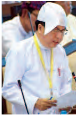
ဒုတိယဝန်ကြီး ဒေါက်တာဇော်လင်းအောင်။

အတွက် စီစဉ်ဆောင်ရွက်သွားမည် ဖြစ်ကြောင်း ရှင်းလင်းဖြေကြားသည်။ ဝဲခူးတိုင်းဒေသကြီး မဲဆန္ဒနယ် အမှတ်(၁)မှ ဦးစောမော်ထွန်း၏ မန္တလေးနန်းမြို့တော်အတွင်း မြန်မာ မင်း လွှတ်တော်ပုံစံ ခေတ်မီပြတိုက် တည်ဆောက်ပေးရန် အစီအစဉ် ရှိ မရှိ နှင့် စပ်လျဉ်း၍ ယဉ်ကျေးမှုဝန်ကြီး ဌာန ဒုတိယဝန်ကြီး ဦးသန်းဆွေက မန္တလေးမြို့ရှိ မြန်မာစံကျော်ရွှေနန်း တော်ကြီးမှာ အမျိုးဂုဏ်၊ ဇာတိဂုဏ် မြင့်မားရေးအတွက် ရည်ရွယ်ကာ မူလပုံစံအတိုင်း မြေနန်းပြာသား၊ ဇေတဝန်ဆောင်၊ ဗြဟ္မာ့၊ တောင် ထားဝယ်ဆောင်၊ မြောက်ထားဝယ် ဆောင်၊ မှန်နန်းဆောင် စသည့် အဆောင်များအား စနစ်တကျ ပြန်လည် တည်ဆောက်ထားသဖြင့် လေ့လာသူများအတွက် နန်းတွင်း အလေ့အထများကို လေ့လာမှတ် သားနိုင်ပါကြောင်း၊ ထို့ကြောင့် မန္တလေး နန်းမြို့တော်အတွင်း မြန်မာမင်း လွှတ်တော်ပုံစံ ခေတ်မီပြတိုက် တည် ဆောက်ပေးရန် အစီအစဉ်မရှိပါ ကြောင်း ဖြေကြားသည်။ ထို့နောက် ပြည်သူ့လွှတ်တော်က ပြင်ဆင်ချက်ဖြင့် ပြန်လည်ပေးပို့လာ သည့် ၂၀၁၂ ခုနှစ် အမျိုးသားလွတ်