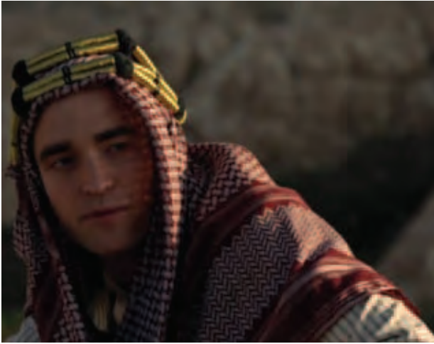
Twilight ဇာတ်လမ်းတွဲများဖြင့် နာမည်ကြီးလာခဲ့သော ဟောလိဝုဒ် ကြယ်ပွင့် ရောဘတ်ပက်တီဆန်သည် အမြဲအေးစက်နေခဲ့သော သွေးစုပ် ဖုတ်ကောင်အဖြစ် သရုပ်ဆောင်ခဲ့ရာမှ ယခုအခါ ပူပြင်းလှသော ကမ္ဘာ့ရုပ်ရှင်

လှုပ်ရှားသွားလာနေထိုင်ရသူတစ်ဦး အဖြစ် ကမ္ဘာ့ရုပ်ရှင်မ (Queen of the Desert) တွင် မင်းသားဂျိမ်းစ် ဖရန်ကို့၊ မင်းသမီး နီကိုးကတ်မန်းတို့ နှင့်အတူ တွဲဖက်ရိုက်ကူးလျက်ရှိသည်။ အဆိုပါရုပ်ရှင်သည် ၁၉၂၀ ဝန်း ကျင်ခန့်က အရှေ့အလယ်ပိုင်း ဒေသ၏ နိုင်ငံရေးအခြေအနေများကို ဇာတ်အိမ် တည်ထားခြင်းဖြစ်ကာ အချစ်၊ ရသနှင့် စွန့်စားခန်းများ ပါဝင်သော ဇာတ်ကားတစ်ကားလည်း ဖြစ်သည်။ ထို့ပြင် ယင်းရုပ်ရှင်သည် သမိုင်း ပညာရှင်၊ စာရေးဆရာနှင့် ဗြိတိသျှ လျှို့ဝှက်အဖွဲ့အစည်းတစ်ခု၏ အဖွဲ့ ဝင်တစ်ဦးဖြစ်သည့် ဂါလူဇီဘဲလ် အကြောင်းရိုက်ကူးထားသည့် ရုပ်ရှင်