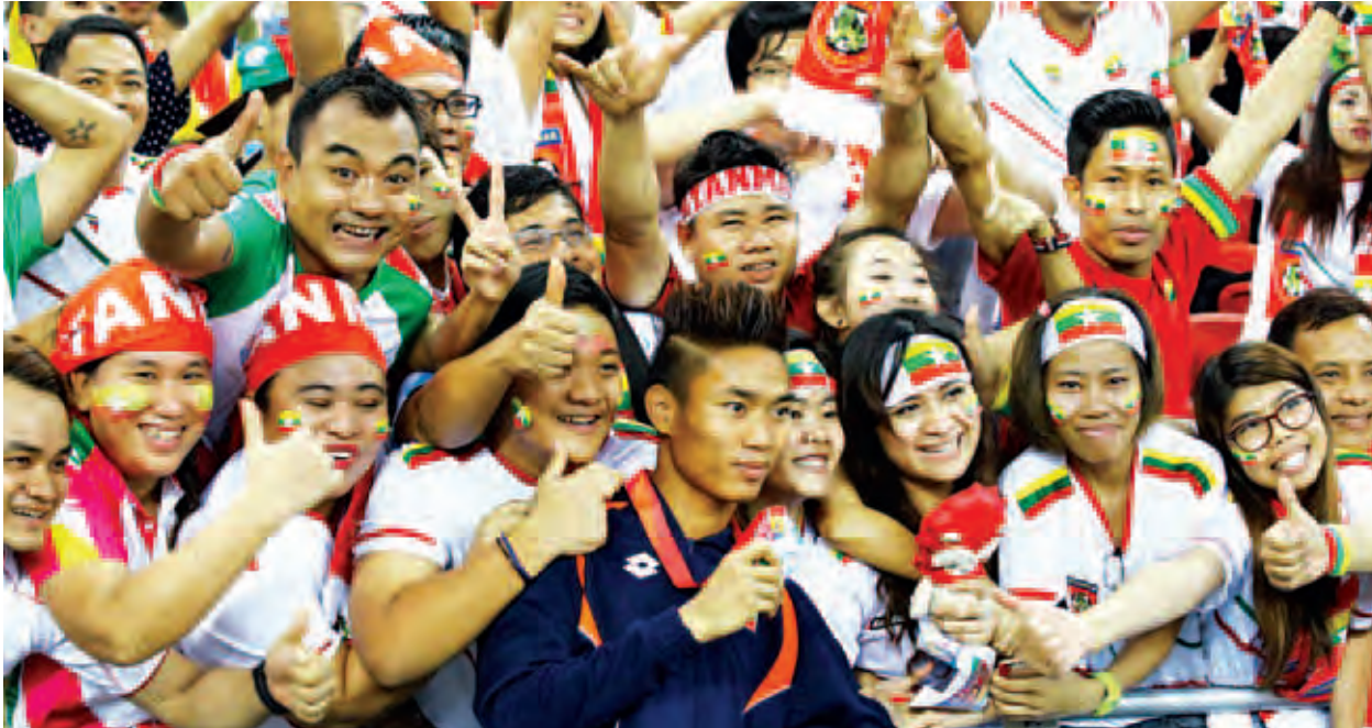
စင်ကာပူနိုင်ငံရောက် မြန်မာပရိသတ်များ၏ တစ်ခဲနက်အားပေးမှုကို တွေ့ရစဉ်၊