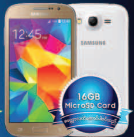
Samsung GALAXY GRAND Neo