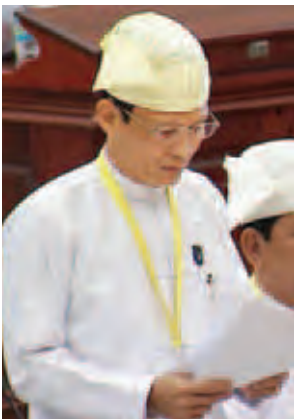
ဒုတိယဝန်ကြီး ဦးဝင်းမြင့်။

မိုးမောက်မဲဆန္ဒနယ်မှ ဦးဇော်ထွန်း၏ မြန်မာနိုင်ငံသားနှင့် အခြားနိုင်ငံ သားတို့ ပေါင်းသင်းရာမှ မွေးဖွားလာသည့် သားသမီးများအတွက် နိုင်ငံသား သို့မဟုတ် နိုင်ငံခြားသားအဖြစ် အသိအမှတ်ပြုနိုင်ရေးအတွက် ဥပဒေ ပြဋ္ဌာန်းရေးရန် အစီအစဉ်ရှိ မရှိ မေးခွန်းနှင့် စပ်လျဉ်း၍ မြန်မာနိုင်ငံသားနှင့် အခြားနိုင်ငံသား မိဘနှစ်ပါးတို့ ပေါင်းသင်းရာမှ မွေးဖွားလာသည့် သားသမီး များအတွက် နိုင်ငံသားအဖြစ် အသိအမှတ်ပြုရေး ဆောင်ရွက်နိုင်မည်မဟုတ်ဘဲ မြန်မာနိုင်ငံသားဥပဒေပုဒ်မ ၄၃ (က)အရ နိုင်ငံသားပြုခွင့်သာ လျှောက်ထား နိုင်မည်ဖြစ်ပါကြောင်း၊ နိုင်ငံသားနှင့် နိုင်ငံခြားသားမိဘနှစ်ပါးမှ နိုင်ငံတော်ပြင်ပ ၌ မွေးဖွားလာသော သားသမီးများအတွက် (နိုင်ငံသားဆိုင်ရာ လုပ်ထုံးလုပ် နည်းများ)အရ ကလေးမွေးဖွားကြောင်း မွေးစာရင်းနှင့်အတူ မွေးဖွားသည့်နေ့မှ စ၍ တစ်နှစ်အတွင်း မြန်မာနိုင်ငံသို့သို့ အကြောင်းကြားရမည်ဖြစ်ပါကြောင်း၊ နိုင်ငံတော်ပြင်ပတွင် မွေးဖွားခဲ့သော ကလေးအား မြန်မာနိုင်ငံသို့ ပြန်လည် ရောက်ရှိ နေထိုင်ပါက မိဘ/အုပ်ထိန်းသူ၏ အိမ်ထောင်စု လူဦးရေစာရင်းတွင် နိုင်ငံတော်ပြင်ပတွင် ကလေးမွေးဖွားခြင်း မှတ်တမ်းပုံစံ နိုင်ငံ-၈ တို့နှင့်အတူ မြို့နယ်ဦးစီးဌာနမှူးမှူးသို့ လာရောက်လျှောက်ထားရမည်ဖြစ်ပါကြောင်း၊ မြန်မာ