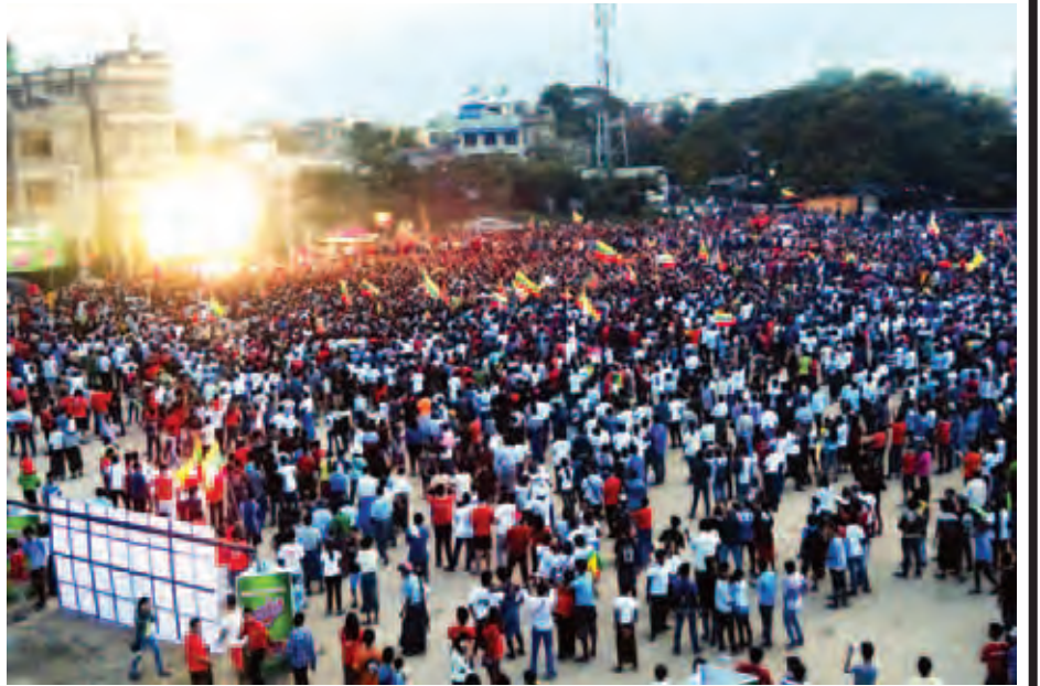
မြန်မာ-ထိုင်း ဘောလုံးပြိုင်ပွဲ ဗိုလ်လုပွဲ ယှဉ်ပြိုင်ကစားမှုကို မန္တလေးမြို့တော် စည်ပင်ရုံးရှေ့ LED Board ရှေ့တွင် မျိုးချစ်စိတ်အပြည့်ဖြင့် ပွဲပြီးသည့်အထိ အားပေးနေကြစဉ်။

မြန်မာ - ထိုင်း ဘောလုံးပြိုင်ပွဲ ဗိုလ်လုပွဲ အား လားရှိုးမြို့၊ မြို့တော် ခန်းမရှေ့တွင် မြို့သူ မြို့သားများ တစ်ခဲနက် အားပေးနေကြသည်ကို တွေ့ရစဉ်။