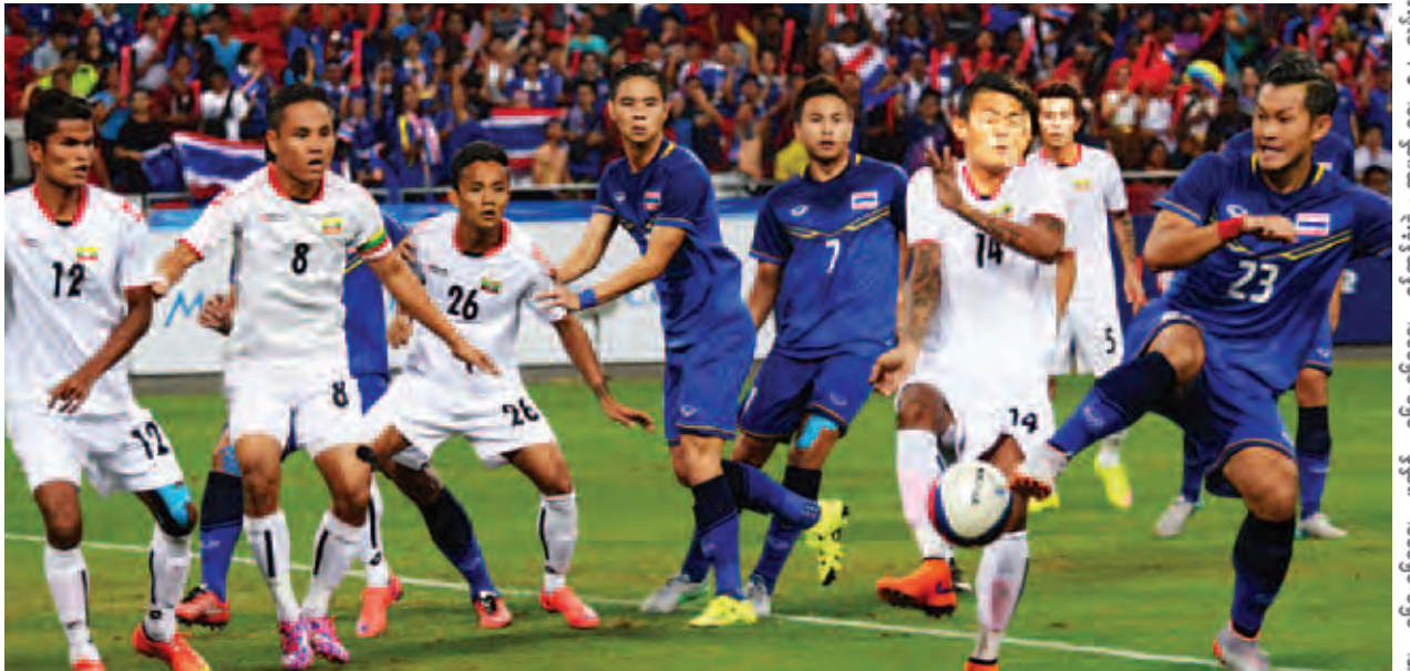
(၂၈)ကြိမ်မြောက် အရှေ့တောင်အာရှအားကစားပြိုင်ပွဲ၏ ဘောလုံးဗိုလ်လုပွဲတွင် မြန်မာအသင်းနှင့် ထိုင်းအသင်းတို့ အကြိတ်အနယ်ယှဉ်ပြိုင် နေစဉ်။

(၂၈)ကြိမ်မြောက် အရှေ့တောင်အာရှအားကစားပြိုင်ပွဲ၏ ဘောလုံးဗိုလ်လုပွဲတွင် ဝင်ရောက်ယှဉ်ပြိုင်နေကြသည့် ဘောလုံးသမားများအား ဗိုလ်လုပွဲ မတိုင်မီတွင် နိုင်ငံတော်သမ္မတ ဦးသိန်းစိန်က ဂုဏ်ပြုအားပေးစကားပြောကြားခဲ့သည်။ နိုင်ငံတော်သမ္မတက သမိုင်းဝင်မည့် ဘောလုံးဗိုလ်လုပွဲကို ထိုက်ထိုက်တန်တန် တက်ရောက်နိုင်အောင် ကြိုးပမ်းစွမ်းဆောင်ခဲ့ကြသည့် မြန်မာဘောလုံးအသင်း၏စွမ်းဆောင်မှုများကို မိမိအပါအဝင် ပြည်သူတစ်ရပ်လုံးက ဝမ်းမြောက်ဂုဏ်ယူလျက်ရှိကြပါကြောင်း၊ ယနေ့ကစားမည့် ဘောလုံးဗိုလ်လုပွဲ၌ မြန်မာလူငယ်ဘောလုံးသမားများအနေဖြင့် အားကစားစိတ်ဓာတ်ကိုအခြေခံပြီး စိတ်ဓာတ်မြင့်မြင့်မားမားနှင့် မြန်မာ့စွမ်းရည်ပြသပြီး မြန်မာ့ဂုဏ်ကို ဆောင်နိုင်မည်ဟု ယုံကြည်ပါကြောင်း၊ မြန်မာနိုင်ငံတစ်ဝန်းလုံးမှ ပြည်သူများအားလုံးကလည်း မြန်မာဘောလုံးအသင်းကို မိမိနှင့်အတူ တစ်ခဲနက်အားပေးနေကြမည်ဖြစ်ပါကြောင်း၊ အားကစားပြိုင်ပွဲအသီးသီးတွင် ယှဉ်ပြိုင်နေကြသည့် မြန်မာ့ဂုဏ်ဆောင်အားကစားသမားများနှင့် အားကစားနည်းပြများအနေဖြင့် မြန်မာ့စွမ်းရည်ပြသပြီး မြန်မာ့ဂုဏ်ဆောင်နိုင်ရန်အတွက် ရေကုန်ရေခန်းကြိုးစားအားထုတ်နေကြသည့် မြန်မာ့အားကစားသမားများကို မိမိအပါအဝင် ပြည်သူအားလုံး ကြည့်ရှုအားပေးရင်း ဆုမွန်ကောင်း တောင်းလျက်ရှိပါကြောင်း ပြောကြားခဲ့သည်။