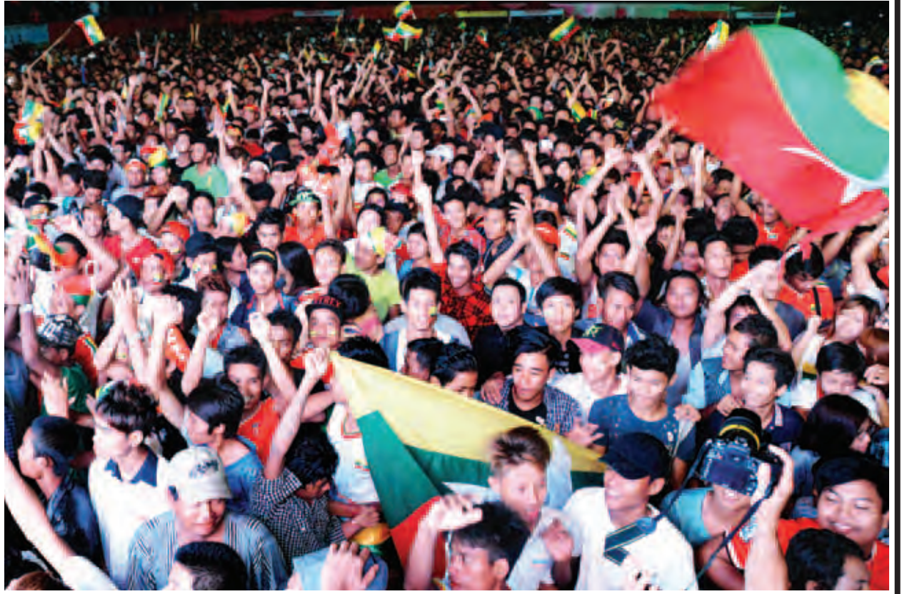
ရန်ကုန်မြို့၊ ပြည်သူ့ရင်ပြင်တွင် မြန်မာ-ထိုင်း ဘောလုံးပြိုင်ပွဲ ဗိုလ်လုပွဲအား တစ်ခဲနက်အားပေးနေကြသည့် ပရိသတ်ကြီးကို တွေ့ရစဉ်။