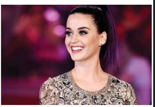
Space"မှာမူ ၉၂၃ သန်း ဖြင့် ကြည့်ရှု ရှိနေခဲ့သည်။ သူ ပဉ္စမအများဆုံးနေရာ တွင်

အင်္ဂါနေ့တွင် ထုတ်ပြန်ခဲ့သော Youtube ရှိ ဗီဒီယိုတစ်ခုကို ကမ်တီပယ်ရီ သတင်းအချက်အလက်များအရ အမေရိကန် ပေါ့ပီအဆိုတော် ကမ်တီပယ်ရီ၏ "Dark Horse" သီချင်းသည် ကြည့်ရှုသူ တတိယ အများဆုံးနေရာတွင် ရောက်ရှိခဲ့ပြီး အဆိုတော် တေလာဆွစ်၏ "Blank Space" သီချင်းမှာမူ ပဉ္စမမြောက် အများဆုံးနေရာတွင်သာ ရှိခဲ့သည်။ ကမ်တီပယ်ရီ၏ အဆိုပါသီချင်း သည် ကြည့်ရှုသူ သန်း ၉၀၀ ကျော် ရှိ ခဲ့ပြီး အမျိုးသမီးအဆိုတော်များထဲ တွင် ကြည့်ရှုသူအများဆုံး ရရှိခဲ့သော အဆိုတော်လည်းဖြစ်သည်။ ဂျက်စတင် ဘီ ဘာ၏ "Baby" သီချင်းသည် ကြည့်ရှုသူ ၁ ဒသမ ၂ တိလီယံဖြင့် ဒုတိယနေရာတွင် ရှိနေ ခဲ့ပြီး Psy ၏ "Gangnam Style" သီချင်းသည် ၂ ဒသမ ၃ တိလီယံဖြင့် ထိပ်ဆုံးတွင်ရပ်တည်နေခဲ့သည်။ ထို့ပြင် ကမ်တီပယ်ရီ၏ "Roar" သီချင်းသည် စတုတ္ထနေရာတွင် ရှိနေခဲ့ကာ တေလာဆွစ်၏ "Blank