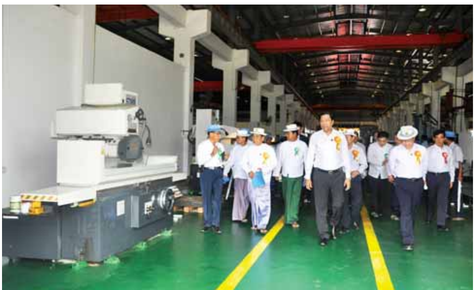
စက်ရုံထုတ်လုပ်သော မိုလ်နှင့်ခိုင်များဖြင့် မော်တော်ယာဉ်သုံးပစ္စည်းအစိတ်အပိုင်းများ၊ စက်ပစ္စည်းအစိတ်အပိုင်းများ၊ အိမ်သုံးလျှပ်စစ်ပစ္စည်းအမျိုးမျိုးနှင့် လူသုံးကုန်ပစ္စည်းအမျိုးမျိုးတို့ကို ထုတ်လုပ်နိုင်မည်ဖြစ်ကြောင်း သိရသည်။ (ကြေးမုံ)

အလုပ်ရုံကမ္ဘာ့မော်ကွန်းကို စက်ခလုတ်နိုင်ဖွင့်လှစ်ပေးသည်။ အဆိုပါစက်ရုံကို စက်မှုဝန်ကြီးဌာနအမှတ်(၂) အကြီးစားစက်ရုံလုပ်ငန်းနှင့် တရုတ်နိုင်ငံ CATIC Beijing Co.,Ltd. တို့ ပူးပေါင်း၍ ၂၀၁၂-၂၀၁၅ ရက်တွင် စတင်အကောင်အထည်ဖော်ခဲ့ပြီး ၂၄-၁၁-၂၀၁၄ ရက်တွင် စီမံကိန်းလုပ်ငန်းအားလုံး ပြီးစီးခဲ့သည်။ ယင်းစက်ရုံမှ ပို့ဆောင်ရေးကဏ္ဍသုံး မော်တော်ယာဉ်များအတွက် မိုလ်နှင့်ခိုင်များကို ပြည်ပသွင်းကုန်အစားထိုး ထုတ်လုပ်နိုင်၍ ထုတ်လုပ်မှုနည်းပညာများရရှိခြင်းနှင့် ဒေသခံပြည်သူများအတွက် အလုပ်အကိုင်အခွင့်အလမ်းသစ်များ ဖန်တီးပေးနိုင်ခြင်း အကျိုးကျေးဇူးများ ရရှိနိုင်မည်ဖြစ်ပြီး မိုလ်နှင့်ခိုင်အမျိုးမျိုးကို တစ်နှစ်လျှင် အစုံ ၅၀၀ ထုတ်လုပ်နိုင်မည်ဖြစ်သည်။