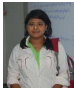
မနင်းရှိုင်းပွင့်