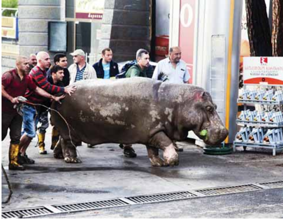
သေဆုံးခဲ့သည် သို့မဟုတ် တိရစ္ဆာန်များတိုက်ခိုက်မှုကြောင့် သေဆုံးခဲ့ခြင်းဖြစ်သည်ကို ရှင်းလင်းစွာမသိရသေးပေ။

သေဆုံးခဲ့သည့်လူကိုးဦးသည် ရေကြီးရေလျှံမှုကြောင့်