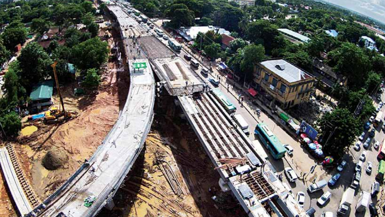
အင်းစိန်ရထားလမ်း ခုံးကျော်တံတားအသစ်တည်ဆောက်ရေးစီမံကိန်း ဆောင်ရွက်ပြီးစီးနေမှုအခြေအနေကို တွေ့ရစဉ်။ (သတင်း စာမျက်နှာ-၃)