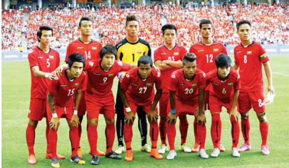
စင်ကာပူဆီမီးဖိုင်နယ်တွင် ပြိုင်ပွဲဝင်လျက်ရှိသော မြန်မာယူ-၂၃ အသင်းအား တွေ့ရစဉ်။