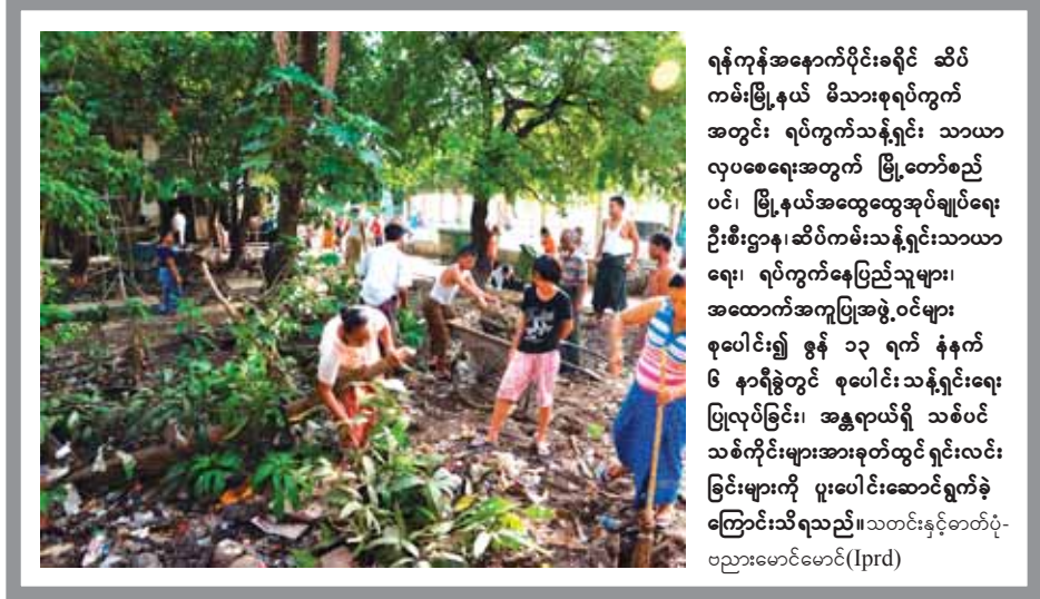
ရန်ကုန်အနောက်ပိုင်းခရိုင် ဆိပ်ကမ်းမြို့နယ် မိသားစုရပ်ကွက်အတွင်း ရပ်ကွက်သန့်ရှင်း သာယာလှပစေရေးအတွက် မြို့တော်စည်ပင်၊ မြို့နယ်အထွေထွေအုပ်ချုပ်ရေးဦးစီးဌာန၊ ဆိပ်ကမ်းသန့်ရှင်းသာယာရေး၊ ရပ်ကွက်နေပြည်သူများ၊ အထောက်အကူပြုအဖွဲ့ဝင်များ စုပေါင်း၍ ဇွန် ၁၃ ရက် နံနက် ၆ နာရီခွဲတွင် စုပေါင်းသန့်ရှင်းရေးပြုလုပ်ခြင်း၊ အန္တရာယ်ရှိ သစ်ပင်သစ်ကိုင်းများအားခုတ်ထွင်ရှင်းလင်းခြင်းများကို ပူးပေါင်းဆောင်ရွက်ခဲ့ကြောင်းသိရသည်။ သတင်းနှင့်စာတတ်ပုံ-ဗညားမောင်မောင် (Iprd)

ပြုတိုက်တွင် မူလက ပြသသော ပစ္စည်း ၁၂၂ မျိုးမှ စတင်ခဲ့ပြီး နောက်ပိုင်း၌ ရှေးဟောင်းပစ္စည်း . . .