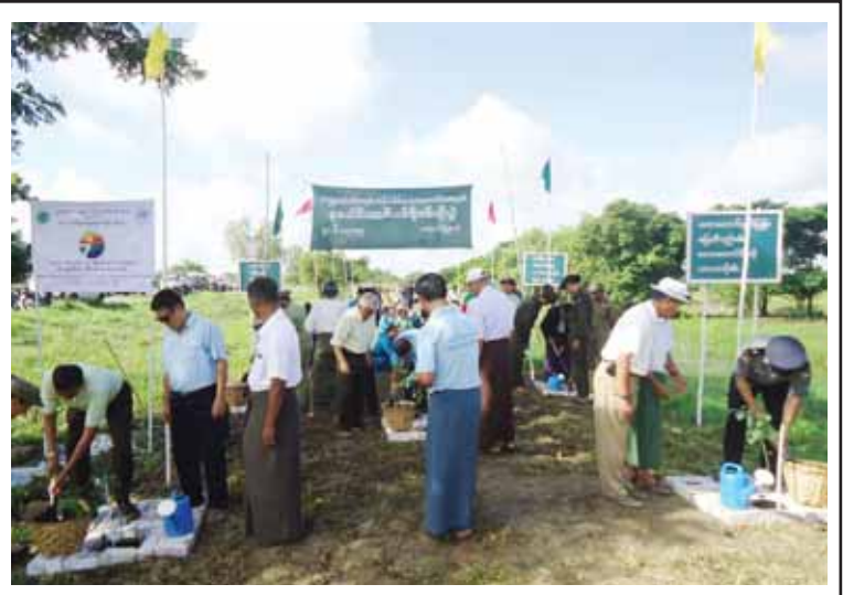
မအူပင်မြို့နယ် သစ်တောဦးစီးဌာနမှ ၂၀၁၅ ခုနှစ် ကမ္ဘာ့ပတ်ဝန်းကျင်ထိန်းသိမ်းရေးနေ့ အထိမ်းအမှတ် စုပေါင်းသစ်ပင် စိုက်ပျိုးပွဲကို မအူပင်-ကျိုက်လတ်ကားလမ်း မိုင်တိုင် (၂၂/၅) တွင် ဇွန် ၅ ရက်က ကျင်းပခဲ့ရာ ခရိုင်နှင့် မြို့နယ်အဆင့်ဌာနဆိုင်ရာများ လူမှုရေးအသင်းအဖွဲ့များ၊ ကျေးရွာသူကျေးရွာသားများ အင်အား ၂၀၀ ခန့်က ပါတောက်ပင် ငါးပင်နှင့် ယူကလစ်ပင် ၃၀၀ တို့ကို စုပေါင်းစိုက်ပျိုးကြစဉ်။