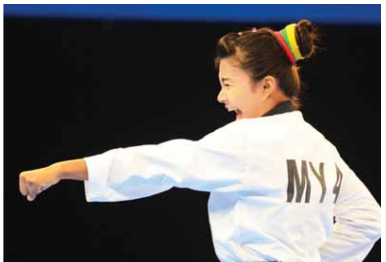
(၂၈)ကြိမ်မြောက် အရှေ့တောင်အာရှ အားကစားပြိုင်ပွဲ အမျိုးသားနှစ်ယောက်တွဲအသင်းလိုက် ပိုက်ကျော်ခြင်းပြိုင်ပွဲ ဗိုလ်လုပွဲတွင် မြန်မာနှင့် ထိုင်းအသင်းတို့ ယှဉ်ပြိုင်နေစဉ်။(ဝဲပုံ)နှင့် တိုက်ကွမ်စီပြိုင်ပွဲ ကကွက်ပြိုင်ပွဲတွင် မြန်မာအားကစားမယ်တစ်ဦး ပြိုင်ပွဲဝင်နေစဉ်။(ယာပုံ)