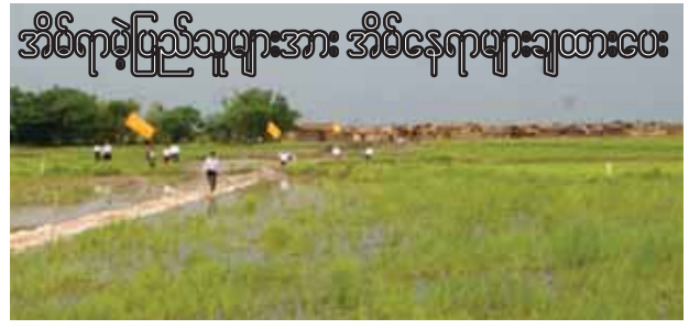
မအူပင် ဇွန် ၁၂