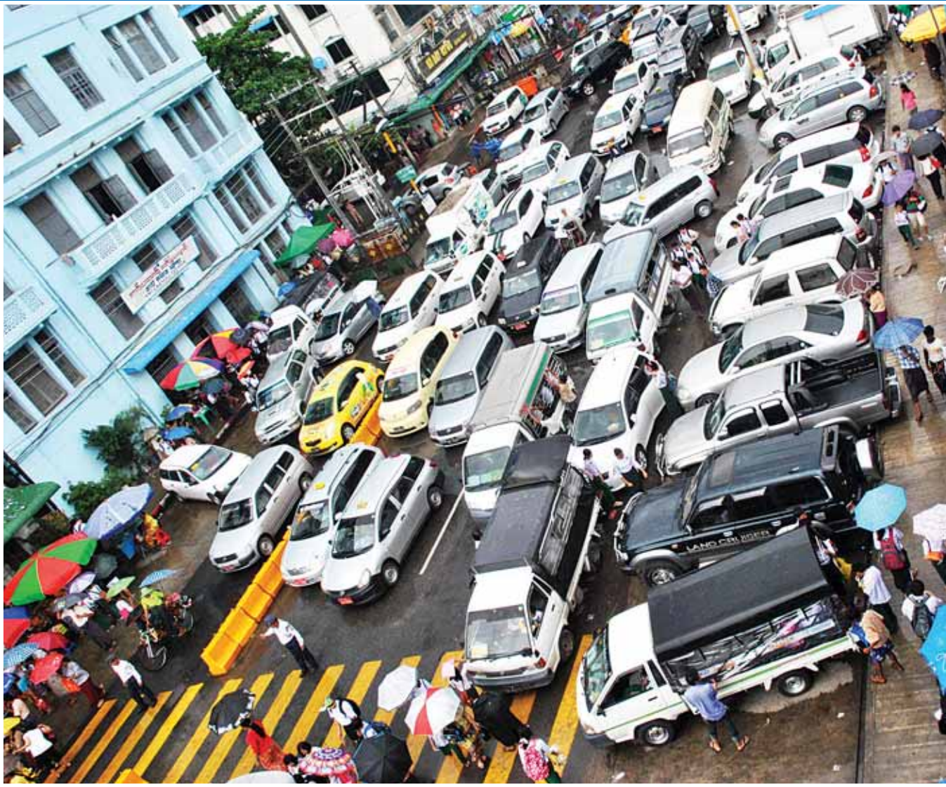
ရန်ကုန်မြို့ အနော်ရထာလမ်းတစ်လျှောက် ယာဉ်ကြောပိတ်ဆို့မှုကို တွေ့ရစဉ်။