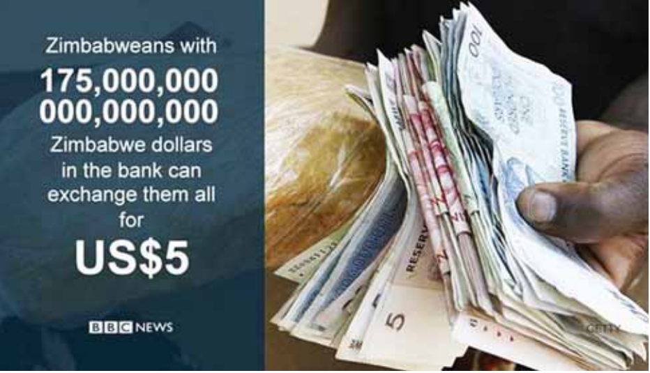
လက်တွန်းလှည်းပေါ်တင်၍ တွန်းသွားကြရသည်ဟု ဆိုသည်။ ဇင်ဘာဘွေအစိုးရက နောက်ဆုံးရိုက်နှိပ်သော ငွေစက္ကူ။

၁၇၅ ကွာဒရီလီယံ (၁၇၅ ၀၀၀ ၀၀၀ ၀၀၀ ၀၀၀) ဖြင့် လဲလှယ်ရသည်။ အမေရိကန်ဒေါ်လာလျှင် ဇင်ဘာဘွေဒေါ်လာ ၃၅ ကွာဒရီလီယံနှုန်းဖြစ်သည်။ ဇင်ဘာဘွေနိုင်ငံသားများသည် စက်တင်ဘာလကုန် မတိုင်မီ ၎င်းတို့၏ ပြည်တွင်းသုံး ဒေါ်လာများကို လဲလှယ်ကြရမည်ဖြစ်သည်။ ငွေကြေးဖောင်းပွမှု မြင့်လွန်းလှသဖြင့် ဈေးဆိုင်များ ၌ ကုန်ပစ္စည်းဈေးနှုန်းများမှာ တစ်ရက်တည်းမှာပင် အကြိမ်ကြိမ် ပြောင်းလဲလျက်ရှိပြီး အခြေခံကုန်စည်များ မှာလည်း ရှားပါးလျက်ရှိသည်။ ပြည်သူများသည် ဈေးဝယ်ထွက်လျှင် ငွေများကို