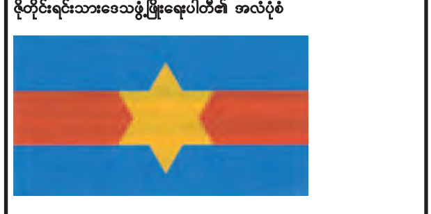
ဇိုတိုင်းရင်းသားဒေသဖွံ့ဖြိုးရေးပါတီ၏ အလံပုံစံ

၁။ ရန်ကုန်တိုင်းဒေသကြီး၊ မြေခံကုန်း၊ ရှင်စောပုရပ်ကွက်၊ စမ်းချောင်းလမ်း၊ အမှတ်(၁၅၀) (၅ လွှာ) (A)တွင် ပါတီရုံးချုပ်တည်ရှိသော ဇိုတိုင်းရင်းသားဒေသဖွံ့ဖြိုးရေးပါတီက နိုင်ငံရေးပါတီများ မှတ်ပုံတင်ခြင်း ဥပဒေ ပုဒ်မ ၅ အရ နိုင်ငံရေးပါတီအဖြစ် မှတ်ပုံတင်ခွင့်ပြုရန် ၁၁-၆-၂၀၁၅ ရက်နေ့တွင် လျှောက်ထားလာပါသည်။ ယင်းသို့လျှောက်ထားရာတွင် ပါတီအမည်၊ အလံနှင့် တံဆိပ်တို့ကို ဖော်ပြပါအတိုင်း အသုံးပြုမည်ဖြစ်ကြောင်း တင်ပြလာပါသည်။ ၂။ ယင်းအဖွဲ့အစည်းက အသုံးပြုမည့် ပါတီအမည်၊ အလံနှင့် တံဆိပ်တို့ကို ကန့်ကွက်လိုက် ယခုကြေညာသည့်နေ့မှစ၍ (၇)ရက်အတွင်း ခိုင်လုံသော အထောက်အထားများဖြင့် ပြည်ထောင်စုရွေးကောက်ပွဲကော်မရှင်သို့ လာရောက်ကန့်ကွက်နိုင်ပါကြောင်း နိုင်ငံရေးပါတီများ မှတ်ပုံတင်ခြင်း နည်းဥပဒေ ၁၄(ဃ)အရ အများသိစေရန် ကြေညာအပ်ပါသည်။