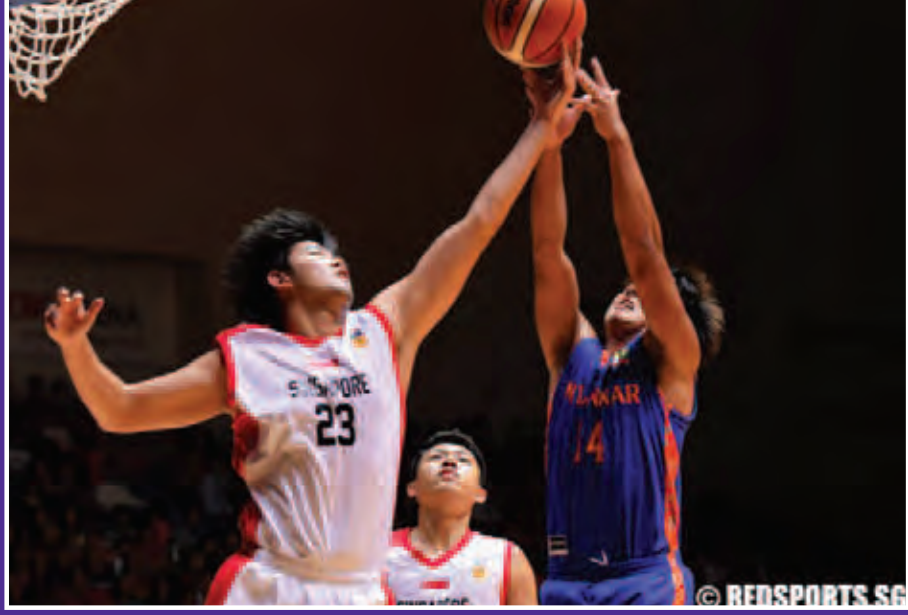
စင်ကာပူအသင်းနှင့် မြန်မာအသင်းတို့ ယှဉ်ပြိုင်ကစားနေစဉ်။

ဇွန် ၉ ရက်ကယှဉ်ပြိုင်ခဲ့သည့် အိမ်ရှင် စင်ကာပူအသင်းနှင့် မြန်မာအသင်းတို့၏ အမျိုးသားဘတ်စကက်ဘောပွဲစဉ်တွင် အိမ်ရှင်စင်ကာပူက မြန်မာအား ၁၃၀-၃၀ဖြင့် အနိုင်ရရှိခဲ့သည်။ ပွဲချိန်အစမှအဆုံး စင်ကာပူအသင်းကပဲ ပွဲကိုလွှမ်းမိုးထားနိုင်ခဲ့ပြီး မြန်မာအသင်းမှာ စင်ကာပူ ၁၂ မှတ်ရသည်အထိ အမှတ်တစ်မှတ်မှမရရှိခဲ့ပေ။ ပွဲချိန်၁၀မိနစ်မှာပင် စင်ကာပူက ၄၀-၁၀ ဖြင့် ပြတ်ပြတ်သားသားဦးဆောင်နိုင်ခဲ့ပြီး နောက်ပိုင်းပွဲချိန်များတွင် အရန်ကစားသမားများကို ထည့်သွင်းကာ ပွဲကိုထိန်းကျောင်းကစားခဲ့သည်။ စင်ကာပူကစားသမားများအနေဖြင့် အဝေး၊ အနီးနှစ်မျိုးစလုံးမှ ခုန်သွင်းသော ထိချက်များအားလုံး မှန်ကန်မှုရှိခဲ့ပြီး မြန်မာနောက်တန်းကို အလွယ်တကူပင် ဖြတ်ကျော်နိုင်ခဲ့သည်။ စင်ကာပူ နည်းပြနီယိုဘန်ဆိုင်းက “ကျွန်တော်မြန်မာအသင်းကို အထင်သေးလို့နောက်ပိုင်းမှာ အရန်ကစားသမားတွေကို ထည့်ပြီးကစားစေတာ မဟုတ်ပါဘူး။ ကစားသမားတွေအားလုံးကို တကယ်ပြိုင်ဘက်နဲ့ ရင်ဆိုင်တွေ့ပြီး ကစားခိုင်းမှသာ သူတို့အနေနဲ့ ယုံကြည်မှုတည်ဆောက်နိုင်မှာဖြစ်ပါတယ်။ တချို့ကစားသမားတွေ ကိုယ့်ကိုယ်ကိုယ်ယုံကြည်မှုနည်းနေသေးတယ်။ နောက်ပိုင်းပွဲတွေကျရင် ဒါကိုကျွန်တော် ပြောင်းလဲပစ်ဖို့ကြိုးစားရမှာပါ။ အခုနိုင်ပွဲက ဒီပြိုင်ပွဲအောင်ပွဲဆိုပေမယ့် ဒီလောက်နဲ့ကျေနပ်နေတာ မျိုးမဟုတ်ဘဲ နောက်ပိုင်းပွဲတွေကို ပိုပြီးကောင်းအောင်ချဉ်းကပ်ကစားဖို့လိုပါတယ်”ဟု ပွဲအပြီးသတင်းစာရှင်းလင်းပွဲတွင် ပြောကြားခဲ့သည်။