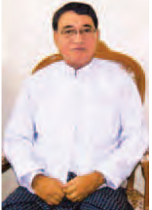
ဂုဏ်ထူးဆောင် ပါမောက္ခ ဒေါက်တာဦးလင်းထွန်းထွန်း။

နေပြည်တော် စည်ပင်သာယာရေးကော်မတီအနေဖြင့် အများပြည်သူ၏ ကျန်းမာရေးစောင့်ရှောက်မှု လုပ်ငန်းများကို အထောက်အကူပြုရန်ရည်ရွယ်ချက်ဖြင့် ဗျူသီရိအထူးကုဆေးရုံကြီးကို ခေတ်မီစက်ကိရိယာများ တပ်ဆင်၍ နေပြည်တော် ဖျဉ်းမနား-တောင်ညိုလမ်းမကြီးဘေး ဇီဝါပန်းအပိုင်းအနီးတွင် ၃-၅-၂၀၁၂ ရက်မှစ၍ ဖွင့်လှစ်ပေးခဲ့သည်။