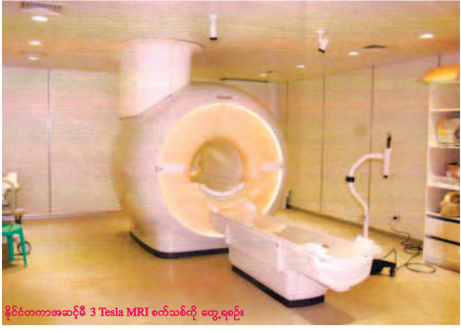
နိုင်ငံတကာအဆင့်မီ 3 Tesla MRI စက်သစ်ကို တွေ့ရစဉ်။

ရောက်စစ်ဆေးနိုင်ပါပြီ” ဟု ပြော ကြားသည်။ နေပြည်တော် ဗျူသီရိအထူးကု ဆေးရုံကြီးအနေဖြင့် ခေတ်မီရောဂါ ရှာဖွေစစ်ဆေးသည့် စက်ကြီးများ တပ်ဆင်အသုံးပြုကာ မြန်မာနိုင်ငံ အရပ်ရပ်မှ ပြည်သူများအား ၂၄ နာရီ ပိတ်ရက်မရှိ အချိန်ပြည့် အထူးကု ဆရာဝန်ကြီးများတာဝန်ယူ၍ သင့်တင့် သောနှုန်းထားများဖြင့် ရောဂါအလိုက် ကျန်းမာရေးစောင့်ရှောက်မှုပေးလျက် ရှိသောကြောင့် ပြည်သူလူထုအားကိုး အားထားရာ အထူးကုဆေးရုံကြီး တစ်ရုံအဖြစ် မလွဲမသွေ ဖြစ်လာ တော့မည်ဖြစ်ကြောင်း . . . . . သတင်းမှတ်စု ဇော်မင်းအောင်(၁၀၇)