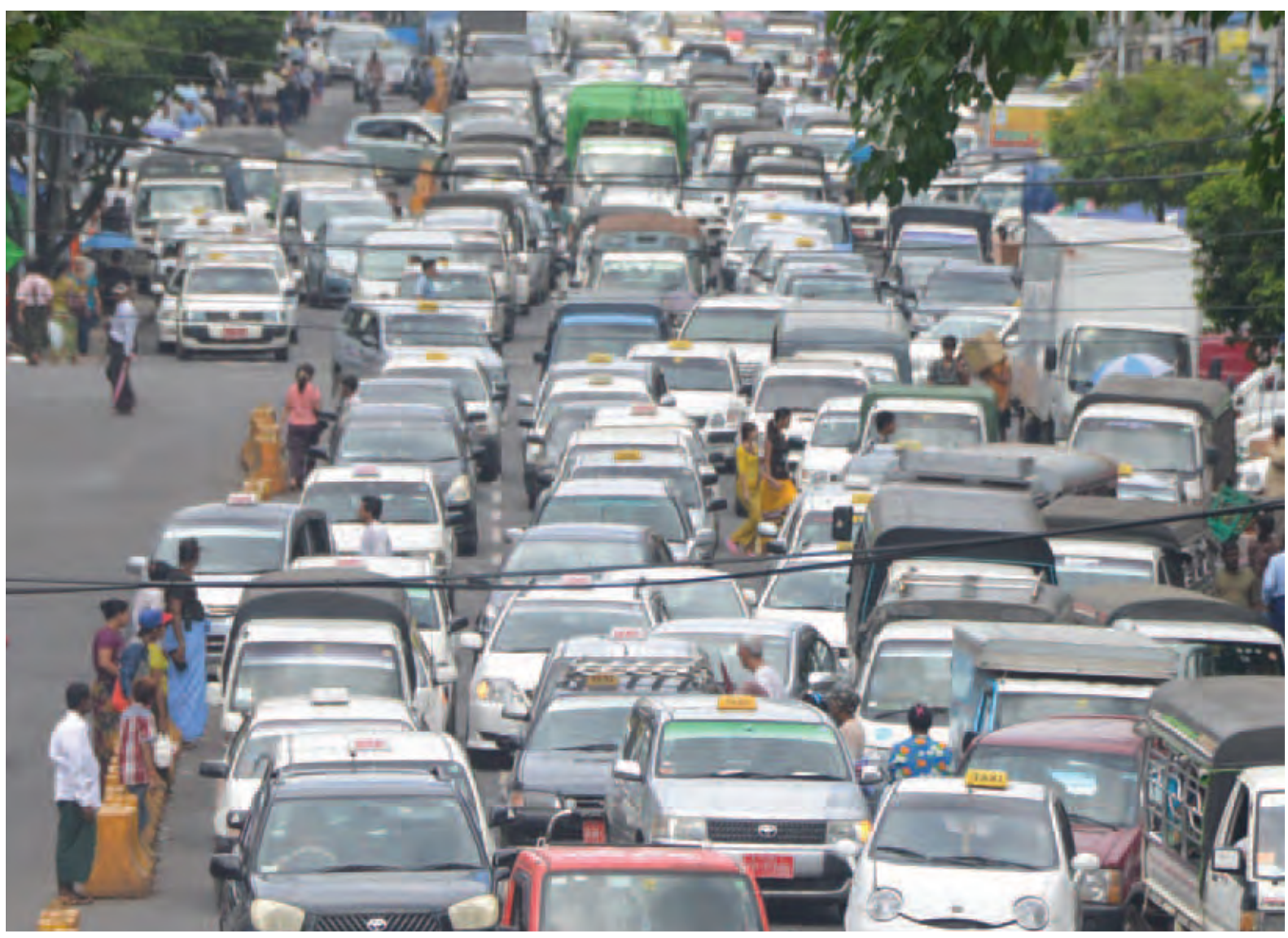
သတင်းဆောင်းပါး - ဆုနှင်းလှ

ယနေ့ရန်ကုန်မြို့တွင် ဖြစ်ပေါ်နေသော ယာဉ်ကြောပိတ်ဆို့နေမှုများသည် တစ်နေ့ထက်တစ်နေ့ ပိုမိုဆိုးရွားလာသည်ကို ရန်ကုန်မြို့တွင် နေထိုင်နေသူများကြုံတွေ့ခံစားနေသည်။ အများပြည်သူတို့မှာ နေ့စဉ်နီးပါး နေအိမ်မှ စတင်ထွက်ခွာခြင်းနှင့် နေအိမ်သို့အပြန် ခရီးများအတွက် ခက်ခဲပန်းနေကြသည်။ မိမိတို့၏ လုပ်ငန်းခွင်များအတွင်း အလုပ်လုပ်နိုင်စွမ်းအားအပြည့်ဖြင့် အလုပ်မလုပ်နိုင်ကြဘဲ အချိန်နှင့် လုပ်အားများစွာ လမ်းပေါ်တွင် ဆုံးရှုံးစေသည်။ ယာဉ်ကြော ပိတ်ဆို့နေမှုများကြောင့် နိုင်ငံ၏ဂျီဒီပီကို ကျဆင်းစေသည်ဟုပင် ပညာရှင်များက ထောက်ပြပြောဆိုကြသည်။ အလုပ်ချိန်မီရန် နေအိမ်မှစောစီးစွာ ထွက်ခွာကြရပြီး အလုပ်မှအပြန် နေအိမ်သို့အချိန်နောက်ကျစွာ ရောက်ရှိကြရသော အဖြစ်၊ ဘတ်စ်ကားနည်းပါး၍ ဝန်ဆောင်မှုညံ့ဖျင်းခြင်းများက တစ်ပုပေါ် နှစ်ပုဆင့်သကဲ့သို့ ရန်ကုန်မြို့နေ ပြည်သူလူထုတို့ ကြိတ်မှိတ်သည်းခံ ဖြတ်ကျော်နေရသော နိစ္စဝေအခက်အခဲများပင်ဖြစ်သည်။ ထိုသို့သော ယာဉ်ကြောပိတ်ဆို့နေမှုများကြောင့်လည်း ယင်းပြဿနာများကို ဖြေရှင်းနိုင်ရန်အလို့ငှာ အချက်အချာကျသော မီးပွင့်လမ်းဆုံများတွင် စာမျက်နှာ ၁၄ ကော်လံ ၁ သို့ ❖