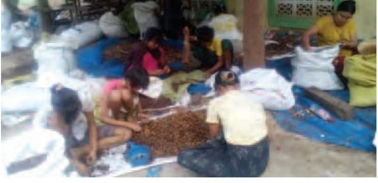
အဝယ်ခိုင်တစ်ဦးက ပြောသည်။ ယင်းကြိမ်သီးအား ကြိုတင်လျှောက်ကုန် စနစ်ကျင့်သုံးရန် မဖြစ်နိုင်သေးသော်လည်း အဆိုပါကြိမ်သီးများကို ဖန်စီလက်ဝတ်ရတနာ နှင့် အလှဆင်ပစ္စည်းများအဖြစ် အသုံးပြုကြ သည်ဟု ကုန်ကြမ်းဈေးကွက်လားရာကလေး လာသော တရုတ်ကုန်သည်များထံမှ သိရ သည်။ ဈေးကွက်ရှိနေဦးမည်ဆိုလျှင် ကြိမ်သီး စုဆောင်းရောင်းချသူများ၊ ဆက်စပ်လုပ်ငန်း လုပ်ကိုင်သူများအားလုံး နှစ်စဉ်အဆင်ပြေနိုင် လိမ့်မည်ဟု ထင်မြင်ကြောင်း ဒေသခံအဝယ် ခိုင်များက ပြောသည်။ မေဇာတု(မကွေး)

သီးကို အဝတ်နဲ့ထုပ်ပြီး တုတ်တွေနဲ့အရင် ရိုက်ပြီးမှ အခွံပြန်ချွတ်ကြတာ။ အလုပ်သမား ခက တစ်ပိဿာ အသန့်ချွတ်ပြီး ကျပ် ၄၀၀ ပေးပါတယ်။ လုပ်သားတစ်ယောက် တစ်နေ့ကို ကျပ်ခြောက်ထောင်ကျော် ဝင်ငွေရနိုင်ပြီး မိသားစုလိုက်လုပ်တဲ့သူတွေဆို တစ်ရက်ကျပ် နှစ်သောင်းကျော်လောက်ရကြပါတယ်။ ကျွန် တော်တို့အတွက်လည်း ခေါက်ချိုးလောက် မြတ်တဲ့အလုပ်ပါ” ဟု မကွေးမြို့ ကန်သာ ရပ်ကွက်နေ ကြိမ်သီးအဝယ်ခိုင်တစ်ဦးက လုပ်ငန်းသဘာဝအား ရှင်းပြသည်။ မန္တလေးဝယ်လက်၊ မူဆယ်ဝယ်လက်ကို အားထားနေရသည့် ကြိမ်သီးလုပ်ငန်းမှာ ဈေး ကွက်အတက်အကျနှင့် ဈေးကွက်ဖြစ်တည်မှု ရှိ-မရှိအခြေအနေများကို တရားသေသုံးသပ် ရန် အခက်အခဲဖြစ်ပြီး ဈေးကွက်အတက်အကျ မြန်ဆန်တတ်သောကြောင့် အော်ဒါရရှိမှုသာ ဝယ်ယူစုဆောင်းမှုအဆင်ပြေနိုင်ကြောင်း