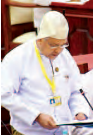
ဒုတိယဝန်ကြီး ဦးဝင်းသန်း။

တာဝါတိုင်တစ်တိုင်နှင့် ဆီးဖြူကုန်းအုပ်စုတွင် တာဝါတိုင်တစ်တိုင် တည်ဆောက်လျက်ရှိပါကြောင်းနှင့် မြို့ပေါ်သာမက ကေးလက်ဒေသအထိ ဗိုတိုင်းတယ်လီဖုန်းကွန်ရက် လွှမ်းခြုံအသုံးပြုနိုင်ရေးအတွက် စီစဉ်ဆောင်ရွက်လျက်ရှိပါကြောင်းဖြင့် ဖြေကြားသည်။