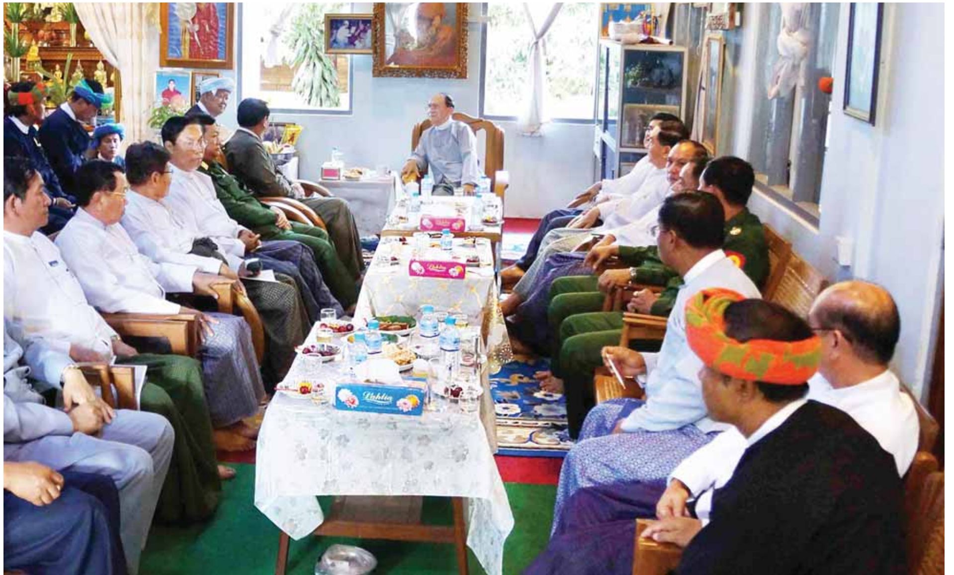
နိုင်ငံတော်သမ္မတ ဦးသိန်းစိန် ပအိုဝ်းအမျိုးသားအဖွဲ့ခေါင်းဆောင် ဦးအောင်ခမ်းထီနှင့်အဖွဲ့အား တွေ့ဆုံဆွေးနွေးစဉ်။ (သတင်း စာမျက်နှာ-၈)