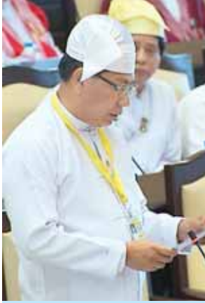
ပြည်ထောင်စုဝန်ကြီး ဦးအေးမြင့်ကြူ။

ပထမအကြိမ် အမျိုးသားလွှတ်တော် (၁၂) ကြိမ်မြောက် ပုံမှန်အစည်းအဝေး (၅၉) ရက်မြောက်နေ့ကို ယနေ့နံနက် ၁၀ နာရီတွင် ဆက်လက်ကျင်းပရာ ပဲခူးတိုင်းဒေသကြီး မဲဆန္ဒနယ်အမှတ် (၁)မှ လွှတ်တော်ကိုယ်စားလှယ် ဦးစောမော်ထွန်း၏ “ ကမ္ဘာပေါ်တွင် ရှေးအကျဆုံး နှစ်သန်းပေါင်း (၄၀) ခန့်သက်တမ်းရှိသည့် လူတူပရိုင်းမိတ်များ တွေ့ရှိခဲ့ခြင်းကို ဆက်လက် သုတေသနပြုရန် အစီအစဉ် ရှိ မရှိနှင့် လူသားမျိုးနွယ်စုများ၏ မည်သည့်မျိုးနွယ်မှ ဆင်းသက်လာသည် ဆိုသောဖြစ်စဉ်ကို ပြန်လည်သုံးသပ်ရန် အစီအစဉ် ရှိ မရှိ ” မေးခွန်းနှင့်စပ်လျဉ်း၍ ပြည်ထောင်စုဝန်ကြီး ဦးအေးမြင့်ကြူက ကမ္ဘာပေါ်တွင်