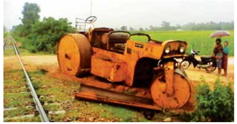
ကုလွင်(ဆွာ)

ရေတာရှည် ဇွန် ၉ ပဲခူးတိုင်းဒေသကြီး ရေတာရှည်မြို့နယ် မြို့လှကျေးရွာအုပ်စု ရန်ကုန်-မန္တလေးရထားလမ်း မိုင်တိုင်အမှတ် (၂၀၃/၈) နှင့် (၂၀၃/၉) အကြားတွင် ဇွန် ၈ ရက် မွန်းလွဲ ၁ နာရီ ၄၅ မိနစ်ခန့်က အမြန်ရထားနှင့် လမ်းကြိုစက်တိုက် တိုက်မိခဲ့ကြောင်း သိရသည်။ ဖြစ်စဉ်မှာ ဆတ်သေ(တောင်ရွာ) အနောက်တောင်ဘက်ရှိ ရန်ကုန်-မန္တလေးကားလမ်းနှင့် ဆက်သွယ်ဖောက်လုပ်လျက်ရှိသော မြေသားလမ်းအား ကျော်သက်(၂၆)နှစ် (စက်ကြီး