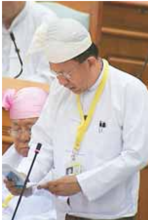
ပြည်ထောင်စုဝန်ကြီး ဒေါက်တာကလော်။

ဝန်ကြီး ဒေါက်တာကလော်က မြန်မာနိုင်ငံအနေဖြင့် ကမ္ဘာ့ဘဏ်၊ အာရှဖွံ့ဖြိုးရေးဘဏ် အပြည်ပြည်ဆိုင်ရာငွေကြေးရန်ပုံငွေ အဖွဲ့ဝင်အဖြစ်ပါဝင်ခဲ့ပြီး အခြေခံအဆောက်အအုံများဖွံ့ဖြိုးရေးအတွက် အဆိုပါငွေကြေးအဖွဲ့များ၏ ထောက်ပံ့ငွေများ၊ ချေးငွေများဖြင့် ဖြည့်ဆည်းဆောင်ရွက်လျက်ရှိပါကြောင်း၊ မြန်မာနိုင်ငံအနေဖြင့် ထည့်ဝင်နိုင်သည့် ငွေကြေးပမာဏဖြစ်သည့်အတွက် အာရှအခြေခံအဆောက်အအုံ ရင်းနှီးမြှုပ်နှံမှုဘဏ် AIIB သို့ ဝင်ရောက်ခြင်းနှင့် မတည်ငွေထည့်ဝင်ခြင်းအပေါ် ခွင့်ပြုသင့်ပါကြောင်းဖြင့် ထောက်ခံဆွေးနွေးသည်။ ထို့နောက် လယ်ယာမြေနှင့် အခြားမြေများ သိမ်းဆည်းခံရမှုကြောင့် ပြည်သူများ နစ်နာမှုမရှိစေရေးအတွက် စုံစမ်းရေးကော်မရှင်၏ အစီရင်ခံစာများအပေါ် လက်ရှိကာလအထိ တိုးတက်ဆောင်ရွက်ပြီးစီးမှုများနှင့် စပ်လျဉ်း၍ ပြည်ထဲရေးဝန်ကြီးဌာန ဒုတိယဝန်ကြီး ဝိုင်းမျိုးချုပ်ကော်မရှင်က မြေကိစ္စ