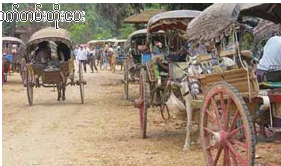
မှာ တိရစ္ဆာန်အစာရှားပါးမှုကြောင့် တွေ့ရခြင်း၊ ရာသီဥတုပြောင်းခြင်းများကြောင့် လွယ်ကူသက်သာသော စက်တပ်ယာဉ်များပြောင်းလဲမောင်းနှင် အသုံးပြုလာကြခြင်းများကြောင့်ဖြစ်ကြောင်း ချောက်မြို့ အနွေးယာဉ်(မြင်းလှည်း) မောင်းသမားတစ်ဦး၏ပြောပြချက်အရသိရသည်။ ကျော်ဇေယျ

တစ်စီးအတွက် ယာဉ်ခွန်၊ ဘီးခွန်၊ မောင်းလိုင်စင်၊ နံပါတ်ပြား စသည့်စုပေါင်းအခွန် ကျပ်၅၅၀၀ ပေးဆောင်စေပြီး ၂၀၁၅-၂၀၁၆ ခုနှစ်အတွက် လိုင်စင်သက်တမ်းတိုးပေးခြင်းဆောင်ရွက်ပေးနေကြောင်း မြို့နယ်စည်ပင်သာယာရေးအရာရှိ ဦးထင်အောင်က ပြောသည်။ ယခင်နှစ်က အနွေးယာဉ်(မြင်းလှည်း) ၄၂ စီး သက်တမ်းတိုးခဲ့သော်လည်း ယခုနှစ်တွင် အနွေးယာဉ်(မြင်းလှည်း) ၂၂ စီးသာ လိုင်စင်သက်တမ်းတိုးခဲ့ကြောင်း ချောက်မြို့နယ်စည်ပင်သာယာရေးအဖွဲ့မှ သိရသည်။ မကွေးတိုင်းဒေသကြီးအတွင်းရှိ မြို့များတွင် ယခင်က အသုံးပြုလာခဲ့သော အနွေးယာဉ်(မြင်းလှည်း) များမှာ မြို့တိုင်းတွင် ကွယ်ပျောက်လှဖြစ်နေပြီး ယင်းသို့ကွယ်ပျောက်လာခြင်းမှာ မြို့များအလိုက် သယ်ယူပို့ဆောင်ရေးလုပ်ငန်းများဆောင်ရွက်သော ပြည်သူများသည် အနွေးယာဉ် (မြင်းလှည်း) များအစား ပိုမိုမြန်ဆန်သော သုံးဘီးဆိုင်ကယ်၊ ဆိုင်ကယ်ကယ်ရီများအား အစားထိုးအသုံးပြုမှုများလာကြခြင်း၊ အနွေးယာဉ်(မြင်းလှည်း) သမားများ