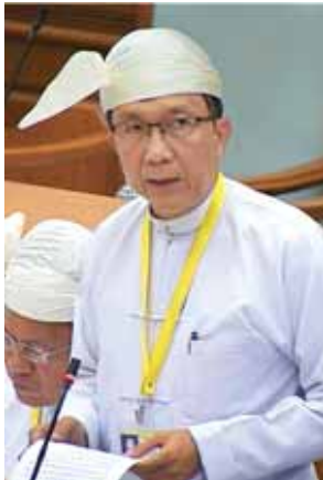
ပြည်ထောင်စုဝန်ကြီး ဦးဝင်းရှိန်။

အမျိုးသားစီမံကိန်းနှင့် စီးပွားရေးဖွံ့ဖြိုးတိုးတက်မှုဝန်ကြီးဌာန ပြည်ထောင်စု