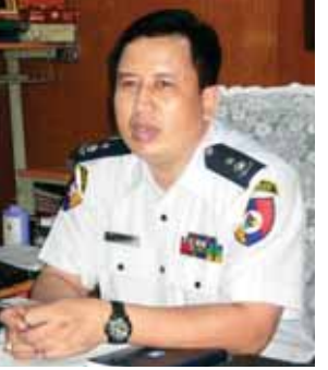
ဒုတိယရဲမှူးကြီး လင်းထွဋ်

ဖြေ။ ။ရန်ကုန်တိုင်းဒေသကြီးအတွင်း စည်ပင်သာယာနယ်နိမိတ်အတွင်းမှာ ဟွန်းသံကင်းမဲ့ဖို့အဖြစ် သတ်မှတ်ထားခဲ့ပေမယ့် ဟွန်းတီးနေကြတုန်းပါ။ ဥပဒေနဲ့အညီ အရေးယူပါတယ်။ တီးတဲ့သူက အများကြီးပါ။ မီးပွိုင့်တွေ၊ လမ်းဆုံတွေမှာ ယာဉ်ထိန်းတပ်ဖွဲ့ဝင်တွေက သုံး၊ လေးဦး ရှိတယ်။ ဒီထဲမှာ ပူးပေါင်းဖမ်းဆီးရေးအဖွဲ့ရှိလို့ရှိရင် တစ်ဖွဲ့ကို ၁၂ ဦး ရှိတဲ့အဖွဲ့ တာဝန်ချထားပါတယ်။ ၁၀ ဦးထားပါဦး၊ တကယ်တမ်း ပြုကျလာရင် အကုန်လုံး ဟွန်းတီးတာကို မဖမ်းနိုင်ပါဘူး။ လိုက်ဖမ်းတဲ့အခါမှာ သက်သေအထောက်အထားလည်း မရှိဘူး။ ဥပမာ - ရှေ့ကား ဟွန်းတီးတယ်။ နောက်ကားတွေကျတော့ ဇေဝေပုံဖြစ် ကုန်တယ်။ ဘယ်ကားတွေကို အတိအကျအရေးယူနိုင်လဲဆိုတော့ ဘတ်စ်ကားတွေပါ။ ကျန်တဲ့ ကားသေးတွေကို ဖမ်းဆီးရာမှာ ခက်ခဲတယ်။ အချို့ကားတွေက ဟွန်းမတီးတာရှိပါတယ်။ မီးပွိုင့်လမ်းဆုံမှာ စောင့်ရတာကြာလို့ တီးတဲ့သူလည်း ရှိတယ်။ ဖမ်းဆီးအရေးယူမှု လုပ်ပါတယ်။ သို့သော်လည်း အကုန်လုံးကို တစ်ချိန်တည်း တစ်ပြိုင်တည်း စည်းကမ်းတကျ ရှိအောင်လုပ်ဖို့ကတော့ မလုပ်နိုင်သေးပါဘူး။ တစ်ဖက်ကလည်း ဖမ်းဆီးအရေးယူဖို့သက်သေအထောက်အထားလည်း လိုတယ်ဆိုတော့။ ကားအစီး ၂၀ လောက်ပြိုင်တီးရင် ဒီပေါ်မှာ လိုက်ပြီး ဒဏ်ရိုက်လို့မရဘူး။ စည်းကမ်းထိန်းသိမ်းရေးကို မြို့ထဲမှာလုပ်ဖို့ ခက်ခဲနေတယ်။ ဘာကြောင့်လဲဆိုတော့ စည်းကမ်းထိန်းသိမ်းပြီး တားဆီးအရေးယူနေရင် ကျန်ကားတွေ ယာဉ်ကြောပိတ်ဆို့စေမှာဖြစ်တဲ့ အတွက် တတ်နိုင်သလောက်ရှောင်ရပါတယ်။ စည်းကမ်းထိန်းသိမ်းရာမှာ ပညာပေးစည်းကမ်းထိန်းသိမ်းဖို့က