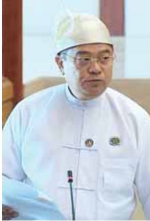
လွှတ်တော်ကိုယ်စားလှယ် ဦးစောမော်ထွန်း။

သုတေသနပြုရန် ယဉ်ကျေးမှုဝန်ကြီးဌာနအနေဖြင့် အစီအစဉ် မရှိပါကြောင်း ဖြေကြားပြီး ပုံတောင်ပရိုင်းမိတ် ကျောက်ဖြစ်ရုပ်ကြွင်း ကွင်းဆင်းရှာဖွေလေ့လာမှု နောက်ခံသမိုင်းအကျဉ်းကိုလည်းကောင်း၊ နိုင်ငံတကာပညာရှင်များနှင့် ပူးပေါင်းကာ နှစ်အလိုက် ဆောင်ရွက်ခဲ့သည့် လုပ်ငန်းဆောင်ရွက်ချက်ဆိုင်ရာများကိုလည်းကောင်း ရှင်းလင်းတင်ပြသည်။ ထို့နောက် အမျိုးသားလွှတ်တော် ဥပဒေကြမ်း ကော်မတီအဖွဲ့ဝင် တပ်မတော်သားကိုယ်စားလှယ် ဝိုင်းမျိုးကြီးခင်စိုးက ရှေးဟောင်းဝတ္ထုပစ္စည်းများ ကာကွယ်ထိန်းသိမ်းရေး ဥပဒေကြမ်းနှင့် စပ်လျဉ်း၍ ဥပဒေကြမ်းကော်မတီ၏ အစီရင်ခံစာကို ပြန်လည် ဖတ်ကြားတင်သွင်းရာ