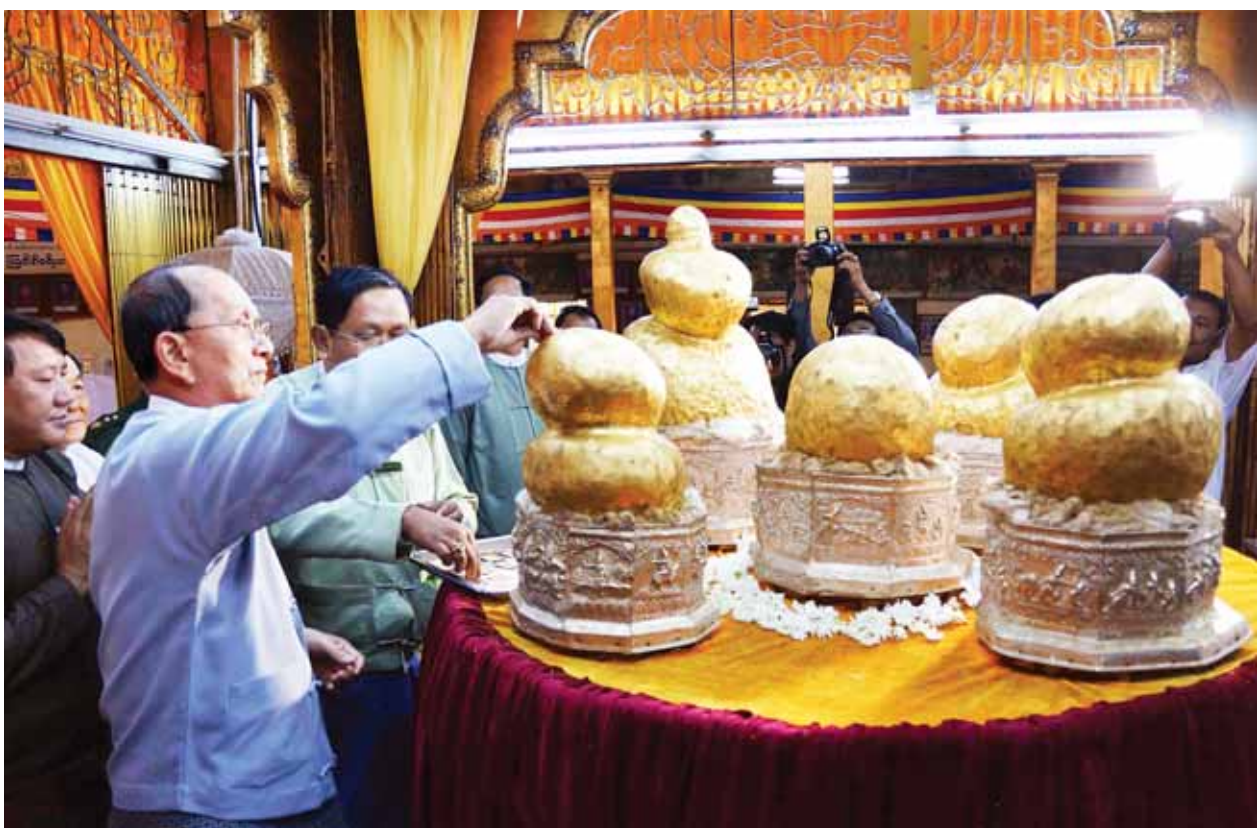
နိုင်ငံတော်သမ္မတ ဦးသိန်းစိန် အင်းလေးဖောင်တော်ဦးစေတီတော်၌ ရွှေသင်္ကန်းကပ်လှူပူဇော်စဉ်။ (ပြန်/ဆက်)

ထို့နောက် နိုင်ငံတော်သမ္မတနှင့် အဖွဲ့ဝင်များသည် ဆရာတော်ကြီး အမျိုးပြုသော ဆရာတော်၊ သံဃာ တော်များအား လှူဖွယ်ပစ္စည်းများ ဆက်ကပ်လှူဒါန်းကြကာ လှူဒါန်းမှု