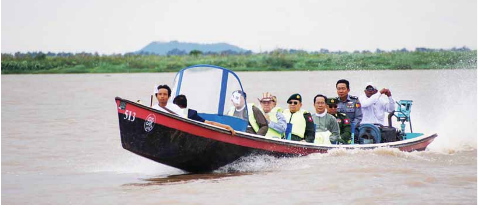
နိုင်ငံတော်သမ္မတ ဦးသိန်းစိန် အင်းလေးကန်အတွင်း လှည့်လည်ကြည့်ရှုစစ်ဆေးစဉ်။ (ပြန်/ဆက်)