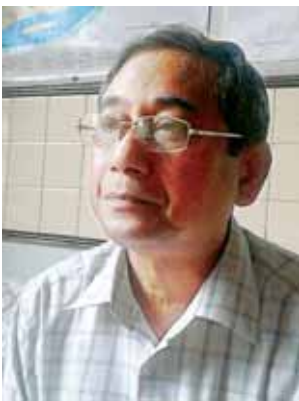
ဦးသန်းဦး

ထိခိုက်နိုင်တယ်။ အဲလိုပဲ အိမ်ရာဈေးနှုန်းဆွဲချတာ ဆွဲချတိုင်းလည်း မကောင်းဘူး။ သူ့ဟာသူ ပုံမှန်လေးဈေးကွက်သဘောတရားအရ ထိန်းကျောင်းပြီးတော့မှ ပုံမှန်အနေအထားလေး၊ သာမန်လူတွေလည်း လက်လှမ်းမီတဲ့ အနေအထားမျိုး၊ ပိုင်ဆိုင်မှုကိုလည်း အာမခံနိုင်တဲ့ အနေအထားမျိုးဖြစ်သွားမှသာလျှင် မှန်ကန်တဲ့ စီးပွားရေးအနေအထားဖြစ်မယ်။