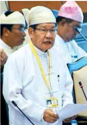
ဒုတိယဝန်ကြီး ဦးခင်ဇော်

အစည်းအဝေးတွင် ပဲခူးတိုင်းဒေသ ကြီး မဲဆန္ဒနယ်အမှတ်(၁)မှ ဦးစော မော်ထွန်း၏ နိုင်ငံတစ်ဝန်း မြို့နယ် များ၏ မြေအောက်ရေထုတ်ယူ သုံးစွဲမှုကို သုတေသနပြုလုပ်၍ မှတ်တမ်းတင်ရန် အစီအစဉ် ရှိ၊ မရှိ မေးခွန်းနှင့်စပ်လျဉ်း၍ လယ်ယာစိုက် ပျိုးရေးနှင့် ဆည်မြောင်းဝန်ကြီးဌာန ဒုတိယဝန်ကြီး ဦးခင်ဇော်က မြေ အောက်ရေနှင့်သက်ဆိုင်သည့် ဥပဒေ ပြုမှု၊ သုတေသနလုပ်ငန်းများ ဆောင်