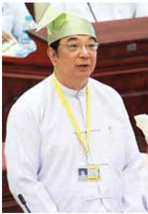
ဒုတိယဝန်ကြီး ဒေါက်တာမောင်မောင်သိမ်း

ကြည့်မြင်တိုင်မဲဆန္ဒနယ်မှ ဦးသန်းစိန်၏ ကြည့်မြင်တိုင်တစ်ဖက်ကမ်းရှိ ကျေးရွာများအတွက် သောက်သုံးရေလုံလောက်မှုရရှိရန် သက်ဆိုင်ရာ ပြည်ထောင်စုအစိုးရအဖွဲ့မှ စီမံဆောင်ရွက်ထားရှိမှုအခြေအနေကို သိလိုခြင်း မေးခွန်းနှင့်စပ်လျဉ်း၍ သမ္မတရုံးဝန်ကြီးဌာန ဒုတိယဝန်ကြီး ဦးကျော်ကျော်ဝင်း က ကြည့်မြင်တိုင်တစ်ဖက်ကမ်းတွင် ရပ်ကွက်ပေါင်း (၁၁)ရပ်ကွက်ရှိပြီး လူဦးရေ ၄၀၀၀၀ ကျော်နေထိုင်ပါကြောင်း၊ အဆိုပါရပ်ကွက်များအတွက် သောက်သုံးရေရရှိရန် ရေကန် ၅၀ ကျော်ရှိပါကြောင်း၊ ယခုနှစ်နေရာသီတွင် ရေဂါလန် သုံးသန်းခွဲကျော် ရန်ကုန်မြို့တော်စည်ပင်သာယာရေးကော်မတီနှင့်