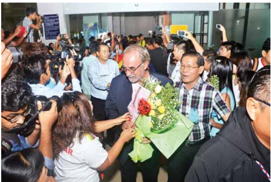
မြန်မာယူ-၂၀ အသင်းနည်းပြအား ပန်းစည်းဖြင့် ကြိုဆိုကြစဉ်။

မြန်မာဆိုတာ စိတ်ဓာတ်က ပြင်းထန်တယ်။ တက်ကြွတယ်ဆိုတာ အခုပွဲစဉ်တွေကတစ်ဆင့် ကမ္ဘာကို ပြနိုင်ခဲ့တယ်။ ကမ္ဘာ့ဖလားဆိုတာ မြန်မာအသင်းအတွက် အခုမှပထမဆုံးအကြိမ် ဝင်ရောက်ယှဉ်ပြိုင်ရတဲ့အတွက် လိုအပ်ချက်တွေ၊ အတွေ့အကြုံတွေတော့ အများကြီးလိုပါသေးတယ်။ ဒီလိုကမ္ဘာ့ဖလားမှာ ဝင်ရောက်ယှဉ်ပြိုင်ခွင့်ရတာကိုပဲ ဂုဏ်ယူပါတယ်။ နောက်ထပ်လေးငါးနှစ်လောက် နေရင်တော့ အင်မတန်ကောင်းလာမှာပါ။ အတွေ့အကြုံပိုင်းနဲ့ လူခန္ဓာကိုယ်အရပ်အမောင်း ကွာခြားမှုတွေကြောင့်သာ ဒီအဆင့်နဲ့ပြန်လာခဲ့ရတာပါ။ စိတ်ဓာတ်နဲ့ ကစားကွက်အရတော့ မရှုံးခဲ့ပါဘူး။ ဒါဟာ ကမ္ဘာ