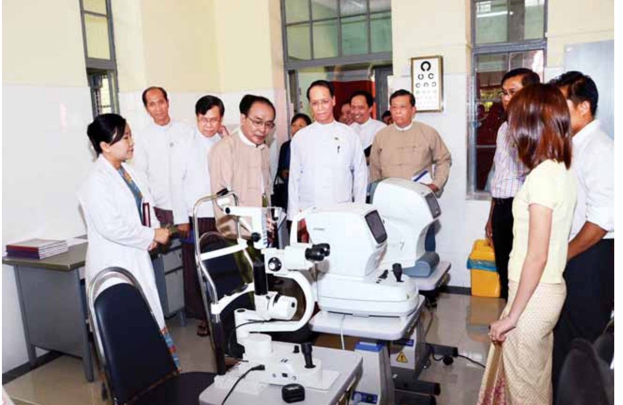
ဒုတိယသမ္မတ ဒေါက်တာစိုင်းမောက်ခမ်း တက္ကသိုလ်များဆေးရုံ(ရန်ကုန်)တွင် ကြည့်ရှုစစ်ဆေးစဉ်။ (သတင်းစဉ်)