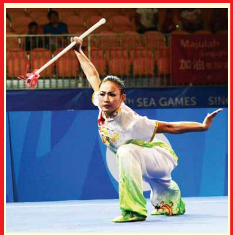
(၂၀)ကြိမ်မြောက် အရှေ့တောင်အာရှ အားကစားပြိုင်ပွဲတွင် ရွှေတံဆိပ်ဆု ရရှိခဲ့သည့် ဂုဏ်အောင်အာရှ အားကစားမယ် စန္ဒီဦးပြိုင်ပွဲဝင်နေစဉ်။