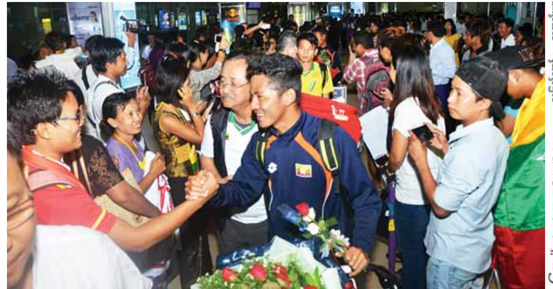
မြန်မာယူ-၂၀ အသင်းအား လာရောက်ကြိုဆိုသူများနှင့်အတူ တွေ့ရစဉ်။ (သတင်း စာမျက်နှာ - ၆)