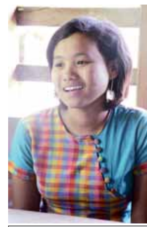
မယမင်းသူ