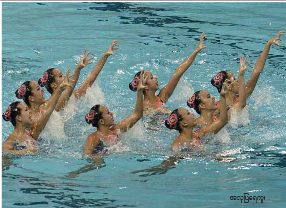
အလှပြရေကူး