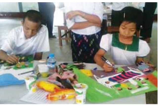
ပြန်လည်ထူထောင်ရေးအဖွဲ့