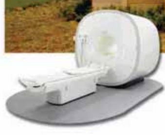
Philips Multiva MR