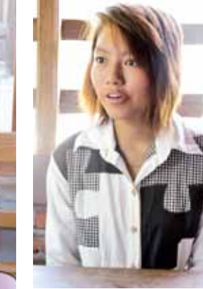
မစိုးသက်ယု

“စာမေးပွဲမှာကတည်းက အင်္ဂလိပ် စာနဲ့ ရူပဗေဒဘာသာရပ်ကို အားမရခဲ့