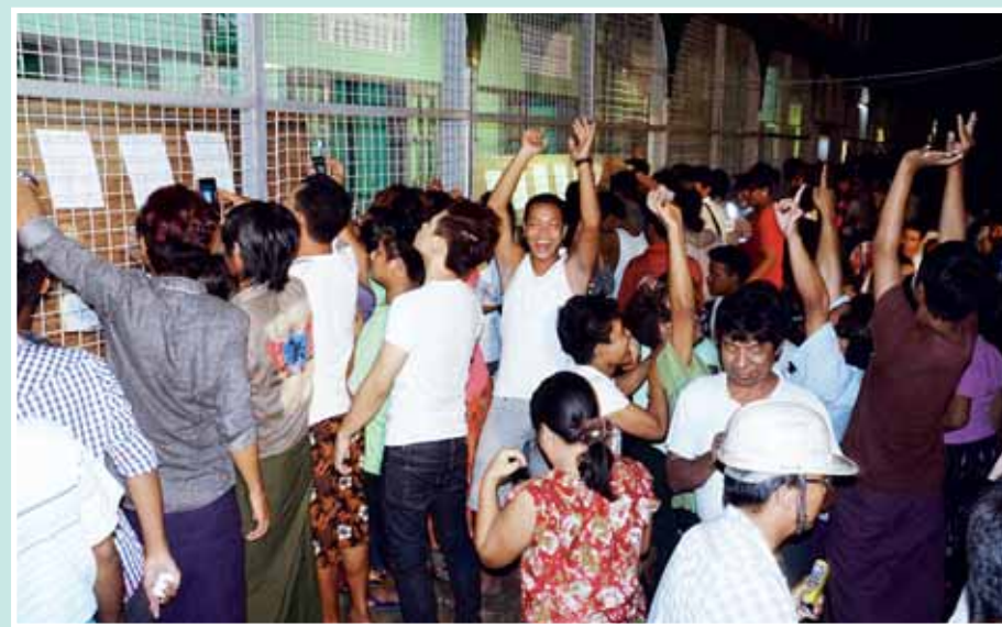
ရန်ကုန်တိုင်းဒေသကြီး သန်လျင်မြို့နယ်ပညာရေးမှူးရုံးတွင် ၂၀၁၅ ခုနှစ် တက္ကသိုလ်ဝင်စာမေးပွဲအောင်စာရင်း လာရောက်ကြည့်ရှုကြသော ကျောင်းသား ကျောင်းသူများနှင့် မိဘအုပ်ထိန်းသူများကို တွေ့ရစဉ်။ သန်းဝင်း(သန်လျင်)

မီးရထားလမ်းပိုင်းများ ပိုမိုတိုးတက် တောင်းမွန်ရေးတို့အတွက် AILTM ခေတ်မီစက်ကြီးများဖြင့် အငယ်တန်း အင်ဂျင်နီယာ(၂) ဦးချစ်ကိုကိုနှင့် ကျွမ်းကျင်လုပ်သားများက စဉ်ဆက် မပြတ် ပြုပြင်ဆောင်ရွက်လျက်ရှိရာ ဇွန်လ ပထမပတ်တွင် တောကွဲအင်း၊ ကညွတ်ကွင်း - ညောင်ပင်သာ - ဖြူ မီးရထားသံလမ်းပိုင်းများအား ပြုပြင် ဆောင်ရွက်လျက်ရှိကြောင်း သိရ သည်။(အောက်ပုံ) (ဖြူမြင့်ဦး)