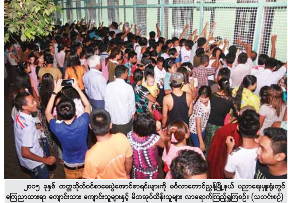
၂၀၁၅ ခုနှစ် တက္ကသိုလ်ဝင်စာမေးပွဲအောင်စာရင်းများကို မင်္ဂလာတောင်ညွန့်မြို့နယ် ပညာရေးမှူးရုံးတွင် ကြေညာထားရာ ကျောင်းသား ကျောင်းသူများနှင့် မိဘအုပ်ထိန်းသူများ လာရောက်ကြည့်ရှုကြစဉ်။ (သတင်းစဉ်)

ဦးဆောင်သောအဖွဲ့သည် မြန်မာနိုင်ငံဆိုင်ရာ ဘင်္ဂလားဒေ့ရှ်သံရုံးက ပေးပို့ထားသည့် ဘင်္ဂလားဒေ့ရှ်နိုင်ငံသား လေ့စားခရီးသွားလာသူများ၏ ကိုယ်ရေးအချက်အလက်များအား တိုက်ဆိုင်စစ်ဆေးခြင်း၊ နိုင်ငံသားမှန်ကန်မှု ရှိမရှိ မေးမြန်းစိစစ်ခြင်းများပြုလုပ်ခဲ့ကြောင်း၊ စိစစ်မှုများပြုလုပ်ပြီးပါက ၎င်းတို့ မူလလာရောက်သည့်နေရာများသို့ အမြန်ပြန်လည်လွှဲပြောင်းပို့ဆောင်နိုင်ရန် သံတမန် နည်းလမ်းနှင့် လုပ်ငန်းစဉ်များနှင့်အညီ ဆက်လက်ဆောင်ရွက်လျက်ရှိကြောင်း သိရသည်။ (သတင်းစဉ်)