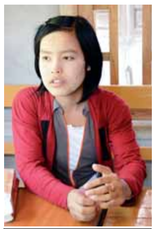
မနန္ဒာဗိုလ်

၂၀၁၅ ခုနှစ်အတွက် တက္ကသိုလ် ဝင်စာမေးပွဲ အောင်စာရင်းရလဒ် များအပေါ် ဝမ်းသာကြရသူများ အတွက် ထပ်တူဂုဏ်ထူးဝမ်းမြောက်ရ ပါကြောင်းနှင့် ကျဆုံးသူများအတွက် လည်း အခွင့်အရေးရှိနေပါသေးသည့် အတွက် အားသစ်လောင်းကြိုးစား ကြစေလိုပါကြောင်းဖြင့် တိုက်တွန်း ရေးသားလိုက်ရပါတယ်။ ။