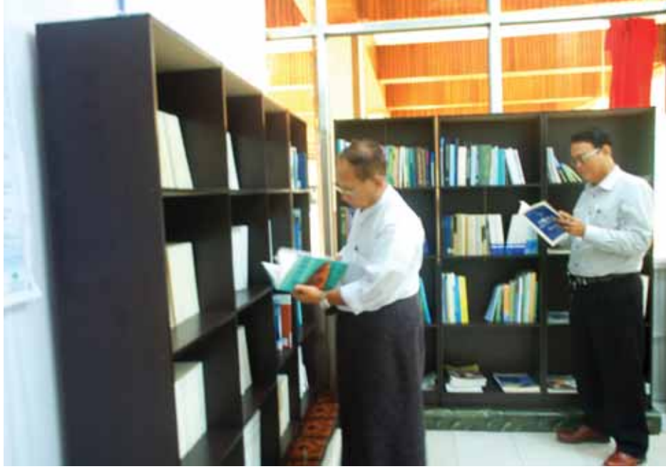
လည်း အများကြီးအသုံးတည့်မယ် ထင်ပါတယ်။ ကိုယ်တိုင် အသုံးပြုလို့ရမယ့် နည်းစနစ်တွေကို ပုံတွေနဲ့ ရှင်းပြထားတဲ့အတွက် ကြည့်ရုံနဲ့တင် ရှင်းရှင်းလင်းလင်း တွေ့ရတယ်။

“အခုဒီစာကြည့်တိုက်မှာတွေ့ရတဲ့ စာအုပ်တွေထဲမှာ ငါးမွေးမြူရေးပညာရှင်တွေက သုတေသနပြုလုပ်ပြီး ဖော်ပြထားတာ အများကြီးကောင်းပါတယ်။ ဒီမှာ နိုင်ငံတကာက သုတေသနစာတမ်းရှင်တွေရဲ့ စာတမ်းပေါင်းများစွာကိုလည်း လေ့လာနိုင်မှာပါ။ လုပ်ငန်းရှင်တွေအတွက်