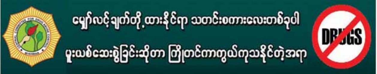
ကျောင်းသားလူငယ်များအား အသိပညာပေးရေးအဖွဲ့

မူးယစ်ဆေးဝါးနှင့် စိတ်ကိုပြောင်းလဲစေသော ဆေးဝါးများအန္တရာယ် တားဆီးကာကွယ်ရေးဗဟိုအဖွဲ့ ဥက္ကဋ္ဌ ပြည်ထဲရေးဝန်ကြီးဌာန ပြည်ထောင်စု ဝန်ကြီး ဒုတိယဗိုလ်ချုပ်ကြီးကိုကိုဇီဦးဆောင်မှုဖြင့် လူထုလှုပ်ရှားမှုအသွင်ဖြင့် မူးယစ်ဆေးဝါးတိုက်ဖျက်ရေး အထူးလုပ်ငန်းစီမံချက်(ယင်းမာ)ကို မူးယစ်ဗဟို အဖွဲ့ အစည်းအဝေး(၁/၂၀၁၅)တွင် အတည်ပြုခဲ့ပြီး လုပ်ငန်းတာဝန်များ ခွဲဝေသတ်မှတ်ပေးခဲ့ပါသည်။ အဆိုပါ ယင်းမာစီမံချက်ကို ၂၆-၅-၂၀၁၅ ရက် နေ့မှ ၂၆-၆-၂၀၁၅ ရက်နေ့အထိ ဆောင်ရွက်လျက်ရှိပြီး အထက်မြန်မာပြည်၊ အောက်မြန်မာပြည်၊ ရှမ်းပြည်နယ်တို့ရှိ ဇန်နဝါရီလနှင့် နိုဝင်ဘာလများအတွက် မူးယစ်ဗဟိုအဖွဲ့အစည်းအဖွဲ့များအလိုက် ပထမရက်သတ္တပတ် အတွင်း အောက်ပါအတိုင်းဆောင်ရွက်ခဲ့ကြောင်း သတင်းရရှိသည် -