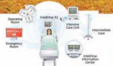
Philips Monitoring Systems