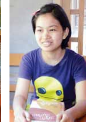
မထက်ထက်ကျော်

“သင်္ချာ၊ ဓာတု၊ ရူပနဲ့ ဇီဝဘာသာရပ် တွေ ဂုဏ်ထူးထွက်တာပါ။ ဒီထက် မျှော်လင့်ထားခဲ့ပေမယ့် ကျေနပ်ပါ တယ်။ သင်ကြားရတဲ့ဘာသာရပ်တွေ ထဲမှာ သင်္ချာဘာသာကို စိတ်ဝင်စား ဆုံးဖြတ်ပြီး အခက်ခဲဆုံးကတော့ ဓာတု ဗေဒဘာသာပါ။ စာကျက်တဲ့အခါ အချိန်ဖွဲ့နဲ့ အတိအကျကျက်ပြီး စာတွေကိုလည်း အမြဲအလွတ်ပြန်ရေး