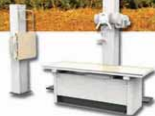
Philips Primary Diagnost DR