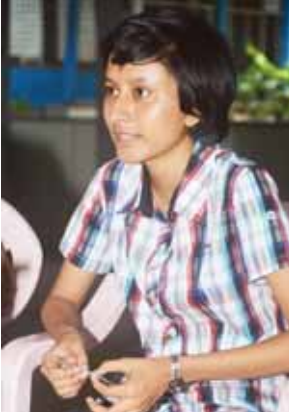
မအေးမြတ်စိုး

“အထက (၄) တာမွေကို ၂၀၀၉ ခုနှစ်မှာ စတင်ရောက်ရှိခဲ့တာ ငါးတန်း၊ ခြောက်တန်း၊ ခုနစ်တန်း၊ ရှစ်တန်း၊ ကိုးတန်းအထိ ပထမ၊ ဒုတိယ၊ တတိယ စဉ်ဆက်မပြတ် ရရှိပါတယ်။ သူငယ်တန်းကနေ စတုတ္ထတန်းအထိ အမက(၁၄) တာမွေတွင် ပညာသင်ကြားခဲ့ရာမှာလည်း ပထမ၊ ဒုတိယ၊ တတိယ ရရှိပါတယ်။ ငယ်စဉ်ကတည်းက သင်ကြားပေးခဲ့တဲ့ အမကမှ ဆရာ ဆရာမတွေကို လည်း ကျေးဇူးတင်ပါတယ်။ အလယ် တန်းနဲ့ အထက်တန်းပညာကို အထက (၄)တာမွေမှ ဆရာမတွေရဲ့ သင်ကြား ပြသမှုကို ဂရုစိုက်လေ့လာ မှတ်သားပြီး ကြိုးစားခဲ့ပါတယ်။ ပြင်ပကျွန်ုပ်တို့ အငွေမတန်းရောက်မှ အင်္ဂလိပ်စာကျွမ်းကျင်အောင် ယူခဲ့ တယ်။ ကျောင်းမှာ ဆရာမတွေ က စာသင်ချိန် ခုနစ်ချိန်ကို ကျောင်းသားတိုင်းကို လေ့လာပြီး အနီးကပ် ချဉ်းကပ်သင်ကြားပေးမှု တွေကြောင့် ပိုမိုပြီး ကြိုးစားလို့မြင် ပေါ်ခဲ့လို့ ကျောင်းချိန်များကို မလစ် ဟင်းစေဘဲ အချိန်မှန်မှန်တက်ခဲ့တဲ့ အတွက် မေးခွန်းကို ဘယ်လိုဖြေရ မယ်၊ ဘယ်လိုဖြေရင် အမှတ်ပိုရမယ် စတဲ့အကြောင်းအရာတွေပါ အသေး စိတ်သိရှိခဲ့ရခဲ့ပါတယ်။ နှစ်စက တည်းက စာကျက်ချိန်ကို ၁၂ နာရီ အထိသတ်မှတ်ခဲ့ပြီး နံနက် လေးနာရီ ထ၍ စာကိုပုံမှန်ကျက်ခဲ့ပါတယ်။ ဒီဇင်ဘာလမှစ၍ အိပ်ရေးဝဝအိပ်ခဲ့ပြီး