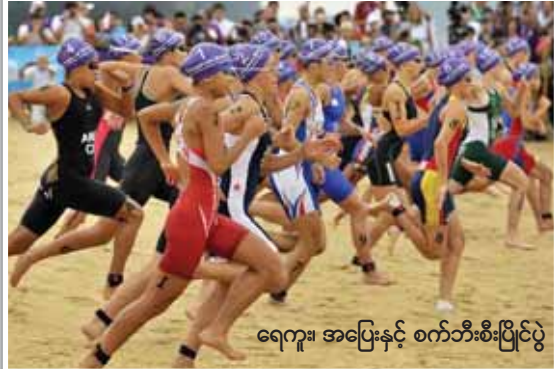
ရေကူး၊ အပြေးနှင့် စက်ဘီးစီးပြိုင်ပွဲ