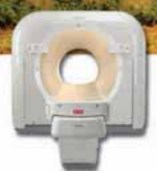
Philips Ingenuity Elite CT