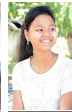
မဂ္ဂနိုဗိုင်းမြို့