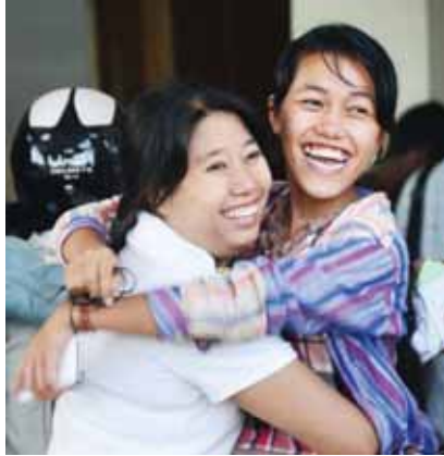
တက္ကသိုလ်ဝင်စာမေးပွဲ အောင်မြင်ခဲ့သော ကျောင်းသူတို့ ပျော်ရွှင်နေကြစဉ်။

၂၀၁၅ ခုနှစ် တက္ကသိုလ်ဝင်စာမေးပွဲ အောင်စာရင်းများကို ယနေ့နံနက်ပိုင်းတွင် ပြည်နယ်နှင့်တိုင်းဒေသကြီးအလိုက် တစ်ပြိုင်တည်းထုတ်ပြန်ခဲ့သည်။