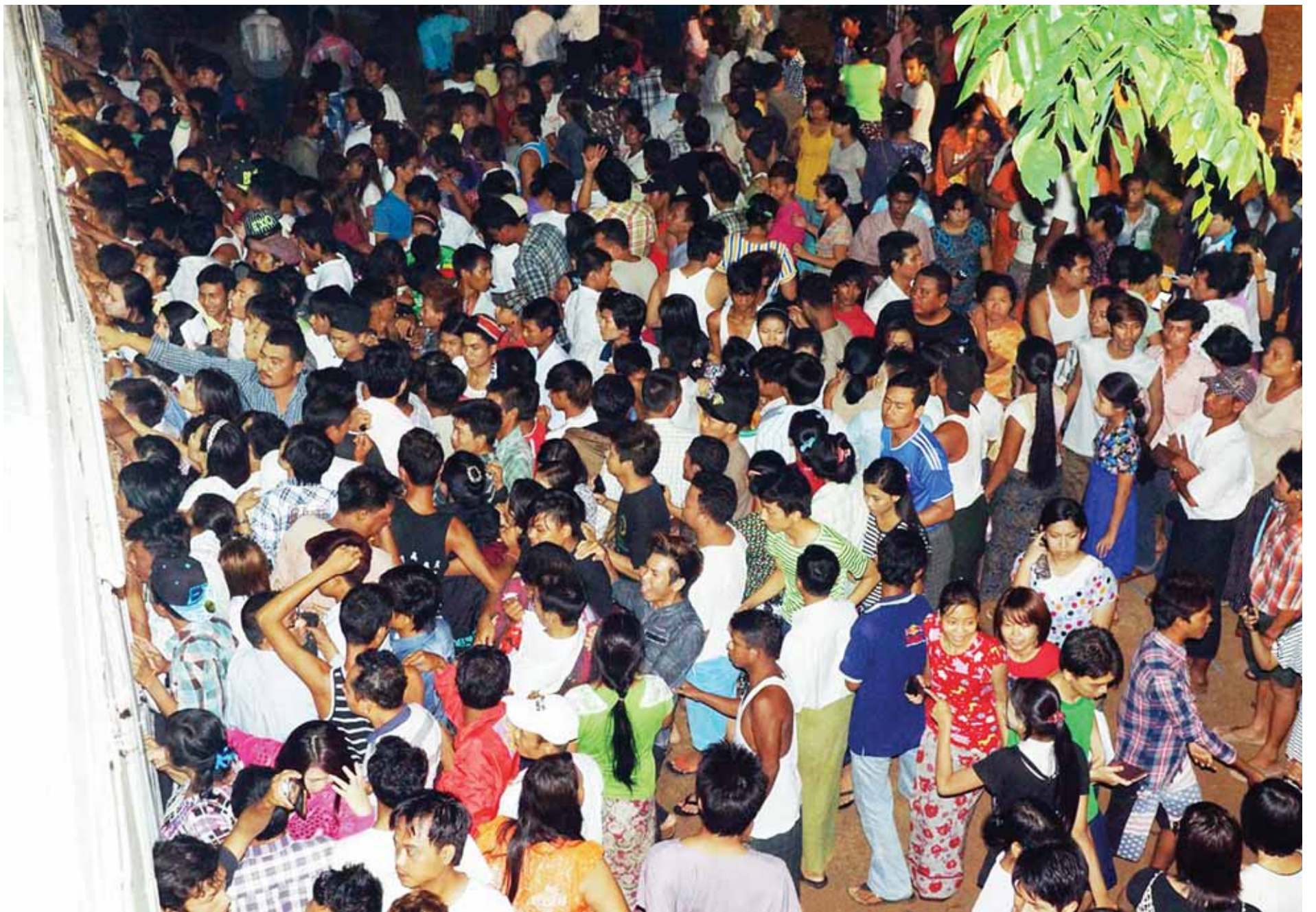
၂၀၁၅ ခုနှစ် တက္ကသိုလ်ဝင်စာမေးပွဲ အောင်စာရင်းများကို ရန်ကုန်တိုင်းဒေသကြီးအတွင်းရှိ သက်ဆိုင်ရာကျောင်းအသီးသီးတွင် ကြေညာထားရာ သန်လျင်မြို့နယ် ပညာရေးမှူးရုံးတွင် အောင်စာရင်းလာရောက်ကြည့်ရှုကြသော ကျောင်းသား ကျောင်းသူများနှင့် မိဘအုပ်ထိန်းသူများကို တွေ့ရစဉ်။

၂၀၁၅ ခုနှစ် တက္ကသိုလ်ဝင်စာမေးပွဲ အောင်စာရင်းများကို ယနေ့နံနက် ၆ နာရီတွင် ပြည်နယ်နှင့် တိုင်းဒေသကြီးများအလိုက် သက်ဆိုင်ရာကျောင်းများတွင် အသီးသီးထုတ်ပြန်ထားသည်။ ယခုနှစ်တွင် စာမေးပွဲဖြေဆိုသူ ၅၉၇၉၄၆ ဦးရှိသည့်အနက် ၂၂၄၈၄၇ ဦးအောင်မြင်ခဲ့သဖြင့် ယခင်နှစ်များနှင့်မတူ အောင်ချက်ရာခိုင်နှုန်း မြင့်မားလာသည်ကို တွေ့ရသည်။ ယခင်နှစ် ၂၀၁၄ အောင်ချက်ရာခိုင်နှုန်းမှာ ၃၁ ဒသမ ၆၇ ဖြစ်ပြီး ယခုနှစ် ၂၀၁၅ အောင်ချက် ရာခိုင်နှုန်းမှာ ၃၇ ဒသမ ၆၀ ဖြစ်၍ နှစ်အလိုက်တက္ကသိုလ်ဝင်စာမေးပွဲများတွင် အမြင့်ဆုံးနှုန်းရောက်လာသည်။ စာမျက်နှာ ၁၁ ကော်လံ ၁ သို့ ❀