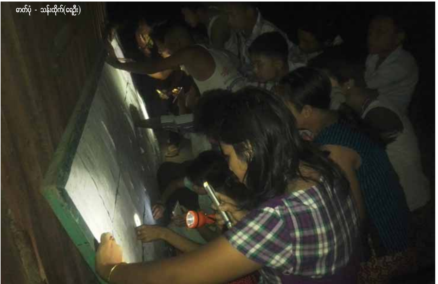
တတ်ပုံ - သန်းထိုက်(ရေဦး)

မနေ့ညက ကျွန်တော် တစ်ညလုံး အိမ်မပျော်ခဲ့ပါ။ စိုးရိမ်ပူပန်ခြင်းများစွာနှင့် လွင့်ပျောက်နေသည့် အတွေးများကြောင့် ညတာရှည်လွန်းသည်ဟု ထင်မိပါသည်။ ထိုည မြန်မြန်ကုန်လွန်ပါစေဟု ဆုတောင်းရင်း နံနက်မိုးသောက် အလင်းရောက်ခဲ့ပါသည်။ အိမ်မပျော်ခဲ့သည့် အကြောင်းရင်းမှာ ယနေ့တက္ကသိုလ်ဝင်(၁၀တန်း) စာမေးပွဲအောင် စာရင်းထွက်မှာဖြစ်သောကြောင့်တည်း။ စာမေးပွဲနှင့် ပတ်သက်၍ ပြောရမည်ဆိုလျှင် ကျွန်တော်ကိုယ်တိုင် မိမိကိုယ်ကို ယုံကြည်မှုနည်းခဲ့သည်မှာ အမှန်ဖြစ်ပါသည်။ တက္ကသိုလ်ဝင်စာမေးပွဲကို ချွေးသီးချွေးပေါက်ကျ အောင် ဖြေခဲ့ရသည့်အဖြစ်က ကျွန်တော်၏ အောင်စိတ်ကို လျော့ကျစေပါသည်။ အမေ့ဆန္ဒကိုပြည့်ဆည်းလိုသည့် လွန်ကဲသောစိတ်က စာမေးပွဲခန်းအတွင်း တုန်လှုပ်မိပါသည်။ သို့သော်ကျွန်တော် စာမေးပွဲအောင်ခဲ့ပါပြီ။ ကျွန်တော်နေထိုင်သည်မှာ ရန်ကုန်မြို့ပြင် လှိုင်သာယာမြို့နယ် ဆင်ခြေဖုံးရပ်ကွက်လေးတွင်ဖြစ်ပါသည်။ ထရီကာ၊ သွပ်မိုး အိမ်ကျဉ်းကျဉ်းလေးတွင် ကျွန်တော်၏မိသားစု ခြောက်ယောက်နှင့်အတူနေထိုင်ပါသည်။ ဖခင်မှာ လှိုင်သာယာစက်မှုဇုန်မှ လုပ်သားတစ်ဦး ဖြစ်ပြီး မိခင်မှာ နေအိမ်ရုံ အိမ်ဆိုင်လေးတွင် ဈေးရောင်းပါသည်။ ညီအစ်ကို မောင်နှမလေးယောက်တွင် ကျွန်တော်က အကြီးဆုံးဖြစ်၍ ကျောင်းတက်ချိန်၊ ကျူရှင်ချိန်မှလွဲလျှင် အမေ့အား အမြဲကူညီပေးရသဖြင့် စာကျက်ချိန်နည်းပါး လှပါသည်။