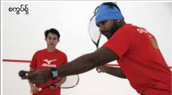
စကွပ်ရှ်