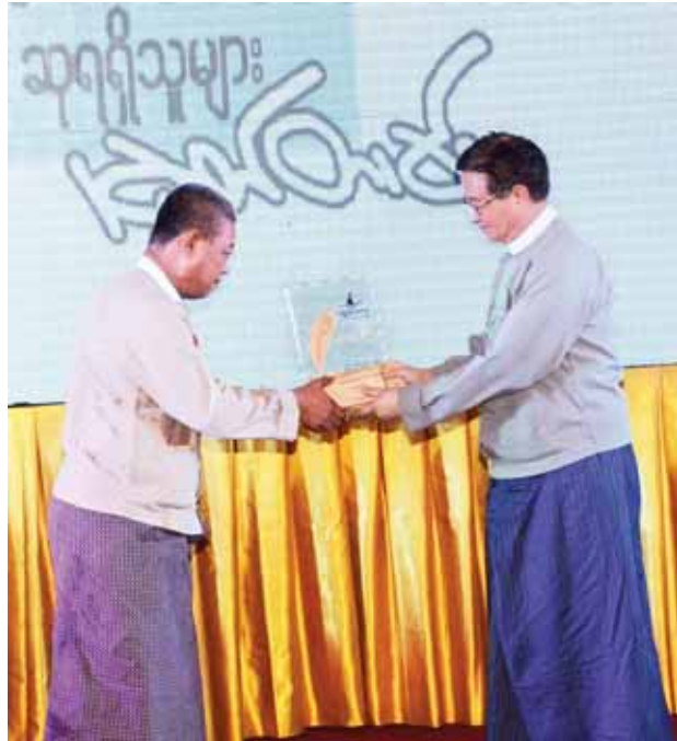
သမ္မတရုံးဝန်ကြီးဌာန ပြည်ထောင်စုဝန်ကြီး ဦးအောင်မင်း သတင်းကာတွန်းဆုရ ဦးရွှေထူးအား ဆုချီးမြှင့်ပွဲစဉ်။

မြန်မာနိုင်ငံ သတင်းစာဆရာအသင်း၏ တတိယအကြိမ်မြောက် အမျိုးသားသတင်းဆု (National Press Award) ချီးမြှင့်ပွဲ အခမ်းအနားကို ယနေ့ ညနေ ၇ နာရီတွင် ရန်ကုန်မြို့၊ ဗဟန်းမြို့နယ်ရှိ မြရိပ်ညိုဟိုတယ်၌ ကျင်းပသည်။