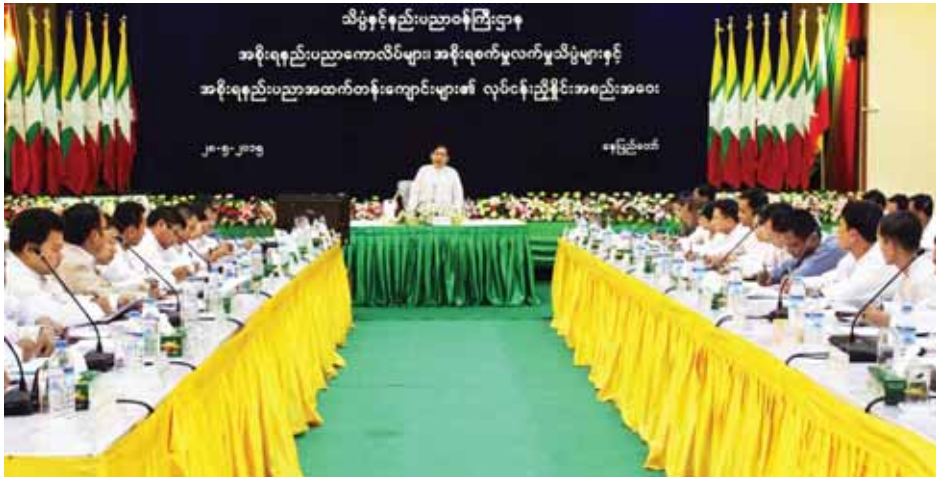
အစီအစဉ်များအား ရှင်းလင်းတင်ပြခဲ့သည်။ များ၏ ကျောင်းအုပ်ကြီးများက သင်ကြားရေး၊ စီမံရေးရာ နှင့် အုပ်ချုပ်ရေးဆိုင်ရာကိစ္စရပ်များနှင့်စပ်လျဉ်း၍ ဆွေးနွေးတင်ပြခဲ့ကြကြောင်း သတင်းရရှိသည်။ (သတင်းစဉ်)

ပေးကြရမှာဖြစ်ကြောင်း၊ အစိုးရနည်းပညာအထက်တန်း ကျောင်း (G.T.H.S) များတွင် Skill Level-3 နှင့် အစိုးရစက်မှုလက်မှုသိပ္ပံ (G.T.I) ကျောင်းများတွင် Skill Level-4 အထိရောက်အောင် ကျွမ်းကျင်သူများအဖြစ် လေ့ကျင့်သင်ကြားပေးထုတ်ပေးရန် လိုအပ်ပါကြောင်း၊ ဒေသမှလိုအပ်သည့် ဘာသာရပ်များအားလုံး သင်ကြားပေး နိုင်ရန် Polytechnic Center များ ဖွင့်လှစ်ခြင်းဖြစ် ကြောင်း၊ သို့မှသာ လူ့စွမ်းအားအရင်းအမြစ် ဖွံ့ဖြိုး တိုးတက်မှုကို တိုက်ရိုက်အထောက်အကူပြုမည်ဖြစ်ပါ ကြောင်း၊ နိုင်ငံတော်ဖွံ့ဖြိုးတိုးတက်ရေးနှင့် သက်မွေးပညာ ကဏ္ဍ ဖွံ့ဖြိုးတိုးတက်ရေးအတွက် ဆရာ၊ ဆရာမများအနေ ဖြင့် ဝိုင်းဝန်းဆောင်ရွက်ကြစေလိုပါကြောင်း၊ နောင်တွင် Polytechnic School များ၊ Polytechnic Institute များ ဖွင့်လှစ်နိုင်ရေး ရည်မှန်းချက်ထား ဆောင်ရွက်ရန်ဖြစ် ကြောင်း ပြောကြားသည်။ ထို့နောက် ဒုတိယဝန်ကြီး ဒေါက်တာအောင်ကျော် မြတ်က နည်းပညာနှင့် သက်မွေးပညာဆိုင်ရာဥပဒေ (မူကြမ်း)နှင့်စပ်လျဉ်း၍ ရှင်းလင်းပြောကြားခဲ့ပြီး နည်းပညာ နှင့်သက်မွေးပညာဦးစီးဌာန ဒုတိယညွှန်ကြားရေးမှူးချုပ် က နည်းပညာနှင့်သက်မွေးပညာကဏ္ဍ ဖွံ့ဖြိုးတိုးတက်ရေး ဆောင်ရွက်နေမှုများ၊ ဆက်လက်ဆောင်ရွက်ရမည့်