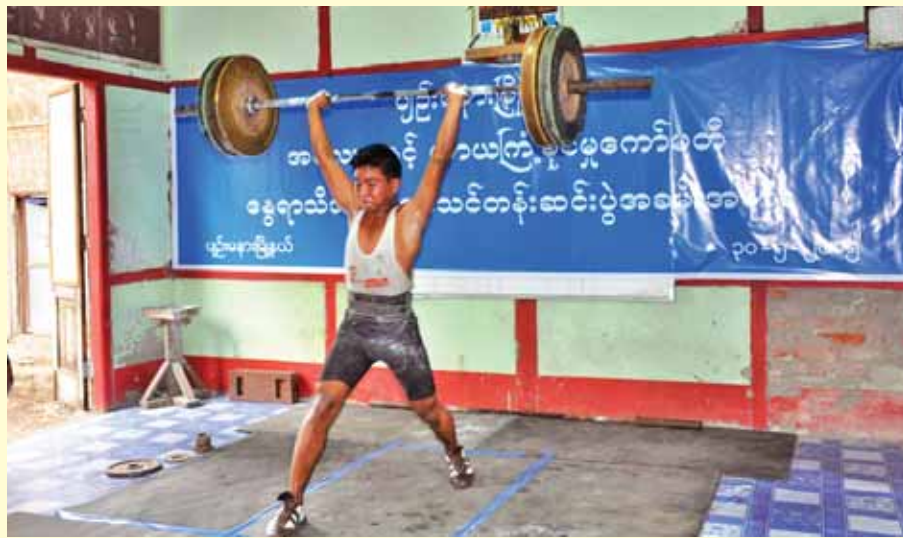
ပျဉ်းမနားမြို့နယ် အလေးမနှင့် ကာယကြံ့ခိုင်မှုကော်မတီမှ ကြီးမှူးဖွင့်လှစ်သည့် နေရာသီအားကစားသင်တန်းဆင်း အခမ်းအနားကို မေ ၃၀ ရက် ညနေ ၄ နာရီက ကျင်းပရာ သင်တန်းသားများမှ ၂၁/၂ ကီလိုမှ ၂၅ ကီလိုထိ လက်တွေ့အလေးမ သရုပ်ပြသကြသည်။