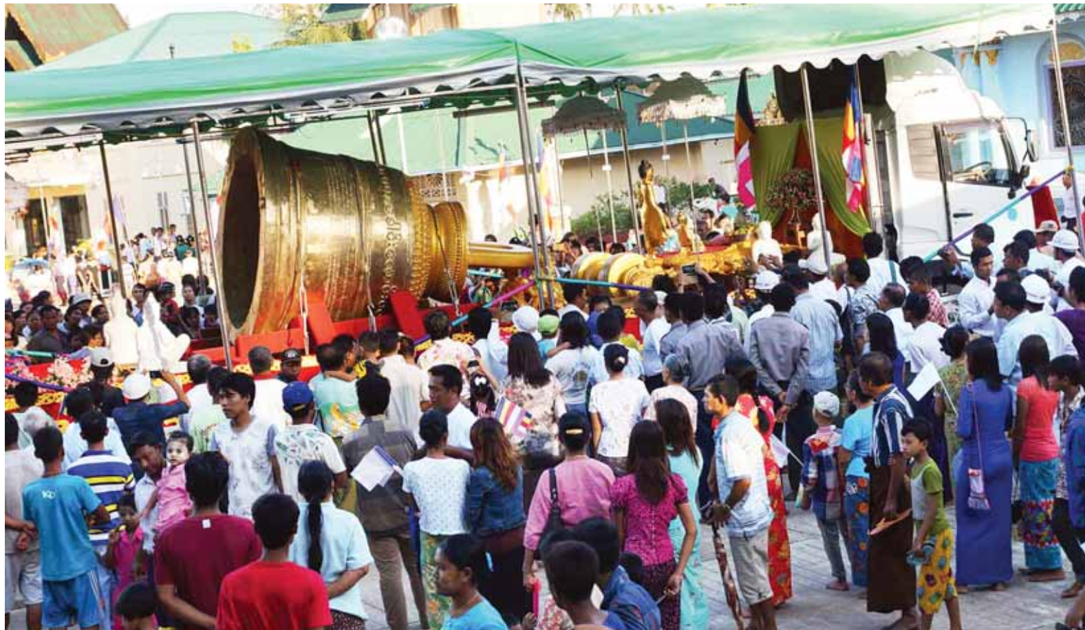
မဟာဝိဇယ ခေမသီတလ နိဗ္ဗာတယောသ မဟာမင်္ဂလာခေါင်းလောင်းတော်ကြီးကို ထားဝယ်မြို့ ကျက်သရေဆောင်လောကမာရဇိန်ဘုရားကြီးဝင်းအတွင်း၌ ပူဇော်ခံထားရှိစဉ်။