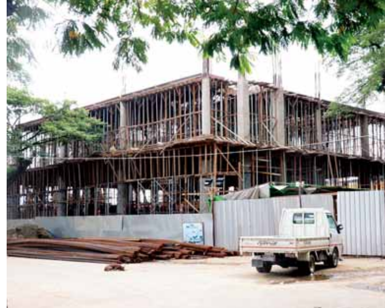
အင်းယားကန်စောင်းရှိ မြကျွန်းသာဥယျာဉ်အတွင်း ဆောက်လုပ်လျက်ရှိသော အဆင့်မြင့်အဆောက်အအုံများကို တွေ့ရစဉ်။