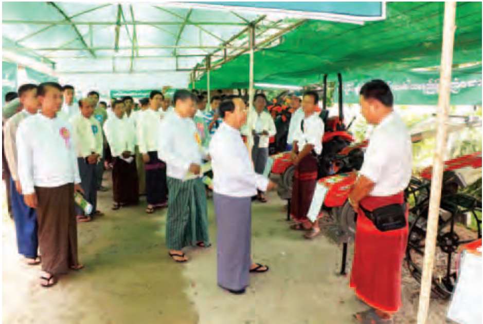
ပြည်ထောင်စုဝန်ကြီး ဦးကျော်ဆန်း ကရင်ပြည်နယ် ကျေးလက်ဒေသဖွံ့ဖြိုးရေးနှင့် လူမှုစီးပွားဘဝမြှင့်တင်ရေး အခမ်းအနားသို့ တက်ရောက်လာသူများအား ရင်းရင်းနှီးနှီးနှုတ်ဆက်စဉ်။ (သတင်းစဉ်)