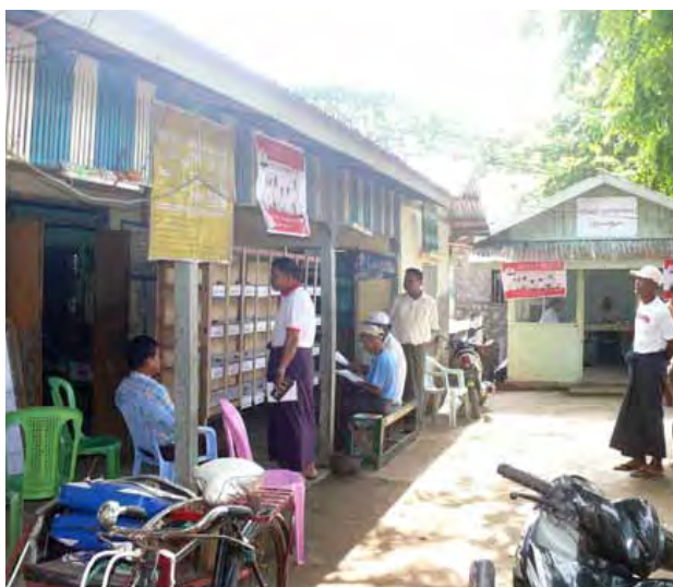
ရန်ကုန်မြောက်ပိုင်းခရိုင် လှိုင်သာယာမြို့နယ် အမှတ်(၉)ရပ်ကွက် ရပ်ကွက်ကော်မရှင်ရုံးတွင် မေ ၂၅ ရက် နံနက်ပိုင်းက ၂၀၁၅ ခုနှစ် ရွေးကောက်ပွဲဆိုင်ရာမဲဆန္ဒရှင်များအား လူဝင်မှုကြီးကြပ်ရေးစာရင်းပုံစံ ၆၆/၅ စာရင်းအရ ထုတ်ပြန်ကြေညာထားမှုကို တွေ့ရစဉ်။ (၃၂၉)

မှ ထောက်ပြအကြံပြုမှုအား ကျေးဇူးတင်ရှိကြောင်း အမြန်လမ်းမကြီး ထိန်းသိမ်းပြုပြင်ရေးနှင့် ကြီးကြပ်ရေးအဖွဲ့မှ သိရသည်။ ထို့အပြင် ယခုကဲ့သို့ ခရီးသွားပြည်သူများ၏ အမြန်လမ်းမကြီးနှင့်ပတ်သက်၍ အကြံပြုချက်များအား လက်ခံကြိုဆိုလျက်ရှိပြီး အကြံပြုချက်တင်ပြလိုပါက အကြံပြုလိုသည့် လမ်းအပိုင်း မိုင်တိုင်တည်နေရာအား ထည့်သွင်းဖော်ပြပေးပါရန် မေတ္တာရပ်ခံထားကြောင်း အမြန်လမ်းမကြီး ထိန်းသိမ်းပြုပြင်ရေးနှင့် ကြီးကြပ်ရေးအဖွဲ့၏ မေ ၂၅ ရက် ထုတ်ပြန်ချက်အရ သိရသည်။ (စိုးဝင်း-MLA)