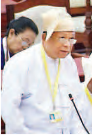
ကျန်းမာရေးဝန်ကြီးဌာန ဒုတိယဝန်ကြီး ဒေါက်တာဝင်းမြင့်။

ကျန်းမာရေးဝန်ကြီးဌာနအနေဖြင့် လက်လှမ်းမမီသောဒေသမှ မြေကိုကံ ခံရသည့် တောင်သူလယ်သမားနှင့် အခြေခံလူတန်းစားများအတွက် အရေးပေါ် မြေဆီပ်ဖြေဆေးထိုးနိုင်ရန် တိုက်နယ်ဆေးရုံများနှင့် ကျေးလက်ကျန်းမာရေး ဌာနများအထိ သက်ဆိုင်ရာမြို့နယ်များမှတစ်ဆင့် မြေဆီပ်ဖြေဆေးများကို