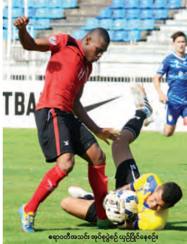
ရော့ဝတီအသင်း အုပ်စုပွဲစဉ် ယှဉ်ပြိုင်နေစဉ်။

လှေစီးဒုက္ခသည် ဘင်္ဂလားဒေ့ရှ် နိုင်ငံသားများအား အပြန်ပြန်လည်လွှဲပြောင်းပေးနိုင်ရန် ကောင်စစ်ဆိုင်ရာ စိစစ်ပေးမြန်းမှုများ ပြုလုပ်လျက်ရှိ