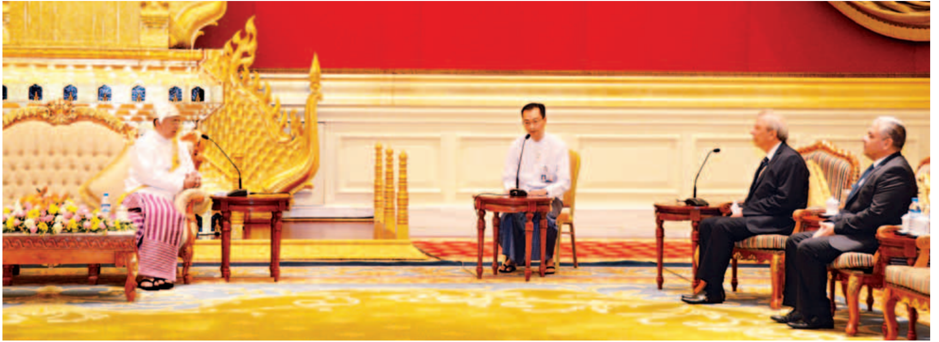
နိုင်ငံတော်သမ္မတ ဦးသိန်းစိန် ဘူလ်ဂေးရီးယားသမ္မတနိုင်ငံ သံအမတ်ကြီး မစ္စတာအက်စ်ဂဲနို စတဲဖနော့ဖ် စတိုင်းချက်စ်အား လက်ခံတွေ့ဆုံစဉ်။