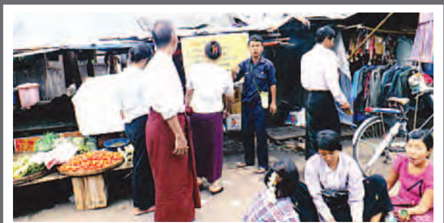
ရန်ကုန်တိုင်းဒေသကြီး ကြည့်မြင်တိုင်မြို့နယ် ထီးတန်းဈေးတွင် မေ ၂၄ ရက် နံနက် ၉ နာရီခွဲက ရန်ကုန်မြို့တော် စည်ပင်သာယာရေးကော်မတီ ကျန်းမာရေးဌာနမှ ခွင့်မပြုဆိုဆေးများပါဝင်သည့် ငါးဖယ်ချဉ်၊ ပုစွန်ချဉ်၊ စိမ်းစား ငါးမိ၊ ပုစွန်ခြောက်၊ ငရုတ်ဆီ၊ ငရုတ်သီးမှုန့်၊ ဆော့စ်အမျိုးမျိုး၊ လက်ဖက်၊ ဂျင်းနုပိ၊ ပဲကြီးလှော်၊ ပဲနီလေး၊ ကြံမဆိုင်၊ မျှစ်၊ ကြက်အူချောင်း၊ ဝက်အူချောင်း၊ ယိုစုံအမျိုးမျိုးစသည်တို့ကို ဝယ်ယူစားသုံးခြင်းမပြုရန် သတိပေးတားမြစ်သည့် ကြော်ငြာဆိုင်းဘုတ်များကို ဈေးတာဝန်ခံရုံးမှ စည်ပင်ဝန်ထမ်းများက ပြည်သူများသိရှိစေရန် လိုက်လံချိတ်ဆွဲလျက်ရှိ ကြောင်း သိရသည်။

လုံးဝဆုံးရှုံးသွားတာပေါ့။ မိုးရွာအပြီးဆွတ်လို့ရတဲ့ ပဲတီစိမ်းကျပြန်တော့ မိုးမိလို့ အရည်အသွေးမကောင်း ဘူးဆိုပြီး ပွဲရုံတွေက အရင်ဈေးမပေးတော့ဘဲ ၃၉၀၀၀၊ ၃၈၀၀၀ ကနေ အခုရက်ကြတော့ ၃၆၀၀၀ ပဲပေးတော့ ဈေးတွေက ကျသွားတယ်။ ဒါကြောင့် ကျွန်တော်တို့တောင်သူတွေမှာ စိုက်ရပျိုးရတာ မိုးမရွာတော့လည်းမရွာလို့ ရွာတော့လည်းဆိုးရွား ရောင်းရတဲ့ဈေးကလည်း အတတ်အကျနဲ့ ဒုက္ခ ကတော့ အမျိုးမျိုးပါပဲ” ဟု ပဲရောင်းလာသူ တောင်သူ တစ်ဦးက ပြောပြသည်။ မေထွန်းစော်(ရေစကြို)