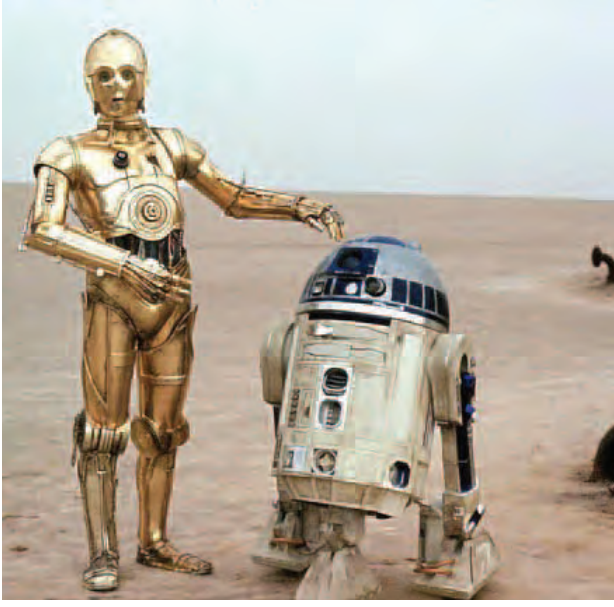
မြောက်အမေရိကတွင် စတင်ရုံတင်ပြသသွားမည်ဖြစ်သည်။ အဆိုပါ ရုပ်ရှင်သည် တရုတ်ရုပ်ရှင်ဈေးကွက်ကို များစွာရိုက်ခတ်နိုင်မည်ဟုလည်း ထင် ကြေးပေးနေကြသည်။ ခင်ခင်သက်

ယခုကဲ့သို့ ပြသရခြင်းမှာ နောင်ထွက်ရှိမည့် ခုနစ်ကားမြောက် Star Wars ရုပ်ရှင် "The Force Awakens" အတွက် တရုတ်နိုင်ငံတွင်ပရိသတ်ရရှိရေး ကိုလည်း ဦးတည်ဆောင်ရွက်ခြင်းဖြစ်ကာ Star Wars 7ကို ဒီဇင်ဘာ ၁၈ရက်၌