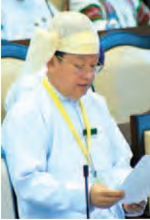
သမ္မတရုံးဝန်ကြီးဌာန ဒုတိယဝန်ကြီး ဦးအောင်သိန်း။

ထို့နောက် မန္တလေးတိုင်းဒေသကြီး မဲဆန္ဒနယ်အမှတ်(၃)မှ ဦးတင်မောင်ဝင်း၏ ရွှေလီ(၃) ရေအားလျှပ်စစ်စီမံကိန်းအား အကောင်အထည် ဖော်ဆောင်ရွက်လျက်ရှိရာတွင် ဘဏ္ဍာနှစ်အလိုက် လိုအပ်သည့်ရန်ပုံငွေနှင့် အဓိကလိုအပ်သော တည်ဆောက်ရေးပစ္စည်းများ ခွင့်ပြုချထားပေးရာ၌ သင့်တင့်လုံလောက်စွာ တိုးမြှင့်ချထားပေးရန် အစီအစဉ်ရှိ မရှိမေးခွန်းနှင့် စပ်လျဉ်း၍ လျှပ်စစ်စွမ်းအားဝန်ကြီးဌာန ဒုတိယဝန်ကြီး ဦးမော်သာထွေးက ရွှေလီ(၃) စီမံကိန်းအကောင်အထည်ဖော်ရေးအတွက် အဓိကအားဖြင့် ရန်ပုံ ငွေနှစ်စဉ်ပျမ်းမျှ ကျပ်ဘီလီယံ (၁၅၀)ခန့်လိုအပ်မည်ဖြစ်ရာ နိုင်ငံတော်ရန်ပုံငွေ နှစ်စဉ်ခွဲဝေရရှိရန် အခက်အခဲရှိသည့်အတွက် ကမ္ဘာ့ဘဏ်အပါအဝင် အပြည်ပြည်ဆိုင်ရာငွေကြေးအဖွဲ့အစည်းများထံမှ သက်သာသောအတိုးနှုန်းဖြင့် ချေးငွေရရှိရေးဆွေးနွေးလျက်ရှိသကဲ့သို့ ပြည်ပမှကျွမ်းကျင်သူ Developer များနှင့်လည်း အကောင်အထည်ဖော်မှုအပိုင်းအား ပူးပေါင်းဆောင်ရွက်ရန် ဆွေးနွေးညှိနှိုင်းလျက်ရှိရာ မကြာမီသဘောတူညီချက်များရရှိမည့် အခြေ အနေသို့ ရောက်ရှိလာမည်ဖြစ်ပါကြောင်း။