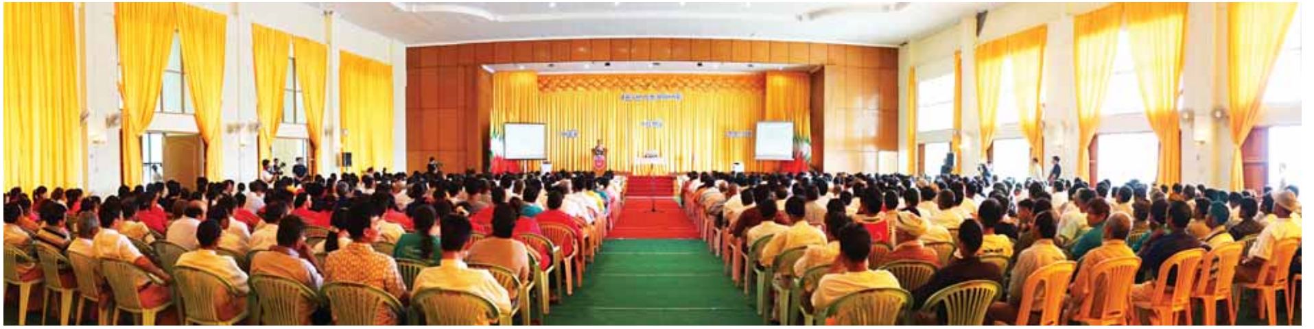
ဒုတိယသမ္မတ ဒေါက်တာစိုင်းမောက်ခမ်း နည်းပညာတက္ကသိုလ်(လားရှိုး)သို့ပို့ရတနာခန်းမ၌ကျင်းပသည့် လားရှိုးမြို့နယ်အတွင်းရှိ ကျေးရွာများမှ ဒေသခံပြည်သူများနှင့် တွေ့ဆုံပွဲအခမ်းအနားတွင် အမှာစကားပြောကြားစဉ်။ (ပြန်/ဆက်)

◆ ရှေ့ဖူးမှ တွေ့ဆုံပွဲတွင် ဒုတိယသမ္မတက လားရှိုးမြို့နယ်အတွင်းရှိ ကျေးရွာအုပ်စုများ၊ ကျေးရွာများမှ တာဝန်ရှိသူများ၊ ရပ်မိရပ်ဖများနှင့်တွေ့ဆုံပြီး လူမှုစီးပွား ဖွံ့ဖြိုးတိုးတက်ရေးအတွက် ကျေးရွာများ၏လိုအပ်ချက်များကို သိရှိလို၍ ယခုလို လာရောက်တွေ့ဆုံခြင်း ဖြစ်ပါကြောင်း။ နိုင်ငံတော်အစိုးရအနေဖြင့် တိုင်းဒေသကြီးနှင့် ပြည်နယ်များ၏ ဒေသလိုအပ်ချက်များဖြစ်သည့် ဖွံ့ဖြိုးတိုးတက်ရေးလုပ်ငန်းများအပါအဝင် လမ်း၊ တံတား၊ ပို့ဆောင်ရေး၊ သောက်သုံးရေရရှိရေး၊ လျှပ်စစ်မီးရရှိရေး၊ ပညာရေး၊ ကျန်းမာရေး စသည့် လူမှုစီးပွားအခြေခံလိုအပ်ချက်များကို ဖြည့်ဆည်းဆောင်ရွက်ပေးလျက်ရှိပါကြောင်း။ ထို့ပြင် နိုင်ငံတော်အစိုးရ၏ အုပ်ချုပ်ရေးပုံစံသည် ပြည်သူလူထုအခြေပြုသည့် အုပ်ချုပ်ရေးပုံစံဖြစ်သောကြောင့် မြို့နယ်/ကျေးရွာများ၏ လူမှုစီးပွားဖွံ့ဖြိုးတိုးတက်ရေး အခြေခံလိုအပ်ချက်များဖြစ်သည့် လမ်း၊ တံတား၊ ပို့ဆောင်ဆက်သွယ်ရေး၊ သောက်သုံးရေရရှိရေး၊ လျှပ်စစ်မီးရရှိရေး၊ ပညာရေး၊ ကျန်းမာရေး စသည့် လုပ်ငန်းများကို ထိထိရောက်ရောက်ပံ့ပိုးကူညီဖြည့်ဆည်း ဆောင်ရွက်ပေးနိုင်ရန်အတွက် မြို့နယ်နှင့်ကျေးရွာ ဖွံ့ဖြိုးတိုးတက်ရေး အထောက်အကူပြုကော်မတီများ ဖွဲ့စည်းဆောင်ရွက်လျက်ရှိပါကြောင်း။ မိမိအနေဖြင့်လည်း လားရှိုးဒေသမှ ဒေသခံပြည်သူများနှင့် တွေ့ဆုံ၍ ဒေသလိုအပ်ချက်များကိုသိရှိပြီး အတတ်နိုင်ဆုံးဖြည့်ဆည်းဆောင်ရွက်ပေးရန် ရည်ရွယ်ချက်ဖြင့် လာရောက်ခြင်းဖြစ်ပါကြောင်း။ ထို့အတူ ဒေသအလိုက် လိုအပ်ချက်များထဲမှ ချက်ချင်းဆောင်ရွက်ပေးနိုင်သည်များကို ချက်ချင်းဖြည့်ဆည်း ဆောင်ရွက်ပေးသွားမည်ဖြစ်ပြီး ချက်ချင်းမဆောင်ရွက်ပေးနိုင်သည်များကို သက်ဆိုင်ရာဝန်ကြီးဌာနများနှင့် ပေါင်းစပ်ညှိနှိုင်းဆောင်ရွက်ပေးမည်ဖြစ်ပါကြောင်း။ ထို့ကြောင့် ကျေးရွာများမှ တာဝန်ရှိသူများနှင့် ရပ်မိရပ်ဖများက မိမိတို့