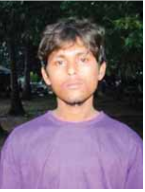
နိုရိုအာဆာ