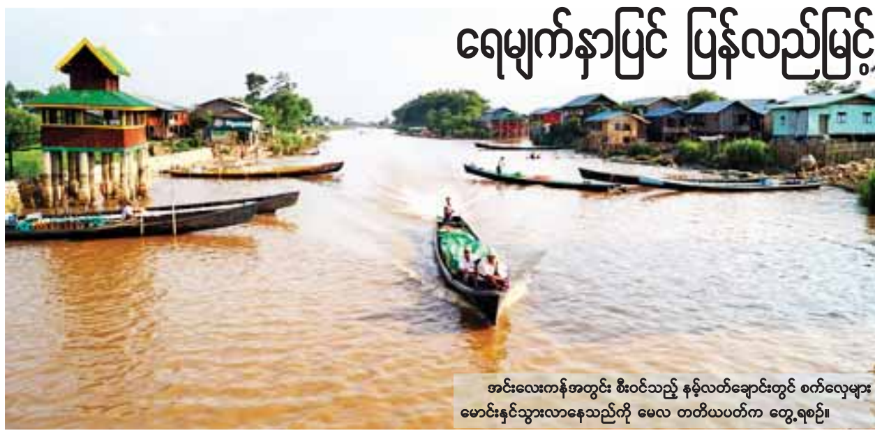
အင်းလေးကန်အတွင်း စီးဝင်သည့် နမ့်လတ်ချောင်းတွင် စက်လှေများ မောင်းနှင်သွားလာနေသည်ကို မေလ တတိယပတ်က တွေ့ရစဉ်။