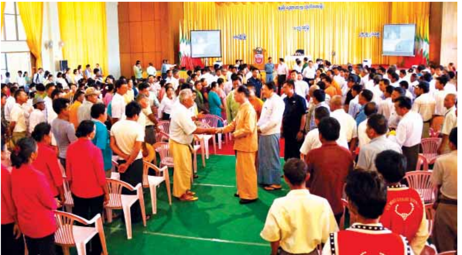
ဒုတိယသမ္မတ ဒေါက်တာစိုင်းမောက်ခမ်း နည်းပညာတက္ကသိုလ်(လားရှိုး)သိပ္ပံရတနာခန်းမ၌ ကျင်းပသည့် တွေ့ဆုံပွဲအခမ်းအနားသို့ တက်ရောက်လာကြသူများအား ရင်းရင်းနှီးနှီး နှုတ်ဆက်စဉ်။ (ပြန်/ဆက်)