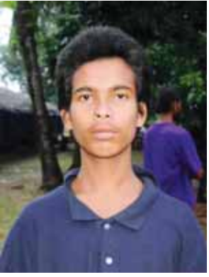
မူဟာမက်မိုဘီနော်ဟောက်