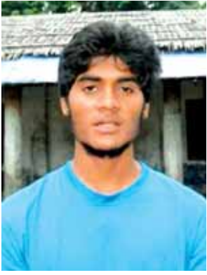
မိုဟာမက်အိဗီရာဟာဆင်