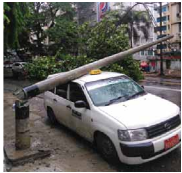
ရန်ကုန်တိုင်းဒေသကြီး လမ်းမတော် ၂၅ ပေ၊ လုံးပတ် သုံးပေခန့်ရှိ မြို့နယ် (၉)ရပ်ကွက် ဗိုလ်ချုပ်လမ်း ဗာဒံပင်မှာ မေ ၂၃ ရက် မွန်းလွဲ ၁၂ နာရီခွဲက မိုးရေကြောင့် မြေပျော့၍ လျှပ်စစ်ဓာတ်ကြိုးများပေါ်သို့ လဲကျပြီး ဗိုလ်ချုပ်လမ်းပေါ်သို့ ကန့်လန့်ဖြတ်လဲကျကာ ယာဉ်ကြောပိတ်ဆို့မှု ဖြစ်ပွားခဲ့သည်။

ရန်ကုန် မေ ၂၅ နှင့် ဖိုးရာဇာလမ်းထောင့်ရှိ အမြင့် ရန်ကုန်တိုင်းဒေသကြီး လမ်းမတော် ၂၅ ပေ၊ လုံးပတ် သုံးပေခန့်ရှိ မြို့နယ် (၉)ရပ်ကွက် ဗိုလ်ချုပ်လမ်း ဗာဒံပင်မှာ မေ ၂၃ ရက် မွန်းလွဲ ၁၂