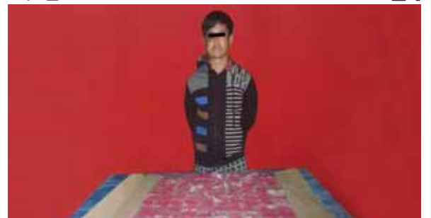
တွမ်အယ်(ခ)အိုက်နု (၄၀)နှစ်အား သိမ်းဆည်းရမိ မူးယစ်ဆေးဝါးများနှင့် အတူတွေ့ရစဉ်။

ထည့်လျက် စိတ်ကြွရွှေသွပ်ဆေးပြား ၁၆၀ နှင့် အိုက်ဂျန် ၀တ်ဆင်ထားသည့် အင်္ကျီဝဲဘက်အိတ်ကပ်အတွင်းမှ အအေးစုပ်ပိုက်ဖြင့်ထည့်လျက် ဘိန်းဖြူ သူညီ ဒသမ ၁ ဂရမ်တို့ကို သိမ်းဆည်းရမိသဖြင့် စိုင်းအွမ် (၄၀) နှစ်နှင့် အိုက်ဂျန် (၄၂)နှစ် တို့ နှစ်ဦးအား မူးယစ်ဆေးဝါးနှင့် စိတ်ကိုပြောင်းလဲစေသော ဆေးဝါးများဆိုင်ရာ ဥပဒေအရ အရေးယူထားကြောင်း သိရသည်။