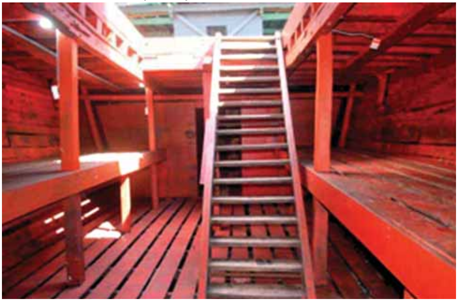
ဘင်္ဂါလီများ တင်ဆောင်ပို့ဆောင်ပေးသည့် လူမှောင်ခိုရေယာဉ်အတွင်းပိုင်းကို တွေ့ရစဉ်။