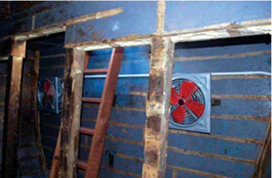
ဘင်္ဂါလီများ တင်ဆောင်ပို့ဆောင်ပေးသည့် လူ့မောင်ခိုရေယာဉ်အတွင်းပိုင်းနေရာများကို တွေ့ရစဉ်။