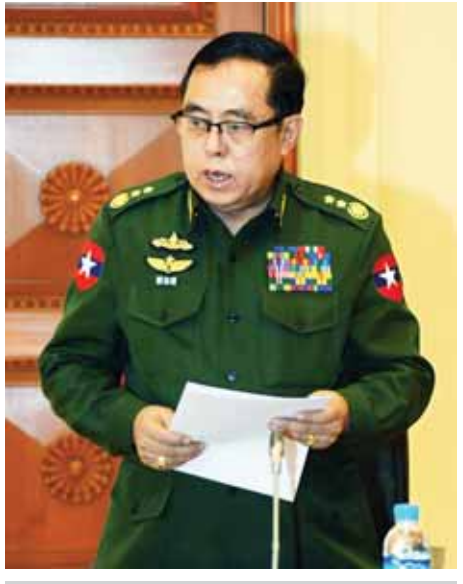
ပြည်ထောင်စုဝန်ကြီး ဒုတိယဗိုလ်ချုပ်ကြီးဝေလွင်။