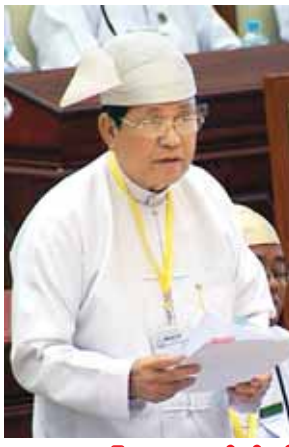
မွေးမြူရေး၊ ရေလုပ်ငန်းနှင့် ကျေးလက်ဒေသဖွံ့ဖြိုးရေးဝန်ကြီးဌာန ဒုတိယဝန်ကြီး ဦးတင်ဌေ။

ဆက်လက်၍ ဒုတိယဝန်ကြီး ဦးကျော်ကျော်ဝင်းက ဒိုက်ဦး မဲဆန္ဒနယ်မှ ဦးမင်းဆွေ၏ ဒိုက်ဦးမြို့နယ်ရှိ ဒရယ်မီးချောင်းနှင့် အကြောင်ချောင်းကို တူးဖော်ပေးရန်နှင့် ကျန်ရှိသည့် ချောင်းကော၊ မြောင်းကောများအား တူးဖော်ပေးရန် လုပ်ငန်းများကို ပွင့်လင်းရာသီဖြစ်