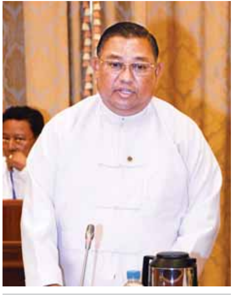
ပြည်ထောင်စုဝန်ကြီး ဦးဝဏ္ဏမောင်လွင်။

ပင်လယ်တွင်း လေ့စီးဒုက္ခသည်များသည် မြန်မာနိုင်ငံမှ လာသည်ဟု စွပ်စွဲပြောဆိုနေမှုများသည် မြန်မာနိုင်ငံမှ နည်းပါးသည့်အရေအတွက် ပါဝင်ကောင်းပါဝင်နိုင်သော်လည်း အများစုမှာ မိမိတို့နိုင်ငံမှ မဟုတ်သည်ကို ပြတ်ပြတ်သားသား ပြောကြားလို။