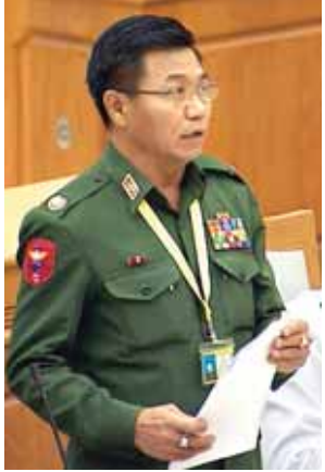
ပြည်ထဲရေးဝန်ကြီးဌာန ဒုတိယဝန်ကြီး ဗိုလ်မှူးချုပ် ကျော်ဇော်မြင့်။

အလုပ်ရုံဌာနများ၏ အလုပ်သမားရေးရာကိစ္စရပ်များ၊ ပြည်ပရောက်မြန်မာရွှေ့ပြောင်းအလုပ်သမားများအား ကာကွယ်စောင့်ရှောက်ရေး၊ အလုပ်ရှင်နှင့် အလုပ်သမားများ အလုပ်သမားဥပဒေပါ အကျိုးခံစားခွင့်များ အပြည့်အဝရရှိနိုင်စေရေး၊ လူမှုရေးတရားမျှတစွာဖြင့် သင့်လျော်ကောင်းမွန်သည့် စက်မှုလုပ်ငန်းခွင်ဖြစ်စေရန် တာဝန်ရှိမှုနှင့် ပေါင်းစပ်ညှိနှိုင်းမှုများဖြင့် ဝန်ကြီးဌာနလုပ်ငန်းစဉ်များနှင့်အညီ အကောင်အထည်ဖော်ဆောင်ရွက်လျက်ရှိပါကြောင်းဖြင့် ပြန်လည်ရှင်းလင်းဖြေကြားသည်။