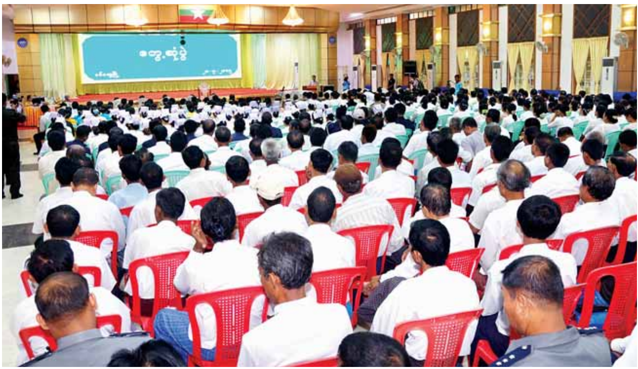
ဒုတိယသမ္မတ ဒေါက်တာစိုင်းမောက်ခမ်း စစ်တွေမြို့ ဦးဥက္ကဋ္ဌမခန်းမတွင် ဒေသခံပြည်သူများနှင့် တွေ့ဆုံစဉ်။ (သတင်းစဉ်)

ထိုသို့တွေ့ဆုံရာတွင် ကုလသမဂ္ဂဒုက္ခသည်များဆိုင်ရာ မဟာမင်းကြီးရုံး (UNHCR)၊ UNICEF၊ UNDP၊ MSF နှင့် UNOCHA တို့မှ တာဝန်ရှိသူများက ယခုကဲ့သို့ အပြုသဘောဆောင် ဆွေးနွေးခွင့်ရသည့်အတွက် ကျေးဇူးတင်ပါကြောင်း၊ လက်ရှိပင်လယ်ပြင်တွင် ရောက်ရှိနေသည့် လေ့စီးသူများ ကမ်းခြေသို့ရောက်ရှိရေးသည် အရေးကြီးပါကြောင်း၊ ပင်လယ်ပြင်ရှိ လေ့စားပေါ်တွင်ပါရှိသည့် ကလေးသူငယ်များနှင့် လူငယ်များ၏ အာဟာရ