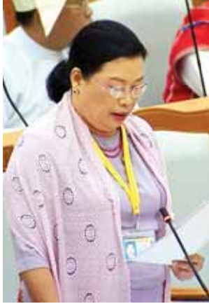
အလုပ်သမား၊ အလုပ်အကိုင်နှင့် လူမှုဖူလုံရေးဝန်ကြီးဌာန ဒုတိယဝန်ကြီး ဒေါ်ဝင်းမော်ထွန်း။

အနည်းဆုံးလုပ်ခလစာ သတ်မှတ်နိုင်ရေးကိစ္စအပါအဝင် အလုပ်သမား၊ အလုပ်ရှင်အခွင့်အရေး ပူးပေါင်းကော်မရှင်၏ အစီအရင်ခံစာပါ အပိုဒ် ၂၄မှ ၃၃ အထိပါဝင်သော သုံးသပ်တင်ပြချက်များနှင့်စပ်လျဉ်း၍ အလုပ်သမား၊ အလုပ်အကိုင်နှင့် လူမှုဖူလုံရေးဝန်ကြီးဌာန ဒုတိယဝန်ကြီး ဒေါ်ဝင်းမော်ထွန်းက ၂၀၁၄ ခုနှစ် ဧပြီလအထိ အလုပ်သမားအဖွဲ့အစည်း ဥပဒေ၊ အလုပ်သမားရေးရာ အငြင်းပွားမှုဖြေရှင်းရေးဥပဒေ၊ ၂၀၁၂ ခုနှစ် လူမှုဖူလုံရေးဥပဒေ၊ ၂၀၁၃ ခုနှစ် အနည်းဆုံးအခကြေးငွေ ဥပဒေ၊ အလုပ်အကိုင်နှင့် ကျွမ်းကျင်မှု ဖွံ့ဖြိုးတိုးတက်ရေးဥပဒေ၊ ၁၉၅၁ ခုနှစ် ခွင့်ရက်နှင့် အလုပ်ပိတ်ရက်အက်ဥပဒေကို ပြင်ဆင်သည့် ဥပဒေတို့ကို ရေးဆွဲပြဋ္ဌာန်းနိုင်ခဲ့ပြီး ဥပဒေ(၄)ခုရုပ်သိမ်းခြင်း၊ အသစ်ရေးဆွဲလျက်ရှိသည့် ဥပဒေ (၆)ခု တို့ကိုလည်း ပြီးစီးနိုင်ရေးတွန်းအားပေး ဆောင်ရွက်လျက်ရှိပါကြောင်း၊ ထို့ပြင် နိုင်ငံခြားသားအလုပ်သမားဆိုင်ရာ ဥပဒေနှင့် လုပ်ငန်းခွင်ဘေးအန္တရာယ်ကင်းရှင်းရေးနှင့် ကျန်းမာရေးဥပဒေ တို့ကိုလည်း ထပ်မံအသစ်ရေးဆွဲပြဋ္ဌာန်းနိုင်ရေး ဆောင်ရွက်လျက်ရှိပါကြောင်း၊ စီးပွားရေးဖွံ့ဖြိုးတိုးတက်မှုနှင့်အညီ ဖြစ်ပေါ်လာသည့် အထူးစီးပွားရေးဇုန်များ၊ စက်မှုဇုန်များနှင့် နိုင်ငံပိုင်၊ သမဝါယမပိုင်၊ ပုဂ္ဂလိကပိုင် စက်ရုံ