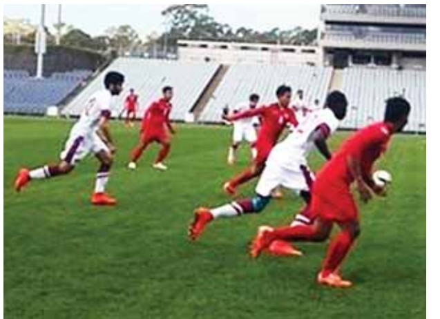
မြန်မာယူ-၂၀ အသင်းနှင့် ကာတာယူ-၂၀ အသင်းတို့ ခြေစမ်းစဉ်။