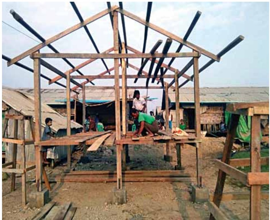
ရခိုင်ပြည်နယ်အစိုးရအဖွဲ့၏ကြီးကြပ်မှုဖြင့် သက်ဆိုင်ရာဝန်ကြီးဌာနများနှင့် အဖွဲ့အစည်းများက ပြန်လည်ထူထောင်ရေးလုပ်ငန်းများ ဆောင်ရွက်ပေးလျက်ရှိရာ အဆောက်အအုံများ ဆောက်လုပ်နေသည်ကို တွေ့ရစဉ်။ (သတင်းစဉ်)