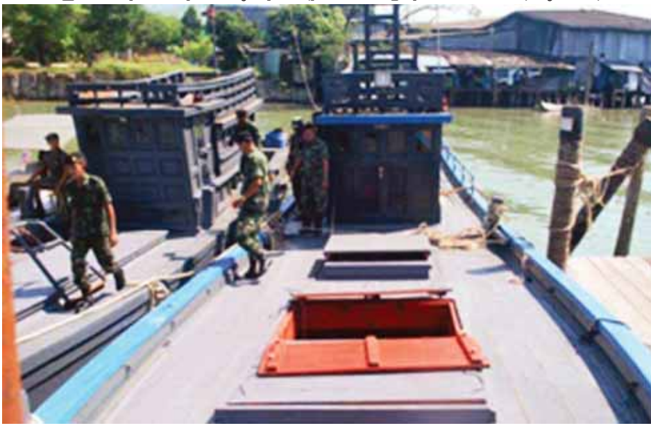
ဘင်္ဂါလီများ တင်ဆောင်ပို့ဆောင်ပေးသည့် လူမှောင်ခိုရေယာဉ်များကို တွေ့ရစဉ်။