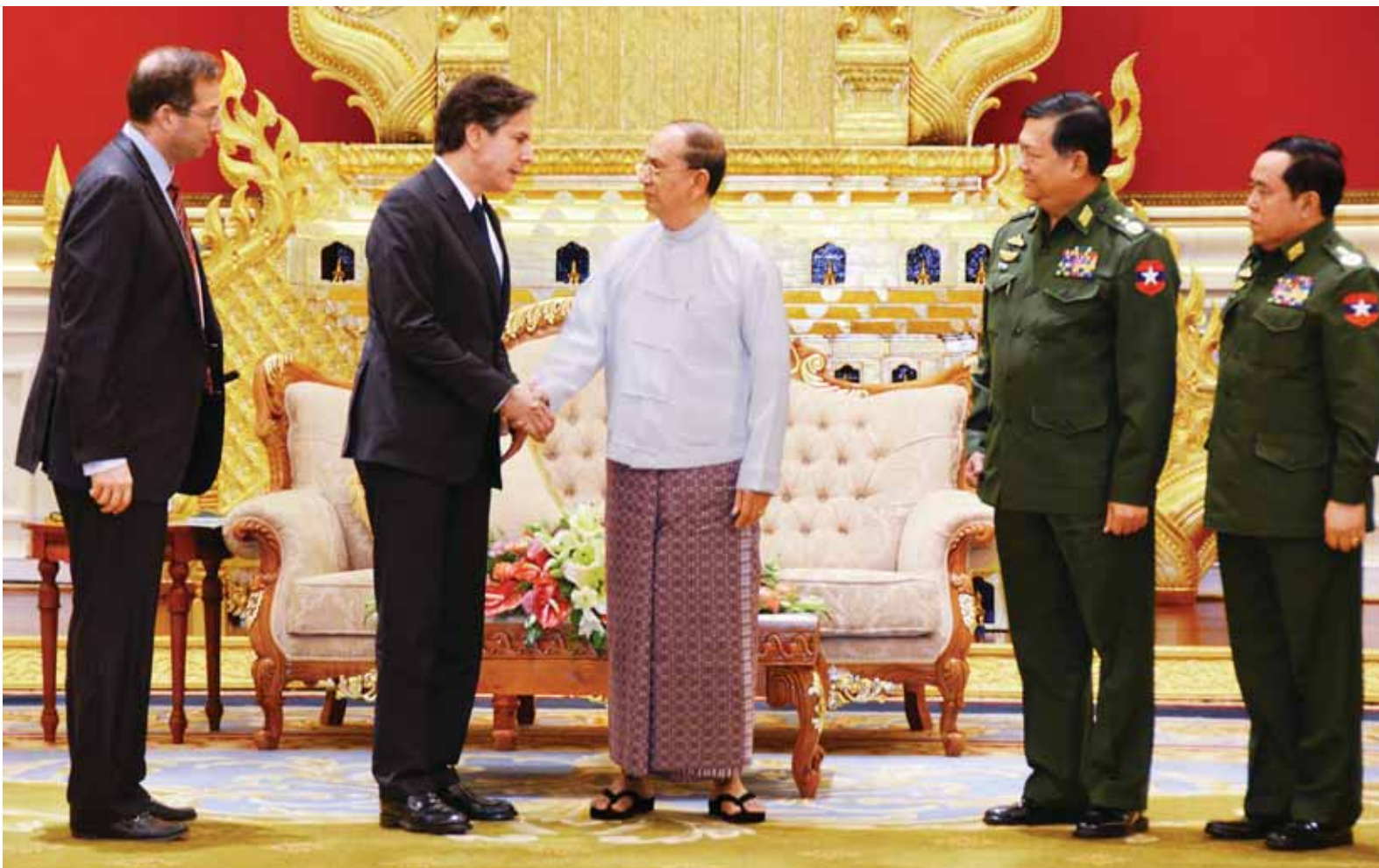
နိုင်ငံတော်သမ္မတ ဦးသိန်းစိန် အမေရိကန်ပြည်ထောင်စု ဒုတိယနိုင်ငံခြားရေးဝန်ကြီး မစ္စတာ အန်တိုနီ ဘလင်ကန်အား ရင်းရင်းနှီးနှီးနှုတ်ဆက်စဉ်။

အခွန်အကောက်ဥပဒေကို ပြင်ဆင်သည့်ဥပဒေကြမ်း အပြန်ဆုံးတင်သွင်းအတည်ပြု ပေးနိုင်ပါရန် လွှတ်တော်သို့ တိုက်တွန်း စာမျက်နှာ » ၇