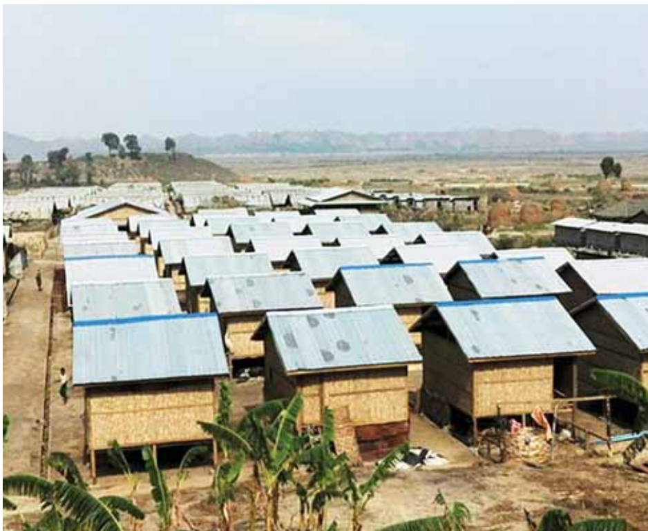
ပေါက်တောမြို့နယ် ကြိမ်နီပြင်စခန်း (ကန်ပြင်ကျေးရွာ) တွင် ဆောက်လုပ်ထားသည့် လုံးချင်းအိမ်ရာများကို တွေ့ရစဉ်။