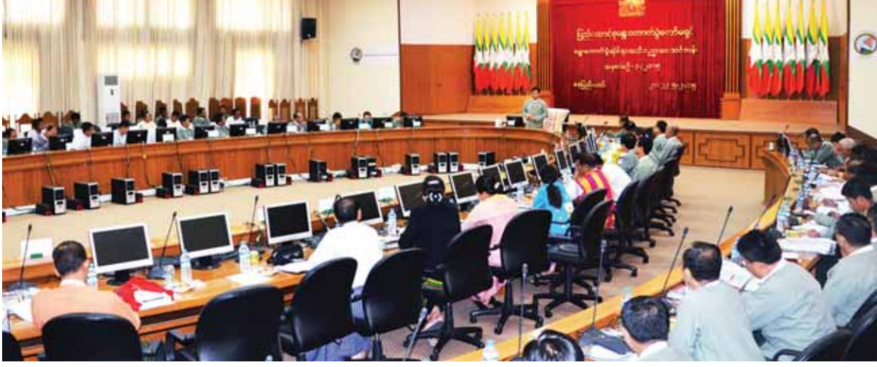
ပြည်ထောင်စုရွေးကောက်ပွဲကော်မရှင်ဥက္ကဋ္ဌ ဦးတင်အေး ရွေးကောက်ပွဲဆိုင်ရာအသိပညာပေး သင်တန်းအမှတ်စဉ် (၃/ ၂၀၁၅) သင်တန်းဖွင့်ပွဲတွင် အမှာစကားပြောကြားစဉ်။

နေပြည်တော် မေ ၂၁ ပြည်ထောင်စု ရွေးကောက်ပွဲကော်မရှင်ရုံးမှ ရွေးကောက်ပွဲဆိုင်ရာ အသိပညာပေး သင်တန်းအမှတ်စဉ် (၃/ ၂၀၁၅) သင်တန်းဖွင့်ပွဲကို ယနေ့ နံနက် ၈ နာရီတွင် နေပြည်တော် ရွှေပြည်သာ ပြည်ထောင်စုရွေးကောက်ပွဲကော်မရှင်ရုံး အစည်းအဝေးခန်းမ၌ ကျင်းပရာ ပြည်ထောင်စုရွေးကောက်ပွဲကော်မရှင်ဥက္ကဋ္ဌဦးတင်အေးက အဖွင့်အမှာစကားပြောကြားသည်။