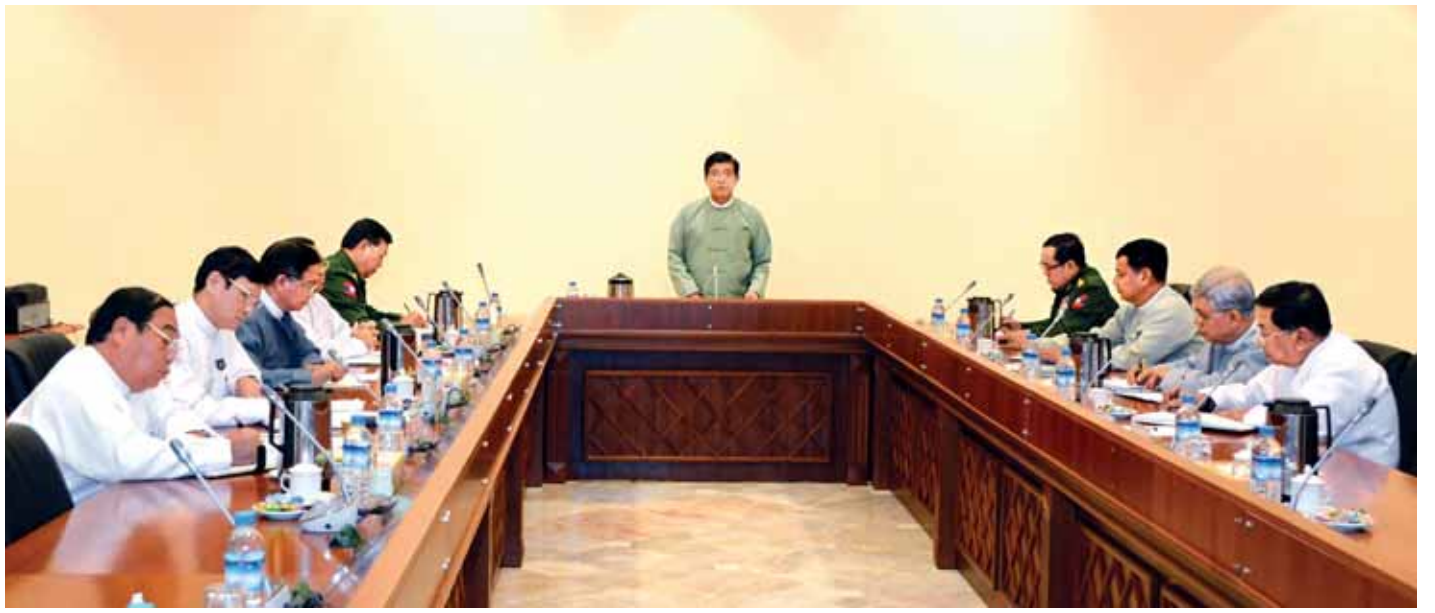
ဒုတိယသမ္မတ ဦးညွှန်ထွန်း ပင်လယ်ပြင်အတွင်း တရားမဝင် ရွှေ့ပြောင်းသွားလာသူများဆိုင်ရာ အရေးပေါ်စီမံခန့်ခွဲရေးကော်မတီ ညှိနှိုင်းအစည်းအဝေးတွင် အမှာစကားပြောကြားစဉ်။

ယခုနှစ် မတ်လအတွင်းတွင် မလေးရှားနိုင်ငံ လန်ကာဝီကျွန်းတွင် ထိန်းသိမ်းထားသည့် တရားမဝင် မြန်မာအလုပ်သမား ၁၂ ဦးကို တပ်မတော်(ရေး)စစ်ရေ ယာဉ်ဖြင့် မြန်မာနိုင်ငံသို့ ပြန်လည်ခေါ်ဆောင်ခဲ့သည့် ဖြစ်စဉ်နှင့် ယခုလအတွင်း အင်ဒိုနီးရှားနိုင်ငံတွင် ဒုက္ခ ရောက်နေသည့် မြန်မာရေလုပ်သား ၅၀၀ ခန့် လေယာဉ် ဖြင့် မြန်မာနိုင်ငံသို့ စတင်ခေါ်ဆောင်နေသည့် လုပ်ဆောင် ချက်များကိုကြည့်ပါက မိမိတို့အစိုးရအနေဖြင့် မြန်မာ နိုင်ငံသားမှန်ကန်ပါက လူမျိုး၊ ဘာသာမခွဲခြားဘဲ လိုအပ် သော ကာကွယ်စောင့်ရှောက်မှုများ ပေးအပ်နေသည်ကို တွေ့ရမည်ဖြစ်ပါကြောင်း။