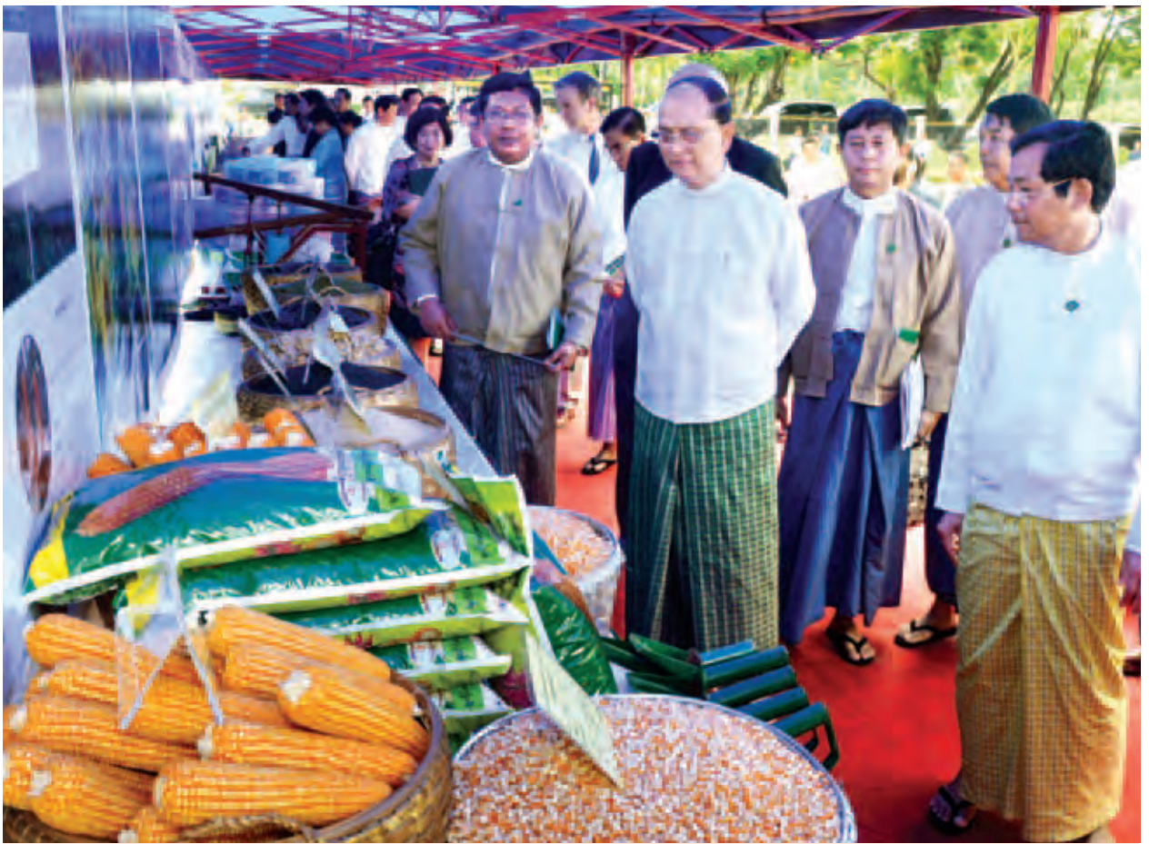
နိုင်ငံတော်သမ္မတ ဦးသိန်းစိန်နှင့်အဖွဲ့ဝင်များ၊ ဧည့်သည်တော်များ စိုက်ပျိုးရေးသုတေသနဦးစီးဌာနမှ ခင်းကျင်းပြသထားသည့်များကို ကြည့်ရှုကြစဉ်။ (သတင်းစဉ်)

ထို့အပြင် သုတေသနပညာရှင်များအနေဖြင့် စပါးသီးနှံအခြေခံ စိုက်ပျိုး ထုတ်လုပ်နေကြသော လုပ်ကွက်ငယ် တောင်သူ လယ်သမားများ၏ ဝင်ငွေတိုး တက်စေရေးနှင့် ၎င်းတို့၏ လူနေမှု အဆင့်အတန်းများ ပိုမိုတိုးတက်သာယာ