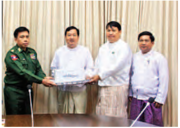
ပေါင်းစုံထိန်းသိမ်းရေးကော်မတီတွဲဖက်ပူးပေါင်းဆောင်ရွက်ပေးခဲ့ကြောင်း သိရသည်။(အောက်ပုံ) (ပြန်/ဆက်)