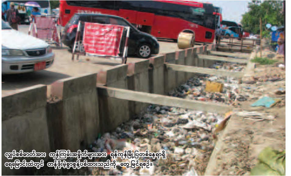
လျှပ်စစ်ဓာတ်အား ထုတ်ပေးရန်အတွက် အမှိုက်စွန့်ပစ်ခြင်းဖြင့် ဖြစ်ပေါ်နေသည့် ရေမြောင်းထဲတွင် ထန်ပိုးမွှားစွန့်ပစ်ထားသည်ကို တွေ့မြင်ရစဉ်။

ဩစတြေးလျတွင် ပန်းခြံများအတွင်း အပန်းဖြေပြီးနောက် အမှိုက်များထားခဲ့ခြင်းမပြုပဲ ပန်းခြံထဲမှ အရာများ