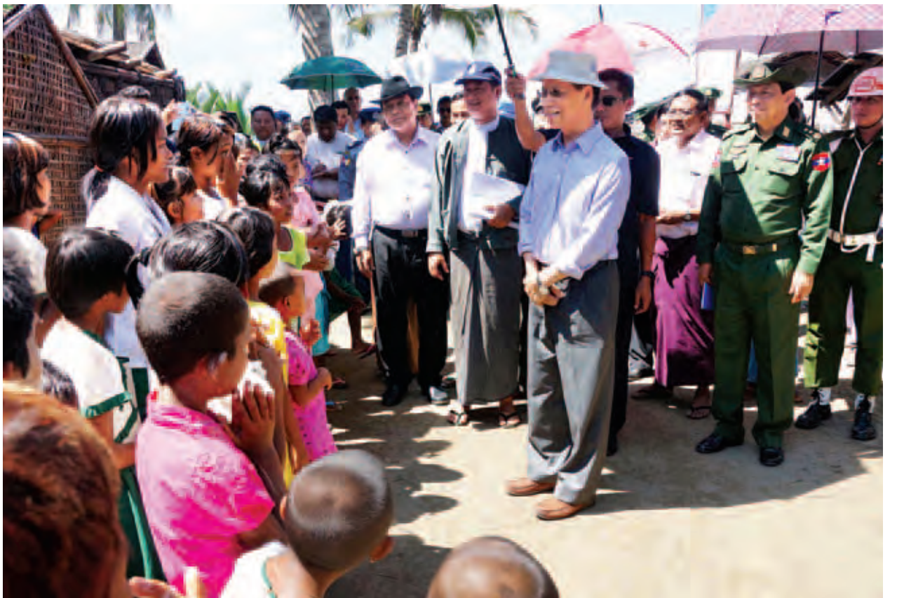
ဒုတိယသမ္မတ ဒေါက်တာစိုင်းမောင်ခမ်း စစ်တွေမြို့နယ် ရေချမ်းပြင်ကျေးရွာအုပ်စု အုန်းရည်ပေါ်ကျေးရွာရှိ ဒေသခံတိုင်းရင်းသားများနှင့် တွေ့ဆုံစဉ်။

ထို့နောက် ဒုတိယသမ္မတသည် စစ်တွေမြို့ရှိ သက္ကေပြင်ကယ်ဆယ်ရေးစခန်း၊ သဲချောင်းကယ်ဆယ်ရေးစခန်းနှင့် မြို့ပြဖွံ့ဖြိုးတိုးတက်မှုများကို မော်တော်ယာဉ်များဖြင့် လှည့်လည်ကြည့်ရှုစစ်ဆေးသည်။