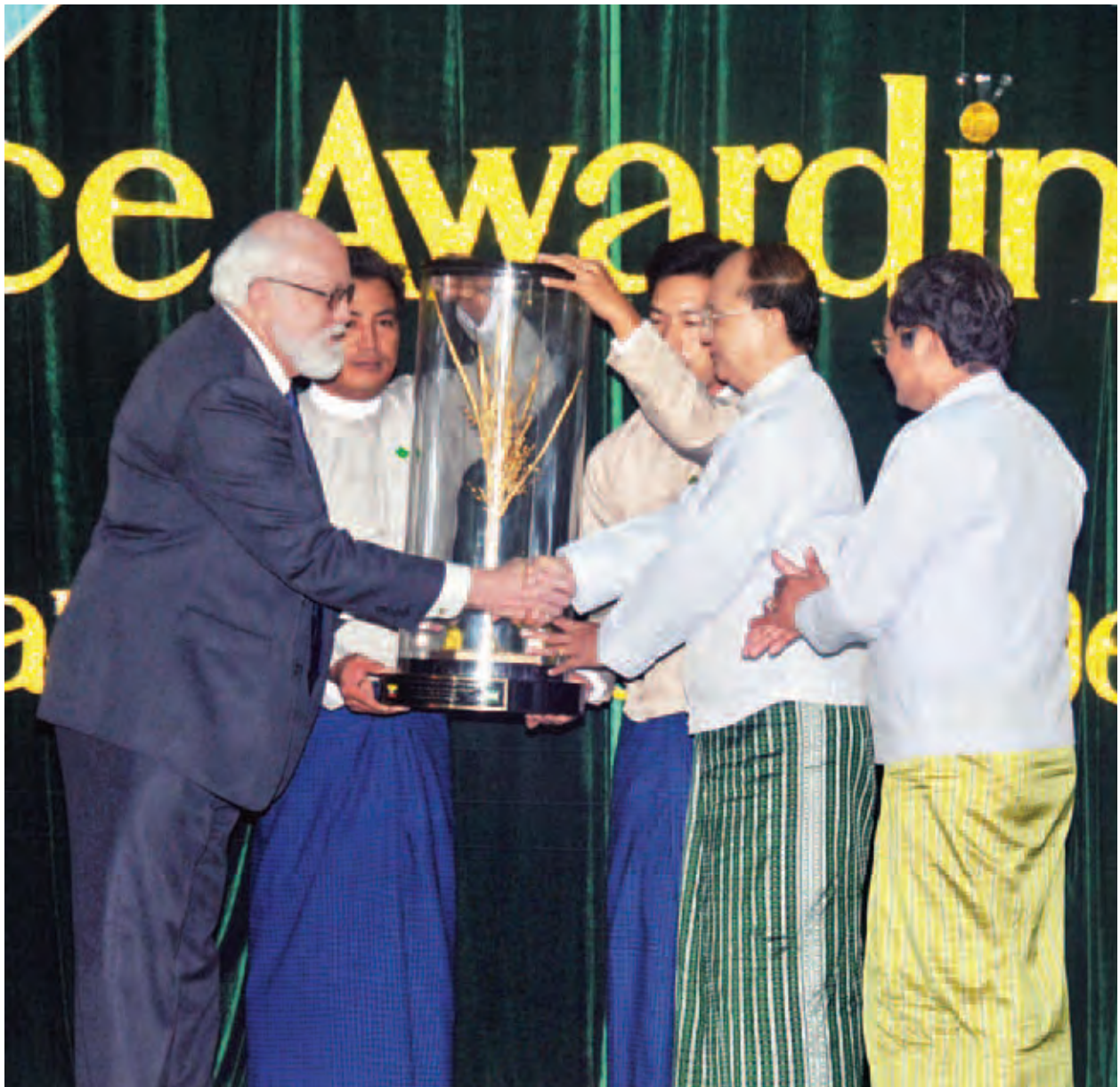
နိုင်ငံတော်သမ္မတ ဦးသိန်းစိန်အား အပြည်ပြည်ဆိုင်ရာ ဆန်စပါးသုတေသနဌာန ညွှန်ကြားရေးမှူးချုပ် ဒေါက်တာရောဘတ်ဇီဂလာက ရွှေစပါးနံရုပွင့်ပြုဆု (သတင်းစဉ်) ယေးအပ်စဉ်။

နေပြည်တော် မေ ၂၀ နိုင်ငံတော်သမ္မတ ဦးသိန်းစိန်အား အပြည်ပြည်ဆိုင်ရာ ဆန်စပါး သုတေသနဌာန (IRRI) မှ ရွှေစပါးနံရုပွင့်ပြုဆုချီးမြှင့်ခြင်း အခမ်းအနားနှင့် မြန်မာ့ဆန်စပါးကဏ္ဍ ဖွံ့ဖြိုးတိုးတက်ရေးမဟာဗျူဟာ အစီအမံ စတင်ဖွင့်လှစ်ခြင်း အခမ်းအနားကို ယနေ့ နံနက် ၈ နာရီတွင် နေပြည်တော်ရှိ စိုက်ပျိုးရေးသုတေသန ဦးစီးဌာန စုဝေးခန်းမ၌ ကျင်းပသည်။ အဆိုပါအခမ်းအနားသို့ ဒုတိယသမ္မတ ဦးညွှန်ထွန်း၊ ပြည်ထောင်စုဝန်ကြီးများ၊ ဒုတိယဝန်ကြီးများ၊ လယ်ယာစိုက်ပျိုးရေးနှင့် ဆည်မြောင်းဝန်ကြီးဌာနမှ တာဝန်ရှိသူများ၊ ကုလသမဂ္ဂဆိုင်ရာ အဖွဲ့အစည်းများ၊ အပြည်ပြည်ဆိုင်ရာ အေဂျင်စီများ၊ အစိုးရမဟုတ်သော အဖွဲ့အစည်းများမှ တာဝန်ရှိသူများ၊ အပြည်ပြည်ဆိုင်ရာ ဆန်စပါး သုတေသနဌာန (IRRI) မှ ညွှန်ကြားရေးမှူးချုပ်နှင့် ပညာရှင်များ၊ ဖိတ်ကြားထားသူများ တက်ရောက်ကြသည်။ ရှေးဦးစွာ ပြည်ထောင်စုဝန်ကြီး ဦးမြင့်လှိုင်က ကြိုဆိုနှုတ်ခွန်းဆက်စကား ပြောကြားပြီး မြန်မာ့ဆန်စပါးကဏ္ဍဖွံ့ဖြိုးတိုးတက်ရေး နိုင်ငံတော်သမ္မတ၏ ကြိုးပမ်းဆောင်ရွက်ချက်မှတ်တမ်းဗီဒီယိုကို ပြသသည်။ ယင်းနောက် အပြည်ပြည်ဆိုင်ရာဆန်စပါးသုတေသနဌာန ညွှန်ကြားရေးမှူးချုပ် ဒေါက်တာ ရောဘတ် ဇီဂလာက မြန်မာနိုင်ငံဆန်စပါးကဏ္ဍဖွံ့ဖြိုးတိုးတက်ရေးအတွက် နိုင်ငံတော်