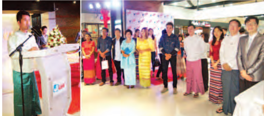
owif - wifnri? atnib&riav)