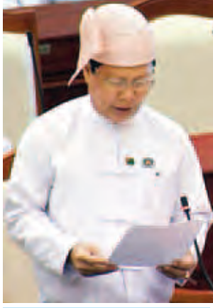
ပြည်သူ့လွှတ်တော်ကိုယ်စားလှယ် သူရဦးအောင်ကို။

အောင်ကျွန်းသည် သီးသန့်တည်ရှိသော ကျွန်းဖြစ်ပြီး အနီးဆုံးနေရာဖြစ်သည့် ရမ်းဗြဲမြို့နယ် အောင်လှပြင်မှ ရေမိုင်အကွာအဝေး ငါးမိုင်ခန့် ရှိသည့်အတွက် ဓာတ်အားလိုင်း တည်ဆောက်ရန် ခက်ခဲမှုရှိပါ၍ လက်ရှိအချိန်တွင် ဒီဇယ်ဓာတ်အားပေးစက်ဖြင့်သာ ဓာတ်အားပေးနေရပါကြောင်း ။ မာန်အောင်ကျွန်းပေါ်တွင် အသေးစား ဓာတ်အားစနစ်အသုံးပြု၍ ၂၄ နာရီ စီးပေးနိုင်ရေး ဆောင်ရွက်နိုင်ရန် စီစဉ်လျက်ရှိပါကြောင်း၊ ကနဦးစစ်ဆေးချက်များအရ မာန်အောင်မြို့အနီးတွင် ဇီဝဒြပ်ထု/ဇီဝဓာတ်ငွေ့ ဓာတ်အားပေးစက်နှင့် လေအားလျှပ်စစ်တို့ကို တစ်လှည့်စီအသုံးပြုမည့်စနစ်ဖြင့် ဓာတ်အားထုတ်လုပ်ပြီး ကျွန်းပေါ်ရှိ မြို့နှင့်ကျေးရွာများအားလုံးသို့ ၂၃ ကေဗီဓာတ်အားစနစ်ဖြင့် ဓာတ်အားပို့လွှတ် ဖြန့်ဖြူးပေးနိုင်ရန် ကနဦးလေ့လာမှုများကို ပြည်နယ်အစိုးရအဖွဲ့နှင့် ညှိနှိုင်းပြီး ဆောင်ရွက်လျက်ရှိပါကြောင်းနှင့် ဖြစ်မြောက်နိုင်စွမ်းပေါ်မူတည်၍ နိုင်ငံတော်မှ ရန်ပုံငွေခွဲဝေရရှိမှု၊ အတိုးနှုန်းသက်သာသော ပြည်တွင်း/ပြည်ပ ချေးငွေ ရရှိမှုအပေါ်မူတည်၍ ပြည်နယ်အစိုးရအဖွဲ့နှင့် ညှိနှိုင်းပြီး နှစ်အလိုက် အစီအစဉ်များ ချမှတ်၍ ဆောင်ရွက်ပေးမည်ဖြစ်ပါကြောင်းဖြင့် ပြန်လည်ရှင်းလင်းဖြေကြားသည်။ (သတင်းစဉ်)