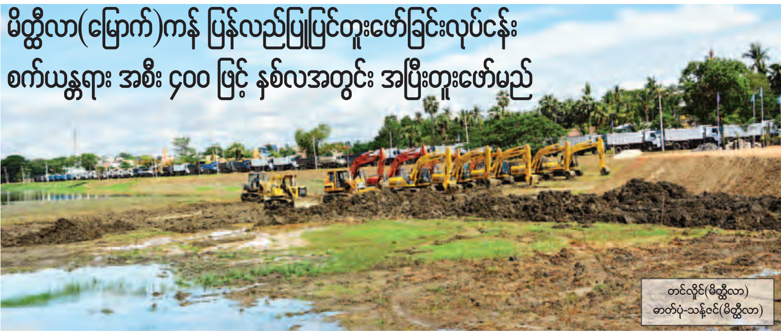
တင်လှိုင်(မိတ္ထီလာ) တက်ပုံ-သန့်ဝင်(မိတ္ထီလာ)