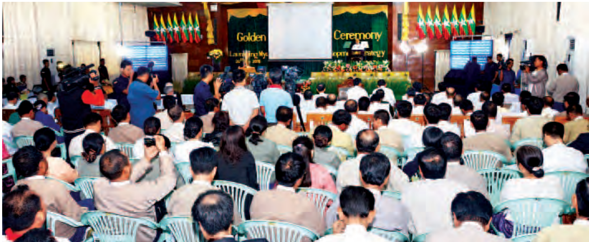
နိုင်ငံတော်သမ္မတ ဦးသိန်းစိန် အပြည်ပြည်ဆိုင်ရာ ဆန်စပါးသုတေသနဌာနမှ ရွှေစပါးနံဂုဏ်ပြုဆု ချီးမြှင့်ခြင်းအခမ်းအနားနှင့် မြန်မာ့ဆန်စပါးကဏ္ဍ ဖွံ့ဖြိုးတိုးတက်ရေး မဟာဗျူဟာအစီအစဉ် စတင်ဖွင့်လှစ်ခြင်း အခမ်းအနားတွင် အမှာစကားပြောကြားစဉ်။ (သတင်းစဉ်)