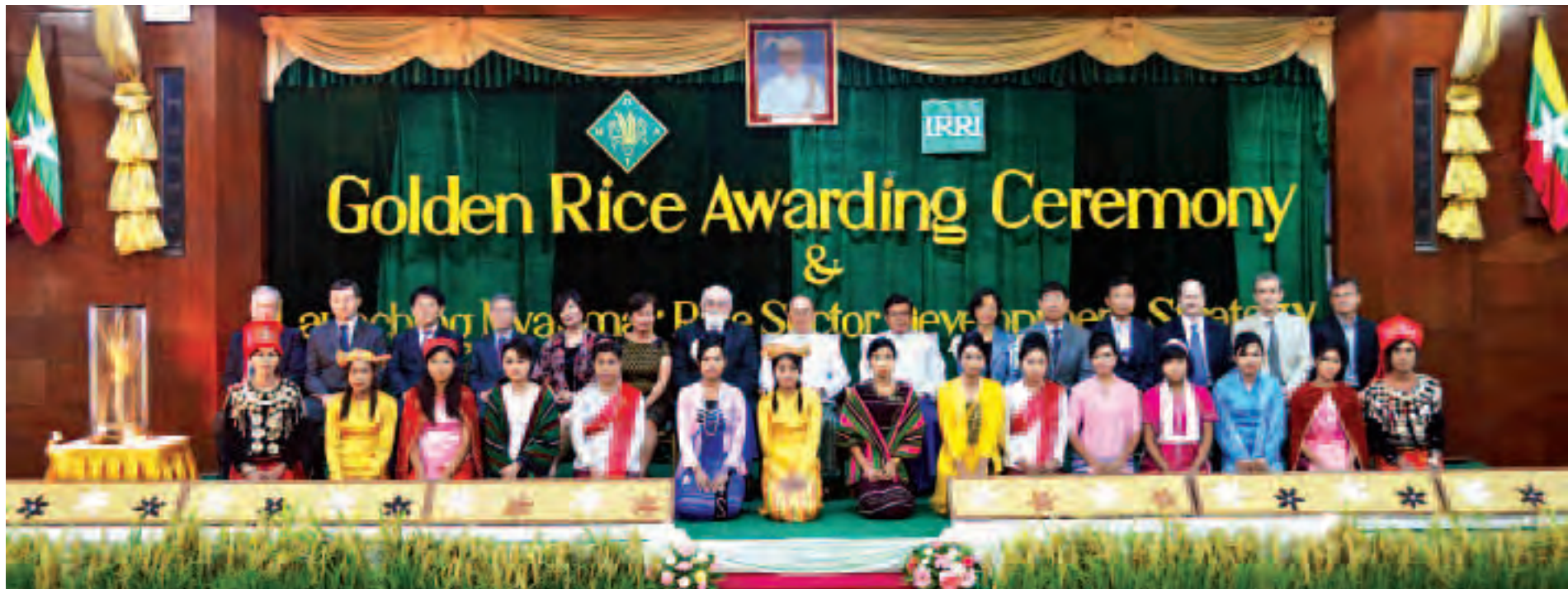
နိုင်ငံတော်သမ္မတ ဦးသိန်းစိန် အပြည်ပြည်ဆိုင်ရာ ဆန်စပါးသုတေသနဌာန (IRRI) မှ ညွှန်ကြားရေးမှူးချုပ်နှင့် ပညာရှင်များ တိုင်းရင်းသားကျောင်းသူများနှင့်အတူ စုပေါင်းမှတ်တမ်းတင်ဓာတ်ပုံရိုက်စဉ်။ (သတင်းစဉ်)