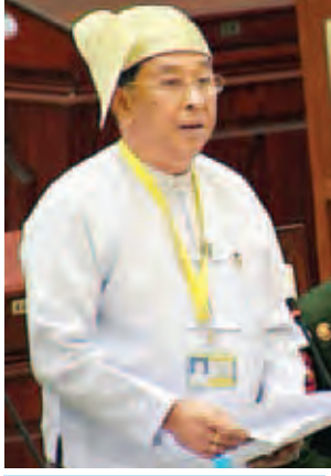
ဒုတိယဝန်ကြီး ဦးထင်အောင်။

သာ လျှပ်စစ်မီးရရှိနေပြီး ကျန် ၇၀ ရာခိုင်နှုန်းမှာ လျှပ်စစ်မီးသုံးစွဲခွင့်ရရှိရန် စောင့်ဆိုင်းတောင်းခံလျက်ရှိနေပါသဖြင့် ဓာတ်အားတိုးချဲ့ထုတ်လုပ်ပေးရန် လိုအပ်နေပါကြောင်း၊ နိုင်ငံတော်ဓာတ်အားစနစ်တွင်လည်း ဓာတ်အားသုံးစွဲမှု ၂၄၀၀ မဂ္ဂါဝပ်ခန့် ရှိနေပြီဖြစ်ပြီး မကြာမီ ၂၅၀၀ မဂ္ဂါဝပ်