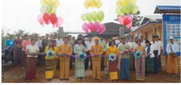
ကာလိ မေ ၁၉

ရှမ်းပြည်နယ်(တောင်ပိုင်း) လွိုင်လင်ခရိုင် ကာလိမြို့နယ် ပြန်ကြားရေးနှင့် ပြည်သူ့ဆက်သံရေးဦးစီးဌာနရုံး အဆောက်အအုံသစ်ဖွင့်ပွဲအခမ်းအနားကို မေ ၁၅ ရက်နံနက် ၈ နာရီက အဆိုပါရုံးရှေ့တွင်ကျင်းပခဲ့ကြောင်း သိရသည်။ အဆိုပါရုံးအဆောက်အအုံသစ်ဖွင့်ပွဲတွင် ပြန်ကြားရေးနှင့်ပြည်သူ့ဆက်သံရေးဦးစီးဌာန ရှမ်းပြည်နယ် ပြည်နယ်ဦးစီးမှူး ဦးစိုင်းဆမ်တစ်က ရုံးအဆောက်အအုံသစ်ဖွင့်လှစ်ခြင်းနှင့်ပတ်သက်၍ ရှင်းလင်းတင်ပြခဲ့သည်။ ရုံးအဆောက်အအုံသစ်နှင့်ပတ်သက်သော စာရွက်စာတမ်းများအား Ti Tan Sky ကုမ္ပဏီ စီမံကိန်းမန်နေဂျာ ဦးဝင်းအောင်က လွိုင်လင်ခရိုင် ပြန်ကြားရေးနှင့်ပြည်သူ့ဆက်သံရေးဦးစီးဌာန ခရိုင်ဦးစီးမှူးဒေါ်စမ်းစမ်းအေး ထံ လှူပြောင်းပေးအပ်ခဲ့ကြောင်း သိရသည်။