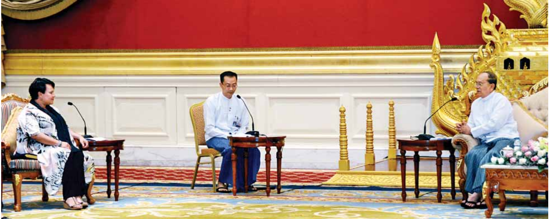
နေပြည်တော် မေ ၁၉

ပြည်ထောင်စုသမ္မတမြန်မာနိုင်ငံတော် နိုင်ငံတော်သမ္မတ ဦးသိန်းစိန်သည် နယ်သာလန်နိုင်ငံ လယ်ယာစိုက်ပျိုးရေးဝန်ကြီးဌာနဝန်ကြီး H.E.Mrs. Sharon Dijksma ဦးဆောင်သည့် ကိုယ်စားလှယ်အဖွဲ့အား ယနေ့ညနေ ခုနာရီတွင် နေပြည်တော်ရှိ နိုင်ငံတော်သမ္မတအိမ်တော် သံတမန်ဆောင် ဧည့်ခန်းမ၌ လက်ခံတွေ့ဆုံသည်။(အပေါ်ပုံ)