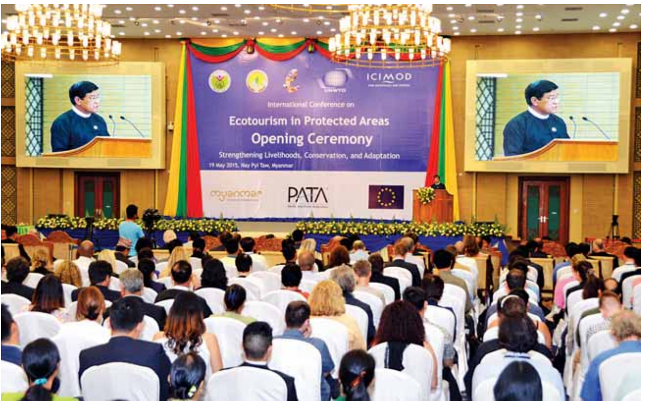
ဒုတိယသမ္မတ ဦးညွှန်ထွန်း အပြည်ပြည်ဆိုင်ရာ သဘာဝအခြေခံခရီးသွားလုပ်ငန်းကွန်ဗလင့် ဖွင့်ပွဲအခမ်းအနားတွင် အမှာစကားပြောကြားစဉ်။ (သတင်းစဉ်)

ဟိုတယ်နှင့်ခရီးသွားလာရေးလုပ်ငန်းဝန်ကြီးဌာနနှင့် သဘာဝပတ်ဝန်း ကျင် ထိန်းသိမ်းစောင့်ရှောက်ရေးနှင့် သစ်တောရေးရာဝန်ကြီးဌာနတို့သည် မြန်မာနိုင်ငံ သဘာဝအခြေခံခရီးသွားလုပ်ငန်းမူဝါဒနှင့် စီမံခန့်ခွဲမှုမဟာဗျူဟာ ရေးဆွဲရေးလုပ်ငန်းကို အတူတကွပူးပေါင်းဆောင်ရွက်လျက်ရှိပါကြောင်း၊ တောင်တန်းဒေသဖွံ့ဖြိုးတိုးတက်မှုဆိုင်ရာ နိုင်ငံတကာဗဟိုဌာန (ICIMOD) နှင့် ပူးပေါင်းဆောင်ရွက်မှု၊ ဥရောပသမဂ္ဂနှင့် မဟာမဲခေါင်ဒေသခွဲ သဘာဝ ပတ်ဝန်းကျင်ဗဟိုပြုအစီအစဉ်တို့၏ အထောက်အပံ့တို့ဖြင့် မြန်မာနိုင်ငံ