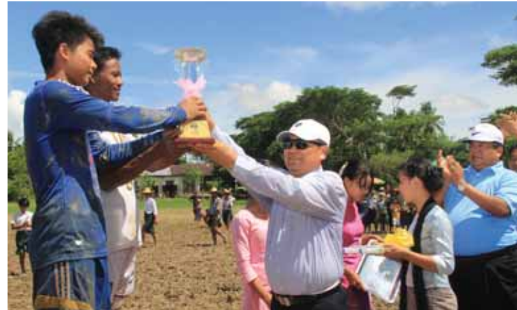
ဘောလုံးအသင်းအား ဆုတံဆိပ်၊ ဆုဖလားနှင့် ဆုကြေးငွေများအားလည်းကောင်း၊ တိုင်းဒေသကြီးလွှတ်တော်ကိုယ်စားလှယ် ဦးပြုံးချိုက ပူးတွဲတတိယဆုရ ကျပ်ငွေစု ဘောလုံးအသင်းနှင့် တယောကျွေးဘောလုံးအသင်းတို့အား ဆုကြေးငွေနှင့် ဆုဖလားတို့အားလည်းကောင်း၊ နှစ်သိမ်ဆုရဘောလုံးအသင်းများအား မြန်မာနိုင်ငံအိုလံပစ်ကော်မတီဝင် ဦးဌေးမြင့်က ဆုကြေးငွေများကိုလည်းကောင်း ဆက်လက်ချီးမြှင့်ခဲ့သည်။ (ကြည်စိုးလင်း)

ပုသိမ် မေ ၁၅ ဧရာဝတီတိုင်းဒေသကြီး မြောင်းမြခရိုင် မြောင်းမြမြို့နယ် ဒီးဒုတ်ဦးဘချိုရုပ်တု ဖွင့်ပွဲ အထိမ်းအမှတ်ဖလား ရန်မနိုင်တိုက်နယ်ကျေးရွာ အုပ်စု ဘောလုံးပြိုင်ပွဲကို မေ ၁၈ ရက် နံနက် ၇နာရီမှ စ၍ မြောင်းမြမြို့နယ် ရန်မနိုင်တိုက်နယ်ကျေးရွာ၌ ကျင်းပရာ မြန်မာနိုင်ငံ အိုလံပစ်ကော်မတီဥက္ကဋ္ဌ အားကစားဝန်ကြီးဌာန ပြည်ထောင်စုဝန်ကြီး ဦးတင့်ဆန်း တက်ရောက် အားပေးခဲ့သည်။ ပြင်ပအပြီးတွင် ဆုပေးပွဲအခမ်းအနားကို ဆက်လက်ကျင်းပရာ ပြည်ထောင်စုဝန်ကြီးက ပထမဆုရရှိသော ရန်မနိုင်ကျေးရွာ ဘောလုံးအသင်းအား ဆုတံဆိပ်၊ ဆုဖလားနှင့် ဆုကြေးငွေများ ချီးမြှင့်ခဲ့ပြီး ရန်မနိုင်ကျေးရွာဘောလုံးကွင်း ပြုပြင်ထိန်းသိမ်းရန်အတွက် အလှူငွေ ရှစ်သိန်း ပေးအပ်လျှူဒါန်းခဲ့သည်။ ဆက်လက်၍ တိုင်းဒေသကြီး ဘဏ္ဍာရေးဝန်ကြီး ဦးဝင်းကိုကိုက ဒုတိယဆုရ ကန်ဘူးလေး