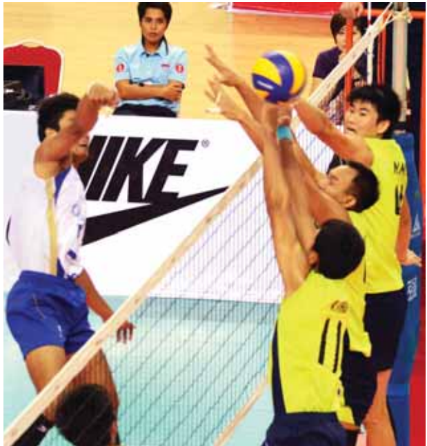
မြန်မာအသင်းနှင့် ထိုင်းအသင်းတို့ ယှဉ်ပြိုင်နေစဉ်။

မြန်မာနှင့်ထိုင်းနိုင်ငံအတွင်းရှိ ခရီးသွားလုပ်ငန်းဝန်ဆောင်မှုနှင့် ထုတ်ကုန်မြှင့်တင်ရန် ရည်ရွယ်ချက်ဖြင့် ထိုင်းခရီးသွားအာဏာပိုင်(TAT)နှင့် မြန်မာ့ ဟိုတယ်နှင့် ခရီးသွားလုပ်ငန်းဝန်ကြီးဌာနတို့သည် Mega Joint Familiarization Trip ခရီးစဉ်ကို ဖွင့်လှစ်လိုက်ပြီဖြစ်သည်။ ယခုနှစ်အကုန်တွင် အာဆီယံ စီးပွားရေးအသိုက်အဝန်းပေါ်ပေါက်ရေးအတွက် မြန်မာနှင့်ထိုင်းနိုင်ငံတို့ ပါဝင်အကောင်အထည်ဖော်နေချိန်၌ အဆိုပါခရီးစဉ်ကို ဖွင့်လှစ်လိုက်ခြင်းဖြစ်ကြောင်း ဗန်ကောက်မှလာသော သတင်းတစ်ရပ်အရ သိရသည်။