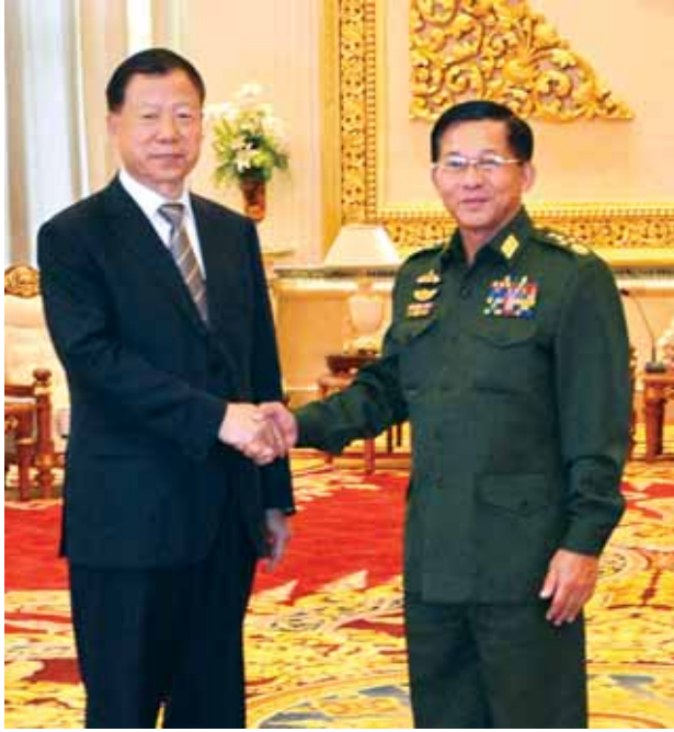
တပ်မတော်ကာကွယ်ရေးဦးစီးချုပ် ဗိုလ်ချုပ်မှူးကြီးမင်းအောင်လှိုင် တရုတ်ပြည်သူ့သမ္မတနိုင်ငံ တရုတ်ကွန်မြူနစ်ပါတီ ဗဟိုကော်မတီ နိုင်ငံခြား ဆက်ဆံရေးဝန်ကြီးဌာန ဒုတိယဝန်ကြီးအား တွေ့ဆုံနှုတ်ဆက်စဉ်။

တပ်မတော်နှင့်မြန်မာ့နိုင်ငံရေးဖြစ်စဉ်များသည် သမိုင်းကြောင်းအရ ခွဲခြား၍ မရပါကြောင်း၊ တပ်မတော်အနေဖြင့် တိုင်းပြည်တည်ငြိမ်အေးချမ်းအောင် တိုးတက်အောင် လုပ်ဆောင်နေခြင်းမှာလည်း သမိုင်းကြောင်းနှင့် ယှဉ်တွဲပါလာသည့် အခြေအနေဖြစ်ပါကြောင်း၊ တပ်မတော်သည် တိုင်းပြည် လွတ်လပ်ရေးရရှိအောင် ကြိုးပမ်းဆောင်ရွက်ခဲ့ပါကြောင်း၊ လွတ်လပ်ရေးရပြီး နောက်တွင်လည်း ပြည်တွင်း သောင်းကျန်းမှုပြဿနာများကို ထိန်းသိမ်းဖြေရှင်း၍ လက်ရှိအခြေအနေရောက်ရှိအောင် ကြိုးပမ်းဆောင်ရွက်ခဲ့ပါကြောင်း၊ သို့ဖြစ်၍ လက်ရှိအခြေအနေအား ပြောင်းလဲမသွားစေရန်နှင့် ယခုထက်ပိုမို ကောင်းမွန်တိုးတက်စေလိုကြောင်းဖြင့် တပ်မတော်ကာကွယ်ရေးဦးစီးချုပ် ဗိုလ်ချုပ်မှူးကြီးမင်းအောင်လှိုင်က ယနေ့မွန်းလွဲ ၁ နာရီတွင် တရုတ်ပြည်သူ့ သမ္မတနိုင်ငံ တရုတ်ကွန်မြူနစ်ပါတီ ဗဟိုကော်မတီ နိုင်ငံခြားဆက်ဆံရေး ဝန်ကြီးဌာန ဒုတိယဝန်ကြီး H.E.Mr. Chen Fengxiang အား ဇေယျာသီရိ ဗိမာန်ဧည့်ခန်းမဆောင်၌ လက်ခံတွေ့ဆုံရာတွင် ထည့်သွင်းပြောကြားသည်။ တွေ့ဆုံပွဲသို့ တပ်မတော်ကာကွယ်ရေးဦးစီးချုပ်နှင့် အတူ ဒုတိယ တပ်မတော် ကာကွယ်ရေးဦးစီးချုပ် ကာကွယ်ရေးဦးစီးချုပ်(ကြည်း) ဒုတိယ ဗိုလ်ချုပ်မှူးကြီးစိုးဝင်း၊ ကာကွယ်ရေးဦးစီးချုပ်ရုံး(ကြည်း)မှ တပ်မတော် အရာရှိကြီးများ တက်ရောက်ကြပြီး တရုတ်ကွန်မြူနစ်ပါတီ ဗဟိုကော်မတီ နိုင်ငံခြားဆက်ဆံရေးဝန်ကြီးဌာန ဒုတိယဝန်ကြီး H.E.Mr. Chen Fengxiang နှင့် တာဝန်ရှိသူများ တက်ရောက်ကြသည်။