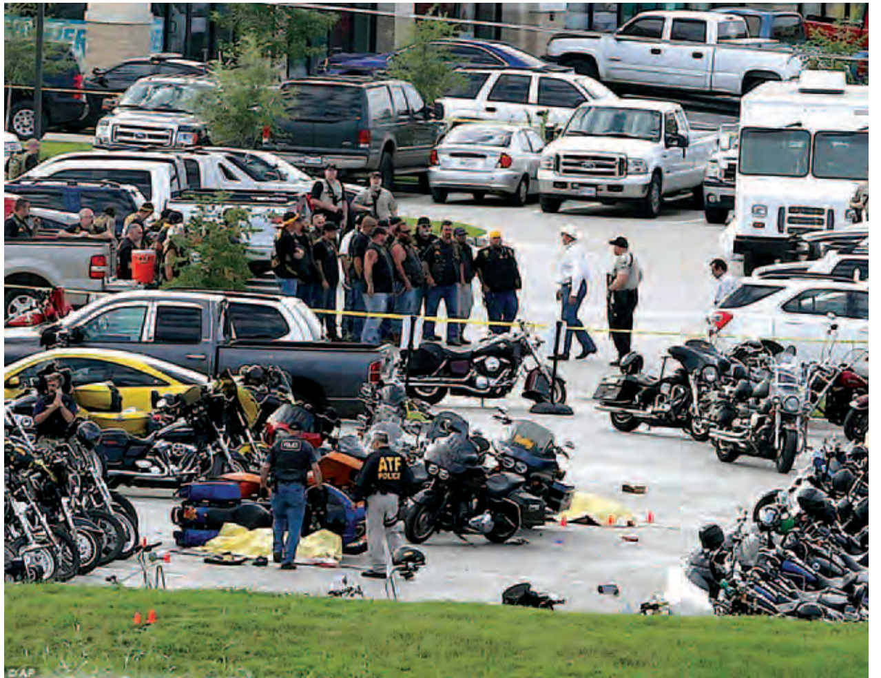
အမေရိကန်ပြည်ထောင်စု တက္ကဆက်ပြည်နယ် ဝါကိုမြို့တော်ရှိ 'ဝါကို တွင်းပိစ်'စားသောက်ဆိုင်တစ်ဆိုင်၏ ယာဉ်ရပ်နားရာနေရာတွင် မော်တော်ဆိုင်ကယ်ဂိုဏ်းများ သေနတ်ပစ်ခတ်မှု ဖြစ်ပွားခဲ့ပြီးနောက် ရဲအရာရှိများက စုံစမ်းစစ်ဆေးနေစဉ်။

ဝါကို မေ ၁၈ အမေရိကန်ပြည်ထောင်စု တက္ကဆက်ပြည်နယ် ဝါကိုမြို့တော်ရှိ 'ဝါကို တွင်းပိစ်'စားသောက်ဆိုင်တစ်ဆိုင်၏ ယာဉ်ရပ်နားရာနေရာတွင် မေ ၁၇ ရက်က မော်တော်ဆိုင်ကယ်ဂိုဏ်းများ သေနတ်ပစ်ခတ်မှု ဖြစ်ပွားခဲ့ရာ လူကိုးဦးသေဆုံးပြီး အများအပြား