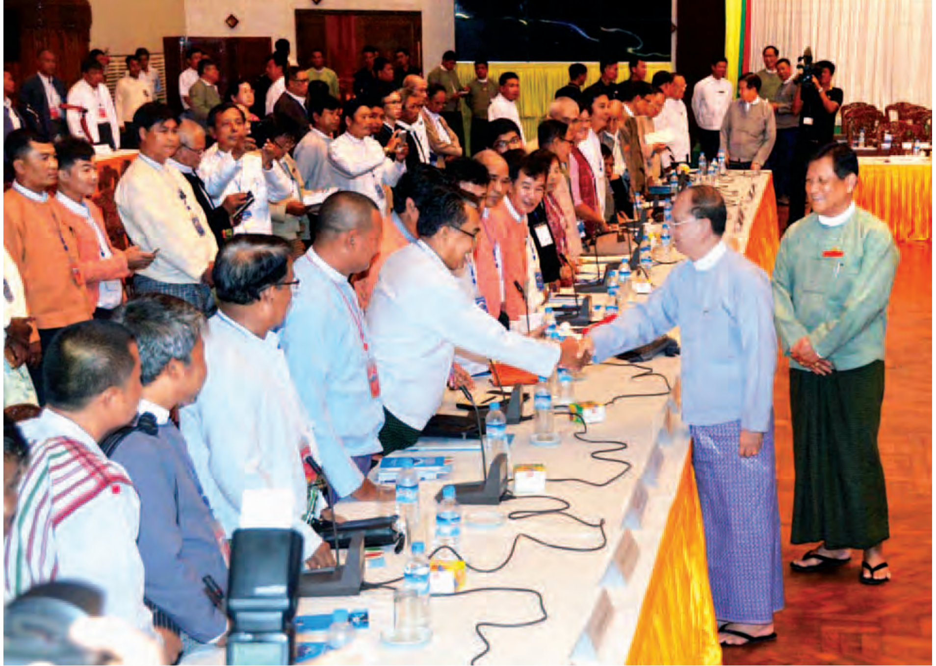
နိုင်ငံတော်သမ္မတ ဦးသိန်းစိန် တွေ့ဆုံပွဲသို့တက်ရောက်လာကြသည့် နိုင်ငံရေးပါတီခေါင်းဆောင်များအား ရင်းရင်းနှီးနှီးနှုတ်ဆက်စဉ်။ (သတင်းစဉ်)