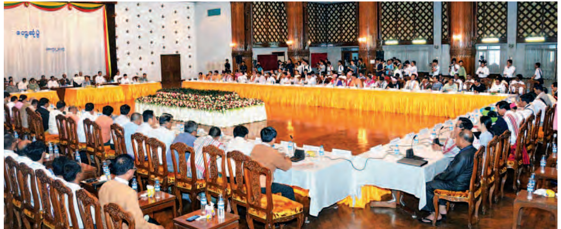
နိုင်ငံတော်သမ္မတ ဦးသိန်းစိန် ရန်ကုန်မြို့ရှိ ရန်ကုန်တိုင်းဒေသကြီးအစိုးရအဖွဲ့မှ မင်္ဂလာခန်းမ၌ နိုင်ငံရေးပါတီခေါင်းဆောင်များနှင့် တွေ့ဆုံသည်။

အဖြစ်လည်း ပြဋ္ဌာန်းပြီးဖြစ်ပါကြောင်း၊ ဤဥပဒေအရ မြန်မာနိုင်ငံကိုပင်ရင်း နိုင်ငံအဖြစ် သတ်မှတ်ပြီး အစဉ်အဆက်နေထိုင်ခဲ့ကြသည့် တိုင်းရင်းသားလူမျိုးများအနေဖြင့် မိမိတို့၏ ဘာသာစကား၊ စာပေ၊ အနုပညာနှင့် ဓလေ့ထုံးတမ်း၊ ကိုးကွယ်ရာဘာသာနှင့်ဆိုင်သည့်ကိစ္စများ၊ ဥပဒေနှင့်အညီ လွတ်လွတ်လပ်လပ် ဆောင်ရွက်ခွင့်ရရှိထားပြီး ဖြစ်ပါကြောင်း၊ ဤအခွင့်အရေးများ အပြည့်အဝ ကျင့်သုံးနိုင်ရန် ဆက်လက်ကြိုးပမ်းရမည့်ကိစ္စများတွင် အစိုးရကလုပ်ပေးရမည့် အပိုင်းပါသကဲ့သို့ ဥပဒေပြုရေးနှင့် တရားရေးဏ္ဍိုင်ဘက်က ဆောင်ရွက်ရမည့် လည်း ရှိပါကြောင်း၊ နိုင်ငံရေးပါတီများအပြင် အရပ်ဘက်လူအဖွဲ့အစည်းများနှင့်