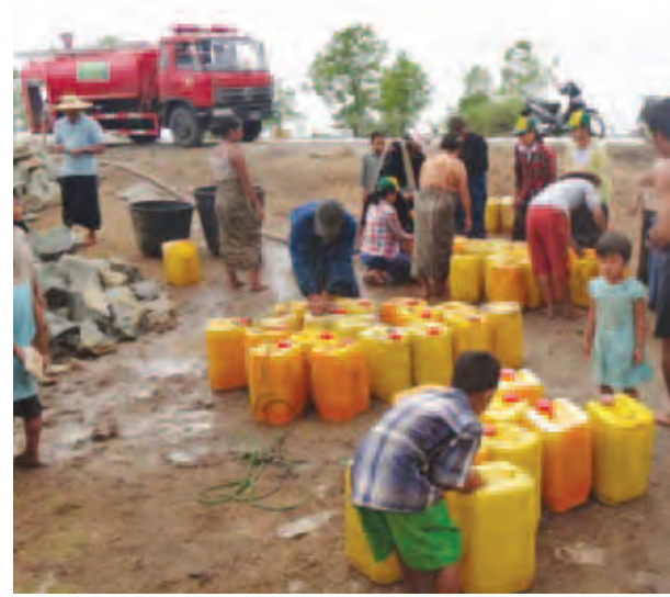
လပွတ္တာ မေ ၁၈

လပွတ္တာ-မြောင်းမြ ကားလမ်းဘေး သောက်သုံးရေရှားပါးသော ကျေးရွာအိမ်ထောင်စုများသို့ သောက်သုံးရေလှူဒါန်းပေးရန်အတွက် ဧရာဝတီတိုင်းဒေသကြီး စိုက်ပျိုးရေးဦးစီးဌာန၏ စီစဉ်မှုဖြင့် တိုင်းဒေသကြီး စိုက်ပျိုးရေးဦးစီးမှူးရုံး လပွတ္တာခရိုင်နှင့် လပွတ္တာမြို့နယ် ဝန်ထမ်းမိသားစုများ၏ စုပေါင်းလှူဒါန်းငွေများဖြင့် သောက်သုံးရေရှားပါးသော ကျေးရွာ၊ အိမ်ထောင်စုများအား မေ ၁၆ ရက်က သောက်သုံးရေလှူဒါန်းခဲ့သည်။ ယင်းသောက်သုံးရေရှားပါးသော ကျေးရွာအိမ်စုများအား သောက်သုံးရေလှူဒါန်းရန်အတွက် လပွတ္တာမြို့နယ် မီးသတ်ဦးစီးဌာနမှ ရေသယ်ကားတစ်စီးနှင့် သီးသန့်ရေသယ်ကားတစ်စီးတို့ဖြင့် သောက်သုံးရေဂါလန် ၂၀၀၀ တင်ဆောင်ပြီး လပွတ္တာ-မြောင်းမြ ကားလမ်းဘေး သောက်သုံးရေရှားပါးသော ခုနစ်မိုင်၊ ကိုးမိုင်နှစ်ဖာလုံ ၁၀ မိုင် လေးဖာလုံ ၁၁ မိုင် နှစ်ဖာလုံတို့ရှိ အိမ်စုများနှင့် ငဖော်ကျေးရွာအပါအဝင် စုစုပေါင်းအိမ်ခြေ ၂၆ အိမ် လူဦးရေ ၄၀၅ ဦးတို့အတွက် သောက်သုံးရေများ သွားရောက်လှူဒါန်းရာ ဒေသခံပြည်သူများက ပလတ်စတစ်ပုံးများ သုံးပုံးများဖြင့် သောက်သုံးရေများကို လာရောက်သယ်ယူကြသည်။ အဆိုပါ လပွတ္တာမြို့နယ်နှင့် လပွတ္တာ-မြောင်းမြ ကားလမ်းဘေးကျေးရွာများမှ သောက်သုံးရေရှားပါးသောကျေးရွာ၊ အိမ်ထောင်စုများအား လပွတ္တာခရိုင်နှင့် လပွတ္တာမြို့နယ် စိုက်ပျိုးရေးဦးစီးဌာနတို့မှ သောက်သုံးရေများ ဆက်လက်လှူဒါန်းသွားမည်ဖြစ်ကြောင်း သိရသည်။ မော်ကျန်း(မြင့်အောင်)