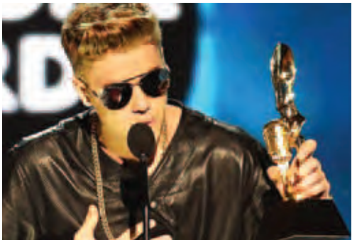
ဂျတ်စတင်ဘီဘာ

အမေရိကန် လက်စ်ဗီးဂတ်စ်တွင် ဧပြီ ၁၇ ရက် တနင်္ဂနွေနေ့က ကျင်းပခဲ့သော ၂၀၁၅ ခုနှစ် ဘောဘုတ်ဂီတဆုပေးပွဲတွင် တေလာဆွစ်သည် ဆုအများဆုံးရရှိခဲ့ပြီး ဆုတော်တော်များများကို သူ သာ ရယူသွားခဲ့သည့်အတွက် ထိုညသည် တေလာ၏ ညသာဖြစ်ခဲ့ရသည်ဟု မီဒီယာများက ရေးသားဖော်ပြ ခဲ့ကြသည်။