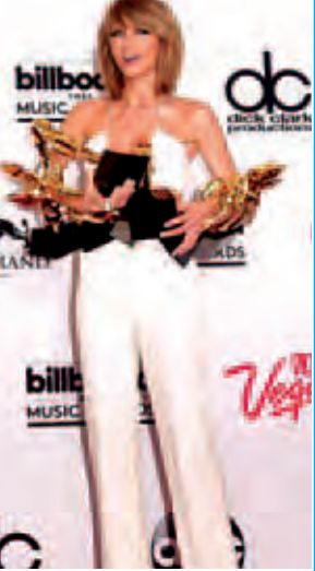
တေလာဆွစ်