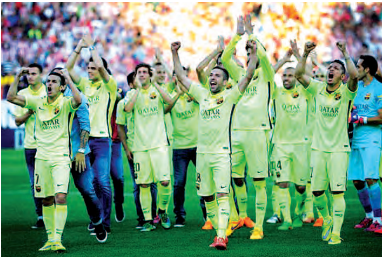
ဘာစီလိုနာအသင်း အက်သလက်တီကိုမက်ဒရစ်အသင်းကို အနိုင်ရရှိပြီး အောင်ပွဲခံစဉ်။

ထို့ပြင် ဘာစီလိုနာအသင်းသည် လာလီဂါဖလားကို ရယူဆွတ်ခူးနိုင်ခဲ့ပြီး နောက် တစ်နှစ်တည်းဖလားသုံးလုံး ရယူနိုင်မည့်လမ်းကြောင်းပေါ် ကိုလည်း