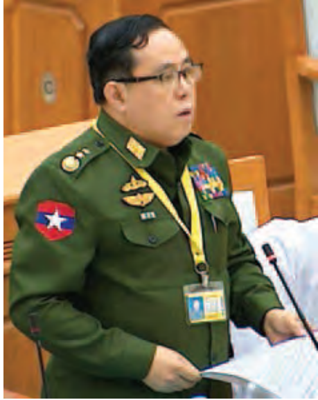
ကာကွယ်ရေးဝန်ကြီးဌာန ပြည်ထောင်စုဝန်ကြီး ဒုတိယဗိုလ်ချုပ်ကြီးဝေလွင်

နေပြည်တော် မေ ၁၄ ပထမအကြိမ် ပြည်ထောင်စုလွှတ်တော် (၁၂)ကြိမ်မြောက် ပုံမှန်အစည်းအဝေး (၄၅)ရက်မြောက်နေ့ကို ယနေ့မနက် ၁ နာရီခွဲတွင် ကျင်းပပြီး အဆိုတစ်ခု တင်သွင်းခြင်း၊ လူဦးရေတိုးပွားနှုန်းထိန်းညှိခြင်းဆိုင်ရာ ကျန်းမာရေးစောင့်ရှောက်မှုဥပဒေကြမ်း၊ ပြည်တွင်းရေး ကြောင်းသွားရေယာဉ်ဥပဒေကြမ်းနှင့် မြန်မာနိုင်ငံသူနာပြု နှင့် သားဖွားကောင်စီဥပဒေကြမ်းတို့အား တစ်ပိုင်းချင်းစီ အလိုက် လွှတ်တော်၏ အဆုံးအဖြတ်ရယူ အတည်ပြုခဲ့ကြ သည်။ အစည်းအဝေးတွင် နိုင်ငံတော်သမ္မတ၏ ဥပဒေကဲ့သို့ အာဏာတည်သော အမိန့်အမှတ် (၁/၂၀၁၅) အရေးပေါ် အခြေအနေကြေညာခြင်းအပေါ် ထပ်မံ၍ ရက်ပေါင်း ၉၀ အထိ ဆက်လက်အတည်ပြုစေရေးအတွက် လွှတ်တော်က အတည်ပြုပေးရန် အဆိုကို ကာကွယ်ရေးဝန်ကြီးဌာန ပြည်ထောင်စုဝန်ကြီး ဒုတိယဗိုလ်ချုပ်ကြီးဝေလွင်က လွှတ်တော်သို့ တင်သွင်းသည်။ အဆိုတင်သွင်းရာတွင် ပြည်ထောင်စုဝန်ကြီးက ရှမ်းပြည်နယ် ကိုးကန့်ကိုယ်ပိုင်အုပ်ချုပ်ခွင့်ရဒေသတွင်