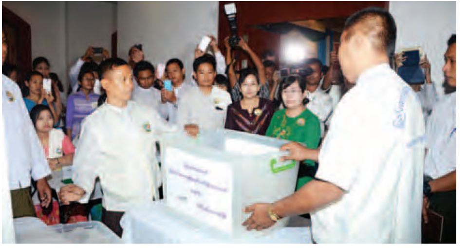
ပြည်ထောင်စုရွေးကောက်ပွဲကော်မရှင်နှင့် အရပ်ဘက်လူမှုအဖွဲ့အစည်းများအကြား ပူးပေါင်းညှိနှိုင်းမှုဆိုင်ရာ အစည်းအဝေးတွင် ရွေးကောက်ပွဲညှိ မဲဆန္ဒပေးခြင်း၊ ဆန္ဒမဲများ စနစ်တကျစိစစ်ကောက်ခံခြင်း သရုပ်ပြသမှုများကို သတင်းမီဒီယာများအား ရှင်းလင်းပြသစဉ်။

သည့်မဲသည် ပယ်မဲဖြစ်ရေးတို့ကို လူမှု အဖွဲ့အစည်းများအနေဖြင့် ပြည်သူလူထုကို အသိပညာပေးရန် လိုအပ်ကြောင်း။ ကော်မရှင်အနေဖြင့် ၂၀၁၅ ခုနှစ် အထွေထွေ ရွေးကောက်ပွဲကို လွတ်လပ်မျှတပြီး ပွင့်လင်းမြင်သာစွာ ကျင်းပပေးသွားမည်ဖြစ်ကြောင်း၊ ရွေးကောက်ပွဲသည် မျှတမှုရှိ၊ မရှိ၊ ပွင့်လင်းမြင်သာမှုရှိ၊ မရှိကို လေ့လာအကဲခတ်နိုင်ရန် စောင့်ကြည့်လေ့လာရေး လူမှုအဖွဲ့အစည်းများကို ဖိတ်ခေါ်ထားကြောင်း၊ လူမှုအဖွဲ့အစည်းများအနေဖြင့် စောင့်ကြည့်လေ့လာသည့်အခါ ဥပဒေနှင့်အညီ ဖြစ်၊ မဖြစ်ကို အလေးထား ကြည့်ရှုရန် လိုကြောင်း၊ ရွေးကောက်ပွဲဆိုင်ရာ ဥပဒေ၊ နည်းဥပဒေများနှင့် အမိန့်ညွှန်ကြားချက်များကို သိရှိအောင်