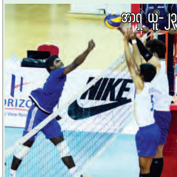
အာရှ ယူ-၂၃