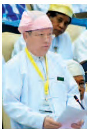
သမ္မတရုံးဝန်ကြီးဌာန(၄) ဒုတိယဝန်ကြီး ဦးအောင်သိမ်း။

အဆိုပါ ပြန်လည်စွန့်လွှတ်လယ်မြေ များအား မူလလယ်သမားများထံ ယာယီလုပ်ပိုင်ခွင့်ပုံစံ(၃)ပြန်လည် ပေးအပ်နိုင်ရေး (ရပ်/ကျေး) မြို့နယ်/ ခရိုင် မြေအသုံးချမှုစီမံခန့်ခွဲရေး ကော်မတီတို့မှ စိစစ်ဆောင်ရွက်ခဲ့ရာ တွင် ကျွန်းကျွန်းကျေးရွာအုပ်စုရှိ လယ်မြေ(၆၀၆ ဒသမ ၁၀)ဧကအား လယ်သမား(၇၇) ဦးနှင့် ဆားတလင်း ကျေးရွာအုပ်စုမှ လယ်မြေ(၁၉ ဒသမ ၃၅) ဧကအား လယ်သမားတစ်ဦး စုစုပေါင်းလယ်သမား (၇၈)ဦးတို့အား စိစစ်နိုင်ခဲ့ကြောင်း၊ စုစုပေါင်းဧရိယာ (၆၂၅ ဒသမ ၄၅) ဧကကို လယ် သမား (၇၈)ဦးတို့အား ရန်ကုန်တိုင်း ဒေသကြီး မြေအသုံးချမှုစီမံခန့်ခွဲရေး ကော်မတီဥက္ကဋ္ဌ တိုင်းဒေသကြီး ဝန်ကြီးချုပ်ကြီးမျိုး၍(၃၀-၂-၂၀၁၅)