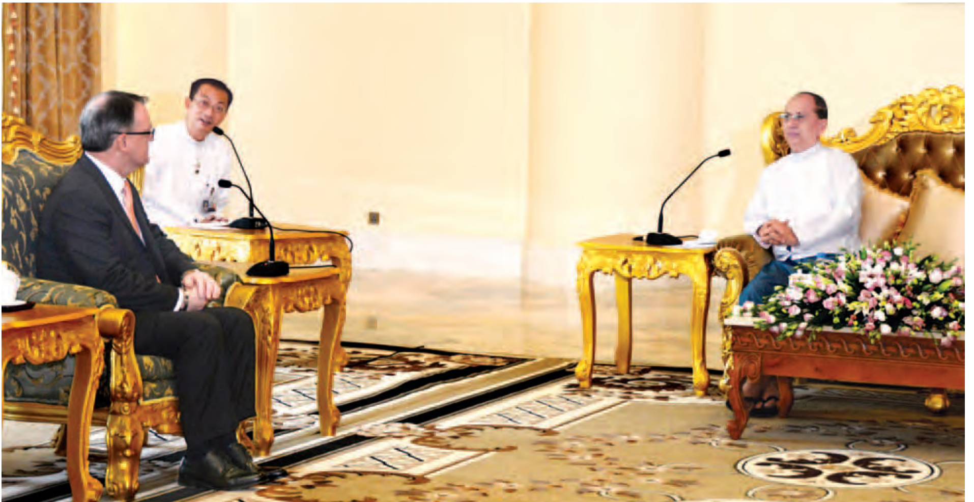
နိုင်ငံတော်သမ္မတ ဦးသိန်းစိန် (ဝဲဘက်) နှင့် အမှုဆောင်အရာရှိချုပ် ဒေါ်ခင်မာမာ (ညာဘက်) တို့ တွေ့ဆုံရင်း ဖြစ်ပုံ။

ယခုနှစ်တွင် ပြည်တွင်းပြည်ပ ရင်းနှီးမြှုပ်နှံသူများက ဟိုတယ်ကဏ္ဍ၌ အမေရိကန်ဒေါ်လာ သုံးဘီလီယံထိ ရင်းနှီးမြှုပ်နှံမည်ဟု မျှော်မှန်းထား