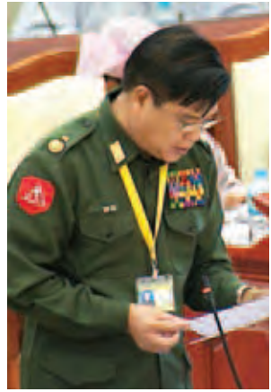
ကာကွယ်ရေးဝန်ကြီးဌာန ဒုတိယဝန်ကြီး ဗိုလ်ချုပ်ကျော်ညွန့်။

ပထမအကြိမ် ပြည်သူ့လွှတ်တော် (၁၂)ကြိမ်မြောက် ပုံမှန်အစည်းအဝေး (၄၆) ရက်မြောက်နေ့ကို ယနေ့နံနက် ၁၀ နာရီတွင် လွှတ်တော်အဆောက်အအုံ ပြည်သူ့လွှတ်တော်အစည်းအဝေးခန်းမ၌ ကျင်းပရာ မေးခွန်းများ မေးမြန်း ဖြေကြားခြင်းနှင့် ဥပဒေကြမ်းတစ်ခုတင်သွင်းခြင်းတို့ ဆောင်ရွက်ခဲ့ကြ သည်။ အစည်းအဝေးတွင် နတ်တလင်းမဲဆန္ဒနယ်မှ ဦးရဲထွဋ်ဦး၏ နိုင်ငံတော် ကာကွယ်ရေး တာဝန်ထမ်းဆောင်ရေးကြေညာချက် တစ်မတော်သားများအား တန်းပြည့်စစ်မှုထမ်းချိန် သတ်မှတ်ထားသည့် စစ်ဆင်ရေး၊ လုံခြုံရေးတာဝန် ထမ်းဆောင်ချိန်တွင် လစာနှင့်ညီမျှသော ထောက်ပံ့သောငွေချီးမြှင့်ပေးရန် အစီအစဉ် ရှိ မရှိ မေးခွန်းနှင့်စပ်လျဉ်း၍ ကာကွယ်ရေးဝန်ကြီးဌာန ဒုတိယ ဝန်ကြီး ဗိုလ်ချုပ်ကျော်ညွန့်က နိုင်ငံတော်ကာကွယ်ရေးနှင့် လုံခြုံရေးတာဝန်များ ထမ်းဆောင်ကြရာတွင် အချိန်ပြည့် ၂၄ နာရီ တာဝန်ရှိပြီး သက်စွန့်ပြီးပမ်း စွန့်လွှတ်စွန့်စားဆောင်ရွက်နေကြရသဖြင့် ပင်ပန်းကြမ်းတမ်းမှုနှင့် သက်စွန့် တာဝန်စရိတ်အား လစဉ် ယခင် ၅၀၀၀ ကျပ်စီကို ယခု ၁၀၀၀၀ ကျပ်စီအဖြစ် တိုးမြှင့်ပြီး တပ်သားအဆင့်မှ ဗိုလ်ချုပ်မှူးကြီးအဆင့်အထိ ခံစားခွင့်ပြုထား ပါကြောင်း။ တပ်မတော်သားများအတွက် လစာနှုန်းထားများကို စစ်ဆင်ရေး၊ လုံခြုံ ရေးတာဝန်ထမ်းဆောင်နေချိန်နှင့် သာမန်တာဝန်ထမ်းဆောင်နေချိန်ဟူ၍