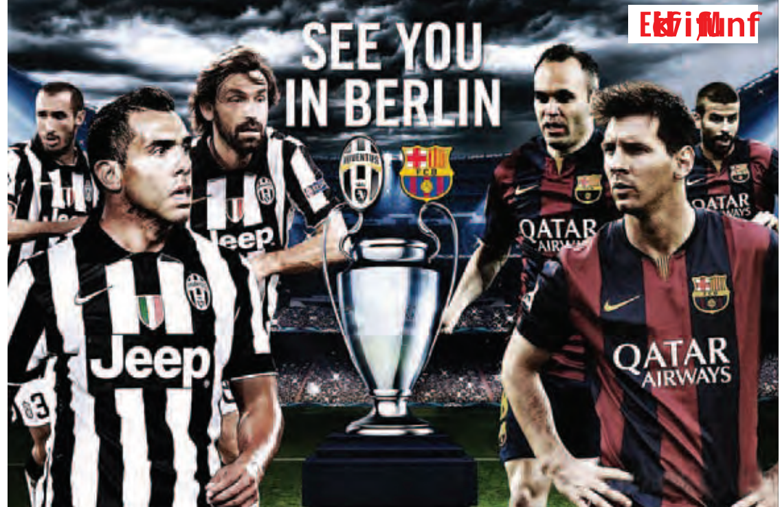
အီတလီစီးရီးအေကလပ် ဂျူဗင်တပ်အသင်းသည် ချန်ပီယံလိဂ်ဆီမီးဖိုင်နယ်အဆင့်တွင် ရီးယဲလ်မက်ဒရစ်အသင်းအား နှစ်ကျောပေါင်း ရလဒ် သုံးဂိုး-နှစ်ဂိုးဖြင့် အနိုင်ရရှိခဲ့ပြီး ချန်ပီယံလိဂ်နောက်ဆုံးပိုလ်လုပွဲသို့ တက်လှမ်းလာခဲ့ရာ ပိုလ်လုပွဲတွင် ဘိုင်ယန်မြူးနစ်အသင်းအား ငါးဂိုး-သုံးဂိုးဖြင့် အနိုင်ရရှိခဲ့သည့် စပိန်လာလီဂါကလပ် ဘာစီလိုနာအသင်းနှင့် ထိပ်တိုက်တွေ့ဆုံမည်ဖြစ်သည်။

ဂျူဗင်တပ်အသင်းသည် ၂၀၀၂-၂၀၀၃ ဘောလုံးရာသီနောက်ပိုင်း ချန်ပီယံလိဂ် နောက်ဆုံးပိုလ်လုပွဲသို့ ပထမဆုံးအကြိမ်တက် လှမ်းခဲ့ခြင်းဖြစ်ပြီး အဆိုပါပိုလ်လုပွဲတွင် အင်တာ မီလန်အား သုံးဂိုး-နှစ်ဂိုးဖြင့် ရှုံးနိမ့်ကာ ချန်ပီယံလိဂ်ဖလားချန်ပီယံအဖြစ်မှ လွှဲခဲ့ရသည်။ ဂျူဗင်တပ်အသင်းသည် ရီးယဲလ်မက်ဒရစ် အသင်းအား ပထမအကျော့ တူရင်မြို့တွင် ကစားခဲ့စဉ်က နှစ်ဂိုး-တစ်ဂိုးဖြင့် အနိုင်ရရှိ ထားခဲ့ပြီး ယခုဒုတိယအကျော့ ဘာနေဗျူးတွင်း တွင် တစ်ဖက်တစ်ဂိုးစီ သရေပွဲဖြစ်ခဲ့ခြင်း ကြောင့် နှစ်ကျော့ပေါင်း သုံးဂိုး-နှစ်ဂိုးဖြင့် အနိုင်ရရှိခဲ့ခြင်းဖြစ်သည်။ ဂျူဗင်တပ်အသင်းသည် လက်ရှိတွင် အီတလီစီးရီးအေဖလားကိုလည်း ရယူဆွတ်ခူး ထားနိုင်ခဲ့သည့်အသင်းဖြစ်သည်။ ရီးယဲလ် မက်ဒရစ်အသင်းမှာမူ လာလီဂါအမှတ်ပေး ဇယားတွင် ဘာစီလိုနာ၏နောက် လေးမှတ် အကွာဖြင့် အမှတ်ပေးဇယားဒုတိယနေရာတွင် ရပ်တည်နေခြင်းကြောင့် လာလီဂါဖလားရဖို့ မျှော်လင့်ချက်မရှိတော့သလို ယခု ဂျူဗင်တပ် အသင်းကို ရှုံးနိမ့်ခဲ့ခြင်းကြောင့် ချန်ပီယံ လိဂ်ဖလားကိုပါ ထပ်မံလက်လွှတ်လိုက်ရပြီ ဖြစ်၍ ယခုနှစ် ဘောလုံးရာသီတွင်မူ ရီးယဲလ် မက်ဒရစ်အသင်းအတွက် ဖလားလက်မှတ်ရာသီ ကို ဖြတ်သန်းရတော့မည်ဖြစ်သည်။