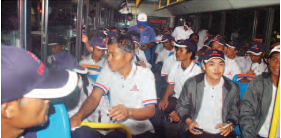
ပြန်လည်ရောက်ရှိလာသည့် ရေလုပ်သားများအား ရန်ကုန်အပြည်ပြည်ဆိုင်ရာလေဆိပ်တွင် တွေ့ရစဉ်။

ယနေ့မြန်မာနိုင်ငံသို့ ပြန်လည် ရောက်ရှိလာသည့် အင်ဒိုနီးရှားနိုင်ငံ သို့ လူကုန်ကူးခံရသည့် မြန်မာ ရေလုပ်သား ၁၂၅ ဦးတွင် ဧရာဝတီ တိုင်းဒေသကြီးမှ ၃၃ ဦး၊ တနင်္သာရီ တိုင်းဒေသကြီးမှ ၁၄ ဦး၊ ရခိုင်ပြည် နယ်မှ ၁၄ ဦး၊ ရန်ကုန်တိုင်းဒေသကြီးမှ ၁၄ ဦး၊ ပဲခူးတိုင်းဒေသကြီးမှ ၂၂ ဦး၊ မွန်ပြည်နယ်မှ ၁၄ ဦး၊ မကွေးတိုင်း ဒေသကြီးမှ ၆ ဦး၊ မန္တလေးတိုင်း ဒေသကြီးမှ ၁ ဦး၊ ကရင်ပြည်နယ်မှ လေးဦးနှင့် နေပြည်တော်မှ တစ်ဦးတို့ ဖြစ်ကြောင်း သိရသည်။ ။