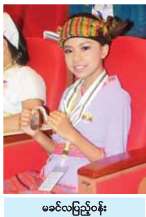
မခင်လပြည့်ဝန်း