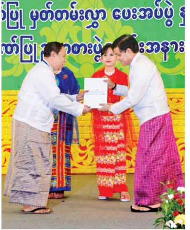
ဒုတိယသမ္မတ ဦးညွှန်ထွန်း အကအကဖြတ်လုပ်ငန်းအဖွဲ့ဥက္ကဋ္ဌ ဦးအောင်တင်ဝင်းအား ဂုဏ်ပြုပွဲတမ်းလွှာပေးအပ်ချီးမြှင့်စဉ်။ (သတင်းစဉ်)