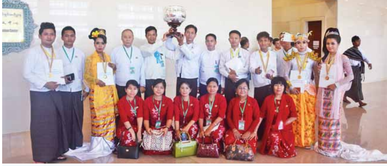
(၂၁) ကြိမ်မြောက် အဆို၊ အက၊ အရေး၊ အတီးပြိုင်ပွဲတွင် ဆုအများဆုံးရရှိသည့် ရန်ကုန်တိုင်းဒေသကြီးမှ ပြိုင်ပွဲဝင်အချို့နှင့် အုပ်ချုပ်သူများကို တံခွန်စိုက်ဖလားနှင့်အတူ တွေ့ရစဉ်။

ပြိုင်ပွဲကြီးပြီးဆုံး၍ မိမိတို့ နေထိုင်ရာ ပြည်နယ်နှင့် တိုင်းဒေသကြီးအသီးသီးသို့ ပြန်ကြတော့မည်ဖြစ်သော တိုင်းရင်းသားညီအစ်ကိုမောင်နှမ အနုပညာရှင်များ၏ ရင်တွင်းဝယ် ယဉ်ကျေးမှုကို ထိန်းသိမ်းရင်း ဝါသနာရှင်အဆင့်မှ ပညာရှင်အဆင့်သို့တိုင် လေ့လာဆည်းပူးကာ မျိုးဆက်သစ်အနုပညာရှင်များကို ပြုစုပျိုးထောင်၍ ရိုးရာယဉ်ကျေးမှုအနုပညာပေးပို့ပေးရန်အတွက် အစဉ်မပြတ် စီးဆင်းစေအောင် လက်ဆင့်ကမ်းသယ်ဆောင်သွားမည် ဟု ယုံကြည်ပါကြောင်း ဂုဏ်ပြု ရေးသားအပ်ပါသည်။ ။