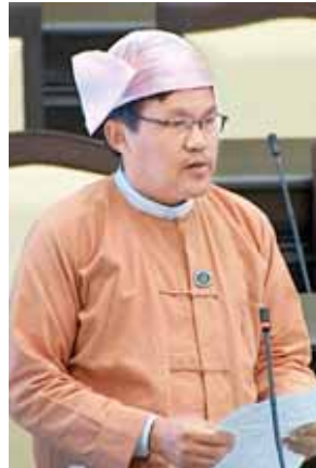
ဦးဖုန်းမြင့်အောင်။

အခြေအနေတွင် ဖွင့်လှစ်ပေးနိုင်ခြင်း မရှိသေးပါကြောင်းဖြင့် ပြန်လည်ရှင်းလင်းဖြေကြားသည်။ ထို့နောက် ရန်ကုန်တိုင်းဒေသကြီး မဲဆန္ဒနယ် အမှတ်(၃)မှ လွှတ်တော်ကိုယ်စားလှယ် ဦးဖုန်းမြင့်အောင်၏ “စာမေးပွဲဖြေဆိုမည့် ကျောင်းသားကျောင်းသူများကို ကျောင်းဝင်းအတွင်း ကြိုတင်ဝင်ရောက်ခွင့်ပြုပေးပါရန်” မေးခွန်းနှင့် စပ်လျဉ်း၍ ပညာရေးဝန်ကြီးဌာန ဒုတိယဝန်ကြီး ဦးသန့်ရှင်းက ဖြေကြားရာတွင်