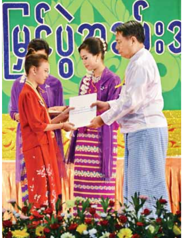
ပြည်ထောင်စုဝန်ကြီး ဦးအေးမြင့်ကြူ အခြေခံအဆင့် အသက် (၁၅) နှစ်မှ (၂၀) နှစ် အမျိုးသမီး မဟာဂီတအဆိုပြိုင်ပွဲတွင် ဆုရရှိသူတစ်ဦးအား ဆုပေးအပ်ချီးမြှင့်စဉ်။ (သတင်းစဉ်)

ယင်းနောက် ပြည်ထောင်စုဝန်ကြီး မောင်ကျော်ဆုဟိန်း (ရှမ်းပြည်နယ်)အား ဆုပေးအပ် ချီးမြှင့်စဉ်။ (သတင်းစဉ်)