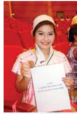
နန်းမြကေခိုင်လွင်