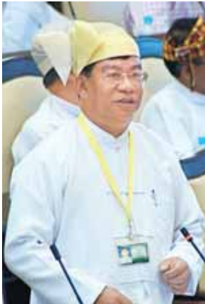
ဒုတိယဝန်ကြီး ဦးသန့်ရှင်း။

ပထမအကြိမ် အမျိုးသားလွှတ်တော် (၁၂)ကြိမ်မြောက်ပုံမှန်အစည်းအဝေး (၄၇) ရက်မြောက်နေ့ကို ယနေ့နံနက် ၁၀ နာရီတွင် ဆက်လက်ကျင်းပရာ ချင်းပြည်နယ် မဲဆန္ဒနယ်အမှတ် (၉) မှ လွှတ်တော်ကိုယ်စားလှယ် ဦးပေါ်လှလွင်၏ “မတူပီမြို့နယ်တွင် အစိုးရနည်းပညာ အထက်တန်းကျောင်း ဖွင့်လှစ်ပေးရန် အစီအစဉ် ရှိ မရှိ” မေးခွန်းနှင့်စပ်လျဉ်း၍ ပြည်ထောင်စုဝန်ကြီး ဒေါက်တာကိုကိုဦးက ရှင်းလင်းဖြေကြားရာတွင် ဝန်ကြီးဌာနအနေဖြင့် တိုင်းဒေသကြီးနှင့် ပြည်နယ်များ၌ ကျောင်းများ ဖွင့်လှစ်ရေးနှင့်စပ်လျဉ်း၍ ဒေသတွင်း၌ လူ့စွမ်းအားအရင်းအမြစ် ဖွံ့ဖြိုးရေးအစီအစဉ်များ၊ စီးပွားရေးစီမံကိန်းအစီအစဉ်များနှင့်အညီ လိုအပ်ချက်အရ ဖွင့်လှစ်ပေးသည့် အစီအစဉ်ဖြင့် ဆောင်ရွက်လျက်ရှိပါကြောင်း၊ သို့ဖြစ်ပါ၍ ချင်းပြည်နယ် မတူပီမြို့နယ်တွင် အစိုးရနည်းပညာ အထက်တန်းကျောင်း ဖွင့်လှစ်ရန် ၂၀၁၅-၂၀၁၆ ဘဏ္ဍာရေးနှစ်တွင် စီမံကိန်းနှင့် ဘဏ္ဍာရေးဥပဒေများ၌ ပါဝင်ခြင်းမရှိသေးပါသဖြင့် လက်ရှိ