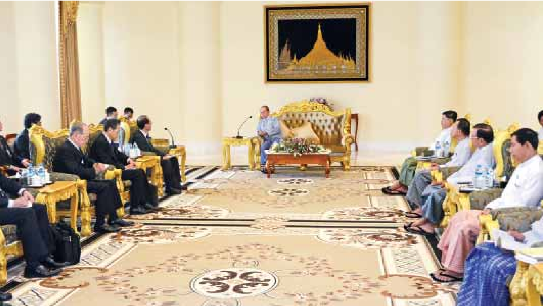
နိုင်ငံတော်သမ္မတ ဦးသိန်းစိန် ဂျပန်ဝန်ကြီးချုပ်၏ အထူးအကြံပေးပုဂ္ဂိုလ် မစ္စတာ ဟိရိုတို အိုဂိုမိ ဦးဆောင်သော ကိုယ်စားလှယ်အဖွဲ့နှင့် တွေ့ဆုံဆွေးနွေးစဉ်။ (သတင်းစဉ်)