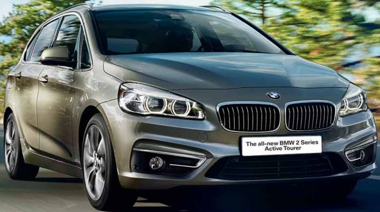
The all-new BMW 2 Series Active Tourer

BMW EfficientDynamics Less consumption. More driving pleasure.