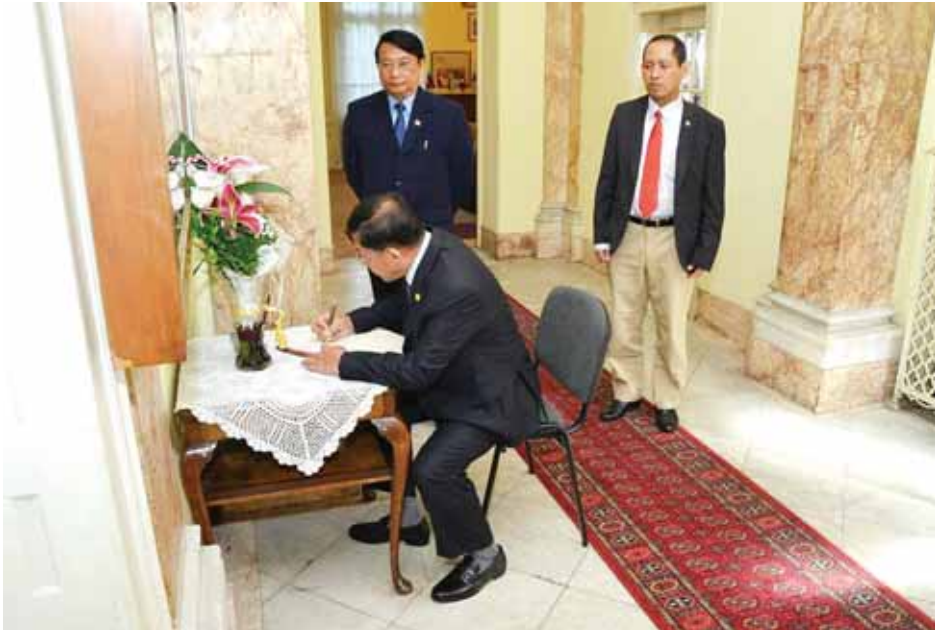
တပ်မတော်ကာကွယ်ရေးဦးစီးချုပ် ပိုလ်ချုပ်မှူးကြီးမင်းအောင်လှိုင် မြန်မာသံရုံး ဧည့်သည်တော်မှတ်တမ်း တွင် လက်မှတ်ရေးထိုးစဉ်။ (မြဝတီ)