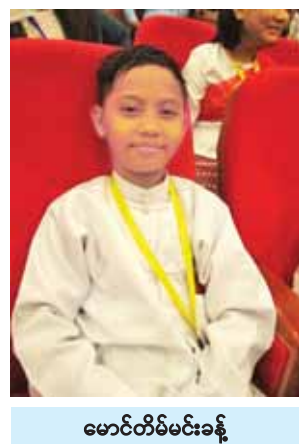
မောင်တိမ်မင်းခန့်

စန္ဒားရာပညာရပ်ကိုလည်း စိတ်ဝင်စားပါတယ်။ မျိုးဆက်သစ်ပြိုင်ပွဲဝင်တွေကို ပြောချင်တာက ကြိုးစားရင် ထိုက်တန်တဲ့ရလဒ်တစ်ခုတော့ရမှာပါ။ နော်ထက်ဆုလမ်း (ရွှေတံဆိပ်ဆုရှင်) အခြေခံပညာအသက်(၁၀-၁၅) အဆင့် (အမျိုးသမီး) တယောပြိုင်ပွဲ ရန်ကုန်တိုင်းဒေသကြီး ဒီနှစ်မှ စပြိုင်ပေးမယ့် ရွှေရခဲ့တဲ့အတွက် အတိုင်းမသိဝမ်းသာတယ်။