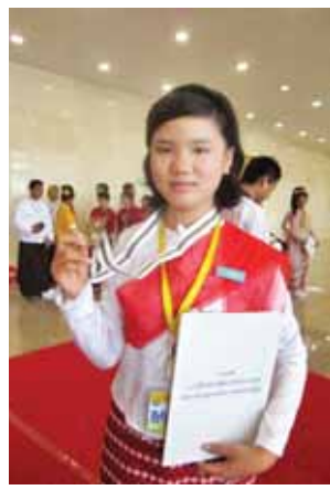
မအိမ့်သူသူမွန်