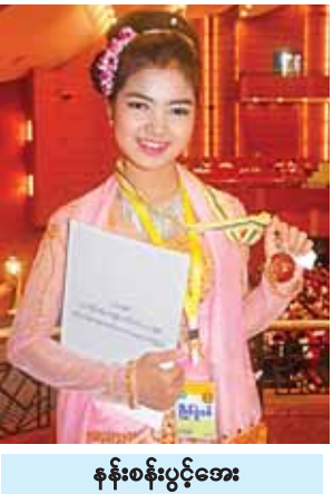
နန်းစန်းပွင့်အေး