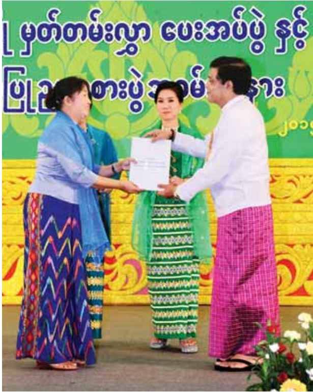
ဒုတိယသမ္မတ ဦးညွှန်ထွန်း ကချင်ပြည်နယ် အုပ်ချုပ်သူအဖွဲ့ခေါင်းဆောင် ဒေါ်ကောဒွေအောင် ဂုဏ်ပြုပွဲတမ်းလွှာပေးအပ်ချီးမြှင့်စဉ်။ (သတင်းစဉ်)

ထို့နောက် ဖျော်ဖြေရေးအစီအစဉ်များ ကြည့်ရှုကာ ဂုဏ်ပြုဥပဒေစာပေးအပ်ပွဲကြေညာသည်။