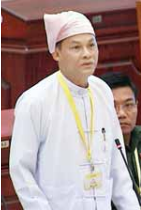
ဒုတိယရှေ့နေချုပ် ဦးထွန်းထွန်းဦး။

မြေအသုံးချမှုစီမံခန့်ခွဲရေးဗဟိုကော်မတီအနေဖြင့် အဆိုပါမြေကိစ္စများကို စိစစ်ဖြေရှင်းရာတွင် ရှင်းလင်းလွယ်ကူစေရန်အတွက် အစီရင်ခံစာ အပိုင်းများအဖြစ် သတ်မှတ်၍ စိစစ်ဖြေရှင်းဆောင်ရွက်လျက်ရှိပါကြောင်း၊ မြေအသုံးချမှုစီမံခန့်ခွဲရေး ဗဟိုကော်မတီအနေဖြင့် အစီရင်ခံစာအပိုင်း ၁၊ ၂၊ ၃ ပါ မြေကိစ္စ (၇၄၅) မှုအပေါ် ၂၀၁၄ ခုနှစ် ဇွန် ၂၄ ရက်ထိ စိစစ်ပြီးစီးမှု အခြေအနေများအား နိုင်ငံတော်သမ္မတက ပြည်ထောင်စုလွှတ်တော်နာယက