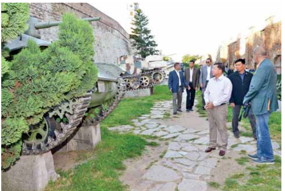
တပ်မတော်ကာကွယ်ရေးဦးစီးချုပ် ပိုလ်ချုပ်မှူးကြီးမင်းအောင်လှိုင်နှင့်အဖွဲ့ ဘဲလ်ဂရိတ်ခံတပ်အတွင်း လေ့လာကြည့်ရှုစဉ်။ (မြဝတီ)

ယင်းနောက် တပ်မတော်ကာကွယ်ရေးဦးစီးချုပ်နှင့် အဖွဲ့သည် ဆားဗီးယားနိုင်ငံ ဘဲလ်ဂရိတ်မြို့ အပြည်ပြည် ဆိုင်ရာလေဆိပ်မှ ဒေသစံတော်ချိန် မွန်းလွဲ ၁၂ နာရီ ၅၅ မိနစ်တွင် ယူအေအီးနိုင်ငံ၊ အဘူဒါဘီမြို့သို့ ဆက်လက် ထွက်ခွာခဲ့ကြောင်း သတင်းရရှိသည်။ (မြဝတီ)