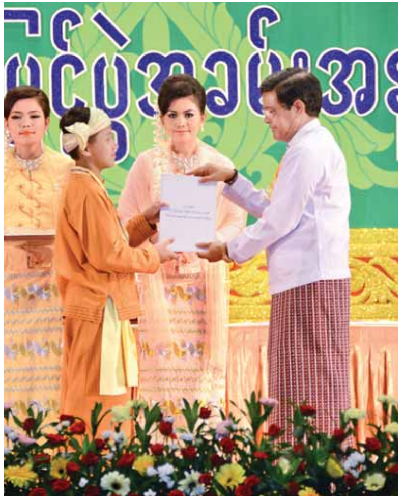
ဒုတိယသမ္မတ ဦးညွှန်ထွန်း အခြေခံအဆင့် အသက် (၁၀) နှစ်မှ (၁၅)နှစ် အမျိုးသား မဟာဂီတအဆိုပြိုင်ပွဲတွင် ပထမဆုရရှိသူ မောင်ကျော်ဆုဟိန်း (ရှမ်းပြည်နယ်)အား ဆုပေးအပ် ချီးမြှင့်စဉ်။ (သတင်းစဉ်)

မတူခြားနားသည့် ယဉ်ကျေးမှု ပြယုဂ် များကို သိမ်မွေ့ညင်သာစွာ ဆက်စပ် နားလည်နိုင်ရန် လိုအပ်ပါကြောင်း။ ယနေ့မျက်မှောက်ကမ္ဘာ၏ ရုပ်ပိုင်း ဆိုင်ရာ၊ နည်းပညာပိုင်းဆိုင်ရာ တိုးတက်ပြောင်းလဲမှု အရှိန်သည် မြန်ဆန်ပြီး နယ်စည်းပိုင်းဖြတ် ကန့်သတ်ရန်လည်း ခဲယဉ်းပါကြောင်း၊ ကျောထောက်နောက်ခံတောင့်တင်းမှု