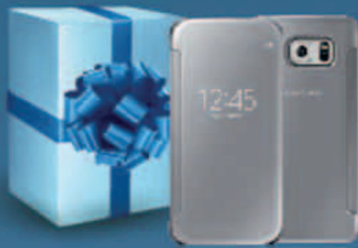
Original Clear View Cover