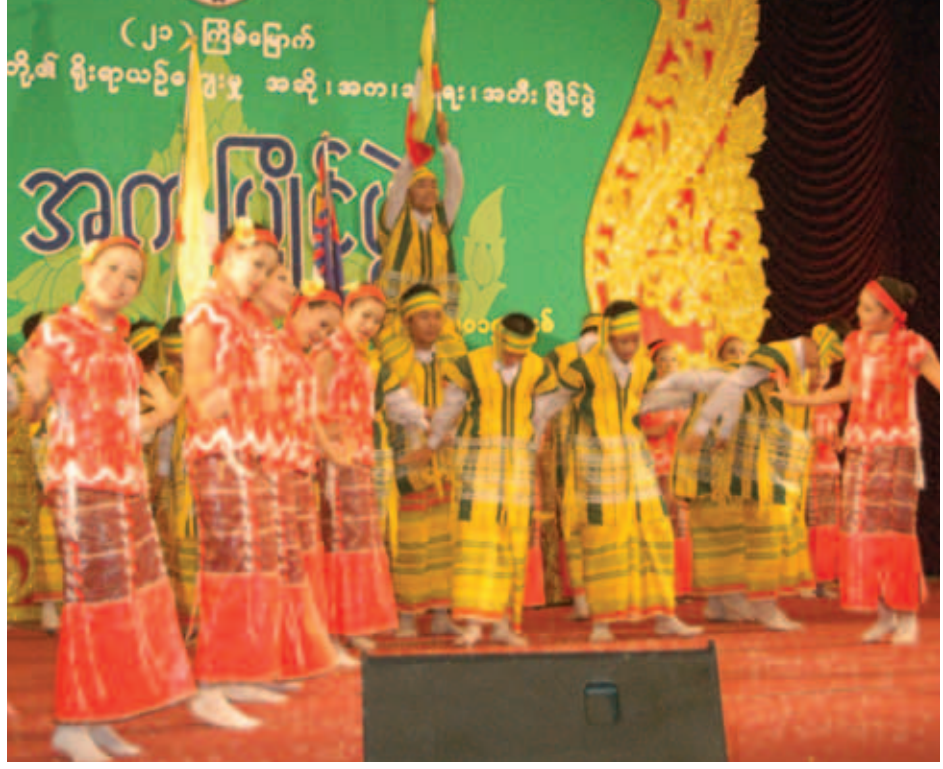
ဧရာဝတီတိုင်းဒေသကြီးမှ အကအဖွဲ့ဝင်များ ကရင်ခုံးယိမ်းအကဖြင့် ယှဉ်ပြိုင်နေစဉ်။

တိုင်းရင်းသားရိုးရာအကအလှများဖြင့် (၂၁) ကြိမ်မြောက် အဆို၊ အက၊ အရေး၊ အတီး ပြိုင်ပွဲကြီးကို စည်ကားသိုက်မြိုက်စွာ ပိတ်သိမ်းနိုင်ခဲ့ပြီး ပြိုင်ပွဲဝင်တိုင်းရင်းသား ညီအစ်ကိုမောင်နှမများ၏ မိမိတို့ရိုးရာအကများဖြင့် ကပြယှဉ်ပြိုင်ခွင့်ရသည့် အတွက် ကျေနပ်ပီတိအပြု၊ ပြိုင်ပွဲကြည့်ရှုသူ ပရိသတ်အပေါင်း၏ ကျေနပ်အားရသည့် အပြုံးတို့ဖြင့် ပြည်ထောင်စုဖွားတိုင်းရင်းသားတို့ အပြုံးချင်းထပ်တူကျခဲ့လေသည်။