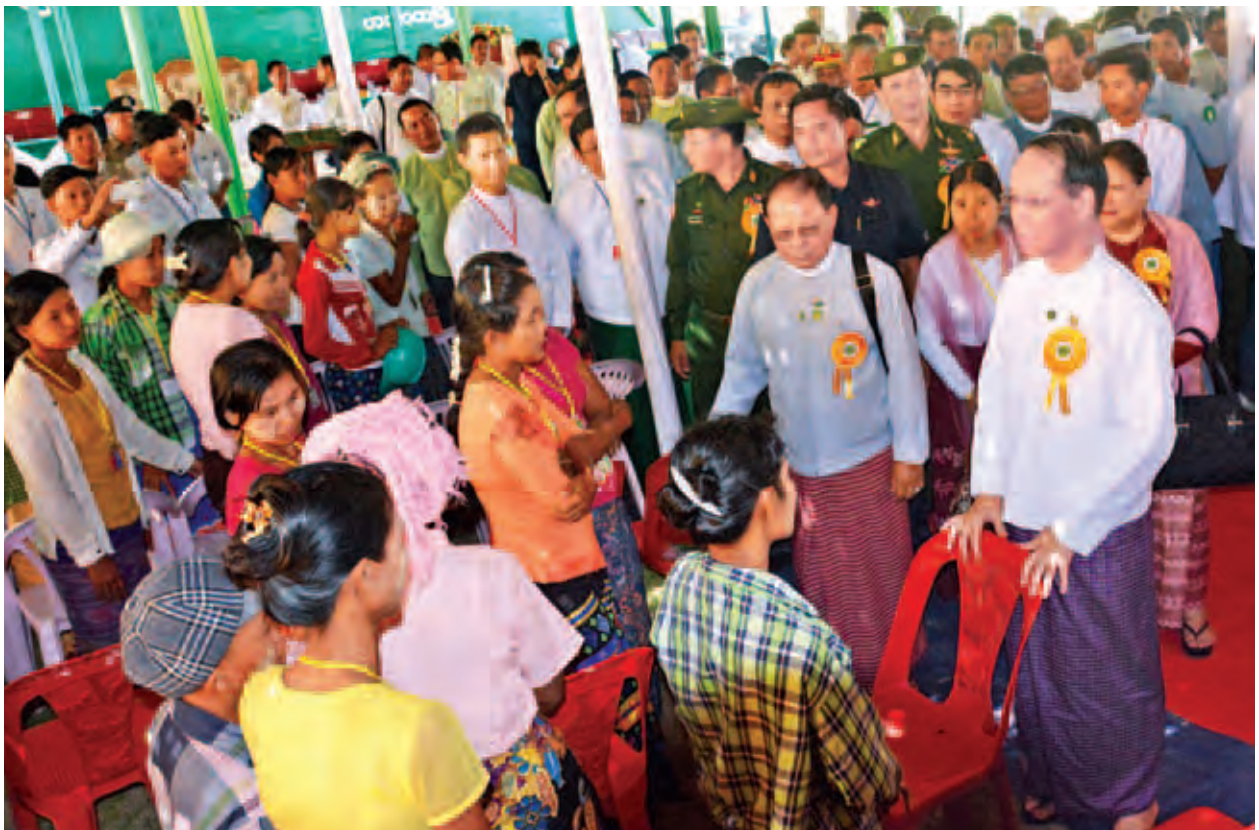
ဒုတိယသမ္မတ ဒေါက်တာစိုင်းမောက်ခမ်း အခြေခံစာတတ်မြောက်ရေးနေ့ လှုပ်ရှားမှုအခမ်းအနားသို့ တက်ရောက်လာကြသူများအား ရင်းရင်းနှီးနှီး နှုတ်ဆက်စဉ်။ (သတင်းစဉ်)

ထို့ကြောင့် ကမ္ဘာ့ကုလသမဂ္ဂအဖွဲ့ကြီးက ချီးမြှင့်သည့် နိုင်ငံတကာ အခြေခံစာတတ်မြောက်ရေးလှုပ်ရှားမှု ဂုဏ်ပြုဆုကြီးကို ၁၉၇၁ ခုနှစ်တွင် တစ်ကြိမ်၊ ၁၉၈၃ ခုနှစ်တွင် တစ်ကြိမ် နှစ်ကြိမ်တိုင်တိုင် ဆွတ်ခူးနိုင်ခဲ့ပါ ကြောင်း၊ ယခု ဒီမိုကရေစီခေတ်ကာလအစိုးရသစ်လက်ထက်၌ အခြေခံ စာတတ်မြောက်ရေးကြိုးပမ်းမှုကို ၂၀၁၃ ခုနှစ်တွင် ပြန်လည်စတင်ခဲ့ပါကြောင်း၊ ထိုနှစ်၌ပင် တက္ကသိုလ်ကျောင်းသား ကျောင်းသူ ဆရာ ဆရာမ ၂၀၀၀ ကျော်က စာမတတ်သူဦးရေ ၂၂၀၀၀ ကျော်ကို လည်းကောင်း၊ ၂၀၁၄ ခုနှစ်တွင်