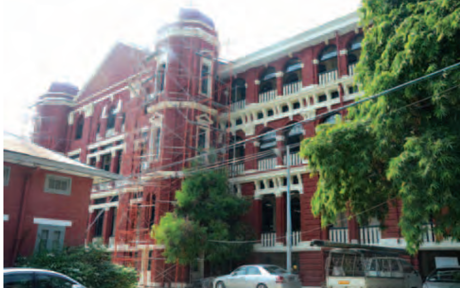
ရန်ကုန်ပြည်သူ့ဆေးရုံကြီး ပြုပြင်မွမ်းမံနေသည့်ကို တွေ့ရစဉ်။

မေး/ရေး - မိုးသူတစ်ဦး စာတပ် - ရဲထွဋ်၊ နေလင်း