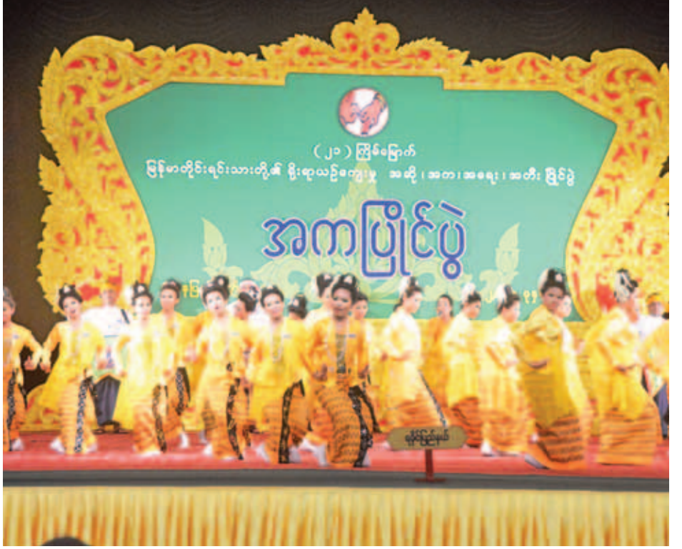
ရခိုင်ပြည်နယ်မှ ပျော်စရာစုံညီ ရခိုင်ပြည်က သုံးရာသီအကဖြင့် ပါဝင်ယှဉ်ပြိုင်နေစဉ်။