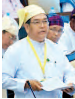
ဒုတိယဝန်ကြီး ဦးအုန်းသန်း။

သုတေသနလုပ်ငန်းများနှင့် မျိုးစေ့မျိုးကောင်း၊ မျိုးသန့်များ ထုတ်လုပ်ဖြန့်ဖြူးသည့်လုပ်ငန်းကို ပိုမိုအောင်မြင်စွာ ဆောင်ရွက်နိုင်ရေးအတွက် လိုအပ်ချက်များအား ပြည့်ဆည်းဆောင်ရွက်ပေးသွားရန် အစီအစဉ် ရှိ မရှိ မေးခွန်းနှင့် စပ်လျဉ်း၍ ဗဟိုစိုက်ပျိုးရေးဌာနသည် ကုန်းတံဆည်ထက် ပို၍မြင့်သောနေရာတွင် တည်ရှိသောကြောင့် ရေရရှိရေးခက်ခဲပါသဖြင့် ဆောင်ရွက်နိုင်ခြင်း မရှိခဲ့ပါကြောင်း၊ လက်ငင်ရေတွင်း တစ်တွင်းကို မော်တာတပ်ဆင်၍ ခြံစီမံမိမိလန်းစိုပြည်ရေးနှင့် တစ်ပိုင်တစ်နိုင် သီးနှံခင်းများ ရေပေးသွင်းခြင်းအတွက် အသုံးပြုလျက်ရှိပါကြောင်း၊ အကျယ်အဝန်း (၀၃၁၁၆၆)ဧက အနက်(၉)ပေရှိ ရေကန်တစ်ကန်ကို ယခင်က ဝန်ထမ်းများ သောက်သုံးရေအဖြစ် အသုံးပြုခဲ့ပြီး ယခုအခါ ရေခန်းခြောက်လျက်ရှိပါကြောင်း၊ ၎င်းရေကန်ကို ၂၀၁၅-၂၀၁၆ မိုးရာသီ သီးနှံစိုက်ပျိုးချိန်အထိ ပြန်လည် တူးဖော်ပေးသွားမည်ဖြစ်ကြောင်း၊ မလိုင်ဗဟိုစိုက်ပျိုးရေးဌာနတွင် မျိုးစေ့ချ