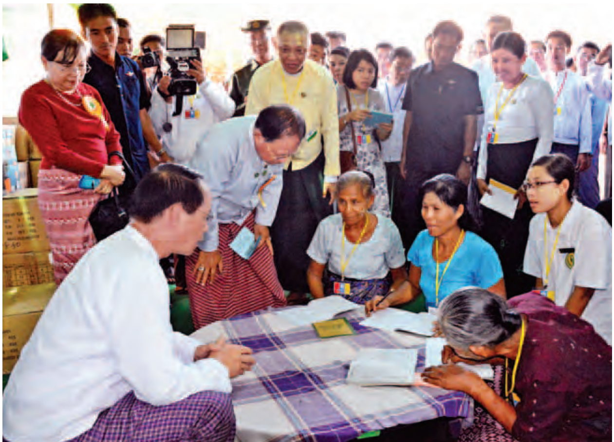
ဒုတိယသမ္မတ ဒေါက်တာစိုင်းမောက်ခမ်း အခြေခံစာတတ်မြောက်ရေး လှုပ်ရှားမှုဆိုင်ရာပညာပေးပြခန်းများနှင့် စာဖတ်ပိုင်းများအား ကြည့်ရှုအားပေးစဉ်။ (သတင်းစဉ်)

ထို့နောက် ဒုတိယသမ္မတနှင့် အဖွဲ့ဝင်များသည် ဟင်္သာတမြို့ပြည်သူ့ ဆေးရုံကြီးသို့ ရောက်ရှိကြပြီး သားဖွားဆောင်နှင့် ခွဲစိတ်ကုသဆောင်၊ အရိုး ကုသဆောင်၊ ခွဲစိတ်ခန်းနှင့် ဆေးရုံပတ်ဝန်းကျင်သန့်ရှင်းရေးနှင့် စိမ်းလန်း စိုပြည်ရေး ဆောင်ရွက်ထားမှုတို့ကို လှည့်လည်ကြည့်ရှုစစ်ဆေး၍ ဆေးရုံ တက်ရောက်ကုသမှုခံယူနေကြသည့် လူနာများအား ရင်းရင်းနှီးနှီး လိုက်လံ အားပေးစကားပြောကြားခဲ့သည်။ (သတင်းစဉ်)