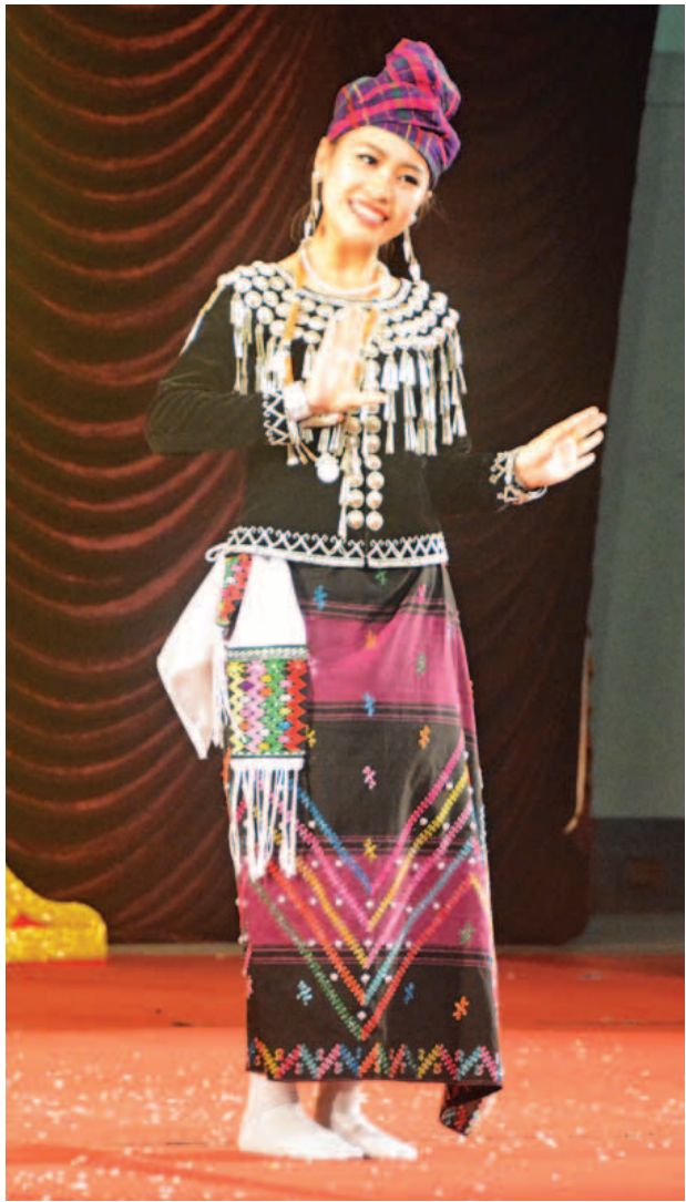
ကချင်ပြည်နယ်မှ ပြိုင်ပွဲဝင်တစ်ဦး ယှဉ်ပြိုင်နေစဉ်။