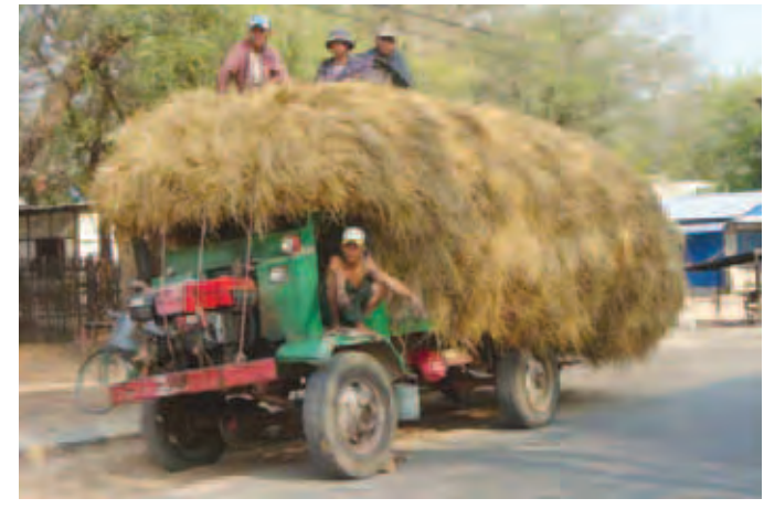
ဆို သုံးနှစ်လေးနှစ်ခန့်ရှိခဲ့ပြီဖြစ်ကြောင်း အတွက် လုံးပန်းနေကြောင်းနှင့် တောင်ငူင်းကပြောပြသည်။ တောင်သူများအဖို့ ယခုအချိန်တွင် လူက နွားကိုပြန်လုပ်ကျွေးနေရသကဲ့သို့ ဖြစ်နေကြရာ နွားစာမလုံလောက်သည့် စင်ဝေလင်း(နတ်မောက်)

၂၀၀၀ ခန့်ရှိ၍ ကားခန့်ပေါင်းတွက်ပါက ငွေကျပ် ၁၀၀၀၀၀ ဝန်းကျင်ကုန်ကျမှုများရှိကြောင်း၊ မိုးမကျခင်အထိ နွားစာလုံလောက်မှုမရှိနိုင်သဖြင့် ဒေသတစ်ဝိုက်တွင်ရှိသော ခင်တန်း၊ ချောက်များမှ ယခင်နွားစာမစားသည့် မြက်ရိုင်းများကို လူငှားများဖြင့် ရသလောက်ရိတ်၍ ရောနှောကျွေးနေကြောင်း၊ ယခုလိုဝင်ငွေမရှိကာလမျိုးတွင် နွားစာအတွက်လုံးပန်းနေရ၍ တောင်သူများအခက်အခဲများရှိကြောင်း အုတ်ဖိုကျေးရွာမှ တောင်သူတစ်ဦးက ပြောပြသည်။ ယခင်က တန်ဆောင်မုန်းလတွင် ဆွတ်ခူးသည့် ပင်ပြန်မြေပဲရိုးများနှင့် သီးထပ်အဖြစ်စိုက်ပျိုးသည့် ပြောင်းရိုး၊ ဆပ်ရိုး၊ ပဲနောက်ရိုးများဖြင့် နွားစာအတွက် တစ်နေ့စာလောက်လောက်ခဲသော်လည်း ယခုအခါ ရာသီဥတုဖောက်ပြန်သည့်အတွက်ကြောင့် နွားစာမလုံလောက်မှု ပြဿနာကြုံတွေ့ရသည်မှာယခုနှစ်နှင့်