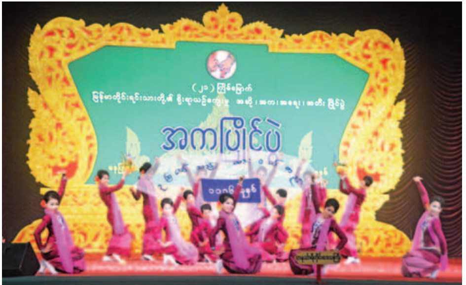
တနင်္သာရီတိုင်းဒေသကြီးကိုယ်စားပြု အကအဖွဲ့ဝင်များက ရှင်တောင်းပုံတူရားပူဇော်ယိမ်းအကဖြင့် ယှဉ်ပြိုင်နေစဉ်။

အားပေးခဲ့ကြသည်။ ထို့နောက် အရေးပြိုင်ပွဲများကို စိုက်ပျိုးရေးသုတေသနဦးစီးဌာန သင်တန်းခန်းမ-၁ တွင် အဆင့်မြင့်ပညာ (အမျိုးသား၊ အမျိုးသမီး)ပြိုင်ပွဲကို ကျင်းပရာ မန္တလေးတိုင်းဒေသကြီးနှင့် ရန်ကုန်တိုင်းဒေသကြီးမှ လည်းကောင်း၊ အခြေခံပညာအသက် (၁၅-၂၀)အဆင့်ပြိုင်ပွဲတွင် တနင်္သာရီတိုင်းဒေသကြီးနှင့် ရန်ကုန်တိုင်းဒေသကြီးမှ ပြိုင်ပွဲဝင်များ ပါဝင်ယှဉ်ပြိုင်ခဲ့ကြသည်။ ၎င်းအပြင် သစ်တောသုတေသန စုဝေးခန်းမတွင် ဆိုင်းတစ်ဦးချင်းပြိုင်ပွဲများကို ကျင်းပခဲ့ရာ ဝါသနာရှင်