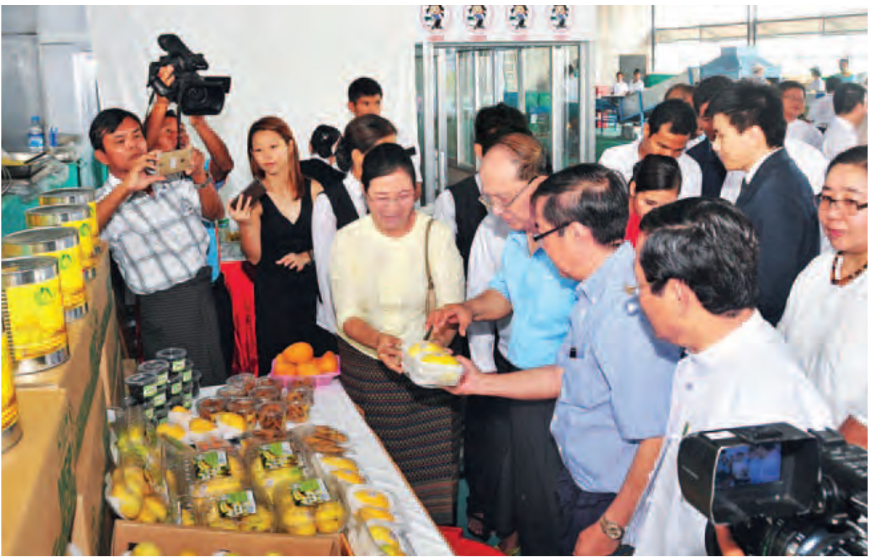
နိုင်ငံတော်သမ္မတ ဦးသိန်းစိန် မြန်မာရွှေသစ်သီးဝလံကုမ္ပဏီမှ ထုတ်လုပ်သော ပြည်ပပို့ကုန် စိန်တလုံးသရက်သီးများကို ကြည့်ရှုစစ်ဆေးစဉ်။ (သတင်းစဉ်)

မြန်မာနိုင်ငံသည် စိုက်ပျိုးရေးနိုင်ငံ ဖြစ်ပြီး ရာသီဥတုနှင့် ရေမြေအနေ အထားအရ သစ်သီးဝလံနှင့် ဟင်းသီး ဟင်းရွက်များ စိုက်ပျိုးထုတ်လုပ်ပြီး ပြည်ပသို့တင်ပို့ရန် အသင့်တော်ဆုံး အနေအထားတွင်ရှိပါကြောင်း၊ ထိုသို့ စိုက်ပျိုးထုတ်လုပ်ပြီး ပြည်ပသို့ တင်ပို့ ရာတွင် စိုက်ပျိုးမှု၊ ထုပ်ပိုးမှု၊ ပို့ဆောင် မှုများကို မိရိုးဖလာနည်းလမ်းများ အတိုင်း မဆောင်ရွက်ကြဘဲ ခေတ်မီ နည်းပညာများအသုံးပြုကြရန် လိုအပ် ပါကြောင်း၊