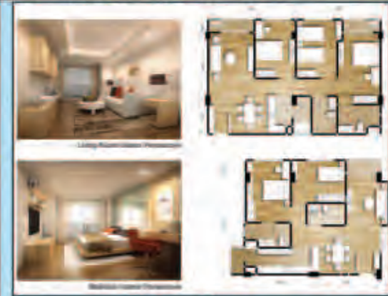
900 sq-ft for 2 Bedrooms 1300 sq-ft for 3 Bedrooms

■ ထိုင်းနိုင်ငံ G4 Architect မှ ရေးဆွဲသော ဝိသုကာဒီဇိုင်း၊ ခေတ်မီ Post-Tensioned ဝန်ခံဖြင့် 10" Concrete Slab ၊ ငလျင်ဒဏ်ခံနိုင်သည့် Shear wall များ ထည့်သွင်း ဆောက်လုပ်မည့် (ဂ)ထပ် အဆင့်မြင့် ကွန်ဒိုမီနီယံဖြစ်ပြီးအဆောက်အအုံတိုင်းတွင် 2500 sq-ft ခန့် ကျယ်ဝန်းသော Lobby ပါရှိပါမည်။