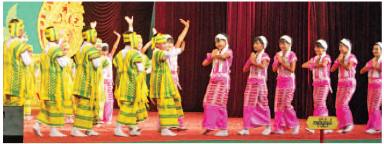
ကရင်ပြည်နယ်ကိုယ်စားပြု အကအဖွဲ့ဝင်များ ပါဝင်ယှဉ်ပြိုင်နေစဉ်။

(ဒုတိယတန်း)(အမျိုးသမီး)ပြိုင်ပွဲတွင် ဧရာဝတီတိုင်းဒေသကြီးနှင့် အခြေခံပညာ အသက်(၁၀-၁၅)အဆင့်ပြိုင်ပွဲတွင် မကွေးတိုင်းဒေသကြီးတို့မှ ပြိုင်ပွဲဝင်များ ပါဝင်ယှဉ်ပြိုင်ခဲ့ကြသည်။ ထို့နောက် ကွက်စိပ်ပြိုင်ပွဲ ဝါသနာရှင်အဆင့်ပြိုင်ပွဲများကို စိုက်ပျိုးရေးတက္ကသိုလ် ပတ္တမြားခန်းမတွင်ကျင်းပလျက်ရှိရာ ပြိုင်ပွဲဝင်များက ဆွန်ဆင်မင်းဇာတ်ဖြင့်ပါဝင်ယှဉ်ပြိုင်ခဲ့ကြသည်။ သစ်တောတက္ကသိုလ် ဘွဲ့နှင်းသဘင်ခန်းမတွင် အတီး(ဒုံမင်း)ပြိုင်ပွဲများကို ဆက်လက်ကျင်းပရာ ဝါသနာရှင်(ပထမတန်း)အမျိုးသမီးအဆင့်ပြိုင်ပွဲတွင် မန္တလားဘွဲ့(ဘွဲ့သီချင်း)ဖြင့်လည်းကောင်း၊ ဝါသနာရှင်(ဒုတိယတန်း)(အမျိုးသား)အဆင့်ပြိုင်ပွဲတွင် မဲဇာတောင်ခြေ(ပတ်ပျိုး)ဖြင့်လည်းကောင်း၊ ဝါသနာရှင်(ဒုတိယတန်း)(အမျိုးသမီး) အဆင့်ပြိုင်ပွဲတွင် ရန်ကုန်တိုင်းဒေသကြီးနှင့် မကွေးတိုင်းဒေသကြီးမှ ပြိုင်ပွဲဝင်များက တောမြိုင်ခြေလမ်း(ယိုးဒယား သီချင်း)ဖြင့်လည်းကောင်း အသီးသီးပါဝင်ယှဉ်ပြိုင်ခဲ့ကြသည်။ (၂၁)ကြိမ်မြောက် မြန်မာတိုင်းရင်းသားတို့၏ အဆို၊ အက၊ အရေး၊ အတီးပြိုင်ပွဲကြီးမှ ဆုရရှိခဲ့သူများကို ယနေ့ မေ ၁၃ ရက်တွင် ဆုများအသီးသီး ပေးအပ်ချီးမြှင့်သွားမည် ဖြစ်ကြောင်း သိရသည်။