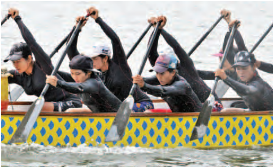
မြန်မာလှေလှော်အဖွဲ့ လေ့ကျင့်မှုများပြုလုပ်နေစဉ်။

ဆီးဂိမ်းလှေလှော်ပြိုင်ပွဲတွင် အားကစားနည်းသုံးခု၌ ရွှေတံဆိပ် ၄၃ ခု ချီးမြှင့်မည်ဖြစ်ပြီး မြန်မာလှေလှော်အဖွဲ့ မှာ ရွှေ ၁၇ ခု မျှော်မှန်းထားကြောင်း သိရသည်။ မြန်မာ လှေအဖွဲ့မှာ(၂၈)ကြိမ်မြောက်ဆီးဂိမ်းပြိုင်ပွဲတွင် အောင်မြင် မှုရရှိရေးအတွက် တစ်နှစ်ကျော်အချိန်ယူပြင်ဆင်ထားပြီး အပြီးသတ်ပြင်ဆင်မှုများ ပြုလုပ်လျက်ရှိသည်။