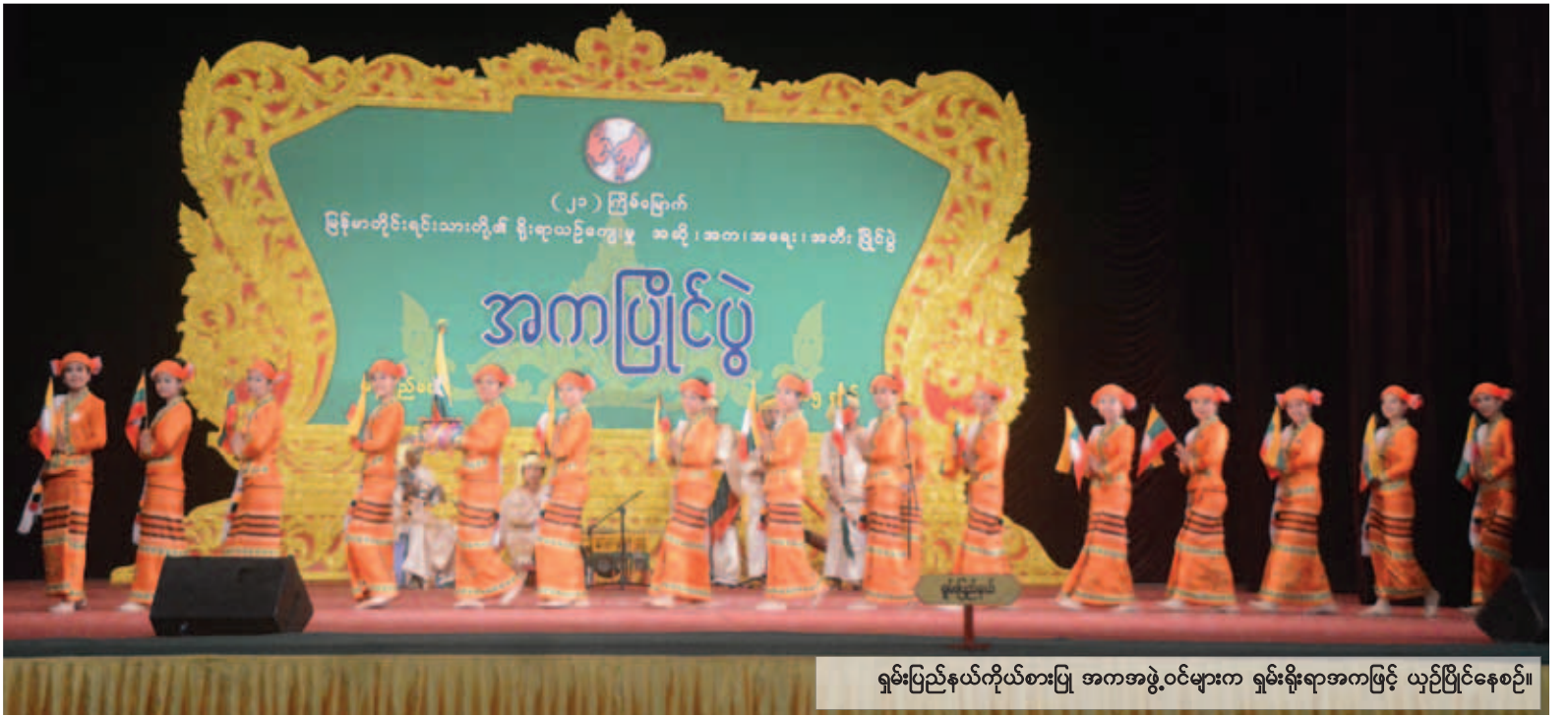
ရှမ်းပြည်နယ်ကိုယ်စားပြု အကအဖွဲ့ဝင်များက ရှမ်းရိုးရာအကဖြင့် ယှဉ်ပြိုင်နေစဉ်။

ကချင်တိုင်းရင်းသားတို့ကလည်း ရိုးရာပလ္လေကို မာန်ပါပီတီးမှုတ်ကာ ယှဉ်ပြိုင်မှုကို ဖွင့်လှစ်လိုက်သည်။ ထို့နောက် ငွေမောင်းသံ တချွတ်ချွတ်ဖြင့် မြန်မာပြည်မြောက်ဖျားမှ အလှမယ်များ၏ မြူးကြွသည့်ကတွက်များကို ရှုမြင်ကြရသည်။ ယှဉ်ပြိုင်နေစဉ် ရိုးရာခေါင်ရည်နှင့် မုန့်ဖက်ထုပ်များဝေ