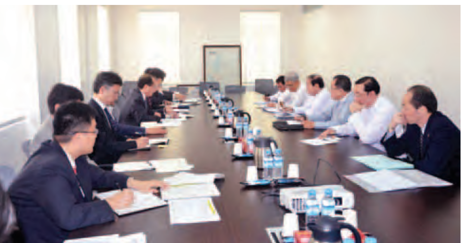
ဗဟိုဘက် ဒုတိယဥက္ကဋ္ဌ ဦးဆောင်အောင်၊ ဂျပန်နိုင်ငံအစိုးရ ကြသည်။ အဖွဲ့ ဝန်ကြီးဌာနများမှ တာဝန်ရှိသူများ တက်ရောက်ခဲ့ (သတင်းစဉ်)

SEZ အကောင်အထည်ဖော်ရေးအတွက် မြန်မာ-ထိုင်းနှင့် ဂျပန် နိုင်ငံပါဝင်လာမည့် Memorandum of Intent(MOI) ပြုစု၍ အမြန်လက်မှတ်ရေးထိုးနိုင်ရေးက ဝ္စများကို ဆွေး နွေးညှိနှိုင်းခဲ့ကြကြောင်း သိရသည်။ ဆွေးနွေးပွဲသို့ ထားဝယ်အထူးစီးပွားရေးဇုန် တည် ဆောက်ရေးအထူးလုပ်ငန်းအဖွဲ့ ဥက္ကဋ္ဌနှင့်အတူ ထားဝယ် SEZ စီမံခန့်ခွဲမှုကော်မတီဥက္ကဋ္ဌ ပို့ဆောင်ရေးဝန်ကြီးဌာန ဒုတိယဝန်ကြီး ဦးဟိရိုနို၊ ထားဝယ် SEZ ငွေကြေးနှင့် ရန်ပုံငွေရှာဖွေစုစည်းရေးကော်မတီဥက္ကဋ္ဌ ဘဏ္ဍာရေး ဝန်ကြီးဌာန ဒုတိယဝန်ကြီး ဒေါက်တာမောင်မောင်သိမ်း၊ ထားဝယ် SEZ ဥပဒေနှင့် လုပ်ထုံးလုပ်နည်းများ ညှိနှိုင်း ရေးဆွဲရေးကဏ္ဍဆိုင်ရာ ဆပ်ကော်မတီဥက္ကဋ္ဌ မြန်မာနိုင်ငံ