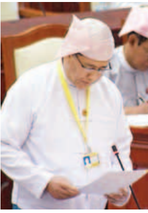
ပြည်ထောင်စုရာထူးဝန်အဖွဲ့ ဥက္ကဋ္ဌ ဦးကျော်သူ။

ရန်ကင်းမဲဆန္ဒနယ်မှ ဦးသာဝင်း၏ ၂၀၁၄-၂၀၁၅ ဘဏ္ဍာနှစ်တွင် သောက်သုံးရေ လုံလောက်စွာရရှိရေးအတွက် စက်ရေတွင်းနှင့် သောက်သုံးရေကန် တူးဖော်ခြင်းလုပ်ငန်းများ ဆောင်ရွက်ပေးနိုင်ခဲ့မှုအခြေအနေနှင့် ယခု လာမည့် ၂၀၁၅ ခုနှစ် ဇွန်လမှ စတင်အကောင်အထည်ဖော် ဆောင်ရွက်ပေးနိုင်ခြင်း ရှိ မရှိ မေးခွန်းနှင့်စပ်လျဉ်း၍ မွေးမြူရေး၊ ရေလုပ်ငန်းနှင့် ကျေးလက်ဒေသဖွံ့ဖြိုးရေးဝန်ကြီးဌာန ဒုတိယဝန်ကြီး ဦးခင်မောင်အေးက ၂၀၁၄-