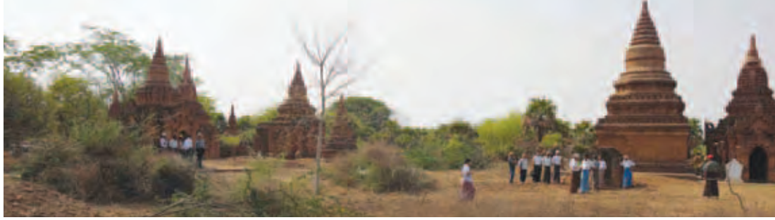
ညောင်ဦး မေ ၁၂

ပုဂံရှေးဟောင်းယဉ်ကျေးမှုနယ်မြေ ပုဂံမြို့နယ်ရှိ မကျီးကန်ဘုရားကျောက်စာနှင့် မကျီးကန်ဘုရားပတ်ဝန်းကျင်အား မြို့ပြအင်္ဂါရပ်နှင့် အညီ သန့်ရှင်းသာယာလှပစေရေး အဆိုပါဘုရားစုအား ပြည်တွင်းပြည်ပခရီးသွားဧည့်သည်များ ဝင်ရောက်လေ့လာနိုင်ရန်ရည်ရွယ်၍ ပုဂံ ယဉ်ကျေးမှုအမွေအနှစ်ဒေသ ကာကွယ်ထိန်းသိမ်းစောင့်ရှောက်ရေးအသင်း (Bagan Heritage Trust) နှင့် ပုဂံဒေသချစ်မြတ်နိုးသည့် လူမှု ရေးအသင်းအဖွဲ့များ ပူးပေါင်းကာ စုပေါင်းသန့်ရှင်းရေးဆောင်ရွက်ခဲ့ကြောင်း သိရသည်။