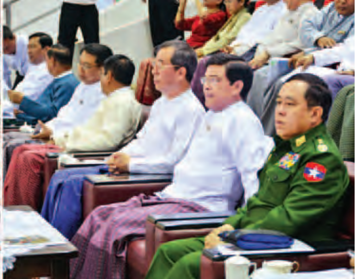
အဆိုပါပြိုင်ပွဲကို မေ ၁၂ ရက်မှ ၂၀ ရက်ထိ ကျင်းပသွားမည်ဖြစ်ပြီး တိုင်ပင်ပေး ဗီယက်နမ်စသည့် နိုင်ငံပေါင်း ၁၆ နိုင်ငံမှ ဘော်လီဘောအားကစား သမားများ ပါဝင်ယှဉ်ပြိုင်ကြမည်ဖြစ်သည်။ (သတင်းစဉ်)