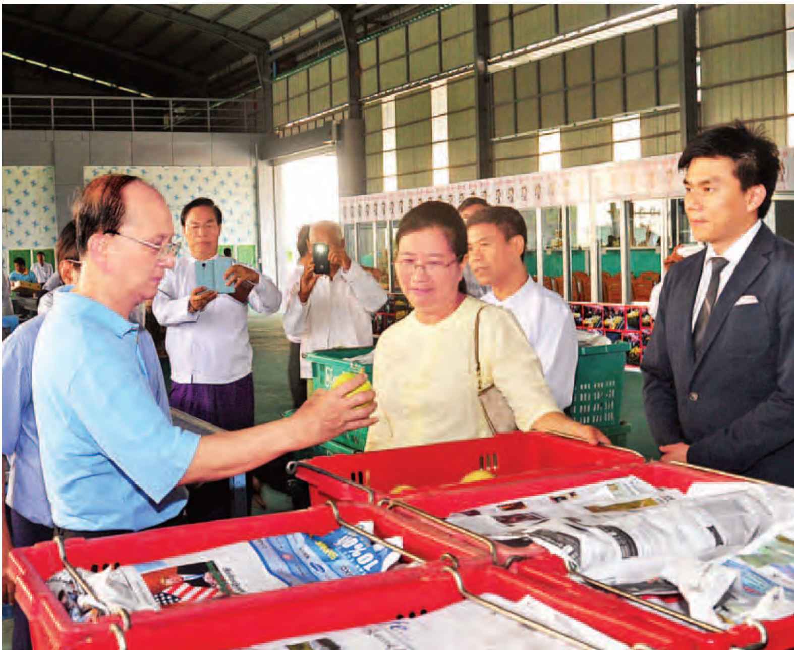
နိုင်ငံတော်သမ္မတ ဦးသိန်းစိန် မြန်မာရွှေသစ်သီးဝလံကုမ္ပဏီမှ စိန်တလုံးသရက်သီးများ နိုင်ငံတကာအဆင့်မီ သန့်စင်ထုပ်ပိုးရန် ပြင်ဆင်နေမှုကို ကြည့်ရှုစစ်ဆေးစဉ်။ (သတင်း စာမျက်နှာ - ၃)

အခမ်းအနားတွင် ပြည်နယ် ဝန်ကြီးချုပ် ဦးလွင်လွင်နှင့် ပြည်နယ်သစ်တောနှင့်သတ္တဝန်ကြီး၊ စာမျက်နှာ ၅ ကော်လံ ၄ သို့ ▲