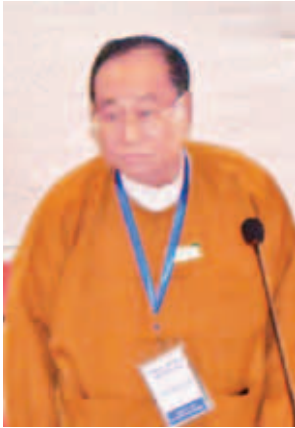
ဦးစိုင်းအိုက်ပေါင်း

နိုင်ငံတော်သမ္မတ ဦးသိန်းစိန်သည် ၂၀၁၅ ခုနှစ် ဖေဖော်ဝါရီလ ၁၂ ရက်နေ့တွင် ငြိမ်းချမ်းရေးနှင့် အမျိုးသားပြန်လည်သင့်မြတ်ရေးအတွက် ကတိပြုလက်မှတ်ရေးထိုးခဲ့သည်။ အဆိုပါ ငြိမ်းချမ်းရေးနှင့် အမျိုးသားပြန်လည်သင့်မြတ်ရေး ကတိကဝတ် (Deed of Commitment)တွင် ပါရှိသည့် အချက်များကို အမြန်ဆုံးအကောင်အထည်ဖော် ဆောင်ရွက်နိုင်ရေးအတွက် လိုအပ်သည့် ကြိုတင်ပြင်ဆင်မှုများကို လုပ်ဆောင်နိုင်ရန် အဖွဲ့အစည်းစုံမှ ပါဝင်သော “ငြိမ်းချမ်းရေးနှင့် အမျိုးသားပြန်လည်သင့်မြတ်ရေးဆိုင်ရာညှိနှိုင်းအဖွဲ့” (Coordination Team for Peace and National Reconciliation)ကို ဖွဲ့စည်းရန် မေ ၂၉ ရက်က ရန်ကုန်မြို့၊ အင်းယားလိတ်တိုက်တွင်ပြုလုပ်သည့် ဆွေးနွေးပွဲတွင် မူအားဖြင့် သဘောတူညီမှုရရှိခဲ့သည်။