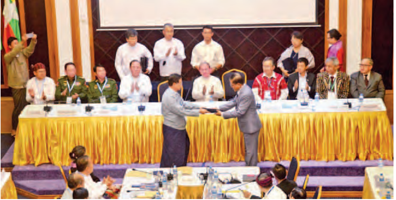
ယခုနှစ် မတ် ၃၀ ရက်က UPWC နှင့် NCCT တို့ NCA မူကြမ်းလက်မှတ်ရေးထိုးစဉ်။

၂၀၁၅ ခုနှစ် မတ်လ ၃၀ ရက်တွင် အပစ်အခတ်ရပ်စဲရေးညှိနှိုင်းရေးအဖွဲ့ (NCCT)နှင့် ပြည်ထောင်စုငြိမ်းချမ်းရေး ဖော်ဆောင်ရေးလုပ်ငန်းကော်မတီ (UPWC) တို့၏ ကိုယ်စားလှယ်ငါးဦးစီတို့မှ ရန်ကုန်မြို့ရှိ MPC၌ တစ်နိုင်ငံလုံးပစ်ခတ်တိုက်ခိုက်မှု ရပ်စဲရေးစာချုပ် (NCA)မူကြမ်းအားလက်မှတ်ရေးထိုးခဲ့သည်။ ယင်း NCA စာချုပ်ကို အချောသပ်လက်မှတ်ရေးထိုးနိုင်ရန်အတွက် တိုင်းရင်းသားလက်နက်ကိုင် ထိပ်သီးခေါင်းဆောင်များ၏ ညီလာခံကို