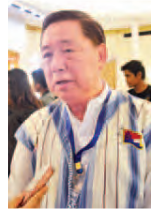
ဦးစောထွန်းအောင်မြင့်

ပြည်ထောင်စုငြိမ်းချမ်းရေးဖော်ဆောင်ရေးလုပ်ငန်းကော်မတီ (UPWC) ကလည်း မဟုတ်ဘူး။ တစ်နိုင်လုံးအပစ်အခတ်ရပ်စဲရေးဆိုင်ရာ ညှိနှိုင်းရေးအဖွဲ့ (NCCT) ကလည်း မဟုတ်ဘူး။ တိုင်းရင်းသားလက်နက်ကိုင်အဖွဲ့တွေဖြစ်တဲ့ KNU၊ RCSS၊ နောက် တိုင်းရင်းသား လက်နက်ကိုင်အဖွဲ့အစည်းတွေနဲ့ တိုင်းရင်းသားရေးရာဝန်ကြီးတွေ အစုအဖွဲ့ လေးစုကနေပြီးတော့ ဦးဆောင်ကျင်းပတာဖြစ်တယ်။ ပြောင်းလဲလာတဲ့ နိုင်ငံရေးအခင်းအကျင်းအပေါ်မှာ သူတို့လို တစ်ကြိမ်တစ်ခါက လက်နက်ကိုင်ခဲ့တဲ့သူတွေကလည်း သူတို့အနေနဲ့ ဒီလိုပွဲမျိုးကို လုပ်ခွင့်ရှိနေပြီ။ လုပ်လည်း လုပ်လာကြပြီ။ ဒီနေ့အခမ်းအနားရဲ့ အဓိကရည်ရွယ်ချက်ကတော့ Political Dialogue ကို အမြန်ဆုံးရောက်အောင် ဘယ်လိုသွားမလဲ။ ရွေးကောက်ပွဲမတိုင်မီမှာလည်း Political Dialogue ကို ဆက်လုပ်ချင်တယ်။ ဒါမှသာလျှင် နောင် ဘယ်အစိုးရပဲ တက်တက် ဒီဖြစ်စဉ်က ဆက်ပြီး ဆောင်ရွက်နိုင်တဲ့ဖြစ်စဉ် သူတို့ဖြစ်စေလိုပါတယ်။ အဲဒီအတွက် ဒီနေ့ဆွေးနွေးတာပါ။ အပြင်မှာပြောနေကြသလို အခြားညီလာခံတွေကို အဓိပ္ပာယ်