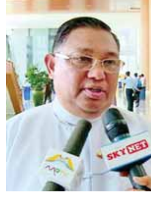
ပြည်ထောင်စုဝန်ကြီး ဦးဝဏ္ဏမောင်လွင်