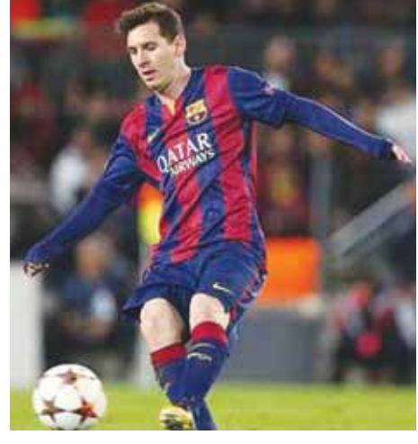
(မေလဲ့သင်း)

သွင်းဂိုး ၇၆ ဂိုးကိုကျော်လွန်ခဲ့ကာ ၇၇ ဂိုးဖြင့် သမိုင်း တစ်လျှောက် သွင်းဂိုးအများဆုံးစံချိန်သစ်ကိုရရှိခဲ့သည်။