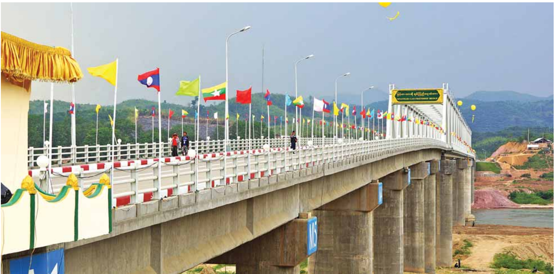
မြန်မာ-လာအိုချစ်ကြည်ရေးတံတားကို တွေ့ရစဉ်။(သတင်း စာမျက်နှာ-၈)