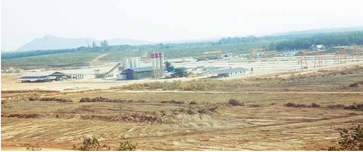
စီမံကိန်းလုပ်ငန်းခွင်အား တွေ့ရစဉ်။

ပေါ်ပေါက်လာပြီဆိုရင် ဒီရေနက်ဆိပ်ကမ်းဟာ မဟာမဲခေါင်ဒေသ တောင်ဘက် လမ်းကြောင်းနဲ့ တစ်ဆက်တည်းဖြစ်ပြီး ပို့ဆောင်ရေးနဲ့ ကုန်စည်စီးဆင်းရေးရဲ့ အချက်အချာနေရာတစ်ခု ဖြစ်လာနိုင်ပါတယ်။ ပြီးရင် ဒီရေနက်ဆိပ်ကမ်းကနေ အိန္ဒိယ၊ ဘင်္ဂလားဒေ့ရှ်၊ ဥရောပ၊ အရှေ့အလယ်ပိုင်းနဲ့ အာဖရိကနိုင်ငံတွေအထိ သွားရောက်နိုင်ပါတယ်။ ဒီလမ်းကြောင်းကြောင့် မြန်မာနိုင်ငံရဲ့ စီးပွားရေးတိုးတက်လာရုံသာမက ဒေသတွင်းနိုင်ငံတွေဖြစ်တဲ့ ထိုင်း၊ ကမ္ဘောဒီးယား၊ ဗီယက်နမ် နိုင်ငံတွေဟာလည်း ဒီအကျိုးအမြတ်တွေကို ခံစားရမှာ ဖြစ်ပါတယ်။ မူလရေလမ်းကြောင်းဖြစ်တဲ့ မလတ္တာရေလက်ကြားကနေ တောင်တရုတ်ပင်လယ်ကို ဖြတ်သွားရတဲ့ လမ်းကြောင်းနဲ့ အခု ပေါ်ပေါက်လာမယ့် လမ်းကြောင်းအသစ်ဟာ အနည်းဆုံး အချိန် လေးရက်လောက် ကုန်စည် ပို့ဆောင်ရာမှာ သက်သာမှာဖြစ်ပါတယ်။ ရေနက်ဆိပ်ကမ်းမှာ အနည်းဆုံး တန်ချိန် သုံးသိန်းဆုံ သင်္ဘောတွေ ဆိုက်ကပ်နိုင်မှာ ဖြစ်ပါတယ်။ မေး။ ။ ဒါဆိုရင် ပင်မစီမံကိန်း လုပ်ငန်းကို ဘယ်အချိန်မှာ ဆောင်ရွက်မှာလဲ။ ဖြေ။ ။ ကနဦးစီမံကိန်းလုပ်ငန်းတွေ အကောင်အထည် ပေါ်လာရင် ပင်မစီမံကိန်းကြီးကို တစ်ဆက်တည်း ဆောင်ရွက်မှာ ဖြစ်ပါတယ်။ (၈)နှစ်ကြာတဲ့ ကနဦးစီမံကိန်းပြီးတော့မှ ပင်မစီမံကိန်းကို သွားမှာ မဟုတ်ပါဘူး။ ဇွန်လမှာလက်မှတ်ထိုးဖြစ်လို့ ကနဦး စီမံကိန်း စတင်ပြုဆိုတာနဲ့ ပင်မစီမံကိန်းအတွက်ကို အကြံပေးတွေ ခေါ်ယူမယ်။ ပြီးရင် နိုင်ငံတကာ ရင်းနှီးမြှုပ်နှံသူတွေကို ဖိတ်ခေါ်ပြီး တော့ အခုလက်ရှိမှာ ပြုစုနေတဲ့ မဟာဗျူဟာစီမံကိန်းကို ချပြမယ်။ ပြီးရင် ကနဦးစီမံကိန်းဆောင်ရွက်နေတဲ့ တစ်နှစ်၊ နှစ်နှစ်အတွင်းမှာ ပင်မစီမံကိန်းရဲ့ ရေနက်ဆိပ်ကမ်းတွေ၊ အကြီးစားစက်မှုလုပ်ငန်းတွေ၊ သံမဏိစက်ရုံတွေ၊ ရေနံစက်ရုံတွေ၊ မြေဩဇာစက်ရုံ၊ သင်္ဘောကျင်းတွေကို ဆက်လက်ဆောင်ရွက်သွားမှာ ဖြစ်ပါတယ်။ (ကျေးဇူးတင်ပါတယ်။)