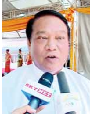
ပြည်ထောင်စုဝန်ကြီး ဦးခင်ရီ