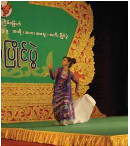
စစ်ကိုင်းတိုင်းဒေသကြီးမှ မဖာဇာဝင်း အကပြိုင်ပွဲဝင်နေစဉ်။

ကြိုးစားယှဉ်ပြိုင်နေကြသည်။ ထို့နောက် အတီးပြိုင်ပွဲများအဖြစ် ဆိုင်းအဖွဲ့လိုက် ပြိုင်ပွဲများကို သစ်တောသုတေသန စုဝေးခန်းမတွင် လည်းကောင်း၊ ပတ္တလားအတီးပြိုင်ပွဲများကို စိုက်ပျိုးရေးတက္ကသိုလ် ပတ္တမြားခန်းမတွင်လည်းကောင်း၊ တယောပြိုင်ပွဲများကို စိုက်ပျိုးရေးသုတေသနဦးစီးဌာန စုဝေးခန်းမတွင် လည်းကောင်းကျင်းပခဲ့ရာ ဝါသနာရှင်(ပထမတန်း)(အမျိုးသား)အဆင့်ပြိုင်ပွဲတွင် မန္တလေးတိုင်းဒေသကြီး၊ ရန်ကုန်တိုင်းဒေသကြီးနှင့် ဧရာဝတီ