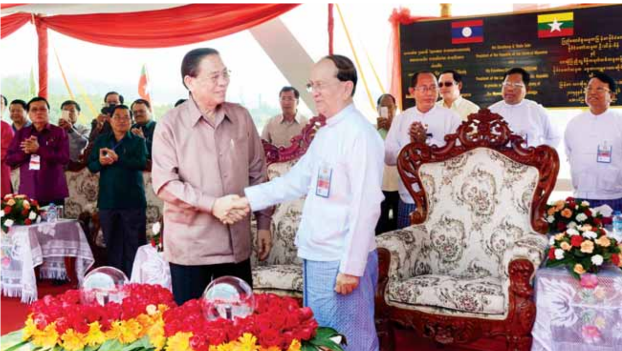
နိုင်ငံတော်သမ္မတ ဦးသိန်းစိန်နှင့် လာအိုပြည်သူ့ဒီမိုကရက်တစ်သမ္မတနိုင်ငံ သမ္မတ မစ္စတာ ကျူမာလီ ဆိုင်ညွှန်တို့ ရင်းရင်းနှီးနှီးနှုတ်ဆက်စဉ်။ (သတင်း စာမျက်နှာ - ၈) (သတင်းစဉ်)