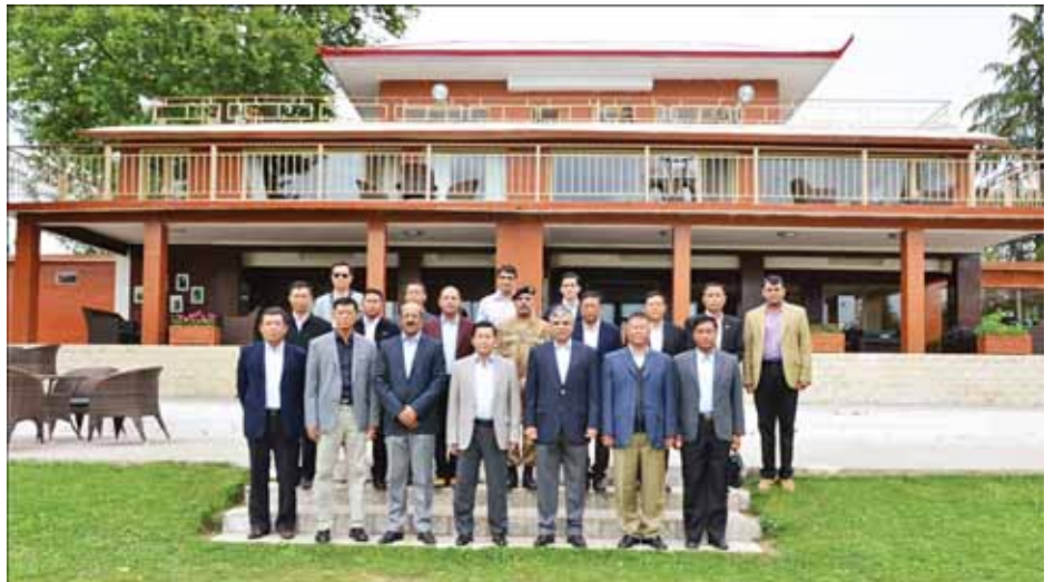
တပ်မတော်ကာကွယ်ရေးဦးစီးချုပ် ဗိုလ်ချုပ်မှူးကြီးမင်းအောင်လှိုင်နှင့်အဖွဲ့ မိုရေးမြို့ရှိ ချိနာတောင်ပေါ် အပန်းဖြေစခန်းတွင် စုပေါင်းမှတ်တမ်းတင်ဓာတ်ပုံရိုက်ကြစဉ်။