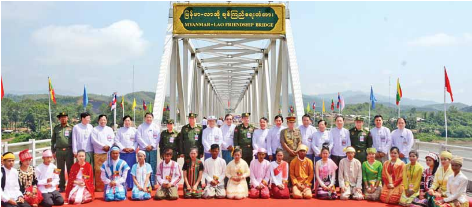
နိုင်ငံတော်သမ္မတ ဦးသိန်းစိန်နှင့်အဖွဲ့ဝင်များ မြန်မာ-လာအို ချစ်ကြည်ရေးတံတားပေါ်တွင် ဒေသခံတိုင်းရင်းသား၊ တိုင်းရင်းသူများနှင့်အတူ ဖွင့်ပွဲအထိမ်းအမှတ်အဖြစ် မှတ်တမ်းတင် ဓာတ်ပုံရိုက်ကြစဉ်။ (သတင်း စာမျက်နှာ - ၈) (သတင်းစဉ်)

✽ မန္တလေးမြို့မှ မှာတော့ အကြီးဆုံးနှစ်ချီပင်ကြီး ဖြစ်ပါတယ်။ လေက ပြင်းတော့ အမြစ်က ကျွတ်ပြီးလဲကျသွားတာပါ။ ဖြစ်တဲ့အချိန်က ညသန်းခေါင်အချိန် ဆိုတော့ လူသွားလူလာရှင်းတဲ့အတွက် ထိခိုက်မှုတော့မရှိပါဘူး။ အခု နံနက်ပဲ လမ်းပေါ်ပိတ်နေတဲ့ အကိုင် အခက်တွေကို စည်ပင်ဝန်ထမ်းတွေနဲ့ ကျွန်တော်တို့ ရပ်ကွက်နေပြည်သူတွေ ရှင်းလင်းနေကြပါပြီ။ ဟု ၎င်းက ဆက်လက်ပြောကြားသည်။ ထိုသို့ လေပြင်းတိုက်ခတ်မှု ကြောင့် မန္တလေး-ကျောက်ဆည် တားလမ်းနံ့ဘေးရှိ သစ်ပင်ကြီးများ လဲပြိုကြပြီး ကျောက်ဆည်အနီး တစ်ဝိုက်ရှိ သရက်ခြံများမှ သရက်သီး များ လမ်းပေါ်တွင် ကြွေကျမှုများ ဖြစ်ပေါ်ခဲ့ကာ လူထိခိုက်သေဆုံးမှု မရှိခဲ့ကြောင်း သိရသည်။ မင်းထက်အောင်(မန်းကိုယ်ပွား)