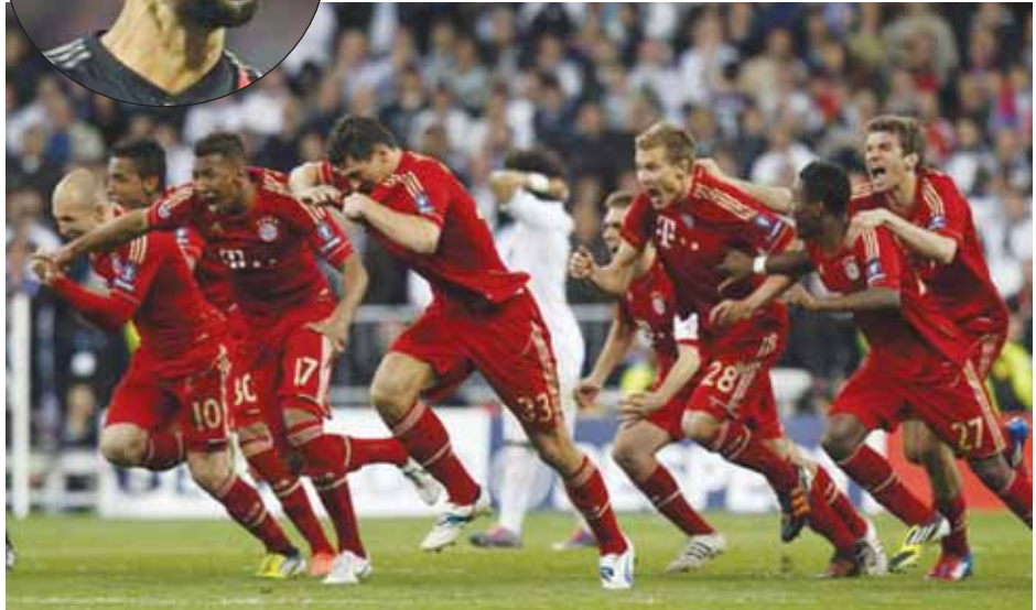
(မေလဲ့သင်း)