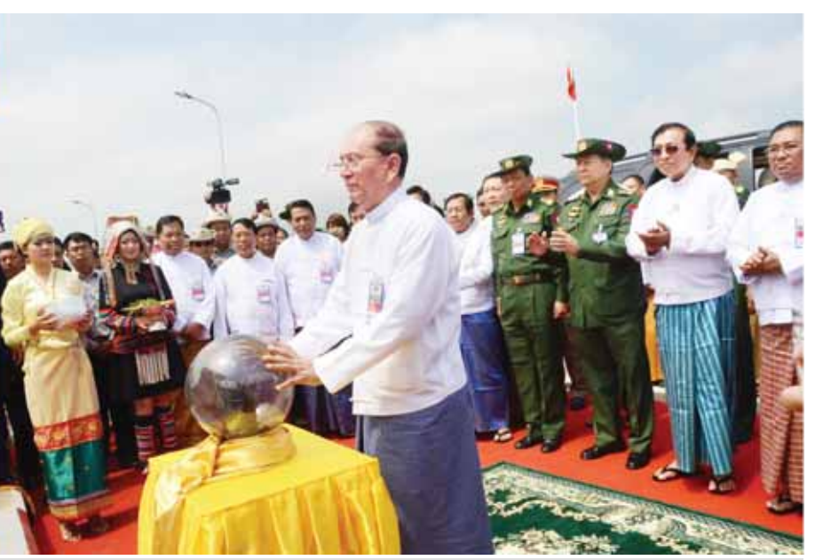
နိုင်ငံတော်သမ္မတ ဦးသိန်းစိန် မြန်မာ- လာအို ချစ်ကြည်ရေးတံတား မြန်မာနိုင်ငံဘက်ကမ်း ကမ်းကပ်ခုံရှိ ကျောက်စာတိုင်ကို စက်ခလုတ်နှိပ် ဖွင့်လှစ်ပေးစဉ်။ (သတင်းစဉ်)

ဦးဝဏ္ဏမောင်လွင်က တံတားဖွင့်လှစ်ခြင်းနှင့်စပ်လျဉ်း၍ ပြောကြားရာတွင် ယခုချစ်ကြည်ရေးတံတားကို နှစ်နိုင်ငံပူးပေါင်း ဆောင်ရွက်မှုဖြင့် တည်ဆောက်ဖွင့်လှစ်နိုင်ခဲ့ခြင်းသည် မိမိတို့နှစ်နိုင်ငံ၏ စည်းလုံးညီညွတ်မှုကို ထင်ရှားစွာပြဆိုလိုက်ခြင်းဖြစ်သည်ဟု ယုံကြည်မိပါကြောင်း။