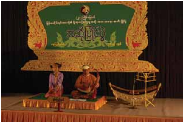
ရှမ်းပြည်နယ်မှ မဆုဆုမွန်ထက် အဆို(မဟာဂီတ)ပြိုင်ပွဲဝင်နေစဉ်။

တိုင်းရင်းသားတို့၏ အမျိုးသားယဉ်ကျေးမှုစရိုက်လက္ခဏာများကို ဖော်ထုတ်ထိန်းသိမ်းပြီး မျိုးဆက်သစ်လူငယ်များကို လက်ဆင့်ကမ်းပေးနေသည့် မြန်မာတိုင်းရင်းသားတို့၏ ရိုးရာယဉ်ကျေးမှု အဆို၊ အက၊ အရေး၊ အတီးပြိုင်ပွဲကို နေပြည်တော် ရေဆင်း တက္ကသိုလ်များနယ်မြေ၌ မေ ၇ ရက်မှ စတင်ကျင်းပခဲ့ရာ ယနေ့တွင် တတိယမြောက်နေ့သို့ ရောက်ရှိလာခဲ့ပြီဖြစ်သည်။