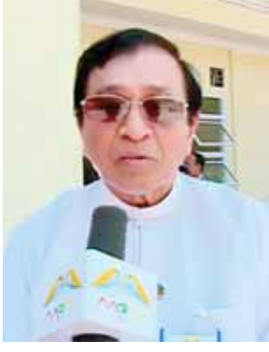
ပြည်ထောင်စုဝန်ကြီး ဦးကျော်လွင်

ရှမ်းပြည်နယ်အရှေ့ပိုင်း တာချီလိတ်ခရိုင် ကျိုင်းလပ်မြို့နှင့် လာအိုနိုင်ငံ လွန်နန်နယ်ပြည်နယ် ဇင်းကုတ်မြို့တို့ကို ဆက်သွယ်တည်ဆောက်ခဲ့သည့် မြန်မာ-လာအို ချစ်ကြည်ရေးတံတားကို ယနေ့နံနက်ပိုင်းတွင် အောင်မြင်စွာ ဖွင့်လှစ်နိုင်ခဲ့ပြီဖြစ်သည်။ အဆိုပါ တံတားဖွင့်လှစ်နိုင်ခဲ့ခြင်း၏ ရလဒ်များကို ပြည်ထောင်စုဝန်ကြီးများနှင့် ပြည်နယ်ဝန်ကြီးချုပ်တို့၏ ပြောကြားချက်များဖြင့် ဖော်ပြလိုက်ပါသည်။