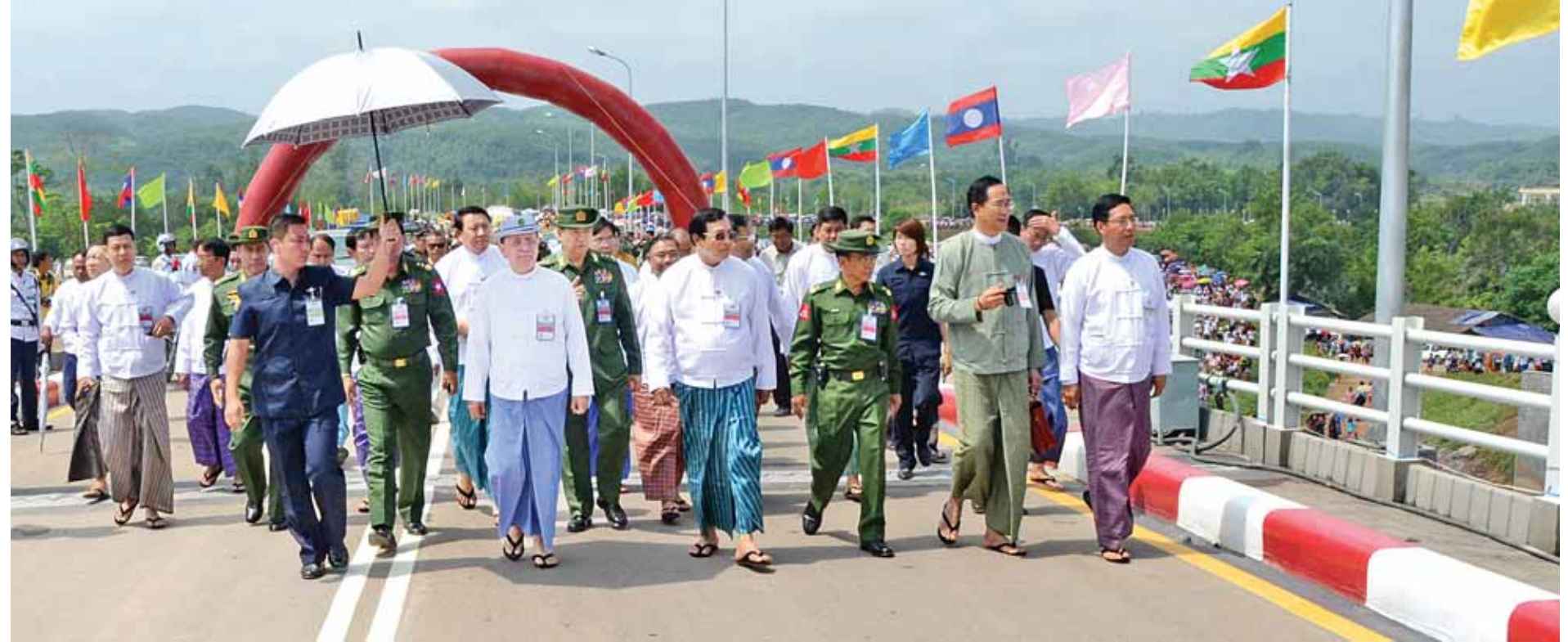
နိုင်ငံတော်သမ္မတ ဦးသိန်းစိန်နှင့်အဖွဲ့ဝင်များ မြန်မာ-လာအို ချစ်ကြည်ရေးတံတားအား ဖြတ်သန်းကြည့်ရှုကြစဉ်။ (သတင်းစဉ်)