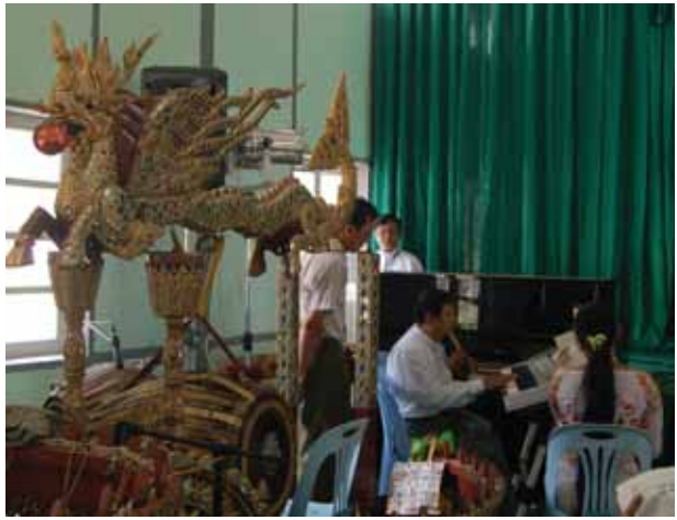
အရေးပြိုင်ပွဲဝင်တစ်ဦး တေးသီချင်းလေ့ကျင့်နေစဉ်။

ကြီးမှ ပြိုင်ပွဲဝင်များက မိမိတို့ မဲကျရာ တေးသီချင်းများဖြင့် ပါဝင်ယှဉ်ပြိုင်ခဲ့ကြသည်။ ထို့နောက် စိုက်ပျိုးရေးတက္ကသိုလ် စာသင်ခန်းမ၌ကျင်းပသည့် အဆို(ကာလပေါ်)ပြိုင်ပွဲတွင် ဝါသနာရှင်(ပထမတန်း)အမျိုးသမီး၊ အခြေခံပညာ အသက်(၁၅-၂၀)(အမျိုးသား)အဆင့်မြင့်ပညာ(အမျိုးသမီး)အဆင့်ပြိုင်ပွဲများကို အကြိတ်အနယ် ဆက်လက်ယှဉ်ပြိုင်လျက်ရှိကြသည်။