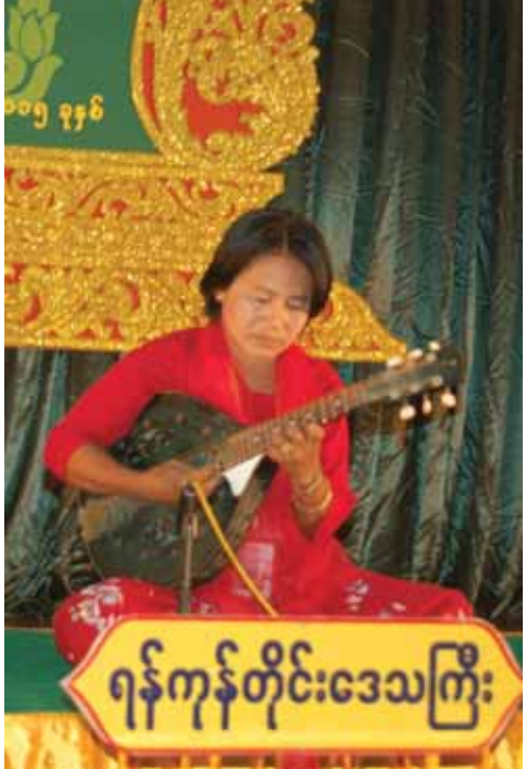
ရန်ကုန်တိုင်းဒေသကြီးမှ ဒေါ်မြနှင့်ရည်အတီး(မယ်ဒလင်)ပြိုင်ပွဲဝင်နေစဉ်။

သတင်း - ခင်ခင်သက်၊ ပြီးစနာမြင့်