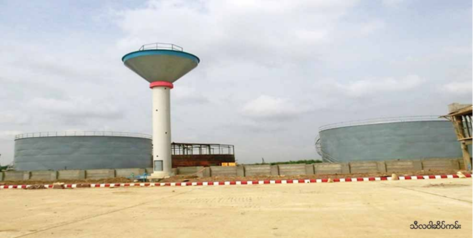
သီလဝါဆိပ်ကမ်း