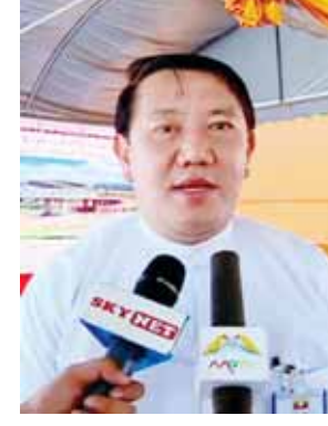
ရှမ်းပြည်နယ်ဝန်ကြီးချုပ် ဦးစဝ်အောင်မြတ်