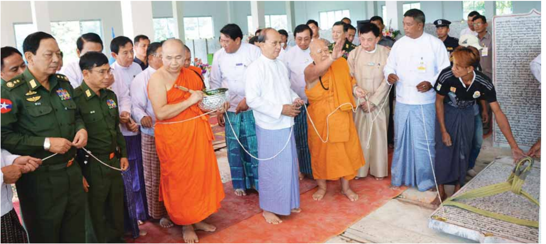
နိုင်ငံတော်သမ္မတ ဦးသိန်းစိန် ဂုံရှမ်းဘာသာဖြင့် စိုက်ထူပူဇော်နေသည့် ပိဋကတ်သုံးပုံကျောက်စာတိုင်ကို စိုက်ထူပူဇော်စဉ်။