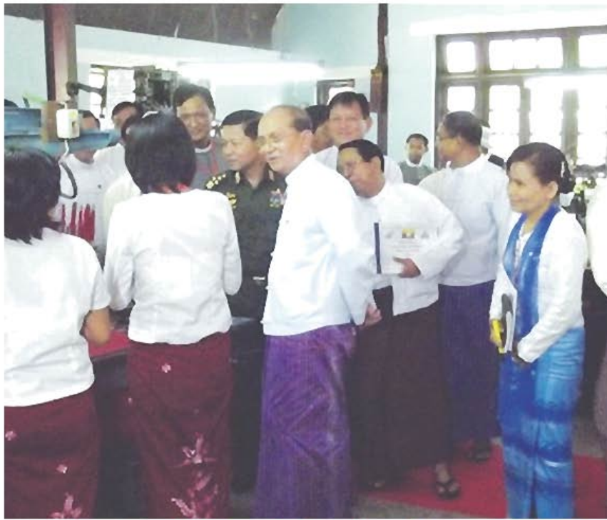
နိုင်ငံတော်သမ္မတဦးသိန်းစိန် ဆောင်းပါးရက်ကန်းနှင့် အသက်မွေးပညာသိပ္ပံကျောင်းသို့ ဝါးစာရက်ကြည့်ရှုစဉ်