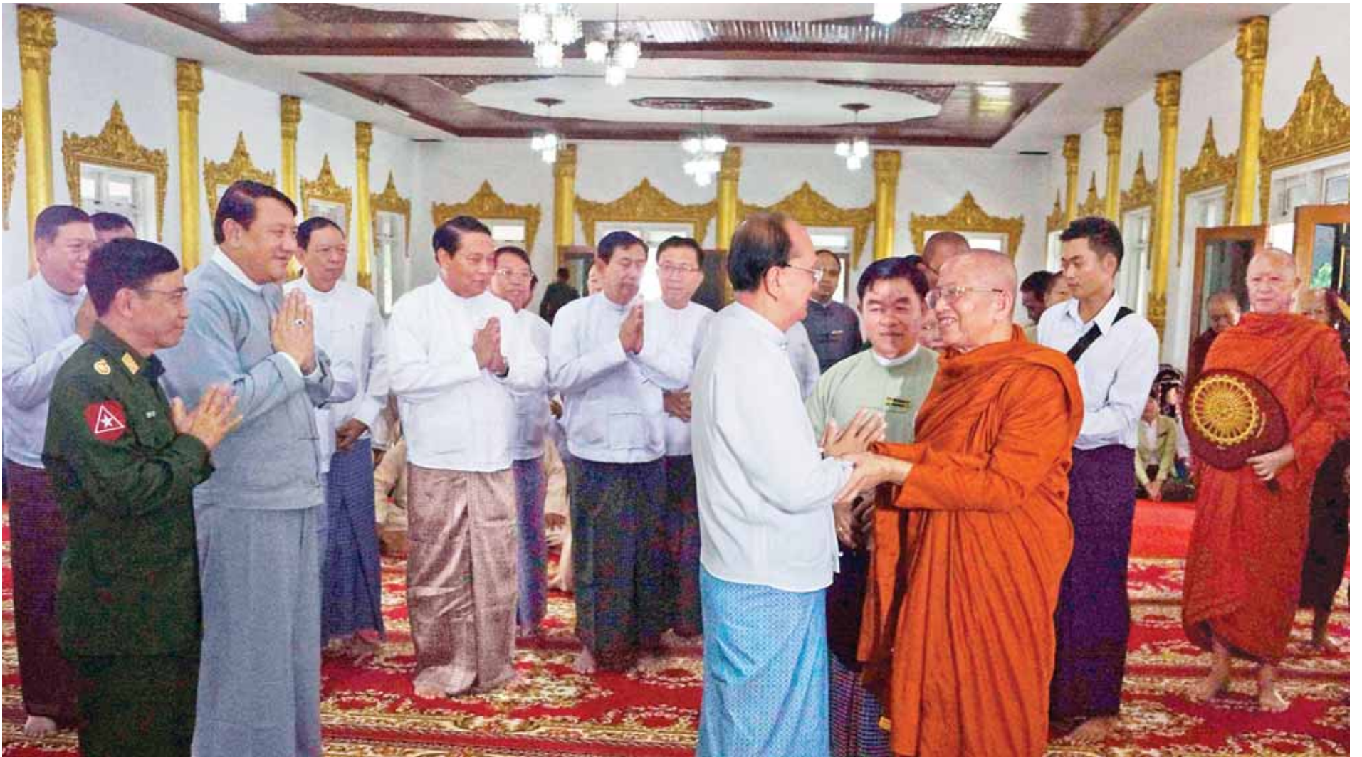
နိုင်ငံတော်သမ္မတ ဦးသိန်းစိန် ကျိုင်းယဉ်ကျေးတိုက်ဆရာတော် အဂ္ဂမဟာသဒ္ဓမ္မဇောတိကဝေ ဘဒ္ဒန္တဓမ္မစာရအား ဖူးမြော်ကြည့်ညှိစဉ်။ (သတင်း စာမျက်နှာ - ၃)