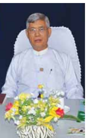
ထားဝယ်အထူးစီးပွားရေးဇုန်စီမံ ခန့်ခွဲမှုကော်မတီဥက္ကဋ္ဌ ပို့ဆောင်ရေး ဝန်ကြီးဌာန ဒုတိယဝန်ကြီး ဦးဟိန်။

ဖြေ။ ကနဦးလုပ်ငန်းတွေကို စီမံကိန်း ဆောင်ရွက်ဖို့အတွက်တော့ တင်ဒါ ခေါ်ယူတဲ့အခါမှာ နိုင်ငံတကာက တင်ဒါခေါ်ယူခြင်းတွေကို (International Tender) မပြုလုပ်ဘဲ ရွေးချယ် ခေါ်ယူခြင်း (Selective Bidding) စနစ်နဲ့ ပြုလုပ်ဖို့အတွက် အီတာလျံ- ထိုင်းကုမ္ပဏီနဲ့ ဂျပန်နိုင်ငံ စီးပွားရေး၊ ကုန်သွယ်ရေးနှင့် စက်မှုဝန်ကြီးဌာန (MEIT)ကတစ်ဆင့် ဂျပန်ကုမ္ပဏီ တွေကို ဖိတ်ခေါ်ဖို့ဆောင်ရွက်ခဲ့ပါ တယ်။ ကနဦးစီမံကိန်း လုပ်ငန်းတွေ ကို ရွေးချယ်ခေါ်ယူခြင်း Selective