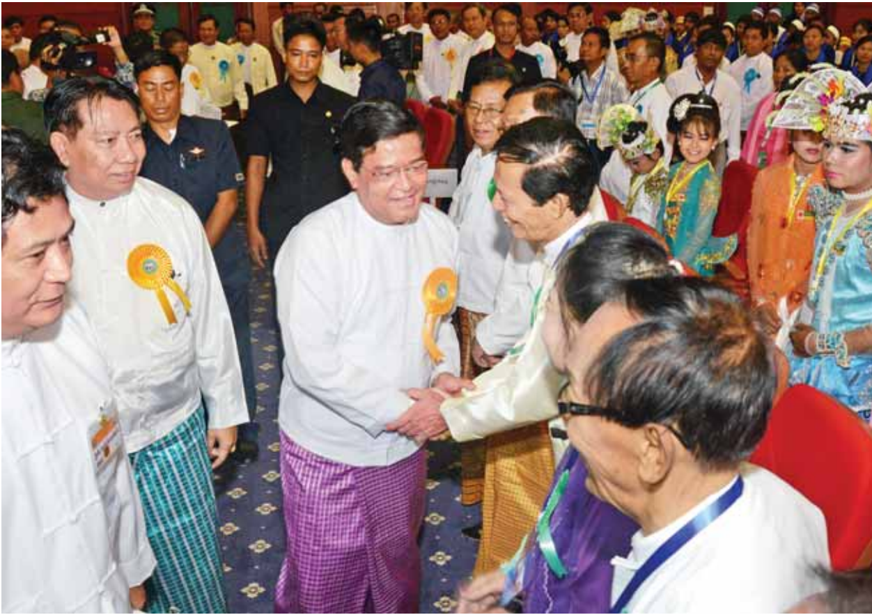
ပြိုင်ပွဲကျင်းပရေးဦးစီးကော်မတီနာယက ဒုတိယသမ္မတ ဦးညွှန်ထွန်း တက်ရောက်လာသူများအား ရင်းရင်းနှီးနှီးနှုတ်ဆက်စဉ်။ (သတင်းစဉ်)

ယနေ့မျက်မှောက်တွင် ယဉ်ကျေးမှုဆိုသည့် စကားရပ်ကို ရိုးရာဓလေ့ထုံးစံနှင့် အနုပညာအမွေအနှစ်ပယ်သမာ နိုင်ငံရေး၊ စီးပွားရေး၊ ပညာရေး၊ လူမှုဆက်ဆံရေး စသည့် နယ်ပယ်များမှာပါ ကျယ်ပြန့်စွာ ယှဉ်တွဲအသုံးပြုလျက်ရှိပါကြောင်း၊ မွေးဖွားသည်မှ သက်တမ်းကုန်ဆုံးသည်တိုင် လူ့ဘဝတွင်နေစဉ်ကြုံရသည့် လူမှုကိစ္စအဝဝတိုင်းသည် ယဉ်ကျေးမှုအလေ့အထများ၊ ကျင့်ဝတ်ကျင့်ထုံးများနှင့် ကင်းလွတ်မှုမရှိပါကြောင်း၊ လူမျိုးတစ်မျိုး၏ စားသောက်ခြင်း၊ ဝတ်စားဆင်ယင်ခြင်း၊ ပြုမူပြောဆိုနေထိုင်ခြင်းစသည့် ဓလေ့ထုံးတမ်းများသည် အဆို