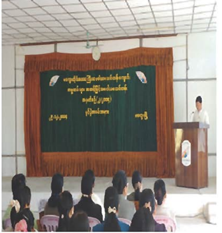
အမှုထမ်းများ အဆင့်မြှင့်သမဝါယမ သင်တန်းဖွင့်လှစ်ပေးနေသည့် အခန်းကဏ္ဍ

ဆက်လက်၍ ၂၀၁၅ - ၂၀၁၆ ဘဏ္ဍာရေးနှစ်တွင်လည်း သမဝါယမဦးစီးဌာနအဆင့်ဆင့်ရိတ်ခံကမ်းများ၊ သမဝါယမအသင်းအဆင့်ဆင့်ရိတ်ခံကမ်းများနှင့် အသင်းဝန်ထမ်းများအတွက် အရည်အသွေးမြှင့်တင်မှုသင်တန်းများကို အောက်ပါအတိုင်းဖွင့်လှစ်ပို့ချပေးသွားမည်ဖြစ်ပါသည်။