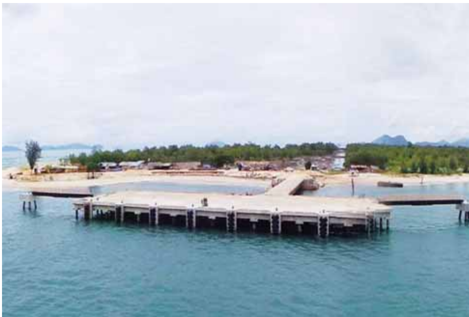
စီမံကိန်းလုပ်ငန်းခွင်အား တွေ့ရစဉ်။

ဖြစ်နိုင်ခြေရှိမှုလေ့လာခြင်း (Feasibility Study)ကို ဆောင်ရွက်ခဲ့ ပါတယ်။ ၂၀၁၀ ခုနှစ် နိုဝင်ဘာလ ၂ ရက်နေ့မှာ မြန်မာ့ဆိပ်ကမ်း အာဏာပိုင်နှင့် အီတာလျံ-ထိုင်း ကုမ္ပဏီတို့က ထားဝယ်အထူးစီးပွား ရေးဇုန်ထဲမှာ စက်မှုနယ်မြေ၊ ရေနက် ဆိပ်ကမ်း၊ မြန်မာ-ထိုင်းနယ်စပ်အထိ ဆက်သွယ်မည့် အဝေးပြေးလမ်း၊ ရထား လမ်းတို့ကို အကောင်အထည်ဖော် တည်ဆောက်သွားဖို့ မူဘောင် သဘောတူစာချုပ် (Framework Agreement)ကို လက်မှတ်ရေးထိုးပြီး ဆောင်ရွက် ခဲ့ပါတယ်။