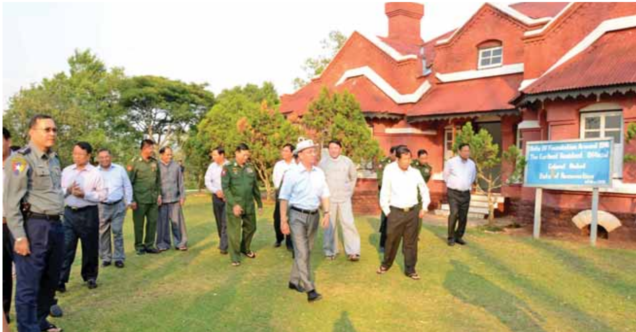
နိုင်ငံတော်သမ္မတ ဦးသိန်းစိန်နှင့်အဖွဲ့ ၁၉၁၈ ခုနှစ်က တည်ဆောက်ခဲ့ သည့် ကာလနယ်ရွာဘယ်၏ ရှေးဟောင်းနေအိမ်ကို ကြည့်ရှုစဉ်။ (ပြန်/ဆက်)

ထို့နောက် နိုင်ငံတော်သမ္မတနှင့်အဖွဲ့သည် ကျိုင်းတုံမြို့ ယဉ်ကျေးမှု