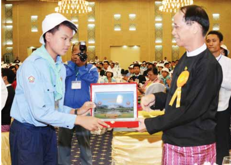
ဒုတိယသမ္မတ ဒေါက်တာစိုင်းမောက်ခမ်း ၂၀၁၅ ခုနှစ် ဘက်စုံပညာထူးချွန်လူငယ် စာပေးပွဲအခမ်းအနား ဂုဏ်ပြုညစာစားပွဲတွင် ဘက်စုံပညာ ထူးချွန်လူငယ်များအား အမှတ်တရလက်ဆောင်များ ပေးအပ်စဉ်။ (သတင်းစဉ်)

ပြည်ထောင်စုသမ္မတမြန်မာနိုင်ငံတော် ဒုတိယသမ္မတ ဒေါက်တာစိုင်းမောက်ခမ်းသည် ယနေ့ညနေ ၆ နာရီတွင် နေပြည်တော်ရှိ မြန်မာအပြည်ပြည်ဆိုင်ရာ ကွန်ဗင်းရှင်း ဗဟိုဌာန-၂ ၌ ကျင်းပသည့် ၂၀၁၅ ခုနှစ် ဘက်စုံပညာထူးချွန်လူငယ်စာပေးပွဲအခမ်းအနား ဂုဏ်ပြုညစာစားပွဲသို့ တက်ရောက်သည်။