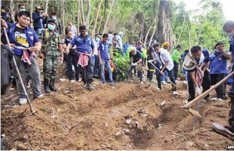
ထိုင်းနိုင်ငံတောင်ပိုင်း ဆောင်ခလာပြည်နယ်တွင် လွန်ခဲ့သည့် ရက်သတ္တပတ်အတွင်း၌ မြန်မာနိုင်ငံနှင့် ဘင်္ဂလားဒေ့ရှ်နိုင်ငံတို့မှ ရွှေ့ပြောင်းနေထိုင်သူများဟု ယုံကြည်ရသူတို့၏ အလောင်းများကို တူးဖော်နေစဉ်။

မလေးရှား နယ်စပ်အနီးတွင် လူကုန်ကူးစခန်းများကို ရှာဖွေတွေ့ရှိ ရခြင်းနှင့်ပတ်သက်၍ စုံစမ်းစစ်ဆေး ရန် ဝန်ကြီးချုပ်က အမိန့်ထုတ်ပြန်ပြီး နောက် လူကုန်ကူးကွန်ရက်များနှင့် အဆက်အသွယ်ရှိကြသည်ဟု သံသယ ရှိသည့် ရဲအရာရှိ ၅၀ ကျော်ကို အရေးယူလိုက်ပြီဖြစ်ကြောင်း ထိုင်း ရဲချုပ်က ယနေ့ ပြောကြားသည်။