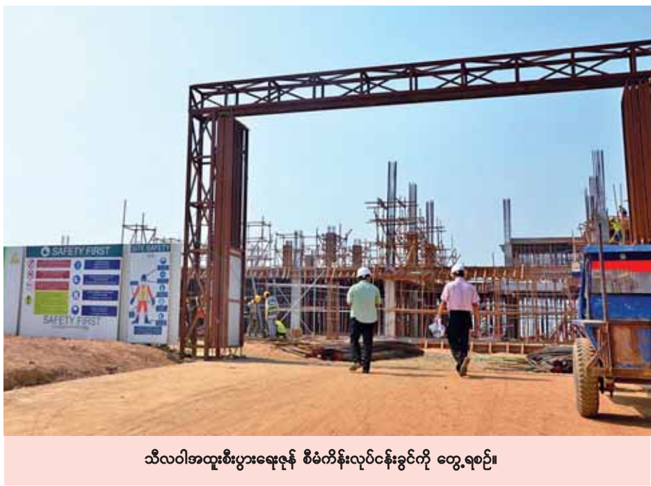
သီလဝါအထူးစီးပွားရေးဇုန် စီမံကိန်းလုပ်ငန်းခွင်ကို တွေ့ရစဉ်။

ဖြေ။ ။ နိုင်ငံရဲ့စီးပွားရေးတွေ ဖွံ့ဖြိုးလာမယ်။ နိုင်ငံခြား ရင်းနှီးမြှုပ်နှံမှုတွေ ဝင်လာမယ်။ ပြီးရင် ဒေသထဲမှာရှိတဲ့ ကျွန်တော်တို့ရဲ့ ပြည်သူတွေ အလုပ်အကိုင်အခွင့်အရေးတွေ ပိုလာပါမယ်။ စီးပွားရေးတွေ တိုးတက်လာမယ်။ နည်းပညာတွေ သူတို့ဆီကနေရရှိမယ်။ အနယ်နယ် အရပ်ရပ်ကလူငယ်တွေ အလုပ်အကိုင်ရရှိမယ်။ အခုဆိုရင်