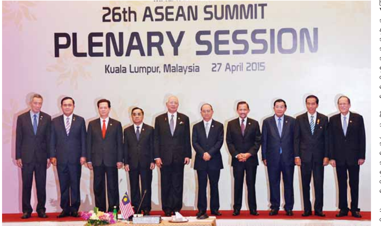
အာဆီယံနိုင်ငံများမှ နိုင်ငံအကြီးအကဲ၊ အစိုးရအဖွဲ့အကြီးအကဲများ (၂၆)ကြိမ်မြောက် အာဆီယံထိပ်သီးအစည်းအဝေးတွင် စုပေါင်းမှတ်တမ်း တင်ဓာတ်ပုံရိုက်ကြစဉ်။ (ပြန်/ဆက်)

အာဆီယံအသိုက် အဝန်းသည် ကမ္ဘာ့အသိုက် အဝန်းအလယ်တွင် (သတင်းစဉ်)