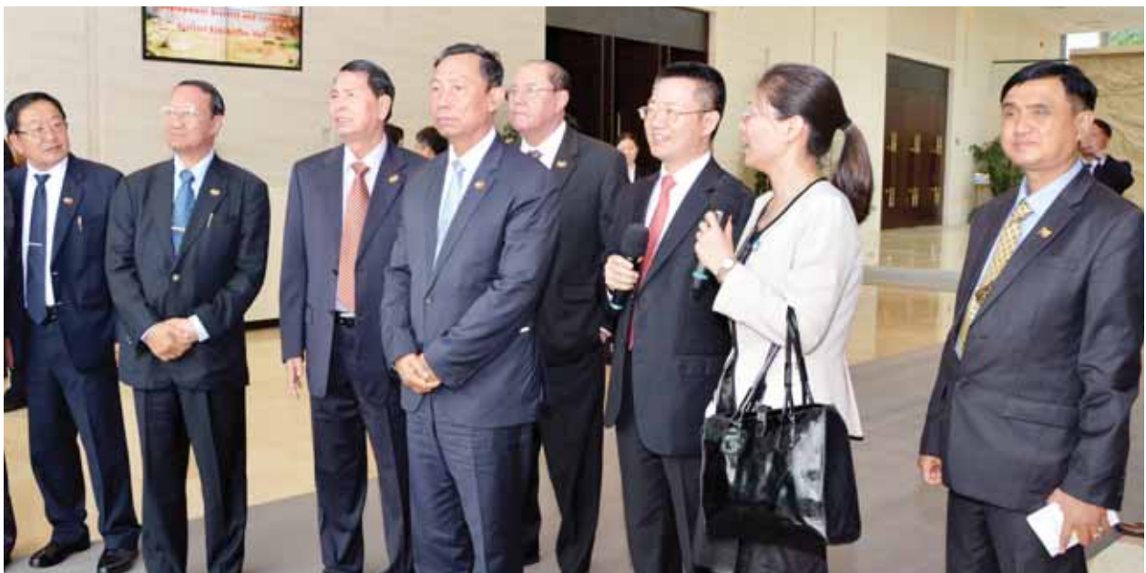
ဆိုင်ရာ မြန်မာသံအမတ်ကြီး ဦးသစ်လင်းအုန်း၊ မြန်မာစစ်သံမှူး (ကြည်း၊ ရေ၊ လေ)ဗိုလ်မှူးကြီးမြင့်သိန်းနှင့် သံရုံးဝန်ထမ်းများက ကြိုဆိုကြသည်။ ထို့နောက် မော်တော်ယာဉ်များဖြင့် ထွက်ခွာရာ ခေတ္တတည်းခိုမည့်

၎င်းနောက် ကွမ်ကျိုးမြို့မှ လေကြောင်းခရီးဖြင့် ပေကျင်းအပြည်ပြည် ဆိုင်ရာလေဆိပ်သို့ရောက်ရှိကြရာ လေဆိပ်၌ တရုတ်ပြည်သူ့သမ္မတနိုင်ငံ