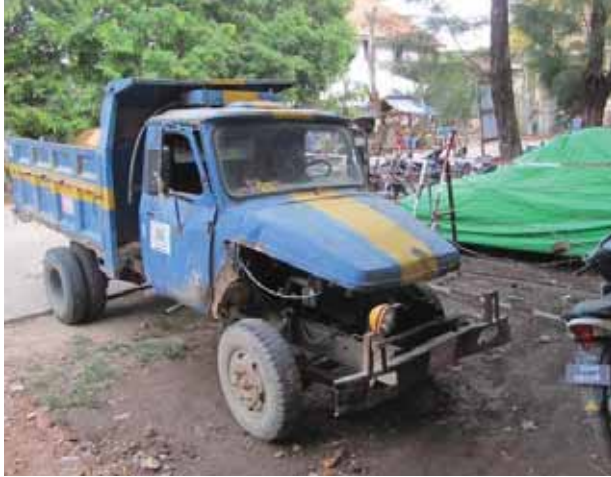
ထွက်ပြေးတိမ်းရှောင်သွားသော ထော်လာဂျီယာဉ်နှင့် ယာဉ်မောင်းအား လိုက်လံဖမ်းဆီးပြီး အမှုဖွင့်အရေးယူ ဆောင်ရွက်လျက်ရှိကြောင်း သိရသည်။

ပုသိမ်မြို့ အမှတ်(၆)ရပ်ကွက် ဘန်ဘွေးကုန်းလမ်းမကြီးနှင့် မြို့ပတ်လမ်းမကြီး လေးခွဆုံ၌ ဧပြီ ၂၆ ရက် မွန်းလွဲပိုင်းက တောင်မှမြောက်သို့ မောင်းနှင်လာသော ကျောက်၊ သဲတင် ထော်လာဂျီယာဉ် ၇၄/xxxxxxနှင့် အနောက်မှ အရှေ့သို့ မောင်းနှင်လာသော ဟွန်ဒါဆိုင်ကယ်တို့ ကန့်လန့်ဖြတ်တိုက်မိကြရာ ဟွန်ဒါဆိုင်ကယ်မောင်းနှင်သူ သေဆုံးသွားကြောင်း သိရသည်။