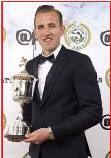
စပါး တိုက်စစ်မှူး ဟယ်ရီကိန်း