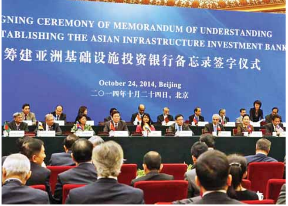
AIIB ဘဏ် တည်ထောင်ရေးဆိုင်ရာ နားလည်မှု စာချုပ်လွှာ လက်မှတ်ရေးထိုးပွဲ အခမ်းအနားကို ၂၀၁၄ ခုနှစ် အောက်တိုဘာ ၂၄ ရက်က ပေကျင်းမြို့ရှိ ပြည်သူ့ခန်းမဆောင်ကြီးတွင် ကျင်းပစဉ်။

AIIB ဘဏ်တည်ထောင်ရေးအတွက် လုပ်ထုံးလုပ်နည်း တွေ၊ ပြဌာန်းချက်တွေ၊ ပဋိညာဉ် စာတမ်းတွေကိုအဖွဲ့ဝင် နိုင်ငံများအကြား ဆက်လက်ညှိနှိုင်းဆွေးနွေးနေဆဲ ဖြစ်ပါ တယ်။ ၂၀၁၅ ခုနှစ် ဇွန်လခန့်မှာ ဘဏ်တည်ထောင်ရေး ဆိုင်ရာ သဘောတူညီချက်ကို အပြီးသတ်ရေးဆွဲပြီး အဖွဲ့ဝင် အဖြစ် ပါဝင်လိုသူတွေ လက်မှတ်ရေးထိုးနိုင်ဖို့ စတင်မှာ