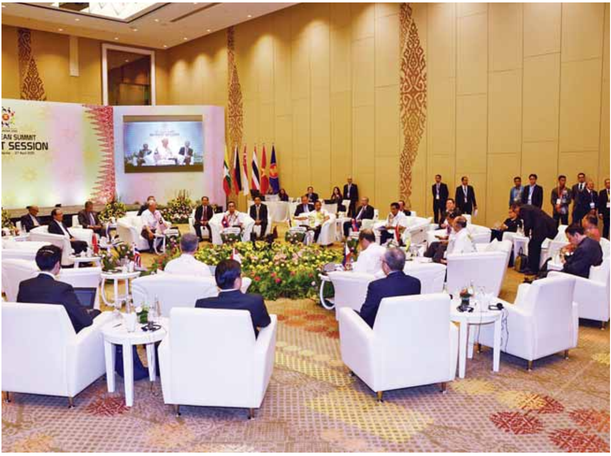
နိုင်ငံတော်သမ္မတ ဦးသိန်းစိန် (၂၆)ကြိမ်မြောက် အာဆီယံ ထိပ်သီးသီးသန့်အစည်းအဝေးတက်ရောက်စဉ်။

ထို့နောက် နိုင်ငံတော်သမ္မတနှင့် ဇနီးတို့အပါအဝင် အာဆီယံနိုင်ငံများမှ ခေါင်းဆောင်များ၊ ဇနီးများအား မလေးရှားနိုင်ငံဝန်ကြီးချုပ်နှင့် ဇနီးတို့က Westin Hotel ရေကူးကန် မြက်ခင်းပြင်၌ ညစာစားပွဲဖြင့် တည်ခင်းဧည့်ခံသည်။ (သတင်းစဉ်)