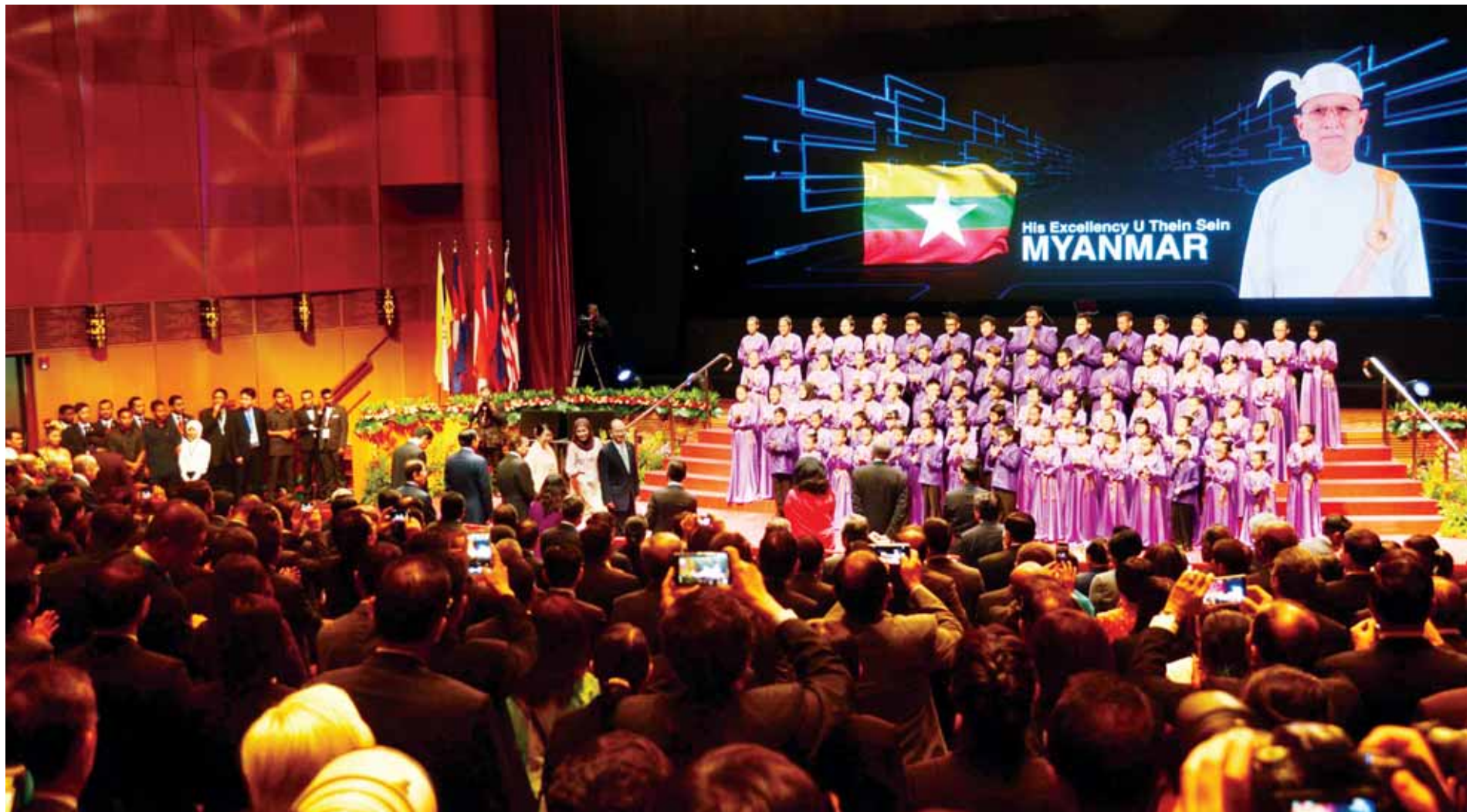
(၂၆) ကြိမ်မြောက် အာဆီယံထိပ်သီးအစည်းအဝေးသို့ တက်ရောက်လာသည့် နိုင်ငံတော်သမ္မတ ဦးသိန်းစိန်နှင့် ဇနီး ဒေါ်ခင်ခင်ဝင်းတို့အား ကြိုဆိုနှုတ်ဆက်ကြစဉ်။ (ပြန်/ဆက်)