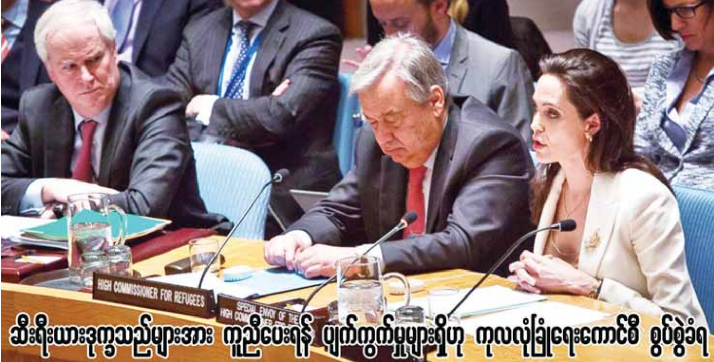
ဆီးရီးယားဒုက္ခသည်များအား ကူညီပေးရန် ပျက်ကွက်မှုများရှိဟု ကုလလုံခြုံရေးကောင်စီ စွပ်စွဲခံရ

အပြား ပျက်စီးခဲ့ရသည်။ မြို့တော်ခတ္တမန္တသည် ဟိမဝန္တာတောင်တန်းက ဝန်းရံထားသော တောင်ကြားဒေသတစ်နေရာတွင် တည်ရှိပြီး လူဦးရေ တစ်သန်း နေထိုင်သည်။ မြေလျင်လှုပ်ခတ်ပြီးနောက် ပြည်သူများမှာ ကြောက်အား လန့်အားဖြင့် လမ်းများပေါ်သို့ ပြေးထွက်လာခဲ့ကြသည်။ ဗိုတိုင်းဖုန်းများနှင့် ဆက်သွယ်ရေး ကိရိယာများ အဆက်အသွယ်ပြတ်တောက်သွားခဲ့သည်။ သမိုင်းဝင် ဒါရာဟာရာ မျှော်စင် ပျက်စီးခဲ့ပြီး လူအများအပြားမှာ ယင်းမျှော်စင် အဆောက်အအုံ၏ အပျက်အစီးများအောက်တွင် ပိတ်မိနေသည်ဟု ယူဆရသည်။ ယင်းမျှော်စင်ကို ၁၈၃၂ ခုနှစ်က တည်ဆောက်ခဲ့ပြီး အထပ်ကိုးထပ်ရှိကာ ၂၀၃ ပေခန့်မြင့်သည်။ မြို့တော်ရှိ လေဆိပ်မှာလည်း ပျက်စီးထိခိုက်မှုရှိကြောင်း သတင်းတွင် ဖော်ပြထားသည်။ ထိခိုက်ဒဏ်ရာရသူများပြားပြီး ဆေးရုံအပြင်ဘက်မှာပင် အရေးပေါ်ဆေးဝါးကုသပေးနေရကြောင်း သတင်းတွင်ဖော်ပြသည်။ [နိုက်တာ]