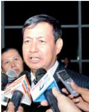
ဦးရဲထွဋ် ပြည်ထောင်စုဝန်ကြီး။

ဒါကြောင့်မို့ ဒီအခမ်းအနားကို တက်ခြင်းဟာ နိုင်ငံရဲ့ဂုဏ်သိက္ခာ၊ မြန်မာပြည်သူတွေရဲ့ ဂုဏ်သိက္ခာကို မြှင့်မားစေခဲ့တယ်။ ဒီအခမ်းအနား တစ်လျှောက် ပြဿနာတွေပုံတွေ၊ ပုံစံတွေထဲမှာလည်း တစ်ချိန်က ဦးဆောင်မှုအခန်းကဏ္ဍက ပါဝင် ဆောင်ရွက်ခဲ့တဲ့ နိုင်ငံတော်ဝန်ကြီးချုပ် ဦးနုပုံကိုလည်း အလေးထားဖော်ပြ ထားတာကို တွေ့ရလို့ တက်ရောက် ရတဲ့ မြန်မာကိုယ်စားလှယ်အဖွဲ့အနေ တစ်နိုင်ငံဖြစ်တယ်။ အဲဒီတုန်းကတော့ ကျွန်တော်တို့နိုင်ငံရဲ့ဝန်ကြီးချုပ် ဦးနု က ပါဝင်ဆောင်ရွက်ခဲ့တာ။ အဲဒီ စစ်အေးကာလတုန်းက အရှေ့အုပ်စု