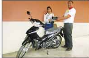
မဖြူဖြူမြင့် (မင်္ဂလာဒုံမြို့နယ်)