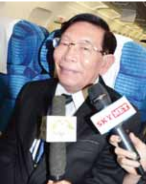
ဦးအောင်မောင် (မန္တလေးမြို့တော်ဝန်)

ဦးအောင်မောင် (မန္တလေးမြို့တော်ဝန်) ကျွန်တော်အနေနဲ့ မန္တလေးမြို့ အတွက် လုပ်ဆောင်စရာတွေ၊ အတု ယူစရာတွေ၊ အတွေ့အကြုံတွေ တော်တော်များများ ရခဲ့တယ်။ အထူး သဖြင့် ဂျကာတာမြို့ဟာ မန္တလေး မြို့ထက် ယာဉ်ပိုမိုများပြားတယ်။