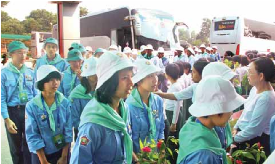
ဒသမတန်းဘက်စုံပညာထူးချွန် ကျောင်းသား ကျောင်းသူများ ငွေဆောင်အပန်းဖြေခန်းသို့ ရောက်ရှိလာရာ တာဝန်ရှိသူများက ကြိုဆိုနှုတ်ဆက်ကြစဉ်။

○ ရှေ့ဖို့မှ တန်ခိုးကြီးဘုရားတစ်ဆူဖြစ်သော ရွှေတိဂုံစေတီတော်မြတ်ကြီးကို သွားရောက်ဖူးမြော်ကြည်ညိုကြပြီး ငွေဆောင်သို့ ခရီးဆက်လက်ထွက်ခွာရာ လမ်းတစ်လျှောက်ရှိ မြို့များမှ ကျောင်းသား ကျောင်းသူများနှင့် မိဘပြည်သူများက လမ်းဘေးဝဲ၊ ယာတစ်လျှောက် အတီးအမှုတ်များဖြင့် ကြိုဆိုနှုတ်ဆက်ကြသည်။ ယင်းနောက် ဒသမတန်းဘက်စုံ ထူးချွန်မောင်မယ်များအား နေ့လယ်စာဖြင့် ကျွေးမွေးညှိနှိုင်းပြီး ဒသမတန်းဘက်စုံပညာ ထူးချွန်လူငယ်များနှင့် အုပ်ချုပ်သူနည်းပြဆရာ၊ ဆရာမများသည် ခရီးဆက်လက်ထွက်ခွာရာ ညနေ ၃ နာရီခန့်တွင် ငွေဆောင်အပန်းဖြေခန်းသို့ ရောက်ရှိသည်။ ၁၉၆၄ ခုနှစ်မှစတင်၍ ခေတ်အဆက်ဆက် ဆောင်ရွက်ခဲ့သည့် လူ့ချစ်ချစ်မိမိန်း အစီအစဉ်အား အစိုးရသစ်လက်ထက်တွင် ၂၀၁၂-၂၀၁၃ ပညာသင်နှစ်မှစတင်၍ ဘက်စုံပညာထူးချွန် လူငယ်အစီအစဉ်အဖြစ် ပြောင်းလဲဆောင်ရွက်ခဲ့ကြောင်းသိရပြီး ယခုနှစ် ၂၀၁၄-၂၀၁၅ ပညာသင်နှစ် ဘက်စုံပညာထူးချွန် ဒသမတန်းကျောင်းသား ကျောင်းသူများအား ငွေဆောင်ကမ်းခြေရှိ ပုလဲငွေဆောင်ဟိုတယ်နှင့် ယူဇနာဟိုတယ်များတွင် တည်းခိုနေထိုင်ရန်စီစဉ်ပေးထားကြောင်း သိရသည်။ ဧပြီ ၂၅ ရက်မှ မေ ၅ ရက်အထိ