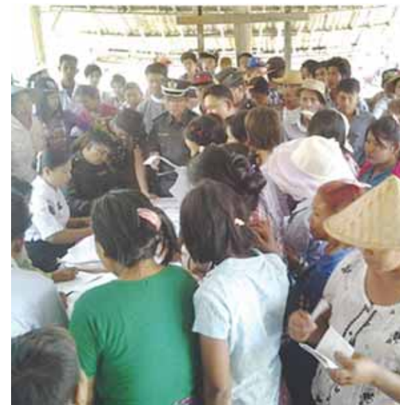
ရွှေဘိုခရိုင် ခင်ဦးမြို့နယ် စည်ပုတ္တရာအုပ်စု ပေကုန်းကျေးရွာ အမက ကျောင်းတွင် အိမ်ထောင်စုနှင့် နိုင်ငံသားစိစစ်ရေးကော်မရှင်း ဆောင်ရွက်နေ မှုကို တွေ့ရစဉ်။

ကမ္ဘာ့အသိဉာဏ်ပစ္စည်းနေ့ စာစီစာကုံးပြိုင်ပွဲ ပထမဆုရသူအား ဂုဏ်ပြုချီးမြှင့်