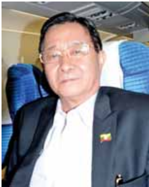
ဦးအောင်မင်း ပြည်ထောင်စုဝန်ကြီး။

ဦးအောင်မင်း ပြည်ထောင်စုဝန်ကြီး ဒီဘန်ဒေါင်းခရီးစဉ်မှာ နိုင်ငံတော် သမ္မတကြီးနဲ့အတူ အစည်းအဝေးနှစ်ခု တက်ရောက်ခဲ့သလို တက်ရောက် လာတဲ့ နိုင်ငံခြားဆောင်ရွက်မှုနဲ့ လည်း တွေ့ဆုံဆွေးနွေးမှုတွေ လုပ်ခဲ့ ပါတယ်။ ဘာကြောင့်လဲဆိုတော့ နီပေါနိုင်ငံရဲ့ ငြိမ်းချမ်းရေးဖြစ်စဉ်နဲ့ ကျွန်တော်တို့နိုင်ငံရဲ့ ငြိမ်းချမ်းရေး ဖြစ်စဉ်က တော်တော်တူတူပါ။ သူတို့ လည်း နှစ်ပေါင်းရှည်ကြာစွာ တိုင်းရင်းသားလက်နက်ကိုင် ပြဿနာ ရှိခဲ့တယ်။ သူတို့ဆီမှာကတော့ မော်ဝါဒီ တိုင်းရင်းသားလက်နက်ကိုင် အဖွဲ့၊ အစည်းတစ်ဖွဲ့တည်းရှိတာ။ မော်ဝါဒီ တိုင်းရင်းသားလက်နက်ကိုင် အဖွဲ့၊ အစည်းနဲ့ သူတို့က ၂၀၀၆ ခုနှစ်က ငြိမ်းချမ်းရေးလက်မှတ်ထိုးနိုင်ခဲ့တယ်။