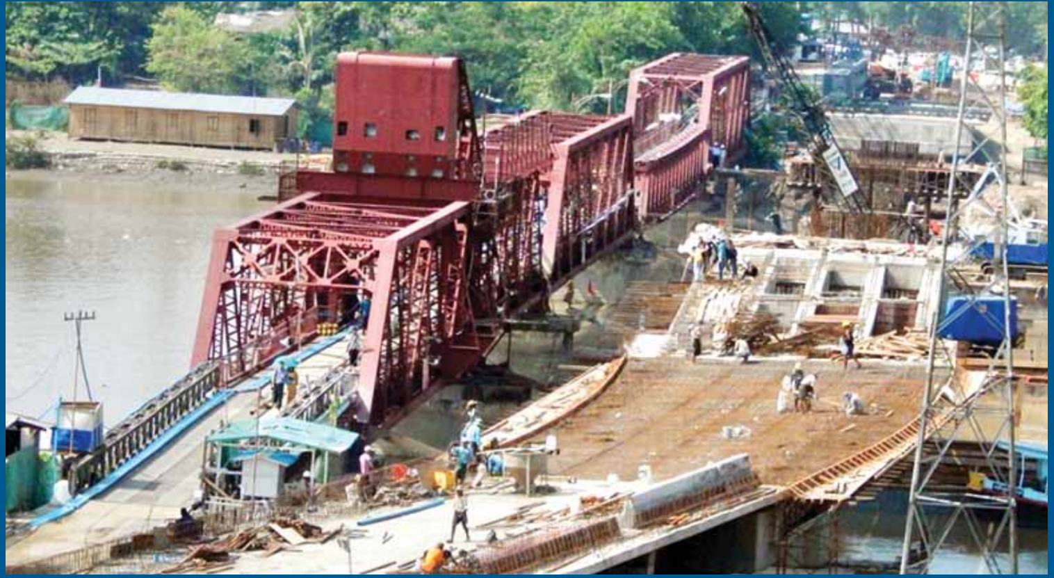
သတင်း စာမျက်နှာ - ၃

ငမိုးရိပ်တံတား (မင်္ဂလာတောင်ညွန့်) တည်ဆောက်ရေး စီမံကိန်း ဘိုးပိုင်လုပ်ငန်းများ ရုန်းပြည်ပြီးစီး