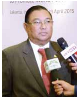
ဦးဝဏ္ဏမောင်လွင် ပြည်ထောင်စုဝန်ကြီး။

ဦးရဲထွဋ် ပြည်ထောင်စုဝန်ကြီး ဒီခရီးစဉ်ကတော့ ဘန်ဒေါင်း ညီလာခံရဲ့ နှစ်(၆၀)ပြည့် အခမ်းအနား ပေါ့။ ၁၉၅၅ တုန်းက အာရှ-အာဖရိက ထိပ်သီးညီလာခံ အများအခေါ် ဘန်ဒေါင်းညီလာခံလုပ်တဲ့အချိန်တုန်း က မြန်မာနိုင်ငံဟာ အဆိုပြုကမကထ လုပ်တဲ့ ငါးနိုင်ငံထဲမှာ အဖွဲ့ဝင် တစ်နိုင်ငံဖြစ်တယ်။ အဲဒီတုန်းကတော့ ကျွန်တော်တို့နိုင်ငံရဲ့ဝန်ကြီးချုပ် ဦးနု က ပါဝင်ဆောင်ရွက်ခဲ့တာ။ အဲဒီ စစ်အေးကာလတုန်းက အရှေ့အုပ်စု