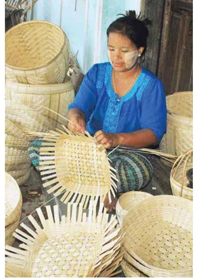
လှိုင်သန်းတင့်(ရမည်းသင်း)

သည်။ တောင်းရက်သူတစ်ဦးလျှင် ပြီးစီးမှုအတိုင်း အတာပေါ်မူတည်၍ ဝါးဖိုး၊ ကြိမ်ဖိုးနုတ်ပြီး တစ်နေ့လျှင် နေ့တွက် နှစ်ထောင်ကျော်မှ နှစ်ထောင်ငါးရာကျပ်ဝန်းကျင် ဝင်ငွေရရှိသည်။ လက်ပံကုန်းဒေသမှ ရက်လုပ်သော တောင်းအမျိုးမျိုးကို ရမည်းသင်းမြို့၊ ယော်ဘွယ်မြို့၊ မိတ္ထီလာမြို့နှင့် တပ်ကုန်းမြို့ အစရှိသော မြို့များသို့ တင်ပို့ရောင်းချကြသည်။ ယင်းလက်ပံကုန်းကျေးရွာမှ ရက်လုပ်သော တောင်းများမှာ အရည်အသွေးကောင်းမွန်သပ်ရပ်ပြီး ကြာရှည်ခံသောကြောင့် လက်ပံကုန်းတောင်းမှာ ယနေ့ထက်တိုင် နာမည်ရရှိလျက် ပြောင်းလဲလာသော ခေတ်အလိုက် ပလတ်စတစ်တောင်းများ၊ လက်ဆွဲခြင်းများ အစားထိုးဝင်ရောက်လာသော ပစ္စည်းများနှင့်ယှဉ်ကာ လက်ပံကုန်းဒေသထွက် တောင်းအမျိုးမျိုးကို ယနေ့ထက်တိုင် လူကြိုက်များကြကြောင်း သိရသည်။