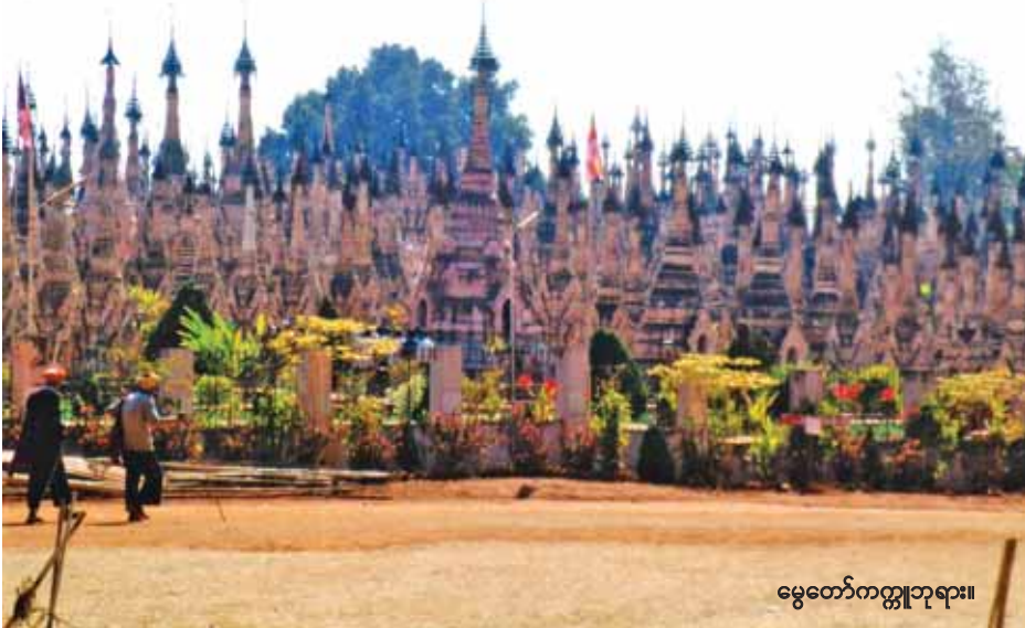
မွေတော်ကတ္တုဘုရား။