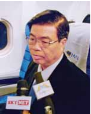
ဦးလှမြင့် (ရန်ကုန်မြို့တော်ဝန်)

နောက်တစ်ခုကတော့ နီပေါ နိုင်ငံက ၂၀၀၆ ခုနှစ်မှာသူ့နိုင်ငံမှာရှိတဲ့ မော်ဝါဒီလက်နက်ကိုင်အဖွဲ့နဲ့ ငြိမ်းချမ်း ရေးဆောင်ရွက်ခဲ့တာရှိတယ်။ အဲဒီ ငြိမ်းချမ်းမှုရယူတုန်းက သူတို့ရဲ့အတွေ့ အကြုံတွေ၊ နိုင်ငံရေးဆွေးနွေးပွဲတွေ လုပ်ခဲ့တဲ့အတွေ့အကြုံတွေကိုလည်း သမ္မတကြီးနဲ့ အမြင်ချင်းဖလှယ်ခဲ့ ကြတယ်။ ဒါတွေဟာ တန်ဖိုးမဖြတ် နိုင်တဲ့ ဘန်ဒေါင်းညီလာခံက ရရှိ