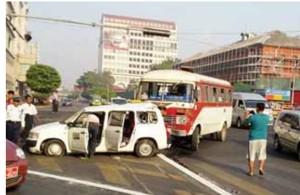
ဆူးလေမီးပွိုင့်တွင် ယာဉ်တိုက်မှု ဖြစ်ပွားစဉ်။