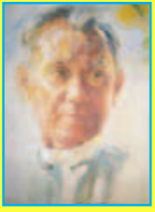
တက္ကသိုလ်ဘုန်းနိုင်