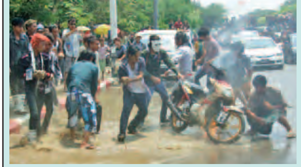
မန္တလေးမြို့ သင်္ကြန်ပွဲတော်အကြတ်နေ့တွင် နန်းရွှေနယူးစီပီလိုင်း တိုက်တန်းအနီး (၆၂)လမ်းမပေါ်တွင် ဆိုင်ကယ်တစ်စီး အပူလွန်၍ မီးလောင်နေစဉ်။ မင်းထက်အောင်(မန်းကိုယ်ပွား)