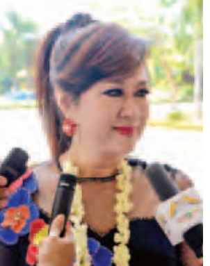
ရုပ်ရှင်သရုပ်ဆောင် မေသန်းနု။