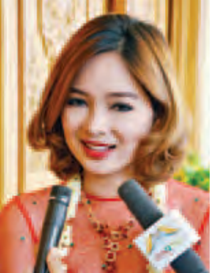
ရုပ်ရှင်သရုပ်ဆောင် မိုးယုစံ။