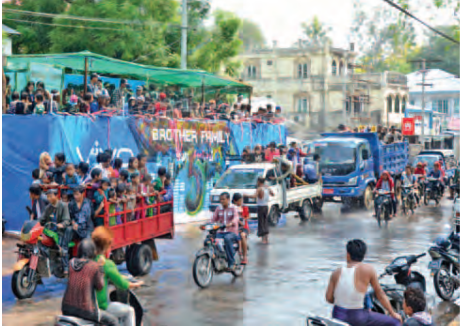
နေပြည်တော်ပျဉ်းမနားရေကစားမဏ္ဍပ်များတွင် ရေကစားသူများဖြင့် စည်ကားနေသည်ကို တွေ့ရစဉ်။ (သတင်းစဉ်)