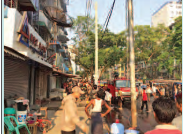
ရန်ကုန်မြို့ ပန်းဘဲတန်းမြို့နယ် အနော်ရထာလမ်းနှင့် ရွှေတိဂုံဘုရား လမ်းထောင့်၌ လျှပ်စစ်ဝါယာရှော့မှ မီးလန့်မှုဖြစ်ပွားစဉ်။ (သက်ပိုင်)