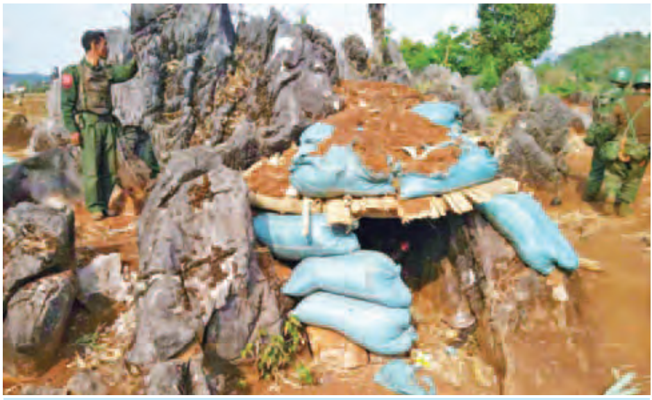
ကိုးကန့်သောင်းကျန်းသူများ၏ ဘန်ကာတစ်လုံးကို တွေ့ရစဉ်။ (မြဝတီ)

ကိုးကန့်သောင်းကျန်းသူများအနေ ဖြင့် ပါစင်ကျော်အရှေ့မြောက်နှင့် အရှေ့ဘက်ဒေသတွင် အဓိက မြေနေရာများ ထိန်းချုပ်နိုင်ခြင်း မရှိတော့ဘဲ ဆုတ်ခွာထွက်ပြေးလျက် ရှိရာ တပ်မတော်စစ်ကြောင်းများက နှစ်နိုင်ငံ နယ်နိမိတ်မျဉ်းအထိ အဆင့်ဆင့်ထိန်းချုပ် တိုက်ခိုက်ချေမှုန်း လျက်ရှိကြောင်း သတင်းရရှိသည်။ (မြဝတီ)