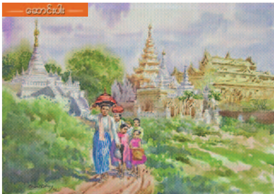
ဆောင်းပါး