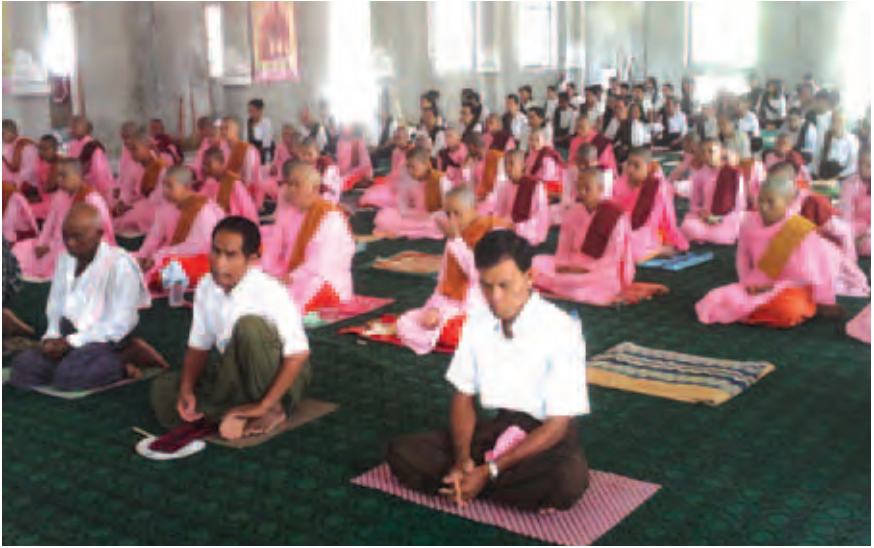
မလ္လိုင်မြို့ အမှတ်(၆) နယ်မြေရပ်ကွက်ရှိ ရွေးသိင်္ဂါတော်ဘုန်းတော်ကြီးကျောင်းဝန်းအတွင်း၌ နှစ်စဉ်ကျင်းပမြဲဖြစ်သော ၇ ရက် တရားစခန်းကို ဧပြီ ၁၃ ရက် နံနက် ၁၀ နာရီတွင် (၈၈) ကြိမ်မြောက်အဖြစ် ဖွင့်လှစ်ခဲ့ရာ ရဟန်းယောဂီ ၁၅ ပါး သီလရှင် ယောဂီ ၇၇ ပါး၊ အမျိုးသမီး ယောဂီ ၁၄၅ ဦးတို့ စုစုပေါင်း ၁၅၉ ပါး ဖြင့် တရားစခန်းဖွင့်လှစ်ခဲ့ပြီး တစ်နှစ်ကိုနှစ်ကြိမ် အဖြစ် တရားစခန်းဖွင့်လှစ်ခဲ့သည်ဟု သိရသည်။