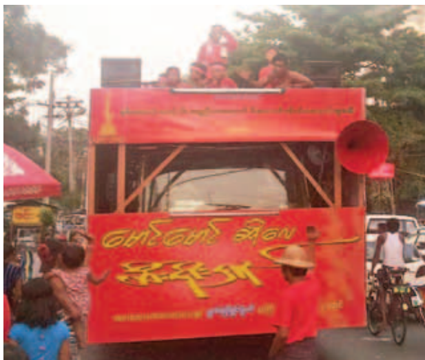
ဧပြီ ၁၅ ရက်က မြန်မာ့ရိုးရာအတာသင်္ကြန်ပွဲတော်ကာလအတွင်း ရန်ကုန်မြို့ရှိ သံချပ်အဖွဲ့များအနက်မှ "မောင်မောင်ဆိုလေ ထီးရိုးရှည်" အဖွဲ့၏ အလှပြမော်တော်ယာဉ်ဖြင့် လှည့်လည်ဖျော်ဖြေမှုကို တွေ့ရစဉ်။ (၆၈၀)