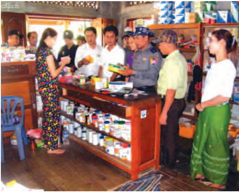
ဆေးဆိုင်အကြီးလေးဆိုင်၊ ဈေးဆိုင်နှင့်ကုန်စုံဆိုင် ၁၅ ဆိုင်နှင့် ကွမ်းယာဆိုင်ငါးဆိုင် စုစုပေါင်း ၂၄ ဆိုင်တို့အား တိုက်ဆိုင်စစ်ဆေးမှုများ ပြုလုပ်နိုင်ခဲ့သည်။ ဆိုင်ပိုင်ရှင်များကိုလည်း မြို့နယ်ဆရာဝန်ကြီးနှင့် အဖွဲ့က တားမြစ်ဆေးဝါးအကြောင်းနှင့် ယခုကဲ့သို့