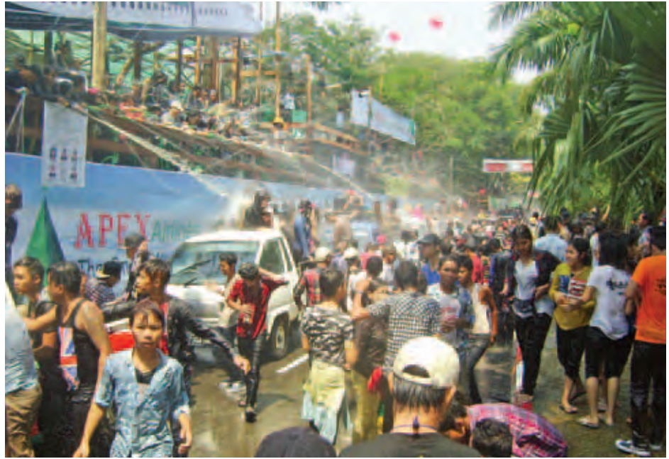
မဟာသင်္ကြန်အကြွတ်နေ့က ရန်ကုန်မြို့ ကန်တော်ကြီးပတ်လမ်းတစ်လျှောက် ရေသဘင်ပွဲဆင်နွှဲလျက်ရှိသည့် သင်္ကြန်ချစ်သူများကို တွေ့ရစဉ်။ (အောင်ကျော်ဦး)

သော တိုင်းရင်းသားအသီးသီး၊ လူမျိုးအသီးသီး၊ ကိုးကွယ်ရာ ဘာသာအသီးသီးတို့ မတူကွဲပြားသော်လည်း တူညီစွာပေါင်းစုစည်းပြီး ပျော်ရွှင်စွာဆင်နွှဲသည့် မြန်မာ့ရိုးရာ သင်္ကြန်ပွဲတော်တွင် ပြောင်းလဲလာသည့် ဒီမိုကရေစီရေးရာကြောင်းနှင့် အတူ မျောပါရင်း မြန်မာတို့၏ နှစ်သစ်ကို ငြိမ်းချမ်းရေးတေးသံများဖြင့် ကြိုဆိုရင်း ပြည်တွင်းရှိ တိုင်းရင်းသားအစိတ်ကို မောင်နှမများနှင့် ထပ်တူ မွေးရပ်မြေကို တမ်းတနေမည့် အဝေးရောက် မိတ်ဆွေများအားလုံးလည်း နှစ်သစ်မှာ ပျော်ရွှင်ပါစေကြောင်း ဆုမွန်ကောင်းတောင်းရင်း။ (သီသီမင်း)