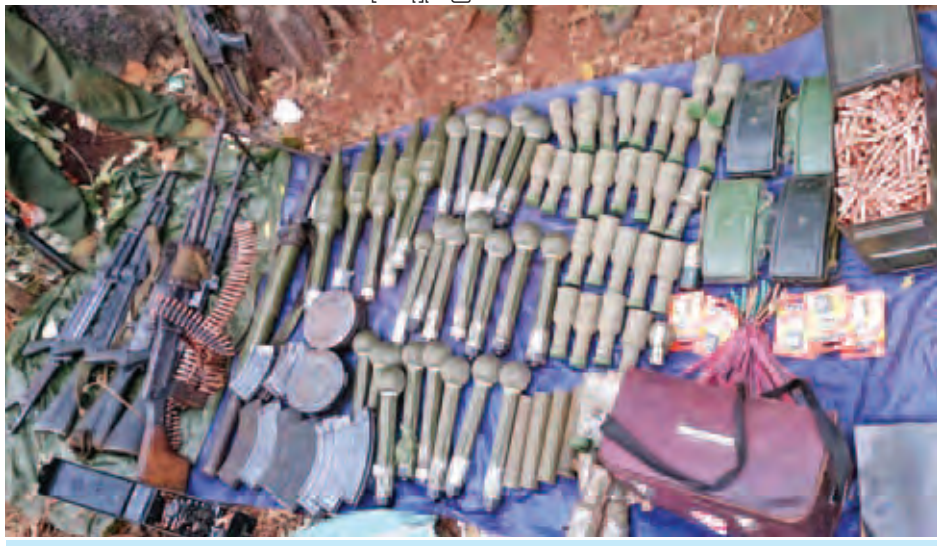
ကိုးကန့်သောင်းကျန်းသူများထံမှ သိမ်းဆည်းရမိသော လက်နက် ခဲယမ်းများကို တွေ့ရစဉ်။

စွန့်စားစွာဖြင့် ရန်သူအား လုံ့စွပ်ထိုးတိုက်ခိုက်ချေမှုန်းမှု (၄၆)ကြိမ် တိုက်ခိုက်ချေမှုန်းခဲ့ရသည်။ ရန်သူအနေဖြင့်လည်း တပ်မတော်စစ်ကြောင်းများအား တန်ပြန်တိုက်စစ်ဖြင့် ခုခံတိုက်ခိုက်မှု (၃၂) ကြိမ်ခန့် ပြုလုပ်ခဲ့သော်လည်း တပ်မတော်သားများက ကြိုကြိုခံရင်ဆိုင်၍ တွန်းလှန်ချေမှုန်းတိုက်ခိုက်ခဲ့သည်။ ထို့အပြင် ကိုးကန့်သောင်းကျန်းသူများအနေဖြင့် အလျား မီတာ ၁၂၀၊ အနံ မီတာ ၈၀ ခန့်ရှိ ကျောက်စိုင်ကျောက်တုံးများ ပေါများသော ပွိုင့်-၁၅၈၄ တောင်ကုန်းအား မြေအနေအထားအရ အသာစီးရယူပြီး အခိုင်အမာဘန်ကာများ ဆောက်လုပ်ထားခြင်းကြောင့် တပ်မတော်စစ်ကြောင်းများက တိုက်ရိုက်ပစ်လက်နက်ကြီးများဖြင့် တိုက်ခိုက်ချေမှုန်းခဲ့ရာ ရန်သူ၏ ဘန်ကာ ၁၄ လုံးအား ဖျက်စီးချေမှုန်းနိုင်ခဲ့သည်။ ပွိုင့်-၁၅၈၄ တောင်ကုန်းအား ကိုးကန့်သောင်းကျန်းသူများက တောင်ကြားလမ်းတစ်လျှောက် အင်အားအစုအပြုံလိုက် ပိတ်ဆို့ခြင်း၊ သဘာဝ