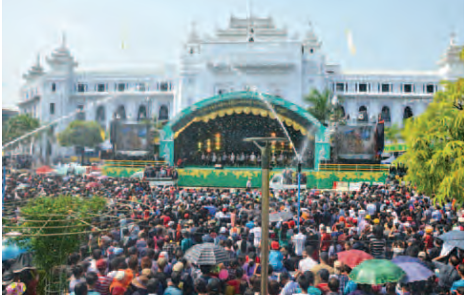
သင်္ကြန်အကြတ်နေ့က ရန်ကုန်မြို့တော်ဝန်မဟာသင်္ကြန်မဏ္ဍပ်၌ စည်ကားလျက်ရှိသည်ကို တွေ့ရစဉ်။