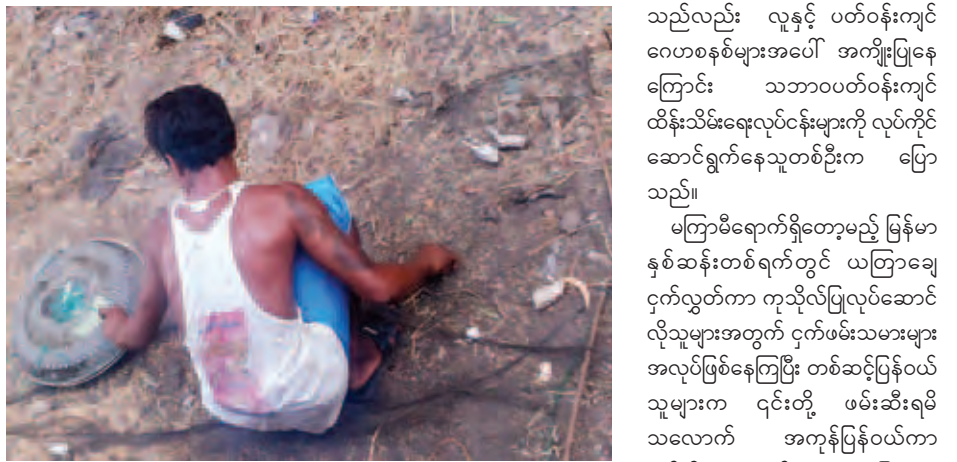
ပိုက်ကွန်ထောင်ခြောက်ဖြင့် ဖမ်းဆီးရမိသောငှက်များကို လှောင်အိမ် အတွင်းထည့်နေစဉ်။