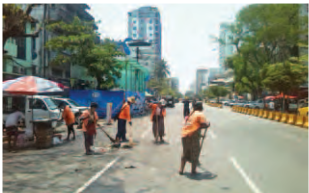
ဧပြီ ၁၅ ရက် သင်္ကြန်အကြတ်နေ့ နေ့လယ်က လမ်းမတော်မြို့နယ် အနော်ရထာလမ်းနှင့် (၁၁)လမ်းထောင့် ရေကစားမဏ္ဍပ်ရှေ့ရှိ ရေပက်ခံ ထွက်ယာဉ်များမှ စွန့်ပစ်ခဲ့သော အမှိုက်များကို ရေကစားရပ်နားသည့်အချိန် မှန်းလွဲ ၁ နာရီက မြို့နယ်စည်ပင်သန့်ရှင်းရေးဝန်ထမ်းများ နေပူကျဲကျဲ တွင် သိမ်းဆည်းနေစဉ်။ (မောင်စေအောင်)