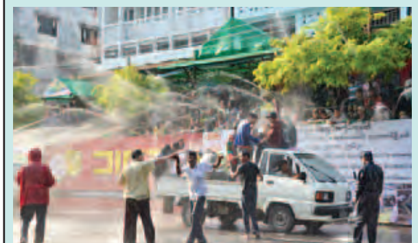
သင်္ကြန်အကြတ်နေ့က DICE အထည်ချုပ်မှု ဦးစီးဌာနနှင့် အာအာဘီ ပြည်ပအလုပ်အကိုင်ရှာဖွေရေးကုမ္ပဏီတို့က နှစ်ပေါင်း ၃၀ ကျော်ကြာ မပျက်မကွက်ဆင်နွှဲသည့် ပုဇွန်တောင်မြို့နယ် လမ်း(၅၀)ထိပ်ရှိ BACHELORS ရေကစားမဏ္ဍပ်တွင် ရေသဘင်ပွဲတော်ကို ဖျော်ရွှင်စွာ နှစ်ပျော်ကြစဉ်။

၂၀၁၅ ခုနှစ် ဧပြီ ၁၆ ရက်တွင် ကျရောက်သော ဒိန်းမတ်နိုင်ငံ ဒုတိယမြောက် မာဂရီသ်ဘုရင်မကြီး၏မွေးနေ့တွင် ပြည်ထောင်စုသမ္မတ မြန်မာနိုင်ငံတော် နိုင်ငံခြားရေးဝန်ကြီးဌာန ပြည်ထောင်စုဝန်ကြီး ဦးဝဏ္ဏမောင်လွင်ထံမှ ဒိန်းမတ်နိုင်ငံ နိုင်ငံခြားရေးဝန်ကြီး မစ္စတာ မာတင် လီဒါဂတ်ထံသို့ ဝမ်းမြောက်ကြောင်း သဝဏ်လွှာပေးပို့သည်။ (သတင်းစဉ်)