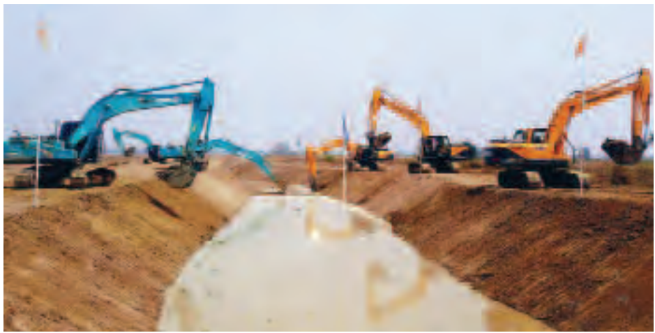
နှစ်တွေမှာ ကျွန်တော်တို့ လယ်သမားတွေ ရေနှစ်မြုပ်မှုဘေးက ကင်းဝေးကြတော့မှာပဲ အထူးအားရဝမ်းသာ ဖြစ်ကြရပါတယ်”ဟု ယင်းဒေသမှ ဒေသခံ လယ်သမားတစ်ဦးက ပြောပြ (ဖြူးမြစ်ဦး)

သက်သာလာစေမည်ဖြစ်ပြီး စိုက်သမျှ သီးနှံများအောင်မြင်ဖြစ်ထွန်းလာကြတော့မည်ဖြစ်သည်။ “ကျွန်တော်တို့ ဒီဒေသတွေမှာ နှစ်စဉ်စပါးများ စိုက်ပျိုးပြီးဖြစ်ထွန်းအောင်မြင်ကြလို့ ဝမ်းသာနေကြတုန်းအောင် မြင်ဖြစ်ထွန်းနေကြတဲ့ စပါးစိုက်ခင်းတွေ ရိတ်သိမ်းခါနီးကျမှ ချောင်း၊ မြောင်းရေနဲ့ စစ်တောင်းမြစ်ရေတွေကြီးလာတော့ စပါးစိုက်ခင်းတွေ ရေအောက်ရောက်ကုန်ကြပြီး နှစ်စဉ်ဆိုသလို ဆုံးရှုံးမှုနဲ့ ကြုံကြရပါတယ်။ “ဒီနှစ်မှာတော့ ဆည်မြောင်းဦးစီးဌာနက အခုလို ချောင်းကော၊ မြောင်းကော တွေတူးဖော် ရေဘေးကာကွယ်ပေးတာတွေ မြေဖို့ပြင်တော့ နောင်