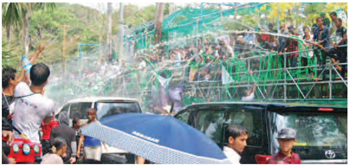
သင်္ကြန်အကြိမ်နေ့က ရန်ကုန်တိုင်းဒေသကြီး မင်္ဂလာတောင်ညွန့်မြို့နယ် ကန်တော်ကြီးကန်ပတ်လမ်းတစ်လျှောက်ရှိ ရေကစားမဏ္ဍပ်များ၌ စည်ကားအေးချမ်းစွာဖြင့် ပြည်သူများ ပျော်ရွှင်စွာရေကစားနေကြစဉ်။

သင်္ကြန်ကားမျိုးစုံကို မြင်တွေ့ရသကဲ့သို့ ဇိမ်ခံကားများကိုလည်း ဘေးတံခါးနှင့် နောက်ပိတ်တံခါးများဖြတ်ပြီး ကားအမိုးပေါ်ထိတက်၍ ကခုန်မှုကို လည်း တွေ့ရသည်။