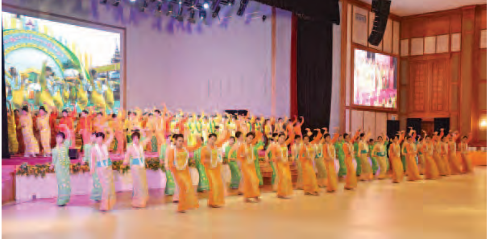
နိုင်ငံတော်သမ္မတအိမ်တော် ငှက်ခွေဝါခန်းမ၌ ယင်းအဖွဲ့များက ဖြေဖျော်တင်ဆက်စဉ်။ (သတင်းစဉ်)