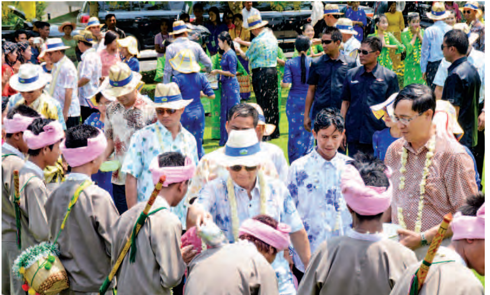
နိုင်ငံတော်သမ္မတ ဦးသိန်းစိန်နှင့် ဇနီး ဒေါ်ခင်ခင်ဝင်း မဟာသင်္ကြန်အကြိမ်တော်တွင် အတာရေသဘင်ပွဲတော်၌ ပါဝင်ဆင်နွှဲစဉ်။