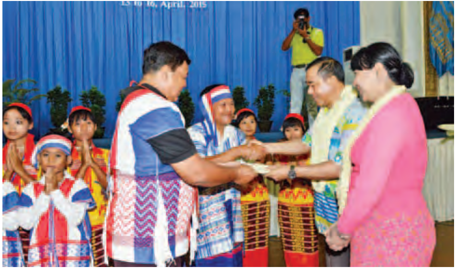
ဧပြီ ၁၅ ရက်က ရန်ကုန်မြို့တော်ခန်းမ၌ ရန်ကုန်တိုင်းစစ်ဌာနချုပ် တိုင်းမှူး ဗိုလ်ချုပ်ထွန်းထွန်းနောင်နှင့် ဇနီးတို့က ကရင်ပြည်နယ် လှိုင်းဘွဲ့မြို့နယ် ကော့ပီးကျေးရွာ ကရင်ရိုးရာယဉ်ကျေးမှုအဖွဲ့အား ဆုချီးမြှင့်ငွေကျပ် ဝါးသိန်းကို ပေးအပ်စဉ်။ (စောသိန်းဝင်း)

သို့ဖြစ်ရာ ယခုကျင်းပနေသော မြန်မာ့ရိုးရာရေသဘင်ပွဲတော်တွင် မြန်မာ့ယဉ်ကျေးမှုကို အတတ်နိုင်ဆုံး ထိန်းသိမ်းနိုင်ခဲ့သည်ဟုဆိုရမည် ဖြစ်သလို သင်္ကြန်နှစ်ကူးပွဲတော်ပြီး၍ နှစ်သစ်သို့ ကူးပြောင်းရောက်ရှိသော ကာလတွင်လည်း နှစ်သစ်တွင် စိတ်သစ်၊ လူသစ်ဖြင့် မင်္ဂလာအပေါင်းနှင့် ပြည့်စုံစေရန်အတွက် ကျန်ရှိနေသေးသော ယဉ်ကျေးမှုကို ထိခိုက်စေမည့် လုပ်ဆောင်မှုများကို ဝိုင်းဝန်းထိန်းသိမ်းသွားကြရမည်ဖြစ်ပါသည်။ ။