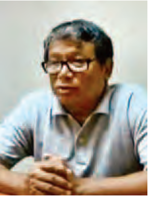
ဦးမျိုးမြတ်သူ။

အမျိုးမျိုးသောပဋိပက္ခတွေကြောင့် ရှေ့ကို မတိုးနိုင်တာ အားလုံးအသိပါ။ တစ်တိုင်းပြည်လုံး ၅၁ သန်းကျော် သော ပြည်သူလူထုကြီးက အဓိက ငြိမ်းချမ်းချင်ကြပြီ။ တိုးတက်ချင်ကြပြီ။ တစ်ဦးနဲ့တစ်ဦး နားလည်မှု ရှင်ကြား စေနိုင်မှ ဒါဟာ ညီညွတ်မှာပါ။ နားလည်မှု ညီညွတ်မယ်၊ ညီညွတ်မှ ငြိမ်းချမ်းမယ်။ ငြိမ်းချမ်းမှ တိုးတက် ပါမယ်။ ဆွေးနွေးပွဲဟာ ဒီတစ်ကြိမ်နဲ့ မပြီးဘဲနဲ့ အဖြေတစ်ခုရတဲ့အထိ ဆွေးနွေးကြပြီးတော့ တိုင်းကျိုး ပြည်ကျိုး ဆောင်ရွက်နိုင်ပါစေလို့