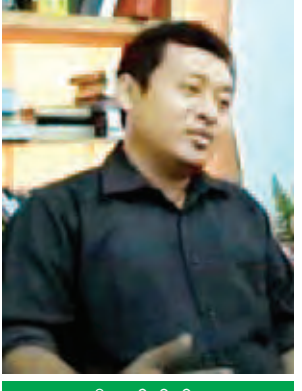
ဦးဇော်ထိုက်။

အမျိုးသားလုံခြုံရေးကိုလည်း ဒီထက် ပိုပြီး ကောင်းမွန်စေချင်ပါတယ်။ နိုင်ငံနဲ့ ပြည်သူတွေအတွက် ရေရှည် ဖွံ့ဖြိုးတိုးတက်မှုကို ဖြစ်စေချင်ပါ တယ်။ တွေ့ဆုံမှုတွေကနေပြီး ကောင်းမွန်တဲ့တိုးတက်မှုတွေ ဖြစ်ပေါ် မယ်ဆိုရင် ကောင်းပါတယ်။ ဒေါက်တာဆလင်းဌာန်ကျီးလန် (ဥပဒေအကြံပေး၊ မြန်မာနိုင်ငံ ငြိမ်းချမ်းရေးပြန်လည်ထူထောင်ရေး လုပ်ငန်းဗဟိုဌာန) အခုတွေ့ဆုံဆွေးနွေးပွဲကို ထောက်ခံ ပါတယ်။ ၂၀၁၅ ရွေးကောက်ပွဲကို လည်း အောင်မြင်စွာ ကျင်းပနိုင်မယ် လို့ ထင်ပါတယ်။