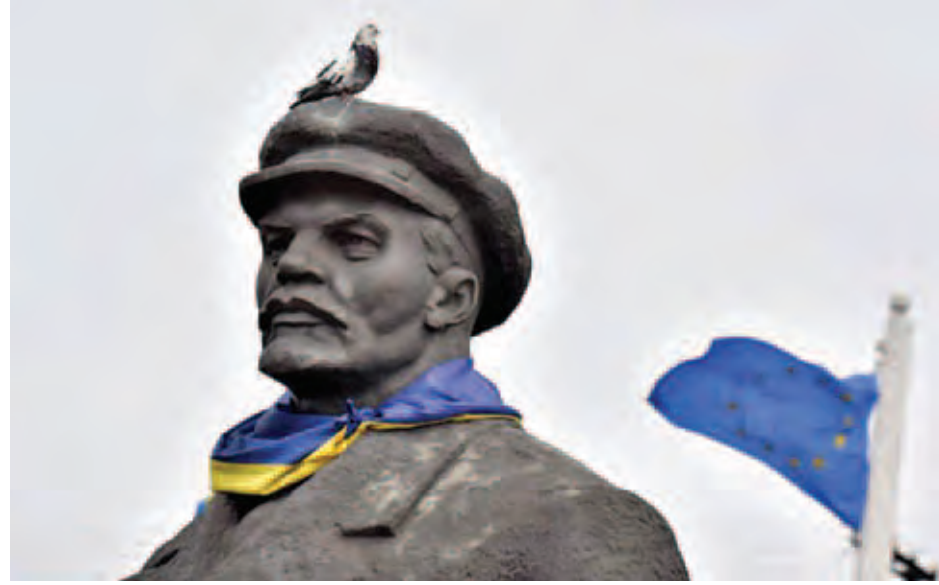
ယူကရိန်းနိုင်ငံအရှေ့ပိုင်းရှိ ဆိုဗီယက်ခေတ်လက်ကျန် ဗလာဒီမာလီနင်ရုပ်တု။ မည်သို့မည်ပုံ ရှင်းလင်းဖယ်ရှားသွားမည်ကို မသိရသေးပေ။ ပြည်သူ့ရှင်ပြင်များတွင် ထားရှိသော ဆိုဗီယက် ခေါင်းဆောင်တောင်း ဗလာဒီမာလီနင်အား သရုပ်ဖော် သည့် ရုပ်တုများကို ဖြိုချသည့် လုပ်ရပ်များပေါ်ပေါက်ခဲ့ပြီး ဆိုဗီယက်ဆန်ကျင်ရေးလှုပ်ရှားမှုများကို ယူကရိန်းနိုင်ငံ အရှေ့ပိုင်းရှိ ရုရှားဘာသာစကားပြော ယူကရိန်းနိုင်ငံသား များက ဒေါသတကြီး ဝေဖန်ပြောကြားခဲ့ကြသည်။ ပီတီအိုင်း။

ကီယက် ဧပြီ ၁၁ ယူကရိန်းနိုင်ငံ၌ ဆိုဗီယက်ခေတ်၏ အထိမ်းအမှတ် သင်္ကေတအရပ်ရပ်ကို ပိတ်ပင်ရန် ပါလီမန်က ဥပဒေကြမ်း တစ်ရပ်ကို အတည်ပြုပေးလိုက်ကြောင်း၊ ယင်းမှာ ရုရှား နိုင်ငံကို အာခံသည့် လက္ခဏာတစ်ရပ်ဖြစ်ကြောင်း ဒေသ ဆိုင်ရာသတင်းဌာနများက ဧပြီ ၁၁ရက်တွင် သတင်း ထုတ်ပြန်သည်။ ဆိုဗီယက်ခေတ်၏ အမှတ်သင်္ကေတအားလုံးကို ပိတ်ပင်ရန် ဥပဒေကြမ်းတွင်ဖော်ပြထားပြီး ထောက်ခံမဲ ၂၅၄ မဲ၊ ကန့်ကွက်မဲမရှိဖြင့် အတည်ပြုလိုက်ကြောင်း အမတ်တစ်ဦးဖြစ်သူ ယူရီလတ်ဆန်ကိုက ပြောကြားသည်။ ယူကရိန်းနိုင်ငံသည် ဒုတိယကမ္ဘာစစ်ပြီးဆုံးချိန်မှသည် ၁၉၉၁ ခုနှစ်တွင် လွတ်လပ်ရေးရရှိချိန်အထိ ဆိုဗီယက် ပြည်ထောင်စု၏အဖွဲ့ဝင်နိုင်ငံတစ်နိုင်ငံအဖြစ် ပါဝင်ခဲ့ သည်။ ဒုတိယကမ္ဘာစစ်ကာလအတွင်း ယူကရိန်းကို နာဇီ တပ်ဖွဲ့များက ကျူးကျော်သိမ်းပိုက်ခဲ့သည်။ ဆိုဗီယက်နှင့် နာဇီအတိတ်သမိုင်းကြောင်းတို့နှင့် သက်ဆိုင်နေသော ရုပ်တုများ၊ ရုပ်လုံးများ၊ အမှတ်တံဆိပ် များ၊ အမှတ်သင်္ကေတများ စသည်တို့အသုံးပြုခြင်းကို ဥပဒေအရ တားမြစ်ပိတ်ပင်မည်ဖြစ်ကြောင်း လတ်ဆန် ကိုက ပြောကြားသည်။ ယူကရိန်းနိုင်ငံတစ်ဝန်း၌ ဆိုဗီယက်ခေတ်လမ်းအမည် များ၊ အထိမ်းအမှတ်ရုပ်တုများ၊ ယဉ်ကျေးမှုအနုပညာ လက်ရာပစ္စည်းများ ရှိနေဆဲဖြစ်ပြီး ဥပဒေသစ်အရ ဆိုဗီယက်အငွေအသက်ပါရှိသော အမှတ်သင်္ကေတများကို