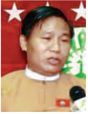
ဦးအေးလွင်။

ဦးသုဝေ (ဥက္ကဋ္ဌ၊ ဒီမိုကရက်တစ်ပါတီမြန်မာ) အခုလိုတွေ့ဆုံပြီး ဆွေးနွေးတယ်၊ ညှိနှိုင်းတယ်၊ အပြေရှာတယ်ဆိုတာ အကောင်းဆုံးအပြေရှာတဲ့နည်း ဖြစ် ပါတယ်။ ဒီမိုကရေစီနည်းဖြစ်တဲ့ အတွက် ဝမ်းသာတယ်။ တွေ့ဆုံပြီးတဲ့ အခါ မူဘောင်သတ်မှတ်ရုံပဲ ရှိသေး တယ်။ သူတို့ရဲ့ သဘောထားအမှန်ကို မပြောသေးတဲ့အတွက် အသေးစိတ် မဝေဖန်ချင်သေးဘူး။ သူတို့အနေနဲ့ တိုင်းပြည်အကျိုးအတွက် ပွင့်ပွင့်လင်း လင်းပြောမယ်ဆိုရင် ကောင်းပါတယ်။ အဲလိုမျိုးမဟုတ်ဘဲနဲ့ စိတ်ကူးထဲက စိတ်ကူးယဉ်အိပ်မက်တွေကိုပဲ ပြော သွားမယ်ဆိုရင်တော့ မဟုတ်သေး ဘူးပေါ့။