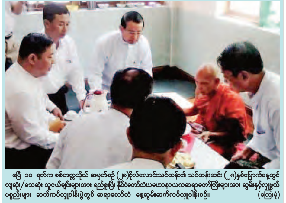
ဧပြီ ၁၀ ရက်က စစ်တက္ကသိုလ် အမှတ်စဉ် (၂၈) ဗိုလ်လောင်းသင်တန်း၏ သင်တန်းဆင်း (၂၈) နှစ်မြောက်နေ့တွင် ကျဆုံး/သေဆုံး သူငယ်ချင်းများအား ရည်စူးပြီး နိုင်ငံတော်သံဃမဟာနာယကဆရာတော်ကြီးများအား ဆွမ်းနှင့်လှူဖွယ် ပစ္စည်းများ ဆက်ကပ်လှူဒါန်းပွဲတွင် ဆရာတော်ထံ နေ့ဆွမ်းဆက်ကပ်လှူဒါန်းစဉ်။