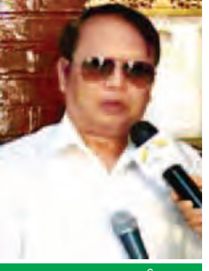
စာရေးဆရာဆူးငှက်။