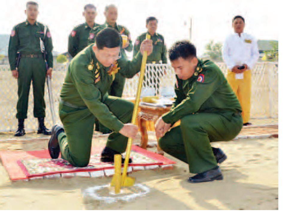
ပုသိမ်၊ မုံရွာ၊ ခိုလမ်း၊ ရေတာရှည် စသည့် ငါးမြို့နယ်တွင်လည်း ဆက်လက် အကောင်အထည်ဖော် ဆောင်ရွက်သွားမည်ဖြစ်ကြောင်း သိရသည်။ ထို့ပြင် လာမည့်ဘဏ္ဍာရေးနှစ်

အလားတူ အထက်ပါဘဏ္ဍာရေး နှစ်အတွင်း စစ်မှုထမ်းဟောင်း အဆင့်မြင့်အိမ်ရာများကို ရန်ကုန် တိုင်းဒေသကြီး မော်ဘီမြို့နယ်၌ အရာရှိကြီး နေအိမ်နှစ်ခန်းတွဲ သုံးထပ် နှစ်လုံး၊ အရာရှိငယ်နေအိမ် နှစ်ခန်းတွဲ သုံးထပ် လေးလုံးနှင့် အခြားအဆင့်နေအိမ် နှစ်ခန်းတွဲ သုံးထပ် ၁၇ လုံး စုစုပေါင်း ၂၃ လုံးကို လည်းကောင်း၊ မန္တလေးတိုင်းဒေသ ကြီး ပုသိမ်ကြီးမြို့နယ်၌ အရာရှိကြီး နေအိမ်နှစ်ခန်းတွဲ သုံးထပ် နှစ်လုံး၊ အရာရှိငယ်နေအိမ် နှစ်ခန်းတွဲ သုံးထပ် လေးလုံးနှင့် အခြားအဆင့်နေအိမ် နှစ်ခန်းတွဲ သုံးထပ် ၁၇ လုံး စုစုပေါင်း ၂၃ လုံးကိုလည်းကောင်း အသီးသီး ဆောက်လုပ်လျက်ရှိပြီး လားရှိုးမြို့ တွင် အရာရှိငယ်နေအိမ် နှစ်ခန်းတွဲ နှစ်ထပ်လေးလုံး၊ အခြားအဆင့်နေအိမ် နှစ်ခန်းတွဲနှစ်ထပ် ၂၈ လုံးနှင့် ဟုမ္မလင်း မြို့တွင် အခြားအဆင့် နေအိမ် နှစ်ခန်းတွဲတစ်ထပ် ခုနစ်လုံး တို့ကို လည်း အကောင်အထည်ဖော်ဆောင် ရွက်သွားမည်ဖြစ်သည့်အပြင် ကျိတ်ထို