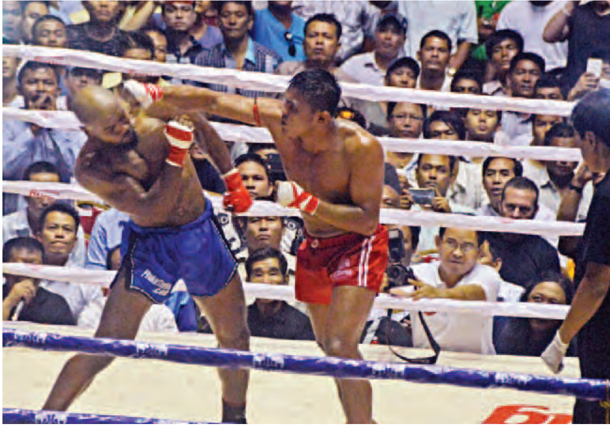
ထွန်းထွန်းမင်း(မုဒုံသား)က ဆိုင်းရစ်(အမေရိကန်)ကို ဤသို့ အမိအရ ထိုးသတ်စဉ်။