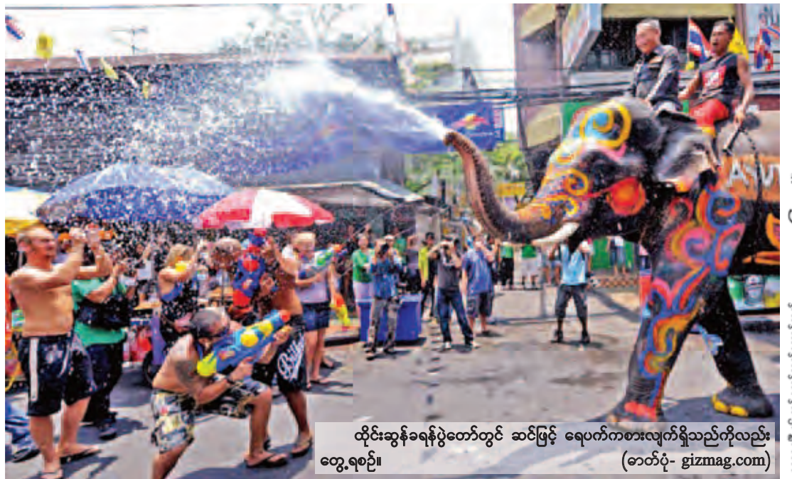
ထိုင်းဆွန်ခရစ်ပွဲတော်တွင် ဆင်ဖြင့် ရေပတ်ကစားလျက်ရှိသည်ကိုလည်း တွေ့ရစဉ်။