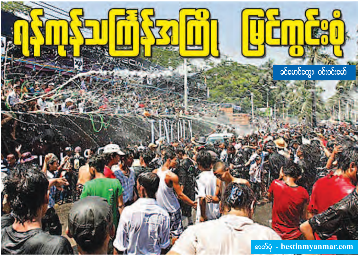
၁၆မောင်ထွေး၊ ဝင်းဝင်းမော်