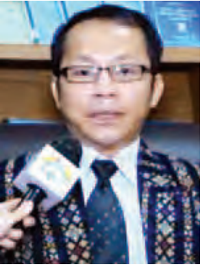
ဒေါက်တာဆလင်းဌာန်ကျီးလန်။