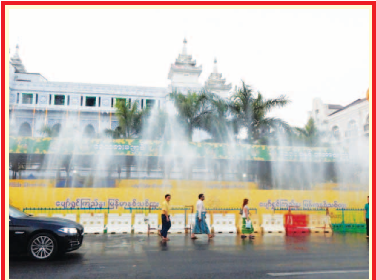
2015 ခုနှစ် ဧပြီလ ၁၁ ရက် နံနက်ပိုင်းမှစတင် ရေကစားကြ သည်။ ကလေးများ၊ လူငယ်များ ပျော်ရွှင်စွာဖြင့် ရေပက်ကစားခြင်းကို ထားဝယ်ရိုးရာ ယဉ်ကျေးမှု တစ်ရပ်အနေဖြင့် သုံးရက်စော၍ ပျော်ရွှင်အေးချမ်းစွာ ရေကစားကြသည်မှာ အစဉ်အလာဖြစ်ကြောင်း သိရ သည်။ (ကျော်ကျော်လတ်)

သင်္ကြန်ပွဲတော် ကာလများတွင် ရေပက်ကစားမဏ္ဍပ်များနှင့် ရေပက်ခံ ထွက်သော ယာဉ်များကြောင့် အရေးပေါ်ကိစ္စဖြင့် သွားလာနေကြ