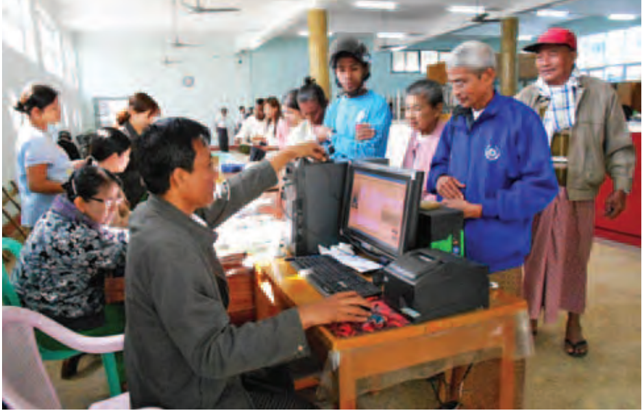
မြန်မာ့စီးပွားရေးဘဏ်(စစ်တွေ)တွင် အငြိမ်းစားဝန်ထမ်းများ ပင်စင်လစာတွေကို စမတ်ကတ်ဖြင့် ထုတ်ယူစဉ်။

မေး။ ။ နိုင်ငံဝန်ထမ်းများ လစာနှုန်းထား တိုးမြှင့်ခွင့်ပြုပြီးဖြစ်ပေမယ့် ပင်စင်စားတွေအတွက် တိုးမြှင့်ပေးမယ့် နှုန်းထားပါရှိခြင်း မရှိတဲ့အတွက် ပင်စင်စားတွေကို ဘယ်လို တိုးမြှင့်ပေးမလဲဆိုတာ သိလိုပါတယ်။ ဖြေ။ ။ ပင်စင်လစာ တိုးမြှင့်ရေးနဲ့ ပတ်သက်ပြီးတော့ ဘဏ္ဍာရေးဝန်ကြီးဌာနရဲ့ ဧပြီ(၁၀)ရက်စွဲပါ အမိန့်ကြော်ငြာစာအမှတ် ၁၀၅၉/ ၂၀၁၅ ဖြင့် ပင်စင်စားတွေရဲ့ ပင်စင်လစာကို တိုးမြှင့်သတ်မှတ်ပေးဖို့ အမိန့်ကြော်ငြာစာ ထုတ်ပြန်ပေးပြီး ဖြစ်ပါတယ်။ အဲဒီအမိန့်ကြော်ငြာစာမှာ ပင်စင်စားတွေကို လက်ရှိပင်စင်လစာအပြင် ထပ်မံတိုးမြှင့်သတ်မှတ်တဲ့ လစာ ကျပ် ၄၅၀၀၀ အပေါ် မူတည်ပြီး တည်ဆဲပင်စင်နည်းဥပဒေနဲ့ အညီတွက်ချက်ပြီး တိုးမြှင့်ပင်စင်လစာအဖြစ် ထပ်မံတိုးမြှင့်ခွင့်ပြုသွားမှာ ဖြစ်ပါတယ်။