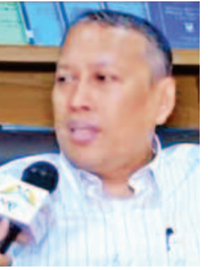
ဦးလှမောင်ရွှေ။

ဦးသုဝေ (ဥက္ကဋ္ဌ၊ ဒီမိုကရက်တစ်ပါတီမြန်မာ) အခုလိုတွေ့ဆုံပြီး ဆွေးနွေးတယ်၊ ညှိနှိုင်းတယ်၊ အပြေရှာတယ်ဆိုတာ အကောင်းဆုံးအပြေရှာတဲ့နည်း ဖြစ် ပါတယ်။ ဒီမိုကရေစီနည်းဖြစ်တဲ့ အတွက် ဝမ်းသာတယ်။ တွေ့ဆုံပြီးတဲ့ အခါ မူဘောင်သတ်မှတ်ရုံပဲ ရှိသေး တယ်။ သူတို့ရဲ့ သဘောထားအမှန်ကို မပြောသေးတဲ့အတွက် အသေးစိတ် မဝေဖန်ချင်သေးဘူး။ သူတို့အနေနဲ့ တိုင်းပြည်အကျိုးအတွက် ပွင့်ပွင့်လင်း လင်းပြောမယ်ဆိုရင် ကောင်းပါတယ်။ အဲလိုမျိုးမဟုတ်ဘဲနဲ့ စိတ်ကူးထဲက စိတ်ကူးယဉ်အိပ်မက်တွေကိုပဲ ပြော သွားမယ်ဆိုရင်တော့ မဟုတ်သေး ဘူးပေါ့။