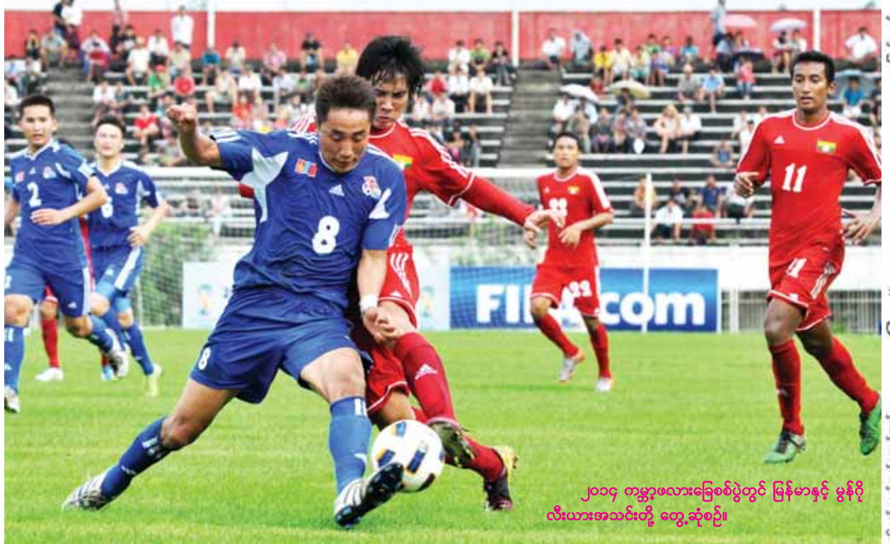
၂၀၁၄ ကမ္ဘာ့ဖလားခြေစစ်ပွဲတွင် မြန်မာနှင့် မွန်ဂိုလီးယားအသင်းတို့ တွေ့ဆုံစဉ်။