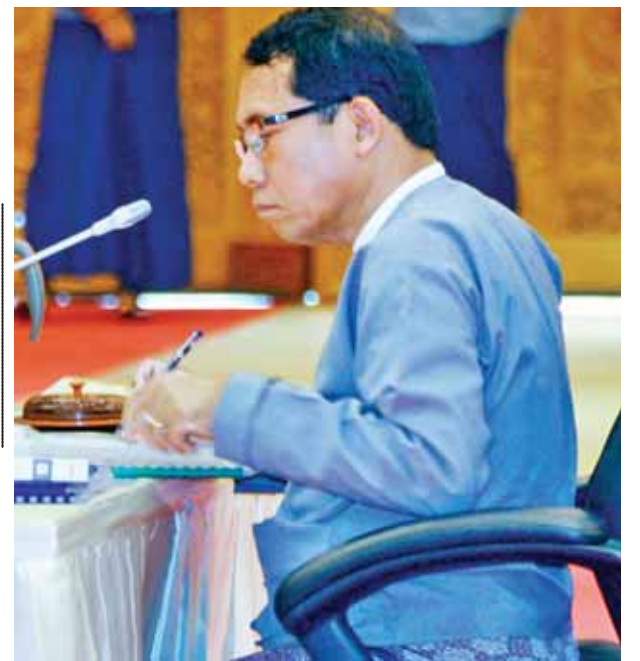
အမျိုးသားလွှတ်တော်ကိုယ်စားလှယ် ဒေါက်တာအေးမောင်။