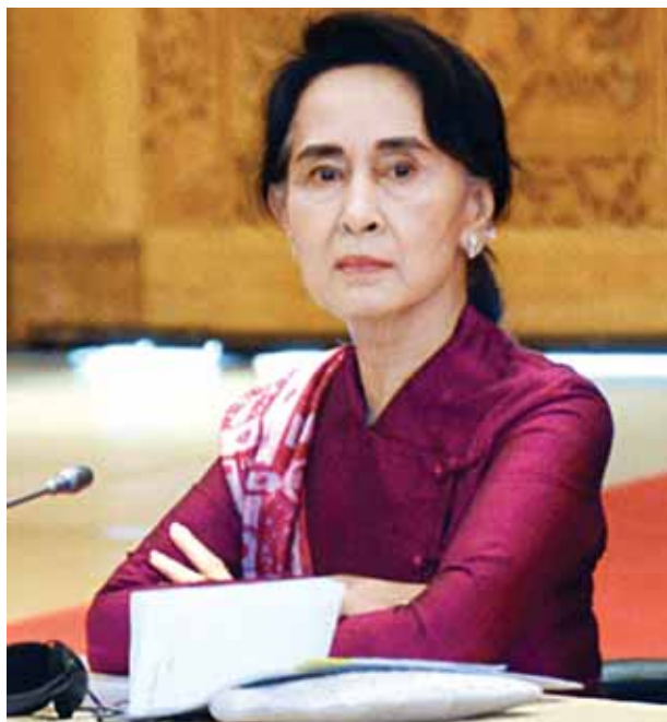
အမျိုးသားဒီမိုကရေစီအဖွဲ့ချုပ်ဥက္ကဋ္ဌ ဒေါ်အောင်ဆန်းစုကြည်။