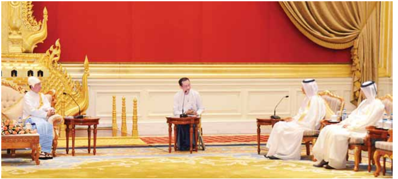
နိုင်ငံတော်သမ္မတ ဦးသိန်းစိန် သံအမတ်ကြီး မစ္စတာ ဟာဆန်တင် မိုဟာမက် ရာဖီအယ်လ်အီမာဒီအား တွေ့ဆုံစဉ်။