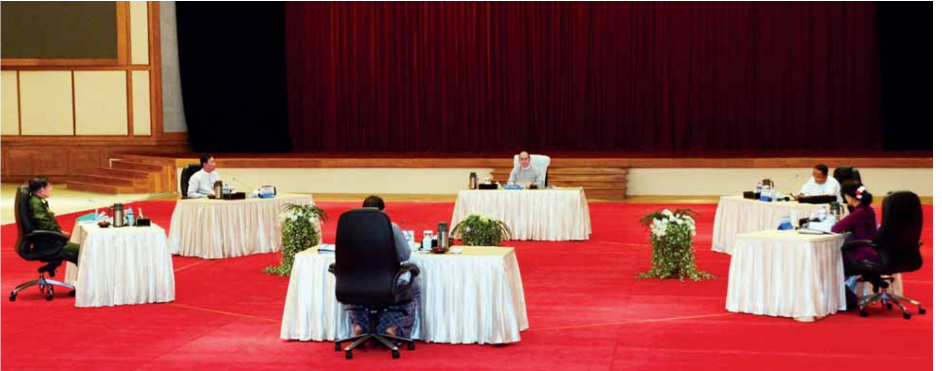
နိုင်ငံတော်သမ္မတ ဦးသိန်းစိန်နှင့် လွှတ်တော်ဥက္ကဋ္ဌများ၊ တပ်မတော်ကာကွယ်ရေးဦးစီးချုပ်၊ အမျိုးသားဒီမိုကရေစီအဖွဲ့ချုပ်ဥက္ကဋ္ဌနှင့် အမျိုးသားလွှတ်တော်ကိုယ်စားလှယ်တို့ နေပြည်တော်ရှိ နိုင်ငံတော်သမ္မတအိမ်တော် ငွေရွှေဝါခန်းမ၌ တွေ့ဆုံဆွေးနွေးစဉ်။ (သတင်း စာမျက်နှာ - ၇)

ဒီမိုကရေစီနိုင်ငံသစ်ကို အစပျိုးထူထောင်ရာတွင် ဒီမိုကရေစီအတွေ့အကြုံ၊ ဒီမိုကရေစီအလေ့အကျင့်များ နည်းပါးသေးသည့် အတွက် နိုင်ငံရေးလုပ်ငန်းစဉ်တွင် နိုင်ငံသားအားလုံးပါဝင်ပြီး အတွေ့အကြုံ၊ သဘောထားအမြင်များဖြင့် ပေါင်းစပ်ပါဝင်ဆောင်ရွက်