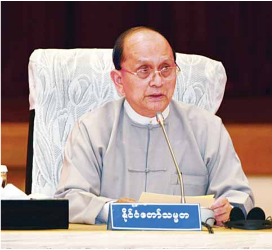
နိုင်ငံတော်သမ္မတ ဦးသိန်းစိန်။