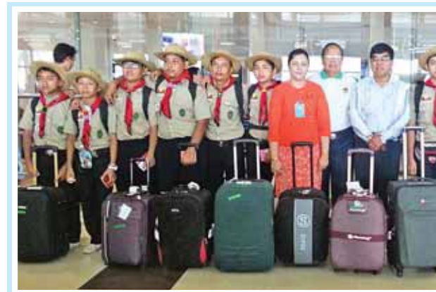
ဧပြီ ၁၀ ရက်က ထိုင်းနိုင်ငံ ဘုရင့်သမီးတော် မဟာချက်ကရီသီရိခုံ၏ နှစ်(၆၀)ပြည့် ဖွေးနေ့အထိမ်းအမှတ်အဖြစ် ဂုဏ်ပြုကျင်းပသည့် အကြိမ်(၂၀)မြောက် ကင်းထောက်များ တွေ့ဆုံပွဲ(ဂျန်ဘူရီ)သို့ တက်ရောက်ခဲ့သည့် မြန်မာနိုင်ငံ ကင်းထောက်အဖွဲ့မှ ကင်းထောက်များ ရန်ကုန်အပြည်ပြည်ဆိုင်ရာလေဆိပ်သို့ ပြန်လည်ရောက်ရှိရာ မြန်မာနိုင်ငံ ကင်းထောက်အဖွဲ့(ယာယီ)မှ ကော်မတီဝင်များ၊ ပညာရေးဌာနမှ တာဝန်ရှိသူများ ကြိုဆိုနှုတ်ဆက်ကြစဉ်။ (သတင်းစဉ်)

နေပြည်တော် ဧပြီ ၁၀ ယီမင်နိုင်ငံတွင် ပြည်တွင်းပဋိပက္ခဖြစ်ပွားမှုကြောင့် အန္တိယနိုင်ငံသား အလုပ်သမားများနှင့် မြန်မာနိုင်ငံသားအလုပ်သမားနှစ်ဦးတို့ကို ဂျီဟာဒီနိုင်ငံမှ တစ်ဆင့် INS Mumbai သင်္ဘောဖြင့် ပြန်လည်ခေါ်ဆောင်ခဲ့ရာ လာမည့် ငါးရက်ခန့်တွင် အိန္ဒိယနိုင်ငံ မွမ်ဘိုင်းမြို့သို့ ရောက်ရှိမည်ဖြစ်ကြောင်း၊ မြန်မာနိုင်ငံသား အလုပ်သမားနှစ်ဦးအား မြန်မာနိုင်ငံသို့ပြန်လည်ပို့ဆောင်နိုင်ရေးအတွက် နယူးဒေလီရှိ မြန်မာသံရုံးနှင့် ရန်ကုန်မြို့ရှိ အိန္ဒိယသံရုံးတို့ ညှိနှိုင်းစီစဉ်ဆောင်ရွက်လျက်ရှိကြောင်း နိုင်ငံခြားရေးဝန်ကြီးဌာနမှ သတင်းရရှိသည်။ (သတင်းစဉ်)