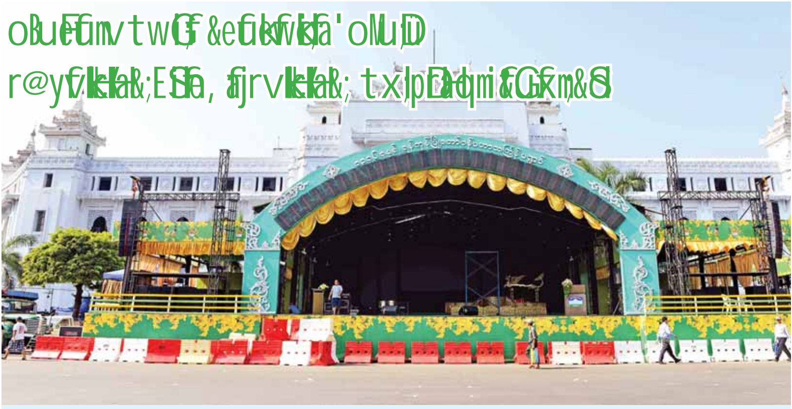
ယခုနှစ် ရန်ကုန်မြို့တော်ဝန်ကြီးဌာန ပြင်ဆင်တည်ဆောက်ထားရှိမှုကို တွေ့ရစဉ်။

ဝေလအသင်း & ကမ္ဘာ့အသင်း ဝေလအသင်း r@y/v/k/k&E/S&၊ t/r/v/k/k&၊ t/x/p/d/a/m/i & G/f/m&B