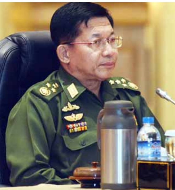
တပ်မတော်ကာကွယ်ရေးဦးစီးချုပ် ဗိုလ်ချုပ်မှူးကြီးမင်းအောင်လှိုင်။