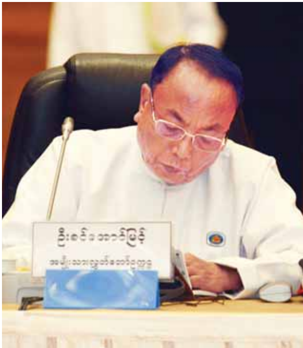
အမျိုးသားလွှတ်တော်ဥက္ကဋ္ဌ ဦးခင်အောင်မြင့်။