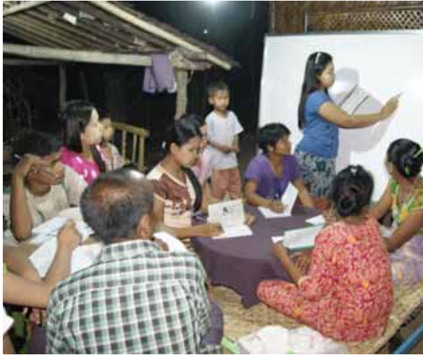
တတ်တော့ လူဖြစ်ရဲ့တာပေါ့။ မြင်းမူမြို့နယ်တွင် ၂၀၁၅ခုနှစ် ဒါကြောင့် စာလာသင်ယူတာပါ။ ကျွန်မတို့ လက်လုပ်လက်စားတွေ နေ့ခင်းမှာ မအားလို့ ဆရာမလေးတွေက ညပိုင်းမှာ သင်ပေးတော့ ကျေးဇူးပိုတင်ရတာပေါ့” ဟု ပြောသည်။

အရွယ်တွေ ဆိုပေမယ့် စာတတ်ချင်တဲ့ စိတ်တွေနဲ့ လာသင်ကြတာဆိုတော့ သင်ပေးရတာ အဆင်ပြေပါတယ်။ နေ့ခင်းဘက်မှာ သူတို့ အလုပ်မအားကြလို့ ညပိုင်းမှာလည်း သင်ကြားပေးနေပါတယ်” ဟု ပြောသည်။