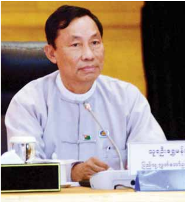
ပြည်သူ့လွှတ်တော်ဥက္ကဋ္ဌ သူရဦးရွှေမန်း။