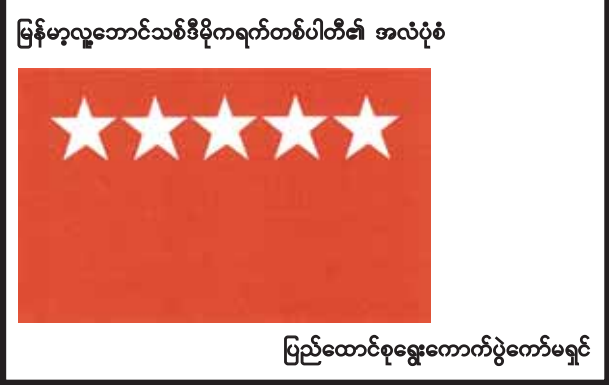
ပြည်ထောင်စုရွေးကောက်ပွဲကော်မရှင်

၁။ နိုင်ငံရေးပါတီများမှတ်ပုံတင်ခြင်းဥပဒေ ပုဒ်မ ၉ အရ နိုင်ငံရေးပါတီအဖြစ် မှတ်ပုံတင်ခွင့်ပြုထားပြီးဖြစ်သည့် ရန်ကုန်တိုင်းဒေသကြီး၊ သန်လျင်မြို့နယ်၊ ထန်းပင်ကုန်းရပ်ကွက် ထန်းပင်ကုန်းလမ်းမကြီး၊ အမှတ် (၆)တွင် ပါတီရုံးချုပ်တည်ရှိသော မြန်မာ့လူ့ဘောင်သစ်ဒီမိုကရက်တစ်ပါတီသည် ယင်းပါတီ၏အလံကို ဖော်ပြပါအတိုင်း ပြောင်းလဲအသုံးပြုမည်ဖြစ်ကြောင်း တင်ပြလာပါသည်။ ၂။ ယင်းအဖွဲ့အစည်းက အသုံးပြုမည့်ပါတီ၏အလံကို ကန့်ကွက်လိုက် ယခုကြေညာသည့်နေ့မှစ၍ (၇)ရက်အတွင်း ခိုင်လုံသော အထောက်အထားများဖြင့် ပြည်ထောင်စုရွေးကောက်ပွဲကော်မရှင်သို့ လာရောက်ကန့်ကွက်နိုင်ပါကြောင်း နိုင်ငံရေးပါတီများမှတ်ပုံတင်ခြင်း နည်းဥပဒေ ၁၄(ဃ)အရ အများသိစေရန် ကြေညာအပ်ပါသည်။