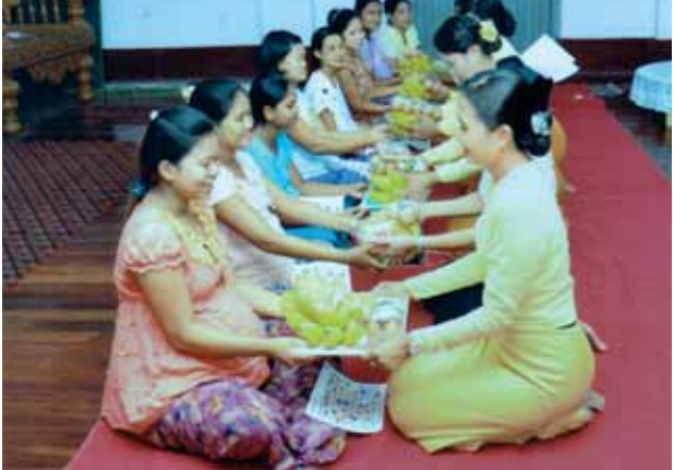
ဆိုင်ရာများနှင့်အာဟာရအုပ်စု (၃)စု အကြောင်း ရှင်းလင်းဟောပြောသည်။