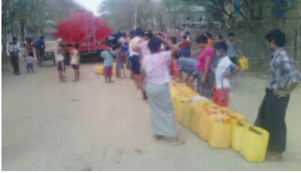
သောက်သုံးရေ ပေးဝေခြင်းလုပ်ငန်း အား ဖိသတ်တပ်ဖွဲ့ရေသယ်ယာဉ်များ ဖြင့် အခမဲ့ဆောင်ရွက်ပေးမည်ဖြစ် သဖြင့် လိုအပ်ပါက ဖုန်းနံပါတ် ၀၆၃-၂၂၃၁၊ ၀၆၃-၂၅၀၄၇ ၀၉-၇၉၉၂၂ အား ဖိသတ်တပ်ဖွဲ့ရေသယ်ယာဉ်များ ဖြင့် အခမဲ့ဆောင်ရွက်ပေးမည်ဖြစ် ကောင်းခံနိုင်ကြောင်း သိရသည်။

ရေစကြိုမြို့နယ် ဝေးပင်သာရွာ၊ မြိုင် မြို့နယ် ပုတွင်းကျေးရွာ၊ ပေါက်မြို့နယ် သပြေရွာ၊ ဆိပ်ဖြူမြို့နယ် တဲကြီးရွာမှ ပြည်သူများသို့ စုစုပေါင်း ရေဂါလန် ၁၂၀၀၀ ခန့်ကို ဖြန့်ဝေလှူ ဒါန်းခဲ့ကြောင်း သိရသည်။