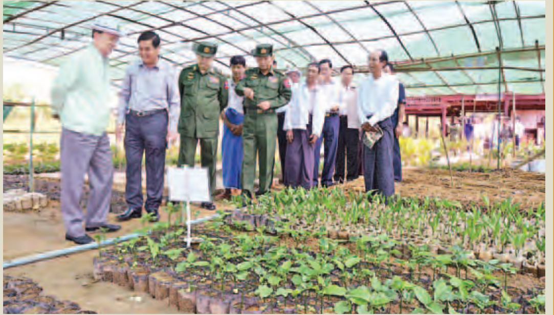
နိုင်ငံတော်သမ္မတ ဦးသိန်းစိန်နှင့်အဖွဲ့ဝင်များ ဟုမ္မလင်းမြို့ရှိ ဦးသိန်းအောင်မြင့် နှစ်ရှည်သီးနှံဖျိုးပင်များ ဖျိုးထောင်ထားရှိမှုအား ကြည့်ရှုစဉ်။ (ပြန်/ဆက်)