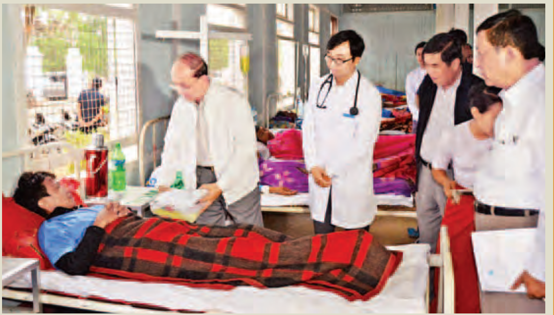
နိုင်ငံတော်သမ္မတ ဦးသိန်းစိန် ခန္တီးမြို့ပြည်သူ့ဆေးရုံ၌ တက်ရောက်ကုသနေသော ဆေးရုံတက်လူနာများအား ကြည့်ရှု အားပေးစဉ်။ (ပြန်/ဆက်)