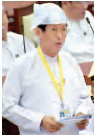
ဒုတိယဝန်ကြီး ဦးသန်းထွန်းအောင်။

နေပြည်တော် ဧပြီ ၉ ပြည်သူ့လွှတ်တော် (၁၂)ကြိမ်မြောက် ပုံမှန်အစည်းအဝေး (၄၂)ရက်မြောက်နေ့ကို ယနေ့နံနက် ၁၀ နာရီတွင်ကျင်းပပြီး သတ္တုတွင်းကဏ္ဍ၊ လျှပ်စစ်ကဏ္ဍနှင့် လယ်ယာကဏ္ဍဆိုင်ရာမေးခွန်းများ မေးမြန်းဖြေကြားခဲ့ကြသည်။