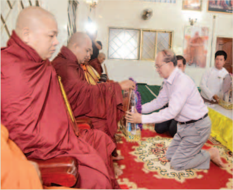
နိုင်ငံတော်သမ္မတ ဦးသိန်းစိန် သီတဂူစကျဆေးရုံတော်သို့ရောက်ရှိပြီး နိုင်ငံတော် သံဃာ့ဝန်ဆောင်ဆရာတော်ကြီးများအား လှူဖွယ်ပစ္စည်းဆက်ကပ်လှူဒါန်းစဉ်။ (ပြန်/ဆက်)