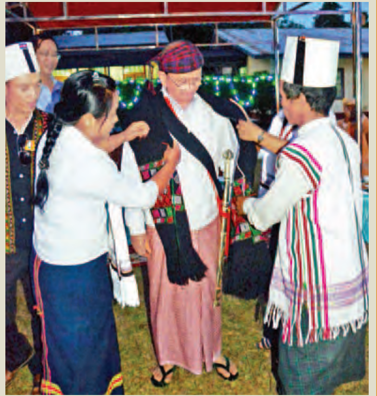
နိုင်ငံတော်သမ္မတ ဦးသိန်းစိန်အား တိုင်းရင်းသားရိုးရာယဉ်ကျေးမှုအဖွဲ့ဝင်များက ချင်းရိုးရာဝတ်စုံ ဂါရဝပြုဝတ်ဆင်ပေးစဉ်။ (ပြန်/ဆက်)