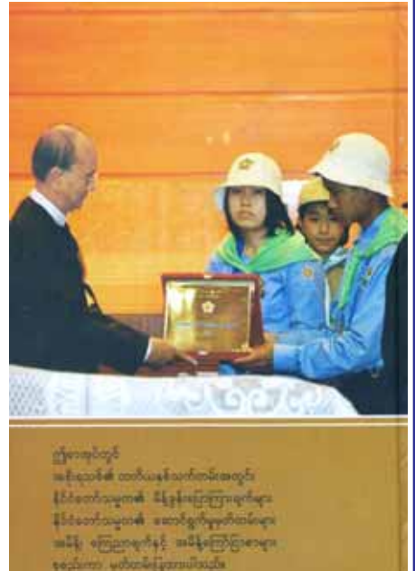
အစိုးရသစ်၏ မြန်မာ့ရွှေဦးနီဒါန်း နိုင်ငံတော်သမ္မတ၏ ဆောင်ရွက်မှုများ (တတိယနှစ်)

အင်ဒိုနီးရှားသမ္မတနိုင်ငံ သမ္မတနှင့် ဇနီးတို့အား ဂုဏ်ပြုကြိုဆိုခြင်း၊ အမေရိကန်ပြည်ထောင်စု၏ ပထမဆုံး သမ္မတ ဂျော့ရှီပါရှင်တန်၏ အိမ်တော်ကိုသွားရောက်လေ့လာခြင်း၊ ဂျပန်ဝန်ကြီးချုပ် မစ္စတာ ရှင်ဒိုအာဘေးနှင့် ဇနီးတို့အား ဂုဏ်ပြုကြိုဆိုခြင်း၊ ကမ္ဘာ့ထိပ်တန်းကုမ္ပဏီများမှ ခေါင်းဆောင်များအား တွေ့ဆုံခြင်း၊ နယူးဇီလန်နိုင်ငံ နိုင်ငံခြားရေးဝန်ကြီးနှင့်တွေ့ဆုံခြင်း၊ မြီတီနှင့် ပြင်သစ်နိုင်ငံတို့သို့ တရားဝင်ခရီးထွက်ခွာခြင်း၊ မြန်မာနိုင်ငံ စာနယ်ဇင်းကောင်စီ (ယာယီ) ဥက္ကဋ္ဌနှင့်အဖွဲ့အား လက်ခံတွေ့ဆုံခြင်း၊ ဩစတြေးလျဓနသဟာယနိုင်ငံ ဘုရင်ခံချုပ်နှင့် ခင်ပွန်းတို့အား ဂုဏ်ပြုကြိုဆိုခြင်း၊ မွန်ဂိုလီးယားနိုင်ငံသမ္မတအား ဂုဏ်ပြုကြိုဆိုခြင်း၊ ဖိလစ်ပိုင်နိုင်ငံ သမ္မတက ဂုဏ်ပြုကြိုဆိုခြင်း၊ ပြည်ထောင်စုသမ္မတ ဂျာမနီနိုင်ငံသမ္မတနှင့် ဇနီးတို့အား ဂုဏ်ပြုကြိုဆိုခြင်း၊ ဘင်္ဂလားဒေ့ရှ်နိုင်ငံ ဝန်ကြီးချုပ်အား လက်ခံတွေ့ဆုံခြင်း၊ အိန္ဒိယနိုင်ငံဝန်ကြီးချုပ်အား လက်ခံတွေ့ဆုံခြင်း၊ တတိယအကြိမ် ဘင်းမိစတက် ထိပ်သီးအစည်းအဝေး၌ တက်ရောက်ဆွေးနွေးခြင်း၊ သီရိလင်္ကာနိုင်ငံသမ္မတအား လက်ခံတွေ့ဆုံခြင်း၊ နီပေါနိုင်ငံဝန်ကြီးချုပ်အား လက်ခံတွေ့ဆုံခြင်း၊ ဘူတန်နိုင်ငံဝန်ကြီးချုပ်အား လက်ခံတွေ့ဆုံခြင်း၊ ပြည်ထောင်စုလွှတ်တော်၌ မိန့်ခွန်းပြောကြားခြင်း၊ နိုင်ငံရေးပါတီများမှ ခေါင်းဆောင်များ၊ ကိုယ်စားလှယ်များနှင့် တွေ့ဆုံဆွေးနွေးခြင်း စသည်တို့အပါအဝင် ဆောင်ရွက်ချက် ၂၉၄ ပုဒ် ပါဝင်ပြီး အခန်း (၃) တွင် အမိန့်၊ ကြေညာချက်နှင့် အမိန့်ကြော်ငြာစာများပါရှိသည်။ အဆိုပါစာအုပ်ကို ဦးကျော်ကျော်ဝေ ရွက်စိမ်းစာပေက တန်ဖိုး ၁၀၀၀၀ ကျပ်ဖြင့် ထုတ်ဝေဖြန့်ချိလိုက်ကြောင်း သိရှိရသည်။ (ကြေးမုံ)