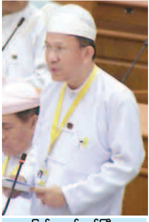
ပြည်ထောင်စုဝန်ကြီး ဒေါက်တာကလေး။

အဆိုနှင့် စပ်လျဉ်း၍ အမျိုးသားစီမံကိန်းနှင့် စီးပွားရေးဖွံ့ဖြိုးတိုးတက်မှုဝန်ကြီးဌာန ပြည်ထောင်စုဝန်ကြီး ဒေါက်တာကလေးက အမြဲတမ်းအတွင်းဝန်ခန့်ထားရေးကိစ္စသည် ပြည်သူ့ရေးရာစီမံခန့်ခွဲမှု ပြုပြင်ပြောင်းလဲမှုတွင် ကောင်းမွန်သောအစိုးရ သန့်ရှင်းသောအစိုးရ ပွင့်လင်းမြင်သာသော အစိုးရတာဝန်ခံသောအစိုးရဆိုသည့် အချက်လေးချက်ပြည့်စုံသည့် အစိုးရတစ်ခု