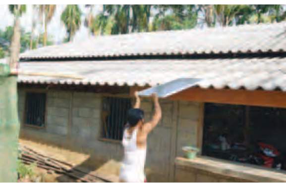
ခမောက်ကြီး(မြန်/ဆက်)

ခမောက်ကြီး ဧဇ တနင်္သာရီတိုင်းဒေသကြီး ကော့သောင်းခရိုင် ခမောက်ကြီးမြို့ အမှတ်(၃) ရပ်ကွက်အိမ်ခြေ ၁၀၀ အား ဧပြီ ၅ ရက်က ကျေးလက်ဒေသဖွံ့ဖြိုးတိုးတက်ရေးဦးစီးဌာနနှင့် SKY Dragon ကုမ္ပဏီမှ ဆိုလာလျှပ်စစ်ဓာတ်အားရရှိရေး လိုက်လံတပ်ဆင်ဆောင်ရွက်ပေးခဲ့ကြောင်း သိရသည်။ အဆိုပါရပ်ကွက်ရှိ အိမ်ခြေ ၁၀၀ အား အိမ်တစ်အိမ်လျှင် (၂၀x၄၀) လက်မ ၈၀ ဝပ် ဆိုလာပြားတစ်ချပ်၊ ၁၂ ဗို့ဟထရီတစ်လုံး၊ ချာဂျင်ကွန်ထရိုလာ (ထိန်းချုပ်ကိရိယာ) တစ်လုံး၊ ၃၀၀ ဝပ် အင်ဗိုက်တာတစ်လုံး၊ LED မီးသီးနှင့် ဆက်စပ်ပစ္စည်းများ တပ်ဆင်ပေးခဲ့ကြောင်း သိရသည်။ အဆိုပါလုပ်ငန်းအား ၂၀၁၄-၂၀၁၅ ဘဏ္ဍာနှစ် ကျေးလက်ဒေသဖွံ့ဖြိုးရေး ရန်ပုံငွေဖြင့် SKY Dragon ကုမ္ပဏီမှ တာဝန်ယူတပ်ဆင်ပေးခြင်းဖြစ်သည်။