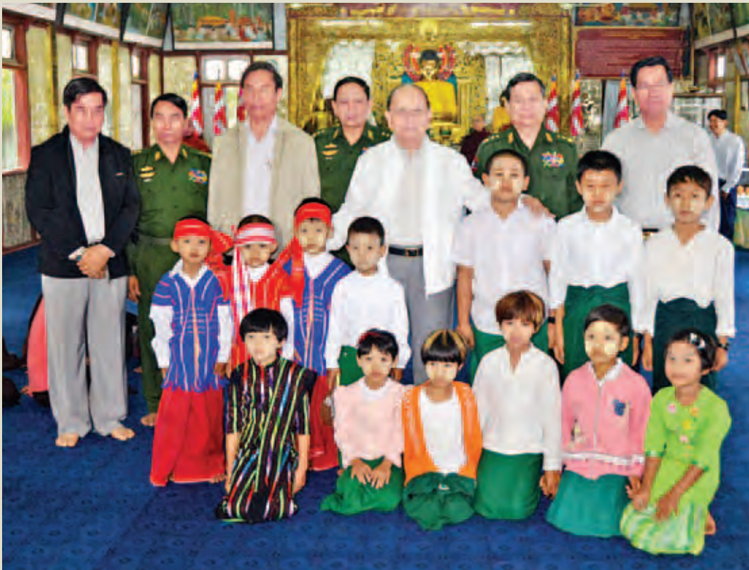
နိုင်ငံတော်သမ္မတ ဦးသိန်းစိန်နှင့်အဖွဲ့ဝင်များ ခန္တီးမြို့နယ် ထေရဝါဒဗုဒ္ဓသာသနာပြုဗဟိုကျောင်းတိုက်တွင် ဒေသခံကလေးများ နှင့်အတူ မှတ်တမ်းတင်ဓာတ်ပုံရိုက်စဉ်။ (ပြန်/ဆက်)