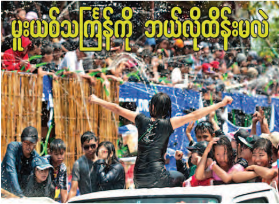
၂၀၁၄ ခုနှစ် ရန်ကုန်မဟာသကြွန်မဏ္ဍပ်တစ်ခုကို တွေ့ရစဉ်။ [ဓာတ်ပုံ-စိုင်းဇော်(ရောဂါဝင်)]

ရောဂါဝင်ဂျာနယ်အတွဲ(၂) အမှတ်(၁၅)တွင် ဖော်ပြခဲ့သော သစ်နေမိုး၏ “မူးယစ်သကြွန်ကို ဘယ်လိုထိန်းမလဲ” ဆောင်းပါးကို ဂျာနယ်နှင့်စာရေးသူ၏ ခွင့်ပြုချက်ဖြင့် ဖော်ပြခြင်းဖြစ်ပါသည်။