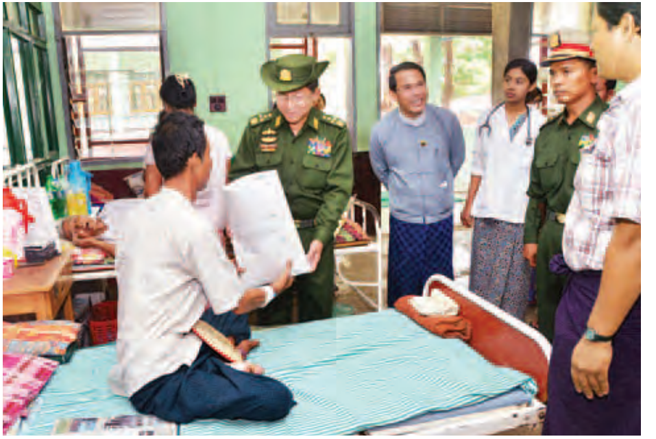
တပ်မတော်ကာကွယ်ရေးဦးစီးချုပ် ဗိုလ်ချုပ်မှူးကြီး မင်းအောင်လှိုင် ဆေးရုံတက်လူနာအား လက်ဆောင် ပစ္စည်းများ ပေးအပ်စဉ်။ (မြဝတီ)

ယနေ့ဖွင့်လှစ်ခဲ့သော သူဌေး ချောင်းတံတားအား တပ်မတော် ကာကွယ်ရေးဦးစီးချုပ် မိသားစု၊ တပ်မတော်(ကြည်း၊ ရေလေ)မိသားစု