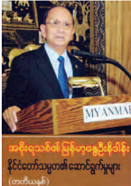
အစိုးရသစ်၏ မြန်မာ့ရွှေဦးနီဒါန်း နိုင်ငံတော်သမ္မတ၏ ဆောင်ရွက်မှုများ (တတိယနှစ်)

ဤစာအုပ်တွင် အစိုးရသစ်၏ တတိယနှစ်သက်တမ်းအတွင်း နိုင်ငံတော်သမ္မတ၏ မိန့်ခွန်းပြောကြားချက်များ၊ နိုင်ငံတော်သမ္မတ၏ ဆောင်ရွက်မှုမှတ်တမ်းများ၊ အမိန့်၊ ကြေညာချက်နှင့် အမိန့်ကြော်ငြာစာများကို မှတ်တမ်းပြုထားသည်။ အခန်း (၁) နိုင်ငံတော်သမ္မတ၏ မိန့်ခွန်းများတွင် မိဘပြည်သူများသို့ ရေဒီယိုအစဉ်များမှတစ်ဆင့် လစဉ်ပြောကြားသည့် မိန့်ခွန်းများ၊ တရုတ်နိုင်ငံတွင် ကျင်းပသည့် ဘိုအော့ဖိုရမ်အစည်းအဝေးဖွင့်ပွဲတွင် ပြောကြားသည့် မိန့်ခွန်း၊ ဘက်စုံပညာ ထူးချွန်လူငယ်များနှင့် ကင်းထောက်လူငယ်များအားပြောကြားသည့် ဂုဏ်ပြုအမှာစကား၊ မဟာသင်္ကြန်နှစ်သစ်ကူးအခါသမယမိန့်ခွန်း၊ ငြိမ်းချမ်းရေးဆုချီးမြှင့်ပွဲတွင် ပြောကြားသည့် မိန့်ခွန်းများ အပါအဝင် စုစုပေါင်းမိန့်ခွန်း ၆၈ ပုဒ်ပါဝင်သည်။ အခန်း (၂) နိုင်ငံတော်သမ္မတ၏ ဆောင်ရွက်မှုမှတ်တမ်းတွင် စင်ကာပူသမ္မတ ဒေါက်တာ တိုနီတန်ကင်ယမ်းနှင့် ဇနီးတို့အား ဂုဏ်ပြုကြိုဆိုခြင်း၊ အမေရိကန်သမ္မတဟောင်း ဂျင်မီကာတာနှင့် ဇနီးနှင့်အဖွဲ့အား လက်ခံတွေ့ဆုံခြင်း၊