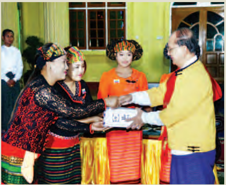
နိုင်ငံတော်သမ္မတ ဦးသိန်းစိန် တိုင်းရင်းသားရိုးရာယဉ်ကျေးမှုအဖွဲ့ဝင်များအား ဂုဏ်ပြုဆုငွေ ပေးအပ်စဉ်။ (ပြန်/ဆက်)