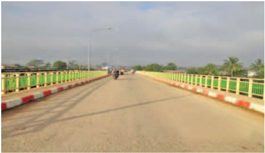
ပင်လောင်းမြို့နယ်အတွင်း တံတားအထူးအဖွဲ့(၃)မှ တာဝန်ယူဆောင်ရွက်သည့် အောင်ပန်း-ပင်လောင်း-မိုးမြ-လွိုင်ကော် လမ်းပေါ်ရှိ ဘီလူးချောင်းတံတား(တီလွစ်) တည်ဆောက်နေမှုအခြေအနေ

အောင်ပန်း-ပင်လောင်း-မိုးမြ-လွိုင်ကော် လမ်းပေါ်ရှိ ဘီလူးချောင်းတံတား(မိုးမြ) တည်ဆောက်ပြီးစီးမှုအခြေအနေ