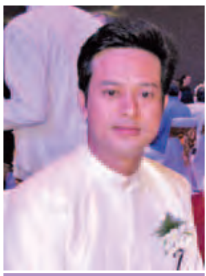
ရုပ်ရှင်သရုပ်ဆောင် ပြေတီဦး။