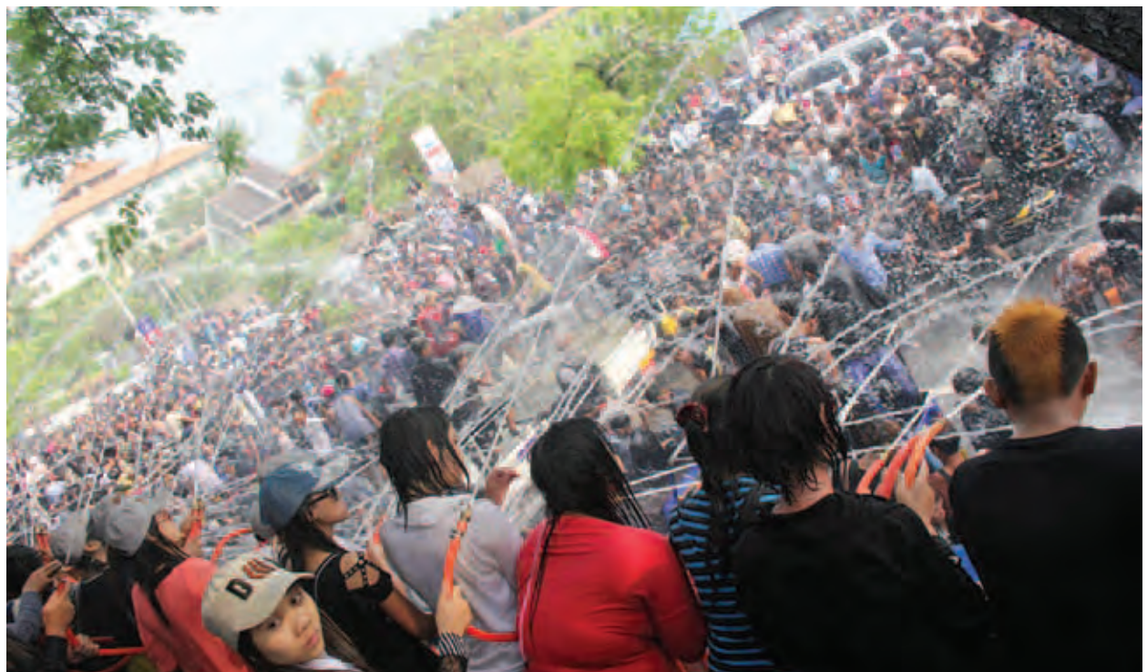
၂၀၁၄ ခုနှစ် သင်္ကြန်ကာလအတွင်း မန္တလေးမြို့ ကျင်းပတတ်လည်တွင် ရေကစားနေကြသည်ကို တွေ့ရစဉ်။

ကျေးတောင်ဘက် Alpine မဏ္ဍပ်တွင်လည်း The Trees Band နှင့်အတူ ယခင်နှစ်များအတိုင်း နာမည်ကြီးအဆိုတော်များ လာရောက်ဖျော်ဖြေ တင်ဆက်ကြမည်ဖြစ်သည်။