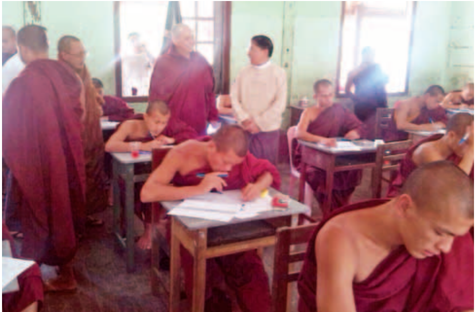
၂၃၈ ခုတွင် ပထမကြီးတန်းဖြေဆို သံယုဂ် သီလရှင် ၁၁၄၉၁ ပါး၊ ပထမ လတ်တန်းဖြေဆို သံယုဂ် သီလရှင် ၁၁၄၁၁ ပါး၊ ပထမငယ်တန်းဖြေဆို သံယုဂ် သီလရှင် ၂၂၂၂၅ ပါး နေ့တွင် ပထမပြန်စာကြီးတန်းစာမေးပွဲများ ဖြေဆိုပြီးဆုံးမည်ဖြစ်ကြောင်း သိရသည်။ (သတင်းစဉ်)

ဟိုပုံးမြို့၊ တုံခမ်းကျောင်းတိုက်သို့ သွားရောက်၍ အစိုးရပါဠိ ပထမပြန်စာမေးပွဲ အငယ်တန်း နောက်ဆုံးနေ့ ဖြေဆိုမှုကို ကြည့်ရှုဖူးမြော်သည်။ ယင်းနောက် မြို့နယ်သံယုဂ်ဆရာတော် ဘဒ္ဒန္တအာလောက အမျိုးမျိုးသော ကြီးကြပ်ရေး ဆရာတော်များအား ဖူးမြော်၍ လှူဖွယ်ဝတ္ထုပစ္စည်းများ ဆက်ကပ်လှူဒါန်းပြီး သာသနာရေး ဆိုင်ရာများ လျှောက်ထားသည်။ ထို့နောက် တောင်ကြီးမြို့၊ မူလ မင်းကွန်းပရိယတ္တိစာသင်တိုက်သို့ သွားရောက်၍ ပြည်နယ်သံယုဂ်ဆရာတော် ဘဒ္ဒန္တပညာသီရိ၊ အကျိုးတော်ဆောင် ဆရာတော် ဘဒ္ဒန္တဥက္ကဋ္ဌအဖွဲ့ဝင် ဆရာတော်များအား ဖူးမြော်ပြီး လှူဖွယ်ဝတ္ထုပစ္စည်းများ ဆက်ကပ်လှူဒါန်း၍ သာသနာရေးဆိုင်ရာ များ လျှောက်ထားသည်။ တစ်နိုင်ငံလုံးအနေဖြင့် စာဖြေငှာန