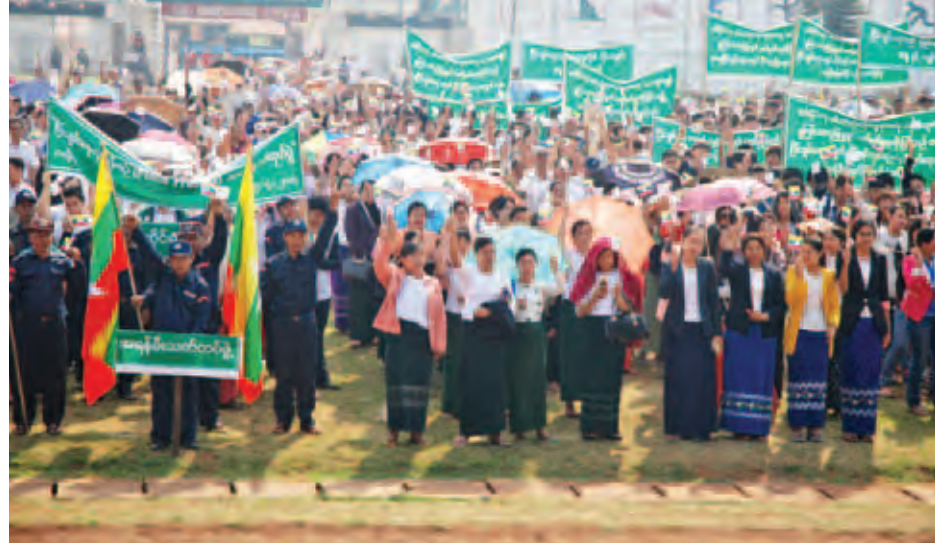
လားရှိုးမြို့၌ ပြည်ထောင်စုငြိမ်းချမ်းရေးဖော်ဆောင်မှု လူထုဆန္ဒထုတ်ဖော်ထောက်ခံပွဲ ကျင်းပစဉ်။

လားရှိုး ဧပြီ ၅ ရှမ်းပြည်နယ်(မြောက်ပိုင်း) လားရှိုး မြို့ ရပ်ကွက်(၁၂) ပြည်ထောင်စု အားကစားကွင်း၌ ၂၀၁၅ ခုနှစ် ဧပြီ ၅ ရက် နံနက် ၉ နာရီခွဲခန့်က လားရှိုး မြို့ပေါ်ရှိ ကျေးရွာ/ရပ်ကွက် ၁၂ ရပ်ကွက်အတွင်းရှိ မြို့သူမြို့သားများ၊ ရပ်မိ ရပ်ဖများ၊ ဌာနဆိုင်ရာဝန်ထမ်း များ၊ NGO အဖွဲ့အစည်းများက တစ်နိုင်ငံလုံးအပစ်အခတ်တိုက်ခိုက် မှု ရပ်စဲရေးသဘောတူစာချုပ်မူကြမ်း လက်မှတ် ရေးထိုးနိုင် မှု အပေါ် ထောက်ခံသည့် လူထုဆန္ဒထုတ်ဖော်မှု ကို ခွင့်ပြုချက်ရယူပြီး ပြုလုပ်ခဲ့သည်။ အခမ်းအနားတွင် မြို့မိမြို့ဖ ဦးကမြိုင်က “တစ်နိုင်ငံလုံး အပစ် အခတ်တိုက်ခိုက်မှုရပ်စဲရေး သဘော တူစာချုပ်မူကြမ်းကို နှစ်ဖက်သဘော တူညီနှိုင်း ပြုစုရေးဆွဲပြီးစီးကြောင်း အတည်ပြုတဲ့ အခမ်းအနားမှာ ငြိမ်းချမ်းရေးဟာ ပြည်သူတွေရဲ့