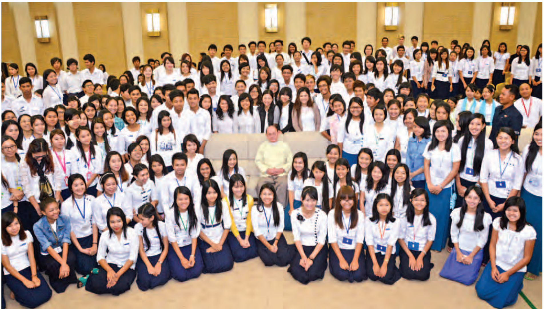
နိုင်ငံတော်သမ္မတ ဦးသိန်းစိန် နည်းပညာပိုင်းဆိုင်ရာဆွေးနွေးပွဲသို့ တက်ရောက်လာကြသည့် ဆရာ ဆရာမများ၊ ကျောင်းသား ကျောင်းသူများနှင့်အတူ မှတ်တမ်းတင်ဓာတ်ပုံရိုက်စဉ်။