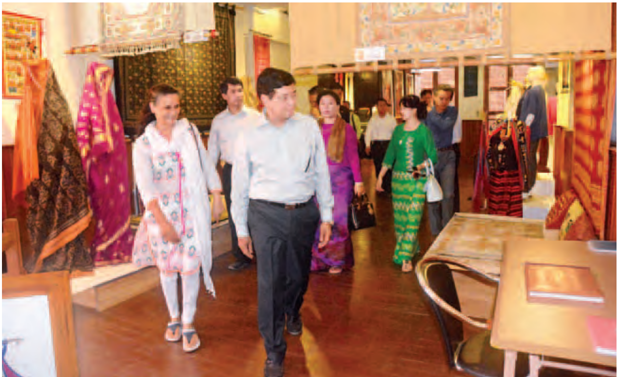
ဒုတိယသမ္မတ ဦးညွှန်ထွန်း၊ မဲခေါင်-ဂီရီရောအထည်အလိပ်ပြတိုက်အတွင်း ကြည့်ရှုလေ့လာစဉ်။

ညပိုင်းတွင် ဒုတိယသမ္မတနှင့် ဇနီးတို့သည် ဒုတိယဝန်ကြီးချုပ်နှင့် ဝန်ကြီးချုပ်ရုံးဝန်ကြီး၊ အန်ကောဝဘုရားကျောင်းနှင့် ဆီယမ်ရီဒေသ ဖွံ့ဖြိုး တိုးတက်ရေးနှင့် ယဉ်ကျေးမှုဆိုင်ရာ အာဏာပိုင်အဖွဲ့ဥက္ကဋ္ဌနှင့် ဇနီးတို့က