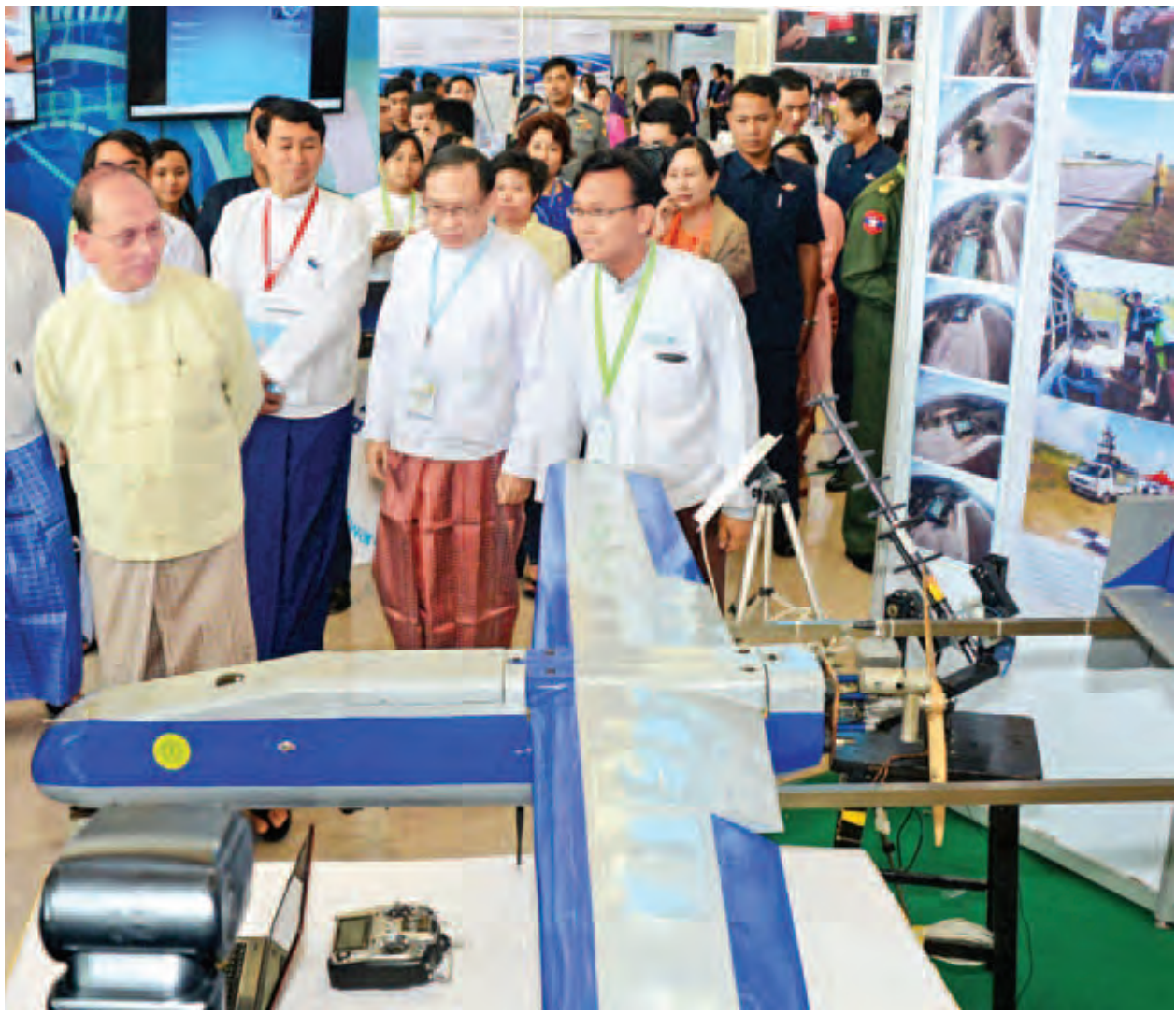
နိုင်ငံတော်သမ္မတ ဦးသိန်းစိန် မြန်မာနိုင်ငံလေကြောင်းနှင့် အာကာသပညာတက္ကသိုလ်မှ ပြသထားသည့် မောင်းသူမဲ့လေယာဉ် သုတေသနပြခန်း၌ ကြည့်ရှုအားပေးစဉ်။ (သတင်းစဉ်)

ဆွေးနွေးပွဲ၌ နိုင်ငံတော်သမ္မတက အဖွင့်အမှာစကား ပြောကြားရာတွင် ယနေ့ခေတ် နည်းပညာ၏ တိုးတက် မှုများသည် အံ့မခန်းနိုင်အောင် တိုးတက်မြင့်မားနေပြီဖြစ်ကြောင်း၊ တိုင်းပြည် ပွံ့ဖြိုးတိုးတက်စေရန် နည်းပညာပွံ့ဖြိုးတိုးတက်မှုအရေး ကြီးပြီး နိုင်ငံတော်၏ စီးပွားရေး၊ ပညာရေး၊ ကျန်းမာရေး၊ လူမှုရေး၊ ကာကွယ်ရေးနှင့် ကဏ္ဍပေါင်းစုံတွင်