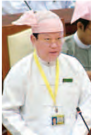
ဒုတိယဝန်ကြီး ဦးအောင်သိန်း။

သိရှိလိုပါက တင်ဒါအောင်မြင်သည့် ကုမ္ပဏီများထံ၌ လည်းကောင်း၊ သက်ဆိုင်ရာ ဌာနဆိုင်ရာရုံးများတွင်လည်းကောင်း၊ သက်ဆိုင်ရာခရိုင်/မြို့နယ် အထွေထွေအုပ်ချုပ်ရေးမှူးရုံးများတွင် ဆက်သွယ်တောင်းယူရရှိနိုင်ပါကြောင်းဖြင့် ဖြေကြားသည်။