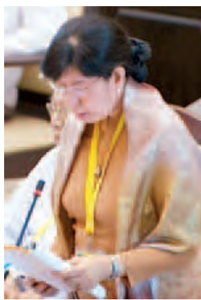
ဒုတိယဝန်ကြီး ဒေါက်တာ ဒေါ်သိန်းသိန်းဌေး။

တပ်မတော်သား လွှတ်တော်ကိုယ်စားလှယ် ဗိုလ်မှူးအောင်ကျော်ဇော၏ မတူညီသော လုပ်ငန်းတာဝန် နှစ်ရပ်ကို တစ်ပြိုင်တည်းထမ်းဆောင်နေရသည့် ဆောက်လုပ်ရေးဝန်ကြီးဌာန ပြည်သူ့ဆောက်လုပ်ရေးလုပ်ငန်းအား သီးခြားလွတ်လပ်သောလုပ်ငန်းအဖွဲ့အစည်းနှစ်ခုအဖြစ် ပြောင်းလဲပြင်ဆင်ဖွဲ့စည်းဆောင်ရွက်သွားရန် အစီအစဉ်ရှိ/မရှိ မေးခွန်းနှင့် စပ်လျဉ်း၍ ၂၀၁၅ ခုနှစ် ဧပြီလ ၁ ရက်မှစ၍ ပြည်သူ့ဆောက်လုပ်ရေးလုပ်ငန်းကို လမ်းဦးစီးဌာန၊ တံတားဦးစီးဌာနနှင့် အဆောက်အအုံနှင့် ဆောက်လုပ်ရေးညွှန်ကြားမှုဦးစီးဌာနအဖြစ် ပြောင်းလဲဖွဲ့စည်းသွားမည်ဖြစ်ပါကြောင်း၊ ဆောက်လုပ်ရေးဝန်ကြီးဌာနအနေဖြင့် နိုင်ငံခြား ချေးငွေအကူအညီဖြစ်သည့် JICA၊ ADB ချေးငွေဖြင့် ဆောင်ရွက်သည့် တည်ဆောက်ရေးစီမံကိန်းလုပ်ငန်းများတွင် အရည်အသွေးစစ်ဆေးကြပ်မတ်ရန်အတွက် နိုင်ငံခြား Consultant Team များ ငှားရမ်းဆောင်ရွက်နေပါကြောင်းဖြင့် ပြန်လည်ဖြေကြားခဲ့သည်။