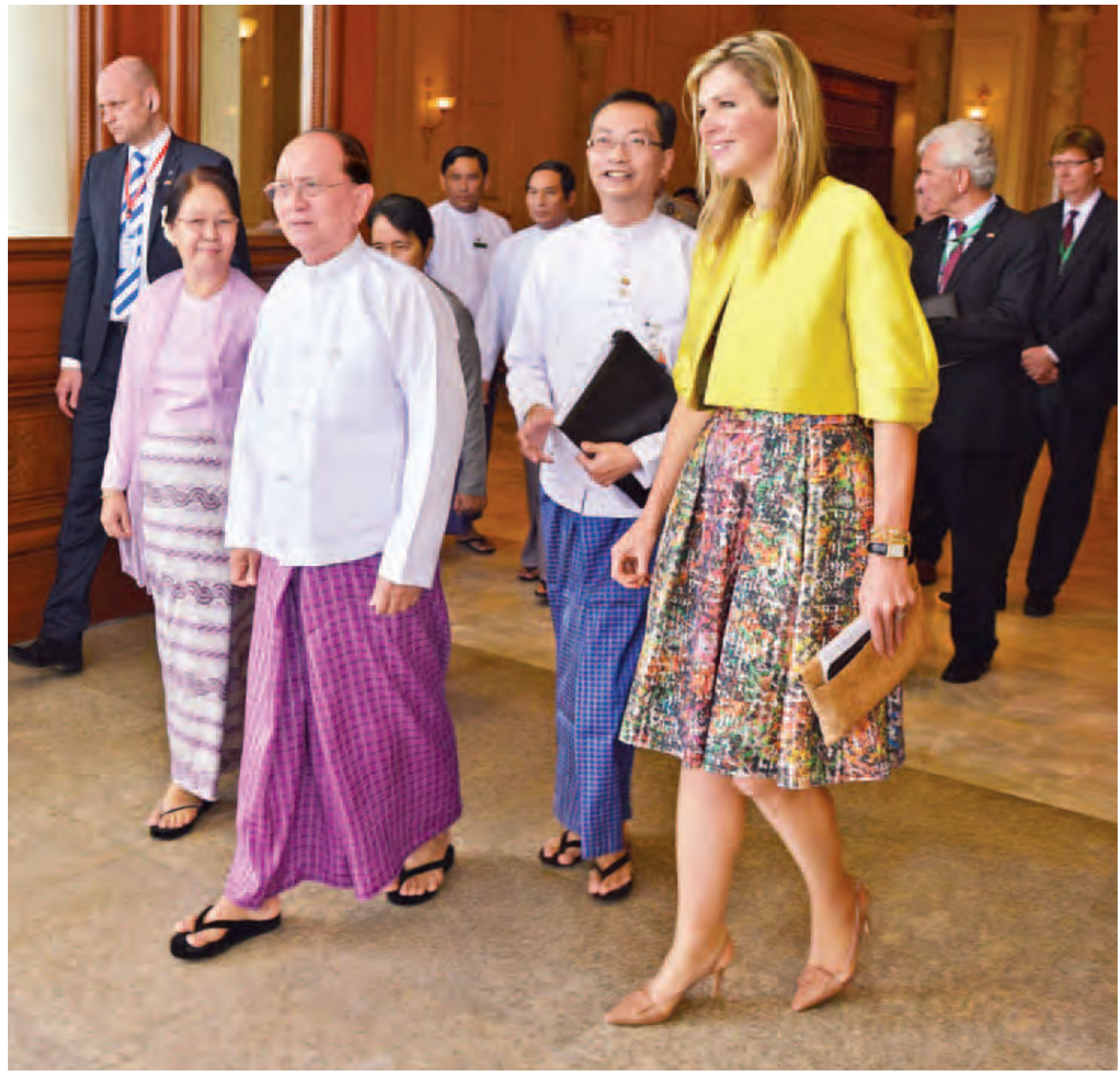
နိုင်ငံတော်သမ္မတ ဦးသိန်းစိန် နယ်သာလန်နိုင်ငံ ဘုရင့်မိဖုရား မက်ဆီမာ ဦးဆောင်သော ကိုယ်စားလှယ်အဖွဲ့အား နေပြည်တော်ရှိ နိုင်ငံတော်သမ္မတအိမ်တော် သံတမန်ဆောင်စဉ်ခန်းမ၌ လက်ခံတွေ့ဆုံစဉ်။