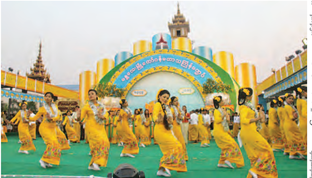
၂၀၁၄ ခုနှစ်က မန္တလေးမြို့ မြို့တော်ဝန်မဏ္ဍပ်တွင် ကျောင်းသူများ ကပြဖျော်ဖြေတင်ဆက်စဉ်။

မန္တလေး ဧပြီ ၁ ယခုနှစ် မန္တလေးမြို့ မြို့တော်ဝန်မဏ္ဍပ်တွင် သင်္ကြန်ပွဲတော်အတွက် အခြေခံပညာကျောင်းပေါင်း ၄၉ ကျောင်းမှ ကျောင်းသူအင်အား ၃၀၀၀ ပါဝင်ဆင်နွှဲမည်ဖြစ်ပြီး နိုင်ငံကျော် အဆိုတော်များလည်း ပါဝင်ဖျော်ဖြေ တင်ဆက်သွားမည်ဖြစ်ကြောင်း မန္တလေးမြို့တော်စည်ပင်သာယာရေးကော်မတီ သတင်းနှင့် ပြန်ကြားရေးဌာနမှ သိရသည်။ မန္တလေးမြို့တော်ဝန်မဏ္ဍပ်ဖွင့်ပွဲတွင် အခြေခံပညာကျောင်းများမှ ကျောင်းသူများ ပါဝင်ကပြဖျော်ဖြေမည့်အပြင် မန်းစည်ပင်ခေတ်ပေါ်တေးဂီတနှင့် မြန်မာ့ဆိုင်းဝိုင်း၊ ယဉ်ကျေးမှုဦးစီးဌာနမှ မင်္ဂလာစည်တော်အဖွဲ့များက နံနက်ပိုင်းနှင့် ညနေပိုင်းတို့တွင် ပါဝင်တင်ဆက်ကြမည်ဖြစ်ကြောင်း အဆိုပါဌာနမှ တာဝန်ရှိသူတစ်ဦးက ပြောသည်။ စာမျက်နှာ ၈ ကော်လံ ၁ သို့ ❖