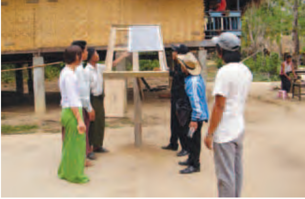
များအား တစ်မိသားစုချင်းထံပေး မီးလင်းသည်အထိ ဆက်စပ်ပစ္စည်း အပ်ပို့ပေးရန် SKY DRAGON ကုမ္ပဏီမှ တာဝန်ရှိသူများက အိမ်တိုင်ရာရောက် ဆိုလာများတပ်ဆင်ပေးခဲ့ကြသည်။

တနင်္သာရီမြို့နယ် ကျေးလက်ဒေသဖွံ့ဖြိုးရေးဦးစီးဌာန၏ ၂၀၁၄-၂၀၁၅ ဘဏ္ဍာရေးနှစ် အစီအစဉ်အရ တနင်္သာရီမြို့နယ် ဇေယျာရွာအုပ်စု ရေခမ်းချောင်းရွာ ဒေသခံကရင်တိုင်းရင်းသားအိမ်ထောင်စု ၃၅ စုအား ဆိုလာနှင့်ဆက်စပ်ပစ္စည်းများ ပေးအပ်ပို့ပေး ရေခမ်းချောင်းရွာ အ-မ-က ကျောင်းခန်းမ၌ မတ် ၂၈ ရက် မွန်းလွဲ ၂ နာရီက ပြုလုပ်ခဲ့ကြောင်း သိရသည်။