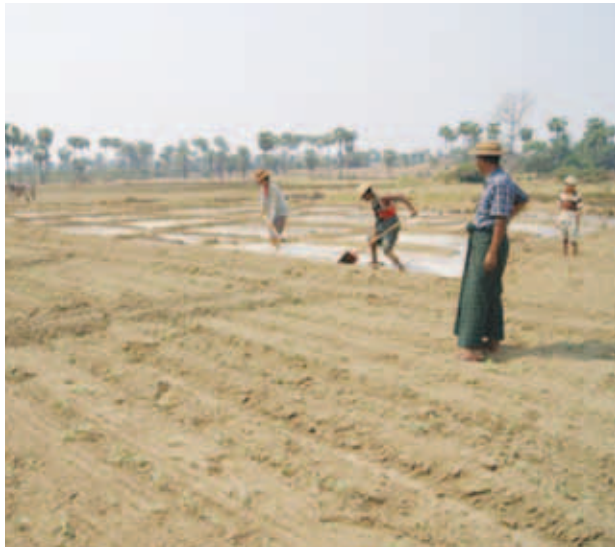
ကနိ မြို့ ၁

ကနိမြို့နယ် သရက်ပင်ကျေးရွာတွင် မိုးကြိုမြေပဲနှင့် ပဲတီစိမ်းများ စိုက်ပျိုးမှုစတင်