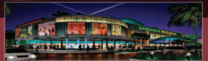
Corner of Gandamar Road & Waizayantar Road, Mayangone Township, Yangon. Tel : 01 657 834