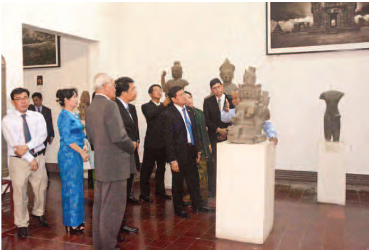
ဒုတိယသမ္မတ ဦးညွှန်ထွန်း ကမ္ဘောဒီးယားနိုင်ငံ အမျိုးသားပြတိုက်အတွင်း လှည့်လည်ကြည့်ရှုလေ့လာစဉ်။ (သတင်းစဉ်)