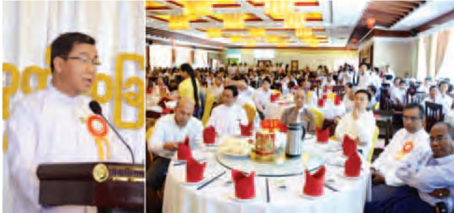
ပြန်ကြားရေးဝန်ကြီးဌာန ဒုတိယဝန်ကြီး ဦးပိုင်ထွေး စံတော်ချိန် နေ့စဉ်သတင်းစာထုတ်ဝေခြင်း နှစ်နှစ်ပြည့် အခမ်းအနားတွင် အမှာစကားပြောကြားစဉ်။

ရန်ကုန် ဧပြီ ၁ - “မိမိတို့ပြန်ကြားရေးဝန်ကြီးဌာန နှင့် စာနယ်ဇင်းသမားများသည် တစ်လှေတည်းစီး၊ တစ်ခရီးတည်း သွားနေကြသည့် ပုဂ္ဂိုလ်များဖြစ်ခြင်းကြောင့် ပြန်ကြားရေးဝန်ကြီးဌာန အနေဖြင့် မိမိယာလောကနှင့် စာနယ်ဇင်းသမားများ ဖွံ့ဖြိုးတိုးတက်ရေးအတွက် အထူးအလေးထား အားပေးကူညီလျက်ရှိကြောင်းဖြင့် ယနေ့နံနက်ပိုင်းတွင် ရန်ကုန်မြို့၊ ကန်တော်ကြီးရှိ Western Park Royal Restaurant ၌ ကျင်းပသည့် စံတော်ချိန်နေ့စဉ်သတင်းစာ ထုတ်ဝေခြင်း နှစ်နှစ်ပြည့် အခမ်းအနား၌ ပြန်ကြားရေးဝန်ကြီးဌာန ဒုတိယဝန်ကြီး ဦးပိုင်ထွေးက ပြောကြားသည်။