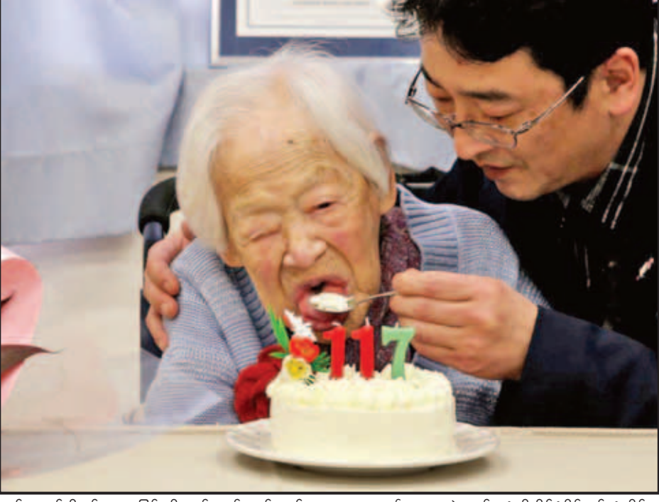
မက်ကရယ်င်းနှင့် စားခြင်းကိုလည်း နှစ်သက်သည်ဟု ဆိုသည်။ သူ၏ မွေးနေ့ပွဲ ကျင်းပပုံကို နိုင်ငံပိုင် ရုပ်သံလိုင်းမှ ထုတ်လွှင့်ပြသခဲ့သည်။ ဘီဘီစီ

ဆူချီသည် ၎င်း၏ အကြိုက်ဆုံး စားစရာဖြစ်ပြီး အထူးသဖြင့် ရှာလကာရည်နှင့် ပေါင်းထားသော ထမင်းကို