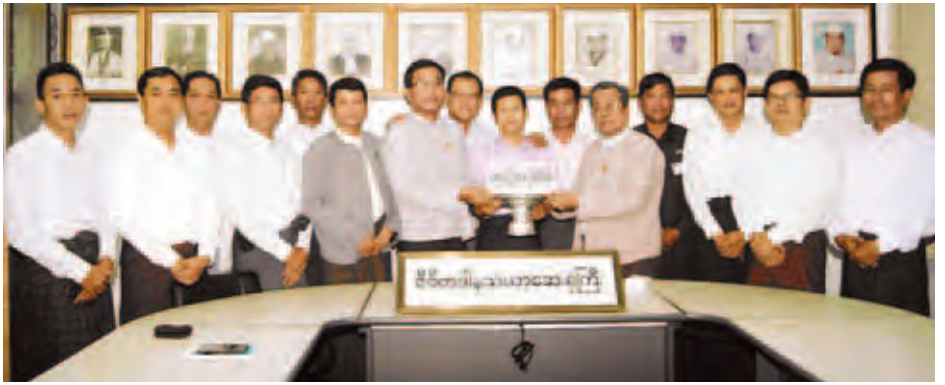
ဧပြီ ၁ ရက်တွင် ကျရောက်သော စစ်တက္ကသိုလ် ဗိုလ်လောင်းသင်တန်းအမှတ်စဉ်(၂၉) ၏ သင်တန်းဆင်း (၂၇)နှစ်ပြည့် အထိမ်းအမှတ်အဖြစ် ရန်ကုန်မြို့ ဇီဝိတဒါန သံဃာ့ဆေးရုံကြီး၌ ထာဝရဆွမ်းပဒေသာပင် မတည် အလှူငွေကျပ် ၁၀ သိန်းကို ဧပြီ ၁ ရက်က သွားရောက်လှူဒါန်းစဉ်။

ရန်ကုန် ဧပြီ ၁ မြန်မာနိုင်ငံစာကြည့်တိုက်အသင်း မှ ကြီးမှူး၍ စာကြည့်တိုက်လုပ်ငန်း ကျွမ်းကျင်မှု(အခြေခံအဆင့်)သင်တန်း အမှတ်စဉ်(၁/၂၀၁၅)ကို ရန်ကုန်မြို့ ရန်ကင်းမြို့နယ် အမှတ်(၈၅) သိရိ မင်္ဂလာလမ်းသွယ် ကမ္ဘာ့အေးဘုရား လမ်း ရန်ကင်းမြို့နယ်ရှိ အမျိုးသား စာကြည့်တိုက်၌ တစ်လတာဖွင့်လှစ် မည်ဟု စာပေဗိမာန်ပြည်သူ့စာကြည့် တိုက်မှ တာဝန်ရှိသူတစ်ဦး၏ ပြော ကြားချက်အရ သိရသည်။ အဆိုပါသင်တန်းကို ရပ်ရွာ ကျေးရွာများ၊ လူမှုအခြေပြုစာကြည့် တိုက်များတွင် စာကြည့်တိုက်ပညာ စိတ်ဝင်စားသူများအတွက် အရည် အချင်းမြင့်မားစွာဖြင့် တာဝန် ထမ်းဆောင်နိုင်စေရန်နှင့် ဝန်ကြီး ဌာနအသီးသီးရှိ စာကြည့်တိုက်များ၊ ပြည်သူ့စာကြည့်တိုက်များ၊ စာကြည့် တိုက်ပညာ ပြန့်ပွားရေးအတွက် ဖွင့်လှစ်ခြင်းဖြစ်ကြောင်း၊ သင်တန်း ကာလမှာ မေ ၄ ရက်မှ ၂၉ ရက်အထိ တစ်လသင်တန်းဖြစ်ကြောင်းနှင့် လျှောက်လွှာများကို အမျိုးသား စာကြည့်တိုက်နှင့် အမှတ် ၅၂၉-၅၃၀ ကုန်သည်လမ်း ကျောက်တံတား မြို့နယ်ရှိ စာပေဗိမာန် ပြည်သူ့စာ ကြည့်တိုက်ဌာနတို့တွင် ရယူ၍ ဧပြီ ၄ ရက် ညနေ ၃ နာရီ နောက်ဆုံးထား လျှောက်ထားရမည်ဖြစ်ကြောင်း၊ သင်တန်းသားဦးရေ ကန့်သတ်ထား ကြောင်း သိရသည်။ (ကြေးမုံ)