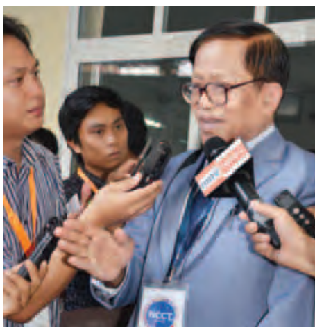
ဦးနိုင်ဟံသာ

ဒီနေ့ (၇)ကြိမ်မြောက်ဆွေးနွေးပွဲရဲ့ သတ္တမနေ့မှာ အရင်အပတ်က ဆွေးနွေးဖို့ကျန်ရှိတဲ့ အခန်းတစ်ခုနဲ့ အချက်အလက်ကို တစ်နေ့လုံးအကျေအလည် ဆွေးနွေးခဲ့ရပါတယ်။ လွန်ခဲ့တဲ့ ငါးမိနစ်မှာ အားလုံးကို သဘောတူနိုင်ခဲ့ပါပြီ။ နောက်ဆုံး NCA စာချုပ်မှတ်တမ်းကို ကျွန်တော်တို့ဘက်က ပြန်ကြည့်တဲ့အခါမှာ နှစ်ဖက်ခေါင်းဆောင်ကိုယ်စားလှယ်အဖွဲ့တွေ သဘောတူညီနိုင်ခဲ့တဲ့ NCA မှာ အခန်းပေါင်း (၇)ခုနဲ့ အပိုပေါင်း (၃၃) ပိုဒ်နဲ့ အပိုဒ်ငယ်ပေါင်း (၈၆) ခုပါပါတယ်။ ဒါဟာအချက်အားလုံးကို ကျွန်တော်တို့သဘောတူနိုင်ခဲ့တာလို့ အသိပေးလိုပါတယ်။ အခု သဘောတူထားတဲ့အချက်တွေကို တိုင်းရင်းသားတွေဘက်က သူတို့ရဲ့ တိုင်းရင်းသားထိပ်သီးခေါင်းဆောင်ညီလာခံမှာ ပြန်လည်တင်ပြဖို့ လိုမယ်။ အစိုးရဘက်အတွက် UPWC ကတော့ အားလုံးအတည်ပြုလိုက်ပြီ။ အတည်ပြုပြီးဖြစ်တဲ့အတွက် UPCC (ပြည်ထောင်စု ငြိမ်းချမ်းရေးဖော်ဆောင်ရေး ဗဟိုကော်မတီ) ကို သတင်းပို့ဖို့ လိုမယ်။ ကျွန်တော်တို့ဘက်က ထပ်ပြီး အတည်ပြုစရာ မလိုတော့ပါဘူး။ နှစ်ဖက်ခေါင်းဆောင်တွေရဲ့ဆုံးဖြတ်ချက်အရ ဒီနေ့ဆွေးနွေးပြီး သဘောတူတာတွေကို မနက်ဖြန် မနက် ၁၀ နာရီမှာ နှစ်ဖက်ကိုယ်စားလှယ်အဖွဲ့ ပြန်တွေ့ပါမယ်။ သဘောတူထားတဲ့ အချက်တွေအားလုံးနဲ့ အစည်းဝေးမှတ်တမ်းကို ပြန်ကြည့်ပြီးရင် မနက်ဖြန်မှာ ကျွန်တော်တို့ UPWC နဲ့ NCCT