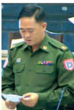
တပ်မတော်သားကိုယ်စားလှယ် ဗိုလ်မှူးအောင်ကိုမင်း။

လျှပ်စစ်စွမ်းအားကဏ္ဍနှင့်ပတ်သက်သည့် မေးခွန်းများနှင့်စပ်လျဉ်း၍ လျှပ်စစ်စွမ်းအားဝန်ကြီးဌာန ဒုတိယဝန်ကြီး ဦးအောင်သန်းဦးက ပြန်လည်