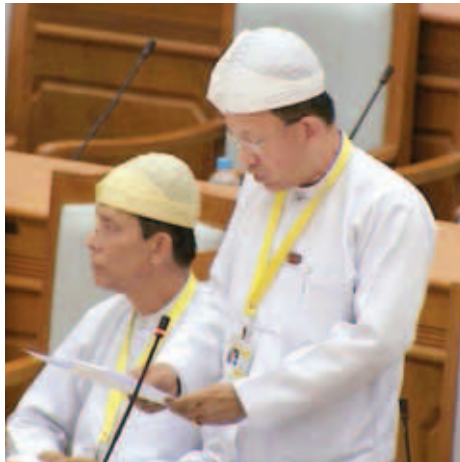
ပြည်ထောင်စုဝန်ကြီး ဒေါက်တာကံဇော်။

၂၀၁၅ - ၂၀၁၆ ဘဏ္ဍာနှစ် အမျိုးသားစီမံကိန်း ဥပဒေ(မူကြမ်း)ကို ပြည်ထောင်စုလွှတ်တော် (၁၂) ကြိမ် မြောက် ပုံမှန်အစည်းအဝေး၏ ပထမနေ့ ၂၀၁၅ ခုနှစ် ဇန်နဝါရီလ ၁၉ ရက်တွင် ပြည်ထောင်စုဝန်ကြီး ဒေါက်တာ ကံဇော်က တင်သွင်းခဲ့ပြီး ဖေဖော်ဝါရီလ ၁၉ ရက်နေ့တွင်