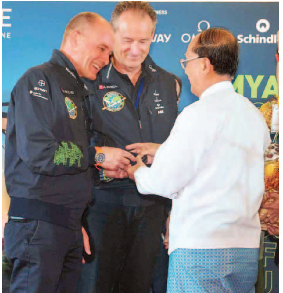
နိုင်ငံတော်သမ္မတ ဦးသိန်းစိန် နေရောင်ခြည်စွမ်းအင်သုံးလေယာဉ် Solar Impulse-2 လေယာဉ်မှူးတို့အား ရင်းရင်းနှီးနှီးနှုတ်ဆက်စဉ်။