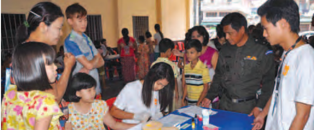
ရေးနှင့် နယ်စပ်ရေးရာဝန်ကြီး ဗိုလ်မှူးကြီးဇော်လွင်နှင့် တာဝန်ရှိသူများက ကြည့်ရှုအားပေးခဲ့ကြပြီး နိုင်ငံသားစိစစ်ရေးကတ်ပြားများကို ပြည်သူ များထံ လက်ဝယ်အရောက် ပေးအပ်ခဲ့သည်။ ယင်းနေ့က နိုင်ငံ-၃(က) ၂၄၁ ဦး၊ နိုင်ငံ-၆(က) ၁၅၂ ဦးနှင့် အိမ်ထောင်စုစာရင်း ၁၆၀ ခုတို့အား ဆောင်ရွက်ပေးခဲ့ကြောင်း သိရသည်။ မြတ်မြို့နယ် (မြို့နယ်) ဝန်ကြီးဌာန

ယင်းသို့ ကွင်းဆင်းဆောင်ရွက်ပေးနေမှုအား တနင်္သာရီတိုင်းဒေသကြီး လုံခြုံရေးနှင့် နယ်စပ်ရေးရာဝန်ကြီး ဗိုလ်မှူးကြီးဇော်လွင်နှင့် တာဝန်ရှိသူများက ကြည့်ရှုအားပေးခဲ့ကြပြီး နိုင်ငံသားစိစစ်ရေးကတ်ပြားများကို ပြည်သူ များထံ လက်ဝယ်အရောက် ပေးအပ်ခဲ့သည်။ ယင်းနေ့က နိုင်ငံ-၃(က) ၂၄၁ ဦး၊ နိုင်ငံ-၆(က) ၁၅၂ ဦးနှင့် အိမ်ထောင်စုစာရင်း ၁၆၀ ခုတို့အား ဆောင်ရွက်ပေးခဲ့ကြောင်း သိရသည်။ မြတ်မြို့နယ် (မြို့နယ်) ဝန်ကြီးဌာန