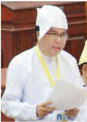
ပညာရေးဝန်ကြီးဌာန ဒုတိယဝန်ကြီး ဒေါက်တာဇော်မင်းအောင်။

ချောက်မဲဆန္ဒနယ်မှ ဦးသိန်းလွင်၏ ချောက်မြို့နယ်အပါအဝင် မိုးနည်း ရေရှားဒေသများ၌ သောက်သုံးရေ ရှားပါးမှုအခက်အခဲကို အထူစီမံချက် တစ်ရပ်ချမှတ်ဖြေရှင်းပေးရန် အစီ အစဉ်ရှိ မရှိမေးခွန်းနှင့်စပ်လျဉ်း၍ မွေးမြူရေး၊ ရေလုပ်ငန်းနှင့် ကျေးလက် ဒေသဖွံ့ဖြိုးရေးဝန်ကြီးဌာန ဒုတိယ ဝန်ကြီး ဦးခင်မောင်အေးက စစ်ကိုင်း တိုင်းဒေသကြီး၊ မန္တလေးတိုင်းဒေသ ကြီးနှင့် မကွေးတိုင်းဒေသကြီးများ