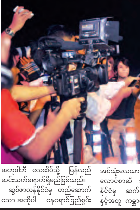
နေရောင်ခြည် စွမ်းအင်သုံး လေယာဉ်၏ လေယာဉ် ပျံနှစ်ဦးတို့ လေယာဉ် မထွက်ခွာမီ သတင်းစာ ရှင်းလင်းပွဲ ပြုလုပ်စဉ်။

အင်သုံးလေယာဉ်သည် ရုပ်ကြွင်း သမိုင်းတွင်မည့် ချက်ခရီးစဉ်ကို မှတ်ကျောက်တင်လိုက်ခြင်းပင်ဖြစ်သည်။ ပထမဆုံးကြီးပမ်း စွန့်ပစ်မှုများဖြင့် ဆက်လက်ထွက်ခွာသွားမှု နှင့်အတူ ကမ္ဘာကိုပတ်၍ ပျံသန်းရန် (သတင်းစဉ်)