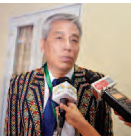
ဒေါက်တာဆလိုင်းလျန်မှန်းဆာခေါင်း