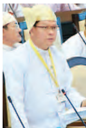
လျှပ်စစ်စွမ်းအား ဝန်ကြီးဌာန ဒုတိယဝန်ကြီး ဦးအောင်သန်းဦး။

တပ်မတော်သားကိုယ်စားလှယ် ဗိုလ်မှူးအောင်ကိုမင်း၏ ကမ္ဘာ့အိုလံပစ် အားကစားပြိုင်ပွဲ၊ SEA Games နှင့် မြန်မာ့ရိုးရာ အားကစားပြိုင်ပွဲများအတွက် ကျင်းပလျက်ရှိသော ဘောလုံး၊ ဘော်လီဘော၊ ဖူဆယ်၊ ပိုက်ကော်ခြင်း၊ ခြင်း လုံး၊ Boxing လက်ဝှေ့၊ မြန်မာ့ရိုးရာလက်ဝှေ့၊ ဘတ်စကက်ဘော၊ ဟော်ကီ၊ ကြက်တောင်၊ တင်းနစ်၊ စားပွဲတင်တင်းနစ် စသည့် အားကစားနည်းများအား ဆုကြေးစနစ်အဖြစ် အမျိုးသား၊ အမျိုးသမီး (၂)မျိုးစလုံး ပါဝင်နိုင်မည့် Pro Sport System ကျင့်သုံးအကောင်အထည်ဖော်ပေးရန် အစီအစဉ် ရှိ/မရှိ မေးခွန်းနှင့် စပ်လျဉ်း၍ အားကစားဝန်ကြီးဌာန ဒုတိယဝန်ကြီး ဦးသောင်းထိုက် က မြန်မာ့အားကစား အောင်မြင်မှုများရရှိရေးအတွက် ရေတိုရေရှည် စီမံချက် များ ရေးဆွဲဆောင်ရွက်ရန်လိုအပ်သည်အတွက် “Myanmar Sport Master Plan” ကို ရေးဆွဲဆောင်ရွက်လျက်ရှိသည့်အပြင် အားကစားလှုပ်ရှားမှုများကို အခြေခံအကျဆုံးမြို့နယ်များမှ စတင်၍ မြှင့်တင်ဆောင်ရွက်နိုင်ရေးအတွက် မြို့နယ်အားကစား ဖွံ့ဖြိုးတိုးတက်ရေးအစီအစဉ် “Township Sport Development Program” ကိုလည်း တစ်ပြိုင်နက်တည်း ရေးဆွဲအကောင် အထည်ဖော် ဆောင်ရွက်လျက်ရှိပါကြောင်း၊ မေးခွန်းပါ အားကစားနည်း(၁၂) နည်းအနက်မှ ၂၀၀၉ ခုနှစ်တွင် ဘောလုံးအားကစားနည်းကို အပျော်တမ်း အဆင့်မှ ဆုကြေးစားစနစ်သို့ ပြောင်းလဲခဲ့သည့်အပြင် ဖူဆယ်နှင့် ရိုးရာ လက်ဝှေ့အားကစားနည်းများကိုလည်း ဆုကြေးစားပြိုင်ပွဲစနစ် ကျင့်သုံး