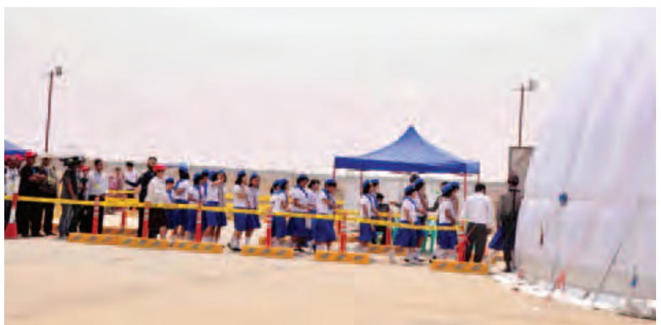
မန္တလေးအပြည်ပြည်ဆိုင်ရာလေဆိပ်၌ နေရောင်ခြည်စွမ်းအင်သုံးလေယာဉ် Solar Impulse-2 ရပ်နားထားစဉ်အတွင်း လာရောက်လေ့လာကြသော ကျောင်းသား ကျောင်းသူများအား တွေ့ရစဉ်။