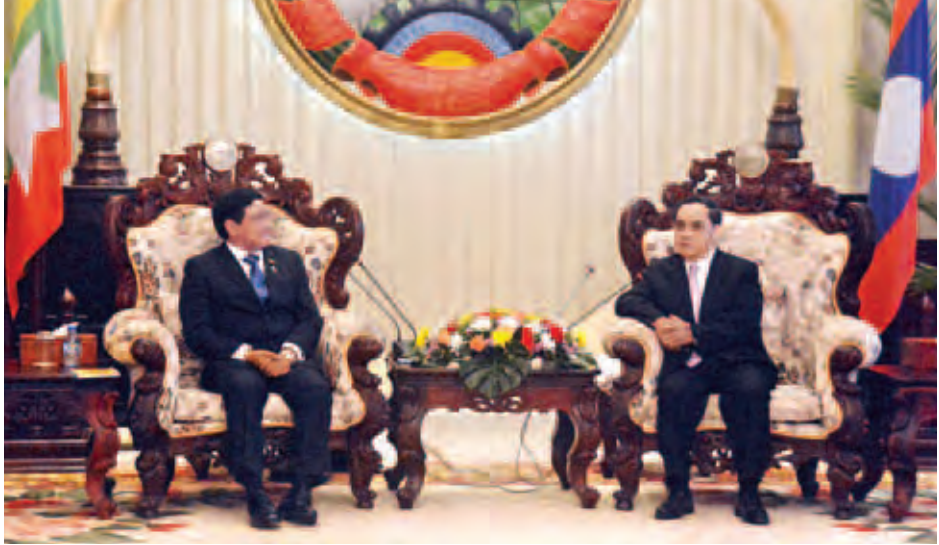
ဒုတိယသမ္မတ ဦးညွှန်ထွန်း၊ လာအိုနိုင်ငံဝန်ကြီးချုပ် မစ္စတာ သွန်ဆင်းသမာဗောင်နှင့် တွေ့ဆုံဆွေးနွေးစဉ်။ (သတင်းစဉ်)