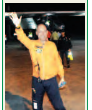
owif pms.uE8n » 4

နေရောင်ခြည်စွမ်းအင်သုံး လေယာဉ်၏ ပထမဆုံး ကမ္ဘာပတ်ခရီး မန္တလေးမြို့မှ တရုတ်နိုင်ငံ ချုံကင်းမြို့သို့ ထွက်ခွာပျံသန်း