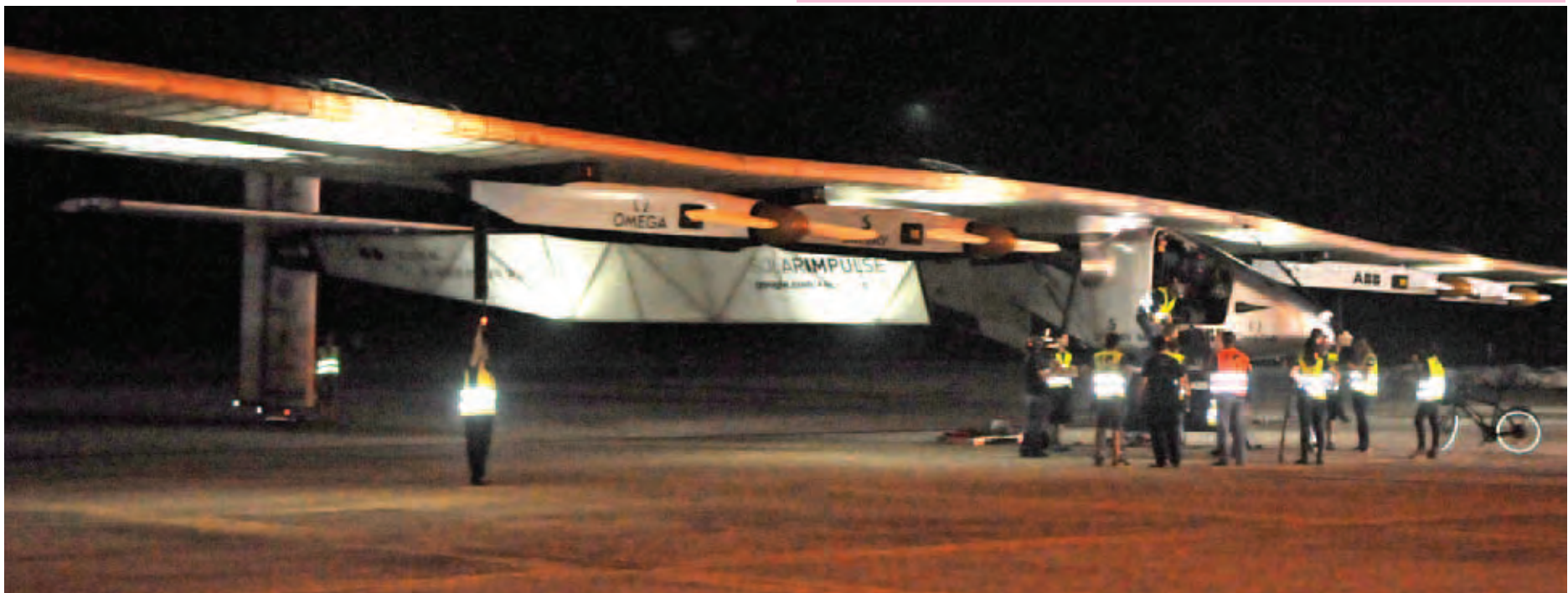
နေရောင်ခြည်စွမ်းအင်သုံးလေယာဉ် Solar Impulse-2 တရုတ်နိုင်ငံသို့ မထွက်ခွာမီ မန္တလေးအပြည်ပြည်ဆိုင်ရာလေဆိပ်၌ ပြင်ဆင်နေစဉ်။