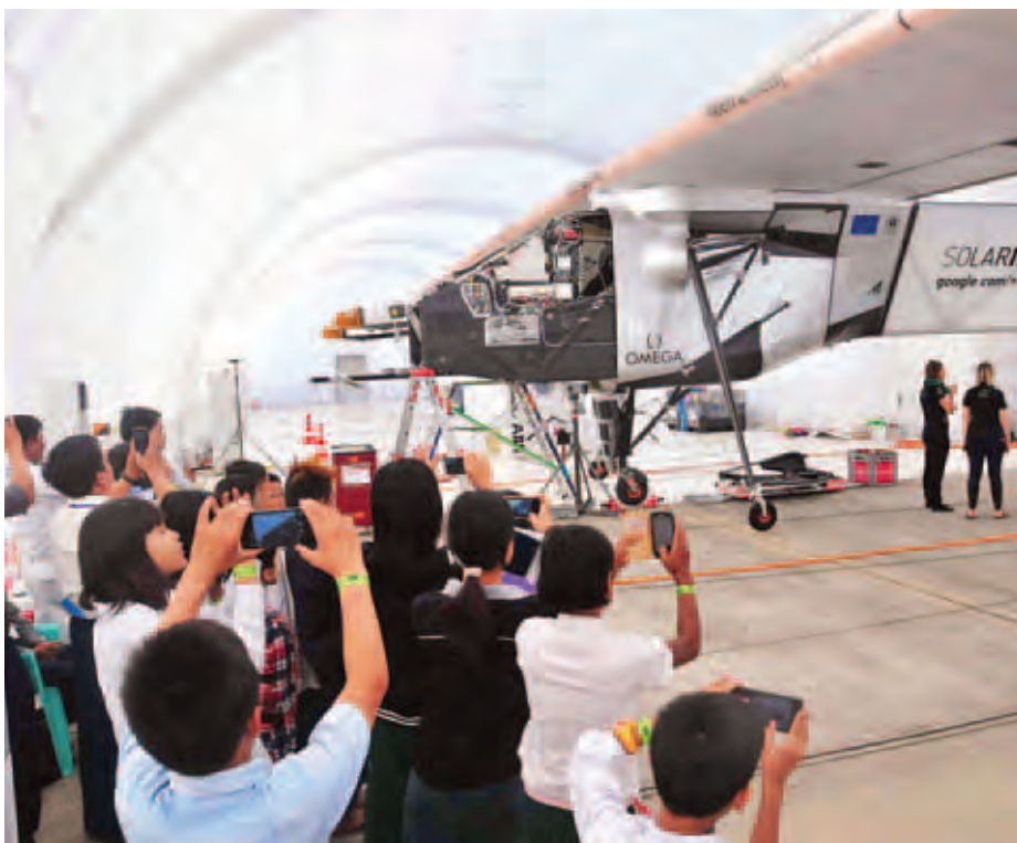
မန္တလေးအပြည်ပြည်ဆိုင်ရာလေဆိပ်၌ နေရောင်ခြည်စွမ်းအင်သုံးလေယာဉ် Solar Impulse-2 ရပ်နားထားစဉ်အတွင်း လာရောက်လေ့လာကြသူများအား တွေ့ရစဉ်။