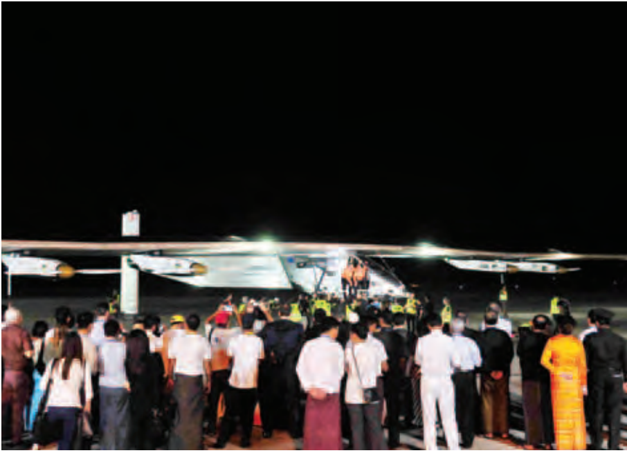
နေရောင်ခြည်စွမ်းအင်သုံးလေယာဉ် Solar Impulse-2 အိန္ဒိယနိုင်ငံမှ မန္တလေးအပြည်ပြည်ဆိုင်ရာလေဆိပ်သို့ မတ် ၁၉ ရက် ညပိုင်းက ရောက်ရှိရန်စားစဉ်။