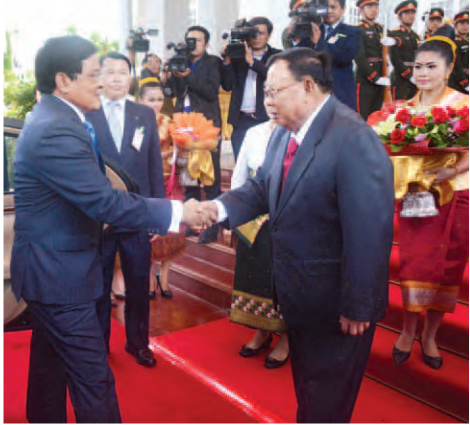
ဒုတိယသမ္မတ ဦးညွှန်ထွန်းအား လာအိုနိုင်ငံ ဒုတိယသမ္မတ မစ္စတာ ဘွန်ညို ဗိုလ်ချုပ်က ကြိုဆိုနှုတ်ဆက်စဉ်။ (သတင်းစဉ်)