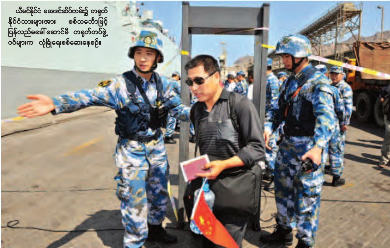
ယီမင်နိုင်ငံ အေဒင်ဆိပ်ကမ်း၌ တရုတ် နိုင်ငံသားများအား စစ်သင်္ဘောဖြင့် ပြန်လည်မခေါ်ဆောင်မီ တရုတ်တပ်ဖွဲ့ ဝင်များက လုံခြုံရေးစစ်ဆေးနေစဉ်။