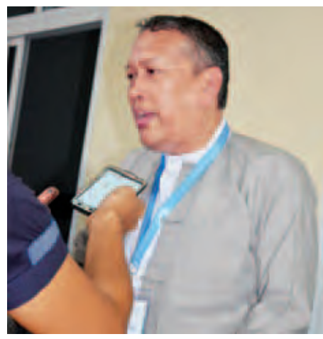
ဦးလှမောင်ရွှေ

ခေါင်းဆောင်တွေအဆင့်မှာ NCA သဘောတူညီချက်ကို နှစ်ဖက်ခေါင်းဆောင်တွေ ပဏာမသဘောတူညီထားကြောင်းကို လက်မှတ်ရေးထိုးပါမယ်။ ပြီးရင် တစ်ဖက်ခေါင်းဆောင်သုံးဦးစီနဲ့ နှစ်ဖက်ခြောက်ဦးပါ ခေါင်းဆောင်တွေက NCA သဘောတူညီချက်စာချုပ်နဲ့ ပတ်သက်ပြီး သတင်းစာရှင်းလင်းပွဲပြုလုပ်ပါမယ်။ ဦးနိုင်ဟံသာ NCCT အဖွဲ့ခေါင်းဆောင် မွန်ပြည်သစ်ပါတီ (NMSP) တစ်နိုင်ငံလုံး အပစ်အခတ်ရပ်စဲနိုင်ရေးအတွက် ကျွန်တော်တို့ တိုင်းရင်းသားတွေဘက်ကဆိုရင် ၂၀၁၃ နိုဝင်ဘာလဆန်းမှာ NCCT အဖွဲ့ကို ဖွဲ့ခဲ့တယ်။ ၂၀၁၃ ခုနှစ် နိုဝင်ဘာ ၄ ရက်နဲ့ ၅ ရက်မှာ UPWC နဲ့ စတင်ပြီး တွေ့ဆွေးနွေးတယ်။ အဲဒီလိုဆွေးနွေးလာခဲ့တာ တရားဝင်က (၇)ကြိမ်ပေါ့။ အလွတ်သဘောတွေက အကြိမ်ပေါင်း မနည်းဘူး။ အစပိုင်းမှာတော့ တစ်ဆို့မှုတွေ တော်တော်များများ ရှိပါတယ်။ အဲဒါကို ကျွန်တော်တို့က တစ်ဖက်နဲ့ တစ်ဖက် နားလည်အောင် ဆွေးနွေးရင်း ဆွေးနွေးရင်းနဲ့ NCCT နဲ့ UPWC အဆင့်မှာတော့ အားလုံးသဘောတူညီမှု ရသွားပြီ။ နောက် ခုနက် နိုင်ငံရေးဆွေးနွေးတဲ့အခါကျရင် အစိုးရဘက်က တင်ပြထားတာကတော့ တိုင်းရင်းသားကိုယ်စားလှယ်အဖွဲ့တွေ သီးသန့်ပါဝင်ဖို့ပေါ့။ အဲဒီ သူတို့ရည်ရွယ်တဲ့ တိုင်းရင်းသားကိုယ်စားလှယ်အဖွဲ့က လွတ်တော်ထဲမှာလည်း မပါဘူး။ တပ်မတော်ထဲမှာလည်း မပါဘူး။ အန်ကယ်တို့ရဲ့ တိုင်းရင်းသားလက်နက်ကိုင် တော်လှန်ရေးအင်အားစုထဲမှာလည်း မပါဘူး။ တိုင်းရင်း