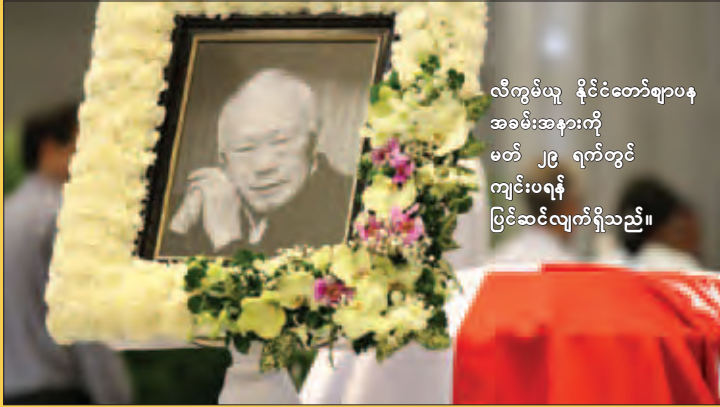
လီကွမ်ယူ နိုင်ငံတော်ဈာပန အခမ်းအနားကို မတ် ၂၉ ရက်တွင် ကျင်းပရန် ပြင်ဆင်လျက်ရှိသည်။

အရှေ့တောင်အာရှဒေသရှိ ချမ်းသာကြွယ်ဝသော စင်ကာပူနိုင်ငံ၌ လီကွမ်ယူကွယ်လွန်အနိစ္စ ရောက်ရှိခဲ့ပြီးနောက် ယင်းနိုင်ငံ၏ နိုင်ငံရေးရှုထောင့်ကို စိတ်ကူးဖြင့် နိမိတ်ပုံဖော်ကြည့်ကာ ဆွေးနွေးငြင်းခုံမှုများ ကျယ်လောင်လာသည်။