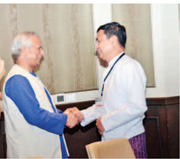
ပြည်ထောင်စုဝန်ကြီး ဦးရဲထွဋ် ဘင်္ဂလားဒေ့ရှ်နိုင်ငံမှ ငြိမ်းချမ်းရေးနိဘယ်ဆုရှင်နှင့် Grameen Bank Bhaban ဥက္ကဋ္ဌ ပါမောက္ခ Mohammad Yunus အား တွေ့ဆုံနှုတ်ဆက်စဉ်။

လက်မဲ့များအတွက်ပါ ချေးငွေအစီအစဉ်များပါရှိသည့် ဘဏ်စနစ်နှင့် ဘဏ်များဖွံ့ဖြိုးတိုးတက်ရန် လိုအပ်ကြောင်း။ မိမိအတွက် အလုပ်လုပ်ခြင်းနှင့် လူတစ်ယောက်အတွက် အလုပ်လုပ်ခြင်းကို ကွဲပြားစေလိုကြောင်း၊ ပြဿနာများဖြင့် မွေးဖွားလာသောလူသားများအနေဖြင့် ယင်းတို့ကို ဖြေရှင်းပေးမည့်သူကို ရှာဖွေနေခြင်းထက် မိမိကိုယ်တိုင် ပါဝင်ဖြေရှင်းခြင်းသည်သာ အကောင်းဆုံးနည်းလမ်းဟု မိမိယုံကြည်ပါကြောင်း၊ ကမ္ဘာတစ်ဝန်းလုံး ရင်ဆိုင်နေရသည့် ဆင်းရဲမှုပြဿနာကို သူညီအဆင့်ထိ လျော့ကျစေရန်မှာ တစ်ဦး