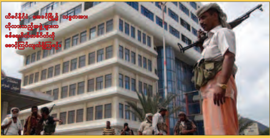
ယီမင်နိုင်ငံ အစောင့်ဖြူသမားတို့ လိုလားသည့်အဖွဲ့များက ဝန်ထမ်းတစ်ဦးကို ဝေဖန်ကြိတ်လှုပ်ကြံခတ်ခဲ့သည်။