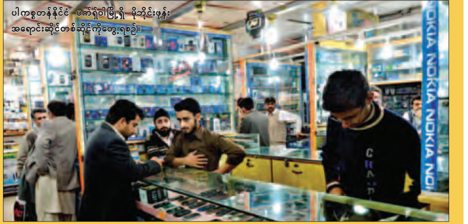
ပါကစ္စတန်နိုင်ငံ စက်ရုံတိုက်ခိုက်မှု ဖြစ်ပွားမှုများကို အရေးယူဆောင်ရွက်ရန်အတွက် တွေ့ရစဉ်။

စစ်သွေးကြွများက ဆဲလ်ဖုန်းအသုံးပြုမှု အဆုံးသတ်ဖွယ်ရှိသည်။ တိုက်ခိုက်မှုပြုလုပ်ချိန်အတွင်း ဆက်သွယ်မှုပြုလုပ်နိုင်ရန် စစ်သွေးကြွများက ဆဲလ်ဖုန်းများကို အသုံးပြုလေ့ရှိခြင်း ခြိမ်းခြောက်ခြင်း၊ ငွေညစ်ခြင်း၊ ဗုံးခွဲခြင်းတို့ပြုလုပ်ရာတွင် ဆဲလ်ဖုန်းများကို အသုံးပြုလေ့ရှိသည်။