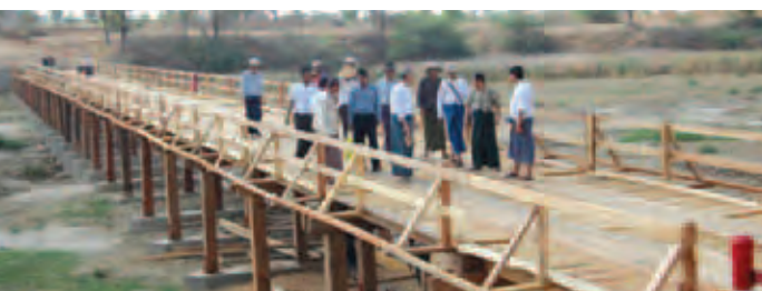
မှာ ၁၃ တန် ထိ ခွင့်ပြုထားကြောင်းနှင့် ယခုအခါ တံတားမှာ ၈၀ ရာနှုန်းပြီးစီးနေပြီဖြစ်၍ တံတားကြီးပြီးသွားပါက ဒေသခံများ ကျွေပတ်သွားလာခဲ့ရသော ဒုက္ခများမှ ကင်းဝေးတော့မည်ဖြစ်ပေသည်။ အောင်ဌေး(မလှိုင်)

စစ်ဆေးခဲ့ကြောင်းသိရသည်။ အဆိုပါ သစ်သားတံတားမှာ အရှည်ပေ ၄၀၀ ၊ အကျယ် ပေ ၁၄၊ အမြင့် ၉ ပေရှိပြီး ၂၀၁၄-၂၀၁၅ ဘဏ္ဍာရေးနှစ် နိုင်ငံတော်ခွင့်ပြုငွေကျပ်သိန်း ၁၀၈၀ ဖြင့် မြို့နယ်ကျေးလက်ဒေသ ဖွံ့ဖြိုးရေးဦးစီးဌာနမှ တင်ဒါအောင်မြင်သော ထွန်းတောက်ရောင်နီကုမ္ပဏီက တာဝန်ယူတည်ဆောက်နေခြင်းဖြစ်သည်။ ယခင် သစ်သားတံတားအဟောင်းမှာ အကျယ်ရှစ်ပေသာရှိ၍ ယာဉ်ငယ်များသာ ဖြတ်သန်းနိုင်ပြီး တံတားအသစ်၏ ခံနိုင်ရည်