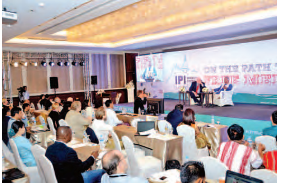
(၆၅) ကြိမ်မြောက် နိုင်ငံတကာစာနယ်ဇင်းအဖွဲ့အစည်း(IPI) ကမ္ဘာ့ညီလာခံဒုတိယနေ့ ကျင်းပစဉ်။