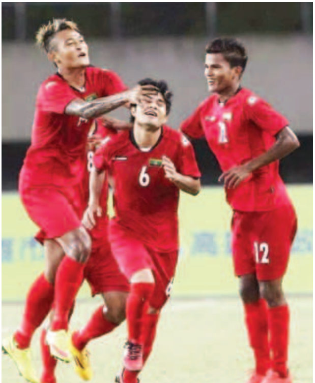
တရုတ်(တိုင်ပေ)နှင့်ပွဲ၌ ဂိုးသွင်းအပြီး အောင်ပွဲခံနေသည့် မြန်မာအသင်း။

သတင်းနှင့်စာတိုက် - ရိုင်းထက်ဇော် အာရှဘောလုံးအဖွဲ့ချုပ်(AFC)မှ ကြီးပွားကျင်းပလျက်ရှိသည့် အာရှ ယူ-၂၃ ခြေစစ်ပွဲစဉ်များကို မတ် ၂၉ ရက်တွင် ဆက်လက်ယှဉ်ပြိုင် ကစားသွားမည်ဖြစ်သည်။ တရုတ်(တိုင်ပေ)တွင် ကျင်းပလျက် ရှိသည့် အုပ်စု(စ) ဒုတိယပွဲစဉ်များ အဖြစ် မြန်မာတော်ချိန်မွန်လွဲ ၂ နာရီခွဲတွင် မြန်မာနှင့် ဟောင်ကောင်၊ ညနေ ၅ နာရီခွဲတွင် ဩစတြေးလျနှင့် တရုတ်(တိုင်ပေ)အသင်းတို့ ယှဉ်ပြိုင် ကစားမည်ဖြစ်သည်။ မြန်မာအသင်း နှင့် ဩစတြေးလျအသင်းတို့မှာ ပွဲဦး ထွက် ပွဲစဉ်များတွင် ဂိုးပြတ်နိုင်ပွဲများ ရရှိထားသည့်အသင်းဖြစ်ပြီး ဒုတိယ ပွဲ၌ အနိုင်ရသော အသင်းများမှာ ခြေစစ်ပွဲအောင်မြင်ရန် အခြေ အနေ ကောင်းသွားမည်ဖြစ်သည်။ မြန်မာအသင်းသည် ပထမပွဲ၌ အိမ်ရှင်တရုတ်(တိုင်ပေ) အသင်းကို စာမျက်နှာ ၅ ကော်လံ ၃ သို့ ၀