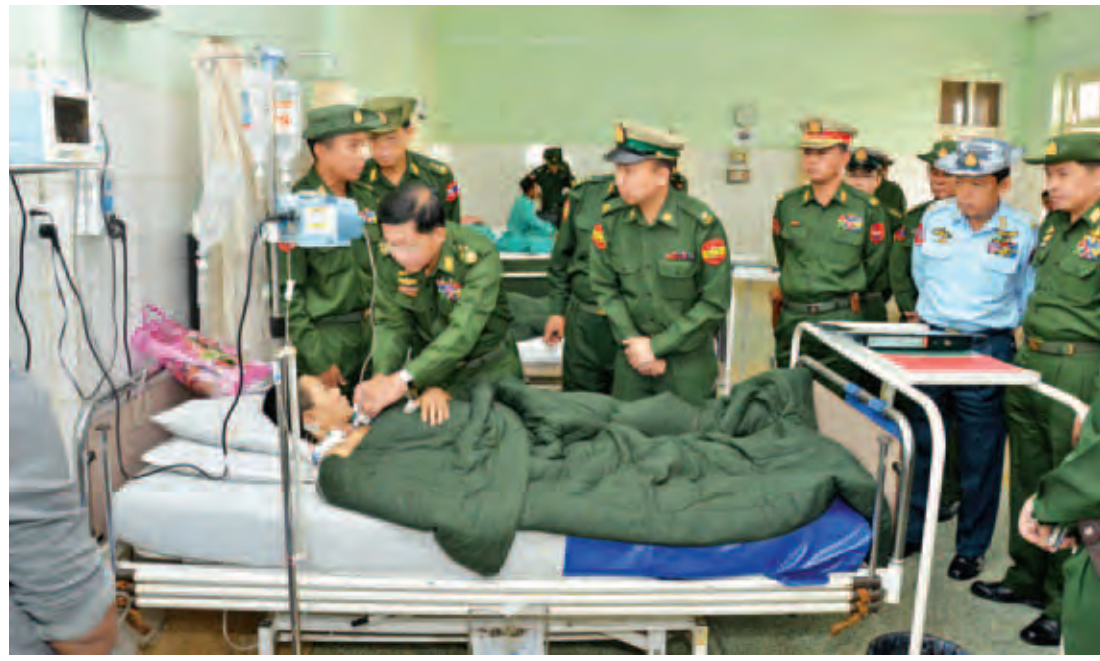
တပ်မတော်ကာကွယ်ရေးဦးစီးချုပ် ဗိုလ်ချုပ်မှူးကြီး မင်းအောင်လှိုင် ပြင်ဦးလွင်တပ်နယ် တပ်မတော်ဆေးရုံ၌ တက်ရောက်ကုသမှု ခံယူနေသော အရာရှိ၊ စစ်သည်များအား ကြည့်ရှုအားပေးစဉ်။

နေပြည်တော် မတ် ၂၂ တပ်မတော်ကာကွယ်ရေးဦးစီးချုပ် ဗိုလ်ချုပ်မှူးကြီး မင်းအောင်လှိုင်သည် ကာကွယ်ရေးဦးစီးချုပ်(လေ) ဗိုလ်ချုပ်ကြီး ခင်အောင်မြင့်၊ ကာကွယ်ရေးဦးစီးချုပ် ရုံး (ကြည်း) မှ တပ်မတော်အရာရှိကြီးများ၊ အလယ်ပိုင်းတိုင်း စစ်ဌာနချုပ် တိုင်းမှူး ဗိုလ်ချုပ် စိုးထွဋ်တို့နှင့်အတူ ယနေ့ နံနက်ပိုင်းတွင် ပြင်ဦးလွင်တပ်နယ် တပ်မတော်ဆေးရုံ၌ ဆေးကုသမှုခံယူနေသည့် နိုင်ငံတော်လုံခြုံရေးနှင့် ကာကွယ်ရေးတာဝန်ကို စွမ်းစွမ်းတမ်းဖြင့် သက်စွန့် ကြိုးပမ်းထမ်းရွက်စဉ် ထိခိုက်ဒဏ်ရာရရှိခဲ့သော အရာရှိ၊ စစ်သည်များအား ရင်းနှီးနှေးနှေးစွာတွေ့ဆုံ ဂုဏ်ပြု အားပေးစကားပြောကြားသည်။ ရှေးဦးစွာ တပ်မတော်ကာကွယ်ရေးဦးစီးချုပ်နှင့် အဖွဲ့ဝင်များသည် ဆေးရုံတက်ရောက်ကုသမှုခံယူနေသော အရာရှိ၊ စစ်သည်များအား တစ်ဦးချင်း ရင်းရင်းနှီးနှီး တွေ့ဆုံ၍ ထိခိုက်ဒဏ်ရာရရှိမှုနှင့် ဆေးကုသမှု အခြေအနေအသေးစိတ်ကို မေးမြန်းကာ ဆေးကုသမှုဆိုင်ရာ လိုအပ်ချက်များ၊ စစ်သည်တစ်ဦးချင်း၏ တင်ပြချက်များကို ဖြည့်ဆည်းဆောင်ရွက်ပေးပြီး ထောက်ပံ့ပွဲ ပစ္စည်းနှင့် စားသောက်ဖွယ်ရာများ ပေးအပ်ကြသည်။ စာမျက်နှာ ၁၁ ကော်လံ ၄ သို့