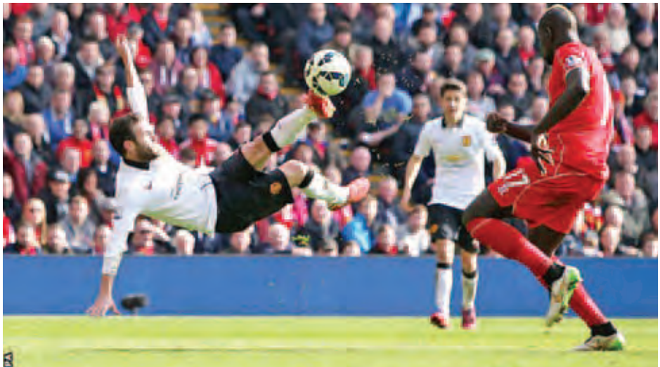
မန်ယူအသင်းအတွက် နှစ်ဂိုးသွင်းယူပေးခဲ့သည့် တိုက်စစ်မှူး မာတာ၏ ဂိုးပေါက်ကန်သွင်းမှုကို တွေ့ရစဉ်။ ပွဲထွက်ကစားခွင့်နည်းပါးနေသည့် မာတာကို ထည့်သွင်းကစားစေသည့် အပြောင်းအလဲတစ်ခု ပြုလုပ်လာ သည်ကို တွေ့ရသည်။ ပြိုင်ပွဲစတင်သည်နှင့် နည်းသည့် မန်ယူအသင်းသည် အချိတ်အဆက် မိမိဖြင့် လီဗာပူးအသင်းကို ဖိအားပေးကစားနိုင်သော်လည်း ထိရောက်သည့် စာမျက်နှာ ၁၀ ကော်လံ ၃ သို့

အင်္ဂလန် ပရီမီယာလိဂ်ပွဲစဉ် (၃၀)၏ စူပါဆန်းဒေးပွဲစဉ်တစ်ပွဲဖြစ်သည့် လီဗာပူးအသင်းနှင့် မန်ယူအသင်းတို့ ပွဲစဉ်ကို မတ် ၂၂ ရက် ည ၈ နာရီတွင် အကြိတ်အနယ် ယှဉ်ပြိုင်ကစားခဲ့ကြရာ မန်ယူအသင်းက နှစ်ဂိုး-တစ်ဂိုးဖြင့် အနိုင်ရရှိသွားခဲ့သည်။ ယခုပွဲသည် ဥရောပ ချန်ပီယံလိဂ်ဝင်ခွင့်တစ်နေရာအတွက် လီဗာပူးအသင်းရောမန်ယူအသင်းအတွက်ပါ အလွန်အရေးပါသည့် ပွဲတစ်ပွဲဖြစ်သည့်အတွက် နှစ်သင်းစလုံး အဓိကကစားသမားများကို ပွဲထုတ်ကာ လူစုံတက်စုံဖြင့် ယှဉ်ပြိုင်ကစားခဲ့ကြသည်။ မန်ယူအသင်းသည် ခြေစွမ်းပြကစားနိုင်ခြင်းမရှိသည့် ဒီမာရီယာနှင့် ဖယ်ကာအိုတို့ ပထမပွဲထွက်လူစာရင်းမှ ချန်လှပ်ထားခဲ့ပြီး