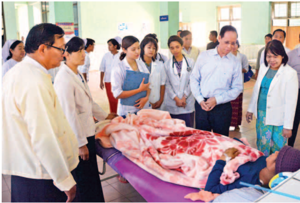
ဒုတိယသမ္မတ ဒေါက်တာစိုင်းမောက်ခမ်း လားရှိုးပြည်သူ့ဆေးရုံကြီး၌ တက်ရောက်ဆေးကုသလျက်ရှိသည့် လူနာများအား ကြည့်ရှုအားပေးစဉ်။ (သတင်းစဉ်)