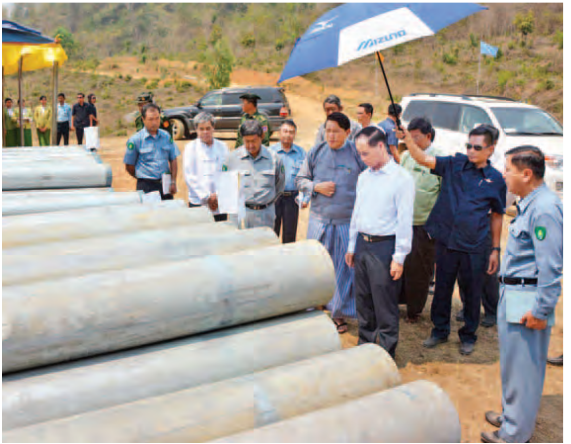
ဒုတိယသမ္မတ ဒေါက်တာစိုင်းမောက်ခမ်း မြို့ရေပေးရေးအတွက် သွယ်တန်းမည့်ရေပိုက်များကို ကြည့်ရှုစစ်ဆေးစဉ်။