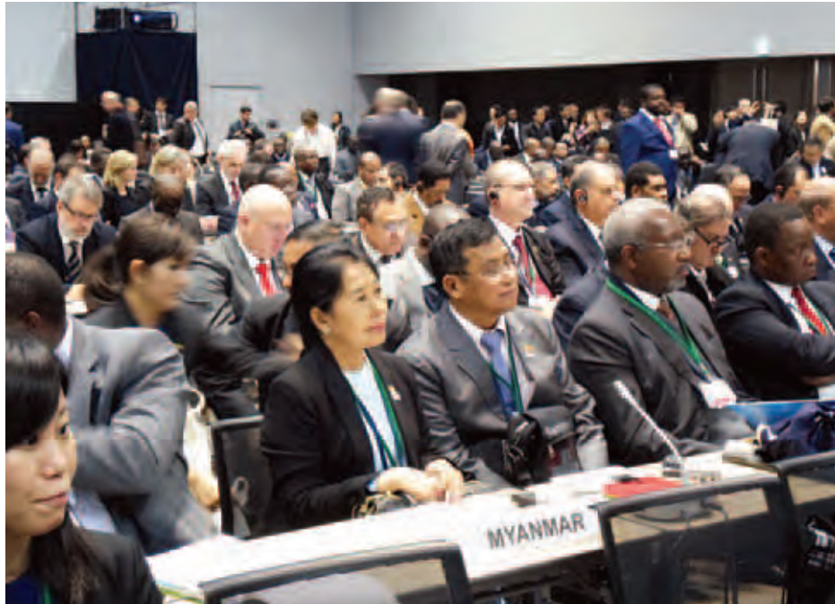
ဂျပန်နိုင်ငံ ဘုရင့်နန်းတော်မှ ပေးပို့သော ဝက်သစ်ချသီး ပျိုးပင်အား သတ်မှတ်ထားသောနေရာတွင် စိုက်ပျိုးပေးသည်။ ညပိုင်းတွင် ဆန်းဒိုင်မြို့၊ မြို့တော်ဝန်က တည်ခင်းစဉ်သော ညစာစားပွဲသို့ တက်ရောက်သည်။ မတ် ၁၅ ရက် မွန်းလွဲပိုင်းတွင် Exhibition Hall 2

အမျိုးသားသဘာဝဘေး ကာကွယ်စောင့်ရှောက်ရေး စီမံခန့်ခွဲမှုလုပ်ငန်းကော်မတီဥက္ကဋ္ဌ လူမှုဝန်ထမ်း၊ ကယ်ဆယ်ရေးနှင့် ပြန်လည်နေရာချထားရေးဝန်ကြီးဌာန ပြည်ထောင်စုဝန်ကြီး ဒေါက်တာဒေါ်မြတ်မြတ်အုန်းခင် ခေါင်းဆောင်သော မြန်မာကိုယ်စားလှယ်အဖွဲ့သည် တတိယအကြိမ် သဘာဝဘေးအန္တရာယ်လျော့ချရေး ဆိုင်ရာ ကမ္ဘာ့ကုလသမဂ္ဂညီလာခံ (3rd UN World Conference for Disaster Risk Reduction) သို့ တက်ရောက်ရန် ဂျပန်နိုင်ငံ ဆန်းဒိုင်မြို့သို့ မတ် ၁၃ ရက်မှ ၁၈ ရက်အထိသွားရောက်ခဲ့သည်။