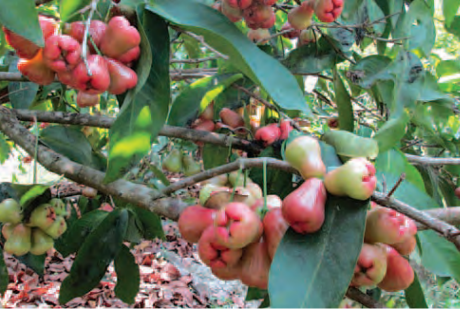
အမော်အတွက် အရွက်ကို ပွတ်ရှူပေးပါက သက်သာစေခြင်း၊ အာဘော်၊ အာပန္နဇ ရေခတ်ကိုနီးအောင်းမှုများသော...