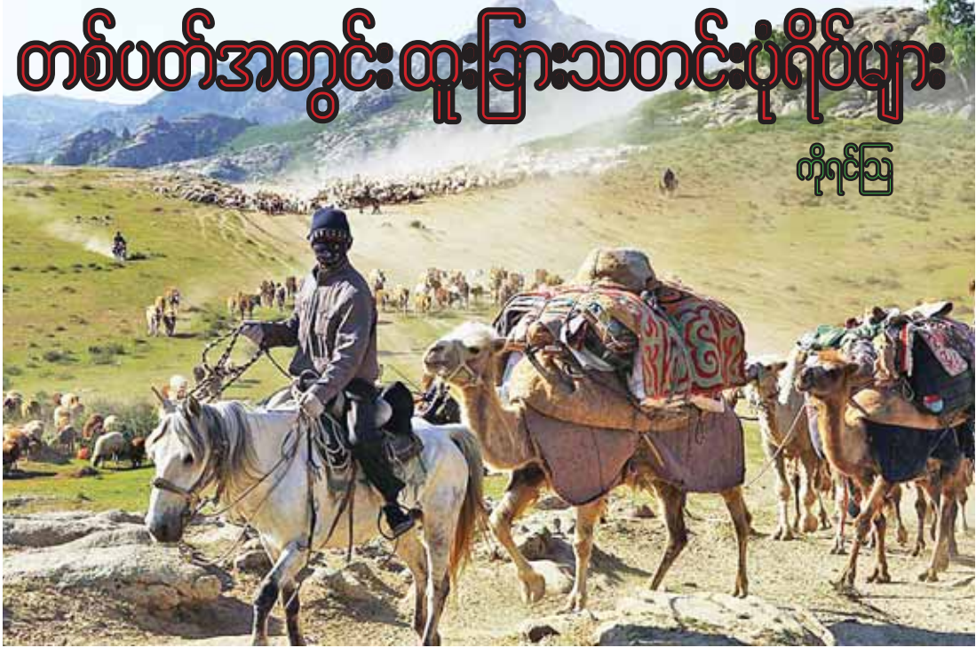
ဆင်ကျန်းကိုယ်ပိုင်အုပ်ချုပ်ခွင့်ရဒေသတစ်ခုခုကို တွေ့ရစဉ်။

မျက်မှောက်ကမ္ဘာတွင် ဖြစ်ပေါ်နေသော နိုင်ငံရေး၊ စီးပွားရေး၊ လူမှုရေး၊ စစ်ရေးစသည့် နိုင်ငံတကာအရေးကိစ္စများကို မျက်မြင်မပြတ်လေ့လာနေရန် လိုအပ်ပါသည်။ ထိုသို့ လေ့လာနေမှသာလျှင် နိုင်ငံတကာအခင်းအကျင်းများမှ ရယူသင့်သော သင်ခန်းစာများကို ထုတ်ယူနိုင်မည်ဖြစ်ပါသည်။ ကြေးမုံစာဖတ်ပရိသတ်များအား တစ်ပတ်အတွင်းထူးခြားသော နိုင်ငံတကာဖြစ်စဉ်များကို ခြုံငုံသိရှိနိုင်စေရန်အတွက် အပတ်စဉ် တနင်္ဂနွေနေ့တိုင်း နိုင်ငံတကာသတင်းပုံရိပ်များကို ဖော်ပြပေးလိုက်ပါသည်။ (စာတည်း)