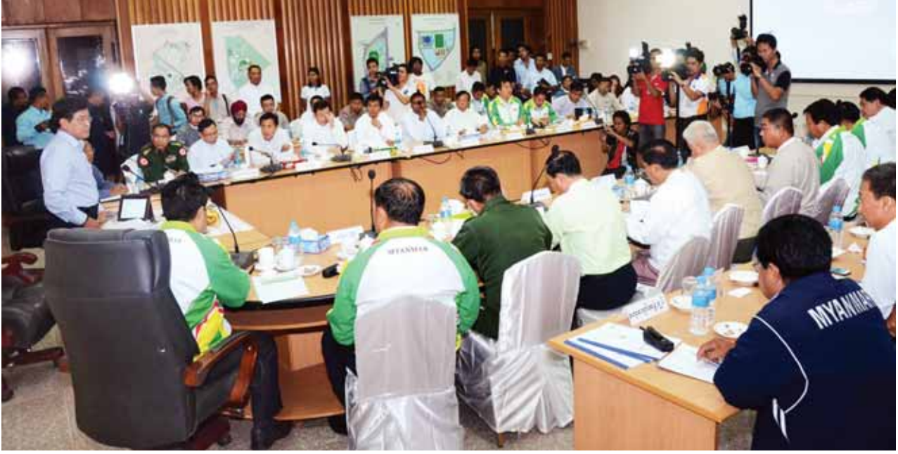
ဒုတိယသမ္မတ ဦးညွှန်ထွန်း မြန်မာနိုင်ငံအားကစားအဖွဲ့ချုပ် ဥက္ကဋ္ဌများနှင့် တွေ့ဆုံပွဲတွင် အမှာစကားပြောကြားစဉ်။ (သတင်းစဉ်)

အားကစားနည်းအလိုက် ထိုက်တန်သည့်ဆုတံဆိပ်များရရှိရန် ဦးတင်ချက်ထား ကြိုးပမ်းသွားရမည်ဖြစ်ကြောင်း၊ အောင်မြင်ရေးအတွက် စိန်ခေါ်မှုများစွာ ရင်ဆိုင်ရမည်ဖြစ်သော်လည်း ယင်းစိန်ခေါ်မှုများကို နိုင်ငံတော်၏ဂုဏ်သိက္ခာ မြင့်မားရေးအတွက် ဖန်တီးပေးနိုင်သော အခွင့်လမ်းကောင်းအဖြစ် ပြောင်းလဲ ပစ်နိုင်ရန် အားလုံးဦးထမ်းပဲ့ထမ်းတစ်စိတ်တစ်ပိုင်းတည်းကြိုးပမ်းသွားရမည်ဖြစ် ကြောင်း၊ အစိုးရနှင့် အားကစားအဖွဲ့ချုပ်များ၊ အားကစားအဖွဲ့အစည်းများ အကြား တာဝန်ရှိသူများ မကြာခဏထိတွေ့မှု၊ အပြန်အလှန်လေးစားမှု၊ ပူးပေါင်း ဆောင်ရွက်မှု၊ အားကစားဖွံ့ဖြိုးတိုးတက်ရေးအတွက် သက်ဆိုင်သူတစ်ဦးချင်း၏