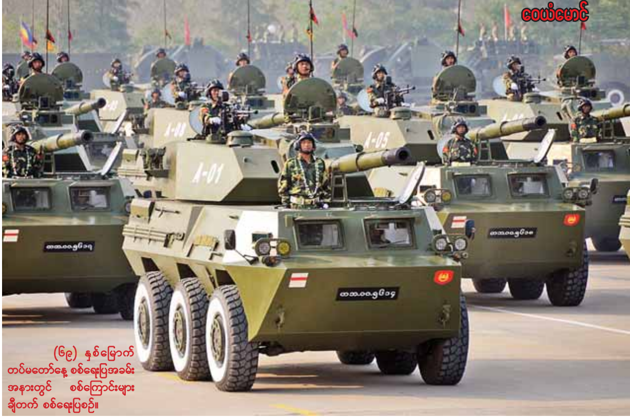
(၆၉) နှစ်မြောက် တပ်မတော်နေ့ စစ်ရေးပြအခမ်း အနားတွင် စစ်ကြောင်းများ ချီတက် စစ်ရေးပြစဉ်။

ဖက်ဆစ်ဂျပန်ကို တိုက်ထုတ်နိုင်စွမ်းရှိသော အဖွဲ့အစည်းမှာ ပြည်သူလူထု နှင့် တစ်သားတည်းရှိနေသော၊ ပြည်သူကြားမှ ပေါက်ဖွားလာသော၊ မျိုးချစ် လူငယ်တိုင်းရင်းသားပေါင်းစုံပါဝင်သော ပြည်ထောင်စုတပ်မတော်ပင် ဖြစ်ပါသည်။