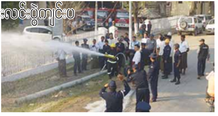
သည့်ညည်သည်တော်များ၊ အလှူရှင်မိသားစုများနှင့် မြို့ပေါ်ရပ်ကွက်များမှ ဒေသအရန်မီးသတ်တပ်ဖွဲ့များ တက်ရောက်ခဲ့ကြသည်။ အခမ်းအနားအပြီးတွင် သန္ဓေမီးသတ်တပ်ဖွဲ့ဝင်များက လက်တွေ့မီးငြိမ်းသတ်နည်းများကို စွမ်းရည်ပြသခဲ့ကြသည်။