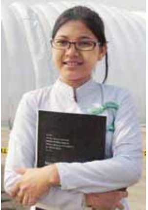
မဟေမာစိုး

မဟေမာစိုး(ကျောင်းသူဖောင်တော်ဦး ပရဟိတဘုန်းတော်ကြီးသင်ပညာရေး ကျောင်း) သမီးတို့ကျောင်းကနေ ဆိုလာ လေယာဉ်လေ့လာဖို့ စိစဉ်ပေးလို့ လာရောက်လေ့လာခြင်း ဖြစ်ပါတယ်။ အရင်က ဆိုလာရဲ့ ကောင်းကျိုးတွေ ကို စာအုပ်တွေထဲမှာပဲ လေ့လာခဲ့ ရတယ်။ နေရောင်ခြည်စွမ်းအင်နဲ့ သဘာဝပတ်ဝန်းကျင်ကို မထိခိုက်စေဘဲ ကောင်းကျိုးပြုစေတဲ့ အကြောင်းတွေ