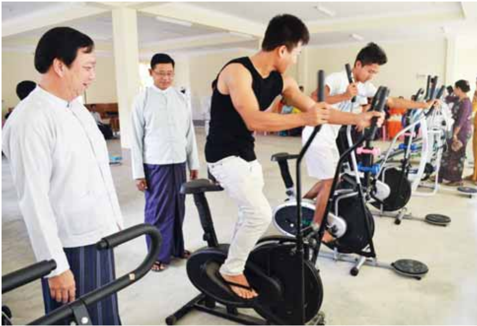
ကျောင်းသား ကျောင်းသူများ ကိုယ်ကာယကျန်းမာကြံ့ခိုင်ဖွံ့ဖြိုးရေး လေ့ကျင့်နေကြစဉ်။

မွေးမြူရေး၊ ရေလုပ်ငန်းနှင့် ကျေးလက်ဒေသဖွံ့ဖြိုးရေး ဝန်ကြီးဌာန ဒုတိယဝန်ကြီး ဒေါက်တာ အောင်မြတ်ဦးသည် မတ် ၁၈ ရက် နံနက် ၁၀ နာရီတွင် ဇေယျာသီရိ မြို့နယ် ရေဆင်းမွေးမြူရေးဆိုင်ရာ ဆေးတက္ကသိုလ်သို့ ရောက်ရှိပြီး ကျောင်းသား ကျောင်းသူများ နားနေဆောင်၌ ကျောင်းသားကျောင်းသူများ ကိုယ်ကာယကျန်းမာကြံ့ခိုင်ဖွံ့ဖြိုးစေရန်ရည်ရွယ်၍ အားကစားပစ္စည်းများ လှူဒါန်းပေးအပ်ခြင်း အခမ်းအနားသို့ တက်ရောက်၍ အားကစားပစ္စည်း အမျိုးအစားကိုမျိုး၊ အရေအတွက်အားဖြင့် ၃၉ ခုကို မွေးမြူရေးဆိုင်ရာဆေးတက္ကသိုလ်အားကစားကော်မတီသို့ လွှဲပြောင်းပေးအပ်ခဲ့သည်။