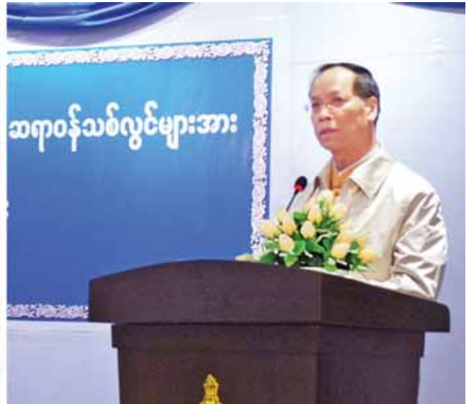
ဒုတိယသမ္မတ ဒေါက်တာစိုင်းမောက်ခမ်း ရှမ်းပြည်နယ်အစိုးရအဖွဲ့၏အစီအစဉ်ဖြင့် ခန့်အပ်ထားသော ဆရာဝန်သစ်လွင်များအား တာဝန်အပ်နှင်းခြင်းအခမ်းအနားတွင် အမှာစကားပြောကြားစဉ်။

အခမ်းအနားတွင် ရှမ်းပြည်နယ်ဝန်ကြီးချုပ်က နိုင်ငံတော်အနေဖြင့် ပြည်သူ့အားလုံး တစ်ပြေးညီ ကျန်းမာရေးစောင့်ရှောက်မှုရရှိစေရေးနှင့် ဒေသတွင်းနိုင်ငံများ နည်းတူ ကုသမှုပေးနိုင်ရန် စီစဉ်ဆောင်ရွက်လျက်ရှိကြောင်း၊ ထို့ပြင်နှစ်အလိုက် ခွင့်ပြုထုတ်ပြန်ပေးခြင်းဖြင့် ဆေးရုံ၊ ဆေးခန်း၊ ဆေးဝါးလိုအပ်ချက်များကို ပြည့်နယ်၊ ပြည့်မ မခွဲခြားဘဲ ဒေသအားလုံး ဟန်ချက်ညီညီတိုးတက်စေရန် ဖြည့်ဆည်းပေးလျက်ရှိပါကြောင်း၊ ဆေးရုံ၊ ဆေးခန်းများတိုးတက်လာသည်နှင့်အမျှ ကျန်းမာရေးဝန်ထမ်းခန့်ထားရေးကို ဆောင်ရွက်ပေးလျက်ရှိရာ ယခုဆိုလျှင် ပြည်နယ်အစိုးရအဖွဲ့၏ အစီအစဉ်ဖြင့် ရှမ်းပြည်မြောက်ပိုင်းဒေသတွက် ဆရာဝန် ၄၂ ဦး ခန့်ထားပေးနိုင်ပြီဖြစ်ပါကြောင်း၊ ယခု လုပ်ငန်းခွင်ဝင်ရောက်ကြမည့် ဆရာဝန်သစ်လွင်များကလည်း ပြည်သူ့ကျန်းမာရေးစောင့်ရှောက်မှုလုပ်ငန်းများကို စေတနာထားဆောင်ရွက်သွားကြစေလိုကြောင်းဖြင့် ပြောကြားသည်။ ထို့နောက် ကျန်းမာရေးဝန်ကြီးဌာန ဒုတိယဝန်ကြီး ဒေါက်တာဝင်းမြင့်က ရှမ်းပြည်နယ် လားရှိုးဒေသတွင် တာဝန်ထမ်းဆောင်ကြမည့် ဆရာဝန်သစ်လွင်များအနေဖြင့် မကြာမီလုပ်ငန်းခွင်သို့ဝင်ရောက်ပြီး ပြည်သူ့ကျန်းမာရေးစောင့်ရှောက်မှုများကို ဆောင်ရွက်ကြတော့မည်ဖြစ်ရာ ဆရာဝန်သစ်လွင်များအနေဖြင့် ပြည်သူများအား ကိုယ်ချင်းစာတရားထားရှိကြရန်၊ စေတနာ့အနစ်နာ၊