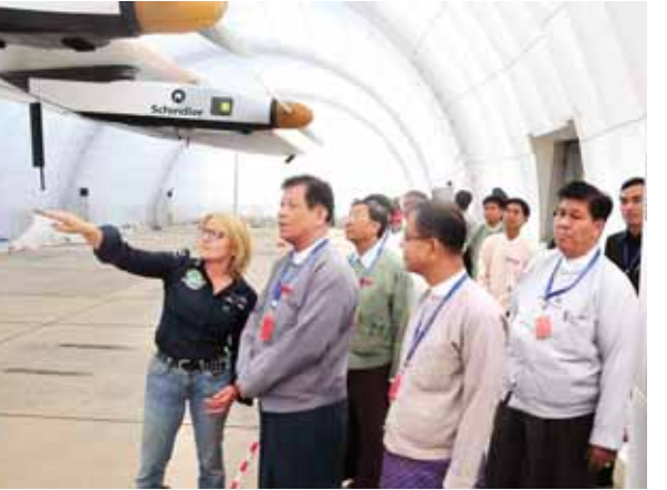
လေယာဉ်များနှစ်ဦးနှင့် တာဝန်ရှိသူများအား First Myanmar Investment နှင့် Yoma Strategic Holdings ကုမ္ပဏီက ယာယီစခန်းအတွင်း ညစာဖြင့် တည်ခင်းပေးခဲ့သည်။ (သတင်းစဉ်)

နေရောင်ခြည်စွမ်းအင်သုံးလေယာဉ် Solar Impulse-2 သည် မန္တလေးအပြည်ပြည်ဆိုင်ရာလေဆိပ်အတွင်း ရပ်နားလျက်ရှိသည့်နည်းတူ ဆိုလာ လေယာဉ်များနှင့် တာဝန်ရှိသူများကလည်း သန့်ရှင်းသည့် သဘာဝစွမ်းအင်ဖြင့် လူမှုစီးပွားဘဝများဖွံ့ဖြိုးတိုးတက်နိုင်သည်များကို လေ့လာသူများအား ဟောပြော လျက်ရှိသည်။