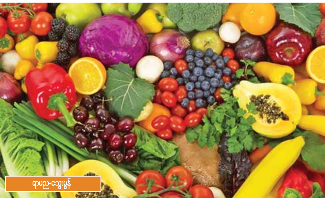
ရာမည-သွေးမွန်

ယင်းသို့သော လိုအပ်ချက်များ၊ မပြည့်စုံမှုများကြောင့် ဝင်ငွေရလမ်းနည်းပါးသည့် တောင်သူများ လယ်ယာလုပ်ငန်းခွင်ကို စွန့်လွှတ်ကာ အခြားသောဝင်ငွေရလမ်းများ မကျွမ်းကျင်သော အဝန်းအဝိုင်းသို့ မျက်ကန်းတောတိုး တိုးဝင်နေကြရသည်မှာလည်း အမှန်ပင်ဖြစ်ရာ မိမိတို့၏ဘဝ၊ မိမိတို့၏သိက္ခာကို ချွေဖွဲပွန်းတီးခံနေကြရသည့်အဖြစ်သာတည်း။ သို့သော်လည်း မိရိုးဖလာ လယ်ယာလုပ်သားရှားပါးလာမှု ပြဿနာ စိန်ခေါ်သည့် နိုင်ငံပြုပြင်