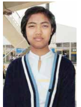
မအေးချမ်းအောင်

ကံရှိသောသူ (အပိုင်း-၂) ၅:၀၀ MRTV-4 ရုပ်သံဇာတ်လမ်းတွဲ 'ချစ်လူဆိုးမလေး'(အပိုင်း-၁၀) ၆:၁၅ MRTV-4 ရုပ်သံဇာတ်လမ်းတွဲ 'မိခင်နှစ်ဦးရဲ့မေတ္တာ'(အပိုင်း-၅၉) ၇:၄၅ မြန်မာ့ရုပ်သံဇာတ်လမ်းတွဲ 'ကံကံ၏ အကျိုး' [ဖြူစင်ခြင်းအားမာန်(အပိုင်း-၁)] MRTV-4 ရုပ်သံဇာတ်လမ်းတွဲ 'အိုအေစစ်ကမ္ဘာလေး'(အပိုင်း-၁၆) ၈:၃၀ Spain Lliga Barcelona Vs Real Madrid (LIVE) ၉:၃၀