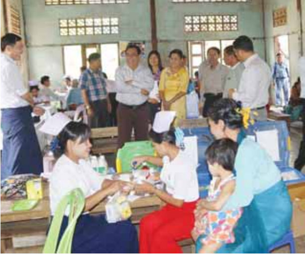
နှင့် လိုအပ်ချက်များကို သက်ဆိုင်ရာ ဝန်ကြီးချုပ်နှင့် တာဝန်ရှိသူများနှင့် ညှိနှိုင်းဆွေးနွေး တိုင်းဒေသကြီး(ပြန်/ဆက်)

ဆက်လက်၍ တိုင်းဒေသကြီးဝန်ကြီးချုပ်နှင့် တာဝန်ရှိသူများသည် ကလစ်ကြီးကျေးရွာသို့ လည်းကောင်း၊ တောင်သုံးလုံးကျေးရွာသို့လည်းကောင်း၊ ကျေးသားအင်းကျေးရွာသို့လည်းကောင်း၊ အထက်မြေးခံဘော်ကျေးရွာသို့လည်းကောင်း ရောက်ရှိပြီး ဒေသ၏အခက်အခဲများ