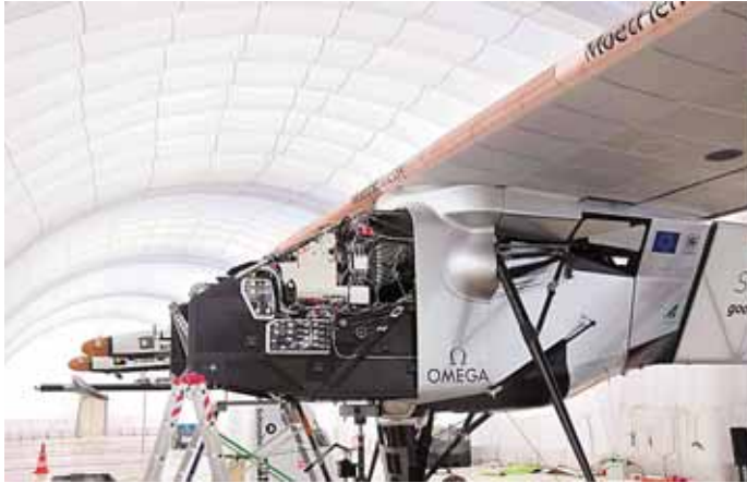
များအား ပရိဂျက်တာဖြင့် ပြသရှင်းလင်းမှု Mobile Hangar အတွင်းထားရှိသည့် နေရောင်ခြည်စွမ်းအင်သုံးလေယာဉ် Solar Impulse-2 နှင့် လေ့လာနေသည့် ပြည်သူများအား အားပေးကြည့်ရှုသည်။ အဆိုပါ နေရောင်ခြည်စွမ်းအင်သုံးလေယာဉ် Solar Impulse - 2

အလားတူ ညနေ ၃ နာရီခွဲတွင် ပြည်ထောင်စုဝန်ကြီးဌာန ပြည်ထောင်စုဝန်ကြီး ဒုတိယပိုင်းချုပ်ကြီးကိုကိုသည် တာဝန်ရှိသူများနှင့်အတူ ယာယီစခန်း (Event Tent) အတွင်း နေရောင်ခြည်စွမ်းအင်သုံးလေယာဉ်ဆိုင်ရာ အချက်အလက်