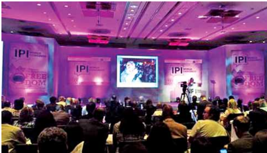
အပြည်ပြည်ဆိုင်ရာ စာနယ်ဇင်းအဖွဲ့အစည်း၏ ကမ္ဘာ့ညီလာခံ (၂၀၁၄) ကျင်းပခဲ့စဉ်က တွေ့ရစဉ်။

မြန်မာနိုင်ငံ၌ ကျင်းပမည့် IPI ကမ္ဘာ့ညီလာခံ၏ ရည်ရွယ်ချက်များမှာ IPI ၏ ကမ္ဘာ့ညီလာခံမှရရှိသော အခွင့်အလမ်းကို ထိရောက်စွာအသုံးပြုကာ ဒေသတွင်း သတင်းလွတ်လပ်မှုအပေါ် အကျိုးသက်ရောက်စေသည့် စာနယ်ဇင်းဆိုင်ရာ ပြဿနာအချို့ကို ဖြေရှင်းရန်၊ မီဒီယာ လွတ်လပ်မှု၊ လွတ်လပ်စွာထုတ်ဖော်ပြောဆိုခွင့် စာနယ်ဇင်း ကျင့်ဝတ်များဆိုင်ရာ ကုလသမဂ္ဂလူ့အခွင့်အရေးဆိုင်ရာ ကြေညာချက်ပါ ရပိုင်ခွင့်အတွက် ပလက်ဖောင်းတစ်ခု ဖန်တီးရာတွင်လည်းကောင်း၊ ပညာရပ်ဆိုင်ရာ ကျွမ်းကျင်မှုများ ဖလှယ်ရေးအတွက် စာနယ်ဇင်းသမားများအား ပေါင်းစုတွေ့ဆုံပေးရေးတွင်လည်းကောင်း လုပ်ငန်းအထ