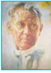
တက္ကသိုလ်ဘုန်းနိုင်

တစ်ကြောင်းမှာ အထက်၌ ကျွန်တော် ဖော်ပြပြီးခဲ့သည့် အတိုင်း ကောလိပ်ကျောင်းပိတ်သော်လည်းကိုကိုသည် အိမ်သို့ မှန်မှန်ပြန်လာတတ်သည်မဟုတ်။ သူ၏ သမဂ္ဂဆို တာကြီး၌သာ အလုပ်များနေတတ်သူဖြစ်သည်။ သမဂ္ဂ ဆိုတာသည် အဘယ်နည်းဟု ခိုင်က မမမြင်ကို မေးပေး မည် ကတိရှိခဲ့သည်။ သို့ရာတွင် မမမြင်သာ ကောလိပ် ကျောင်းပြန်သွားသည်။ ခိုင်က မမေးမိ။ ထို့ကြောင့် သမဂ္ဂ ဆိုတာကြီးသည် အဘယ်နည်းဟု ခိုင်လည်း မသိ။ ကျွန်တော် လည်းမသိ။ ကိုကိုပြန်လာသော ထိုနှစ်သည် ကျွန် တော်