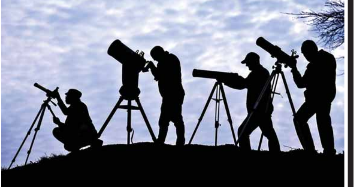
စပိန်နိုင်ငံ၌ နေကြတ်မှုကို ပြည်သူများ စိတ်ဝင်တစားကြည့်ရှုကြစဉ်။

အောင်ပွဲခံသူနေတန်ယာဟု အစွဲရေးဒီမိုကရေစီ အခင်းအကျင်း၏ ရှုခင်းတစ်ရပ်အဖြစ် အထွေထွေရွေးကောက်ပွဲကို ရှုလတ်သော် အောင်ပွဲခံနေသူ ဘင်ဂျမင်နေတန်ယာဟုကို တွေ့မြင်ရလေ၏။ မတ် ၁၇ ရက်က ကျင်းပသော ရွေးကောက်ပွဲ၌ လက်ရှိအာဏာရ နေတန်ယာဟု၏ လီကွတ်ပါတီက အောင်ပွဲခံခဲ့သည်။ မဲအများစုရေတွက်ပြီးစီးချိန်တွင် လီကွတ်ပါတီက ပါလီမန်တွင် အမတ်နေရာ ၃၀ ထက်မနည်း ရရှိထားရာ ၎င်းအနေဖြင့် စတုတ္ထမြောက် ဝန်ကြီးချုပ် ရာထူးသက်တမ်းကို ရယူနိုင်ရန် လမ်းပွင့်သွားသည်။ အတိုက်အခံခေါင်းဆောင် အိုင်ဇက်ဟာဂျေ၏ ဇီယွန်နစ်ယူနီယံ ပါတီမှာမူ အမတ်နေရာ ၂၄ နေရာနှင့်သာ ကျေနပ်လိုက်ရသည်။