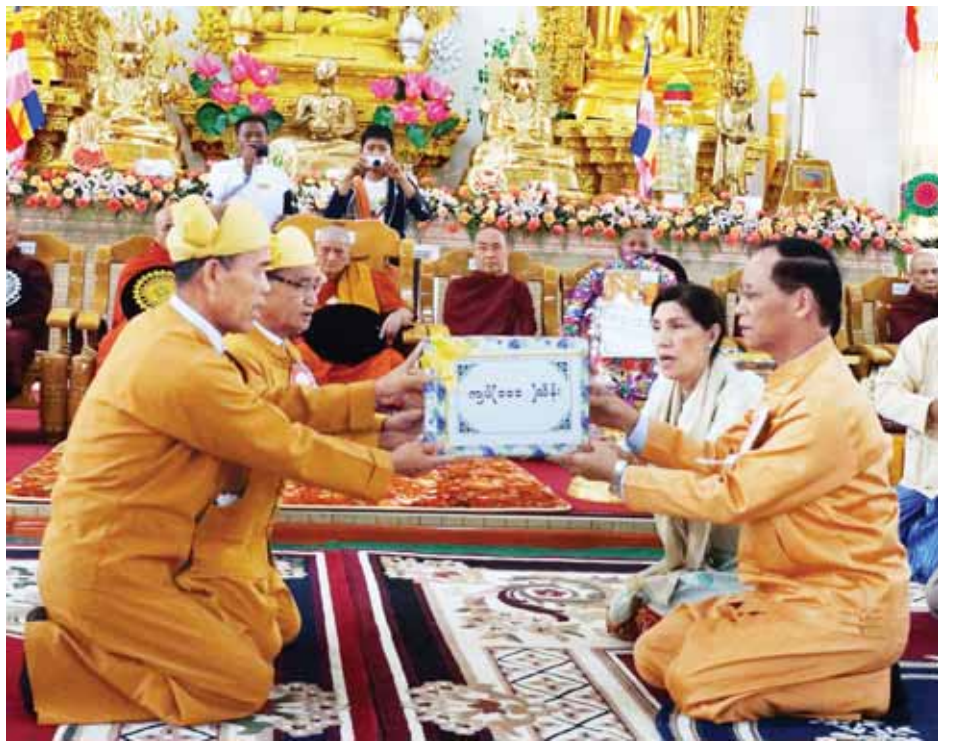
ဒုတိယသမ္မတ ဒေါက်တာစိုင်းမောက်ခမ်းနှင့် ဇနီး ဒေါ်နန်းရွှေမူန် အလှူငွေကျပ် သိန်း ၁၀၀ကို ဂေါပကအဖွဲ့ဥက္ကဋ္ဌ ဦးဆန်မန်ထံပေးအပ်စဉ်။

ဆက်လက်၍ ဒုတိယသမ္မတနှင့်ဇနီးက အရာမကသံဃိကဒါနအဖြစ် သုခဝိဟာရကန်မိန်းဓမ္မာရုံတော်ကြီးနှင့် လှူဖွယ်ဝတ္ထုပစ္စည်းများကို ကန်မိန်းကျောင်း ဆရာတော်ထံ