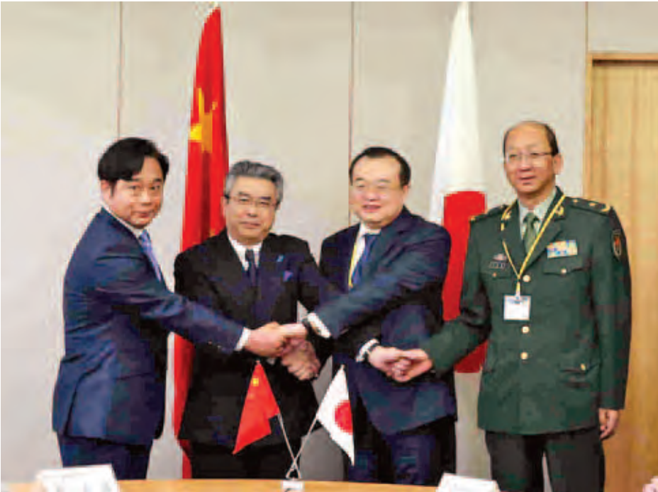
တရုတ်နှင့် ဂျပန်နိုင်ငံတို့သည် အရှေ့တရုတ်ပင်လယ်ရှိ ပိုင်နက်နယ်မြေ အငြင်းပွားနေသော ကျွန်းများအနီး စစ်လေယာဉ်များ အပြန်အလှန် ဝဲယှက်ကာ အင်အားပြသည့် ဖြစ်ရပ်များ ရှိခဲ့သည်။

တရုတ်နှင့် ဂျပန်နိုင်ငံတို့သည် လေးနှစ်အတွင်း ပထမဆုံးအကြိမ် လုံခြုံရေးဆိုင်ရာ ဆွေးနွေးပွဲကို မတ် ၁၉ ရက်က ကျင်းပခဲ့ကြကြောင်း၊ ကမ္ဘာစစ်ကာလအတွင်းက ဂျပန်နိုင်ငံ၏ ကျူးကျော်မှုများနှင့် ပတ်သက်၍ လည်းကောင်း၊ ပင်လယ်ရေကြောင်း ပိုင်နက်နယ်မြေ အငြင်းပွားမှုနှင့် ပတ်သက်၍လည်းကောင်း ဆက်ဆံရေး ထိခိုက်မှုများ ရှိခဲ့လျှင်ကစား နှစ်နိုင်ငံဆက်ဆံရေး ပြန်လည်မြှင့်တင်ရန် သဘောတူညီကြကြောင်း ဒေသဆိုင်ရာ သတင်းဌာနများက မတ် ၂၀ ရက်တွင် သတင်းထုတ်ပြန်သည်။