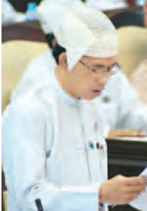
အမျိုးသားလွှတ်တော် ဥပဒေကြမ်းကော်မတီဥက္ကဋ္ဌ ဦးခင်မောင်ရီ။

လွှတ်တော်သည် အမျိုးသားပညာရေးဥပဒေကို ပြည်ထောင်စုလွှတ်တော်ဥပဒေအမှတ် ၄၁/၂၀၁၄ ဖြင့် ၃၀-၉-၂၀၁၄ ရက်နေ့တွင် ပြဋ္ဌာန်းခဲ့ပါကြောင်း၊ သို့ရာတွင် ယင်းဥပဒေကို ပြင်ဆင်ပေးရန်အတွက် ဒီမိုကရေစီပညာရေးလှုပ်ရှားမှု ဦးဆောင်ကော်မတီ (ကျောင်းသားအဖွဲ့)က တောင်းဆိုပြီးနောက် (၄)ပွင့်ဆိုင် အစည်းအဝေး သဘောတူညီချက်အရ အမျိုးသားပညာရေး ဥပဒေကို ပြင်ဆင်သည့် ဥပဒေကြမ်းအား ပြည်ထောင်စု အစိုးရအဖွဲ့၏ သဘောတူညီချက်ဖြင့် ပညာရေးဝန်ကြီးဌာနက ၁၇-၂-၂၀၁၅ ရက်တွင် ပြည်ထောင်စုလွှတ်တော်သို့ တင်သွင်းခဲ့ပါကြောင်း၊ ပြင်ဆင်သည့် ဥပဒေကြမ်းကို အမျိုးသားလွှတ်တော်၌ စတင်ဆွေးနွေးရန် ပြည်ထောင်စု