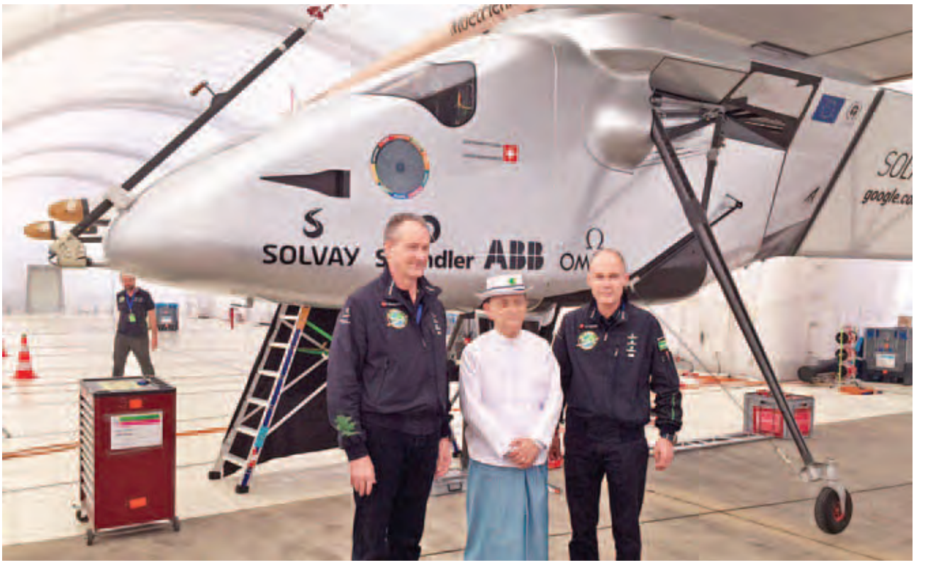
နိုင်ငံတော်သမ္မတ ဦးသိန်းစိန် လေယာဉ်မှူးများနှင့်အတူ မှတ်တမ်းတင်ဓာတ်ပုံရိုက်စဉ်။ (သတင်းစဉ်)

ထိုသို့ ကမ္ဘာတစ်ပတ် ဖြတ်သန်းပျံသန်းပြီး ရပ်နားရာဒေသများတွင် Solar impulse-2 တီထွင်ခဲ့သည့် ဆွစ်ဇာလန်နိုင်ငံ၏ ဆန်းသစ်တီထွင်မှု အတွေ့အကြုံ နှင့် နည်းပညာများကို ပြန်လည်မျှဝေသွားမည်ဟု သိရသည်။ ထိုသို့ မြန်မာနိုင်ငံ မန္တလေးမြို့တွင် သုံးရက်ကြာ ရောက်ရှိရပ်နားပြီး မိဒီယာတွေ့ဆုံပွဲများနှင့် ဆွေးနွေးပွဲများကို ပြုလုပ်မည်ဖြစ်သည်။