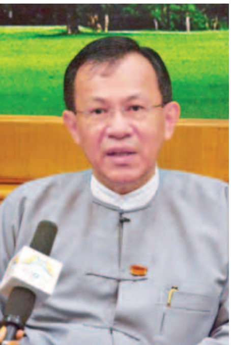
လုပ်ငန်းလုပ်ဖို့အတွက်ဖြစ်စေ နိုင်ငံတွင်းမှာ ဝယ်လို့ရတဲ့ ပစ္စည်းတွေ အားလုံးကိုဝယ်မှာဖြစ်တော့ နိုင်ငံတွင်းမှာ ထုတ်လုပ်တဲ့ ကုန်စည်တွေရဲ့ ဝယ်လို့အားတွေ တက်လာမှာ ဖြစ်ပါတယ်။

ဒေါက်တာကံဇော် ပြည်ထောင်စုဝန်ကြီး အမျိုးသားစီမံကိန်းနှင့် စီးပွားရေးဖွံ့ဖြိုးတိုးတက်မှု ဝန်ကြီးဌာနအနေနှင့် တစ်ပိုင်းက နိုင်ငံတော်ရဲ့ အမျိုးသား စီမံကိန်းဖြစ်တဲ့ နှစ်စဉ်အမျိုးသားစီမံကိန်း၊ ငါးနှစ်ကာလ တို စီမံကိန်းများ၊ ဒေသန္တရဖွံ့ဖြိုးရေးစီမံကိန်းများ၊ ကာလ ရှည် အမျိုးသားဘက်စုံဖွံ့ဖြိုးရေး စီမံကိန်းလိုအပ်တဲ့ နှစ်(၂၀)၊ နှစ်(၃၀) စီမံကိန်းများနဲ့ မျှော်မှန်းချက်များကို စီမံကိန်းရေးဆွဲခြင်း၊ ကြီးကြပ်ခြင်းနဲ့ အကောင်အထည် ဖော်ခြင်းကို ဆောင်ရွက်နေပြီး နောက်တစ်ပိုင်းကတော့ နိုင်ငံတကာနဲ့ ဆက်ဆံဆောင်ရွက်တဲ့အခါမှာ နိုင်ငံခြား စီးပွားဆက်သွယ်ရေးဦးစီးဌာနအနေနဲ့ လည်းကောင်း၊ ရင်းနှီးမြှုပ်နှံမှုနှင့် ကုမ္ပဏီများညွှန်ကြားမှု ဦးစီးဌာနအနေ နဲ့လည်းကောင်း နိုင်ငံတကာနဲ့ နိုင်ငံခြားဆက်ဆံဆက်သွယ် ပူးပေါင်းဆောင်ရွက်မှု၊ ညှိနှိုင်းမှု၊ ရင်းနှီးမြှုပ်နှံမှုတို့ အတွက် အခွင့်အလမ်းတွေဖန်တီးပေးတဲ့ ရင်းနှီးမြှုပ်နှံမှု ခွင့်ပြုမိန့်(ပါမစ်)တွေ ထုတ်ပေးခြင်း၊ နိုင်ငံခြားရင်းနှီး မြှုပ်နှံမှုလုပ်ငန်းများကို မြန်မာနိုင်ငံသားများ ရင်းနှီးမြှုပ်နှံ မှု ဥပဒေ၊ နိုင်ငံခြားရင်းနှီးမြှုပ်နှံမှုဥပဒေ အစရှိသည့် ဥပဒေများနှင့်အညီ ခွင့်ပြုပေးခြင်း စတဲ့လုပ်ငန်းတွေကို ဆောင်ရွက်နေပါတယ်။