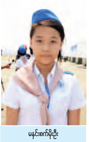
မနင်းစက်မိုးဦး

နည်းပညာအသစ်အဆန်းတွေနဲ့ ပတ်သက်တဲ့ ဗဟုသုတတွေ ရရှိပါတယ်။ နည်းပညာသစ်တွေက အလွန်စိတ်လှုပ်ရှားစရာကောင်းပါတယ်။ အခု ကျောင်းသား ၁၀၀ ကျော်နဲ့ လာရောက်လေ့လာခြင်းဖြစ်ပါတယ်။