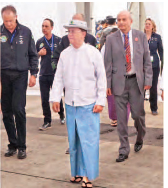
နိုင်ငံတော်သမ္မတ ဦးသိန်းစိန် နေရောင်ခြည်စွမ်းအင်သုံး လေယာဉ် Solar impulse-2 အား ကြည့်ရှုစဉ်။ (သတင်းစဉ်)