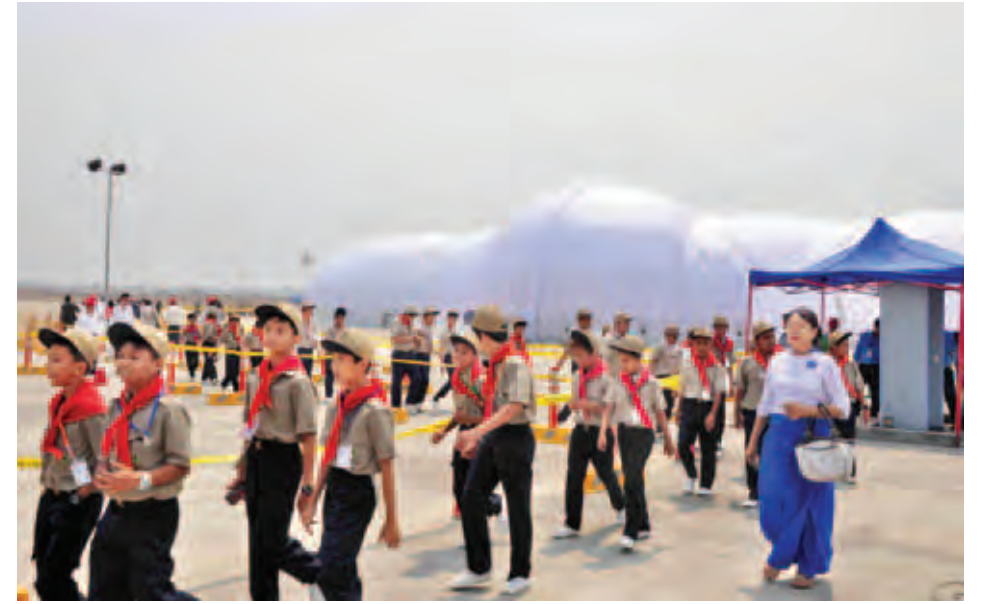
မန္တလေးအပြည်ပြည်ဆိုင်ရာလေဆိပ် (တံတားဦး)၌ ကမ္ဘာပတ်နေရောင်ခြည်စွမ်းအင်သုံး Solar Impulse-2 လေယာဉ်အား ကျောင်းသား ကျောင်းသူများ၊ ကင်းထောက်လူငယ်မောင်မယ်များနှင့် စိတ်ပါဝင်စားသူ ပြည်သူအများအပြား လာရောက်လေ့လာကြည့်ရှုကြစဉ်။