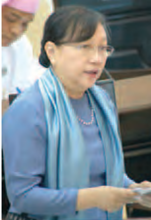
ပညာရေးဝန်ကြီးဌာန ပြည်ထောင်စုဝန်ကြီး ဒေါက်တာ ဒေါ်ခင်စန်းရီ။

အမျိုးသားလွှတ်တော် ၃၁ ရက်မြောက်နေ့ အစည်းအဝေးကို ယနေ့ မွန်းလွဲ ၂ နာရီတွင် နေပြည်တော်ရှိ အမျိုးသားလွှတ်တော် အဆောက်အအုံ အစည်းအဝေးခန်းမ၌ကျင်းပရာ ပညာရေးဝန်ကြီးဌာန ပြည်ထောင်စုဝန်ကြီး ဒေါက်တာဒေါ်ခင်စန်းရီက အမျိုးသားပညာရေး ဥပဒေကို ပြင်ဆင်သည့် ဥပဒေကြမ်းအား အမျိုးသားလွှတ်တော်တွင် ဆွေးနွေးစဉ်းစားရန် အဆိုတင်သွင်းရာ လွှတ်တော်က လက်ခံဆွေးနွေးရန် သဘောတူကြောင်း ဆုံးဖြတ်ခဲ့သည်။