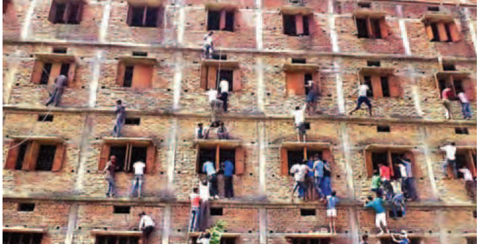
စာမေးပွဲဖြေဆိုနေသည့် ကျောင်းသားများအား မသမာသော နည်းလမ်းများဖြင့် ကူညီပေးနေသော မိဘများအား တွေ့ရစဉ်။