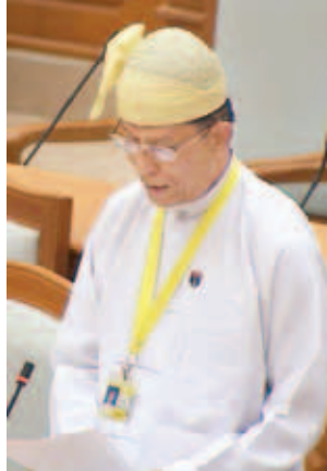
ဘဏ္ဍာရေးဝန်ကြီးဌာန ဒုတိယဝန်ကြီး ဒေါက်တာလင်းအောင်။

Sharing, Resource Sharing, Tax Sharing)တို့နှင့်ပတ်သက်၍ အကြံပြုညှိနှိုင်းတောင်းဆိုတင်ပြချက်များအပေါ် ပြည်ထောင်စုဝန်ကြီးဌာနများအနေဖြင့် ဥပဒေဟောင်းများကို ဖျက်သိမ်းပြီး အသစ်ရေးဆွဲရာတွင် ထည့်သွင်းဆောင်ရွက်ရန် (သို့မဟုတ်) မရှိသေးသည့်ဥပဒေဖြစ်ပါက ဥပဒေအသစ်ရေးဆွဲ၍ ထည့်သွင်းပေးရန်၊ ရှိပြီးသားဥပဒေတွင် ပြည့်စုံစက်ချက် Amendment ဖြင့် ထည့်ရန်၊ နည်းဥပဒေရေးဆွဲရာတွင် ထည့်သွင်းသွားရန်နှင့် ပြည်ထောင်စုဝန်ကြီးဌာနများကသာ ဆက်လက်တာဝန်ယူရန်ဖြစ်ပါက ပြည်ထောင်စုမှသာ ဆက်လက်ဆောင်ရွက်ရန်ဖြစ်ကြောင်း ဖော်ပြရန်မူအားဖြင့် ညှိနှိုင်းဆုံးဖြတ်ထားရှိပါကြောင်း။