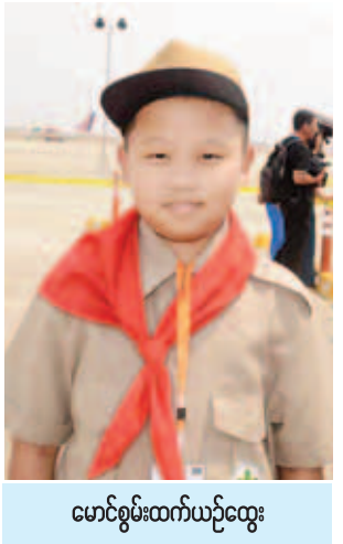
မောင်စွမ်းထက်ယဉ်ထွေး

မစ္စတာ ဒဂရွတ်ဘာဂျန်နာ မြန်မာနိုင်ငံဆိုင်ရာဆွစ်ဇာလန်နိုင်ငံသံအမတ်ကြီး နေရောင်ခြည်စွမ်းအင်သုံးလေယာဉ်ဆိုတဲ့စိတ်ကူးရဲ့အစဟာ ဆွစ်ဇာလန် နိုင်ငံက စတင်တာပါ။ ကျွန်တော်တို့လေယာဉ်မျိုးတွေဟာ လေယာဉ်ချည်းပဲ သယ်လာတာမဟုတ်ပါဘူး။ စွန့်ဦးတီထွင်လိုစိတ်တွေ၊ သဘာဝပတ်ဝန်းကျင်ဆိုင်ရာ အတွေးအမြင်တွေနဲ့ သဘာဝပတ်ဝန်းကျင်ကို မျိုးစေ့ချပေးမယ်ဆိုတာတွေပါ သယ်ဆောင်လာခဲ့တာပါ။ စိတ်ကူးစိတ်သန်းတွေ၊ စွမ်းအင်ကဏ္ဍတွေမှာ ပြန်လည်