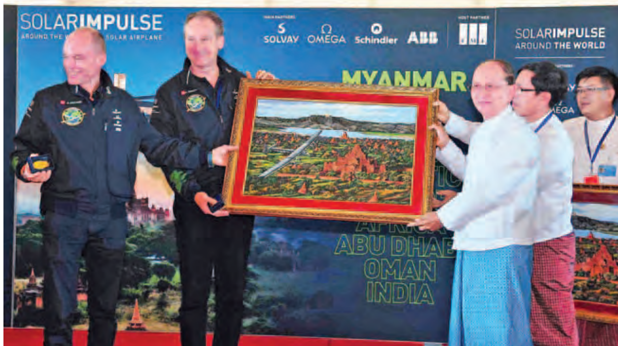
နိုင်ငံတော်သမ္မတ ဦးသိန်းစိန် နေရောင်ခြည်စွမ်းအင်သုံး လေယာဉ် Solar impulse-2 လေယာဉ်မှူးများအား အမှတ်တရလက်ဆောင်ပစ္စည်းပေးအပ်စဉ်။ (သတင်းစဉ်)