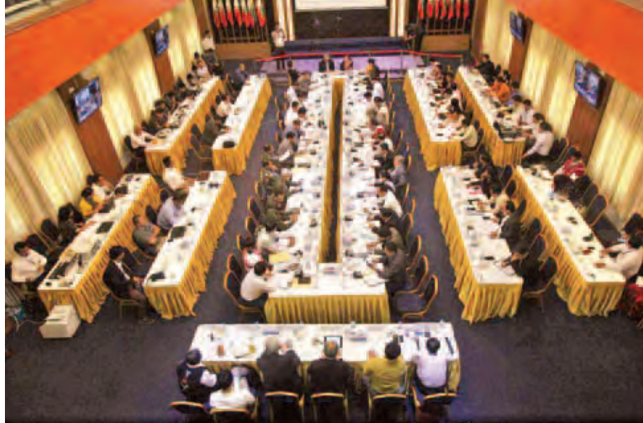
တစ်နိုင်ငံလုံးပစ်ခတ်တိုက်ခိုက်မှုရပ်စဲရေးစာချုပ်အတွက် (၇)ကြိမ်မြောက် အစည်းအဝေး စတုတ္ထနေ့ ကျင်းပစဉ်။

မတ် ၁၉ ရက်တွင် စက်စကမ်းခြေ၌ ကျင်းပသည့် (၄၁)နှစ်မြောက် မွန်ပြည်နယ်နေ့အထိမ်းအမှတ် ပျော်ပွဲရွှင်ပွဲများ၊ အားကစားပြိုင်ပွဲများသို့ အနယ်နယ်အရပ်ရပ်မှ လာရောက်ကြသည့် ပြည်တွင်း ပြည်ပမှ ခရီးသွားများ၊ ဒေသခံပြည်သူများဖြင့် အထူးစည်ကားလျက်ရှိကြောင်း သတင်းရရှိသည်။ (သတင်းစဉ်)