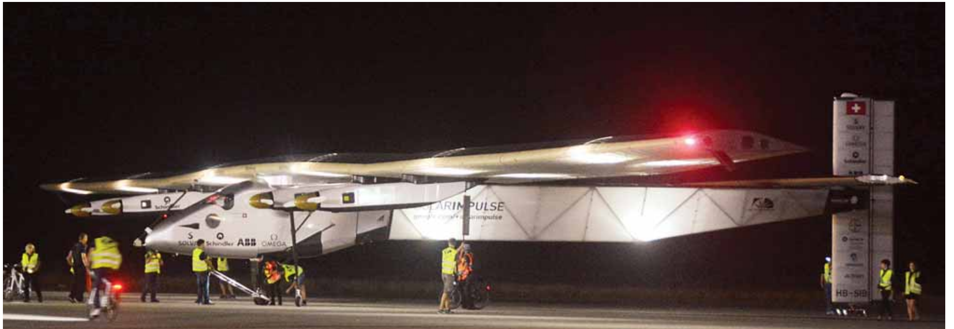
နေရောင်ခြည်စွမ်းအင်သုံးလေယာဉ် Solar Impulse-2 အား မန္တလေးအပြည်ပြည်ဆိုင်ရာလေဆိပ်၌ တွေ့ရှိစဉ်။ (သတင်းစဉ်)