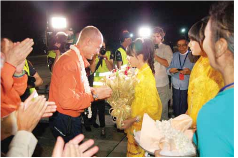
နေရောင်ခြည်စွမ်းအင်သုံးလေယာဉ် Solar Impulse-2 မှ လေယာဉ်မှူးအား မင်္ဂလာပန်းစည်းပေးအပ်စဉ်။ (သတင်းစဉ်)