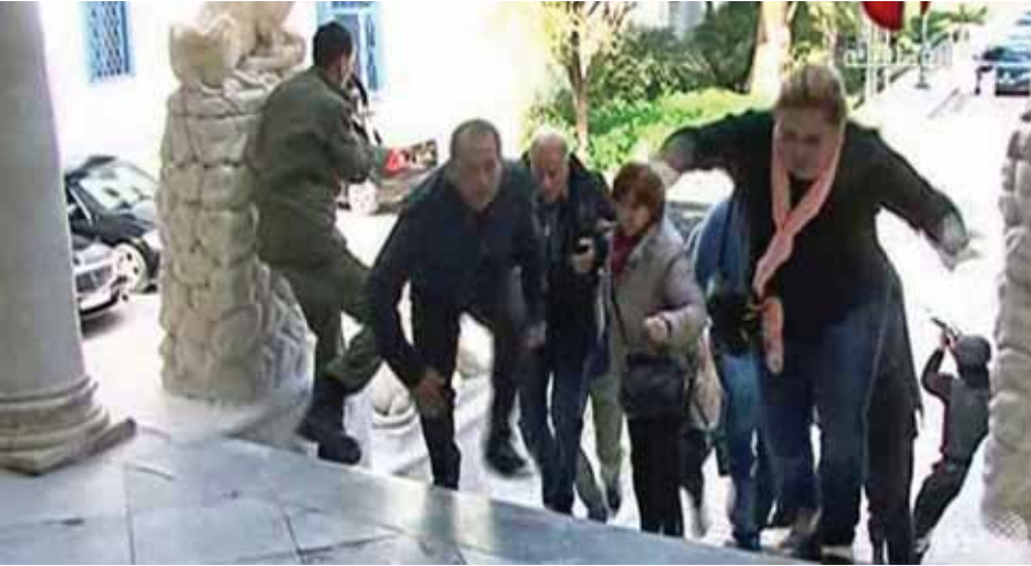
ပစ်ခတ်မှုကြောင့် ထွက်ပြေးတိမ်းရှောင်လာသူများကို တွေ့ရစဉ်။

တူနီးရှားနိုင်ငံ 'ဘာဒို' အမျိုးသားပြတိုက်တွင် နိုင်ငံခြားသားဧည့်သည်များအား သေနတ်ဖြင့် ပစ်ခတ်မှုနှင့် ပတ်သက်ပြီး လူကိုးဦးအား အာဏာပိုင်များက ဖမ်းဆီးလိုက်ပြီဖြစ်သည်။