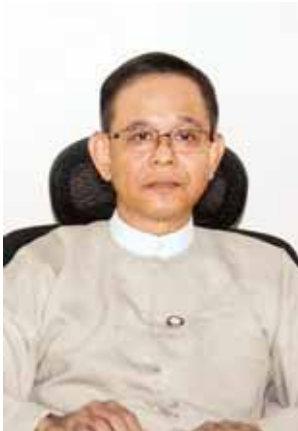
မန္တလေးတိုင်းဒေသကြီး ဝန်ကြီးချုပ် ဦးရဲမြင့်။

ဖြေ။ ။ ပြီးခဲ့တဲ့ဖေဖော်ဝါရီလထဲက နေရောင်ခြည်စွမ်းအင်သုံးလေယာဉ် Solar Impulse-2 က မန္တလေးမှာ ဆင်းမယ်ဆိုတာ နောက်ဆုံးအတည်ပြု ချက်ပါပဲ။ အဲဒီအတွက်လည်း အစည်း အဝေးလုပ်ပါတယ်။ ကျွန်တော်တို့အိမ်က တိုင်းဒေသကြီး ဝန်ကြီး ဦးကျော်ဆန်း တက်ရောက်ခဲ့ပါတယ်။ ဒါကစနစ် တကျနဲ့ သေသေချာချာကြိုဆိုဖို့ ကိစ္စ တွေ လုံခြုံရေးကိစ္စတွေ ဆောင်ရွက်ဖို့ အသေးစိတ် မှာကြားတာတွေရှိပါတယ်။ ကျွန်တော်တို့ဘက်အပိုင်းက လေယာဉ်ဆင်းသက် လာတဲ့ အခါ ပြည်သူတွေ အများကြီးလာကြည့်မယ် လို့ မျှော်လင့်ထားတယ်။ လေယာဉ်ကို အနှောင့်အယှက် မဖြစ်ရအောင် ကျွန်တော်တို့ စဉ်းစားထားတယ်။ မန္တလေးမှာ ဆင်းမယ်ဆိုတော့ မန္တလေး ရဲ့ ပြယုဂ်တစ်ခုအနေနဲ့ သေချာလေး ကြိုဆိုဖို့ စီစဉ်ထားတယ်။ နောက်ဆုံး အစီအစဉ်တစ်ခုကတော့ ပြသရေးမှာ ဆွစ်ဇာလန် သံရုံးကိုယ်စားလှယ် တာဝန်ယူနေတဲ့ FMI ကုမ္ပဏီတွေနဲ့ ကျွန်တော်ရုံးမှာ အစည်းအဝေးလုပ် တယ်။ အစည်းအဝေးမှာ သူတို့ဘက်က လိုလားချက်ဘာရှိသလဲ၊ ကျွန်တော်တို့ ဘက်က ဘာဖြည့်ဆည်းပေးရမလဲဆို တာတွေကို ဆွေးနွေးပါတယ်။ ပြသတဲ့ အစီအစဉ်မှာ ရန်ကုန်၊ မန္တလေးအပါ အဝင် အခြားမြို့တွေကပါ လာပြီးလေ့ လာလို့ရအောင် စီစဉ်စေချင်တယ်။ အထူးသဖြင့် နည်းပညာတက္ကသိုလ်နဲ့ ကွန်ပျူတာတက္ကသိုလ်တွေက ကျောင်း သား ကျောင်းသူတွေ လေ့လာနိုင် အောင်စီစဉ်မယ်။ လူမှုရေးအသင်း