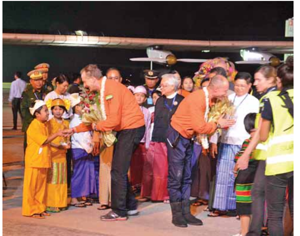
နေရောင်ခြည်စွမ်းအင်သုံးလေယာဉ်မှ လေယာဉ်မှူးများအား မန္တလေးအပြည်ပြည်ဆိုင်ရာလေဆိပ်၌ ကြိုဆိုကြသူများနှင့်အတူ တွေ့ရစဉ်။ (သတင်းစဉ်)