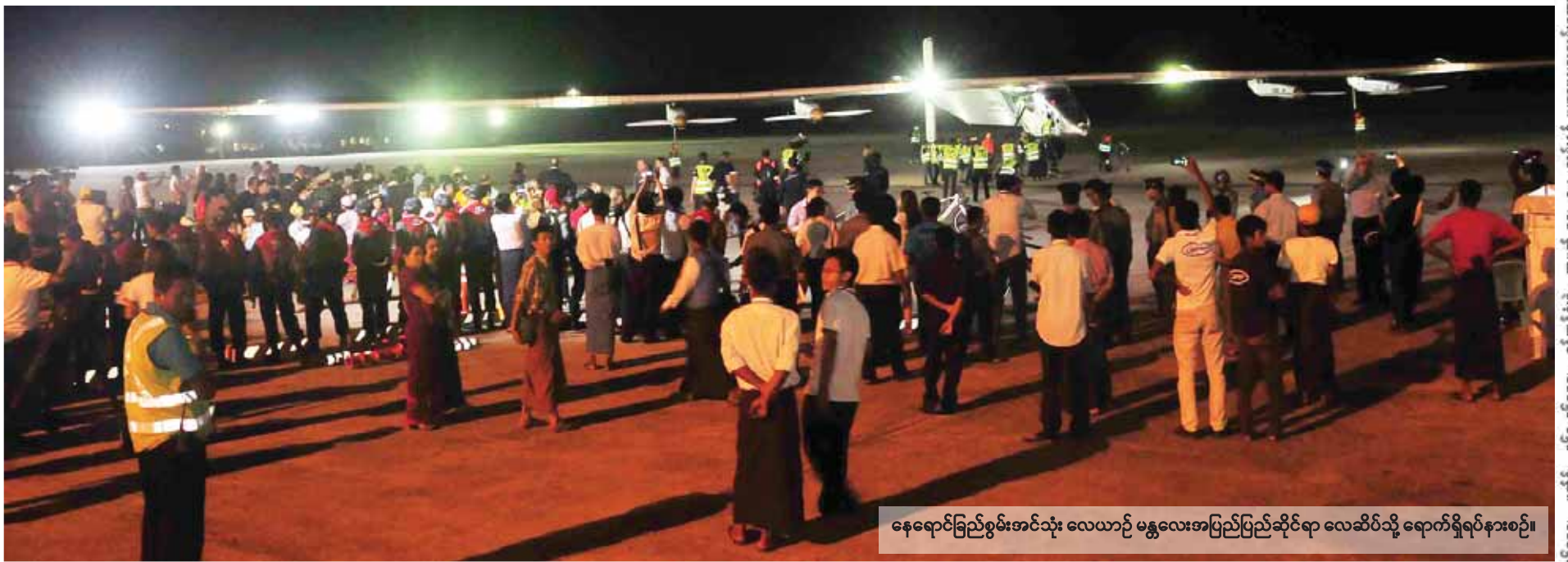
နေရောင်ခြည်စွမ်းအင်သုံး လေယာဉ် မန္တလေးအပြည်ပြည်ဆိုင်ရာ လေဆိပ်သို့ ရောက်ရှိရပ်နားစဉ်။