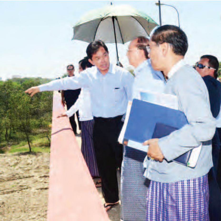
နိုင်ငံတော်သမ္မတ ဦးသိန်းစိန် ပန်းလှိုင်မြစ်ကြောင်းပြန်လည်တူးဖော်ရေးစီမံကိန်းတွင် စက်ယန္တရားများဖြင့် ဆောင်ရွက်နေမှုကို ကြည့်ရှုစစ်ဆေးစဉ်။

ဆက်လက်၍ နိုင်ငံတော်သမ္မတက တစ်နှစ်ကိုသုံးသီးစိုက်ပျိုးနိုင်တော့မည်ဖြစ်၍ ကျေးလက်လူမှုစီးပွားဘဝဖွံ့ဖြိုးတိုးတက်လာတော့မည်ဖြစ်ကြောင်း၊ ကလေးများကို ပညာတတ်များဖြစ်အောင် သင်ကြားပေးရန်လိုကြောင်း၊ ပညာတတ်မှစဉ်းစားချင့်ချိန်နိုင်ရုံမက လူမှုစီးပွားဖွံ့ဖြိုးတိုးတက်အောင် လုပ်ဆောင်နိုင်မည်ဖြစ်ကြောင်း၊ ယခု ကသပေါင်းကျေးရွာတွင် စာမျက်နှာ ၃ ကော်လံ ၁ သို့ *