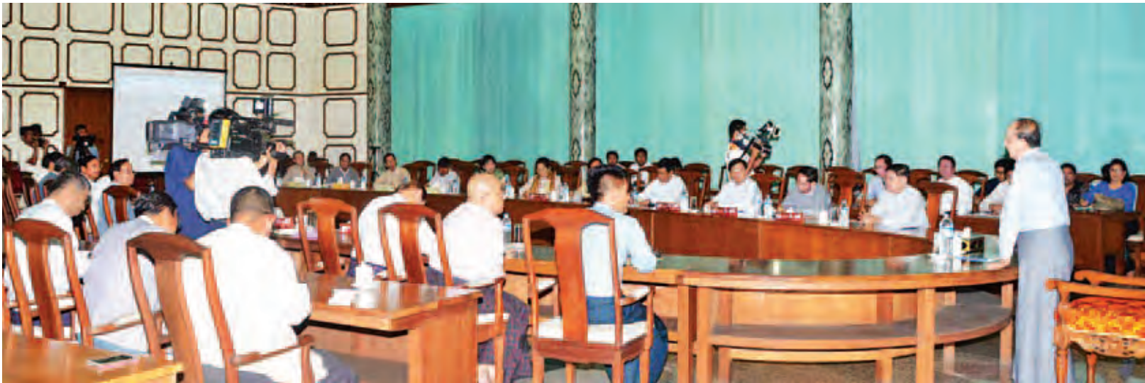
အမှုဆောင် အဖွဲ့ဝင်များ တက်ရောက်ကြသည်။ (သတင်းစဉ်)