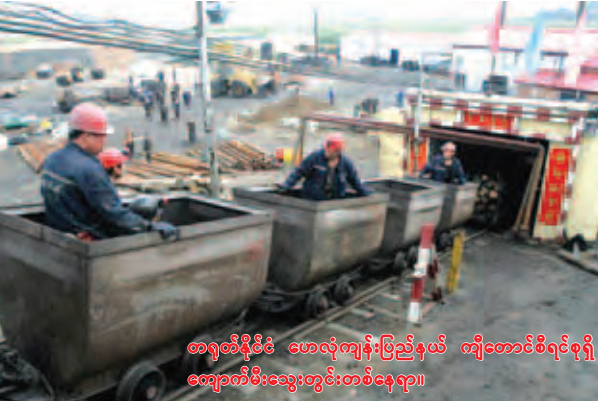
တရုတ်နိုင်ငံ ဟေလုံကျွန်းပြည်နယ် ကျောက်မီးသွေးတွင်းတစ်ခုခုမှာ ရာခိုင်နှုန်းကို ကျောက်မီးသွေးမှ ရရှိလေသည်။ နိုင်ငံတော်၏ စီးပွားရေးဖွံ့ဖြိုးတိုးတက်မှုအတွက် လုပ်ဆောင်ကြရာတွင် လုပ်သားများ၏ အသက်ကို တန်ဖိုးထားကြရမည်ဖြစ်ပြီး ခန္ဓာဖြင့် ပေးဆပ်ရမှု မရှိသင့်ဟု သမ္မတရုံးက ဖြောင့်တင်းစွာ ချီးမြှင့်လေသည်။

တဆမှုများကြောင့် သေဆုံးရသူများတွင် ကျောက်မီးသွေးတွင်းလုပ်သားများ ပါဝင်သည်။ ကျောက်မီးသွေးတွင်းများ၌ ပေါက်ကွဲမှုများ ဖြစ်ပွားလေ့ရှိပြီး လုပ်သားများ အသက်ဆုံးရှုံးရခြင်းဖြစ်သည်။