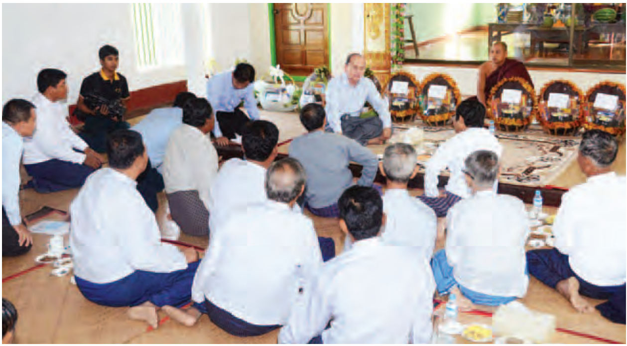
နိုင်ငံတော်သမ္မတ ဦးသိန်းစိန် ကသပေါင်းကျေးရွာရှိ မွေရက္ခိတကျောင်းတိုက်တွင် ကျေးရွာအတွင်းရှိ ရပ်မိရပ်ဖများနှင့် ရင်းရင်းနှီးနှီး တွေ့ဆုံမေးမြန်းဆွေးနွေးစဉ်။ (သတင်းစဉ်)

ဆက်လက်၍ တိုင်းဒေသကြီး ဝန်ကြီးချုပ် ဦးမြင့်ဆွေက စီမံကိန်းနှင့်ဆက်စပ်ကျေးရွာများ ဖွံ့ဖြိုးတိုးတက်ရေးနှင့်စပ်လျဉ်း၍ လိုအပ်ချက်များကို