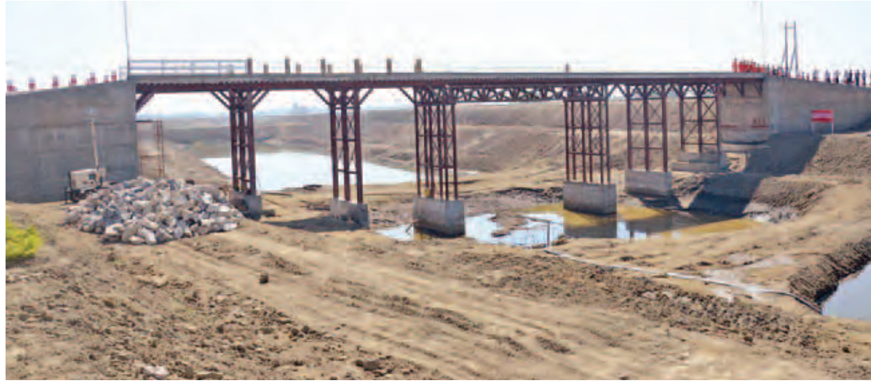
တုံတေးမြို့နယ် ရေစို-ကသပေါင်း သံမဏိသံပေါင်တံတား ပြီးစီးမှုကို တွေ့ရစဉ်။ (သတင်းစဉ်)