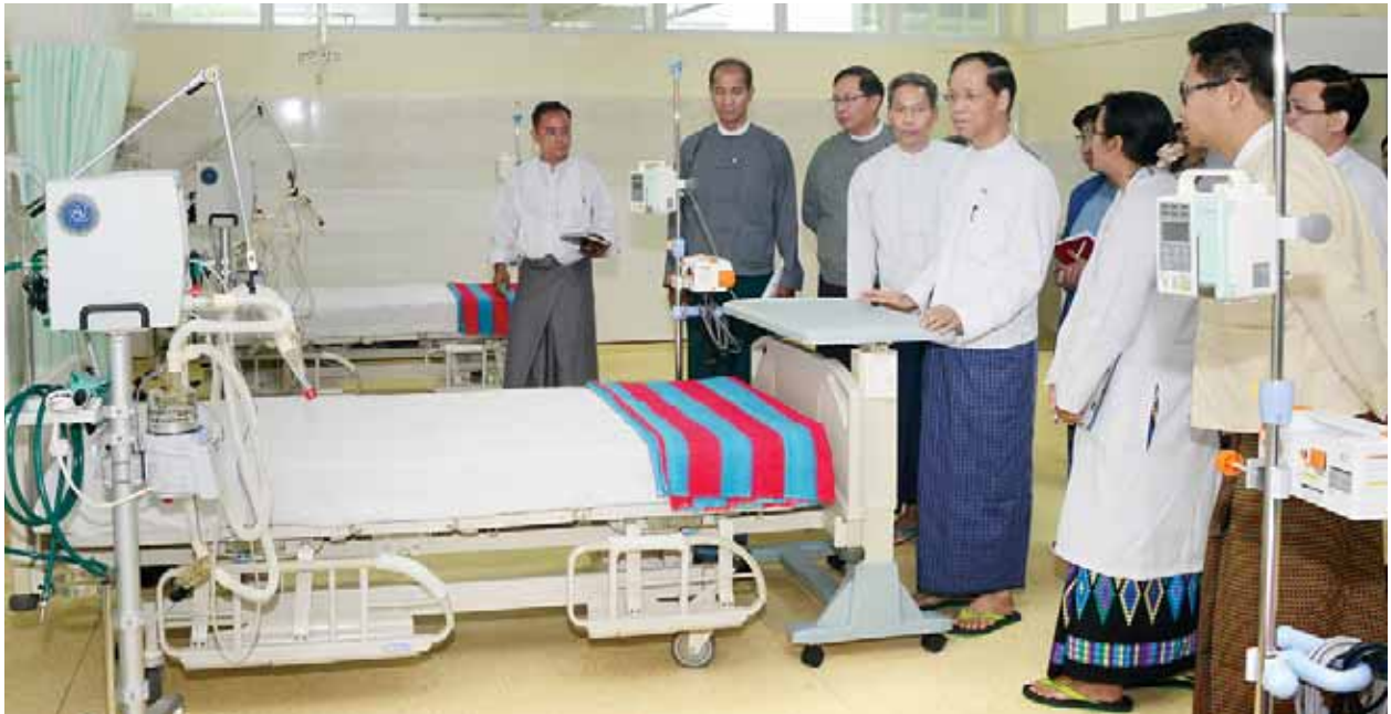
ဒုတိယသမ္မတ ဒေါက်တာစိုင်းမောက်ခမ်း ဆေးဝါးနှင့်ဆေးရုံသုံးပစ္စည်းများ တပ်ဆင်ထားရှိမှုကို လှည့်လည်ကြည့်ရှုစဉ်။ (သတင်းစဉ်)

မြန်မာနိုင်ငံ၏ ကျန်းမာရေးစောင့်ရှောက်မှုလုပ်ငန်းများ ရေရှည်ဖွံ့ဖြိုး တိုးတက်ရန် နိုင်ငံတကာ ကျန်းမာရေးစောင့်ရှောက်မှုနှင့် နှိုင်းယှဉ်လေ့လာ၍ ကြိုးပမ်းဆောင်ရွက်ကြရန်လိုအပ်ပါကြောင်း၊ ကျန်းမာရေးစောင့်ရှောက်မှု လုပ်ငန်းများ ဖွံ့ဖြိုးတိုးတက်ရေးသည် တစ်ဦးကောင်း တစ်ယောက်ကောင်းဖြင့် ဆောင်ရွက်၍မရသောကြောင့် သက်ဆိုင်သူ ဆရာဝန်၊ သူနာပြု၊ ကျွမ်းကျင်သူ များဖြင့် တက်ညီလက်ညီ စည်းစည်းလုံးလုံးဆောင်ရွက်ရန် လိုအပ်ပါကြောင်း။