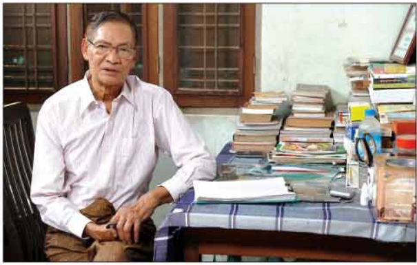
ဆရာ လယ်တွင်းသားစောချစ်

လေးစားအားကျဖွယ်ရာ လူသိများထင်ရှားသော စာပေပညာရှင်ကြီးများ၏ဘဝများကို အတုယူဖွယ်ရာ ဘဝစာတို စာတစ်အုပ်ကို ဖတ်ရသကဲ့သို့ ရိုက်ကူးတင်ဆက်ပေးနေသည့် အစီအစဉ်ဖြစ်ပါသည်။ ဘဝစာတိုကြောင်းများ၊ အတွေ့အကြုံများ အကြောင်းနှင့် ရေးသားခဲ့သော စာပေများအကြောင်းကို ကိုယ်တိုင်ပြောပြရင်း ဖြတ်သန်းခဲ့ရသော ပုံရိပ်များကို ပြန်လည် ပုံဖော်တင်ဆက်ထားခြင်းဖြစ်ပါသည်။ တင်ဆက်ရာတွင် စာအုပ်