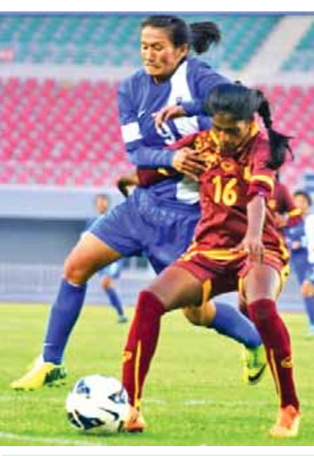
အိန္ဒိယနှင့်သီရိလင်္ကာအသင်းတို့ ယှဉ်ပြိုင်နေစဉ်။

၂၀၁၆ အိုလံပစ်အမျိုးသမီး ဘောလုံးပြိုင်ပွဲ အာရှနှင့် ပထမအဆင့်ခြေစစ်ပွဲအုပ်စု(က)ဒုတိယပွဲစဉ်ကို ယနေ့ ညနေပိုင်းက မန္တလေးမြို့ရှိ မန္တလာသီရိတွင်းတွင် ယှဉ်ပြိုင် ကစားရာ အိန္ဒိယအသင်းက သီရိလင်္ကာအသင်းကို လေးဂိုး ပြတ် အနိုင်ရရှိသွားသည်။