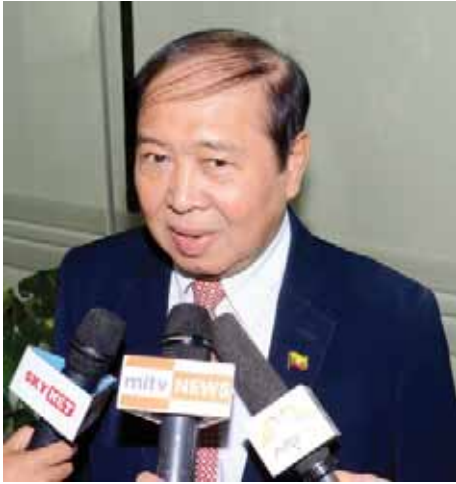
ပြည်ထောင်စုဝန်ကြီး ဦးအေးမြင့်

ကိုင်းသွားမယ်ဆိုရင် ဟိုရောက်ရင် ဘယ်သူမှ ကြောက်စရာ မလိုဘူး။ တရားမဝင် သွားခြင်းဆိုတာက ပွဲစားတွေရဲ့ လိမ်ခြင်းကိုခံရတာပဲ။ ပိုက်ဆံလည်း အများကြီး ကုန်တယ်။ အခု တရားဝင် လုပ်လိုက်တော့ ပိုက်ဆံလည်း မကုန်ဘူး။ အလိမ်အညာလည်း မခံရဘူး။ ပိုက်ဆံတွေ အများကြီး ပေးပြီး ပွဲစားတွေရဲ့ အလိမ်အညာတွေ မခံကြပါနဲ့။ တစ်ခုခု ဖြစ်လာရင် ဘယ်သူမှလည်း မကယ်နိုင်ဘူး။ ပွဲစားတွေလည်း ဘယ်ပျောက်သွားမှန်း မသိဘူး။ ဥပဒေကြောင်းအရ