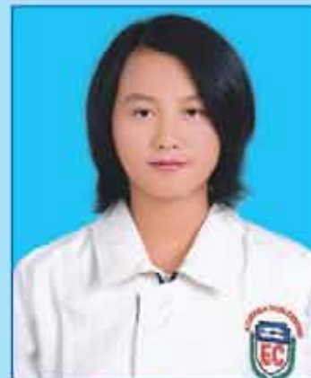
မမြင့်မြတ်ဇော် (ဆဗဟ-၆၂၂) ရန်ကုန်မြို့

Top-Ten နှင့်ဘာသာစုံဂုဏ်ထူး နှစ်စဉ်ဆွတ်ခူးခဲ့ကြသော