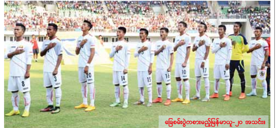
ခြေစမ်းပွဲကစားမည့်မြန်မာယူ-၂၀ အသင်း။

အဆိုပါဖြစ်စဉ်နှင့် ပတ်သက်၍ တာဝန်သိစွာဖြင့် အကြောင်းကြားခဲ့သည့် မြန်မာ့ရေနံထွက်ပစ္စည်းရောင်းဝယ်ရေးလုပ်ငန်းမှ ဝန်ထမ်းနှစ်ဦးအား မတ် ၆ ရက်တွင် ချီးကျူးဂုဏ်ပြု မှတ်တမ်းတင်ခဲ့ကြောင်း သိရသည်။ (ကြောင့်)