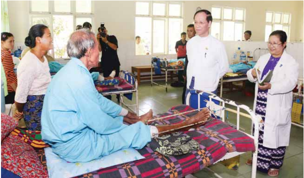
ဒုတိယသမ္မတ ဒေါက်တာစိုင်းမောက်ခမ်း ဆေးဝါးကုသမှုခံယူနေသည့် ဝေဒနာရှင်အား ရင်းရင်းနှီးနှီးတွေ့ဆုံ အားပေးစကားပြောကြားစဉ်။ (သတင်းစဉ်)

ဒုတိယသမ္မတ ဒေါက်တာစိုင်းမောက်ခမ်းသည် နေပြည်တော် ဒုတိယ (၁၀၀၀)ဆံ့ အထွေထွေရောဂါကုဆေးရုံကြီးမှ ဆရာ ဆရာမများ၊ ဝန်ထမ်းများနှင့် ယနေ့နံနက် ၉ နာရီတွင် အဆိုပါဆေးရုံကြီးရှိ ခွဲစိတ်ခန်းနှင့် အထူးပြုကုသခန်းများ အစည်းအဝေးခန်းမ၌ ရင်းရင်းနှီးနှီးတွေ့ဆုံသည်။ တွေ့ဆုံပွဲသို့ ဒုတိယဝန်ကြီး ဒေါက်တာဒေါ်သိန်းသိန်းဌေး၊ ကျန်းမာရေးဦးစီးဌာနမှ ဌာနဆိုင်ရာအကြီးအကဲများနှင့် တာဝန်ရှိသူများ၊ နေပြည်တော် ဒုတိယ(၁၀၀၀)ဆံ့ အထွေထွေရောဂါကုဆေးရုံကြီးမှ ဆေးရုံအုပ်ကြီးနှင့် ဆရာ ဆရာမများ၊ ဝန်ထမ်းများနှင့် တာဝန်ရှိသူများ တက်ရောက်ကြသည်။ တွေ့ဆုံပွဲတွင် ဒုတိယဝန်ကြီး ဒေါက်တာဒေါ်သိန်းသိန်းဌေးက နှုတ်ခွန်း ဆက်စကား ပြောကြားသည်။ ယင်းနောက် ကျွမ်းကျင်သူ ဒေါက်တာဖြူဖြူက ဆေးရုံ၏သမိုင်းအကျဉ်း၊ နိုင်ငံတော်၏ ထောက်ပံ့ပေးမှု၊ ဝန်ကြီးဌာန၏ လမ်းညွှန်မှုတို့ဖြင့် ရောဂါကုသရေးဌာနအလိုက် တပ်ဆင်ထားသည့် ဆေးရုံသုံးစက်ပစ္စည်းကိရိယာများ အခြေအနေနှင့် ရောဂါကုသမှုပိုင်းဆိုင်ရာများကို ရှင်းလင်းတင်ပြသည်။ ဆက်လက်၍ ဆေးရုံအုပ်ကြီး ဒေါက်တာသန်းသန်းမြင့်က ဌာနမှ ခွင့်ပြုချထားရန်ပုံငွေဖြင့် ခွဲစိတ်ဆောင်သစ်၊ လူနာစောင့်ရှောက်ရေးဆောင်၊ မြေအောက်ရေလျှော့ကန်၊ နှလုံးကုသဆောင်၊ ခြံစည်းရိုး၊ ဝန်ထမ်းအိမ်ရာနှင့် မြေထိန်းနံရံတည်ဆောက်ပြီးစီးမှုနှင့် ဆက်လက်ဆောင်ရွက်မည့် အခြေအနေများကို ရှင်းလင်းတင်ပြသည်။ ထို့နောက် ဒုတိယညွှန်ကြားရေးမှူးချုပ် ဒေါက်တာသန်းထွဋ်က နေပြည်တော်၌ သားဖွားမီးယပ်အထူးကုဆေးရုံ၊ အရိုးအကြောရောဂါအထူးကုဆေးရုံ၊ ကလေးအထူးကု ဆေးရုံနှင့် စာမျက်နှာ ၅ ကော်လံ ၁ သို့ ❖