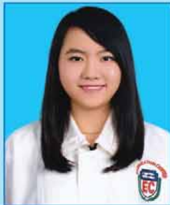
မယွန်းရတနွယ် (ဆဗဟ-၆၅၂) တောင်ကြီးမြို့