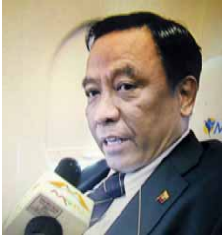
ပြည်ထောင်စုဝန်ကြီး ဦးဌေးအောင်

နေ့က ဘာလင်မှာ ကျင်းပခဲ့တဲ့ နိုင်ငံတကာခရီးသွားပြပွဲမှာ မြန်မာနိုင်ငံအနေနဲ့လည်း အကြီးကျယ်ဆုံး ပါဝင် ပြသခဲ့ပါတယ်။ အလားတူပဲ မလေးရှားကလည်း ပါဝင်ပြသပါတယ်။ အဲဒီမှာ ဒီအစီအစဉ်ကို ကျွန်တော်ဦးစီးပြီးတော့ပဲ လုပ်ငန်းမြှင့်တင်မှု ကြော်ငြာတွေ လုပ်ခဲ့ပါတယ်။ လုပ်ငန်းမြှင့်တင်မှု ကြော်ငြာတွေကို ရေရှည်ပူးပေါင်း ဆောင်ရွက်နိုင်အောင်နဲ့ မလေးရှားရဲ့ လူသားအရင်းအမြစ် တိုးတက်ဖွံ့ဖြိုးနေတာကို ကျွန်တော်တို့ရဲ့ လူသားအရင်းအမြစ် တိုးတက်ဖွံ့ဖြိုး