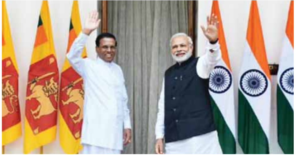
လာခြင်းဖြစ်သည်။ အိန္ဒိယဝန်ကြီးချုပ်သည် မတ် ၁၄ ရက်တွင် သီရိလင်္ကာနိုင်ငံ လွှတ်တော် ဌာနခွဲများပြောကြားမည်ဖြစ်ပြီး ဂျပန်အစိုးရအဖွဲ့အစည်းများနှင့် အိန္ဒိယနိုင်ငံ၏ အထောက်အပံ့အကူအညီများကို အသိပေးပြောကြားမည်ဖြစ်သည်။

ဆိုးရွားစွာ ခံစားခဲ့ရသော မြို့ဖြစ်သည်။ ၁၉၈၃ မှ ၂၀၀၉ ခုနှစ်အတွင်း ဖြစ်ပွားခဲ့သော သီရိလင်္ကာ ပြည်တွင်းစစ်၌ ပြည်သူ ၇၀၀၀၀ ကျော် သေဆုံးခဲ့ရသည်။ အိန္ဒိယဝန်ကြီးချုပ်သည် အိန္ဒိယသမ္မတအဖွဲ့အစည်းမှ ကျွန်ုပ်တို့နှင့် သုံးနိုင်ငံခရီးစဉ်၌ ဆေးရုံလှူဒါန်းမှုများနှင့် ဆေးကုသရေးကော်မရှင်တို့ကို သွားရောက်ခဲ့ပြီးနောက် မတ် ၁၃ ရက်တွင် သီရိလင်္ကာသို့ တတိယခရီးထောက်အဖြစ် ရောက်ရှိ