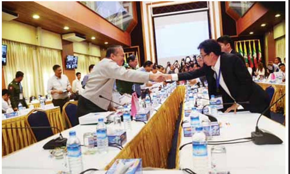
တော်မတီ(Union Peace Making Work Committee) နှင့် တစ်နိုင်ငံလုံး အပစ်အခတ်ရပ်စဲရေးဆိုင်ရာ ညှိနှိုင်းရေးအဖွဲ့(Nationwide Ceasefire Coordination Team)တို့အကြား တစ်နိုင်ငံလုံး အပစ်အခတ်ရပ်စဲရေး သဘောတူညီချက် (Nationwide Ceasefire Agreement)

ပြည်ထောင်စု ငြိမ်းချမ်းရေးဖော်ဆောင်ရေးလုပ်ငန်း