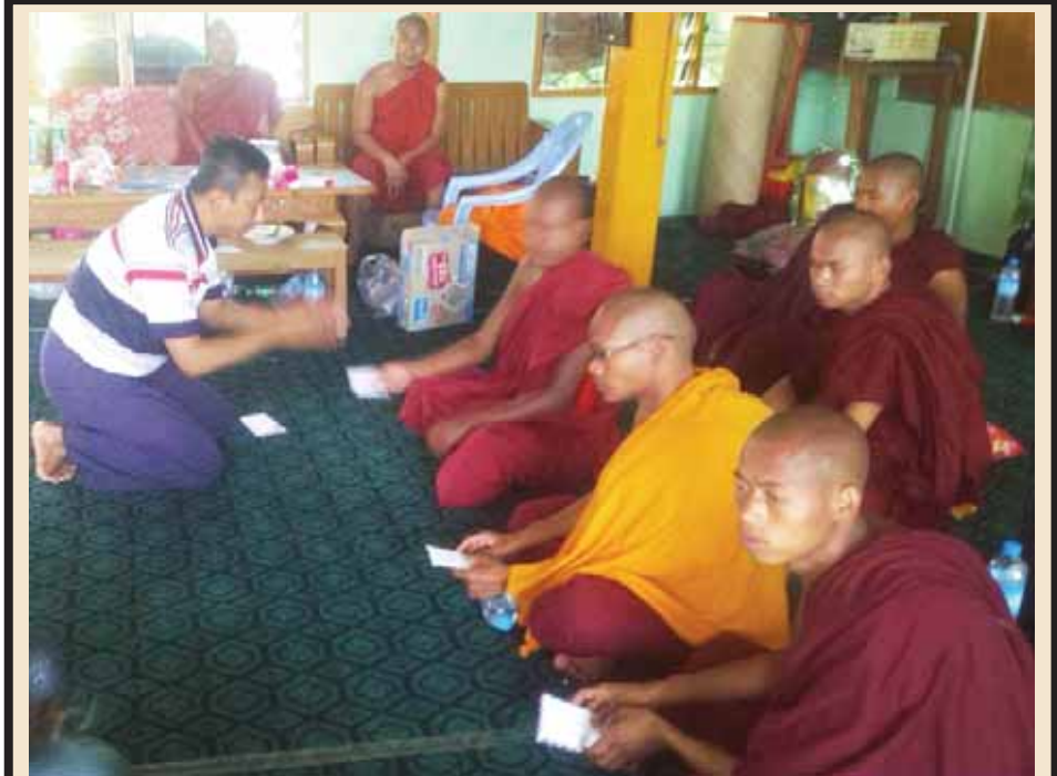
ရဟန်းသံဃာတော်များနှင့် မအာဝတ်သည့်ကိစ္စများ၌ ပါဝင်ခဲ့ခြင်းအပေါ် ခွင့်လွှတ်သည့်ခံပေးပါရန် လျှောက်ထား၍ နိုင်ငံတော်သံဃမဟာနာယကအဖွဲ့က ထုတ်ပြန်ထားသော ညွှန်ကြားလွှာများနှင့်အညီ ကျင့်ကြံ အားထုတ်မည်ဖြစ်ကြောင်း ဝန်ခံကတိပြုခဲ့ပြီး မတ် ၁၁ ရက် နံနက်ပိုင်းတွင် လက်ပံတန်းမြို့ အောင်မြေဗိမာန် ကျောင်းတိုက်မှ ပြန်လည်ထွက်ခွာသွားခဲ့သော မတ် ၁၀ ရက် လက်ပံတန်းဖြစ်စဉ်တွင် ပါဝင်ခဲ့သည့် သံဃာ ၁၀ ပါးအား တွေ့ရစဉ်။ (သတင်းဖော်ပြပြီး)(၀၀၉)

◆ မြစ်ကြီးနားမှ စာမေးပွဲတွင် အမှန်တကယ်ဖြေဆိုသူ ကျား ၂၉၂၅ ဦး၊ မ ၄၅၈၉ ဦး စုစုပေါင်း ၇၅၁၄ ဦး ဝင်ရောက်ဖြေဆိုကြောင်း သိရပြီး စာမေးပွဲလာရောက်ဖြေဆိုသူ ကျောင်းသားတစ်ဦးက “ဖြေနိုင်တယ်၊ နောက်ပိုင်းဘာသာတွေလည်း ဖြေနိုင် မယ်လို့ ယုံကြည်တယ်။ ဘာကြောင့်လဲဆိုတော့ ကျွန်တော်တို့မြို့မှာ တည်တည် ငြိမ်ငြိမ် ငြိမ်းငြိမ်းချမ်းချမ်းဖြစ်နေလို့ပါ။ မတည်မငြိမ်ဆိုရင် ကျွန်တော်တို့ ကျောင်းသားတွေလည်း စိတ်အနှောင့်အယှက်ဖြစ်ပြီး စာမေးပွဲဖြေဆိုရာမှာ အခက်အခဲဖြစ်မှာပါ။ အခုဆိုရင် အေးအေးချမ်းချမ်းမို့ ဝမ်းသာမိပါတယ်”ဟု ပြောကြားသည်။ မိုးယံကျ(မြစ်ကြီးနား)