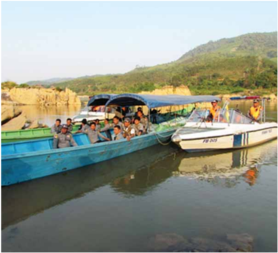
တာလေမြို့နယ် ပါလကေးရွာ နယ်မြေတစ်ဝိုက်တွင် နယ်မြေရှင်းလင်းစဉ် သိမ်းဆည်းရမိသော ကပင်း ၈၁၅၀ ကီလိုအား မဲခေါင်မြစ်အတွင်း သယ်ဆောင်လာစဉ်။ (ရဲဖြန့်ကြား)

မူးယစ်ဆေးဝါးများ ဖော်ထုတ်ဖမ်းဆီးရမိမှု စစ်ဆင်ရေးတွင် မူးယစ်ဆေးဝါးအမှုပေါင်း ၁၀၆ မှုကို သက်ဆိုင်ရာ ရဲတပ်ဖွဲ့စခန်းများတွင် အမှုဖွင့်လှစ်ခဲ့ပြီး တရားခံပေါင်း ၁၄၇ ဦးတို့အား ဖမ်းဆီးအရေးယူနိုင်ကာ အသိပညာပေးဟောပြောပွဲ (၁၀) ကြိမ်ပြုလုပ်၍ ပြည်သူလူထု ၁၅၆၆ ဦးတို့အား မူးယစ်ဆေးဝါးအန္တရာယ် အသိပညာပေးဟောပြောခဲ့ကြောင်း သိရသည်။ (ရဲဖြန့်ကြား)