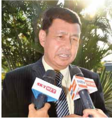
ပြည်ထောင်စုဝန်ကြီး ဦးရဲထွဋ်

ဟိုတယ်/ခရီးက ပြီးခဲ့တဲ့ အာဆီယံမှာ လက်မှတ်ထိုးခဲ့တယ်။ ဒီလ လဆန်းက ဘာလင်မှာ ကျင်းပခဲ့တဲ့ ခရီးသွားပြပွဲမှာ ဒါကို Promotion လုပ်ခဲ့တယ်။ နှစ်နိုင်ငံ ခရီးသွားလုပ်ငန်းကို မြှင့်တင်နေတာကြာပြီ။ သို့သော် အာဆီယံဒေသကြီးတစ်ခုလုံးအနေနဲ့ အာဆီယံဒေသမှာရှိတဲ့ မတူ