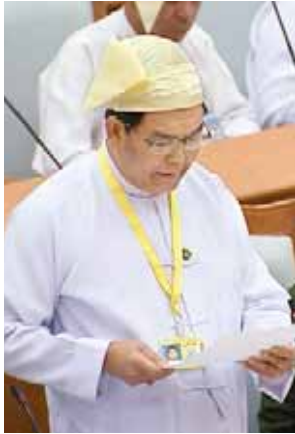
ဒုတိယဝန်ကြီး ဦးအုန်းသန်း

၂၀ ရက်ထက်မနည်း အခကြေးငွေယူ၍ အလုပ်လုပ်ကိုင်သော ပုဂ္ဂိုလ်များ ကိုဆိုသည်”ဟု အတည်ပြုချက်အား ပယ်ဖျက်သင့်ကြောင်း စသည်ဖြင့် ပါရှိသည်။ အစည်းအဝေးတွင် ၂၀၁၅ ခုနှစ် ပြည်ထောင်စု၏ အခွန်အကောက် ဥပဒေကြမ်းနှင့်စပ်လျဉ်း၍ ပြည်ထောင် စုအဆင့် အဖွဲ့အစည်းဝင်များက လွှတ်တော်သို့ ပြန်လည်ရှင်းလင်းတင် ပြကြသည်။ ပြည်ထဲရေးဝန်ကြီးဌာန ဒုတိယ ဝန်ကြီး ဗိုလ်မှူးချုပ်ကျော်ဇံမြင့်က ပြည်ထဲရေးဝန်ကြီးဌာနက ကောက်ခံ သည့် ယစ်မျိုးခွန်၊ မြေယာပေါ်တွင် ကောက်ခံသည့်အခွန်၊ ဓာတ်သတ္တု ပစ္စည်းများထုတ်ယူသည့် အခွန်များ နှင့်စပ်လျဉ်း၍လည်းကောင်း၊ လယ် ယာစိုက်ပျိုးရေးနှင့် ဆည်မြောင်း ဝန်ကြီးဌာန ဒုတိယဝန်ကြီး ဦးအုန်း သန်းက ဆည်မြောင်းဦးစီးဌာန၏ ရေခွန်ကောက်ခံမှုနှင့် ပြည်နယ်နှင့်