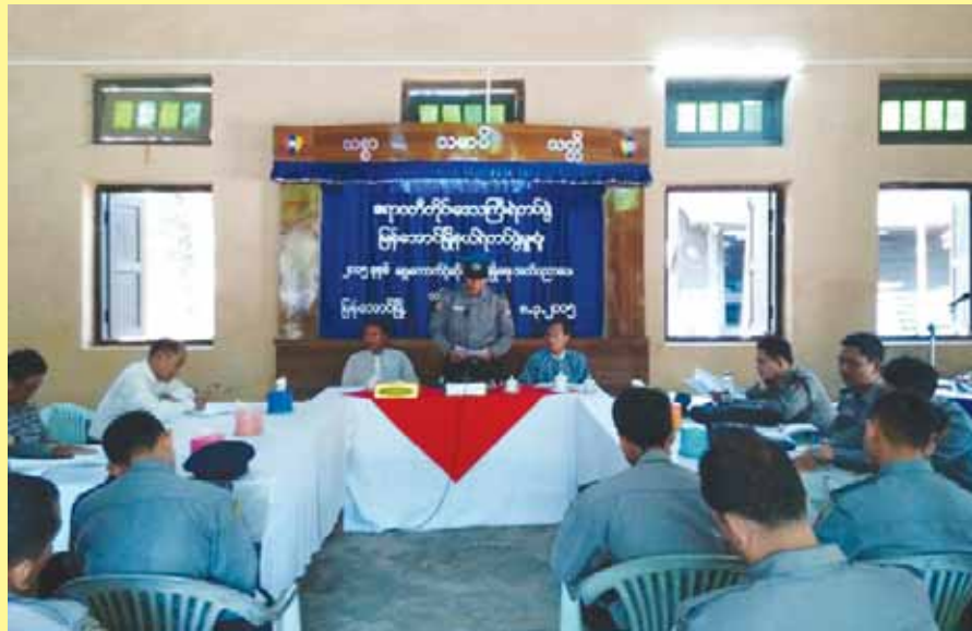
၂၀၁၅ ခုနှစ် ရွေးကောက်ပွဲတွင် ရဲတပ်ဖွဲ့ဝင်များ လုံခြုံရေးတာဝန်ထမ်းဆောင်ရာတွင် လွယ်ကူချောမွေ့စေရန် စီရင်တီတိုင်း ဒေသကြီး ဖြန့်အောင်မြို့တွင် ရွေးကောက်ပွဲဆိုင်ရာ လုံခြုံရေးအသိပညာပေးသင်တန်းကို မတ်လ ၈ ရက်က မြို့နယ် ရဲတပ်ဖွဲ့ စခန်းမှာရုံတွင် ကျင်းပခဲ့ကြောင်း သိရသည်။ သင်တန်းတွင် မြို့နယ်ရဲတပ်ဖွဲ့မှူး၊ ရဲမှူးထွန်းဖေက ရွေးကောက်ပွဲကာလတွင် လုံခြုံရေးဆိုင်ရာဖြစ်ပေါ်လာနိုင်သည့် အခြေအနေများနှင့် ရွေးကောက်ပွဲဆိုင်ရာဥပဒေများ၊ ရွေးကောက်ပွဲကော်မရှင် အဖွဲ့(ခွဲ) ဥက္ကဋ္ဌ ဦးသန်းဆွေက မြို့နယ်၊ ရပ်ကွက်ကျေးရွာ ရွေးကောက်ပွဲကော်မရှင်အဖွဲ့(ခွဲ)တို့၏ ဖွဲ့စည်းပုံနှင့် တာဝန်များကို ရှင်းလင်းဆွေးနွေး ကြသည်။