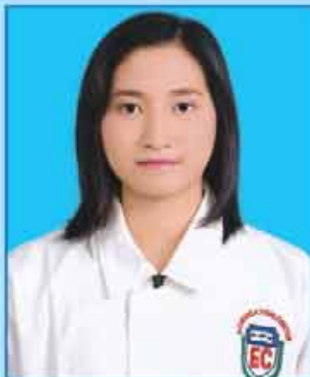
မဟန်နီချို (ဆဗဟ-၆၁၃) ရန်ကုန်မြို့