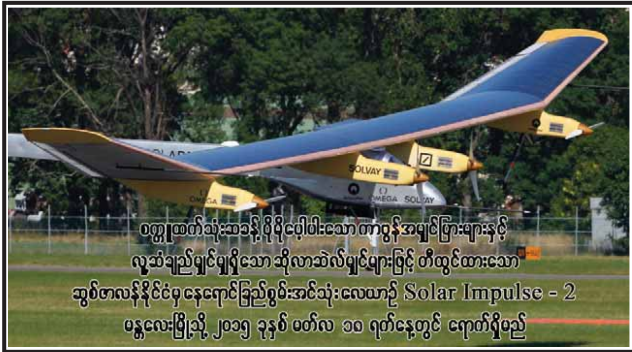
ဝတ္ထုထုတ်ဆုံးအခန်းပိုမိုပေါ့ပါးသော ကာဗွန်အမျှင်ခြားများနှင့် လူသံချည်မျှင်မျှင်သော ဆိုလာဆိပ်မျှင်များဖြင့် တီထွင်ထားသော ဆွစ်ဇာလန်နိုင်ငံမှ နေရောင်ခြည်စွမ်းအင်သုံး လေယာဉ် Solar Impulse - 2 မန္တလေးမြို့သို့ ၂၀၁၅ ခုနှစ် မတ်လ ၁၀ ရက်နေ့တွင် ရောက်ရှိမည်

ပညာရေးနဲ့ ပတ်သက်လို့ အဓိကက မလေးရှားက တက္ကသိုလ်နဲ့ မြန်မာတက္ကသိုလ်တွေကြားမှာ ပူးပေါင်းဆောင်ရွက်မှုတွေ လုပ်ဖို့ပါ။ ဒါကို ပညာရေးဝန်ကြီးဌာနက ဆက်လက်ဆောင်ရွက်သွားမှာပါ။ နှစ်နိုင်ငံ ပူးပေါင်းဆောင်ရွက်မှု ကော်မတီ၊ နှစ်နိုင်ငံ နိုင်ငံခြားရေးဝန်ကြီးတွေကနေ အသေးစိတ် ဆွေးနွေးဆောင်ရွက်သွားမှာ ဖြစ်ပါတယ်။