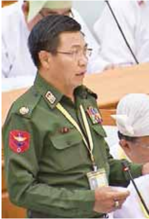
ဒုတိယဝန်ကြီး ဗိုလ်မှူးချုပ်ကျော်ဇံမြင့်

ယနေ့ကျင်းပသည့် ပထမအကြိမ် ပြည်ထောင်စုလွှတ်တော် (၁၂) ကြိမ်မြောက်ပုံမှန်အစည်းအဝေး (၂၆) ရက်မြောက်နေ့တွင် လွှတ်တော်နှစ်ရပ် သဘောကွဲလွဲသည့် အသေးစားနှင့် အလတ်စား စီးပွားရေးလုပ်ငန်းဖွံ့ဖြိုး တိုးတက်ရေးဥပဒေကြမ်းနှင့် စပ်လျဉ်း၍ ဥပဒေကြမ်းပူးပေါင်းကော်မတီက ကော်မတီ၏ လေ့လာတွေ့ရှိချက်နှင့် သဘောထားမှတ်ချက်အစီရင်ခံစာကို လွှတ်တော်သို့ ဖတ်ကြားတင်ပြသည်။