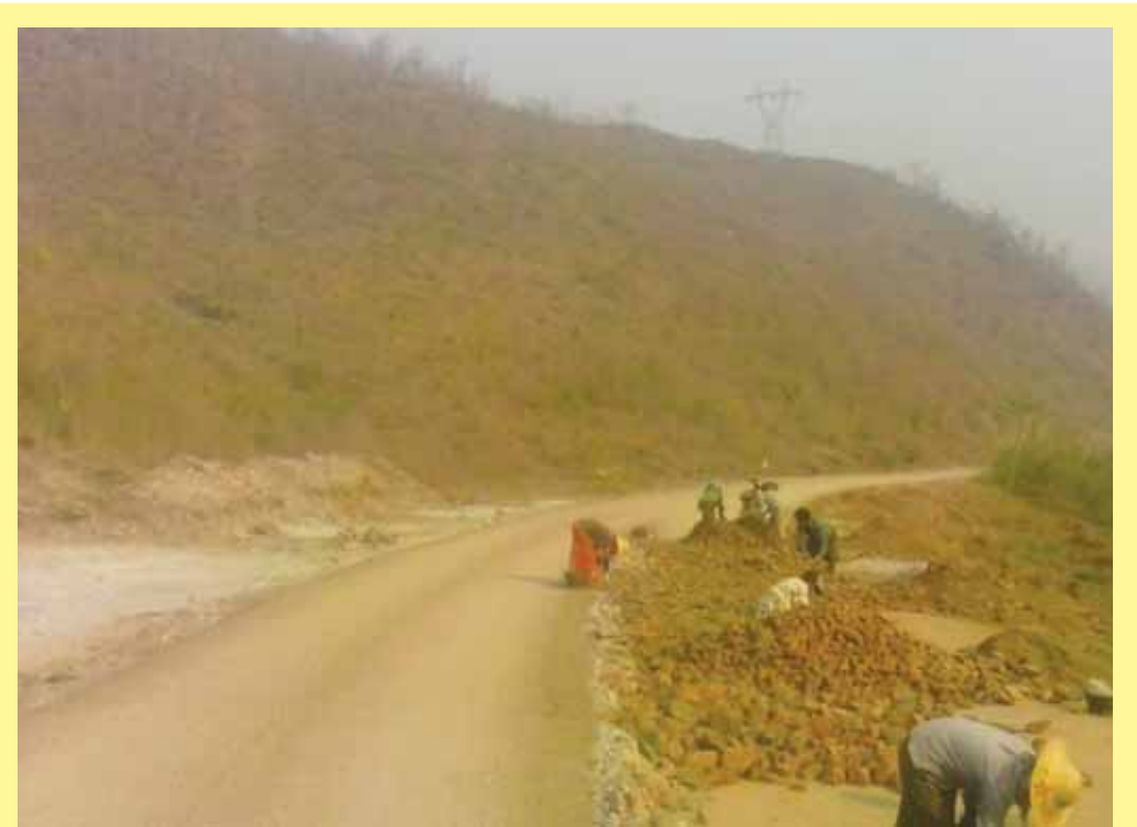
မန္တလေးတိုင်းဒေသကြီး ကျောက်ဆည်ခရိုင် မြစ်သားမြို့နယ် ကုမဲမှ ကင်းတာရေလှောင်တံခံသွား ၂၁ မိုင်လမ်းပိုင်းအား မတ် ၁၁ ရက်တွင် ပြုပြင်နေသည့်ကို တွေ့ရစဉ်။