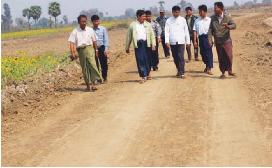
ကျေးရွာချင်းဆက်လမ်းများဖောက်လုပ်ရေးတို့ကို ဆောင်ရွက်ပေးနေကြောင်း သိရသည်။ လမ်းလက်ကြယ်စင်