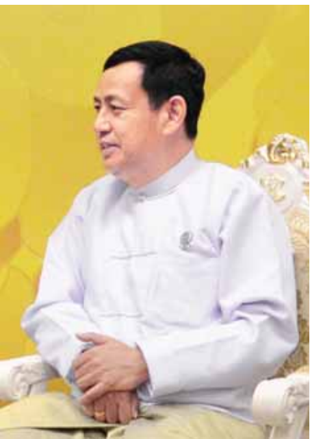
ပြည်ထောင်စုဝန်ကြီးဦးရဲထွဋ်။

မေး။ ။ဝန်ကြီးခင်ဗျာ ထပ်သိချင်တာကတော့ မကြာမီ ကျင်းပမယ့် ရွေးကောက်ပွဲမှာရော အခုဆောင်ရွက်မှုက အကျိုးသက်ရောက်မှု ရှိသွားနိုင်ပါသလားခင်ဗျာ။ ဖြေ။ ။အရေးကြီးဆုံးက ၂၀၁၅ ခုနှစ် ရွေးကောက်ပွဲကို လွတ်လပ်ပြီး တရားမျှတစွာ ကျင်းပနိုင်ဖို့ပဲ။ အဲဒီလိုကျင်းပ နိုင်ဖို့ဆိုရင် နိုင်ငံရေးအားဖြင့် တည်ငြိမ်မှုရှိရမယ်။ တရား ဥပဒေစိုးမိုးမှုရှိရမယ်။ လူတိုင်းလူတိုင်းဟာ မိမိတို့ရဲ့ သဘောထားကွဲလွဲမှုတွေကို ဖွဲ့စည်းပုံအခြေခံဥပဒေနဲ့ အညီဖြေရှင်းရမယ်။ ဒါမျိုးကိုလုပ်နိုင်ဖို့အတွက် အခုလို တရားဥပဒေစိုးမိုးရေးကို ဆောင်ရွက်နေခြင်းဖြစ်တဲ့ အတွက် ကျွန်တော်တို့ဆက်လုပ်သွားမယ်ဆိုရင်တော့ ရွေးကောက်ပွဲကို အောင်မြင်စွာကျင်းပနိုင်မယ်လို့ ယုံကြည် တယ်။ မေး။ ။ အခုလိုဆောင်ရွက်လိုက်တဲ့အတွက်ကြောင့် ကျောင်းသားတွေရဲ့ဥပဒေအပေါ်မှာ ဥပဒေကြမ်းပေါ်မှာ ဆန္ဒပြမှုအနေအထားဟာ တည်ငြိမ်အေးချမ်းသွားမယ်လို့ ဝန်ကြီးအနေနဲ့ ထင်မြင်ယူဆပါသလားခင်ဗျာ။