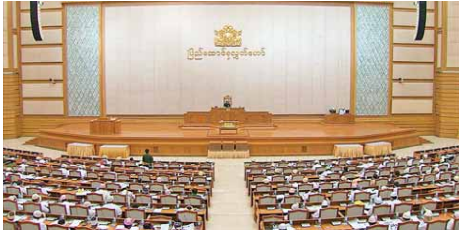
ပြည်ထောင်စုလွှတ်တော် (၁၂)ကြိမ်မြောက် ပုံမှန် အစည်းအဝေး(၂၄)ရက် မြောက်နေ့ကျင်းပစဉ်။(သတင်းစဉ်)

ပြည်ထောင်စုလွှတ်တော် (၁၂)ကြိမ်မြောက် ပုံမှန် အစည်းအဝေး(၂၄)ရက် မြောက်နေ့ကို ယနေ့ မွန်းလွဲပိုင်း တွင်ကျင်းပရာ ဥပဒေကြမ်း အစီရင်ခံစာနှစ်ခုတွင် သွင်းခြင်း၊ ဥပဒေကြမ်းနှစ်ခုအတည်ပြုခြင်း၊ မြန်မာ နိုင်ငံရဲတပ်ဖွဲ့အတွက် တရုတ်ပို့ကုန်/သွင်းကုန်ဘဏ်မှ ချေးငွေချေးယူခွင့်နှင့်စပ်လျဉ်း၍ ဆွေးနွေးအတည်ပြုခြင်း နှင့် ၂၀၁၅ ခုနှစ် ပြည်ထောင်စု၏ အခွန်အကောက် ဥပဒေကြမ်းဆွေးနွေးခြင်းတို့ကို ဆောင်ရွက်ခဲ့ကြသည်။