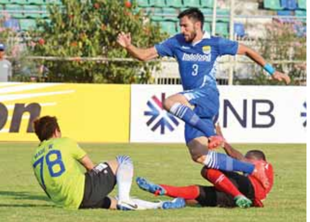
ဧရာဝတီနှင့် ဘန်ဂေါင်းအသင်းတို့ ယှဉ်ပြိုင်နေစဉ်။

ဧရာဝတီအသင်းတွင် နိုင်ငံခြားသားကစားသမားလေးဦးဖြင့် လူစုံခဲ့သော်လည်း ပြည်တွင်းအမာခံများ မပါဝင်နိုင်၍ အားပျော့ပြီး ပထမပိုင်းတွင် ခြေစွမ်းပြနိုင်ခြင်းမရှိခဲ့ပေ။ ဘန်ဂေါင်းအသင်းမှာ ပွဲစတင်တည်းက ဖိကစားနိုင်ခဲ့သော်လည်း ဧရာဝတီကခံစစ်ပိုင်းကို အမှားအယွင်းမရှိ ကစားနိုင်ခဲ့၍ အခွင့်အရေးသိပ်မရခဲ့ပေ။ ပထမပိုင်းပြီးခါနီးမှ ဘန်ဂေါင်းအသင်းဂိုးစရခဲ့ပြီး အသင်းခေါင်းဆောင်အတက်ပိက သွင်းယူခဲ့ခြင်းဖြစ်သည်။