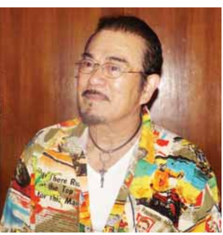
ရန်ကုန် မတ် ၁၁

မန္တလေး မတ် ၁၁ ဂျပန်ရုပ်ရှင်မင်းသားကြီး ဆန်နီချီးဘား (Sonny Chiba) သည် ဒေါက်တာပဏ္ဍိတအဖြစ် အလုပ်ဆောင်နေသည့် “မြန်မာတို့ ၏ အရုဏ်ဦး” ရုပ်ရှင်ဇာတ်ကားဖြစ်မြောက်ရေးအတွက် ရိုက်ကွင်းများရှာဖွေရန် မြန်မာနိုင်ငံ မန္တလေးမြို့သို့ ရောက်ရှိနေစဉ် မန္တလေးမြို့ Hotel Queen ၌ မတ် ၉ ရက် နံနက်ပိုင်းက သတင်းမီဒီယာသမားများနှင့် တွေ့ဆုံ ခဲ့သည်။ မင်းသားကြီးသည် ၁၉၆၀ ခုနှစ်မှ စတင်ပြီး ရုပ်ရှင် ဇာတ်ကား ၂၀၀ ကျော်နှင့် ဗီဒီယိုဇာတ်ကား ၁၃၀၀ ကျော် ရိုက်ကူးခဲ့သဖြင့် မြန်မာ့ရုပ်ရှင်လုပ်ငန်း ကမ္ဘာ့အဆင့်မီ လာစေရန် ဆောင်ရွက်ပေးသွားမည်ဖြစ်ကြောင်း ပြောကြား ခဲ့သည်။ အေးမြ(မန္တလေး)