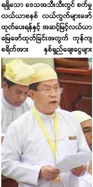
အဂတိလိုက်စားမှု တိုက်ဖျက်ရေး ကော်မရှင်ဥက္ကဋ္ဌ ဦးမြင့်ဝင်း

စုံစမ်းစစ်ဆေး ဖော်ထုတ်အရေးယူနိုင်မည်ဖြစ်ပါကြောင်း။ လာဘ်ပေးလာဘ်ယူမှုဆိုသည်မှာ မမြင်ကွယ်ရာတွင် ကျူးလွန်လေ့ရှိသောကြောင့် လက်ပူးလက်ကြပ် ဖမ်းဆီးရမိရန် မလွယ်ကူပါကြောင်း၊ ဖြစ်စဉ်မှန်ကန်မှုရှိရန် လိုအပ်ပြီး ယင်းဖြစ်စဉ်ကို မှန်ကန်ကြောင်း ဖော်ထုတ်နိုင်မည့် အထောက်အထား၊ သက်သေတင်ပြနိုင်မှုရှိပါက စုံစမ်းစစ်ဆေး ဖော်ထုတ်နိုင်မည်ဖြစ်ပါကြောင်း၊ မြန်မာတစ်နိုင်ငံလုံးရှိ ဥပဒေရုံး၊ တရားရုံးအသီးသီးတွင် အမှုသည်အသွင်ယူ၍ စောင့်ကြပ်ကြည့်ရှုပြီး စုံစမ်းဖော်ထုတ်အရေးယူပေးနိုင်ရန် မလွယ်ကူပါကြောင်း၊ တိုင်ကြားသည့် ကိစ္စရပ်တစ်ခုချင်း အပေါ်မူတည်၍သာ အဂတိလိုက်စားမှုတိုက်ဖျက်ရေးဥပဒေပါ ပြဋ္ဌာန်းချက်များနှင့်အညီ စုံစမ်းဖော်ထုတ်အရေးယူသွားနိုင်မည် ဖြစ်ပါကြောင်းဖြင့် ဖြေကြားသည်။ ဝမ်းတွင်းမဲဆန္ဒနယ်မှ ဦးသန်းမြင့်၏ “ မြန်မာနိုင်ငံအတွင်းရှိ ရေပိုမို