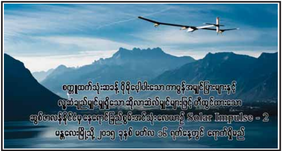
စတုရက်သုံးဆင့် ဝိသိသိပေါင်းသော တာဝန်အမျှင်ဖြားများနှင့် လူ့ဆံ့ချည်မျှင်မျှင်သော သိုလာဆလ်မျှင်များဖြင့် တီထွင်ထားသော ဆွစ်ဇာလန်နိုင်ငံမှ နေရောင်ခြည်စွမ်းအင်သုံးစွယ်စနစ် Solar Impulse - 2 ပန္နလေးမြို့သို့ ၂၀၁၅ ခုနှစ် မတ်လ ၁၆ ရက်နေ့တွင် ရောက်ရှိမည်

ရန်ကုန် တောင်ပိုင်းခရိုင် ကျောက်တန်းမြို့နယ် တံတာမြို့ အခြေခံပညာအထက်တန်းကျောင်းတွင် တက္ကသိုလ်ဝင်တန်းစာမေးပွဲ ဖြေဆိုမည့် ကျောင်းသား ကျောင်းသူများ မတ် ၁၁ ရက်က အေးချမ်းစွာ စာမေးပွဲဖြေဆိုရန် လာရောက်ကြစဉ်။ အောင်ဆွေ(ရွှေတံတား)