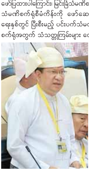
ဧရာဝတီတိုင်းဒေသကြီးမဲဆန္ဒနယ် အမှတ် (၅)မှ ဒေါက်တာဌေးဝင်း

အစီရင်ခံစာအရ နိုင်ငံတော်အတွက် အကျိုးမရှိဖြစ်နိုင်သည်ဟု ဖော်ပြထားပါကြောင်း၊ သို့ရာတွင် ယင်းစီမံကိန်းစက်ရုံများကို သွားရောက်လေ့လာခဲ့သည့် လွှတ်တော်ကိုယ်စားလှယ်အဖွဲ့များနှင့် စက်မှုဝန်ကြီးဌာနပြည်ထောင်စုဝန်ကြီး ဦးမောင်မြင့်တို့က ယုံကြည်မှုအပြည့်အဝရှိကြောင်းဖြင့် ပြည်ထောင်စုလွှတ်တော်တွင် ရှင်းလင်းခဲ့သည်ကိုလည်း သိရှိရပါကြောင်း၊ မိမိအနေဖြင့်လည်း တိုင်းပြည်အတွက် အကျိုးရှိသည့် စီမံကိန်းဖြစ်မည်ဟု မျှော်လင့်ပါကြောင်း၊ အကယ်၍