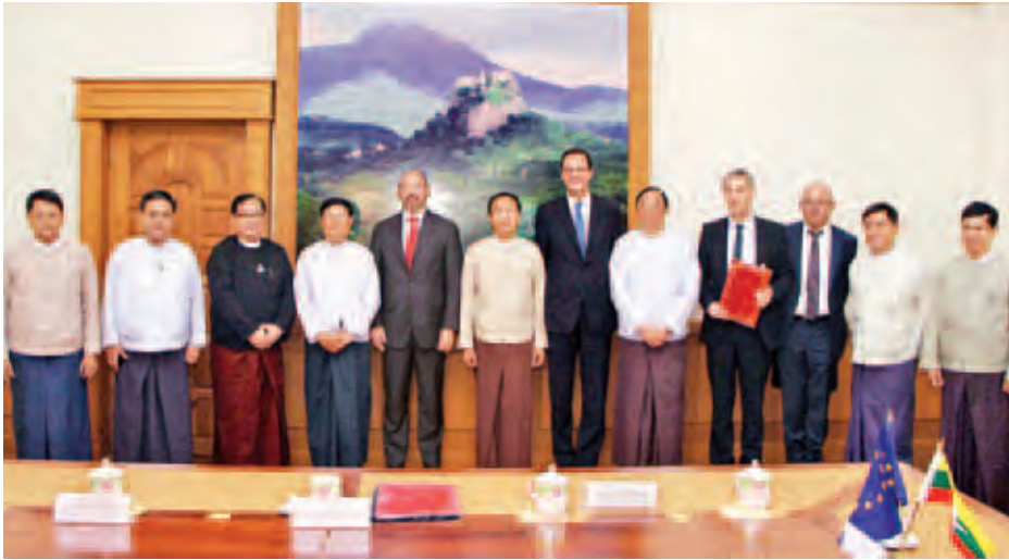
မြန်မာနိုင်ငံ၏ စီမံကိန်းများတွင် အပြည်ပြည်ဆိုင်ရာ ငွေရေးကြေးရေးအဖွဲ့အစည်းတစ်ခုအနေဖြင့် ချေးငွေများထုတ်ချေးခြင်း၊ အာမခံပေးခြင်း၊ အစုရှယ်ယာများအပါအဝင် အခြားငွေရေးကြေးရေးဆိုင်ရာ အထောက်အကူများနှင့် ငွေကြေးရန်ပုံငွေများအား စီမံခန့်ခွဲလက်ဝယ်ထားသုံးစွဲခြင်းများကိုဆောင်ရွက်မည်ဖြစ်သည့်အတွက် မြန်မာနိုင်ငံ၏ ပုဂ္ဂလိကကဏ္ဍဖွံ့ဖြိုးတိုးတက်ရေးအတွက် များစွာအထောက်အကူပြု အကျိုးကျေးဇူးဖြစ်ထွန်းစေနိုင်မည် ဖြစ်သည်။