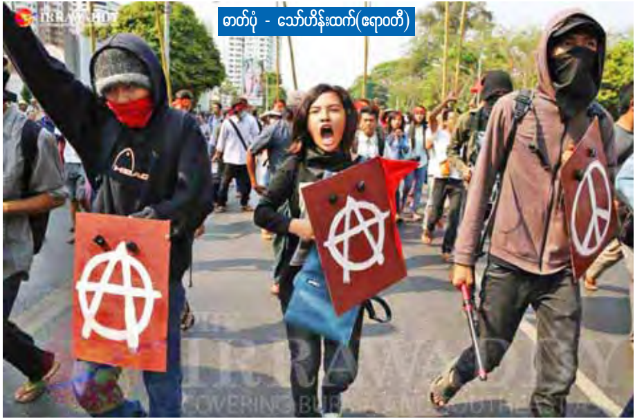
တက်ပုံ - သော်ဟိန်းထက်(ရောဂါ)