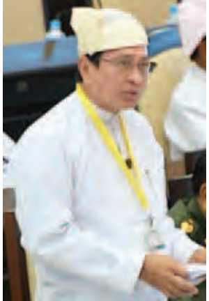
ပြည်ထောင်စုဝန်ကြီး ဦးကျော်လွင်။

၃၄) ဧက စိုက်ပျိုးထားသည့် သီးနှံ ဧက (၁၆၉ ဒသမ ၉၇) ဧကနှင့် အဆောက်အအုံ (၂)လုံးအတွက် ပျဉ်းမနားမြို့နယ် မြေစာရင်းဦးစီး