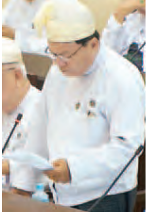
မန္တလေးတိုင်းဒေသကြီး မဲဆန္ဒနယ် အမှတ်(၉)မှ ဦးမှတ်ကြီး။

အစားအလိုက် ပေးလျှော်ရမည့် (၁) ဧက အတည်ပြုချေးနှုန်းကို အဆင့်ဆင့်စိစစ်ကာ နေပြည်တော် ကောင်စီသို့ တင်ပြသဘောထား မှတ်ချက်ရယူသွားမည်ဖြစ်ပါကြောင်း၊ လုပ်ထုံးလုပ်နည်းများအတိုင်း စိစစ် အတည်ပြုပြီးပါက ရန်ပုံငွေတင်ပြ တောင်းခံပေးလျှော်သွားမည်ဖြစ်ပါ ကြောင်းဖြင့် ဖြေကြားသည်။