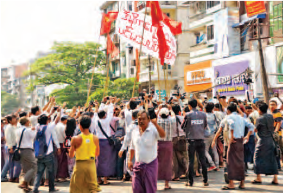
ရန်ကုန် မတ် ၁၀

ဒီမိုကရေစီပညာရေး ပင်မသပိတ်စစ်ကြောင်းစာတန်းနှင့် အလံများကိုင်ဆောင်ထားသည့် အင်အား ၆၀ ခန့် ရှိသောဆန္ဒပြအဖွဲ့သည် ယနေ့မုန်းလွဲ ၂ နာရီခွဲခန့်တွင် ရန်ကုန်မြို့ လှည်းတန်းဈေးရွာမှစတင်၍ ခွင့်ပြုချက် ရယူခြင်းမရှိဘဲ လမ်းလျှောက်ဆန္ဒဖော်ထုတ်ခဲ့သည်။