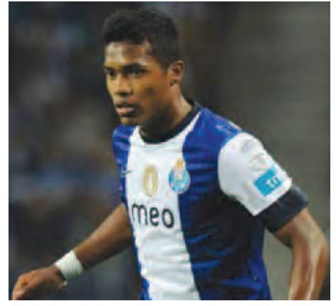
အာဆင်နယ်အသင်းသည် မန်ယူ

အသင်းကို အနိုင်ရရှိကာ အက်ဖ်အေပလား ဆီမီးပိုင်နယ်အဆင့်သို့ တက်လှမ်းလာနိုင် ခဲ့ခြင်းကြောင့် အက်ဖ်အေပလားဆီမီးပိုင် နယ်ပွဲစဉ်တွင် ဘရက်ဒ်ပိုဒ်အသင်း သို့မဟုတ်ပါက ရိုးဒင်းအသင်းနှင့် ယှဉ်ပြိုင် ကစားရမည်ဖြစ်သည်။ အာဆင်နယ်အသင်းသည် မန်ယူ အသင်းကို အနိုင်မရရှိခင်ကတည်းက အက်ဖ်အေပလားဆီမီးပိုင်နယ်အဆင့်သို့ တက်လှမ်းခဲ့ပါက လီဗာပူးအသင်းနှင့် ထိပ် တိုက်မတွေ့စေလိုကြောင်း နည်းပြ အာစင် ဝင်းက ပြောကြားထားခဲ့သည်။ လက်ရှိတွင် အာဆင်နယ်သည် လီဗာ ပူးနှင့် ထိပ်တိုက်တွေ့တော့မည်မဟုတ်ဘဲ လီဗာပူးအသင်း အနိုင်ရရှိခဲ့ပါက အက်စ် တွန်ဗီလာအသင်းနှင့် တွေ့မည်ဖြစ်သည်။ (ဧွေကြယ်)